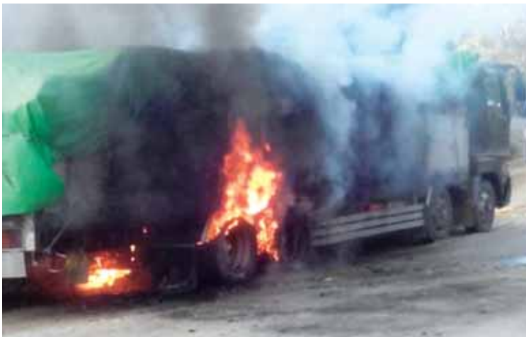
ပုလဲ- ဂန့်ဂေါကားလမ်းတွင် မော်တော်ယာဉ်တစ်စီး မီးလောင်မှုဖြစ်ပွား