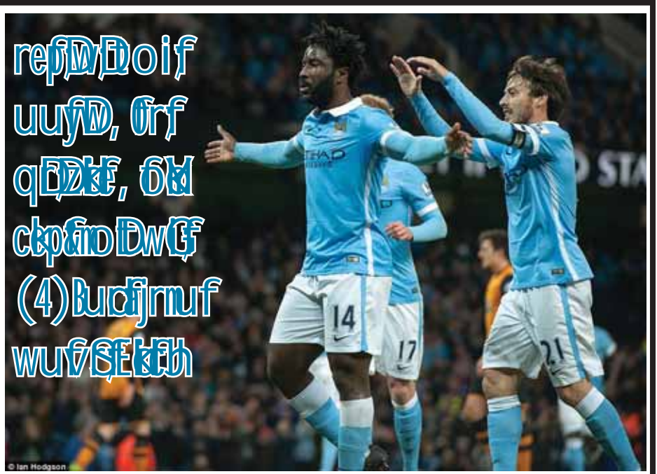
ကွာတားဖိုင်နယ်အဆင့်ကို ကျော်ဖြတ်နိုင်ခြင်းမရှိခဲ့၍ များကို နှစ်ကျောကစားရမည်ဖြစ်ပြီး ဇန်နဝါရီ ၄ ရက်နှင့် ၂၅ ရက်တို့တွင် ယှဉ်ပြိုင်သွားမည်ဖြစ်ကြောင်း သိရ သည်။ ကက်ပီတယ်ဝမ်းဖလားပြိုင်ပွဲ၏ ဆီမီးဖိုင်နယ်ပွဲစဉ် ငွေကြယ်

ပရီမီယာလိဂ်၏ အခြားသော နာမည်ကြီးအသင်း များဖြစ်ကြသည့် ချယ်လ်ဆီးအသင်း၊ အာဆင်နယ်အသင်း နှင့် မန်ယူအသင်းတို့မှာ ကက်ပီတယ်ဝမ်းဖလားပြိုင်ပွဲ၏