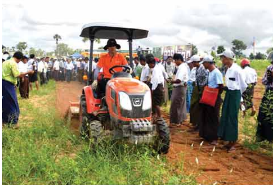
Daedong လယ်ယာသုံးစက်ကိရိယာပစ္စည်းများလက်တွေ့မောင်းနှင်သရုပ်ပြစဉ်

ကျွန်တော်ရဲ့လယ်ယာလုပ်ငန်းခွင်မှာ အသုံးပြုဖို့ ထွန်စက်ဝယ်ယူချင်နေတာကြာပါပြီ။ ဒါပေမယ့် ထွန်စက်ဝယ်ယူဖို့ အခက်အခဲဖြစ်နေပါတယ်။ အခု သမဝါယမလမ်းကြောင်းကနေ အရစ်ကျငွေချေစနစ်နဲ့ ဒေသ ၆၀ HP လယ်ထွန်စက် (၁)စီးကို ဝယ်ယူခဲ့ပါတယ်။ လယ် (၁)ဧကရဲ့ ကုန်ကျစရိတ်ဟာ ဒီဇယ်ဆီဖိုး (၄၅၀၀) ကျပ် ဝန်းကျင်ပဲ ကုန်ကျပါတယ်။ ချိတ်နဲ့ထွန်မယ်ဆိုရင် တစ်နေ့ပျမ်းမျှ (၁၀) ဧကမှ (၁၅) ဧကအထိပြီးပါတယ်။ ထယ်ခွံဆိုရင်တော့ (၈)ဧကမှ (၁၀)ဧကထိပြီးပါတယ်။ နွားနဲ့ထွန်မယ်ဆိုရင် ထယ်ခဲမာရင် ထယ်ရေမညက်ပါဘူး။ စက်နဲ့ထွန်တဲ့အခါ ထယ်ခဲမာရင်လည်း စက်အားနဲ့ဆိုတော့ ထယ်ရေမညက်ပါဘူး။ ဒါကြောင့် စက်နဲ့အသုံးပြုတဲ့အတွက် သီးနှံအထွက်တိုးပါတယ်။ စက်နဲ့ထွန်ယက်စိုက်ပျိုးရတဲ့ အတွက် သီးနှံပိုပြီးအထွက်တိုးခြင်း၊ အချိန်ကုန်သက်သာခြင်းများ ရရှိခဲ့ပါတယ်။ မိမိကျေးရွာတွင်သာမက အခြားမြို့နယ်များသို့လည်း ထွန်စက်အငှားလိုက်ရခြင်းတို့ကြောင့် မိသားစုဝင်ငွေလည်းရရှိပြီး မိသားစုစီးပွားရေးလည်း ပိုမိုကောင်းမွန်လာပါတယ်။ စီးပွားရွာတဲ့နေရာမှာလည်း အဆင်ပြေတဲ့အတွက် အရစ်ကျငွေချေစနစ်နဲ့ ပေးဆပ်ရမယ့်အချိန်တိုင်းမှာ အခက်အခဲမရှိ ပေးဆပ်နိုင်ပါတယ်။