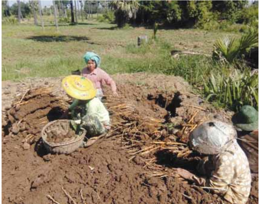
မိုးချမ်း(မုံရွာ)

ဖော်နေပါပြီ။ ထန်းပင်မြစ်ကျင်း စိုက်ပျိုးရာမှာထန်းစေ့တွေကို တစ်စေ့ချင်းမဟုတ်ဘဲ ပဲညှောင့်ဖောက်သကဲ့သို့ အစုလိုက်အပြုံလိုက် စိုက်တဲ့ကဲ့သို့ဖြစ်ပြီး နယ်မြေတို့မှာ ထန်းပင်မြစ်ကျင်းပြုလုပ်ပါတယ်။ ဒါမှသာ စိုက်တဲ့အခါ တူးတဲ့အခါ လွယ်ပါတယ်။ မြေသား၊ မြေနီများမှာ စိုက်ပျိုးပါက ထန်းပင်မြစ်ဖြစ်ထွန်းမှုနည်းပြီး တူးဖော်ရာ၌လည်း ခက်ခဲတတ်ပါတယ်။ ထန်းပင်မြစ်လေးတွေကို ၂၅ ချောင်း အစည်းလေးတွေစည်းပြီး လက်ကားနှုန်းနဲ့ တစ်စည်းကို ကျပ် ၃၅၀ ရရှိပါတယ်။ ‘မုံရွာဘက်က ပဲစားတွေက ဖော်နေတဲ့ကျင်းတွေဆိုလို့ လာဝယ်ကြတယ်။ မုံရွာဘက်မှာတော့ တစ်စည်းကို ကျပ် ၈၀၀ နဲ့ ကျပ် ၁၀၀၀ လောက်ထိ ပြန်လည်ရောင်းချပါတယ်။ ဒီနှစ် မြစ်ဘေးဒေသတွေမှာ မြစ်ရေတွေလျှံပြီးဝင်ကြတော့ ထန်းပင်မြစ်ကျင်းစိုက်တဲ့သူ အရင်နှစ်ကထက်နည်းတော့ ထန်းပင်မြစ်ပေါက်တွေ ဈေးကောင်းပါတယ်” ဟု ပြောသည်။ ထန်းပင်မြစ်သည် ရာသီပေါ် အစားအစာဖြစ်ပြီး ကလေး လူကြီး ကြိုက်နှစ်သက်ကြသလို မီးဖုတ်၍ဖြစ်စေ၊ ရေဖြင့်ပြုတ်၍ ဖြစ်စေ စားသုံးနိုင်သည်။ မီးဖုတ်ပြီးထန်းမြစ်ကို ဆုံတွင်ထည့်ထောင်းပြီး ဆီ၊ ဆားထည့်၍စားလျှင် ပို၍ အရသာရှိလှကြောင်း သိရသည်။