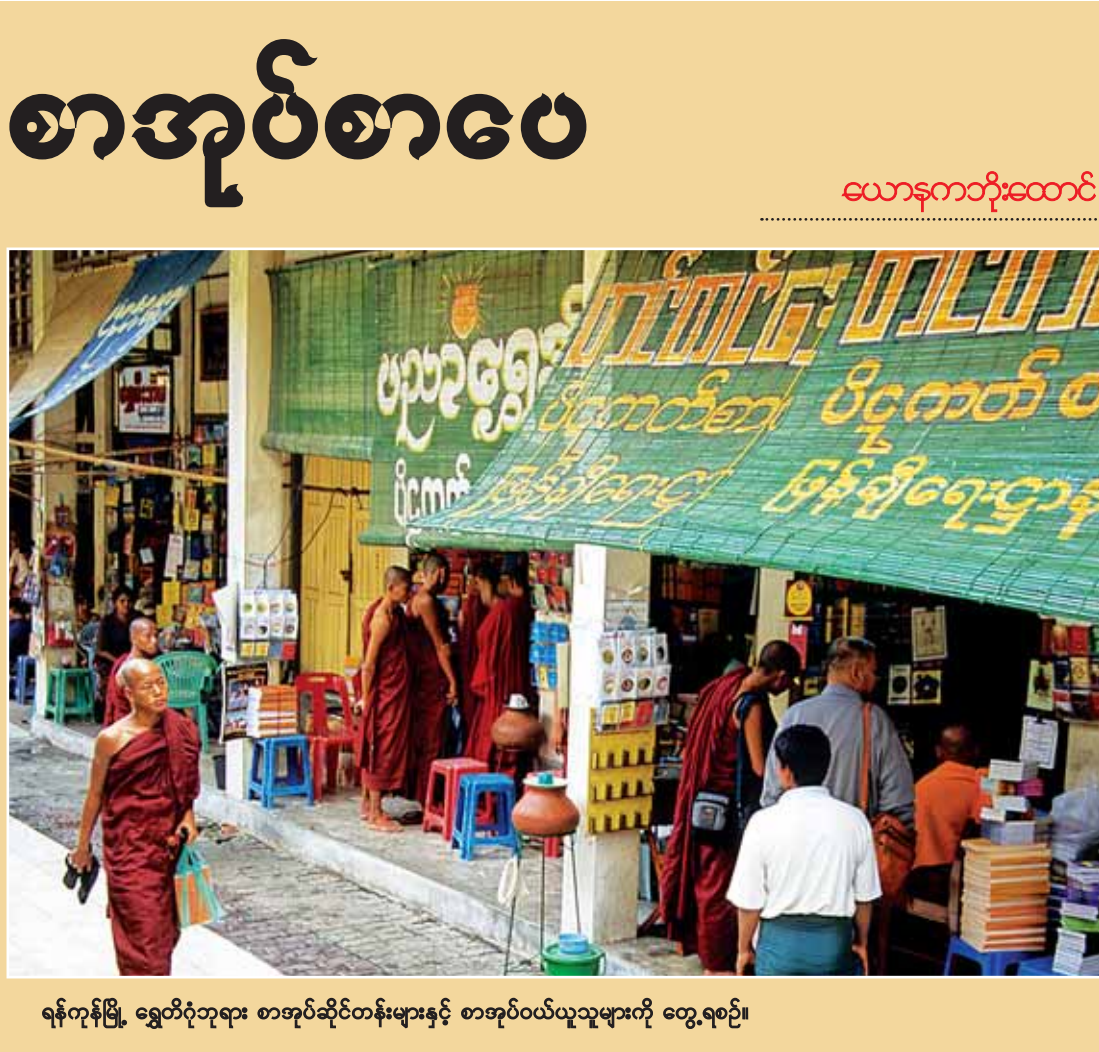
ရန်ကုန်မြို့၊ ရွှေတိဂုံဘုရား စာအုပ်ဆိုင်တန်းများနှင့် စာအုပ်ဝယ်ယူသူများကို တွေ့ရစဉ်။

မျိုးချစ် မျက်ကန်းစာပေသည် ပျက်စီးခြင်းကို ဦးတည်လျက်ရှိပါသည်။ ထွက်ပေါ်လာသောစာမူများကို ထုတ်ဝေ