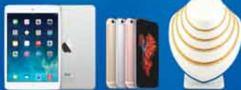
အမှန်တကယ်ဆုပေးမည့် ပစ္စည်းများသည် မျက်နှာပြင်ပေါ်ပြဘာသာစကားဖြင့် အမှတ်လက်မှတ်ချမှတ်နိုင်ပါသည်