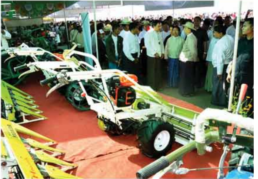
အရစ်ကျငွေချေစနစ်ဖြင့် ရောင်းချပေးသည့် လယ်ယာသုံးစက်ကိရိယာပစ္စည်းများ