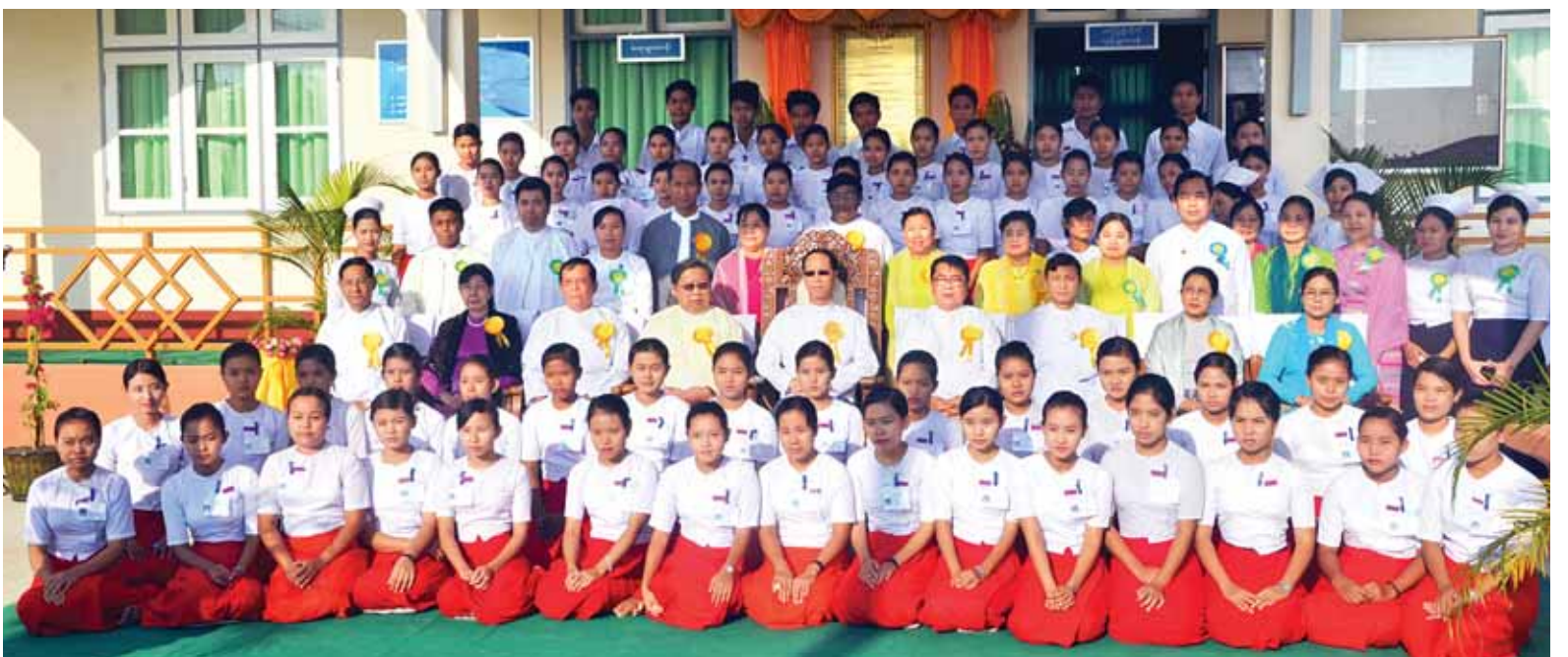
သူနာပြုသင်တန်းကျောင်းနှင့် သားဖွားသင်တန်းကျောင်း ဖွင့်ပွဲအခမ်းအနားတွင် ဒုတိယသမ္မတ ဒေါက်တာစိုင်းမောက်ခမ်းနှင့် တက်ရောက်လာကြသူများ မှတ်တမ်းဓာတ်ပုံရိုက်ကြစဉ်။

ယင်းနောက် ဒုတိယသမ္မတက သားဖွားသင်တန်းကျောင်း ကမ္ဘာ့ဆေးမော်ကွန်းကို စက်ခလုတ်နှိပ် ဖွင့်လှစ်ပေးပြီး ဒုတိယသမ္မတနှင့် ပြည်ထောင်စုဝန်ကြီး ဒေါက်တာသန်းအောင်တို့က ကမ္ဘာ့ဆေးမော်ကွန်းကို အမွှေးနံ့သာရည် ပက်ဖျန်းပေးသည်။ ထို့နောက် ဒုတိယသမ္မတနှင့် ဧည့်သည်တော်များသည် သားဖွားသင်တန်းကျောင်း၊ စာကြည့်တိုက်၊ ကွန်ပျူတာခန်းနှင့် သရုပ်ပြခန်းများကို ကြည့်ရှုကြရာ တာဝန်ရှိသူများက