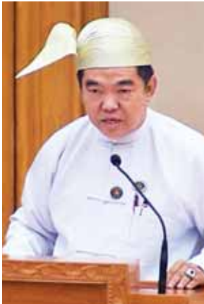
ဒေါက်တာဝင်းမြင့်။

နေပြည်တော် ဒီဇင်ဘာ ၂ ပထမအကြိမ် ပြည်သူ့လွှတ်တော် (၁၃)ကြိမ်မြောက် ပုံမှန်အစည်းအဝေး ဒသမနေ့ကို ယနေ့နံနက် ၁၀ နာရီတွင် ကျင်းပရာ အစီရင်ခံစာနှစ်ခုတင်သွင်းခြင်း၊ အစီရင်ခံစာတစ်ခု လွှတ်တော်၏ အတည်ပြုချက်ရယူခြင်း၊ ဥပဒေကြမ်းတစ်ခု လွှတ်တော်၏အဆုံးအဖြတ်ရယူခြင်းတို့ကို ဆောင်ရွက်သည်။ အစည်းအဝေးတွင် ပြည်သူ့လွှတ်တော် သယံဇာတနှင့် သဘာဝပတ်ဝန်းကျင်ထိန်းသိမ်းရေးဆိုင်ရာ ကော်မတီနှင့် ပြည်သူ့လွှတ်တော် စီးပွားရေးနှင့် ကုန်သွယ်လုပ်ငန်း ဖွံ့ဖြိုးတိုးတက်ရေး ကော်မတီတို့၏ လေ့လာတွေ့ရှိချက်နှင့် သဘောထားမှတ်ချက်များပါဝင်သော အစီရင်ခံစာများကို ဖတ်ကြားတင်သွင်းကြသည်။ ဆက်လက်ပြီး အစီရင်ခံစာများနှင့်စပ်လျဉ်း၍ ဆွေးနွေးလိုသည့် ကိုယ်စားလှယ်များရှိပါက အမည်