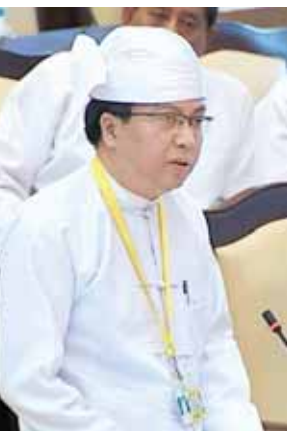
ဒုတိယဝန်ကြီး ဒေါက်တာဇော်မင်းအောင်။

နေပြည်တော် ဒီဇင်ဘာ ၂ ပထမအကြိမ် အမျိုးသားလွှတ်တော် (၁၃) ကြိမ်မြောက် ပုံမှန်အစည်းအဝေး နဝမနေ့ကို ယနေ့နံနက် ၁၀ နာရီတွင် ကျင်းပရာ တိရစ္ဆာန်ဆေးပညာကောင်စီဥပဒေကို ပြင်ဆင်သည့် ဥပဒေကြမ်းနှင့်စပ်လျဉ်းသည့် အစီရင်ခံစာ ဖတ်ကြားတင်သွင်းခြင်းနှင့် နည်းပညာနှင့် သက်မွေးပညာရေးဥပဒေကြမ်း အတည်ပြုခြင်းတို့ကို ဆောင်ရွက်ကြသည်။ အစည်းအဝေးတွင် ပြည်သူ့လွှတ်တော်က ပြင်ဆင်ချက်ဖြင့် အတည်ပြုပြီး ပေးပို့လာသော တိရစ္ဆာန်ဆေးပညာကောင်စီဥပဒေကို ပြင်ဆင်သည့်ဥပဒေကြမ်းအား အမျိုးသားလွှတ်တော်တွင် ဆွေးနွေးနိုင်ရန် ဥပဒေကြမ်းကော်မတီ၏ အစီရင်ခံစာကို ကော်မတီဝင် ဗိုလ်မှူးချုပ် ကျော်ကျော်စိုးက ဖတ်ကြားတင်သွင်းသည်။ ယင်းဥပဒေကြမ်းနှင့်စပ်လျဉ်း၍ လွှတ်တော်ဥက္ကဋ္ဌက ဆွေးနွေးလိုသည့် လွှတ်တော်ကိုယ်စားလှယ်များ အမည်စာရင်းတင်သွင်းနိုင်ကြောင်း ကြေညာသည်။