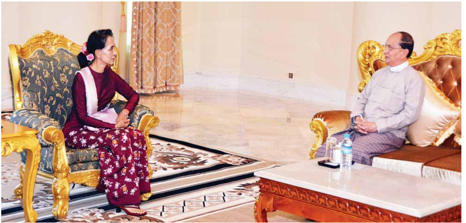
နိုင်ငံတော်သမ္မတ ဦးသိန်းစိန်နှင့် အမျိုးသားဒီမိုကရေစီအဖွဲ့ချုပ်ဥက္ကဋ္ဌ ဒေါ်အောင်ဆန်းစုကြည်တို့ တွေ့ဆုံဆွေးနွေးစဉ်။(သတင်း-ရှေ့ဖုံး) (သတင်းစဉ်)