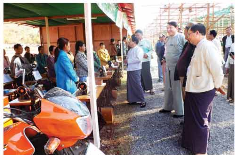
အရစ်ကျငွေချေစနစ်ဖြင့် ရောင်းချပေးသည့် လုပ်ငန်းသုံးစက်ကိရိယာပစ္စည်းများ