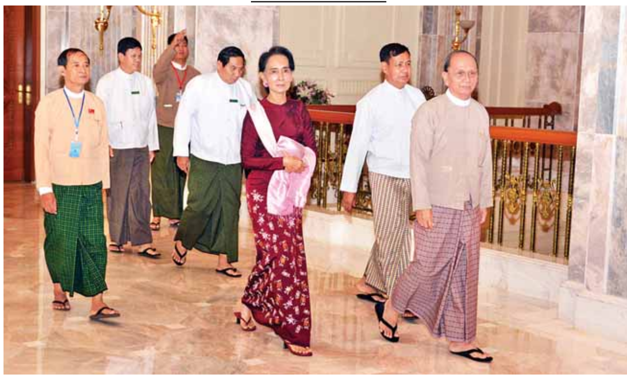
နိုင်ငံတော်သမ္မတ ဦးသိန်းစိန်နှင့် အမျိုးသားဒီမိုကရေစီအဖွဲ့ချုပ်ဥက္ကဋ္ဌ ဒေါ်အောင်ဆန်းစုကြည်တို့အား တွေ့ဆုံဆွေးနွေးပြီးနောက် တွေ့ရစဉ်။(သတင်း-ရှေ့ဖုံး) (သတင်းစဉ်)