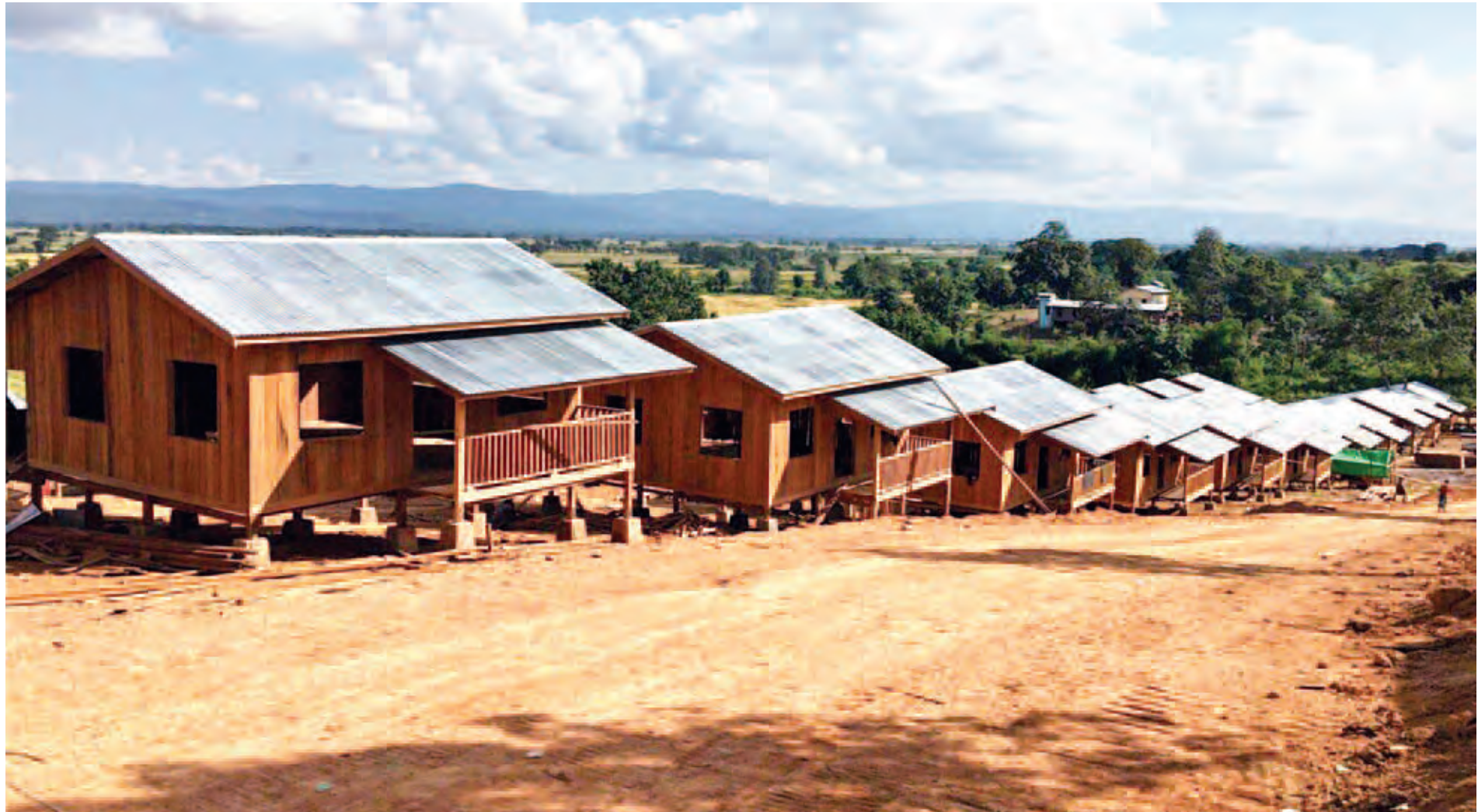
တမူးခရိုင်အတွင်း သဘာဝဘေးဒဏ်ကြောင့်ပျက်စီးခဲ့သော ကနန်ကျေးရွာရှိ နေအိမ်များအား ပြန်လည်တည်ဆောက်ပေးထားမှုကို တွေ့ရစဉ်။

အဆိုပါဒေသတွင် လူနေအိမ် ၃၈၅ လုံး၊ ဘုန်းတော်ကြီးကျောင်း နှစ်ကျောင်း၊ ဆေးပေးခန်းနှစ်ခုတို့အား ပြန်လည်တည်ဆောက်ပေးမည်ဖြစ်ပြီး သဘာဝဘေးသင့်ဒေသများ ပြန်လည်ထူထောင်ရေးလုပ်ငန်းများကို လူအင်အား၊ စက်အင်အားများဖြင့် စာမျက်နှာ ၃ ကော်လံ ၁ သို့ *