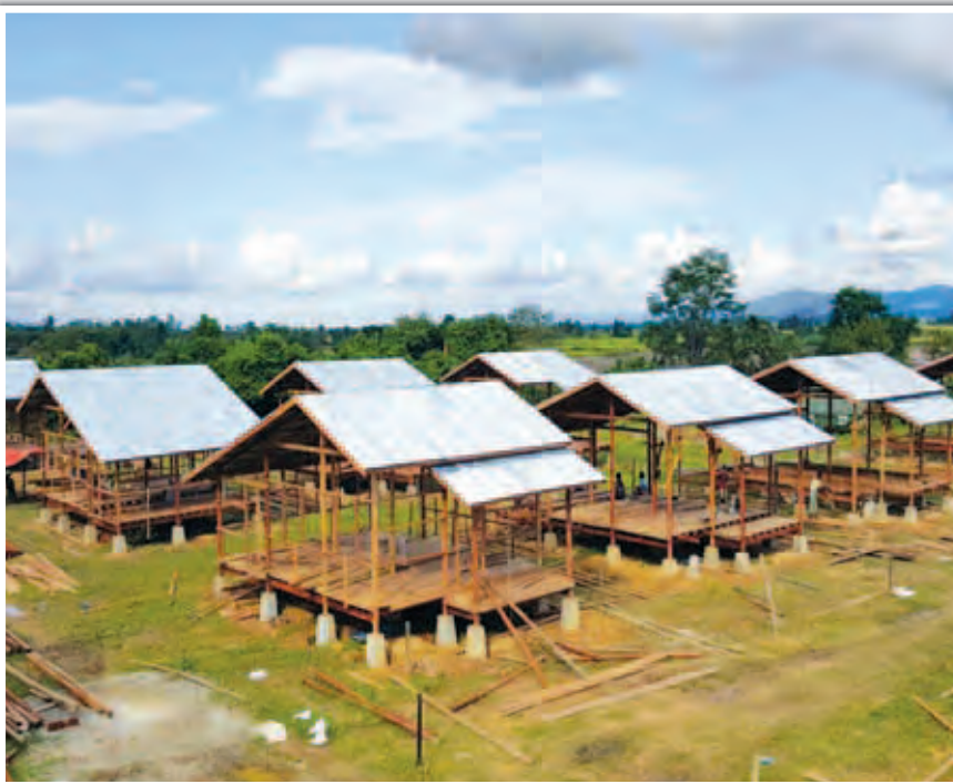
မင်းသမီးကျေးရွာ ပြန်လည်ထူထောင်ရေးအတွက် အိမ်ရာဆောက်လုပ်နေမှုကို တွေ့ရစဉ်။