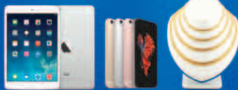
အမှန်တကယ်ဆုပေးမည့် ဖုန်းသည်များသည် မကြော်ငြာတွင်မော်ဂျီကားအသစ်ပစ္စည်းများနှင့် အနည်လယ်ကွက်ဖြင့်ဖန်တီးပါသည်