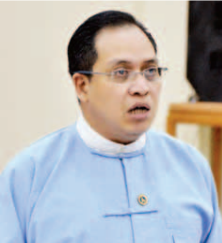
မြန်မာနိုင်ငံတော်ဗဟိုဘဏ် ဒုတိယဥက္ကဋ္ဌ ဦးဆက်အောင်။

အဲဒီလို ဆောင်ရွက်တဲ့အခါမှာလည်း PPP စနစ်ကို ပွင့်လင်းမြင်သာစွာနဲ့ ထိရောက်စွာ ဆောင်ရွက်နိုင်ဖို့ PPP မူဘောင်တွေရှိဖို့လိုပြီး ဖိလစ်ပိုင်နိုင်ငံမှာလို PPP စင်တာမျိုး ဖွဲ့စည်းတည်ထောင်ဖို့လည်း လိုအပ်ပါတယ်။