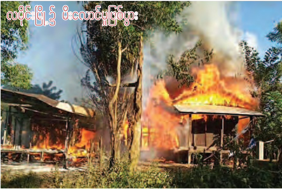
လူငယ်မြို့၌ မီးလောင်မှုဖြစ်ပွားခဲ့ကြောင်းသိရသည်။ လူငယ်မြို့နယ်မြေရဲစခန်းက အမှုဖွင့်စုံစမ်း သိရသည်။