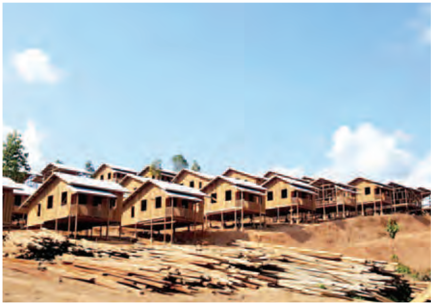
ကမ္မကြီးကျေးရွာ ပြန်လည်ထူထောင်ရေးအတွက် အိမ်ရာဆောက်လုပ်နေမှုကို တွေ့ရစဉ်။