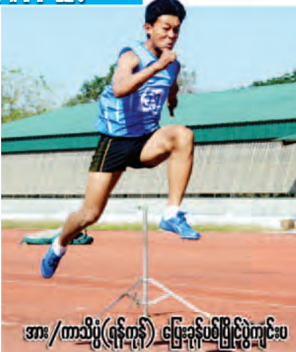
အား/ကာသိပွဲ(ရန်ကုန်) ပြေးခုန်ပစ်ပြိုင်ပွဲကျင်းပ