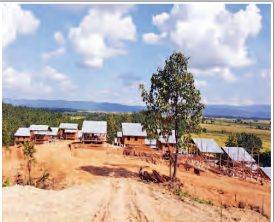
ကနန်ကျေးရွာပြန်လည်ထူထောင်ရေးအတွက် ဆောက်လုပ်လျက်ရှိသည့်အိမ်ရာများကို တွေ့ရစဉ်။