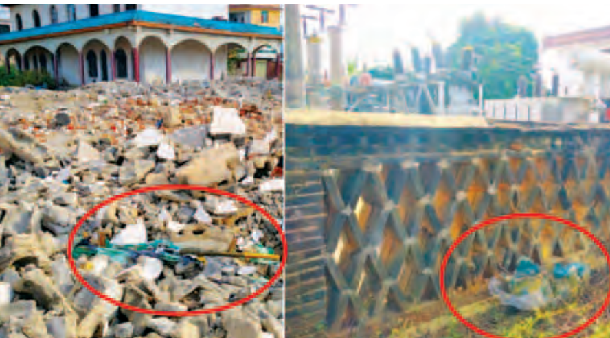
တွေ့ရှိသိမ်းဆည်းရမိသည့် ခုံးသီးနှင့် လက်လုပ်မိုင်းအား တွေ့ရစဉ်။

MNDAA သောင်းကျန်းသူအဖွဲ့များက လောက်ကိုင်မြို့တွင်းသို့ ထိုကဲ့သို့ပစ်ခတ်ခဲ့မှုကြောင့်