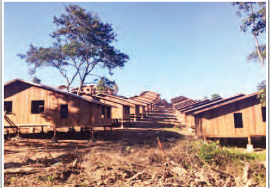
ကနန်ကျေးရွာ အိမ်ရာများဆောက်လုပ်ထားမှုကို တွေ့ရစဉ်။