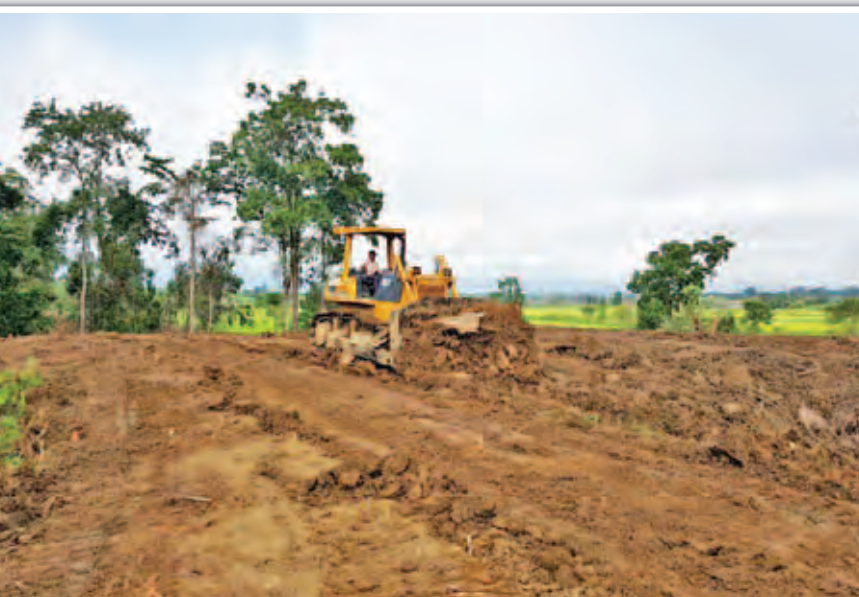
မင်းသမီးကျေးရွာ ပြည်သူများအတွက် မြေယာဖော်ထုတ်မှုအခြေအနေကို တွေ့ရစဉ်။