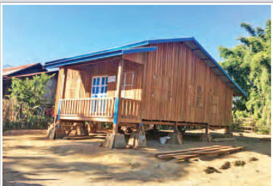
ကျွန်းတောရေရှင်ကျေးရွာ၌ ဆောက်လုပ်ပြီးစီးပြီဖြစ်သည့်အိမ်ရာကို တွေ့ရစဉ်။