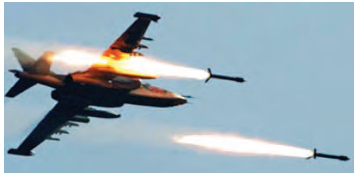
ပါကစ္စတန် တပ်မတော်က လေကြောင်းမှ စီးနင်းတိုက်ခိုက်မှုဆင်နွှဲနေသည်ကို တွေ့ရစဉ်။

ပါကစ္စတန်လေတပ် ဂျက်တိုက်လေယာဉ်များအား ကျောထောက်နောက်ခံအဖြစ် ထားရှိသော တပ်ဖွဲ့များက အာဖဂန်နစ္စတန် နိုင်ငံနှင့် နယ်နိမိတ်ချင်းထိစပ်နေသည့် ခိုင်ဘာ