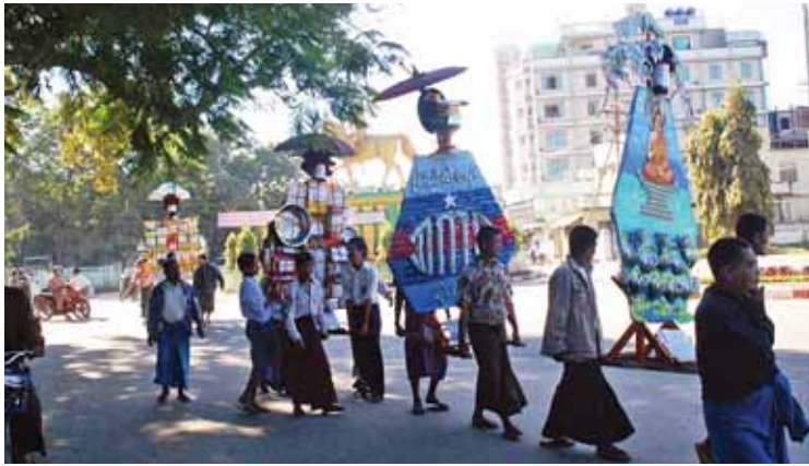
မုံရွာအကျဉ်းထောင်မိသားစု မဟာဘုံကထိန်လှည့်လည်ပွဲ ကျင်းပစဉ်။