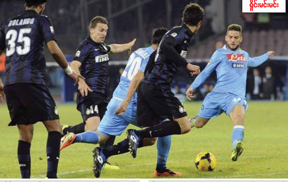
ရှိုင်းမင်းမင်း