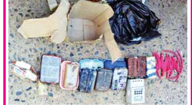
လားရှိုးမြို့ ရပ်ကွက်(၉) ဘူတာရုံ ပန်းခြံအပိုင်းဘေး ချုံပုတ်အစပ်၌ တွေ့ရှိရသော ချိန်ကိုက်မိုင်း။