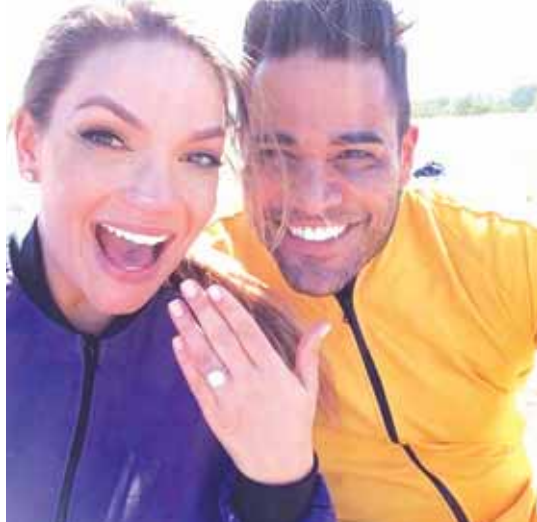
(မေလုံသင်း-ရေးသားသည်)

Shahs of Sunset ဇာတ်ကားရဲ့ ကြယ်ပွင့် ဂျက်စီကာပါရီဒိုနဲ့ မိုက်ကယ် ရှိုးဟက်တို့ဟာ အိမ်ထောင်သက်ခြောက်လအကြာမှာပဲ ကွာရှင်းပြတ်စဲခဲ့ပြီဖြစ်ကြောင်း တီအမ်ဇက်ဒေါ့ကွန်းက ဖော်ပြသည်။ ဂျက်စီကာဟက်မှ ပြီးခဲ့တဲ့ နိုဝင်ဘာ ၂၀ ရက်ကပင် ကွာရှင်းစာချုပ်ကို စတင်လက်မှတ်ရေးထိုးခဲ့ပြီးနောက် နှစ်ဦးစလုံး လမ်းခွဲ ကြောင်း ကျမ်းသစ္စာ ကျိန်ဆိုခဲ့ကြခြင်းဖြစ်သည်။ သူတို့နှစ်ဦးသည် ပြီးခဲ့သည့် ဩဂုတ် ၁ ရက်ကပင် တစ်ဦးနှင့်တစ်ဦး ခွဲနေ ခဲ့ကြပြီး သုံးလလောက်သာ ပေါင်းဖက်ခဲ့ခြင်းဖြစ်သည်။ သူတို့နှစ်ဦးတွင် သားသမီး မထွန်းကားသော်လည်း ဂျက်စီကာက သူ့အတွက် အိမ်ထောင်ဖက်စရိတ်ထောက်ပံ့ ပေးရန် တရားရုံးတွင် တောင်းဆိုခဲ့သည်။