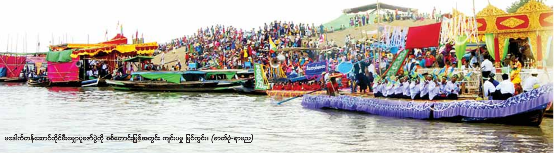
မဒေါက်တန်ဆောင်တိုင်စီးမျောပူဇော်ပွဲကို စစ်တောင်းမြစ်အတွင်း ကျင်းပမှု မြင်ကွင်း။