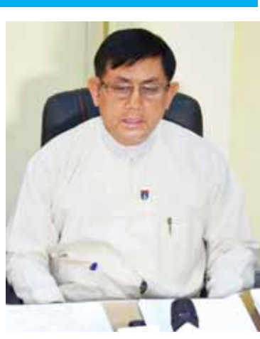
ယူသင့်တယ်ဆိုတာ ရှိပါတယ်။

ရမယ်။ နှစ်နာမယ့်အချက်တွေဆိုရင် တစ်ဖက်နိုင်ငံနဲ့ တစ်ဖက်အဖွဲ့အစည်းတွေကို ပြန်ပြီး ပြောရပါတယ်။ သူ့ဘက်ကလည်း ပြန်လျှော့ပေးတာ၊ တောင်းဆိုတာတွေရှိပါတယ်။ တိုယ့်ဘက်က လိုက်လျောနိုင်တဲ့ a chance ရှိရင် လိုက်လျောပေးတာရှိပါတယ်။ အထူးသဖြင့် မိမိနိုင်ငံ နှစ်နာမယ့်ရလေအောင် ပြည့်စုံအောင်စဉ်းစားပြီးတော့မှ ဆောင်ရွက်ရတာဖြစ်ပါတယ်။ ဒီလိုအပြန်အလှန်ညှိနှိုင်းဖို့ အချိန်အတိုင်းအတာတစ်ခု ယူရပါတယ်။ နောက်ဆုံးမှာ နှစ်ဖက်စလုံး သဘောတူညီပြီဆိုရင် စာချုပ်ချုပ်ဆို လက်မှတ်ထိုးပြီး ချေးရမယ်။ ဒီလိုချေးတဲ့အခါမှာ အတိုးနှုန်းဘယ်လောက်နဲ့ ချေးမလဲ။ ချေးငွေရဲ့ သက်တမ်းကာလ ဘယ်လောက်ရှိလဲ။ ဒီသက်တမ်းကာလအတွင်းမှာ အရင်းပြန်မဆပ်ရသေးတဲ့ ဆိုင်းငံ့ကာလလို့ခေါ်တဲ့ base period ဘယ်လောက်ရှိမလဲ။ ချေးငွေတစ်ခုလုံးကို အတိုးရောအရင်းရော ပြန်ဆပ်ဖို့ကာလ ဘယ်လောက်ရှိမလဲ။ တချို့ချေးငွေတွေက အနှစ်(၂၀)၊ (၃၀)၊ (၄၀) စသဖြင့်ရှိတယ်။ အတိုးနှုန်းသက်သက်သာသာနဲ့ ကာလရှည်ရရှိနိုင်တဲ့ချေးငွေကို ရွေးချယ်ပြီးတော့ ယူရတာဖြစ်ပါတယ်။ ဒါကတော့ နိုင်ငံတော်ဖွံ့ဖြိုးရေးအတွက် ဆောင်ရွက်တဲ့ချေးငွေဖြစ်ပါတယ်။