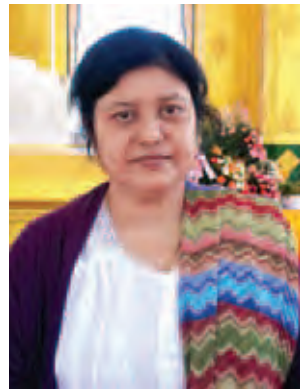
ဒေါ်ချိုချို။