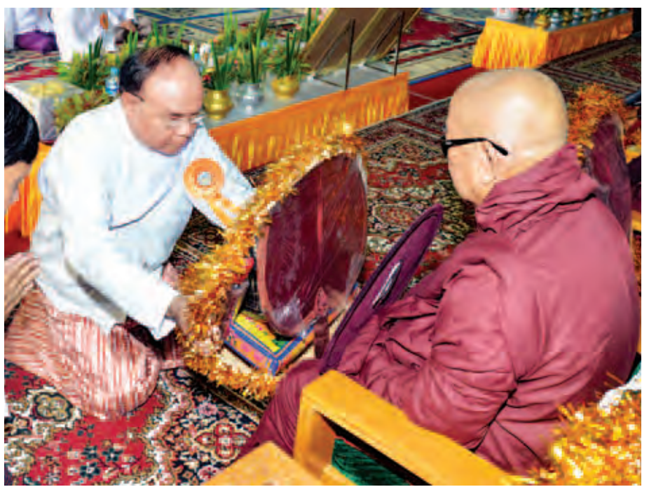
နိုင်ငံတော်ဖွဲ့စည်းပုံအခြေခံဥပဒေဆိုင်ရာခုံရုံးဥက္ကဋ္ဌ ဦးမြသိန်း လှူဖွယ်ပစ္စည်းများ ဆက်ကပ်လှူဒါန်းစဉ်။ (သတင်းစဉ်)