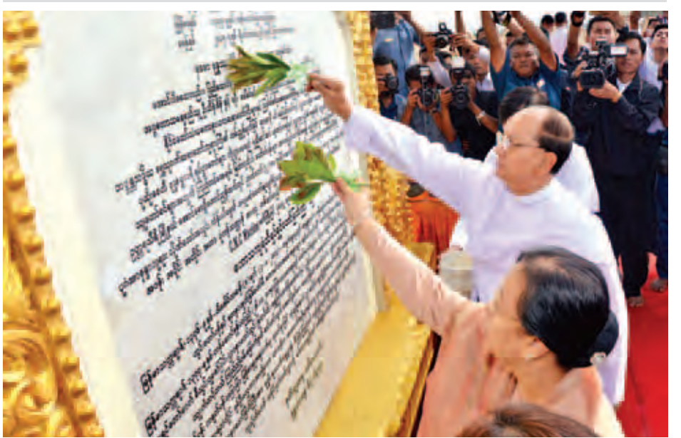
နိုင်ငံတော်သမ္မတ ဦးသိန်းစိန်နှင့်ဇနီး ဒေါ်ခင်ခင်ဝင်း မဟာသကျရံသီရင်ရှင်တော်မြတ်ကြီးတည် မဟာမင်္ဂလာ ကမ္ပည်းမော်ကွန်းကျောက်စာတော်အား စက်ခလုတ်နှိပ်ဖွင့်လှစ်ပေးပြီး အမွှေးနံ့သာရည်ဖြင့် ပက်ဖျန်းပေးစဉ်။ (သတင်းစဉ်)

ပိသုကာ အင်ဂျင်နီယာများအား လက်ဆောင်ပစ္စည်းများ ပေးအပ်ခဲ့ခြင်းဖြင့် ပြီး ACE ကုမ္ပဏီမှ ဦးဇော်မိုးဝင်းက တည်ဆောက်ပြီးစီးအောင်မြင်ခဲ့သော ရုပ်ရှင်တော်မြတ်ကြီးအား မူလဘုရား ဒါယကာ ဒါယိကာမများထံ ပြန်လည်