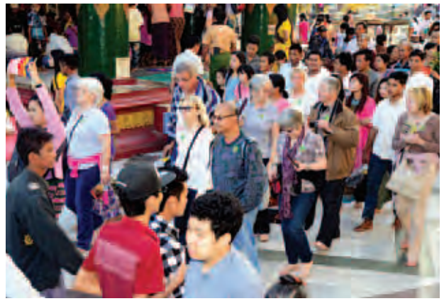
တန်ဆောင်မုန်းလပြည့်နေ့က ရွှေတိဂုံစေတီတော် ရင်ပြင်တော်ပေါ်၌ နိုင်ငံခြားသားဧည့်သည်များ လာရောက်ကြည့်ညိကြစဉ်။

ခဲ့ကြသည်။ လေးဆူဓာတ်ပုံရွှေတိဂုံစေတီတော် မြတ်ကြီး၏ (၃၁)ကြိမ်မြောက် မသိုး သက်နန်း ယှဉ်ပြိုင်ရက်လုပ်ပွဲမှရရှိသော သက်နန်းများကို ဝိနည်းတော်နှင့်အညီ ချုပ်လုပ်ထားသည့် မသိုးရွှေကြာ သက်နန်းတော်များကို ယနေ့ တန်ဆောင်မုန်းလပြည့် အရုဏ် တက်ချိန်၌ စေတီတော်ရင်ပြင် အာရုံခံတန်ဆောင်းများအတွင်းရှိ ပုဒ္ဓရုပ်ပွားတော်လေးဆူ၊ အထက် ပစ္စယ်ရှိ ပတ္တမြားမှတ်ရှင်ရုပ်ပွားတော် နှင့် ရင်ပြင်တော်ပေါ်ရှိ ပုဒ္ဓရုပ်ပွား တော် စုစုပေါင်းရုပ်ပွားတော် ကိုးဆူ