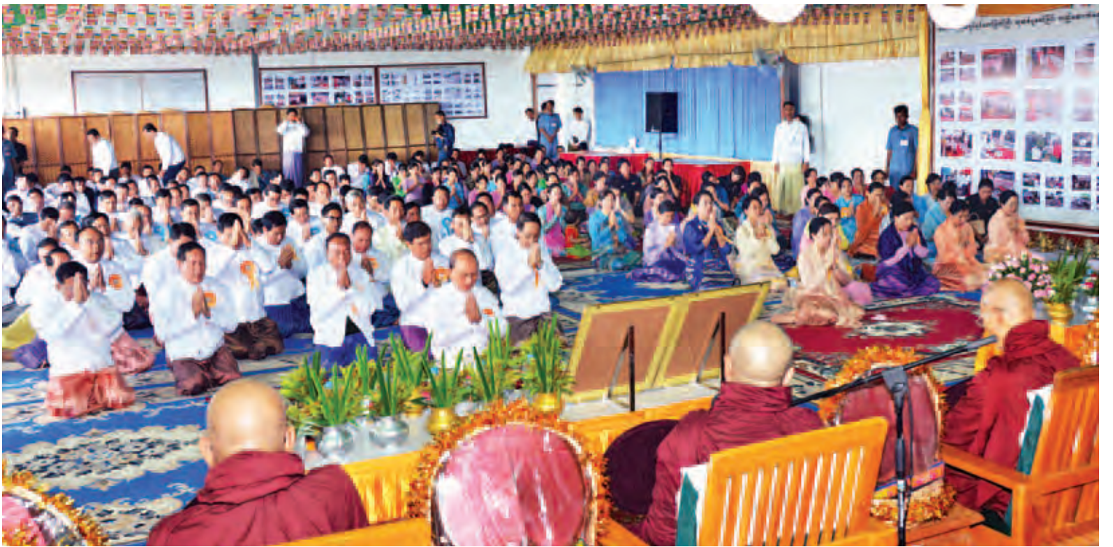
နိုင်ငံတော်သမ္မတ ဦးသိန်းစိန်နှင့် ဧည့်ပရိသတ်များ ဗန်းမော်ကျောင်းတိုက်ဆရာတော် ဒေါက်တာဘဒ္ဒန္တကုမာရာဘိဝံသထံမှ ကိုးပါးသီလခံယူဆောင်တည်ကြစဉ်။ (သတင်းစဉ်)

ရှေးဦးစွာ ဌာပနာတော်သွင်း အခမ်းအနားကို ကျင်းပရာ မင်္ဂလာ အချိန်ကျရောက်သည်နှင့် နိုင်ငံတော် သမ္မတက မဟာသကျရံသီရင်ရှင် တော်မြတ်ကြီး၏ ဌာပနာတော် တိုက်အတွင်းသို့ ဓာတုစေတီ၊ ဓမ္မ စေတီ၊ ပရိဘောဂစေတီ၊ ဥဒ္ဓိသစေတီ