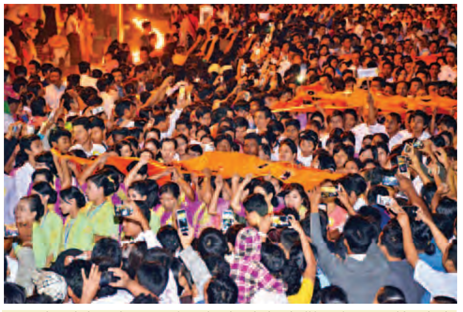
တန်ဆောင်မုန်းလပြည့်နေ့က ရွှေတိဂုံစေတီတော် ရင်ပြင်တော်ပေါ်၌ မသိုးရွှေကြာသက်နန်းဆက်ကပ် ပူဇော်ရန် ပင့်ဆောင်ကြစဉ်။

ခုနစ်ဆူတို့၌ ဆက်ကပ်ပူဇော်ကြသည်။ ဆက်လက်၍ နံနက် ၅ နာရီခွဲတွင် မြတ်စွာဘုရားရှင်အား ရည်မှန်း၍ စေတီတော်ဩဝါဒါစရိယဆရာတော် ကြီးများအား အရုဏ်ဆွမ်းဆက်ကပ် လှူဒါန်းပြီး နံနက် ၆ နာရီတွင် ရေစက်ချ တရားနာယူကြသည်။ နံနက် ၇ နာရီတွင် စေတီတော် အာရုံခံတန်ဆောင်းအပေါ်ထပ်၌ တန်ဆောင်မုန်းလပြည့် သာမညဖလ