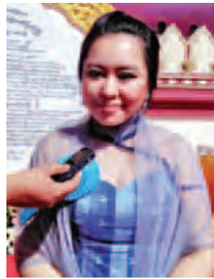
ဒေါ်အောင်ဆန်းစိန်။