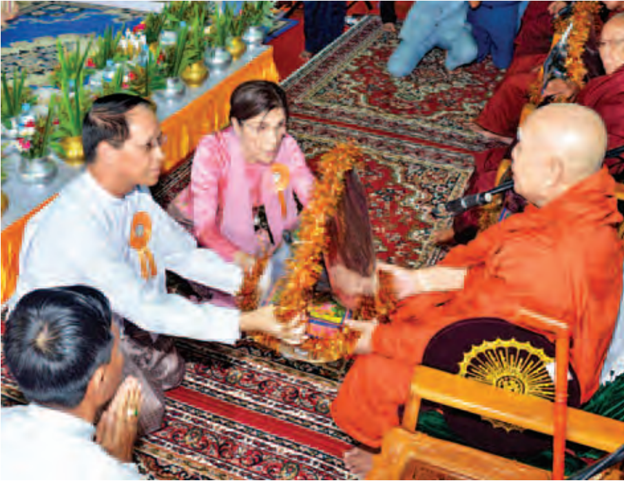
ဒုတိယသမ္မတ ဒေါက်တာစိုင်းမောက်ခမ်းနှင့်ဇနီး လှူဖွယ်ပစ္စည်းများ ဆက်ကပ်လှူဒါန်းစဉ်။ (သတင်းစဉ်)