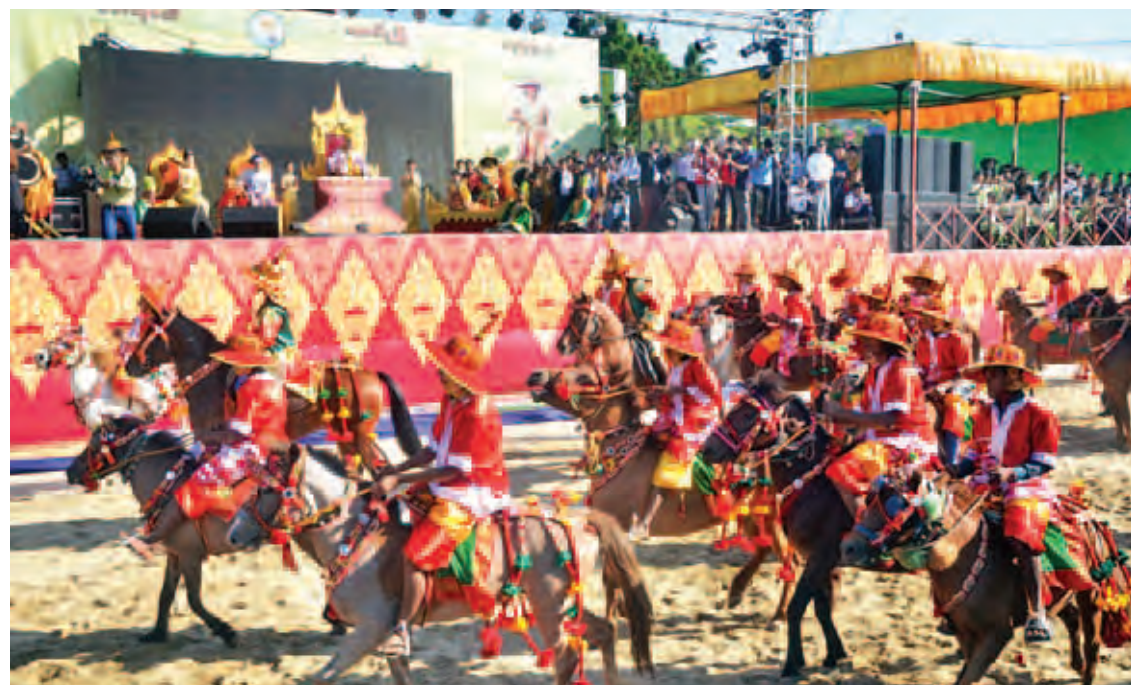
ကေတုမတီ(တောင်ငူ) မြို့တည်နန်းတည် (၅၀၅)နှစ်ပြည့် အထိမ်းအမှတ်ပွဲ ကျင်းပနေစဉ်။