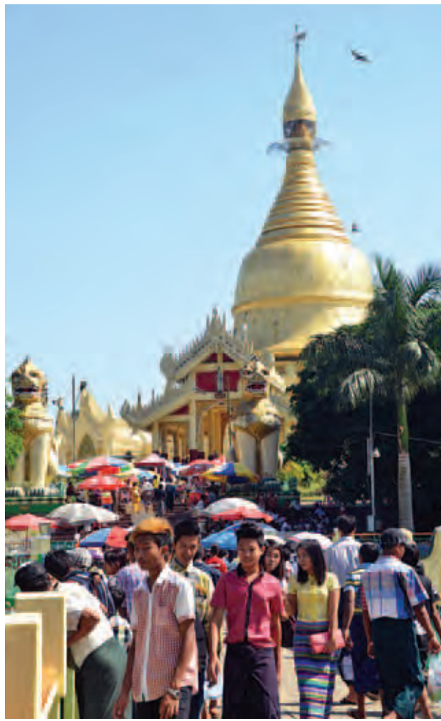
မဟာဝိဇယစေတီတွင် ဘုရားဖူးများ စည်ကားလျက်ရှိစဉ်၊ ဓာတ်ပုံ-ခင်မောင်ဝင်း(ကြေးမုံ)

အား ဆက်ကပ်လျှောက်ပေးပို့ကြ သည်။ ဆက်လက်၍ နံနက် ၅ နာရီတွင် စေတီရင်ပြင်တော် တောင်ဘက် ဧည့်ခံတန်းဆောင်း၌ စေတီတော်ဂေါပက အဖွဲ့ဝင်များ၊ ဘာသာရေးအသင်း အဖွဲ့ဝင်များနှင့် ဘုရားဖူးလာပြည်သူ များက စေတီတော်အား ဆွမ်းတော်ကြီး တင်လှူဆက်ပူဇော်ကြသည်။ ယင်းနောက် နံနက် ၅ နာရီခွဲတွင် ရင်ပြင်တော်တောင်ဘက် ရောင်တော် ဖွင့်တန်းဆောင်း၌ စေတီတော်ဩဝါဒါ စရိယဆရာတော်ကြီးများနှင့် သံဃာ တော်များအား ရွှေတိဂုံစေတီတော် ဂေါပကအဖွဲ့ဝင်များနှင့် ဘာသာရေး အသင်းအဖွဲ့ဝင်များက အရုဏ်ဆွမ်း ဆက်ကပ်လှူဒါန်းကြပြီး ရှေးဟောင်း ပုဒ္ဓရုပ်ပွားတော်များတန်ဆောင်း၌ ရေစက်ချအခမ်းအနားကို ကျင်းပကာ ဆရာတော်၊ သံဃာတော်များထံမှ ကိုးပါးသီလ ခံယူဆောင်တည်ခြင်း၊ ပရိတ် တရားတော်များ နာယူခြင်း၊ လှူဖွယ်ဝတ္ထုပစ္စည်းများ ဆက်ကပ် လှူဒါန်းခြင်း၊ ရေစက်သွန်းချ အနု မောဒနာတရားနာယူကြပြီး ရေစက်ချ အမှုပေးဝေကြသည်။ ဗိုလ်တထောင် ကျိုက်ဒေးအပ် ဆံတော်ဦးစေတီတော် မသိုးရွှေကြာ သက်နန်းကပ်လှူခြင်းအခမ်းအနားကို နံနက် အရုဏ်မတက်မီအချိန်တွင် စေတီတော်ရင်ပြင်ပေါ်၌ ကျင်းပရာ