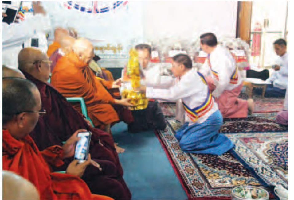
ပြည်ထောင်စုသမ္မတမြန်မာနိုင်ငံတော်အစိုးရကိုယ်စား သာသနာရေးဝန်ကြီးဌာန ပြည်ထောင်စုဝန်ကြီး ဦးစိုးဝင်းက ပုဒ္ဂလိယမြန်မာကျောင်းဆရာတော် ဘဒ္ဒန္တဉာဏိန္ဒထံ လှူဖွယ်ပစ္စည်းများဆက်ကပ်လှူဒါန်းစဉ်။ (သတင်းစဉ်)

ပြည်ထောင်စုဝန်ကြီးသည် နိုဝင်ဘာ ၂၁ ရက်တွင် ဗာရာဏသီမြို့ရှိ ဆေးဝက်ဘာကျောင်း ဆရာတော် ဒေါက်တာဘဒ္ဒန္တမဏ္ဍလနှင့် ဆန်းစစ်ခရစ်တက္ကသိုလ်၊ B.H.U တက္ကသိုလ်တို့တွင် ပညာသင်ယူနေကြသော