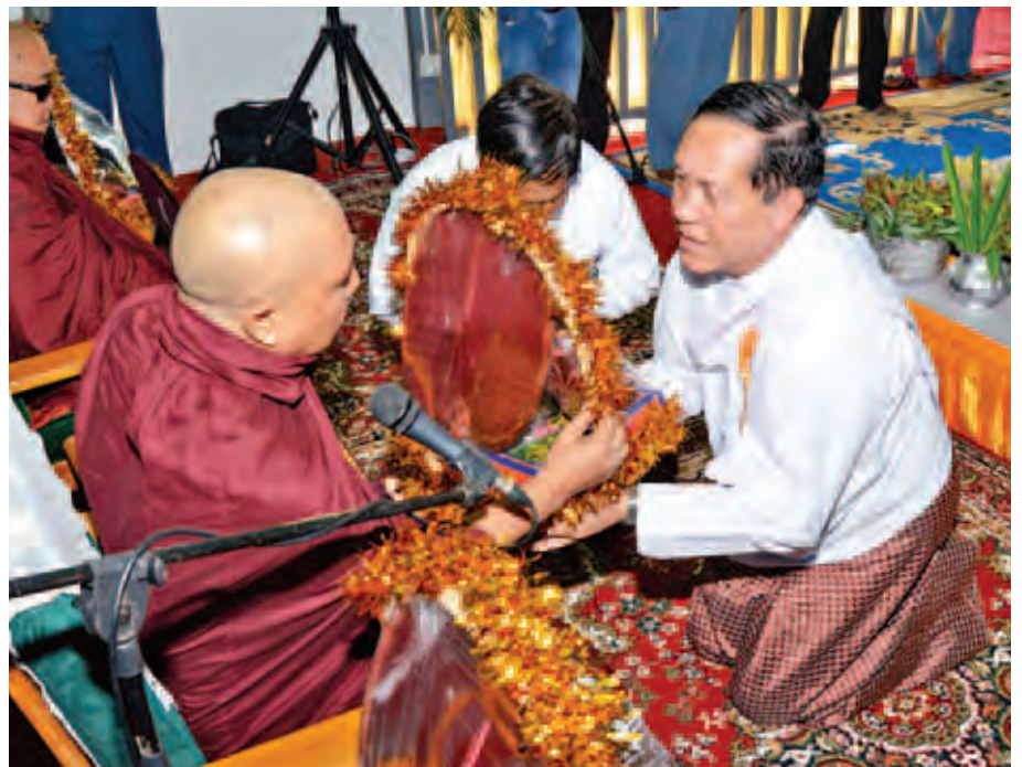
ပြည်ထောင်စုတရားသူကြီးချုပ် ဦးထွန်းထွန်းဦး လှူဖွယ်ပစ္စည်းများ ဆက်ကပ်လှူဒါန်းစဉ်။ (သတင်းစဉ်)