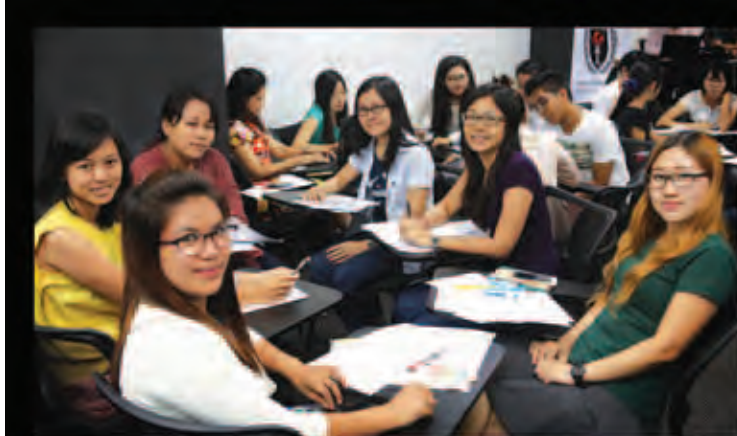
December - June Term ဝီဒင်ဘာ (၁) ရက် စတင် သင်တန်းများအပ်နှံနိုင်ပါပြီ။

ပထမဦးစွာ ပြည်ထဲရေးဝန်ကြီးဌာနနှင့် လူဝင်မှုကြီးကြပ်ရေးနှင့် ပြည်သူ့အင်အား ဝန်ကြီးဌာန ပြည်ထောင်စုဝန်ကြီး ဒုတိယ ဗိုလ်ချုပ်ကြီးကိုကိုနှင့် တာဝန်ရှိသူများက အခမ်းအနားကို ဖဲကြိုးဖြတ်ဖွင့်လှစ်ပေးပြီး နာမည်ကျော်အနုပညာရှင်များနှင့် တောင်ငူမြို့ စာမျက်နှာ ၉ ကော်လံ ၁ သို့ *