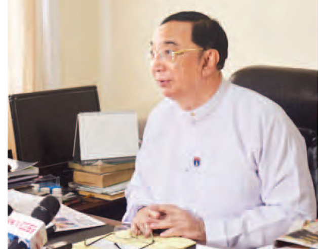
လောလောဆယ်တော့ မရှိနိုင်သေးပါဘူး။

ငွေချေးသက်သေခံလက်မှတ်ရောင်းဝယ်တာနဲ့ပတ်သက်ပြီး ပြည်တွင်းမှာ ဖြစ်နေတဲ့ ဒေါ်လာဈေးအတက်အကျက သိပ်ပြီးတော့ ဆက်စပ်မှုမရှိလောက် ပါဘူး။ စဖွင့်ဖွင့်ချင်းမှာ မြန်မာငွေလဲလှယ်နှုန်းဖြစ်ပါတယ်။ နိုင်ငံခြားသားတွေကို ရင်းနှီးမြှုပ်နှံမှုမပေးသေးဘူးဆိုတော့ မြန်မာပြည်ကို ဒေါ်လာတွေ ဝင်လာ တာတွေ၊ ဒေါ်လာတွေပြန်ထွက်သွားတာတွေ၊ စီးဝင်မှုတွေ၊ စီးထွက်မှုတွေ