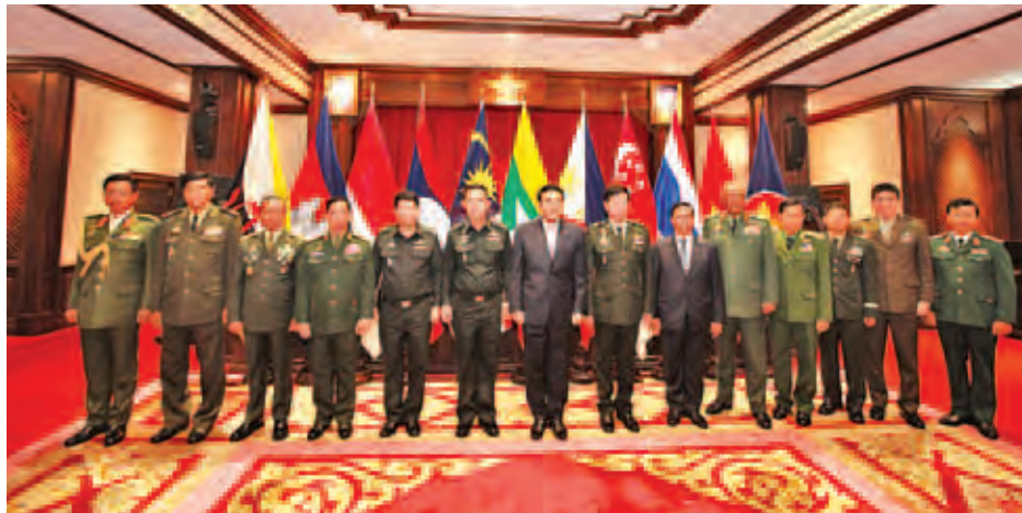
အမှတ်ပြုတိုက်တွင် လိုက်လံရှင်းလင်းပြသသည်။ ယင်းနောက် မွန်းလွဲ ၂ နာရီတွင် ခေတ္တအခြေပြုရာ Siam Kempinski Hotel မှ ထွက်ခွာခဲ့ရာ ဒေသစံတော်ချိန်

ထိုမှတစ်ဆင့် Anata Somakhom Throne Hall သို့ နံနက် ၁၀ နာရီ မိနစ် ၄၀ တွင်ရောက်ရှိရာ တာဝန် ရှိသူများက အမှတ်တရပစ္စည်းအရောင်းဆိုင်နှင့် အထိမ်း