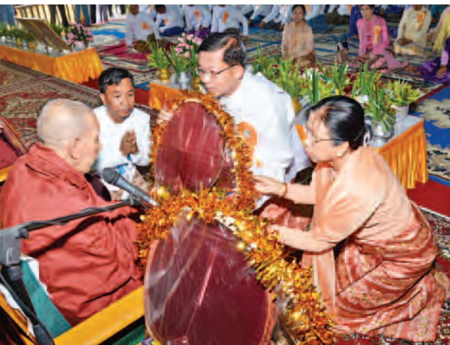
တပ်မတော်ကာကွယ်ရေးဦးစီးချုပ် ဗိုလ်ချုပ်မှူးကြီးမင်းအောင်လှိုင်နှင့်ဇနီး လှူဖွယ်ပစ္စည်းများ ဆက်ကပ်လှူဒါန်းစဉ်။ (သတင်းစဉ်)