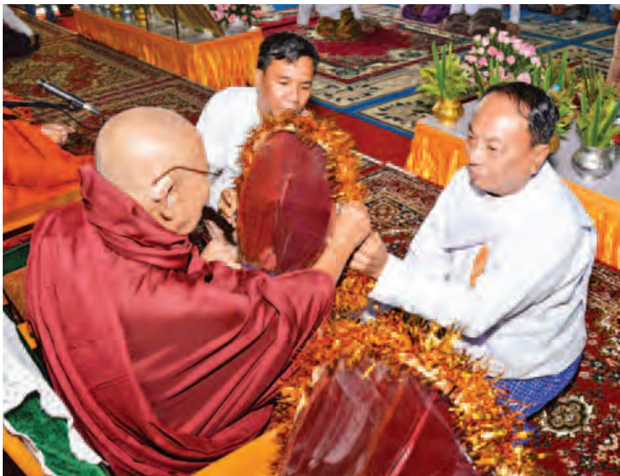
အမျိုးသားလွှတ်တော်ဥက္ကဋ္ဌ ဦးခင်အောင်မြင့် လှူဖွယ်ပစ္စည်းများ ဆက်ကပ်လှူဒါန်းစဉ်။ (သတင်းစဉ်)