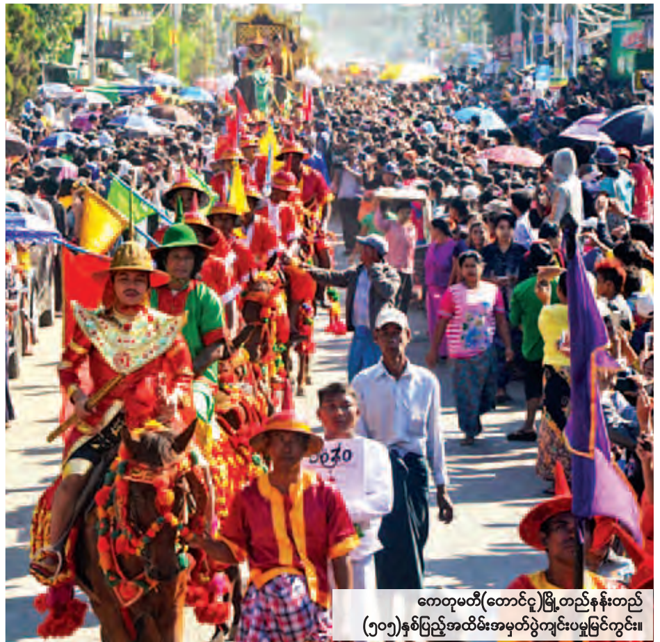
ကေတုမတီ(တောင်ငူ)မြို့တည်နန်းတည် (၅၀၅)နှစ်ပြည့်အထိမ်းအမှတ်ပွဲကျင်းပမှုကြောင်း။

ထို့အတူ ရန်ကုန်တိုင်းဒေသကြီး အတွင်းရှိ တန်ခိုးကြီးဘုရား ပုထိုး စေတီ ကျောင်းကန်အသီးသီး၌ ကထိန်လျာသက်နန်းဆက်ကပ်လှူဒါန်း ကြသူများ၊ ဘုံကထိန်ပဒေသာပင် လှည့်လည်သူများ၊ သာမညဖလ အခါ တော်နေ့ ကျင်းပကုသိုလ်ပြုကြသူများ၊ ဥပသံသီတင်း သီလခံယူ ဆောက် တည်ကြသူများ၊ အလှူဒါနပြုကြသူ များ၊ ကုသိုလ်ပုညပြုကြသူများဖြင့် အထူးများပြားခဲ့ပြီး ဥပယုဂ်ပန်းခြံ များ၌လည်း အပန်းဖြေအနားယူသူ များဖြင့် စည်ကားလျက်ရှိသည်။ ညပိုင်းတွင် ငှာနဆိုင်ရာရုံးများ၊ နေအိမ်တိုက်တာများ၌ ပုဒ္ဓမြတ်စွာ ဘုရားအားရည်မှန်းကာ ရောင်စုံ မီးထွန်းညှိပူဇော်ခြင်း၊ မြို့ရွာ၊ ရပ်ကွက်၊ လမ်းအသီးသီးတို့၌ မီးထွန်း ပွဲတော်များ၊ နိဗ္ဗာန်ဈေး အလှူတော် ပွဲများ၊ စတုဒီသာကျွေးမွေးဧည့်ခံ လှူဒါန်းမှုများ၊ ဖျော်ရွှင်ပွဲများ၊ ကာတွန်းပြပွဲများဖြင့် သက်ဝင်လှုပ်ရှား လျက်ရှိသည်ကို တွေ့ရသည်။