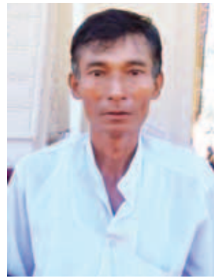
ဦးစိုးသန်း။

မဟာသကျရံသီရပ်တော်မူ ရုပ်ရှင် တော်မြတ်ကြီး ဌာပနာတော်သွင်း၊ မြသပိတိ၊ ရွှေကြာသင်္ကန်းတော်ကပ်၊ ပုဒ္ဂါဘိသေက အနေကဇာတင် မဟာ မင်္ဂလာနှင့် ရေစက်ချအလှူတော် မင်္ဂလာအခမ်းအနားကို နိုင်ငံတော် သမ္မတဦးသိန်းစိန် အမျိုးပြု၍ ယနေ့ တန်ဆောင်းမုန်းလပြည့်နေ့ အခါ သမယတွင် နေပြည်တော် ဥက္ကရ သီရိမြို့နယ် ဖိုးစောင်းတောင်ရှိ အောင်မောဠိတောင်ညွန့်၌ ကျင်းပ သည်။ ထိုကောင်းမှုကုသိုလ် အလှူဒါနတို့၏ အသံသည်ကား လူ့ပြည်၊ နတ်ပြည်၊ ဗြဟ္မာပြည်သာမက စကြာဝဠာတိုက် အသီးသီးသို့ပင် ကြားသိနိုင်ပြီဖြစ်သည်။