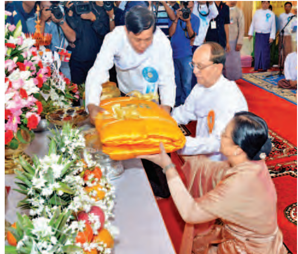
နိုင်ငံတော်သမ္မတ ဦးသိန်းစိန်နှင့်ဇနီး ဒေါ်ခင်ခင်ဝင်း မဟာသကျရံသီရံပရံရင်တော်မြတ်ကြီးအား ရွှေကြာသင်္ကန်းတော် ကပ်လှူပူဇော်ကြစဉ်။ (သတင်းစဉ်)

နေပြည်တော် နိုဝင်ဘာ ၂၆ မဟာသကျရံသီရံပရံရင်တော်မြတ်ကြီး ဌာပနာတော်သွင်း၊ မြသပိတ်၊ ရွှေကြာသင်္ကန်းတော်ကပ်၊ ပုဒ္ဓါဘိသေက အနေကဇာတင် မဟာမင်္ဂလာနှင့် ရေစက်ချအောင်ပွဲ မင်္ဂလာ ကုသိုလ်တော်အခမ်းအနားကို ယနေ့ နံနက် ၉ နာရီတွင် နေပြည်တော် ဥက္ကရသီရိမြို့နယ် အောင်မောဠိ တောင်ညွန့်၌ ကျင်းပရာ နိုင်ငံတော်သမ္မတ ဦးသိန်းစိန်နှင့် ဇနီး ဒေါ်ခင်ခင်ဝင်းတို့ တက်ရောက်ကြည့်ညို့ကြသည်။ အခမ်းအနားသို့ နိုင်ငံတော်သံယမဟာနာယကအဖွဲ့ ဥက္ကဋ္ဌ မန္တလေးမြို့၊ ဗန်းမော်ကျောင်းတိုက်ဆရာတော် အဘိဓဇမဟာရဋ္ဌဂုရု အဘိဓဇအဂ္ဂမဟာသဒ္ဓမ္မ ဇောတိက ဒေါက်တာဘဒ္ဒန္တကုမာရာဘိဝံသ အမျှော်ပြုသောဆရာတော်၊ သံဃာတော်များ ကြွရောက်ချီးမြှင့်တော်မူကြပြီး နိုင်ငံတော် သမ္မတနှင့်ဇနီးနှင့်အတူ စာမျက်နှာ ၃ ကော်လံ ၁ သို့ ၀