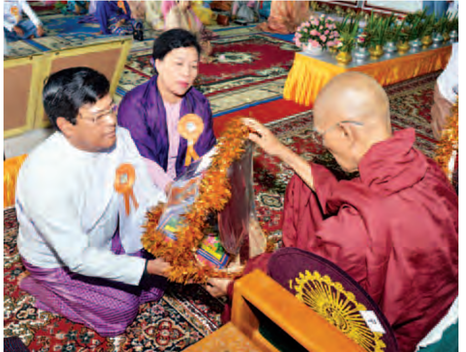
ဒုတိယသမ္မတ ဦးညွှတ်ထွန်းနှင့်ဇနီး လှူဖွယ်ပစ္စည်းများ ဆက်ကပ်လှူဒါန်းစဉ်။ (သတင်းစဉ်)