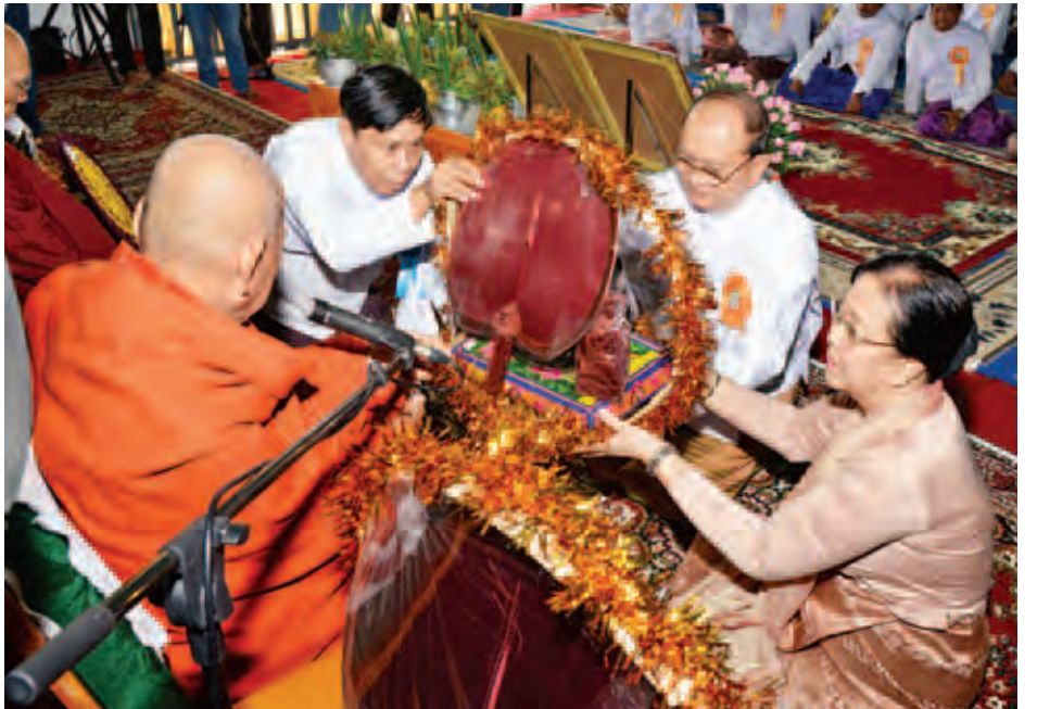
နိုင်ငံတော်သမ္မတ ဦးသိန်းစိန်နှင့်ဇနီး ဒေါ်ခင်ခင်ဝင်း မဟာသကျရံသီရင်ရှင်တော်မြတ်ကြီး ပုံတော်နှင့် လှူဖွယ် ပစ္စည်းများကို ဗန်းမော်ကျောင်းတိုက်ဆရာတော်ထံ ဆက်ကပ်လှူဒါန်းစဉ်။ (သတင်းစဉ်)

ယင်းနောက် သမ္မတရုံးဝန်ကြီး ဌာန ပြည်ထောင်စုဝန်ကြီး ဦးသိန်းညွန့် က မဟာသကျရံသီ ရုပ်ရှင်တော် မြတ်ကြီးအား တည်ဆောက်ခဲ့ကြသည့်