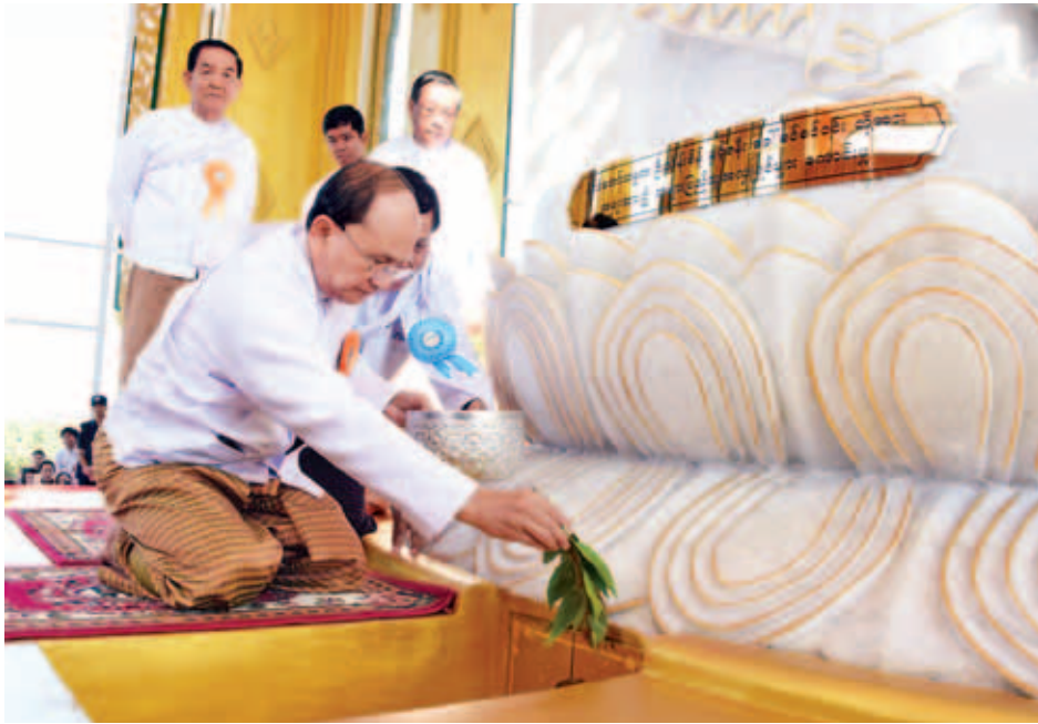
နိုင်ငံတော်သမ္မတ ဦးသိန်းစိန် မဟာသကျရံသီရင်ရှင်တော်မြတ်ကြီး ဌာပနာတော်တိုက်အား အမွှေးနံ့သာရည် ဖြင့် ပက်ဖျန်းပူဇော်စဉ်။ (သတင်းစဉ်)

စသည် စေတီလေးမျိုးပါဝင်သည့် ဌာပနာတော်များကို သွင်းလှူပြီး ကျောက်မျက်ရတနာများ ထည့်သွင်း ခင်းကျင်းကာ ပရိတ်အမွှေးနံ့သာရည် ဖြင့် ပက်ဖျန်းပူဇော်သည်။