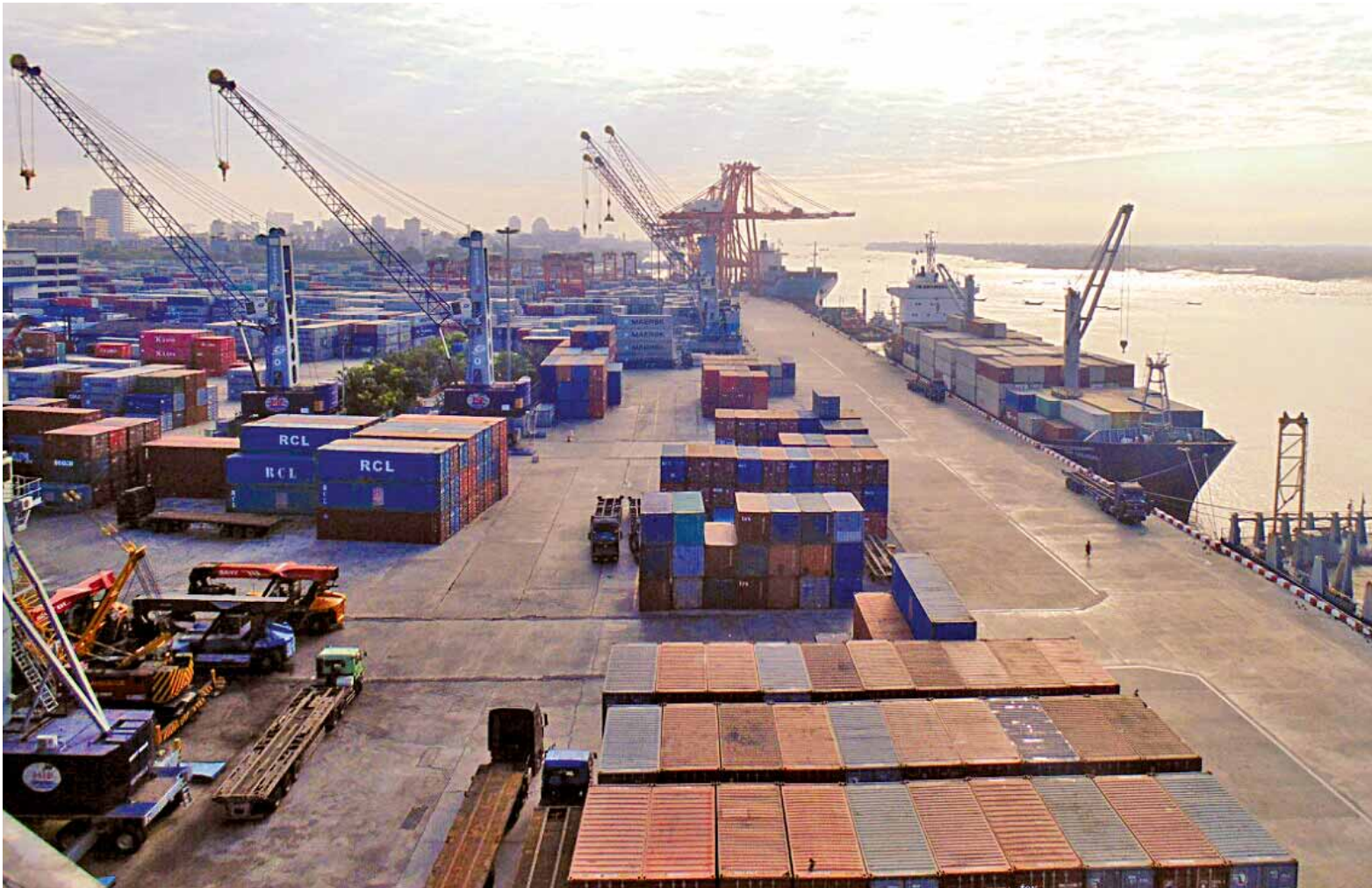
ရန်ကုန်မြို့ အလုံမြို့နယ်ရှိ Asia World ဆိပ်ကမ်းကို တွေ့ရစဉ်။