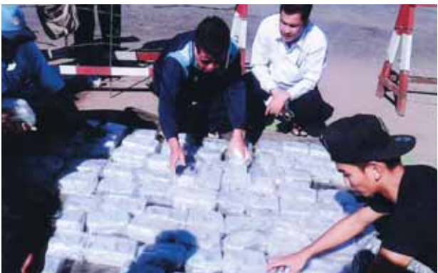
ဖြစ်စဉ်မှာ ဌာနစုံပူးပေါင်းစစ်ဆေးရေးအဖွဲ့(Mobile Team) လရခ(၁) တို့သည် တရားမဝင်ကုန်ပစ္စည်းများ ကူးသန်းသွားလာမှုစစ်ဆေးရေးအတွက် နောင်ချိုမြို့အဝင် စစ်ဆေးရေးဂိတ်တွင် နိုဝင်ဘာ ၂၄ ရက် နံနက် ၈

နောင်ချို နိုဝင်ဘာ ၂၅ တစ်ဖက်နိုင်ငံသို့ပို့ဆောင်ရန် တရားမဝင်သယ်ဆောင်လာသည့် ကျောက်စိမ်းဖြတ်စများအား နောင်ချိုစစ်ဆေးရေးဂိတ်၌ နိုဝင်ဘာ ၂၄ ရက်က သိမ်းဆည်းရမိခဲ့ကြောင်း သိရသည်။