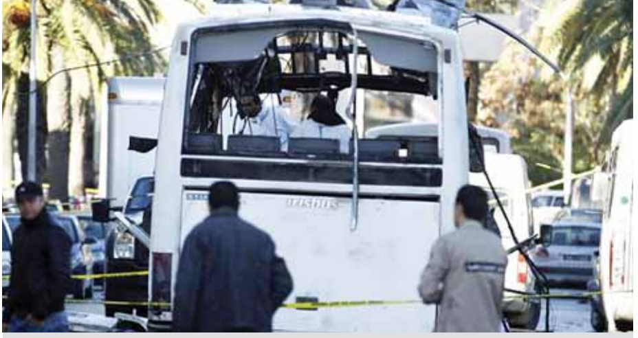
တူနီးရှားသမ္မတ၏ လုံခြုံရေးတပ်ဖွဲ့ဝင်များ စီးနင်းလိုက်ပါလာသည့် ဘတ်စ်ကားတစ်စီး တူးနစ်မြို့တွင် ဗုံးဖောက်ခွဲခံရပြီးနောက် တွေ့ရစဉ်။

တူးနစ် နိုဝင်ဘာ ၂၅ တူနီးရှားသမ္မတ၏ လုံခြုံရေး တပ်ဖွဲ့ဝင်များ စီးနင်းလိုက်ပါလာ သည့် ဘတ်စ်ကားတစ်စီးသည် နိုဝင်ဘာ ၂၄ ရက်က မြို့တော် တူးနစ်တွင် ဗုံးဖောက်ခွဲ တိုက်ခိုက် ခံရခြင်းကြောင့် တပ်ဖွဲ့ဝင် ၁၁ ဦး ထက်မနည်းသေဆုံးပြီး ၁၄ ဦး မှာ ထိခိုက်ဒဏ်ရာရခဲ့ကြောင်း ပြည်ထဲရေးဝန်ကြီးဌာနက ပြော ကြားသည်။ မြို့တော်တူးနစ်ရှိ မိုဟာမက်-၅ ရိပ်သာ လမ်းမပေါ်၌ ပေါက်ကွဲမှု ဖြစ်ပွားခြင်းဖြစ်ကြောင်း ပေါက်ကွဲ မှုကြောင့် သမ္မတတန်းတော်လုံခြုံရေး အစောင့်တပ်ဖွဲ့ဝင်များအား ဖမ်းဆီး သည့် တပ်ဖွဲ့ဝင် ၁၁ ဦး သေဆုံးခဲ့ကြောင်း တူနီးရှားပြည်ထဲရေးဝန်ကြီးဌာန ပြောရေးဆိုခွင့်ရှိသူက အတည်ပြု ပြောကြားသည်။ ပေါက်ကွဲမှု ဖြစ်ပွားရခြင်း အကြောင်းရင်းနှင့် ယင်းပေါက်ကွဲ မှုသည် မည်သူ့လက်ချက်ဖြစ်သည် တို့ကို ရှင်းလင်းစွာ မသိရှိရသေး