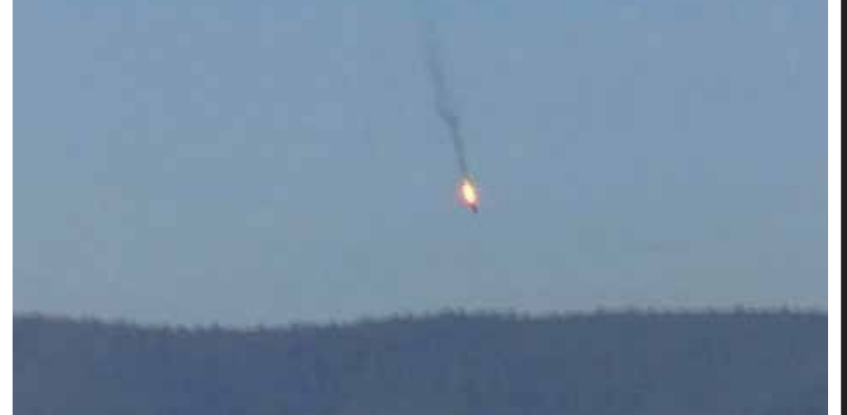
တူရကီ အက်စ်-၁၆ တိုက်လေယာဉ်၏ ပစ်ချမှုကြောင့် ရုရှားအက်စ်ယူ-၂၄ တိုက်လေယာဉ် ပျက်ကျလာစဉ်။