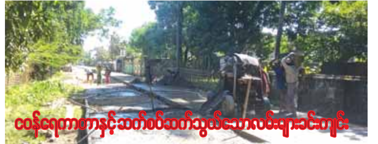
ဝန်ကြီးချုပ်နှင့်ဆက်စပ်ဆက်သွယ်သောလမ်းများခင်းကျင်း

ငါးသိုင်းချောင်း နိုဝင်ဘာ ၂၅ ဧရာဝတီတိုင်းဒေသကြီး ပုသိမ်ခရိုင် ငါး သိုင်းချောင်းမြို့ရှိ ဝန်ကြီးချုပ်နှင့်ဆက် စပ်ဆက်သွယ်သောလမ်း နှစ်လမ်းဖြစ်သည့် လမ်းမတော်လမ်းနှင့် ဘုရားလမ်း ကွန်ကရစ် ခင်းအဆင့်မြှင့်တင်ခြင်းလုပ်ငန်းကို နိုဝင်ဘာ ၂၀ လဆန်းမှ စတင်ဆောင်ရွက်ခဲ့ရာ နိုဝင်ဘာ ၂၀ ရက်တွင် ပြီးစီးခဲ့ကြောင်းသိရသည်။