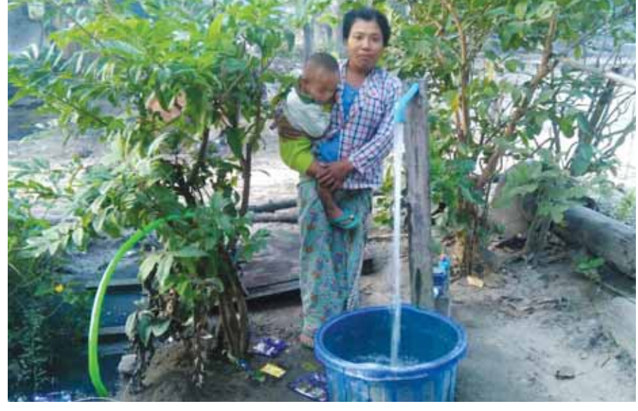
စွဲခြင်းကြောင့်အချိန်မကုန် လူမပန်းဘဲ ရေထိန်းခလုတ် ဖွင့်လိုက်ရုံနဲ့သောက်သုံးရေလွယ်ကူစွာရရှိနေကြပါပြီ ဟု ကျေးရွာနေပြည်သူတစ်ဦးက ပြောပြသည်။

ကျွန်းလှ နိုဝင်ဘာ ၂၅ စစ်ကိုင်းတိုင်းဒေသကြီး ကျွန်းလှမြို့နယ် ရေယိုမီးကျေးရွာတွင် ၂၀၁၄-၂၀၁၅ ဘဏ္ဍာနှစ် ကျေးလက်ဒေသဖွံ့ဖြိုးတိုးတက်ရေးဦးစီးဌာနက ကျေးရွာအတွင်း ရေမိတာစနစ်ဖြင့် ရေပေးနိုင်ရန် လေးလက်မစက်ရေတွင်းတူးပြီး စက်တပ်ဆင်ပေးခြင်း၊ ရေလျှောင်ကန်တည်ဆောက်ပေးခြင်း၊ ရွာအတွင်း နှစ်လက်မပိုက်ဖြင့် ရေသွယ်ရေးလုပ်ငန်းများ ဆောင်ရွက်ပေးခဲ့ကြသည်။