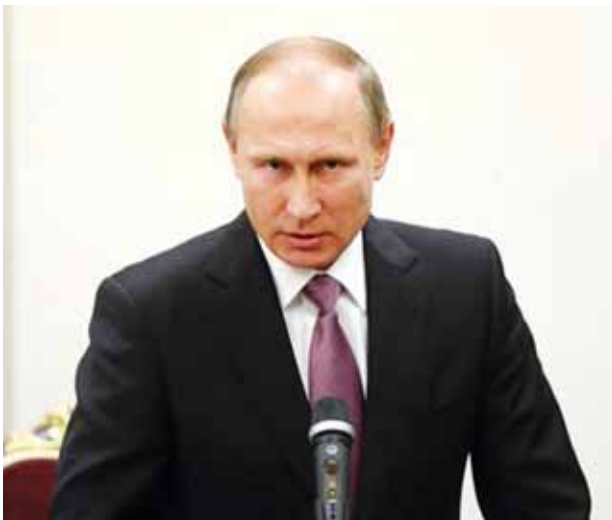
ရုရှားသမ္မတ ဗလာဒီမာ ပူတင်။

တူရကီနိုင်ငံက ဆီးရီးယားနှင့် နယ်စပ် ၎င်းတို့၏ လေပိုင်နက် အတွင်း ရုရှားတိုက်လေယာဉ် တစ်စင်း ကျူးကျော်ဝင်ရောက် လာသည်ဟုဆိုကာ နိုဝင်ဘာ ၂၄ ရက်တွင် ပစ်ချခဲ့သည့်အတွက် နေတိုးအဖွဲ့သည် အရှေ့အလယ်ပိုင်း ဒေသတွင် ပြဿနာသစ်တစ်ခု နှင့် ရင်ဆိုင်ရတော့မည်ဖြစ်သည်။ ယင်းဖြစ်ရပ်သည် ရှုပ်ထွေးလှ သည့် ဆီးရီးယားပဋိပက္ခအတွင်း ရုရှားနှင့် နေတိုးအဖွဲ့ဝင်နိုင်ငံများ အကြား တင်းမာမှုများကို ပိုမို မြင့်တက်စေမည်ဖြစ်သည်။