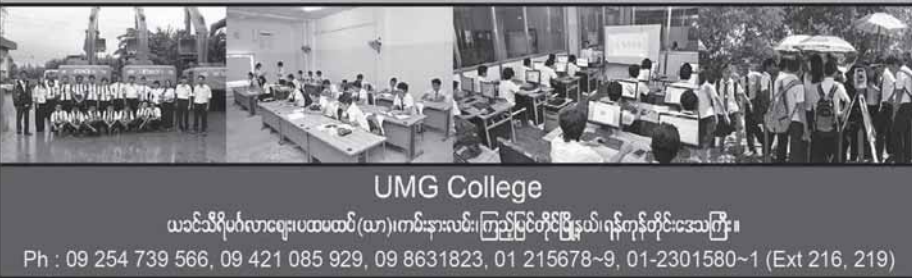
UMG College ယင်းသို့ပတ်လမ်းပထမထပ် (၁၁)၊ ကမ်းနားလမ်း၊ ကြည့်မြင်တိုင်မြို့နယ်၊ ရန်ကင်းတိုင်းဒေသကြီး။ Ph : 09 254 739 566, 09 421 085 929, 09 8631823, 01 215678-9, 01-2301580-1 (Ext 216, 219)