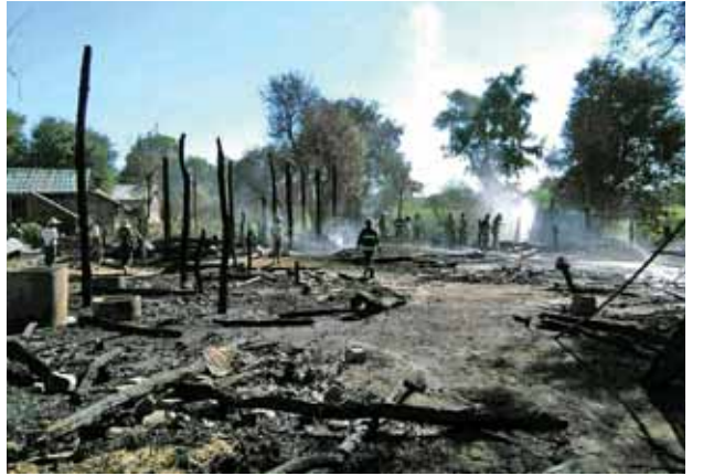
နှစ်စီးနှင့် မီးသတ်တပ်ဖွဲ့ဝင်အင်အား ခုနစ်ဦးတို့သွားရောက်ပြီး ကျေးရွာပြည်သူများနှင့်အတူ ပူးပေါင်းမီးငြိမ်းသတ်ကြကြောင်း သိရသည်။ (မြို့နယ်မြန်/ဆက်)

အဆိုပါ မီးလောင်ကျွမ်းမှုတွင် လူနှင့်တိရစ္ဆာန် အသေအပျောက် မရှိကြောင်း နှင့် မီးလောင်ရာနေရာသို့ မြို့နယ်အုပ်ချုပ်ရေးမှူးနှင့် ဝန်ထမ်းများ၊ မြို့မရဲစခန်းမှူးနှင့် ရဲတပ်ဖွဲ့ဝင်များ၊ မြို့နယ်မီးသတ်ဦးစီးမှူးနှင့် မီးသတ်တပ်ဖွဲ့ဝင်များနှင့်အတူ ဆင်ပေါင်ဝဲမြို့မှ မီးသတ်ယာဉ် နှစ်စီး၊ ဆင်ပေါင်ဝဲမြို့နယ်ကိုး ပင်ကျေးရွာမှ မီးသတ်ယာဉ်တစ်စီး၊ အောင်လံမြို့နယ်မှ မီးသတ်ယာဉ်