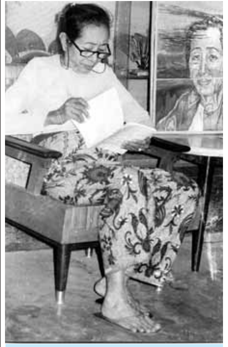
မြန်မာစာပေလောကမှ စွယ်စုံရစာပေပညာရှင်ကြီး လူထုဒေါ်အမာ။

မန္တလေး နိုဝင်ဘာ ၂၅ မြန်မာစာပေလောကတွင် စွယ်စုံရစာပေပညာရှင်ကြီး လူထုဒေါ်အမာသည် အသက် (၉၃) နှစ်အရွယ် ၂၀၀၈ ခုနှစ် ဧပြီ ၇ ရက်တွင် ဆုံးပါးသွားခဲ့သော်လည်း ဆရာမကြီးရေးသားခဲ့သော ပြည်သူ့အကျိုးပြုစာပေများစွာတို့ မှာ ယနေ့အချိန်အထိ စာအုပ်အဖြစ် ထုတ်ဝေနေဆဲပင်ဖြစ်ကြောင်း၊ ၁၉၉၅ ခုနှစ်မှစ၍ အယ်ဒီတာတာဝန်ဖြင့် ယနေ့အချိန်အထိ လူထုပုဂ္ဂိုလ်တို့တွင် တာဝန်ယူဆောင်ရွက်နေသည့် ဆရာမ၏စေမင်းက ပြောသည်။