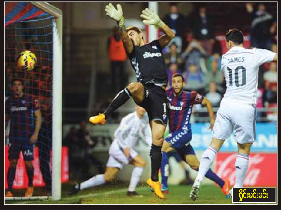
ရှိုင်းမင်းမင်း

စပိန်လာလီဂါပွဲစဉ် ၁၂ မှာ ရိုးယဲလ်မက်စ်ရစ်က ဘာစီလိုနာကို အိမ်ကွင်းဘာနေဗျူးမှာ ဂိုးပြတ်ရှုံးတယ်။ ဒီတစ်ပတ်မှာလည်း ရိုးယဲလ်မက်စ်ရစ်ဟာ လက်ရှိခြေကောင်းနေတဲ့ အိဘားနဲ့အဝေးကွင်းပွဲစဉ်အဖြစ် ရင်ဆိုင်ရမယ်။ ဒါကြောင့် ရိုးယဲလ်မက်စ်ရစ်အနေနဲ့ နိုင်ပွဲပြန်လည်ရယူနိုင်ပါ့မလားဆိုတာကို စောင့်ကြည့်ရမယ်။