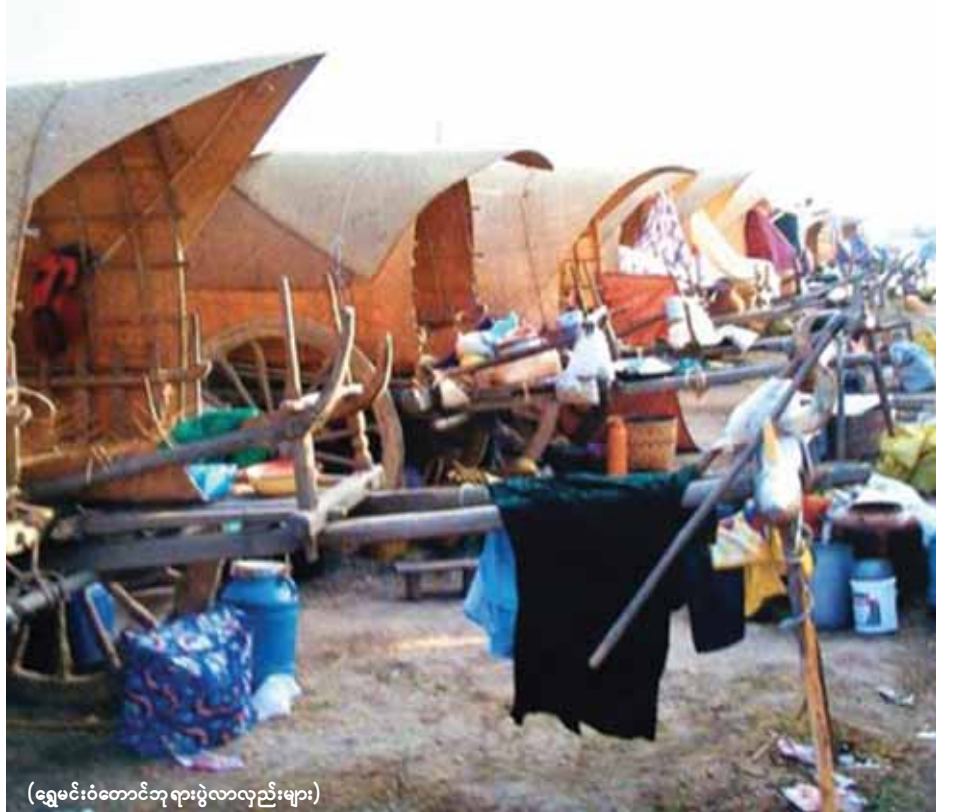
(ရွှေမင်းဝံတောင်ဘုရားပွဲလာလှည်းများ)

ရှေးမှုမပျက်ဆုံးသွားသည့် အခြားအညာပေါင်းမိုးလှည်းဘုရားပွဲများစွာလည်း ရှိနေသည်။ လက်ရှိကာလတွင် တန်ဆောင်မုန်းလပြည့် ကောင်းမှုတော်ပေါင်းမိုးလှည်းဘုရားပွဲနီးလာပြီဖြစ်သည်။ မြန်မာ့ရိုးရာအစဉ်အလာအတိုင်း ပေါင်းမိုးလှည်းများဖြင့်လာသည့် ဘုရားပွဲ၏ပျော်မွေ့ဖွယ်ရသကို ခံစားနိုင်ရန် စစ်ကိုင်းကောင်းမှုတော်ဘုရားသို့ တန်ဆောင်မုန်းလပြည့်နေ့အထိ သွားရောက်လေ့လာဆင်နွှဲနိုင်ကြောင်း သိရသည်။