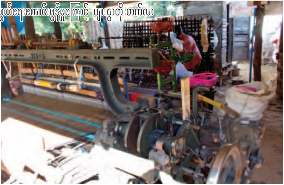
ချည်ရွစ်ထုတ်တန်းကို ခတ်လေ့ရှိပြီး တစ်စင်ပြီးပါက ပုဆိုး ၂၅ ကွင်းမှ ၂၀ အထိရရှိကြောင်း သိရသည်။ လက်ရှိ ကာလ ပုဆိုးတစ်ထည်သွင်းပေးမှုမှာ သုံးထောင့်ကိုးရာမှ လေးထောင့်အထိသွင်းရကြောင်းသိရသည်။ လက်ရှိကာလ တွင် မန္တလေးတိုင်းဒေသကြီး အမရပူရမြို့နယ် လိပ်ဆွန် ကျေးရွာမှာ လျှပ်စစ်မီးမှန်ကာ တစ်ရွာလုံးနီးပါး စက်ရက် ကန်းလုပ်ငန်းများလုပ်ကိုင်ပြီး စက်မှုထွန်းကားကာ အလုပ် အကိုင်အဆင်ပြေလျက်ရှိကြောင်းနှင့် တစ်ရွာလုံးနီးပါး ပြည်တွင်းဖြစ် သဲတောဝမ်းတွင်းထွက် စက်ရက်ကန်းစင် များကို အသုံးပြုလျက်ရှိကြောင်း သိရသည်။ (တိမ်တမန်)

၁၀၀၀ နှင့် လက်ရက်ကန်းစင် ၅၀ ခန့်ရှိသည်။စက်ရက် ကန်းများမှာ သဲတောဝမ်းတွင်းထွက် ပြည်တွင်းဖြစ် စက်ရက်ကန်းစင်များကို အသုံးပြုကြသည်။ ပြည်တွင်းဖြစ် သဲတောဝမ်းတွင်းထွက် စက်ရက်ကန်း စင် တစ်စင်လျှင် ငွေကျပ် ၁၇ သိန်းကျော် ပေးရသည်။ အိမ်တစ်အိမ်လျှင်အနည်းဆုံးစက်ရက်ကန်းစင်သုံးစင်မှ ၁၀ စင်အထိ တည်ထောင်ကာ ရက်ကန်းလုပ်ငန်းကို တွင်ကျယ်စွာလုပ်ကိုင်ကြသည်။ စက်ရက်ကန်းလုပ်ငန်း ထွန်းကားသည့်အတွက် ကျေးရွာအတွင်းတွင်ပင် အလုပ် အကိုင်အခွင့်အလမ်းများရရှိကြသည်။ ကိုယ်ပိုင်စက် ရက်ကန်းဖြင့် ကိုယ်တိုင်ခတ်သလို အငှားခတ်သူများစွာလည်း ရှိသည်။ အငှားခတ်သူများမှာ လူတစ်ဦးလျှင် စက်ရက် ကန်းစင် နှစ်စင်မှသုံးစင်အထိခတ်လေ့ရှိပြီး ပုဆိုး တစ်ကွင်းလျှင် လက်ခအဖြစ် ငွေကျပ် ၃၅၀ ရရှိသည်။ တစ်နေ့လျှင် ပုဆိုး ၁၈ ကွင်းမှ ၂၀ ကျော်အထိပြီးစီးကာ လူတစ်ဦးလျှင်နေ့စဉ် ဝင်ငွေကျပ် ၇၀၀၀ ကျော်မှ ကျပ် ၁၀၀၀၀ ကျော်အထိရရှိသည်။ ကိုယ်ပိုင်စက်ရက်ကန်းထောင်ကာ ပြုလုပ်သူများမှာ အကျိုးအမြတ်ပိုမိုရရှိကြသည်။ စက်ရက်ကန်းများမှာ လက်ရှိကာလတွင် ပလေကပ်နှင့် မိန်းမဝတ်လုံချည်များကို ရက်လုပ်ကြောင်းသိရသည်။ စက်ရက်ကန်းတစ်စင်လျှင်