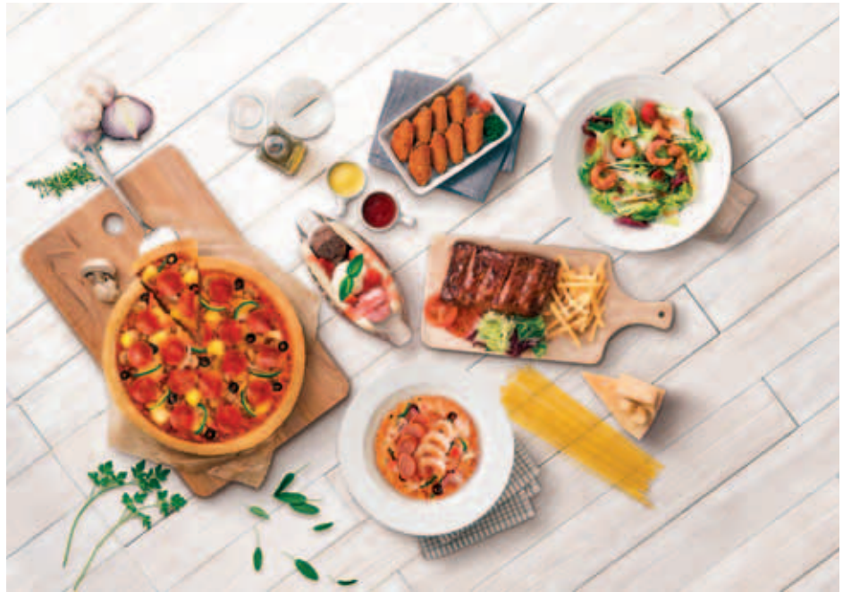
သတင်းနှင့်ဓာတ်ပုံ-ခင်ဇော်

ဟားခါး နိုဝင်ဘာ ၂၄ ဟားခါးမြို့ ဈေးသစ်ရပ်ကွက် သီတာလမ်း၌ နိုဝင်ဘာ ၂၂ ရက်ညက ဖြစ်ပွားသော ပေါက်ကွဲမှုကြောင့် ပျက်စီးသည့် အဆောက်အအုံများနှင့် ပြန်ကြည့်သည့် အမှုိုက်သရိုက်များ ဖယ်ရှားရှင်းလင်းခြင်းကို ယနေ့ နံနက် ၈ နာရီက ဟားခါးမြို့ နယ်မြေခံတပ်ရင်းတပ်ဖွဲ့မှ တပ်မတော်သားများ၊ မြန်မာ နိုင်ငံ ရဲတပ်ဖွဲ့ဝင်များ၊ မီးသတ်တပ်ဖွဲ့ဝင်များ၊ ကြက်ခြေနီတပ်ဖွဲ့ဝင်များ၊ စည်ပင်သာယာရေးအဖွဲ့နှင့် ရပ်ကွက်နေပြည်သူများက ပိုင်းဝန်းဖယ်ရှား ရှင်းလင်းပေးလျက်ရှိသည်။ ယင်းပေါက်ကွဲမှုကြောင့် နေအိမ်ပျက်စီးဆုံးရှုံးသည့် အိမ်ထောင်စု ရှစ်စုအတွက် မြန်မာနိုင်ငံကြက်ခြေနီအဖွဲ့က လှူဒါန်းသော ကယ်ဆယ်ရေးပစ္စည်း သုံးမျိုးကို ဟားခါးမြို့ ကြက်ခြေနီတပ်ဖွဲ့ဝင်များက လည်းကောင်း၊ ဟားခါးမြို့ နယ် အထွေထွေအုပ်ချုပ်ရေးဦးစီးဌာနမှ ကယ်ဆယ်ရေးပစ္စည်း ရှစ်မျိုးကို လည်းကောင်း အသီးသီးထောက်ပံ့ပေးအပ်လှူဒါန်းခဲ့ကြောင်း သိရသည်။ (ခရိုင် ပြန်/ဆက်)