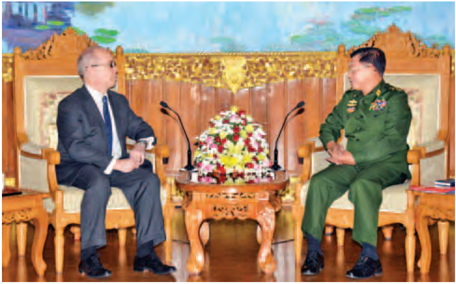
ရွေးကောက်ပွဲလွန်ကာလ မြန်မာ-အမေရိကန် နှစ်နိုင်ငံ ဆက်ဆံရေးနှင့် တပ်မတော်နှစ်ရပ်အကြား ဆက်ဆံရေး၊ ဒေါ်အောင်ဆန်းစုကြည်နှင့် တွေ့ဆုံနိုင်မည့်အခြေအနေ၊ NCA လက်မှတ်ရေးထိုးပြီးနောက်ပိုင်း ဆက်လက် လုပ်ဆောင်နေသည့် လုပ်ငန်းစဉ်များ၏ တိုးတက်မှု၊ လက်မှတ်ရေးထိုးရန် ကျန်ရှိနေသည့်အဖွဲ့များ ပါဝင်လာ နိုင်မည့်အခြေအနေနှင့် တိုင်းရင်းသားရေးရာများ ဆွေးနွေး ကြသည်။ (မြဝတီ)

ရေးဝန်ကြီး မစ္စတာ ဒန်နီရယ် အာ ရပ်စ်ဆဲလ်အား လက်ခံ တွေ့ဆုံစဉ် ထည့်သွင်းပြောကြားသည်။(ယာဝုံ) တွေ့ဆုံပွဲသို့ တပ်မတော်ကာကွယ်ရေးဦးစီးချုပ်နှင့် အတူ ညှိနှိုင်းကွပ်ကဲရေးမှူးရုံး(ကြည်း)၊ ရေ၊ လေ) ပူးတွဲ တာဝန် ကာကွယ်ရေးဦးစီးချုပ်(လေ) ဗိုလ်ချုပ်ကြီး ခင်အောင်မြင့်၊ ကာကွယ်ရေးဦးစီးချုပ်ရုံး(ကြည်း)မှ ဒုတိယ ဗိုလ်ချုပ်ကြီးမြထွန်းဦးတို့ တက်ရောက်ကြပြီး လက်ထောက် နိုင်ငံခြားရေးဝန်ကြီး မစ္စတာ ဒဲရစ်မစ်ချယ်လ်နှင့်အတူ မြန်မာနိုင်ငံဆိုင်ရာ အမေရိကန်သံအမတ်ကြီး၊ စစ်သံမှူး နှင့် တာဝန်ရှိသူများ တက်ရောက်ကြသည်။ ယင်းသို့တွေ့ဆုံရာတွင် မြန်မာနိုင်ငံ၏ ရွေးကောက်ပွဲ ကာလ နိုင်ငံရေးလျှောက်လှမ်းမှုနှင့် ယင်းအပေါ် အမေရိကန်ကွန်ဂရက်၏ သဘောထားအမြင်များ၊