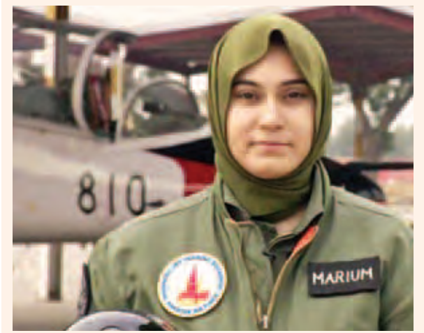
သေဆုံးသွားသည့် ပါကစ္စတန်အမျိုးသမီး လေယာဉ်မှူး မာရီယမ်မြတ်ခီတီယာ။