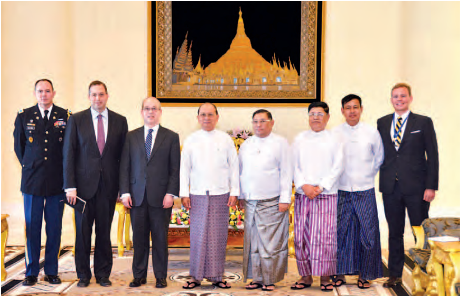
(သတင်းစဉ်)

နေပြည်တော် နိုဝင်ဘာ ၂၄ ပြည်ထောင်စုသမ္မတ မြန်မာနိုင်ငံတော် နိုင်ငံတော်သမ္မတ ဦးသိန်းစိန်သည် အမေရိကန်ပြည်ထောင်စု နိုင်ငံခြားရေးဝန်ကြီးဌာန အရှေ့အာရှနှင့် ပစိဖိတ်ရေးရာ လက်ထောက် နိုင်ငံခြားရေးဝန်ကြီး မစ္စတာ ဒက်ဗီရယ် အာရပ်စ်ဆဲလ် ဦးဆောင်သည့် ကိုယ်စားလှယ်အဖွဲ့အား ယနေ့ နံနက် ၁၁ နာရီတွင် နေပြည်တော်ရှိ နိုင်ငံတော်သမ္မတ အိမ်တော် ဧည့်ခန်းမ ဆောင်၌ လက်ခံတွေ့ဆုံသည်။ ထိုသို့တွေ့ဆုံစဉ် ရွေးကောက်ပွဲအောင်မြင်စွာ ကျင်းပပြီးစီးမှုနှင့် တာဝန်လွှဲပြောင်းရေး ကိစ္စရပ်များ ချောမွေ့ အောင်မြင်စွာဖြစ်ပေါ်လာရေး ဆောင်ရွက်နေမှု၊ မြန်မာ-အမေရိကန် နှစ်နိုင်ငံအကြား ဆက်ဆံရေးတို့ကို ဆွေးနွေးခဲ့ကြသည်။ အဆိုပါတွေ့ဆုံပွဲသို့ နိုင်ငံတော်သမ္မတနှင့်အတူ ပြည်ထောင်စုဝန်ကြီး ဦးဝဏ္ဏမောင်လွင်၊ ဦးစိုးသိန်း၊ ဦးရဲထွဋ်နှင့် တာဝန်ရှိများတက်ရောက်ကြပြီး အမေရိကန် လက်ထောက်နိုင်ငံခြားရေးဝန်ကြီးနှင့်အတူ မြန်မာနိုင်ငံဆိုင်ရာ အမေရိကန် သံအမတ်ကြီး မစ္စတာ ဒဲရစ်မစ်ချယ်လ်လည်း တက်ရောက်သည်။ (ယာပုံ)