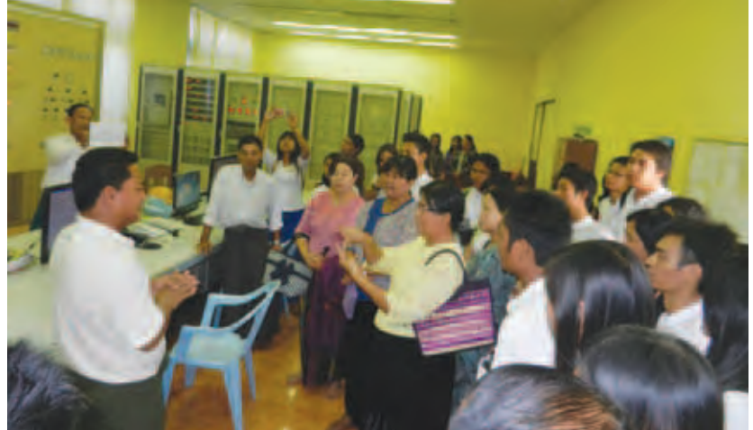
ရပ်ကွက်ရှိ ပြုစုပိတ်ထားရသောကျောင်းသို့ သွားရောက်၍ အလှူငွေနှင့် ကျောင်းသုံးပလာစာအုပ်များ၊ အဝတ်အထည်များလှူဒါန်းခဲ့ပြီး သဖန်းဆိပ်

လေ့လာရေးအဖွဲ့သည် ကျွန်းလှမြို့ ပိတောက်မြိုင်