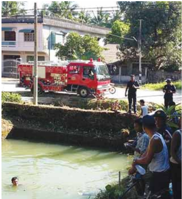
ကျေးသောင်း မီးသတ်တပ်ဖွဲ့ ဝင်များ

ကျေးသောင်းမြို့နယ် မီးသတ်တပ်ဖွဲ့ဝင်များ ရပ်ကွက်မီးသတ် ရေကန်သန့်ရှင်း၍ ပြင်ဆင်မွမ်းမံရေးလုပ်ငန်းများ ဆောင်ရွက်