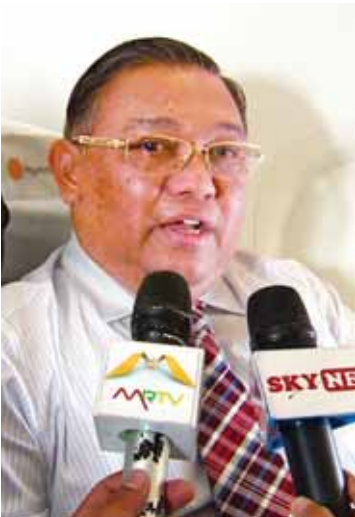
ပြည်ထောင်စုဝန်ကြီး ဦးဝဏ္ဏမောင်လွင်။

အလားတူပဲ ကမ္ဘာကြီးပေါ်မှာ ဖြစ်ပေါ်ပြောင်းလဲနေတဲ့ ရာသီဥတုပြောင်းလဲမှုဆိုင်ရာ ကိစ္စရပ်တွေ၊ ပတ်ဝန်းကျင်ထိန်းသိမ်းရေးနဲ့ ပတ်သက်ပြီးတော့ ဒေသတွင်းမှာရှိတဲ့ နိုင်ငံတွေအနေနဲ့ ဘယ်လိုပူးပေါင်းဆောင်ရွက်ကြမလဲ။ အထူးသဖြင့် အာဆီယံဒေသတွင်းမှာ ဖြစ်ပေါ်နေတဲ့ ပတ်ဝန်းကျင်နဲ့ဆိုင်တဲ့ ပြဿနာ တစ်ခုကတော့ တောမီးတွေလောင်တဲ့ နေရာကနေပြီး မီးခိုးငွေ့တွေ ပျံ့နှံ့နေတဲ့ အတွက် နိုင်ငံတစ်နိုင်ငံတည်းသာမကဘဲ တစ်ခြားနိုင်ငံအတွင်းမှာပါ သက်ရောက်မှုတွေရှိတယ်။ ဒါတွေကိုလည်း ရှေ့လျှောက်ပြီးတော့ ဘယ်လိုပြုပြင်ပြောင်းလဲသွားမလဲ။ ဘယ်လိုကာကွယ်သွားမလဲ။ နောက်တစ်ခုက ကပ်ရောဂါတွေပါ။ ကပ်ရောဂါနဲ့ ပတ်သက်ပြီးတော့ ပျံ့နှံ့မှုတွေနဲ့ ကာကွယ်မှုတွေ ဘယ်လိုဆောင်ရွက်ကြမလဲဆိုတဲ့ ဘာသာရပ် တော်တော်များများမှာ အမြင်ချင်းဖလှယ်ပြီး တော့ ဆွေးနွေးခဲ့တယ်။ အထူးသဖြင့်ကတော့ အာဆီယံအသိုက်အဝန်း ထူထောင်ရေးကိစ္စ ၂၀၁၅ ခုနှစ် ဒီဇင်ဘာ ၃၁ ရက်မှာ အာဆီယံ အသိုက်အဝန်းထူထောင်တော့မှာ ဖြစ်တဲ့ အတွက် ကြောင့် အာဆီယံ အဖွဲ့ကြီးရဲ့ နှစ်ပေါင်းများစွာ ကြိုးစားဆောင်ရွက်လာခြင်းရဲ့ ရလဒ်အသီးအပွင့်အဖြစ်နဲ့ အာဆီယံ အသိုက်အဝန်းတစ်ခုကို စတင်ထူထောင်တော့မယ်။ ဒီလိုစတင်ထူထောင်တဲ့အခါမှာ အာဆီယံအသိုက်အဝန်း ထူထောင်ခြင်းဆိုင်ရာ ကိစ္စရပ်တွေနဲ့ နိုင်ငံအသီးသီးက ဖြည့်စွမ်း