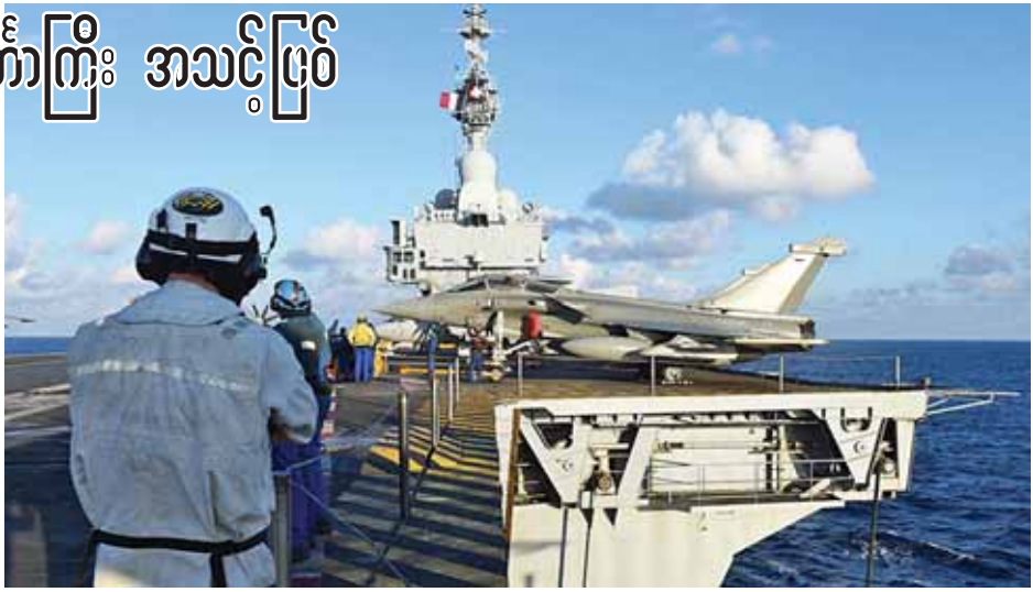
သွားရန် ရုရှားနိုင်ငံက မျှော်လင့်လျက်ရှိပြီး ရုရှားသမ္မတ အဖြစ်ရွှေ့ပြောင်းရန် စစ်ဘက်အရာရှိများကို ပြောကြားခဲ့သည်။ အင်န်အိတ်ချ်ကော့

တပ်ဖြန့်ချိထားသည့် သင်္ဘောများဖြစ်သည်။ သို့သော် လေယာဉ်တင်သင်္ဘောပေါ်ရှိ တိုက်လေယာဉ်များ မည်သည့်အချိန်တွင် ယုံသန်းတိုက်ခိုက်မှုများပြုလုပ်သွားမည်ကို လီဒါယန်က ထုတ်ဖော်ပြောကြားခြင်းမရှိပေ။ ချားလီဂေါလ် လေယာဉ်တင်သင်္ဘောပေါ်တွင် ပြင်သစ်နိုင်ငံ၏ အဓိကတိုက်လေယာဉ်များဖြစ်သည့် ရာဖေးလ်အမ် ဂျက်တိုက်လေယာဉ် ၁၈ စင်းအပါအဝင် တိုက်လေယာဉ် ၂၆ စင်း ပါရှိသည်။ ပြင်သစ်နိုင်ငံအနေဖြင့် အိုင်အက်စ်စစ်သွေးကြွများကို တိုက်ခိုက်ရန် မြေပြင်တပ်ဖွဲ့များလိုအပ်ပါက အသုံးပြုတိုက်ခိုက်သွားမည်ဖြစ်သော်လည်း လောလောဆယ်အခြေအနေတွင် မြေပြင်တပ်ဖွဲ့များကို အသုံးပြုတိုက်ခိုက်သွားရန် အစီအစဉ်မရှိကြောင်း လီဒါယန်က ပြောကြားသည်။ အိုင်အက်စ်များကို ပြင်သစ်နိုင်ငံနှင့် ပူးပေါင်းတိုက်ခိုက်