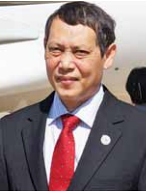
ဦးအောင်လင်း(အမြဲတမ်းအတွင်းဝန်) နိုင်ငံခြားရေးဝန်ကြီးဌာန

နိုင်ငံတော်သမ္မတက ၂၀၀၇ ခုနှစ်ကတည်းကစပြီး အာဆီယံထိပ်သီးအစည်းအဝေးတွေကို မြန်မာပြည်ကိုယ်စား ခေါင်းဆောင်အနေနဲ့ တက်ခဲ့ပါတယ်။ ၂၀၀၇ ခုနှစ်က အခြေအနေနဲ့ လက်ရှိ ၂၀၁၅ ခုနှစ် မြန်မာနိုင်ငံရဲ့ အခြေအနေဟာ အင်မတန်တိုးတက်ပြောင်းလဲနေပါပြီ။ အဲဒီအချိန်တုန်းကဆိုရင် ကုလသမဂ္ဂက ကျွန်တော်တို့အပေါ်ကို မြင်တဲ့အမြင်နဲ့ အခုလက်ရှိအခြေအနေမှာ ကုလသမဂ္ဂက ကျွန်တော်တို့အပေါ် မြင်တဲ့အမြင်က လုံးဝကွဲပြားခြားနားသွားတယ်ဆိုတာကို ကျွန်တော်သတိထားမိပါတယ်။ ၂၀၀၇ ခုနှစ်တုန်းကဆိုရင် ရွေးကောက်ပွဲလည်းမလုပ်ရသေးဘူး။ အခုလို ရွေးကောက်တင်မြှောက်ထားတဲ့ အစိုးရလည်း မတက်သေးဘူး။ မတက်သေးတဲ့အချိန်မှာ ကုလသမဂ္ဂက မြန်မာနိုင်ငံရဲ့ ဒီမိုကရေစီ ပြောင်းလဲတဲ့ဖြစ်စဉ်ကို စောင့်ကြည့်နေတဲ့အနေအထားမှာ ရှိခဲ့ပါတယ်။ အခု လက်ရှိအနေအထားမှာဆိုရင်တော့ ၂၀၁၀ ခုနှစ် ရွေးကောက်ပွဲ ပြုလုပ်ခဲ့တယ်။ ၂၀၁၁ ခုနှစ်မှာ အစိုးရသစ်ဖွဲ့စည်းခဲ့တယ်။ ဖွဲ့စည်းပြီးတော့ ၂၀၁၅ ခုနှစ် နိုဝင်ဘာလမှာ ရွေးကောက်ပွဲပြုလုပ်တဲ့နောက်ပိုင်းမှာ ကုလသမဂ္ဂက ကျွန်တော်တို့အပေါ် မြင်တဲ့အမြင်တွေဟာ တိုးတက်ပြောင်းလဲနေတယ်ဆိုတာကို ကုလသမဂ္ဂ အတွင်းရေးမှူးချုပ်ကလေးက ထုတ်ဖော်ပြောကြားတာရှိပါတယ်။ သူ့အနေနဲ့ မြန်မာနိုင်ငံမှာ ပြုလုပ်ခဲ့တဲ့ ရွေးကောက်ပွဲတွေကို ကြိုဆိုတယ်။ အသိအမှတ်ပြုတယ်။ မြန်မာနိုင်ငံမှာ ရှေ့အနာဂတ်ပြောင်းလဲမယ့် ဒီမိုကရေစီဖြစ်စဉ်တွေကိုလည်း ကုလသမဂ္ဂအနေနဲ့လည်း ဆက်လက်ပြီးတော့ လက်တွဲဆောင်ရွက်သွားမယ်ဆိုတာကို ပြောသွားပါတယ်။ မြန်မာနိုင်ငံရဲ့ မူဝါဒတွေ၊ နိုင်ငံခြားရေးရာနဲ့ပတ်သက်ပြီး ချမှတ်ထားတဲ့ မူဝါဒတွေကို နိုင်ငံခြားရေးဝန်ကြီးဌာနက အကောင်အထည်ဖော်နေတာ