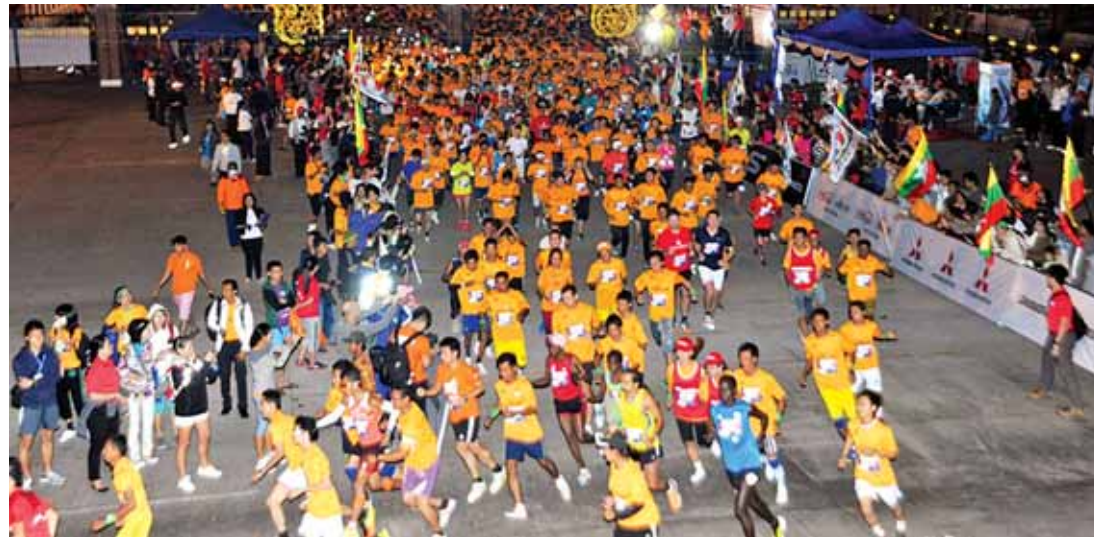
၂၀၁၅ ခုနှစ် ရိုးမ-ရန်ကုန် အပြည်ပြည်ဆိုင်ရာ မာရသွန်အပြေးပြိုင်ပွဲ ကျင်းပခဲ့စဉ်က တွေ့ရစဉ်။