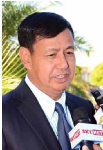
ပြည်ထောင်စုဝန်ကြီး ဦးရဲထွန်း။

ရမယ့် မဏ္ဍိုင်(၃)ခု ရှိပါတယ်။ မဏ္ဍိုင်(၃) ခုက နိုင်ငံရေးနဲ့ လုံခြုံရေး၊ စီးပွားရေး၊ လူမှုရေးနဲ့ ယဉ်ကျေးမှုနဲ့ ဒီမဏ္ဍိုင်ကြီး (၃) ရပ်လုံးက အာဆီယံ Community လို့ ပေါ်ပေါက်လာရင် ဘယ်လိုလုပ်ငန်းတွေကို စတင်ပူးပေါင်းဆောင်ရွက်ကြမလဲ။ ပြည်သူ့ လူထုတွေအနေနဲ့ အာဆီယံ(၁၀)နိုင်ငံရဲ့ နိုင်ငံသူ နိုင်ငံသားတွေအနေနဲ့ ဘယ်လို အကျိုးကျေးဇူးတွေ ခံစားရမလဲ။ ရှေ့ဆက်ပြီးတော့လည်း ဘယ်လိုညီညွတ်ညွတ်နဲ့ ဆောင်ရွက်သွားကြမလဲ။ ဥပမာ ASEAN Free Trade Area တွေ ပေါ်လာမယ်။ ပေါ်လာတဲ့အခါမှာ အခွန်အတုပ်တွေနဲ့ ပတ်သက်ပြီး ကင်းလွတ်ခွင့်တွေရရှိလာမယ်။ ပြီးရင် အဖွဲ့ဝင်နိုင်ငံအသီးသီးမှာရှိတဲ့ နိုင်ငံသူ နိုင်ငံသားတွေအနေနဲ့ တစ်နိုင်ငံနဲ့ တစ်နိုင်ငံကို လွယ်လွယ်ကူကူနဲ့ လွတ်လွတ်လပ်လပ် ပိုမိုပြီးတော့ ကူးလူးဆက်ဆံနိုင်မယ်။ တစ်နိုင်ငံနဲ့တစ်နိုင်ငံ တင်ပို့တဲ့ကုန်တွေနဲ့ ပတ်သက်ပြီးတော့ အခွန်အတုပ် ကင်းလွတ်ခွင့်တွေရမယ် စသည်ဖြင့် ရှေ့ဆက်လုပ်ဆောင်သွားရမယ့် လုပ်ငန်းတွေကို အသိုက်အဝန်းတစ်ခုအနေနဲ့ သန်း ၆၀၀ ကျော်သော (၁၀)နိုင်ငံက ပြည်သူတွေအနေနဲ့ လွတ်လွတ်လပ်လပ် ပွင့်ပွင့်လင်းလင်းနဲ့ သာတူညီမျှရှိတဲ့ အခွင့်အလမ်းတွေ ရရှိဖို့အတွက် ဆက်လက်တည်ဆောက် သွားမယ်ဆိုတဲ့ ရှေ့လုပ်ငန်းစဉ်တွေ ဆွေးနွေးခဲ့တယ်။