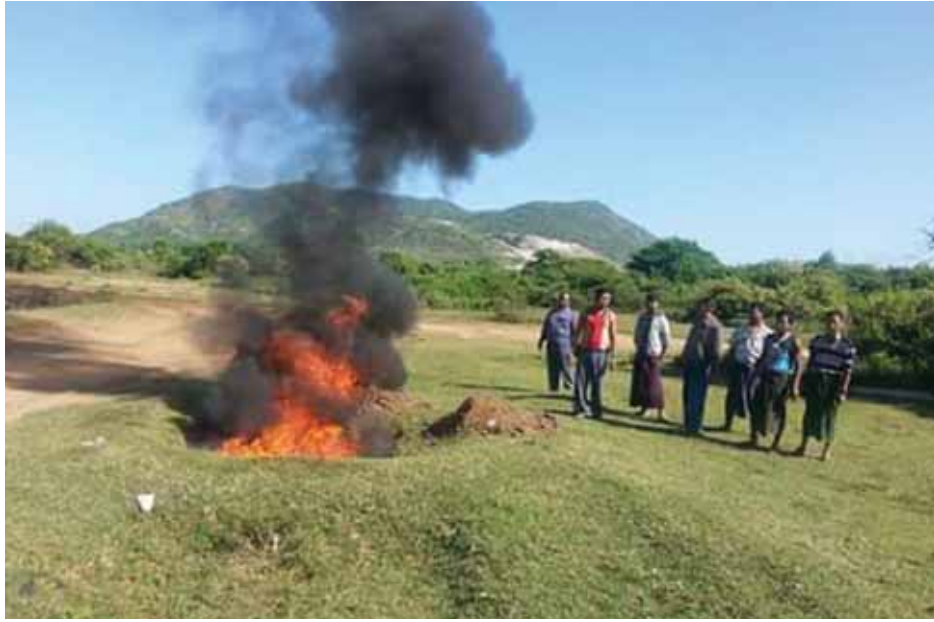
မန္တလေး နိုဝင်ဘာ ၂၃

ကျန်းမာရေးနှင့်ညီညွတ်သော စားသောက်ဖွယ်ရာများရောင်းချ စေရေးအတွက် မန္တလေးမြို့တော်စည်ပင်သာယာရေးကော်မတီက ဆောင်ရွက်လျက်ရှိရာ မြို့တော်အတွင်း ပြည်သူများအတွက်စား သုံးရန်မသင့်သည့် အစားအစားများရောင်းချခြင်းရှိ-မရှိကို အစား အသောက်နှင့် ဆေးဝါးကွပ်ကဲရေးဌာနတို့ပူးပေါင်းကာ ဈေးများ နှင့် ဈေးဆိုင်များ၊ စုပေါင်းကတ်များကို စစ်ဆေးကြပ်မတ်လျက်ရှိ ကြောင်း သိရသည်။