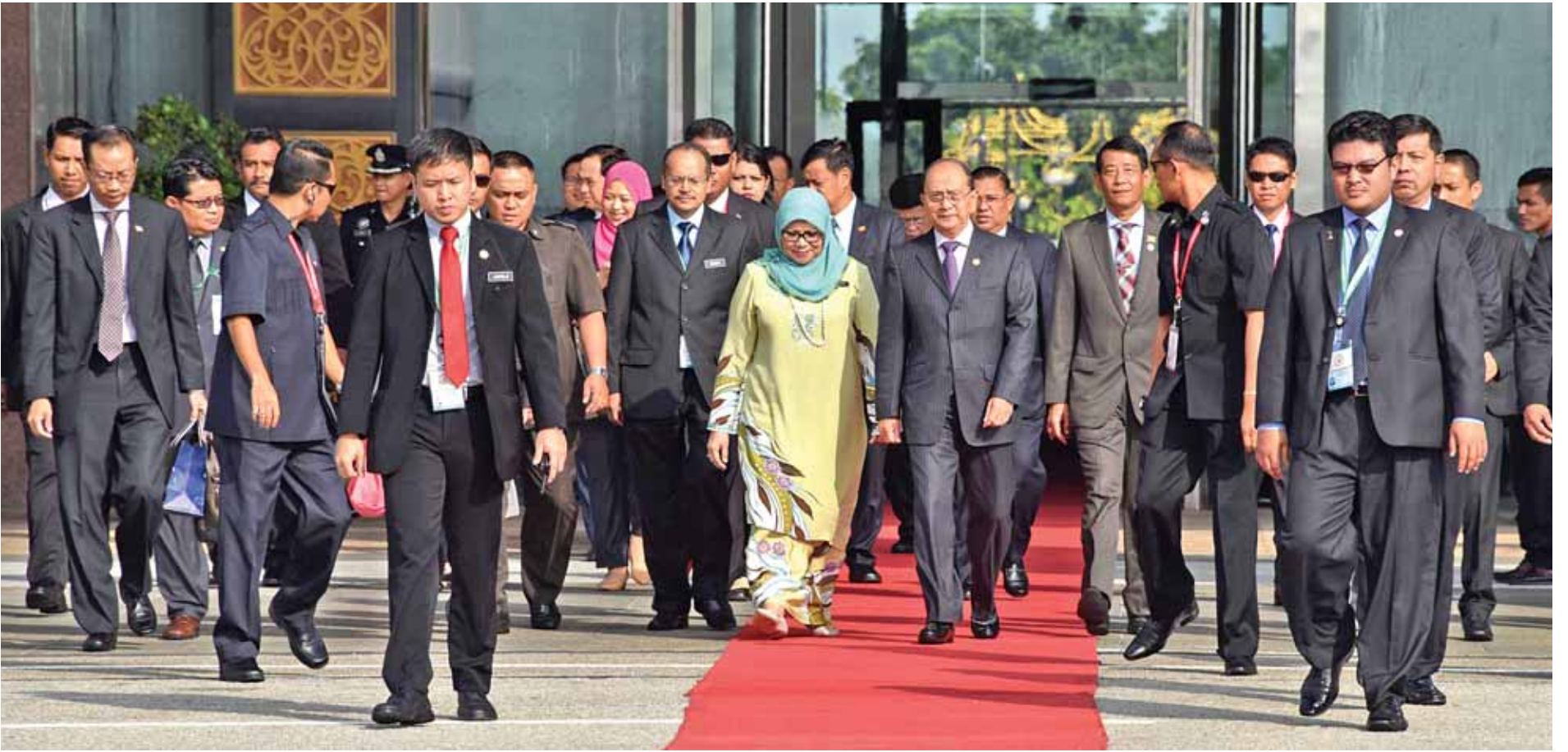
နိုဝင်ဘာ ၂၂ ရက် နံနက်ပိုင်း (၂၅) ကြိမ်မြောက် အာဆီယံတပ်မတော်အစည်းအဝေးနှင့် ဆက်စပ်အစည်းအဝေးများ တက်ရောက်ပြီး မလေးရှားနိုင်ငံမှ ပြန်လည်ထွက်ခွာရာ ကွာလာလမ်ပူအပြည်ပြည်ဆိုင်ရာလေဆိပ်၌ တာဝန်ရှိသူများက ဝိုင်းဆောင်ရွက်ဆက်ကြစဉ်။(သတင်း-ရှေ့ဖုံး)