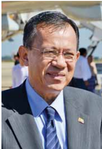
ပြည်ထောင်စုဝန်ကြီး ဒေါက်တာကံဇော်။