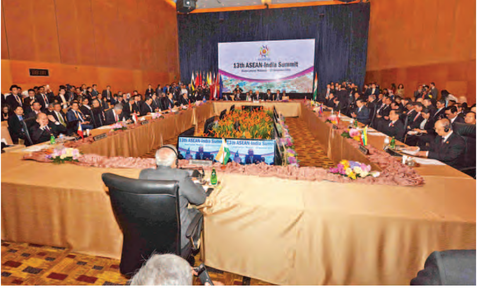
(၁၉) ကြိမ်မြောက် အာဆီယံ-အိန္ဒိယ ထိပ်သီးအစည်းအဝေး ကျင်းပစဉ်။