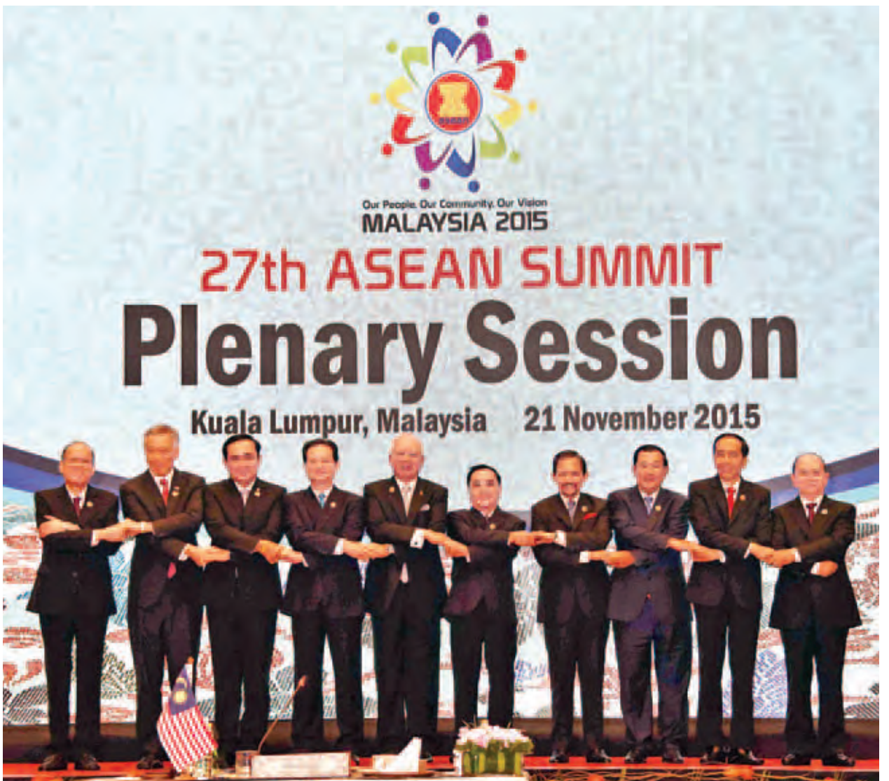
နိုင်ငံတော်သမ္မတ ဦးသိန်းစိန်နှင့် အာဆီယံနိုင်ငံများမှ နိုင်ငံအကြီးအကဲ၊ အစိုးရအဖွဲ့အကြီးအကဲများ အာဆီယံထိပ်သီးမျက်နှာစုံညီအစည်းအဝေး တွင် စုပေါင်းမှတ်တမ်းတင်ဓာတ်ပုံရိုက်ကြစဉ်။ (ပြန်/ဆက်)

ရွှေပိုးမှ ရွေးဦးစွာ နိုင်ငံတော်သမ္မတ ဦးသိန်းစိန်နှင့် အာဆီယံနိုင်ငံများမှ နိုင်ငံအကြီးအကဲ၊ အစိုးရအဖွဲ့အကြီး အကဲများသည် အစည်းအဝေးကျင်းပ မည့်ကာလအတွင်း ကြီးကြပ်စောင့်ကြည့် ထိန်းချုပ်မှုများ ပြုလုပ်ခဲ့ကြောင်း မလေးရှားနိုင်ငံ ဝန်ကြီးချုပ် ဒါတွတ်ဆရီ မူဟာမက် နာဂျစ် ဘင်တွန်း အဗ္ဗဒူ ရာဇဝတ်နှင့် ဇနီး တို့က ခင်မင်ရင်းနှီးစွာ ကြိုဆိုနှုတ်ဆက် ပြီး မှတ်တမ်းတင်ဓာတ်ပုံရိုက်သည်။ ထို့နောက် (၂၇) ကြိမ်မြောက် အာဆီယံထိပ်သီးအစည်းအဝေး ဖွင့်ပွဲ ကို Plenary Hall ၌ ကျင်းပရာ မလေးရှားနိုင်ငံဝန်ကြီးချုပ်က မိန့်ခွန်း ပြောကြားသည်။ ယင်းနောက် (၂၇) ကြိမ်မြောက် အာဆီယံထိပ်သီး မျက်နှာစုံညီ အစည်း အဝေးကို Conference Hall - 2 ၌ ကျင်းပရာ နိုင်ငံတော်သမ္မတ ဦးသိန်းစိန်၊ မလေးရှားနိုင်ငံဝန်ကြီးချုပ် ဒါတွတ် ဆရီမူဟာမက် နာဂျစ် ဘင်တွန်း အဗ္ဗဒူ ရာဇဝတ်နှင့် အာဆီယံနိုင်ငံများမှ