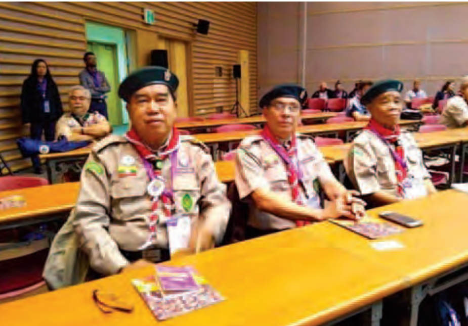
နိုဝင်ဘာ ၃ ရက်မှ ၈ ရက်အထိ တောင်ကိုရီးယားနိုင်ငံ၌ကျင်းပခဲ့သည့် “25th Asia-Pacific Regional Scout Conference” တွင် မြန်မာနိုင်ငံကို ကမ္ဘာ့ကင်းထောက်အဖွဲ့ဝင်နိုင်ငံအဖြစ် အသိအမှတ်ပြုနိုင်ရေးအတွက် မြန်မာနိုင်ငံကင်းထောက်အဖွဲ့ချုပ်ဥက္ကဋ္ဌနှင့်အဖွဲ့ တက်ရောက်ဆွေးနွေးစဉ်။

ရန်ကုန် နိုဝင်ဘာ ၂၀ ၂၀၁၅ ခုနှစ်တွင်ကျင်းပမည့် ကမ္ဘာ့ ကင်းထောက်ညီလာခံ၌ မြန်မာနိုင်ငံ အား ကမ္ဘာ့ကင်းထောက်အဖွဲ့ဝင် နိုင်ငံအဖြစ် အဆိုပြုတင်ပြသည့် အခါ ဆောင်ရွက်ဖွယ်ကိစ္စရပ်များကို ပြည်ပြည်စုံစုံဆောင်ရွက်နိုင်ရန် မြန်မာ နိုင်ငံကင်းထောက်အဖွဲ့ချုပ်၏ ရှေ့ လုပ်ငန်းစဉ်များ ညှိနှိုင်းဆွေးနွေးရေး အတွက် မြန်မာနိုင်ငံကင်းထောက် ယာယီကော်မတီနှင့် မြန်မာနိုင်ငံ