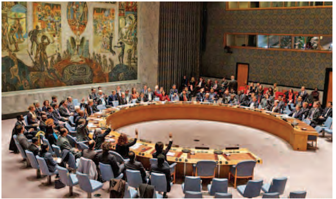
ဆီးရီးယား ကမ်းလွန်ပြင်တွင် ပြင်သစ်လေယာဉ်တင်သင်္ဘော ချားလီးဒီဂွားလီကို တပ်ဖြန့်ထားပြီး လေကြောင်းတိုက်ခိုက်မှုများ စတင်လိမ့်မည်ဟု သံအမတ်ကြီး ဖရန်ကိုစ် ဒီလာတယ်ရီက ဆိုသည်။ သို့သော် အကြမ်းဖက်အဖွဲ့အား ချေမှုန်းရေးအတွက် မြေပြင် တပ်ဖွဲ့များကို ဆီးရီးယားနိုင်ငံသို့ စေလွှတ်ရန် အစီအစဉ်ရှိ မရှိကိုမူ ပြောကြားခြင်းမရှိခဲ့ပေ။ အင်န်အိတ်ချ်ကေ။

ယခုနှစ်ဖွဲ့လုပ်ပိုင်းက တူနီးရှား၊ တူရကီနှင့် လက်ဘနွန်နိုင်ငံများတွင် ဖြစ်ပွားခဲ့သော အကြမ်းဖက်မှုများကို ရှုတ်ချသည့်အဆိုသည် နောင်ဖြစ်ပေါ်လာနိုင်သည့် အကြမ်းဖက်မှုများကို သတိချပ်ရန် ညွှန်းဆိုနေသည်။ အကြမ်းဖက်မှုများကို ကြိုတင်ကာကွယ်ရန် နိုင်ငံတကာဥပဒေနှင့် အညီ ကြိုတင်စီမံမှုများ လုပ်ဆောင်ထားသင့်ကြောင်း ကမ္ဘာ့နိုင်ငံအားလုံးကို ယင်းအဆိုတွင် တိုက်တွန်းထားသည်။ ကုလသမဂ္ဂဆိုင်ရာ ပြင်သစ်သံအမတ်ကြီး ဖရန်ကိုစ် ဒီလာတယ်ရီက ယင်းအဆို၏ အရေးပါမှုကို အလေးပေးပြောကြားခဲ့သည်။ ယင်းအဆိုသည် အိုင်အက်စ်အကြမ်းဖက်အုပ်စုကိုတိုက်ခိုက်ရန် နိုင်ငံတကာ ပူးပေါင်းဆောင်ရွက်မှုအတွက် ရပ်တည်ချက်သဘောထားနှင့်နိုင်ငံများအကြား ကျယ်ပြန့်သောညှိနှိုင်းဆောင်ရွက်မှုအတွက်ပါ အရေးပါကြောင်း ၎င်းက ဆက်လက်ပြောကြားခဲ့သည်။