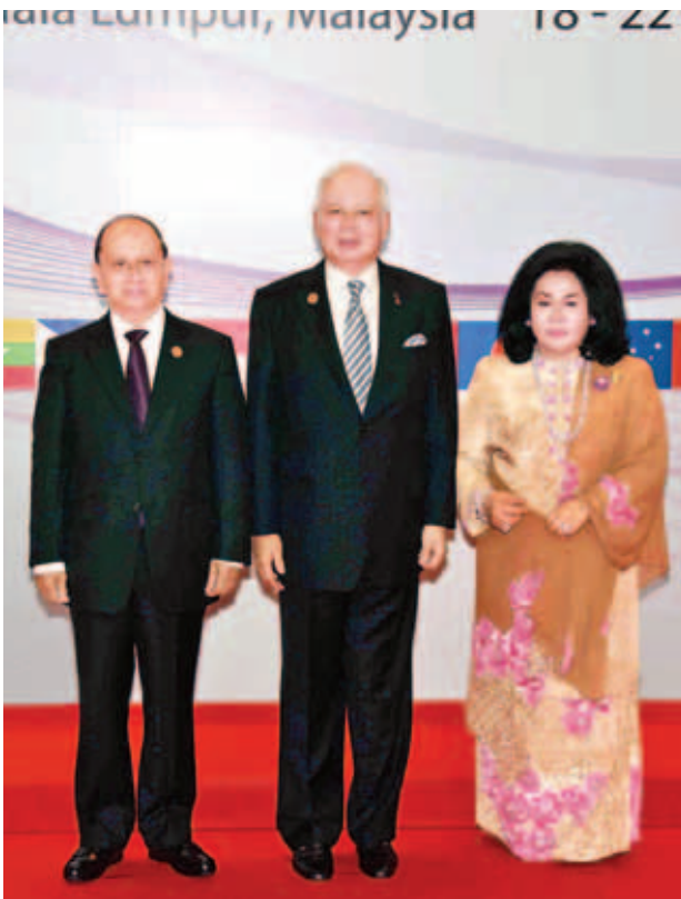
နိုင်ငံတော်သမ္မတ ဦးသိန်းစိန်အား မလေးရှားနိုင်ငံဝန်ကြီးချုပ်နှင့် ဇနီးတို့က ခင်မင်ရင်းနှီးစွာ ကြိုဆိုနှုတ်ဆက်ပြီး မှတ်တမ်းတင်ဓာတ်ပုံရိုက်စဉ်။ (ပြန်/ဆက်)