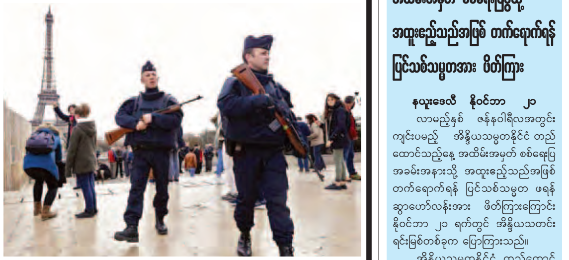
ထိပ်တန်းနိုင်ငံများ၌ ပါဝင်သည်။ လွန်ခဲ့သည့်နှစ်က ပြင်သစ်နိုင်ငံသို့ ကမ္ဘာလှည့်ခရီးသည် ၁ ဒသမ ၇ သန်း အလည်အပတ် လာရောက်ခဲ့ပြီး ယခုနှစ်တွင် နှစ်သန်းအထိ လာရောက်မည်ဟု ကနဦးတွင် ခန့်မှန်းခဲ့သည်။

ထိပ်တန်းနိုင်ငံများ၌ ပါဝင်သည်။ လွန်ခဲ့သည့်နှစ်က ပြင်သစ်နိုင်ငံသို့ ကမ္ဘာလှည့်ခရီးသည် ၁ ဒသမ ၇ သန်း အလည်အပတ် လာရောက်ခဲ့ပြီး ယခုနှစ်တွင် နှစ်သန်းအထိ လာရောက်မည်ဟု ကနဦးတွင် ခန့်မှန်းခဲ့သည်။