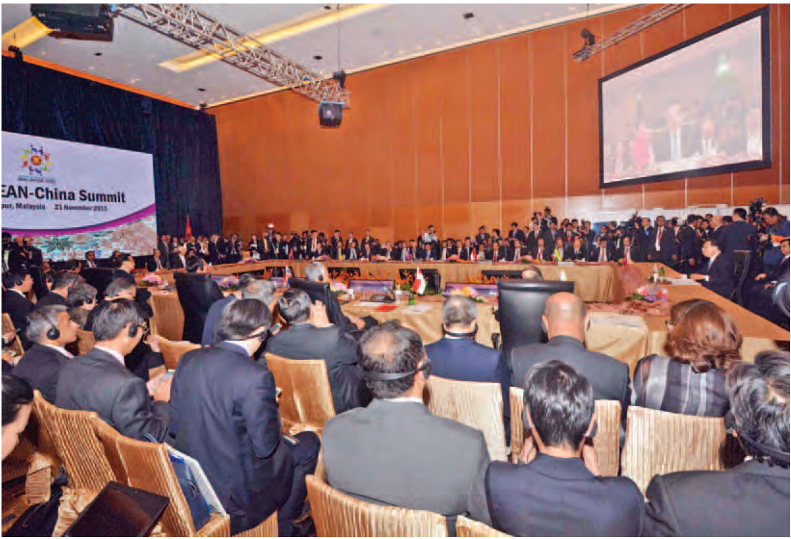
(၁၈)ကြိမ်မြောက် အာဆီယံ-တရုတ် ထိပ်သီးအစည်းအဝေး ကျင်းပစဉ်။

က္ခာလာလမ်ပူ နိုဝင်ဘာ ၂၀ ပြည်ထောင်စုသမ္မတမြန်မာနိုင်ငံတော် နိုင်ငံတော်သမ္မတ ဦးသိန်းစိန်သည် ယနေ့ မွန်းလွဲပိုင်းတွင် က္ခာလာလမ်ပူ ကွန်ဗင်းရှင်းစင်တာ၌ ကျင်းပသည့် (၁၈)ကြိမ်မြောက် အာဆီယံ-တရုတ် ထိပ်သီးအစည်းအဝေး၊ (၁၉)ကြိမ်မြောက် အာဆီယံ-အိန္ဒိယ ထိပ်သီးအစည်းအဝေး၊ (၁၈)ကြိမ်မြောက် အာဆီယံ အပေါင်းသုံး ထိပ်သီးအစည်းအဝေးနှင့် (၃)ကြိမ်မြောက် အာဆီယံ-အမေရိကန် ထိပ်သီးအစည်းအဝေးတို့သို့ တက်ရောက်ခဲ့သည်။