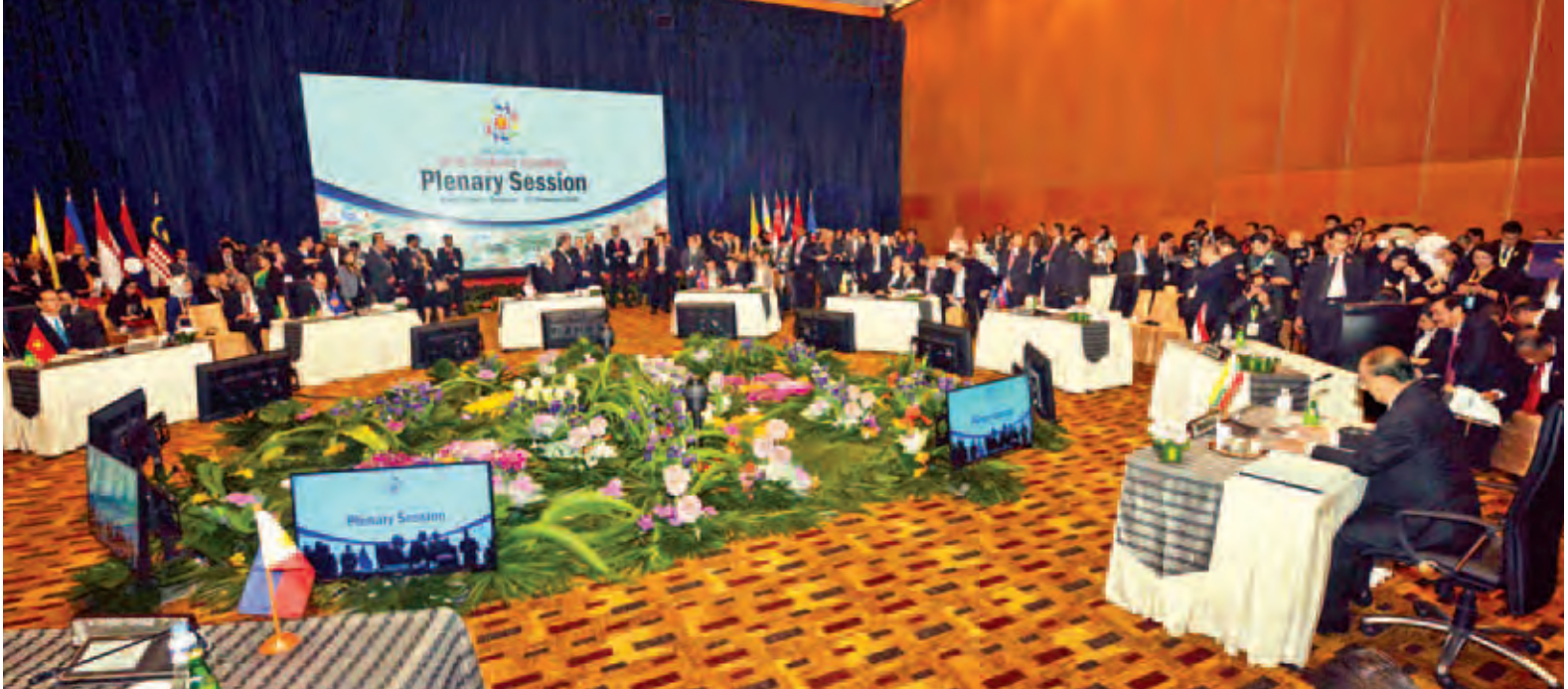
နိုင်ငံတော်သမ္မတ ဦးသိန်းစိန် အာဆီယံထိပ်သီးမျက်နှာစုံညီ အစည်းအဝေးသို့ တက်ရောက်စဉ်။ (ပြန်/ဆက်)

မြန်မာနိုင်ငံတွင် အစိုးရနှင့် တိုင်းရင်းသားလက်နက်ကိုင်အဖွဲ့ ရုစိမ်းတို့အကြား တစ်နိုင်ငံလုံး အပစ် အခတ်ရပ်စဲရေးစာချုပ်ကို ၂၀၁၅ ခုနှစ် အောက်တိုဘာ ၁၅ ရက်တွင် လက်မှတ်ရေးထိုးခဲ့ပြီး မိမိတို့သမိုင်း တွင် စာမျက်နှာသစ်တစ်ခု ဖွင့်လှစ်ခဲ့ ပါကြောင်း။ ငြိမ်းချမ်းရေးဆွေးနွေးပွဲ၏ အသီး အပွင့်တစ်ခုဖြစ်သည့် တစ်နိုင်ငံလုံး အပစ်အခတ် ရပ်စဲရေးစာချုပ်သည် ရေရှည်တည်တံ့မည့် ငြိမ်းချမ်းရေး၏ အခြေခံအုတ်မြစ်တစ်ခု ဖြစ်ပါ ကြောင်း။