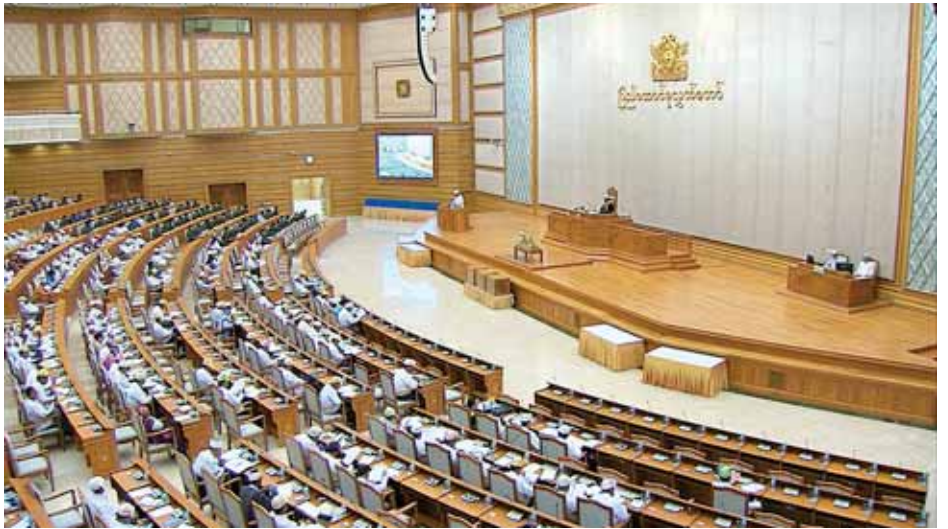
ပြည်ထောင်စုလွှတ်တော်(၁၃)ကြိမ်မြောက် ပုံမှန်အစည်းအဝေး ဒုတိယနေ့ ကျင်းပစဉ်။ (သတင်းစဉ်)

အမျိုးသားစီမံကိန်းဆောင်ရွက်မှု အစီရင်ခံစာနှင့် စပ်လျဉ်း၍ ပြည်ထောင်စုလွှတ်တော် စီမံကိန်းများနှင့်