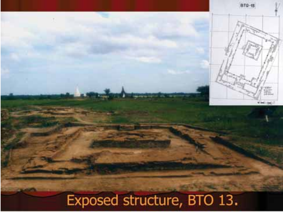
Exposed structure, BTO 13.

အက်ကွဲကျိုးပဲ့လျက်ကြေးညိုများ ထူထပ်စွာတက်လျက်ရှိသည်။ ခေါင်းလောင်းပုံသဏ္ဍာန်မှာ အလွန်ရိုးစင်းသော ပုံစံဖြစ်သည်။