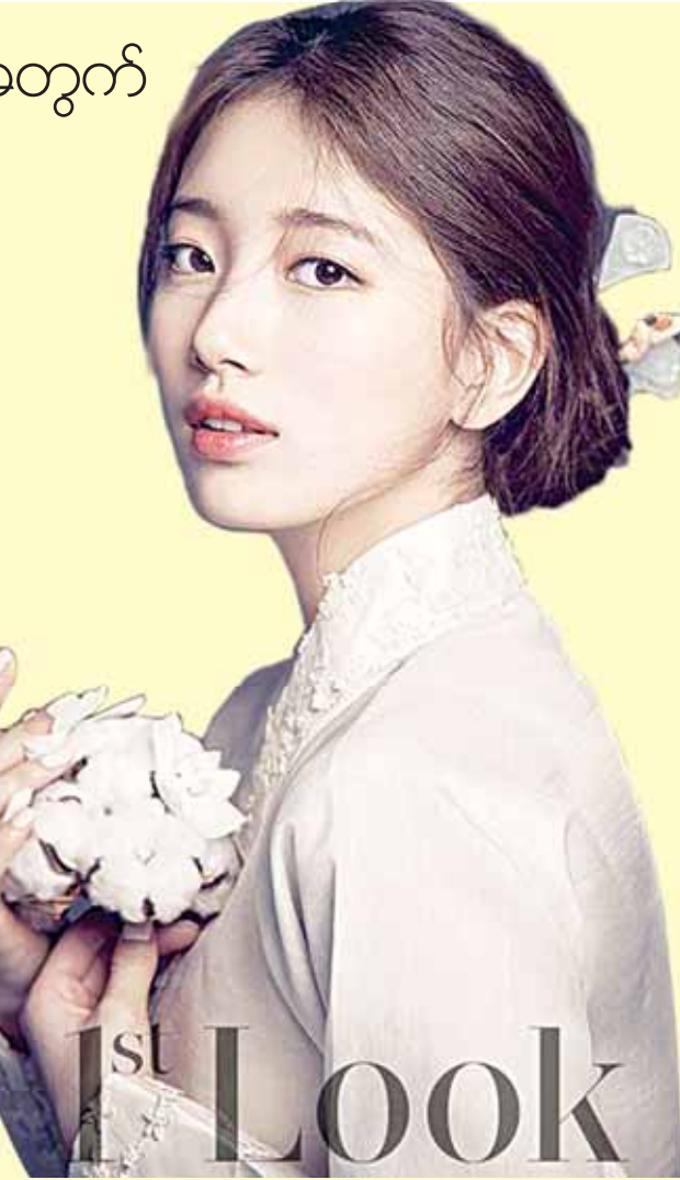
အေး ပြည့် စု စည်း သည်

တောင်ကိုရီးယားအမျိုးသမီးပေါ့ပေါ့အဆိုတော်တစ်ဦး အဖြစ်သာမက သရုပ်ဆောင်တစ်ဦးအဖြစ်ပါ ကျော်ကြားတဲ့ ဆူဇီဟာ နိုဝင်ဘာ ၁၇ ရက်က အမေရိကန်ရုပ်သံအစီအစဉ် "1st Look" အတွက် ဓာတ်ပုံရိုက်ကူးခဲ့ရာမှာ ကိုရီးယားရိုးရာ ဝတ်စုံကို ဝတ်ဆင်ရိုက်ကူးခဲ့ပါတယ်။ အဆိုပါရုပ်သံအစီအစဉ်မှာ ဆူဇီရဲ့တစ်ကိုယ်တော်ဓာတ်ပုံ အယ်လ်ဘမ်ကို ထုတ်လွှင့်ပြသသွားမှာဖြစ်ပြီး ယင်းအစီအစဉ် အတွက် အဖြူရောင်ကိုရီးယားဝတ်စုံလေးကို ဝတ်ဆင် ရိုက်ကူးခဲ့တဲ့ ဆူဇီကို ဒေသခံမီဒီယာတွေက ကိုရီးယားရဲ့ အလှစစ်ရယ်လို့ တင်စားခဲ့ကြပါတယ်။ ယင်းရုပ်သံအစီအစဉ်ဟာ များသောအားဖြင့် လတ်တလောမှာ ခေတ်စားနေတဲ့ ဖက်ရှင်ဒီဇိုင်းနဲ့ အမှတ်တံဆိပ်တွေကို ရိုက်ကူးတင်ဆက်လေ့ရှိပေမယ့် ဆူဇီကတော့ လတ်တလောမှာ ရိုက်ကူးလျက်ရှိတဲ့ သူ့ရဲ့ ရာဇဝင်ရုပ်ရှင် "Dorihwaga" အတွက် ကြော်ငြာတဲ့အနေနဲ့ ရိုးရာဝတ်စုံကို ဝတ်ဆင်ရိုက်ကူးခဲ့တာပါ။ အဆိုပါ ရာဇဝင်ရုပ်ရှင်ကိုတော့ နိုဝင်ဘာ ၂၅ ရက်မှာ တောင်ကိုရီးယား၌ စတင်မိတ်ဆက်ပြသ သွားမှာ ဖြစ်ပါတယ်။ ဆူဇီဟာ သူ့ရဲ့အနုပညာအရည်အသွေးတွေကြောင့် ကိုရီးယားရဲ့ ထိပ်တန်းအနုပညာရှင်တစ်ဦးအဖြစ် အောင်မြင် နေသကဲ့သို့ တောင်ကိုရီးယားရဲ့ စူပါမင်းသားချော လီမင်ဟိုရဲ့ ချစ်သူဖြစ်နေခြင်းကြောင့်လည်း သူ့ရဲ့ ကျော်ကြားမှုဟာ နှစ်ဆတိုးခဲ့ရပါတယ်။