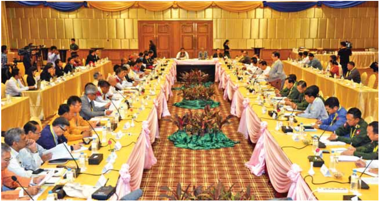
တစ်နိုင်ငံလုံးပစ်ခတ်တိုက်ခိုက်မှုရပ်စဲရေး သဘောတူစာချုပ် အကောင်အထည်ဖော်မှုဆိုင်ရာ ညှိနှိုင်းအစည်းအဝေးကို နေပြည်တော်ရှိ ဟော်ရီရန် တိုတယ်၌ ဒုတိယနေ့ ဆက်လက်ကျင်းပစဉ်။ (သတင်းစဉ်)

အဆိုပါအစည်းအဝေးသို့ ပြည်ထောင်စုငြိမ်းချမ်းရေးဖော်ဆောင်ရေး လုပ်ငန်းကော်မတီ ဒုတိယဥက္ကဋ္ဌ ဦးအောင်မင်း၊ ဦးသိန်းဇော်နှင့် ပြည်ထောင်စု ဝန်ကြီးများ၊ တပ်မတော်မှ ဒုတိယဗိုလ်ချုပ်ကြီးရာပြည့်၊ ဒုတိယဗိုလ်ချုပ်ကြီး ရဲအောင်၊ ဗိုလ်ချုပ်ထွန်းထွန်းနောင်၊ ဗိုလ်ချုပ်မင်းနောင်၊ ဒုတိယဝန်ကြီးများ၊ လွှတ်တော်ကိုယ်စားလှယ်များ၊ တိုင်းရင်းသားလက်နက်ကိုင်အဖွဲ့၊ ရှစ်ဖွဲ့မှ ကိုယ်စားလှယ်များနှင့် အဖွဲ့ဝင်များ၊ မြန်မာနိုင်ငံငြိမ်းချမ်းရေးပြည်လည် ထူထောင်ရေးလုပ်ငန်းဗဟိုဌာနမှ တာဝန်ရှိသူများ တက်ရောက်ကြသည်။ (သတင်းစဉ်)