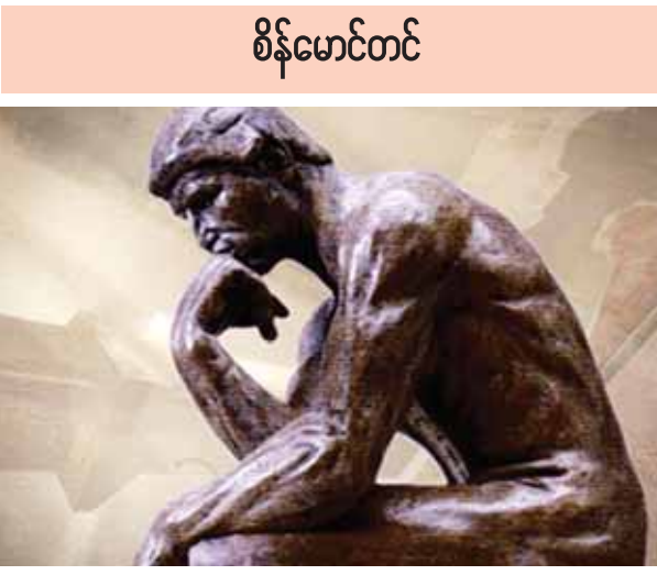
စိန်မောင်တင်

တတိယမဏ္ဍိုင်သည် ဒဿနပေဒဆိုင်ရာ အသိပညာကို ပြန့်ပွားထွန်းကားစေခြင်းနှင့် မြှင့်မားတိုးတက်စေခြင်းပင်ဖြစ်သည်။ တစ်နည်းဆိုရသော် ဒဿနပညာရပ်ကို လူသားအားလုံးထံသို့ရောက်ရှိစေ၍ သိရှိနားလည်ကျင့်သုံးနိုင်စေရန် ဖြစ်ပေသည်။ ဒဿနပညာရပ်၏တာဝန်သည် သူ၏ လေ့လာမှုနယ်ပယ်ကို ကျော်လွန်တိုးချဲ့၍ အခြားပညာရပ်နယ်ပယ်များအား ကျယ်ပြန့်စွာသိနားလည်စေရန် ဆောင်ရွက်ရမည်ဖြစ်ပေသည်။ ထို့အပြင် လူ့အဖွဲ့အစည်းအားလုံးတွင် စဉ်ဆက်မပြတ်ဖြစ်ပေါ်နေသော ပြောင်းလဲမှုများနှင့် ကမ္ဘာ့ပြဿနာများကို ခွဲခြမ်းစိတ်ဖြာစိစစ်ခြင်း၊ ပြန်လည်