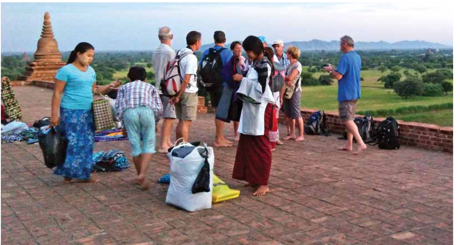
ပုဂံဒေသ ယဉ်ကျေးမှုနယ်မြေတွင် ကမ္ဘာလှည့်ခရီးသွားများအား အမှတ်တရပစ္စည်းများ လိုက်လံရောင်းချနေသူအချို့ကို တွေ့ရစဉ်။