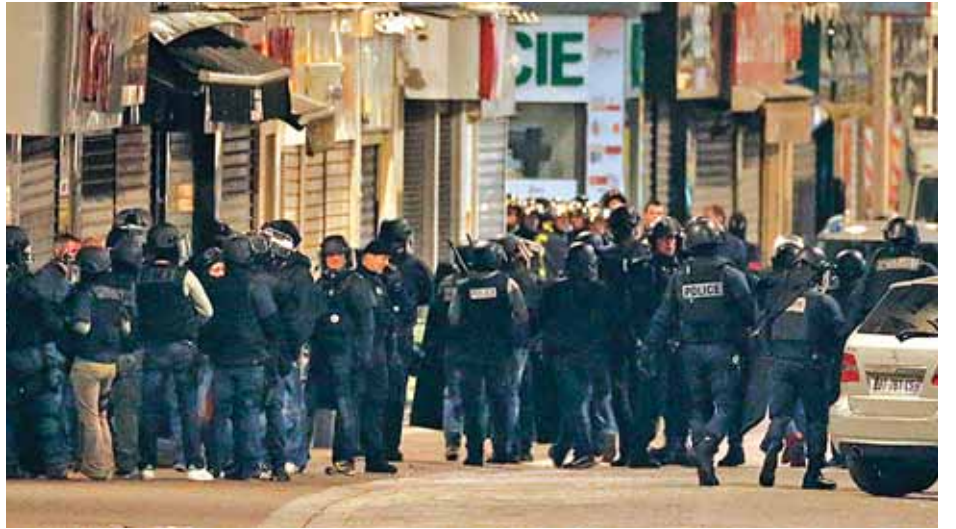
ပြောက်အိုးသံတွေလို့ပဲ ထင်မိတယ်။ ခဏကြာတော့ ပေါက်ကွဲသံတစ်ခုကြားခဲ့ရတယ်။ ပြီးတော့ ကောင်းကင်မှာ ရဟတ်ယာဉ် တစ်စင်းပျံသန်းနေတာကို မြင်ခဲ့ရတယ်။”

ဟု အခင်းဖြစ်ပွားခဲ့သည့် အဆောက်အအုံနှင့် ကပ်လျက်ရှိ တိုက်ခန်းနေ ပြည်သူတစ်ဦးကဆိုသည်။