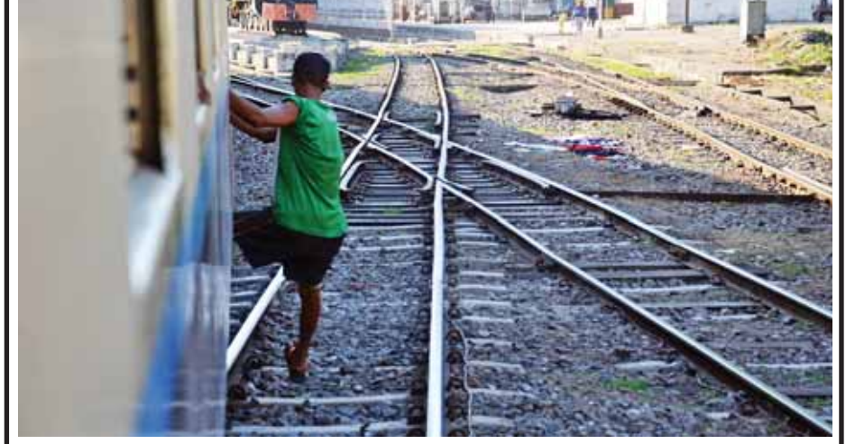
ရန်ကုန်ဘူတာကြီးသို့ မရောက်မီအရှိန်ဖြင့်သွားနေသည့် မြို့ပတ်ရထားပေါ်မှ စည်းကမ်းမဲ့စွာ ခုန်ဆင်းနေသူ တစ်ဦးကို နိုဝင်ဘာ ၁၈ ရက်က တွေ့မြင်ရစဉ်။