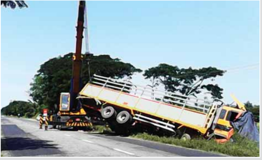
သထုံမြို့နယ် ဇရစ်ချောင်းကျေးရွာအုပ်စု အမှတ်(၉)စစ်အခြေခံလေ့ကျင့်ရေးတပ်ရေ ဝန်ထမ်း-မော်လမြိုင် အထူးပြေးကားလမ်းမကြီးပေါ်၌ လိမ္မော်သီးများ တင်ဆောင်လာသော 3k/--- ၁၂ ဘီးကုန်တင်ယာဉ်သည် ရေမှ မောင်းနှင်နေသောယာဉ်ကို ကျော်တက်စဉ် အရှိန်မထိန်းနိုင်ဘဲ တစ်ဖက်ယာဉ်ကြောသို့ ရောက်ရှိ တိမ်းမှောက်နေသည်ကို နိုဝင်ဘာ ၁၈ ရက် နံနက် ၄ နာရီခန့် တွေ့ရစဉ်။