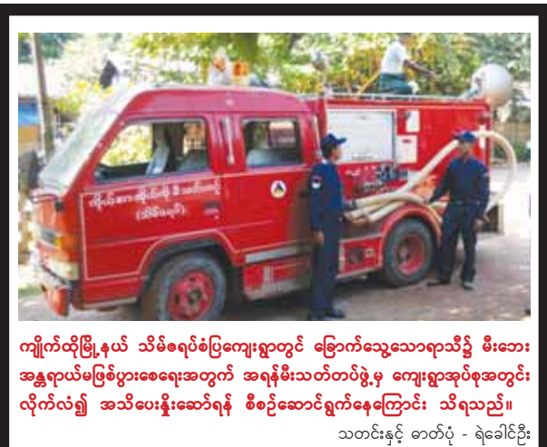
ကျိုက်တိုမြို့နယ် သိမ်စရပ်စပြကျေးရွာတွင် မြောက်သွေသောရာသီ၌ မီးဘေးအန္တရာယ်မဖြစ်ပွားစေရေးအတွက် အရန်မီးသတ်တပ်ဖွဲ့မှ ကျေးရွာအုပ်စုအတွင်း လိုက်လံ၍ အသိပေးနှိုးဆော်ရန် စီစဉ်ဆောင်ရွက်နေကြောင်း သိရသည်။

ယင်းနောက် နဂါးရုံမဟာဗောဓိစေတီတော်လိုက်ပူဇော်အတွင်း တည်ထားကိုးကွယ်သည့် ဗုဒ္ဓရုပ်ပွားဆင်းတုတော်မြတ်လေးဆူအား မသိုးသက်န်းများကို ဆွမ်းသပိတ်ကုသိုလ်ရှင်များနှင့် စေတီတော်ဂေါပကအဖွဲ့ အကျိုးဆောင်များစုပေါင်း၍ အကြည်ညိုခံ ပူဇော်ကြမည်ဖြစ်သည်။ ဆွမ်းသပိတ်အလှူရှင်များအနေဖြင့် ဆွမ်းသပိတ်တစ်လုံးအကျပ် ၃၅၀၀ နှုန်းဖြင့် နဂါးရုံမဟာဗောဓိစေတီတော် ဘဏ္ဍာတော်ထိန်းဂေါပကအဖွဲ့သို့ ဆက်သွယ်လှူဒါန်းနိုင်ကြောင်း သိရသည်။