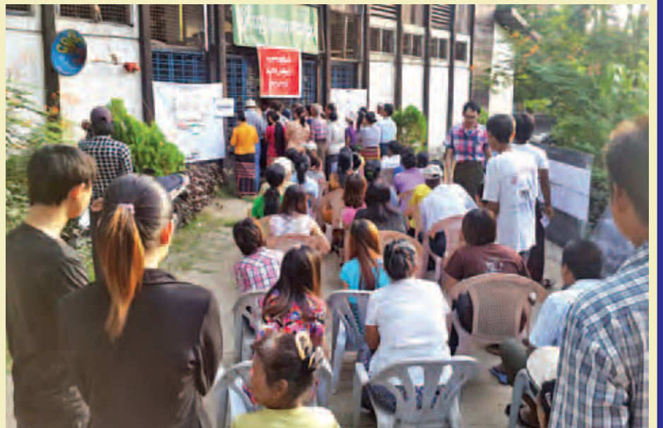
ညောင်တုန်းမြို့နယ်။