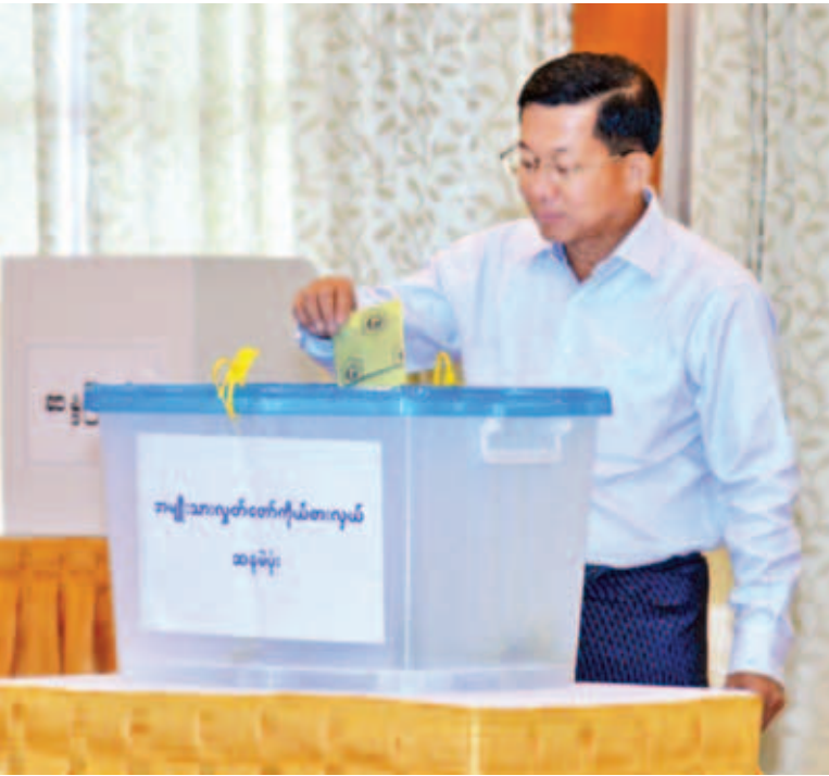
တပ်မတော်ကာကွယ်ရေးဦးစီးချုပ် ဗိုလ်ချုပ်မှူးကြီးမင်းအောင်လှိုင် နေပြည်တော် ဇေယျာသီရိ မြို့နယ် အနော်ရထာရပ်ကွက် ကာကွယ်ရေးဦးစီးချုပ်ရုံး(ကြည်း)ဝင်းအတွင်း အနော်ရထာ ခန်းမရှိ မဲရုံအမှတ်(၁)တွင် ဆန္ဒမဲပေးနေစဉ်။ (သတင်း စာမျက်နှာ-၆)