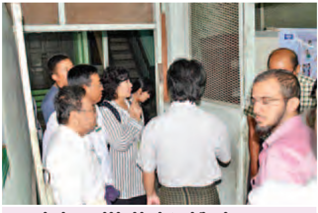
ရန်ကုန်အနောက်ပိုင်းခရိုင် ပန်းဘဲတန်းမြို့နယ်၊