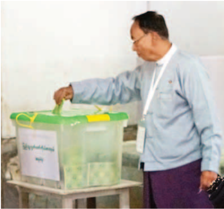
အမျိုးသားလွှတ်တော်ဥက္ကဋ္ဌ ဦးခင်အောင်မြင့် ဖျော်ဘွယ်မြို့နယ် ပြည်တော်သာရပ်ကွက် မဲရုံအမှတ်(၂) တွင် ဆန္ဒမဲပေးနေစဉ်။ (သတင်းရှေ့ဖုံး)