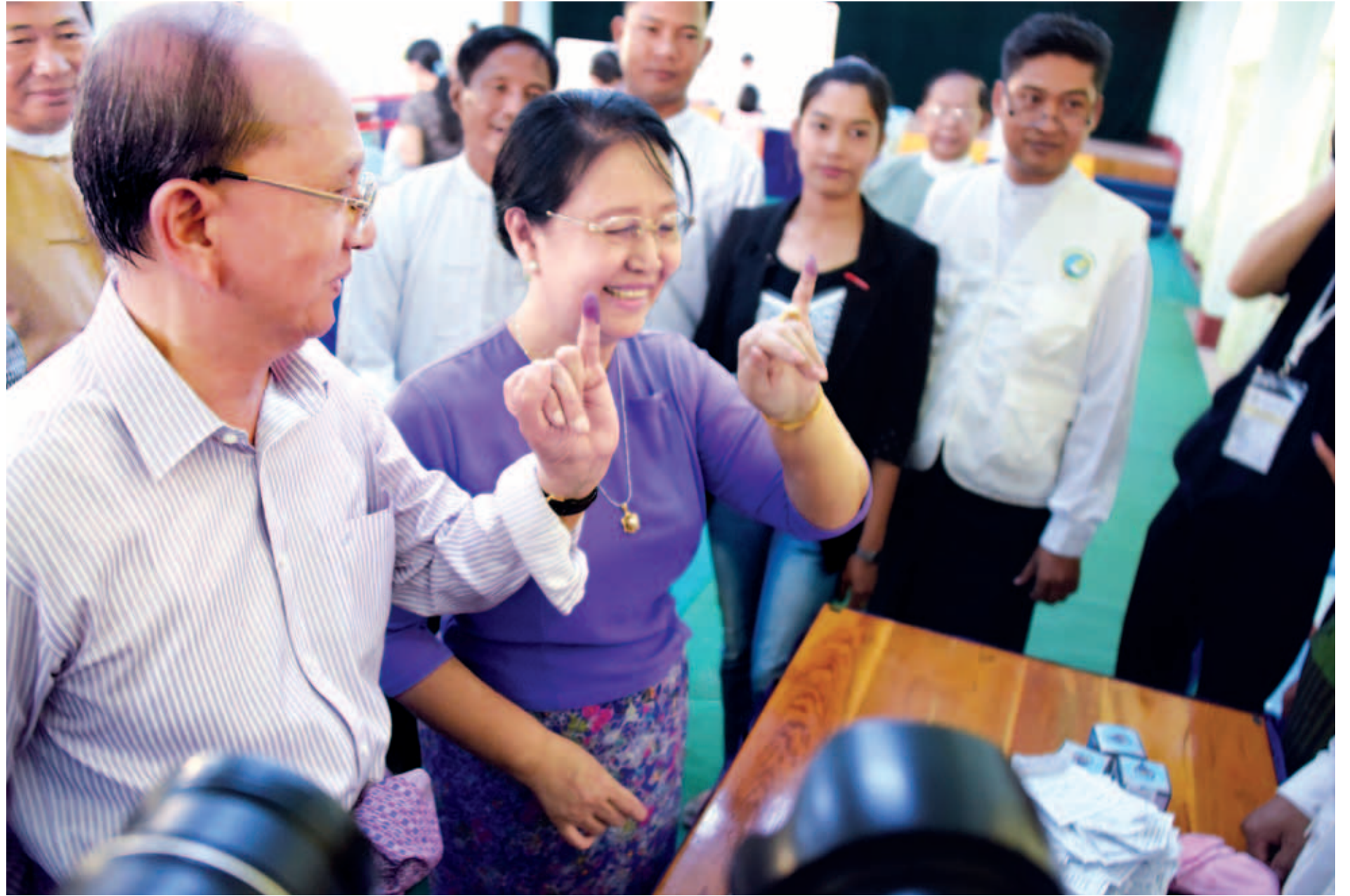
နိုင်ငံတော်သမ္မတ ဦးသိန်းစိန်နှင့် ဇနီး ဒေါ်ခင်ခင်ဝင်းတို့ ဆန္ဒမဲပေးပြီးကြောင်း မင်္ဂလာတံဆိပ်အမှတ်အသားပြုခဲ့ကြသည်ကို တွေ့ရစဉ်။

၂၀၁၅ ခုနှစ် ပါတီစုံဒီမိုကရေစီအထွေထွေရွေးကောက်ပွဲကို ယနေ့နံနက် ၆ နာရီမှစတင်၍ နေပြည်တော်အပါအဝင် တိုင်းဒေသကြီးနှင့် ပြည်နယ်အသီးသီး၌ကျင်းပရာ ပြည်သူ့လွှတ်တော်ကိုယ်စားလှယ် ၃၂၆ နေရာ၊ အမျိုးသားလွှတ်တော်ကိုယ်စားလှယ် ၁၆၈ နေရာနှင့် တိုင်းဒေသကြီး/ပြည်နယ်လွှတ်တော်ကိုယ်စားလှယ်နေရာများအတွက် မဲဆန္ဒရှင်ပြည်သူများက ဆန္ဒမဲပေးကြသည်။ စာမျက်နှာ ၃ ကော်လံ ၁ သို့ ၂