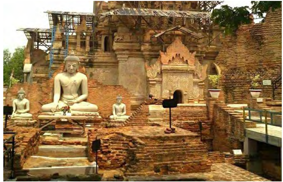
ပုဂံခေတ်ယဉ်ကျေးမှု အဆောက်အအုံများတည်ရှိနေသဖြင့် SITE MUSEUM အဖြစ် ဖန်တီးထိန်းသိမ်းထားကြောင်း နှင့် ထူးခြားအံ့ဩဖွယ်ရာ ရှေးဟောင်းအနုပညာလက်ရာများ တည်ရှိနေသဖြင့် သူတေသီများ၊ မြန်မာ့ရှေးဟောင်း ယဉ်ကျေးမှု အနုပညာလက်ရာမွန်များကို စိတ်ဝင်စားသူများ နှင့်ဘုရားဖူးများအနေဖြင့် သွားရောက်လေ့လာဖူးမြော်သင့် သည့်နေရာတစ်ခုဖြစ်၍ အနယ်နယ်အရပ်ရပ်မှ ဖူးမြော် လေ့လာသူများနှင့် ရုံးပိတ်ရက်၊ ကျောင်းပိတ်ရက်များ၊ အခါကြီးရက်ကြီးများတွင် ဘုရားဖူးစဉ်သည်များဖြင့် ပိုမိုစည်ကားလျက်ရှိကြောင်း သိရသည်။ (စိုင်းလူမင်း)

တမုတ်ရွှေဂူကြီးဘုရားသည် ပုဂံခေတ် အနုပညာလက်ရာမွန်များ၊ ပင်းယခေတ်လက်ရာမွန်များနှင့်