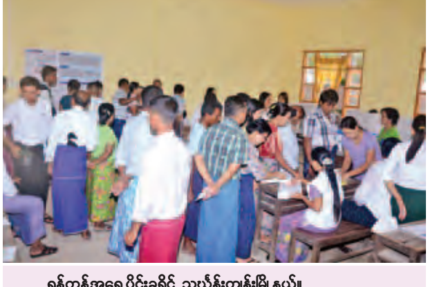
ရန်ကုန်အရှေ့ပိုင်းခရိုင် သယ်နန်းကျွန်းမြို့နယ်၊