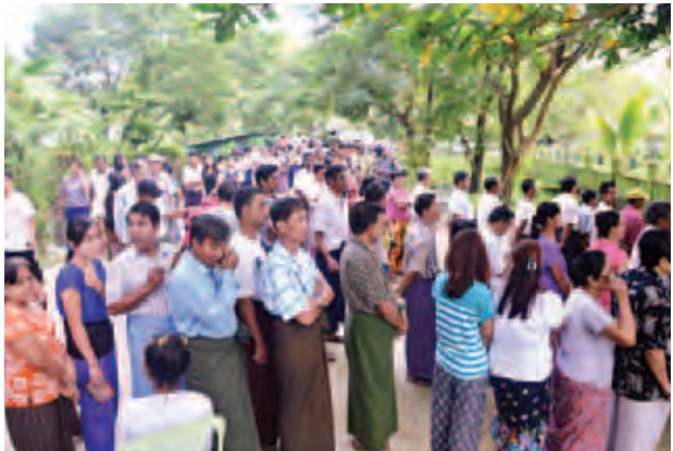
ရန်ကုန်အရှေ့ပိုင်းခရိုင် ဒဂုံမြို့သစ်(တောင်ပိုင်း)မြို့နယ်၊

ရန်ကုန်မြို့ရှိ မီဒီယာစင်တာကို ယနေ့မှ နိုဝင်ဘာ ၁၂ ရက်အထိ နံနက် ၈ နာရီမှ ည ၈ နာရီအတွင်း ဖွင့်လှစ်ထားရှိပြီး မီဒီယာများအနေဖြင့် သက်ဆိုင်ရာ ကိုယ်စားလှယ်သတင်းသမားများမှတစ်ဆင့် သတင်းရယူနိုင် ကြောင်း ပြည်ထောင်စုရွေးကောက်ပွဲကော်မရှင်က သတင်းထုတ်ပြန်ထားသည်။