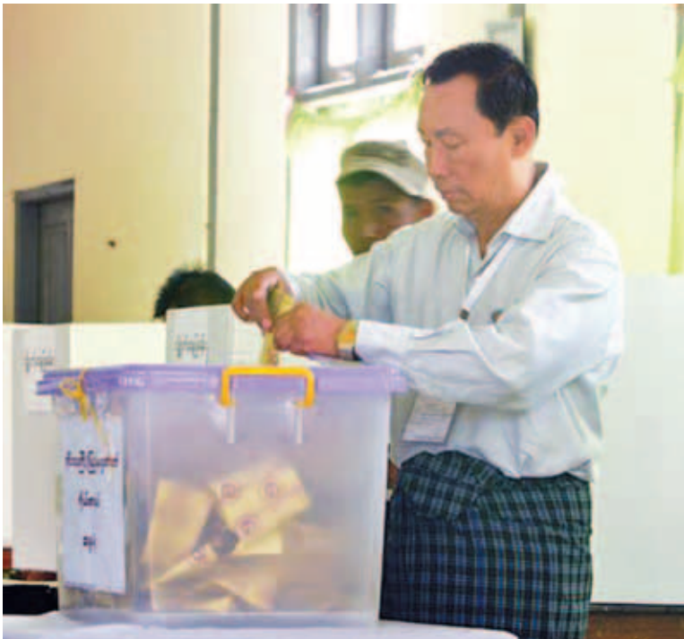
ပြည်သူ့လွှတ်တော်ဥက္ကဋ္ဌ သူရဦးရွှေမန်း ဖြူမြို့နယ် ကညွတ်ကွင်း ကွင်းနောက် (၁) ရပ်ကွက် မဲရုံအမှတ်(၂)တွင် ဆန္ဒမဲပေးနေစဉ်။ (သတင်းရှေ့ဖုံး)