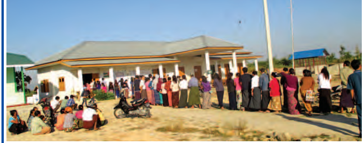
နေပြည်တော်ကောင်စီနယ်မြေ ဇေယျာသီရိမြို့နယ် ခေတ်အေးအုပ်စု စက်ကုန်းကျေးရွာရှိ မဲရုံအမှတ်(၄)၌ ဆန္ဒမဲပေးရန် စောင့်ဆိုင်းနေသူများ ကို တွေ့ရစဉ်။