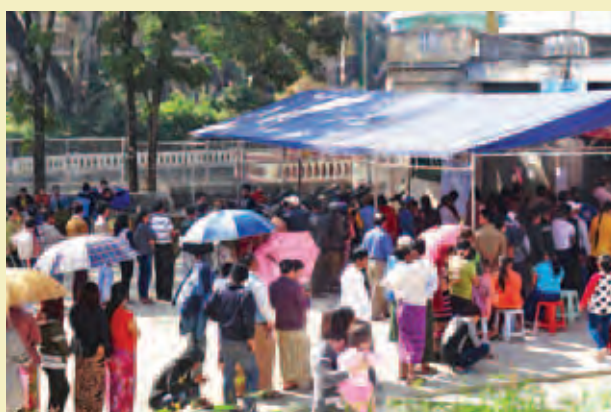
မူဆယ်မြို့နယ်။