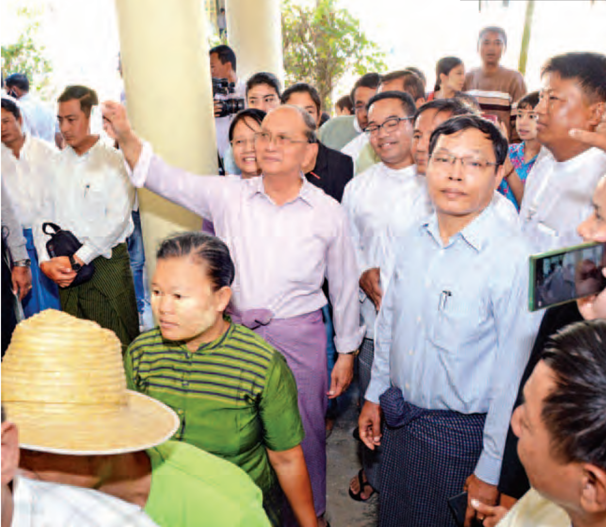
နိုင်ငံတော်သမ္မတ ဦးသိန်းစိန်နှင့်ဇနီး ဒေါ်ခင်ခင်ဝင်းတို့ ဆန္ဒမဲပေးရန် ပြည်သူများနှင့်အတူ တန်းစီစောင့်ဆိုင်းနေစဉ်။ (သတင်းစဉ်)