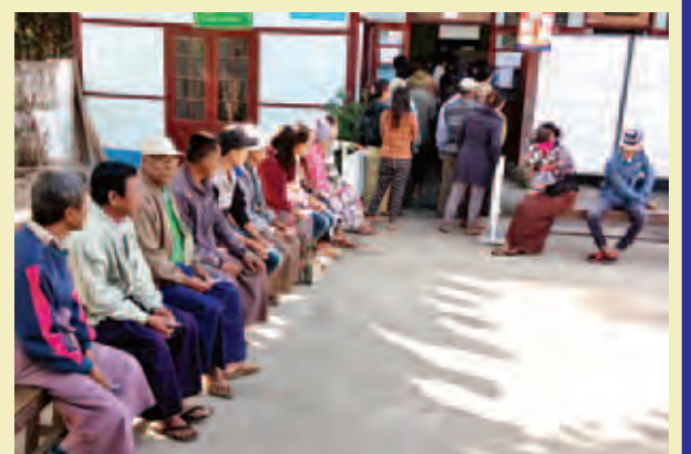
သီပေါမြို့နယ်။