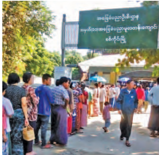
စစ်ကိုင်းမြို့ပေါ်အပါအဝင် ကျေးရွာများတွင် ၂၀၁၅ ခုနှစ် အထွေထွေရွေးကောက်ပွဲကို နိုဝင်ဘာ ၈ ရက်က ကျင်းပရာ မဲရုံမဖွင့်လှစ်မီအချိန်တွင် ဆန္ဒမဲပေးရန် အများအပြားတန်းစီ၍ စောင့်ဆိုင်းနေကြစဉ်။