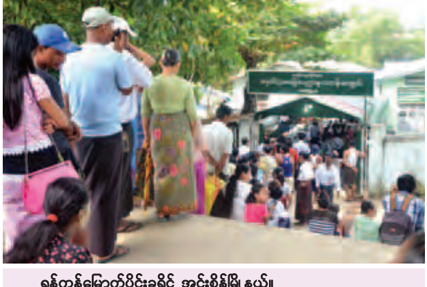
ရန်ကုန်မြောက်ပိုင်းခရိုင် အင်းစိန်မြို့နယ်၊