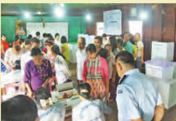
ကော့သောင်းမြို့နယ်။