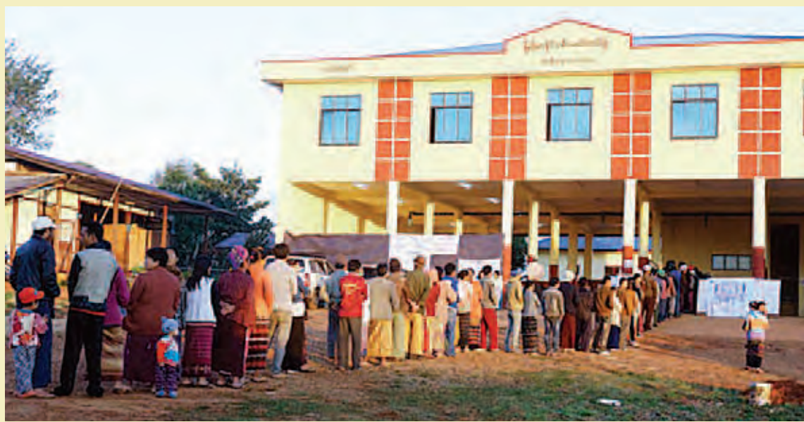
လွိုင်လင်မြို့နယ်။