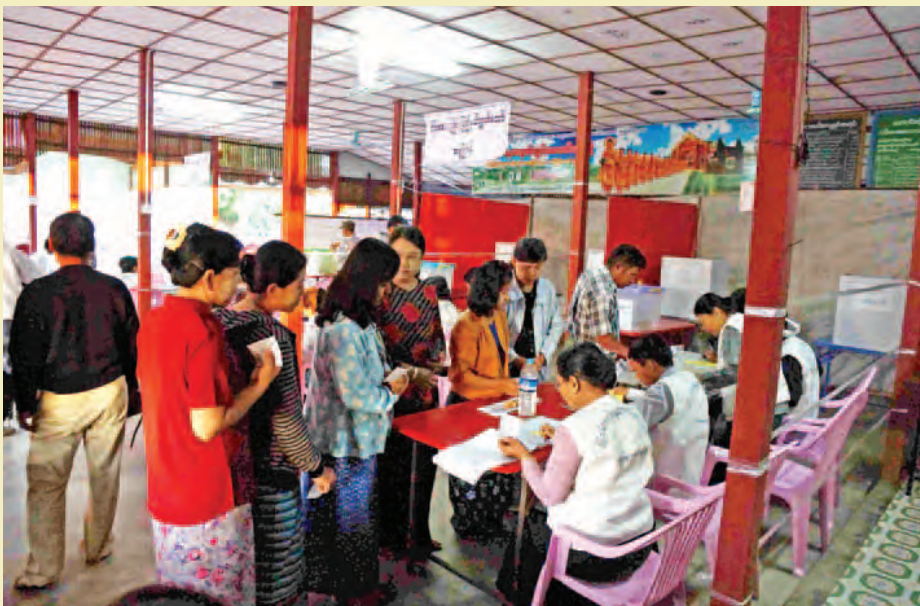
ညောင်ဦးမြို့နယ်။