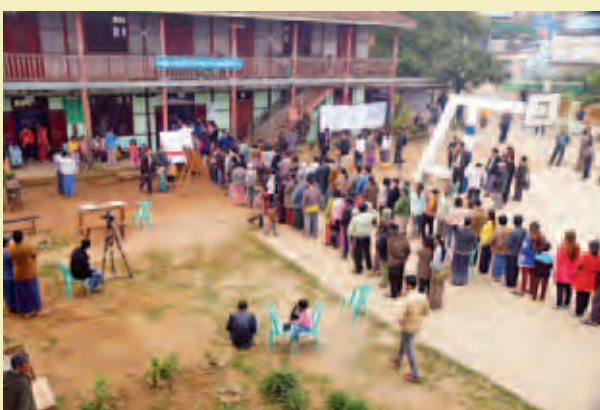
လားရှိုးမြို့နယ်။