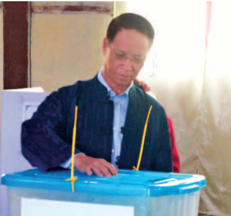
ဒုတိယသမ္မတဒေါက်တာစိုင်းမောက်ခမ်း လားရှိုးမြို့နယ် ရပ်ကွက်(၇)၌ ဖွင့်လှစ်ထားသော မဲရုံအမှတ်(၃)တွင် ဆန္ဒမဲပေးနေစဉ်။ (သတင်းရှေ့ဖုံး)