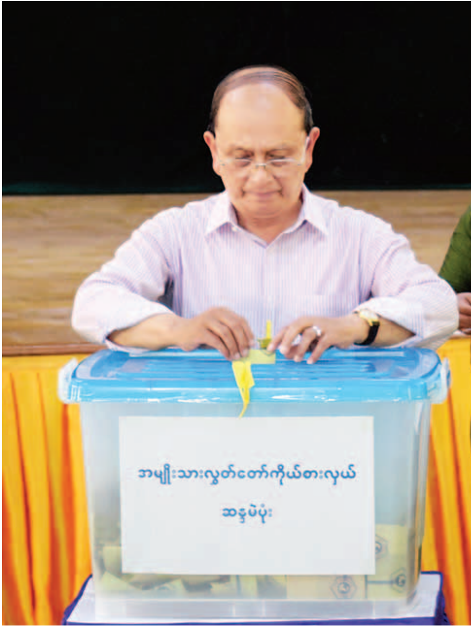
နိုင်ငံတော်သမ္မတ ဦးသိန်းစိန် ဆန္ဒမဲလက်မှတ်ကို မဲပုံးအတွင်း ထည့်သွင်းနေစဉ်။ (သတင်းစဉ်)

ပြီး သက်ဆိုင်ရာ မှတ်တမ်းစာအုပ် များ၌ မှတ်တမ်းရေးသွင်းကြသည်။ ၂၀၁၅ ခုနှစ် ပါတီစုံဒီမိုကရေစီ အထွေထွေ ရွေးကောက်ပွဲကို ရွေးကောက်ပွဲဥပဒေ၊ နည်းဥပဒေများ နှင့်အညီ သန့်ရှင်းလွတ်လပ်ပြီး တရား မျှတစွာ ကျင်းပရာတွင် မဲဆန္ဒရှင်များ လွတ်လပ်လွယ်ကူစွာ လျှို့ဝှက်ဆန္ဒပြု နိုင်ရန် မဲရုံများ၌ ဆန္ဒမဲပေးပိုင်ခွင့် ရှိသူများအား မဲရုံများအတွင်းသို့ စည်းကမ်းတကျ ဝင်ရောက်မဲပေးနိုင် ရေး စနစ်တကျ စီမံဆောင်ရွက်ပေး လျက်ရှိသည်ကို တွေ့မြင်ရသည်။ (သတင်းစဉ်)