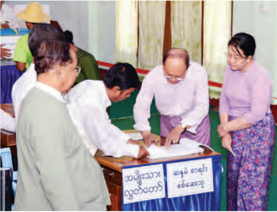
နိုင်ငံတော်သမ္မတ ဦးသိန်းစိန်နှင့်ဇနီး ဒေါ်ခင်ခင်ဝင်းတို့ ဆန္ဒမဲပေးရန် မဲလက်မှတ်ထုတ်ယူနေစဉ်။ (သတင်းစဉ်)

★ ရှေ့ပိုးမှ ထိုသို့ဆန္ဒမဲပေးကြရာ နေပြည်တော် ကောင်စီနယ်မြေအတွင်းရှိ ဇေယျသီရိ မြို့နယ်၌ ၂၀၁၅ ခုနှစ် ပါတီစုံဒီမိုကရေစီ အထွေထွေရွေးကောက်ပွဲကို နံနက် ၆ နာရီမှ ညနေ ၄ နာရီအထိ ကျင်းပရာ မဲဆန္ဒရှင်ပြည်သူများသည် ဖွင့်လှစ်ထားသည့် မဲရုံအသီးသီး၌ လွတ်လပ်စွာ ဆန္ဒမဲပေးကြသည်။ ပြည်ထောင်စုသမ္မတ မြန်မာ နိုင်ငံတော် နိုင်ငံတော်သမ္မတ ဦးသိန်းစိန်နှင့်ဇနီး ဒေါ်ခင်ခင်ဝင်း တို့သည် နံနက် ၁၁ နာရီ ၁၅ မိနစ် တွင် ဇေယျသီရိမြို့နယ်ရှိ နေပြည်တော် အမှတ်(၅) အခြေခံပညာအထက်တန်း ကျောင်း၌ ဖွင့်လှစ်ထားသော မဲရုံ အမှတ်(၁)သို့ လာရောက်ဆန္ဒမဲပေး ကြသည်။ ထိုသို့ မဲရုံများတွင် ဆန္ဒမဲပေးနေမှု များကို မြန်မာနိုင်ငံဆိုင်ရာ နိုင်ငံခြား သံရုံးများမှ တာဝန်ရှိသူများ၊ ပြည်တွင်းပြည်ပမှ ရွေးကောက်ပွဲ စောင့်ကြည့်လေ့လာရေး အဖွဲ့များ၊ အာဆီယံနိုင်ငံများမှ ကိုယ်စားလှယ် များနှင့် ပြည်တွင်းပြည်ပမှ သတင်း မီဒီယာသမားများ လာရောက်ကြည့်ရှု လေ့လာ သတင်းရယူကြသည်။ ဇေယျသီရိမြို့နယ်တွင် မဲရုံပေါင်း ၃၃ ရုံ ဖွင့်လှစ်ထားရှိပြီး ဆန္ဒမဲ ပေးခွင့်ရှိသူ ၅၉၆၃၅ ဦးရှိရာ မဲဆန္ဒ ပေးပိုင်ခွင့်ရှိသည့် မဲဆန္ဒရှင်ပြည်သူ များသည် မဲရုံစတင်ဖွင့်လှစ်သည့် နံနက် ၆ နာရီ မတိုင်မီကပင် သက်ဆိုင်ရာမဲရုံအသီးသီးသို့ စုဝေး ရောက်ရှိလာကြပြီး မဲရုံဖွင့်လှစ်ချိန်မှ စ၍ မိမိတို့နှစ်သက်ရာ လွှတ်တော်