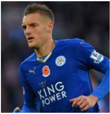
နစ္စတယ်ရှိုင်းရဲ့ စံချိန်ကို လိုက်မီခဲ့တဲ့ ဟနီ

လက်စတာက ဝက်ဖွဲ့ဒ်ကိုနှစ်ဂိုး-တစ်ဂိုး နဲ့ အနိုင်ရရှိခဲ့တဲ့ ပရီမီယာလိဂ်ပွဲစဉ်(၁၂)မှာ တိုက်စစ်မှူးဗာဒီက လက်စတာအတွက် သွင်းဂိုးတစ်ဂိုးကို ပင်နယ်တီမှတစ်ဆင့်သွင်း ယူနိုင်ခဲ့ပြီးနောက်မှာ အရင် မန်ယူတိုက်စစ်မှူး နစ္စတယ်ရှိုင်းရဲ့ ကိုးပွဲဆက်ဂိုးသွင်းယူနိုင်ခဲ့ တဲ့ စံချိန်တစ်ခုကို လိုက်မီနိုင်ခဲ့ပါတယ်။ အရင်က မထင်မရှားကစားသမားလေးဗာဒီ ဟာ လက်စတာမှာပြသနေတဲ့ သူ့ရဲ့ပုံစံ ကောင်းကြောင့် အခုဆို အင်္ဂလန်တိုက်စစ်မှာ တောင် နေရာပေးခံနေရပါပြီ။ ဗာဒီက အင်္ဂလန်တောင်ပံတိုက်စစ်နေရာမှာ ကစား နေရတဲ့အတွက် ဗဟိုတိုက်စစ်နေရာမှာကစား ရင်သူအတွက် ပိုသင့်တော်တယ်လို့တောင်း ဆိုခဲ့တာကြောင့် နည်းပြဟော့ဆန်ရဲ့ သတိ ပေးမှုခံခဲ့ရသူပါ။