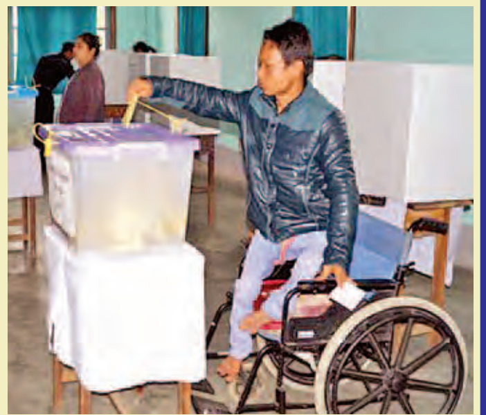
မိုင်းဆတ်မြို့နယ်။