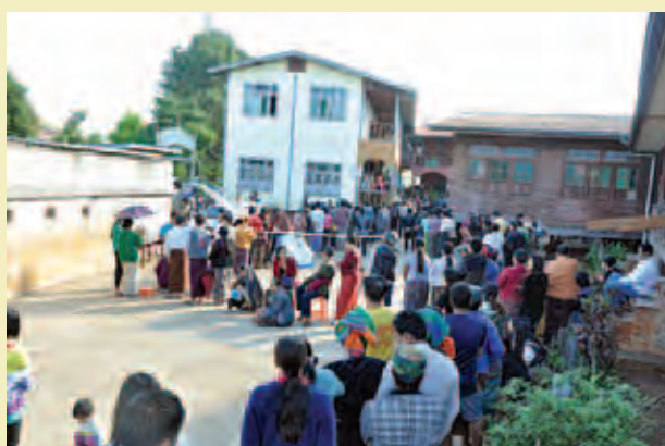
တောင်ကြီးမြို့နယ်။