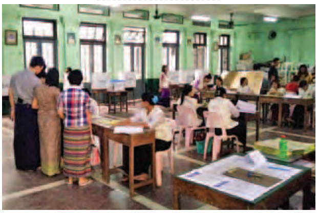
ရန်ကုန်အရှေ့ပိုင်းခရိုင် ပုဇွန်တောင်မြို့နယ်၊