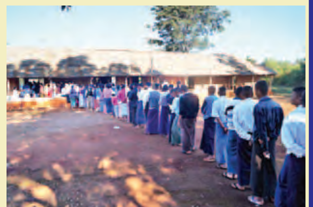
နမ့်စန်မြို့နယ်။