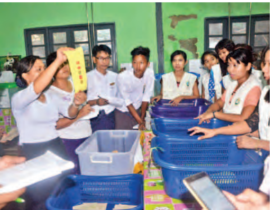
ရန်ကုန်တိုင်းဒေသကြီး ဒေါပုံမြို့နယ် သင်္ဘောကျင်းရပ်ကွက် မဲရုံများ၌ နိုဝင်ဘာ ၈ ရက် ညနေအချိန်တွင် ဆန္ဒမဲရေတွက်နေသည်ကို တွေ့ရစဉ်။