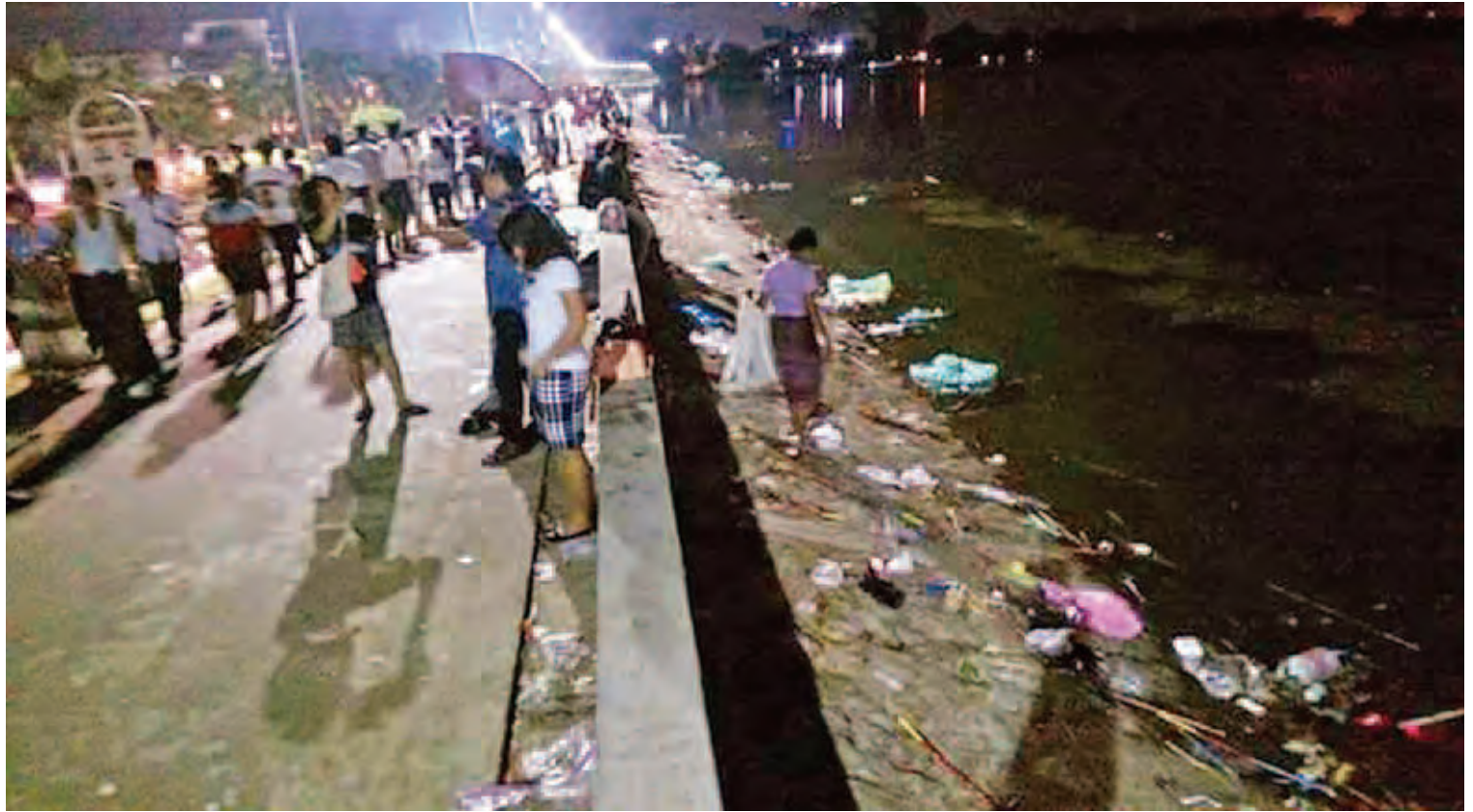
သီတင်းကျွတ်လပြည့်နေ့က ရန်ကုန်မြို့ အင်းလျားကန်ပေါင်တွင် အမှိုက်စွန့်ပစ်မှုများကြောင့် ရုပ်ဆိုးအကျည်းတန်လျက်ရှိသည်ကို တွေ့ရစဉ်။