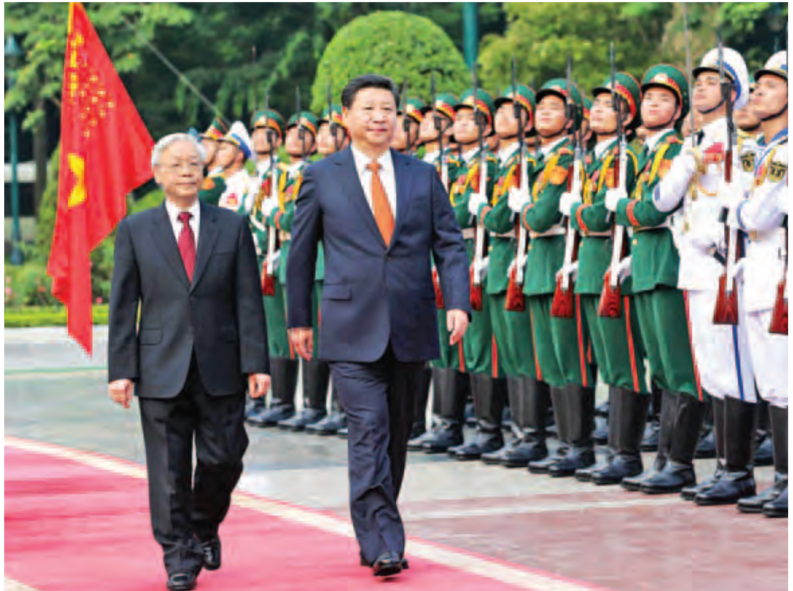
တရုတ်သမ္မတ ရှီကျင့်ဖျင်နှင့် ဗီယက်နမ်ကွန်မြူနစ်ပါတီအထွေထွေအတွင်းရေးမှူး ငွယ်ဟွေတို့ ဂုဏ်ပြုတပ်ဖွဲ့အား စစ်ဆေးစဉ်။

ဆူနာမီရေလှိုင်းများ မြင့်တက်လာမှုဘေး အန္တရာယ်ကိုကြိုတင်ကာကွယ်သည့် နည်းလမ်း ဖြင့် အသေအပျောက်နှင့် အပျက်အစီးများ လျော့နည်းသွားအောင် လျော့ချနိုင်ကြောင်း အမေရိကန်နိုင်ငံဆိုင်ရာ ဂျပန်သံအမတ်ကြီး မိုတိုဟိုက် ယိုရှိကာဝါက ပြောကြားခဲ့သည်။ ဂျပန်နိုင်ငံမှ အဆိုပြုထားသော ကမ္ဘာ့ ဆူနာမီနေ့အဖြစ်သတ်မှတ်ရေးအဆိုပြုချက် ကို နိုင်ငံခြားနိုင်ငံများက သဘောတူလက်မှတ် ရေးထိုးပြီးဖြစ်ကြောင်းနှင့် လက်မှတ်ထိုး သည့်နိုင်ငံများမှာ ဆူနာမီဘေးအန္တရာယ် ထိခိုက်ခံစားခဲ့ရသည့် တောင်အမေရိကနှင့် အရှေ့တောင်အာရှနိုင်ငံများပင်ဖြစ်သည်။ အင်န်အိတ်ချ်ကေ။