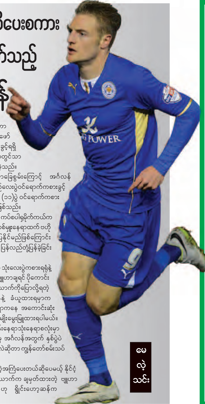
မေလဲ့သင်း

အင်္ဂလန်နည်းပြရှိုင်ဟော့ဆန်က လက်စတာ တိုက်စစ်မျိုး ဟဒီအနေဖြင့် ကလပ်အသင်းဖော် များ၏ အကြံဉာဏ်ပေးသည့်နေရာတွင် ကစားခွင့်ရရှိ မည်မဟုတ်ဘဲ ၎င်းကစားခိုင်းသည့် နေရာတွင်သာ ကစားရမည်ဖြစ်ကြောင်း သတိပေးစကားပါးခဲ့သည်။ ဟဒီ၏ လက်စတာတွင် ပြသနေသောခြေစွမ်းကြောင့် အင်္ဂလန် လက်ရွေးစင်အသင်းတွင် ရွေးချယ်ခံရပြီး ပွဲစဉ်လေးပွဲဝင်ရောက်ကစားခွင့် ရရှိခဲ့သည်။ ဟဒီမှာ လက်စတာအတွက် ပွဲစဉ် (၁၁)ပွဲ ဝင်ရောက်ကစား ခဲ့ရာ သွင်းဂိုး ၁၁ ဂိုးအထိ သွင်းယူထားနိုင်သူဖြစ်သည်။ ဟဒီအား လက်စတာအသင်းကစားဖော် ကပ်စပါရမိုက်ကယ်က အင်္ဂလန်တွင်ကစားနေရသော တောင်ပံတိုက်စစ်မျိုးနေရာထက် ဗဟို တိုက်စစ်မျိုးအဖြစ်ကစားပါက ပိုမိုခြေစွမ်းပြနိုင်မည်ဖြစ်ကြောင်း အကြံပြုခဲ့ရာ ရှိုင်ဟော့ဆန်က ယခုကဲ့သို့ ပြန်လည်တုံ့ပြန်ခဲ့ခြင်း ဖြစ်သည်။ “ခင်ဗျားအနေနဲ့ လက်ရွေးစင်အသင်းမှာ သုံးလေးပွဲကစားရရုံနဲ့ ဟိုနေရာမှာကစားချင်တယ်။ ဟိုအတိုင်းနည်းဗျူဟာချရင် ပိုကောင်း တယ်ဆိုတဲ့ အကြံပြုချက်မျိုး နည်းပြတစ်ယောက်ကိုပြောလိုရတဲ့ အနေအထားမရှိသေးပါဘူး။ ခင်ဗျားအနေနဲ့ ခံယူထားရမှာက နိုင်ငံလက်ရွေးစင်အသင်းအတွက် ကျရာနေရာကနေ အကောင်းဆုံး ပေးဆပ်ကစားချင်တယ်ဆိုတဲ့ စိတ်ဓာတ်မျိုးမွေးမြူထားရပါမယ်။ ကျွန်တော်ကတော့ ဂျေမီ(ဟဒီ)က ရွှေတန်းနေရာသုံးနေရာစလုံးမှာ ကစားနိုင်တယ်လို့ ယူဆပါတယ်။ သူက အခုမှ အင်္ဂလန်အတွက် နှစ်ပွဲပဲ ကစားခွင့်ရသေးတော့ ဘယ်နေရာမှာ အံ့ကျမလဲဆိုတာ ကျွန်တော်စမ်းသပ် ကစားခိုင်းဆဲအဆင့်မှာပဲရှိနေပါသေးတယ်။ ကလပ်အသင်းဖော်တွေက ကောင်းတဲ့အကြံပေးတယ်ဆိုပေမယ့် နိုင်ငံ လက်ရွေးစင်အသင်းမှာတော့ နည်းပြတစ်ယောက်က ချမှတ်ထားတဲ့ ဗျူဟာ အတိုင်း လိုက်ပါကစားဖို့ လိုအပ်ပါတယ်” ဟု ရှိုင်ဟော့ဆန်က ဆိုခဲ့သည်။