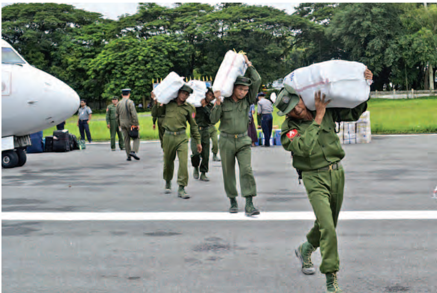
မြန်မာနိုင်ငံတွင် ဇူလိုင်လနှင့် ဩဂုတ်လအတွင်းက ဖြစ်ပွားခဲ့သော ရေကြီးရေလျှံမှုများကြောင့် တပ်မတော်သားများက ကူညီထောက်ပံ့ရေးလုပ်ငန်းများ ဆောင်ရွက်နေစဉ်။

၂၀၁၂ ခုနှစ် စက်တင်ဘာလမှ ၂၀၁၅ ခုနှစ် ဇွန်လအထိ တပ်မတော်အတွင်း အကြောင်းအမျိုးမျိုးကြောင့် မှားယွင်းစုဆောင်းခံခဲ့ရသည့် အရွယ်မရောက်သေးသူ ကလေးသူငယ်များအား မိဘအုပ်ထိန်းသူများထံသို့ ပြန်လည်ပေါင်းစည်းပေးနိုင်ခဲ့မှု ၁၀ ကြိမ်တွင် စုစုပေါင်း ၆၄၅ ဦး ပြန်လည်