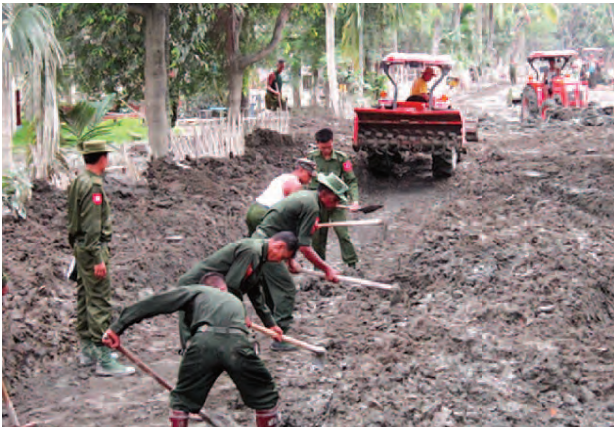
ကလေးမြို့နယ် ရေဘေးသင့်ဒေသများ၌ ရေပြန်ကျချိန်တွင် လမ်းပေါ်တွင်တင်ရှိနေသည့် နန်းများအား တပ်မတော်သားများက ဖယ်ရှားရှင်းလင်းပေးနေသည်ကို တွေ့ရစဉ်။

ဖွဲ့စည်းပုံအခြေခံဥပဒေပုဒ်မ ၃၃၉ ပါ “နိုင်ငံတော်အား ပြည်တွင်း၊ ပြည်ပ အန္တရာယ်များမှ ကာကွယ်ရေးအတွက် တပ်မတော်က ဦးဆောင်ရမည်”၊ ပုဒ်မ ၃၄၁ ပါ “နိုင်ငံတော်တွင် နိုင်ငံတော်နှင့် နိုင်ငံသားများအတွက် ဘေးအန္တရာယ် များ ကျရောက်လာလျှင် တပ်မတော်က ကူညီဆောင်ရွက်ရမည်”ဟူသော အချက်များနှင့်အညီ ဆောင်ရွက်လျက်ရှိသည်။