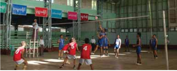
မုံရွာ နိုဝင်ဘာ ၅

မုံရွာခရိုင်စီမံခန့်ခွဲမှုကော်မတီ ဥက္ကဋ္ဌဖလား မြို့နယ်ပေါင်းစုံဘော်လီဘောပြိုင်ပွဲ ဗိုလ်လုပွဲ နှင့်ဆုပေးပွဲကို မုံရွာမြို့ တိုင်းဒေသကြီးအားကစားကွင်း မိုးလုံလေလုံအားကစားရုံ၌ နိုဝင်ဘာ ၃ ရက် ညနေ ၃နာရီတွင် ကျင်းပခဲ့သည်။ အဆိုပါပွဲစဉ်၌ ဗိုလ်လုပွဲအဖြစ် မုံရွာမြို့နယ်အသင်းနှင့် ချောင်းဦးမြို့နယ်အသင်းတို့ ယှဉ်ပြိုင်ကစားရာ ချောင်းဦးမြို့နယ်အသင်းက သုံးပွဲတစ်ပွဲဖြင့် အနိုင်ရ ဗိုလ်စွဲခဲ့သည်။ ဗိုလ်လုပွဲအပြီး ဆုပေးပွဲကျင်းပရာတွင် ဒုတိယဆုရ မုံရွာမြို့နယ်အသင်းအား ဆုငွေကျပ် ၇၀၀၀၀ကို မုံရွာမြို့နယ်စီမံခန့်ခွဲမှုကော်မတီဥက္ကဋ္ဌက လည်းကောင်း၊ ပထမဆုရ ချောင်းဦး မြို့နယ်အသင်းအား ဆုငွေကျပ်တစ်သိန်းနှင့် တံခွန်စိုက်ဆုပေးလေးတို့ကို ခရိုင်စီမံခန့်ခွဲမှု ကော်မတီဥက္ကဋ္ဌက လည်းကောင်း အသီးသီးပေးအပ်ချီးမြှင့်ခဲ့သည်။ အဆိုပါပြိုင်ပွဲကို နိုဝင်ဘာ ၂ ရက်နှင့် ၃ ရက်တို့တွင် ကျင်းပခဲ့ပြီး မုံရွာခရိုင်အတွင်းရှိ ချောင်းဦး၊ မုံရွာ၊ အရာတော်နှင့် ဘုတလင်မြို့နယ်တို့မှ မြို့နယ်ကိုယ်စားပြုဘော်လီဘော အသင်း တစ်သင်းစီဖြင့် စုစုပေါင်း လေးသင်း ဝင်ရောက်ယှဉ်ပြိုင်ခဲ့ကြောင်းသိရသည်။ ဖိုးချမ်း(မုံရွာ)