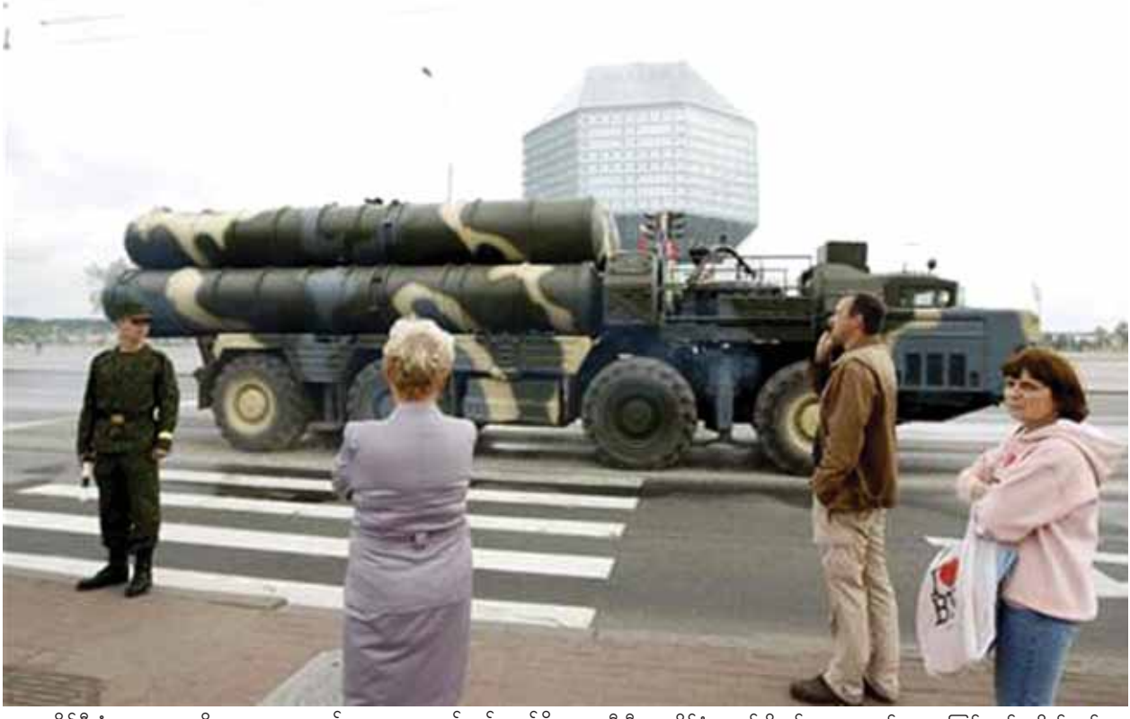
ရုရှားအပိုင်စီးခံရမှုများ မရှိစေရေးအတွက်လည်းကောင်း၊ လုံခြုံရေးအရ ခြိမ်းခြောက်မှုများကို တုံ့ပြန်နိုင်ရေးအတွက်လည်းကောင်း မိမိတို့အလေးအနက်ထားကာဆောင်ရွက်လျက်ရှိကြောင်း ရုရှားလေတပ်ဦးစီးချုပ် ပစ်တာနီကိုလေပစ်ချီဗွန်ဒ်ရော့ဗ်က ပြောကြားသည်။ ဆီးရီးယားနိုင်ငံအတွင်းရှိ စစ်သွေးကြွအုပ်စုများ၏ ပစ်မှတ်များကို ရုရှားလေတပ်က စက်တင်ဘာ ၃၀ ရက်တွင် လေကြောင်းထိုးစစ်များ စတင်ခဲ့သည်။ သင်းမှာ အကြမ်းဖက်မှုတိုက်ဖျက်ရေးစစ်ပွဲ၏ အရေးပါသောခြေလှမ်းအဖြစ် ဆီးရီးယားအစိုးရတာဝန်ရှိသူများက ပြောကြားကြသည်။ ဆင်ဟွာ။

ဒမတ်စကတ် နိုဝင်ဘာ ၅ ဆီးရီးယားနိုင်ငံ၌ ဖြန့်ကြက်ထားသည့် ရုရှားစစ်လေယာဉ်များကို ကာကွယ်ပေးနိုင်စေရန် လေကြောင်းရန်ကာကွယ်ရေးစနစ်များကို ရုရှားနိုင်ငံကပေးပို့ခဲ့ကြောင်း ရုရှားအစိုးရ တာဝန်ရှိသူများ၏ ပြောကြားချက်အား ကိုးကား၍ ဆာနာသတင်းဌာနက နိုဝင်ဘာ ၅ ရက်တွင် သတင်းထုတ်ပြန်သည်။ ဆီးရီးယားနိုင်ငံတွင် စစ်ဆင်ရေးဆောင်ရွက်နေသည့် ရုရှားစစ်လေယာဉ်များအား အကာအကွယ်ပေးရန်နှင့် အခြားအရေးပေါ်အခြေအနေများအား တုံ့ပြန်ရေးအတွက် လေကြောင်းရန်ကာကွယ်ရေးစနစ်များကို ရုရှားကပေးပို့ခဲ့ခြင်းဖြစ်ကြောင်း ဆာနာသတင်းဌာန၏ သတင်းတွင် ဖော်ပြသည်။ ဆီးရီးယားနိုင်ငံတွင် တိုက်ခိုက်ရေး စစ်လေယာဉ်များ၊ ဒုံးပစ်စင်များနှင့် ရဟတ်ယာဉ်များကို စေလွှတ်ပေးခဲ့သည်သာမက လေကြောင်းရန်ကာကွယ်ရေးစနစ်များကို မိမိတို့ ပေးပို့ခဲ့ကြောင်း ဆီးရီးယားအစိုးရက ထိန်းချုပ်ထားသော လေတပ်အခြေစိုက်စခန်းများရှိ ရုရှားလေယာဉ်