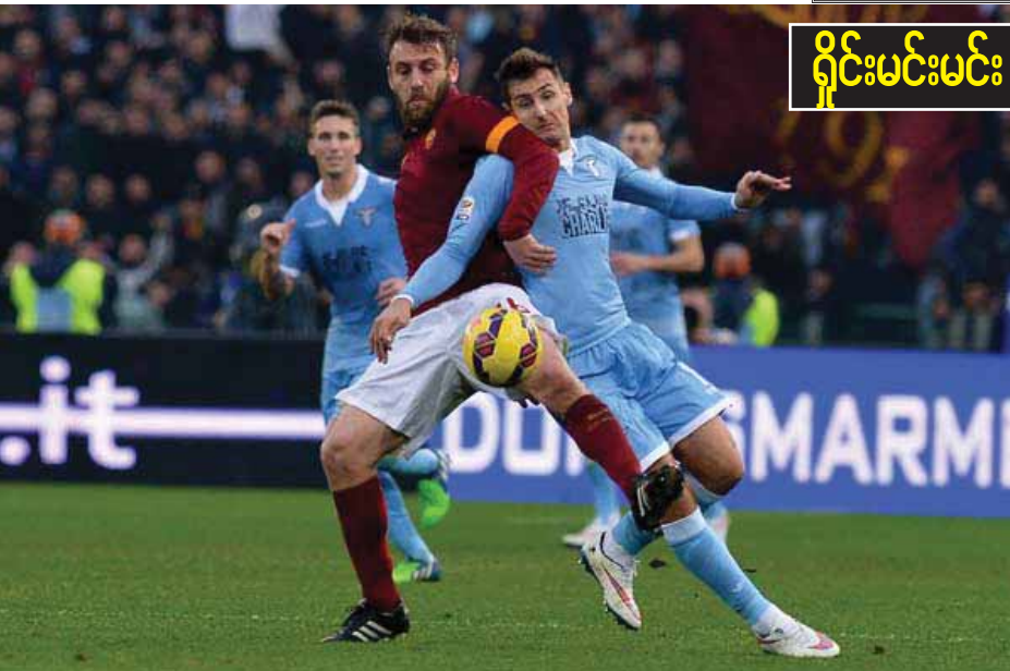
သာမန်သာရှိသလို အဝေးကွင်းနိုင်ပွဲမရှိသေးဘူး။ ခံစစ်ပိုင်းက ဂိုးပေးရမှုတွေ ဆက်တိုက်နီးပါးဖြစ်နေတယ်။ ဒါပေမယ့် ချီယေလိုကလည်း ခြေပျက်ယွင်းနေပြီး အဝေးကွင်းပွဲစဉ်တွေမှာဆိုရင် ခံစစ်ပိုင်းအားပိုနည်းကာ တစ်ပွဲ

သာနိုင်သေးတယ်။ ခြေစွမ်းပိုင်းထင်သလောက်မကွာပေမယ့် အိမ်ရှင်ဖြစ်တဲ့ ပါလာမိုကပ်နိုင်မယ်။ ဂိုးမား - လာဇီယို ည ၈:၃၀(၈-၁၁-၁၅) ဂိုးမားကနိုင်ပွဲပြန်ရဖို့ အားစိုက်လာမှာပါ။ ဂိုးမားအနေနဲ့ နောက်ဆုံးပွဲစဉ်မှာ အင်တာကိုနှိုးနှိမ်ခဲ့ရပေမယ့် အိမ်ကွင်းမှာဆိုရင် ခံစစ်ကစားပုံကျစ်လျစ်ကာနှိုးပွဲလည်း မရှိသေးဘူး။ ဆာစူအိုလို - ကာပီ ည ၈:၃၀(၈-၁၁-၁၅) ဆာစူအိုလိုခြေစွမ်းပိုင်းမဆိုးဘူး။ အထူးသဖြင့် အိမ်ကွင်းပွဲစဉ်တွေမှာ ကစားပုံပိုကောင်းကာ ဂျူပင်တပ်ကိုတောင် အနိုင်ရခဲ့ပြီး နှိုးပွဲလည်းမရှိသေးဘူး။ နာပိုလီ - အူဒီးနီး ည-၁၁:၃၀ (၈-၁၁-၁၅) နာပိုလီဟာ ခုနောက်ပိုင်းမှာ ကစားပုံကောင်းမွန်မှုရှိလာပါတယ်။ ဆမ်ဒီးရီးယား - ဖီအိုရင်တီးနား နံနက် ၂:၁၅(၉-၁၁-၁၅) ဆမ်ဒီးရီးယားက ခြေစွမ်းပိုင်းထင်သလောက် မတည်ငြိမ်ဘူးဆိုပေမယ့် အိမ်ကွင်းကစားပုံကောင်းပါတယ်။