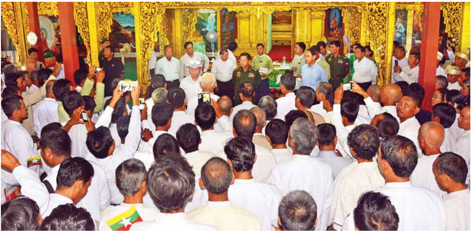
နိုင်ငံတော်သမ္မတ ဦးသိန်းစိန် မင်းတုန်းမြို့ ဘုရားသုံးဆူဓမ္မာရုံ၌ မြို့မိမြို့ဖများ၊ ကော်မတီများမှ ဥက္ကဋ္ဌများနှင့်အဖွဲ့ဝင်များ၊ ဌာနဆိုင်ရာတာဝန်ရှိသူများနှင့် ဒေသခံပြည်သူများအား ရင်းရင်းနှီးနှီးတွေ့ဆုံစဉ်။ (သတင်းစဉ်)

မိမိတို့အစိုးရတာဝန်ယူချိန်တွင် ပြည်သူ့ဆန္ဒနစ်နစ်ဖြစ်သည့် တည်ငြိမ် အေးချမ်းမှုနှင့် ဖွံ့ဖြိုးတိုးတက်မှုကို ဖော်ဆောင်နိုင်ရန်အတွက် နိုင်ငံရေး၊ စီးပွားရေး၊ အုပ်ချုပ်ရေးနှင့် ပုဂ္ဂလိက