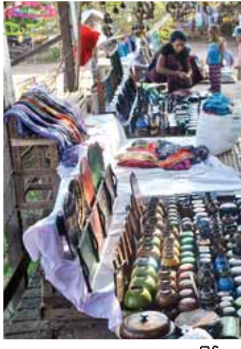
မြန်မာ့လက်မှုပစ္စည်းများ ဝယ်ယူရန် ကြည့်ရှုနေကြသည့် ပြည်ပခရီးသွားဧည့်သည်များ။

ထို့ပြင် မြန်မာနိုင်ငံသို့ လာရောက်လည်ပတ်ကြသော နိုင်ငံတကာခရီးသွားဧည့်သည်များ မြန်မာ့ရိုးရာဓလေ့စရိုက်နှင့် ထုံးတမ်းအစဉ်အလာများကို သိရှိနားလည်၍ လေးစားလိုက်နာနိုင်ရေး (တစ်နည်းအားဖြင့်) တာဝန်သိခရီးသွားလုပ်ငန်းအဖြစ် ရပ်တည်နိုင်ရေးအတွက် မြန်မာလူမျိုးများနှင့် မြန်မာတို့ ထူးခြားသော ရိုးရာဓလေ့ထုံးစံများကို လေးစားပါ။ စိတ်အနှောင့်အယှက်ဖြစ်စေသော ဓာတ်ပုံရိုက်မှတ်တမ်းရယူခြင်းမျိုးမပြုလုပ်ပါနှင့်။ ဘာသာရေးနှင့် သက်ဆိုင်သော နေရာများသို့ သွားမည်ဆိုလျှင် သင့်တင့်လျောက်ပတ်သော အဝတ်အစားများကို ဝတ်ဆင်ပါစသည်ဖြင့် ဆောင်ရန်၊ ရှောင်ရန်များ အချက်အလက်ပေါင်း ၃၀ တို့ကို စိတ်ဝင်စားဖွယ်သရုပ်ဖော်ပုံများဖြင့် ပြုစုထားသော Dos and Don'ts for Tourists စာအုပ်