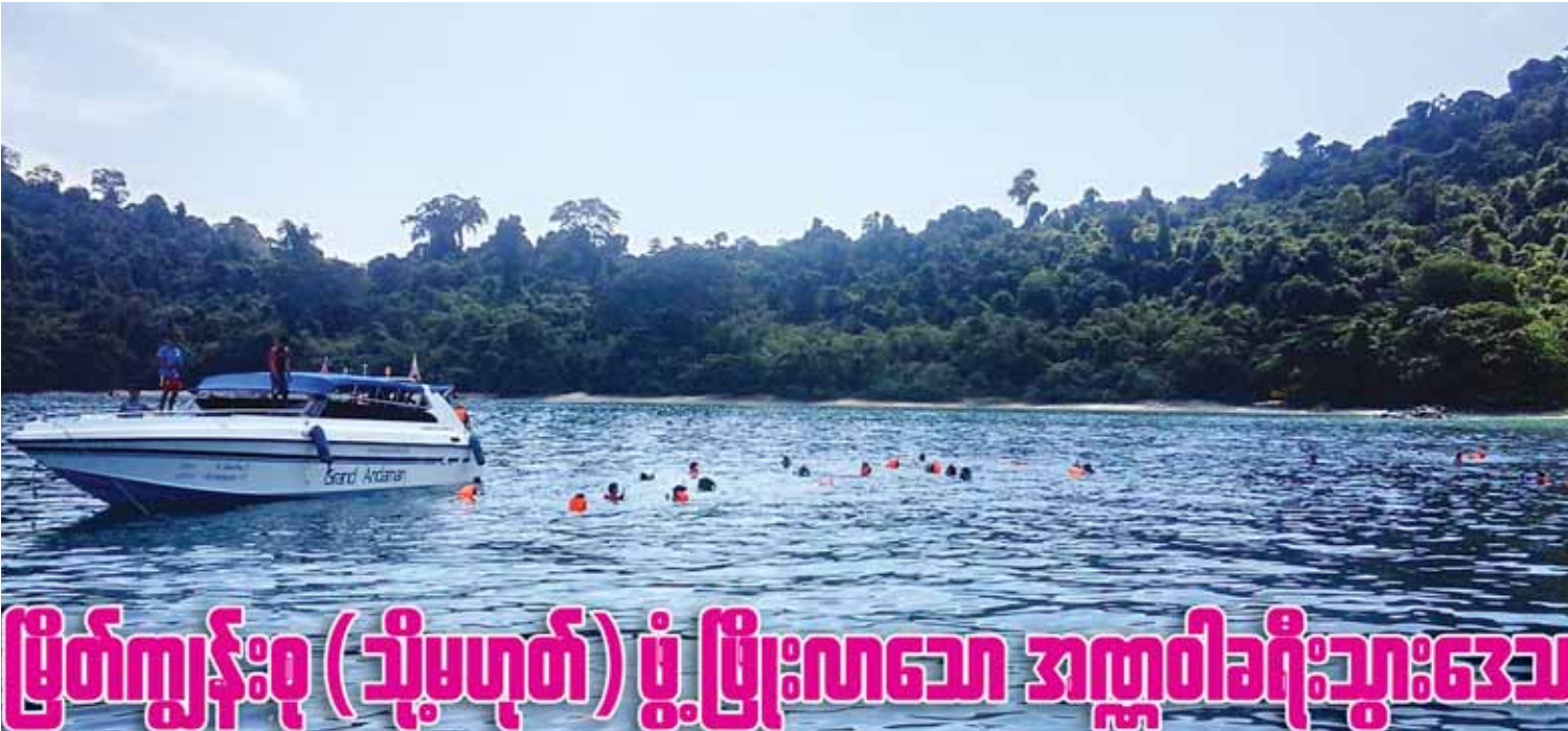
မြိတ်ကျွန်းစု (သို့မဟုတ်) ဖွံ့ဖြိုးလာသော အဏ္ဏဝါခရီးသွားဒေသ

(နိုင်ငံတော်သမ္မတ၏ ၂၀၁၅ ခုနှစ် စက်တင်ဘာလ ၁ ရက်နေ့တွင် ပြောကြားသည့် ရေဒီယိုမိန့်ခွန်းမှ ကောက်နုတ်ချက်)