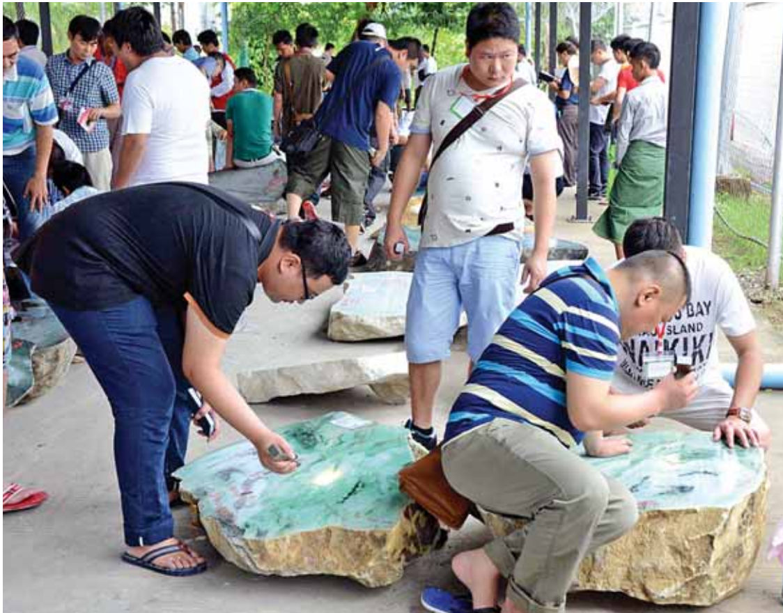
မြန်မာ့ကျောက်စိမ်းကို စိတ်ဝင်တစား လေ့လာနေကြသော ကျောက်မျက်ကုန်သည်များ။

“ကျောက်မျက်ရတနာဈေးကွက် ဖွံ့ဖြိုးတိုးတက်လာဖို့ လက်ရှိအစိုးရလက်ထက်မှာ ကျောက်မျက်ရတနာတွေနဲ့ အသက်မွေးနေတဲ့ မန္တလေး၊ စစ်ကိုင်းက လူတွေအတွက် ပြည်သူ့ဝန်ဆောင်မှုလုပ်ငန်း(OSS)ရုံးကို မန္တလေးမြို့မှာ ဖွင့်လှစ်ပေးထားပါတယ်။ တစ်ပိုင်းတစ်နိုင် ကျောက်စိမ်းပုလင်းတို့၊ လက်ကောက်တို့ လုပ်ရောင်းတဲ့ လုပ်ငန်းရှင်တွေက သက်မှတ်တဲ့ အခွန်ဆောင်ပြီး တစ်ဖက်နိုင်ငံကို တင်ပို့ရောင်းချနိုင်ပါတယ်။ ထိုအတူ နေပြည်တော်မှာဆိုရင် ရွှေကြာပင်မှာ အချောထည်ဈေးတည်ဆောက်လို့ ပြီးသွားပြီ။ ဖွင့်လှစ်ဖွင့်ထားပါပြီ။ လုပ်ငန်းရှင်တွေလုပ်နိုင်အောင်နဲ့ ရေရှည်ဖွံ့ဖြိုးတိုးတက်ဖို့ သင်တန်းကျောင်းတွေလည်း ဆောက်နေပါတယ်။ ပြီးခါနီးနေပါပြီ။ ဒီထက်ဖွံ့ဖြိုးတိုးတက်အောင်လို့ နောင်ကျရင် အချောထည်ထုတ်လုပ်နည်း သင်တန်းတွေလည်း ဖွင့်လှစ်ပြီးတော့ ဆောင်ရွက်သွားမှာပါ” ဟု ဦးသန်းဇော်ဦးက ကျောက်အချောထည် ဖွံ့ဖြိုးရေးအတွက် အနာဂတ်