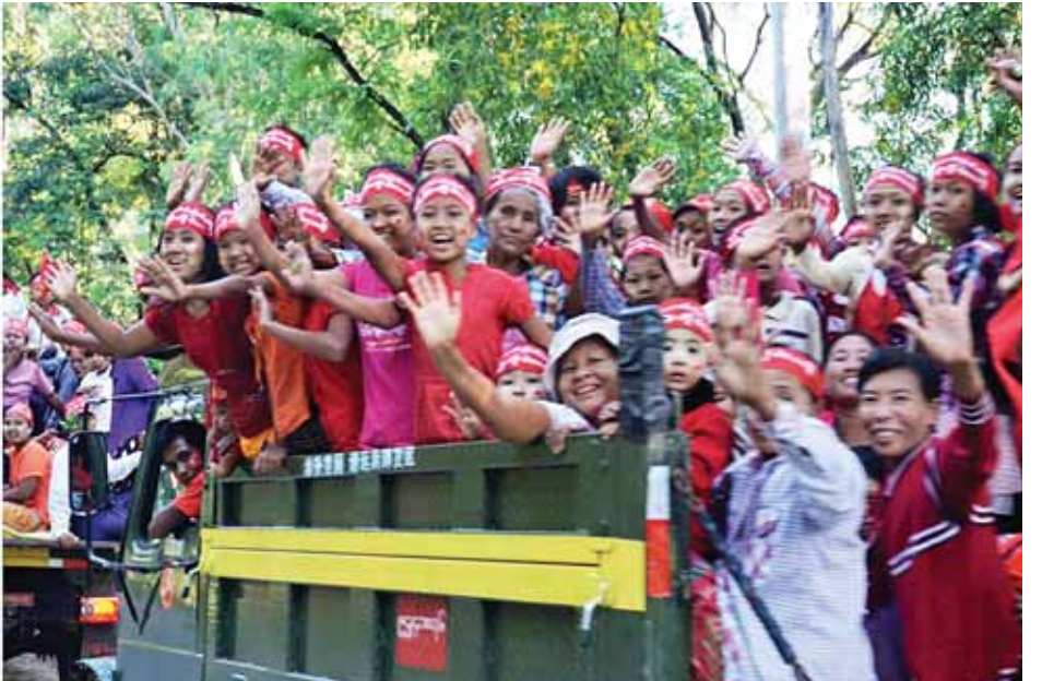
နိုင်ငံတော်သမ္မတ ဦးသိန်းစိန် စလင်းမြို့သို့ ရောက်ရှိရာ နိုင်ငံရေးပါတီထောက်ခံသူများက နှုတ်ဆက်ကြစဉ်။