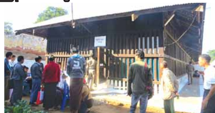
အနယ်နယ်အရပ်ရပ်မှ အမှုရင်ဆိုင်နေရသည့် အချုပ်သားများအား ကြိုတင်မဲများ ပေးနိုင်အောင် ဆောင်ရွက်ပေးလျက်ရှိရာ ယခု အချုပ်အထိ အနယ်နယ်အရပ်ရပ် ကြိုတင်

ထို့ပြင် မြို့ပေါ်ရပ်ကွက်များ၊ ကျေးရွာများမှ အမှုရင်ဆိုင်နေရသည့် အချုပ်သား များမှာ အမှတ် (၁) ရဲစခန်းတွင် ကိုးဦးနှင့် အကျဉ်းထောင်တွင် အမျိုးသား ၅၇ ဦးနှင့် အမျိုးသမီးခြောက်ဦးတို့က မိမိတို့နှစ်သက် ရာကို ဆန္ဒပြုခန်း၌ လွတ်လပ်စွာ ဆန္ဒပြု ခဲ့ကြောင်း သိရသည်။ ၎င်းအပြင် မိတ္ထီလာအကျဉ်းထောင်၌