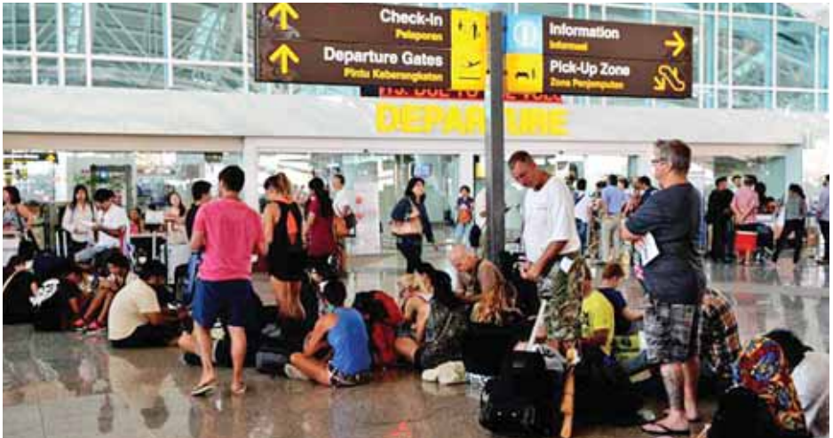
အင်န်အိတ်ချ်ကေ။

မှစပြီး ယာယီပိတ်သိမ်းထားကြောင်း နှင့် လေဆိပ်တွင် ကမ္ဘာလှည့်ခရီးသည်အများအပြား သောင်တင်လျက်ရှိကြောင်း သတင်းများအရ သိရသည်။ လွန်ဘွက်ခံကျွန်းပေါ်ရှိ ရင်ဂျာနီ မီးတောင်သည် အောက်တိုဘာ ၂၅ ရက်က စတင်ပေါက်ကွဲခဲ့ပြီး မီးပြာမှုန်များ မကြာခဏမှတ်ထုတ်လေ့ရှိကြောင်း အင်ဒိုနီးရှားပို့ဆောင်ရေး