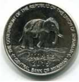
ငွေဒင်္ဂါးပြား၏ ကျောဘက်။

ပြည်ထောင်စုသမ္မတမြန်မာနိုင်ငံတော် ဖွဲ့စည်းပုံအခြေခံဥပဒေအရ စစ်မှန်၍ စည်းကမ်းပြည့်ဝသော ပါတီစုံဒီမိုကရေစီစနစ်ကိုကျင့်သုံးပြီး ဖွဲ့စည်းခဲ့သော ပြည်ထောင်စုသမ္မတမြန်မာနိုင်ငံတော် ပြည်ထောင်စုအစိုးရအဖွဲ့ပထမ သက်တမ်း အထိမ်းအမှတ်အဖြစ် စာမျက်နှာ ၁၀ ကော်လံ ၁ သို့