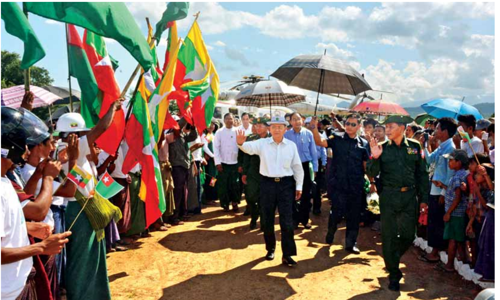
နိုင်ငံတော်သမ္မတ ဦးသိန်းစိန်အား ငမဲမြို့နယ် ဒေသခံပြည်သူများက သောင်းသောင်းဖြဖြကြိုဆိုကြစဉ်။