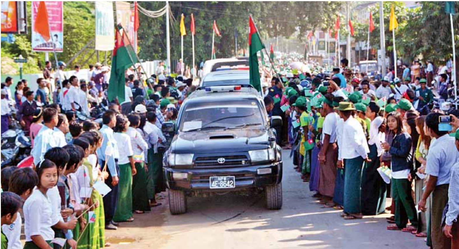
နိုင်ငံတော်သမ္မတ ဦးသိန်းစိန်၏ ယာဉ်တန်း စလင်းမြို့သို့ရောက်ရှိလာရာ ဒေသခံပြည်သူများက သောင်းသောင်းဖြဖြကြိုဆိုကြစဉ်။