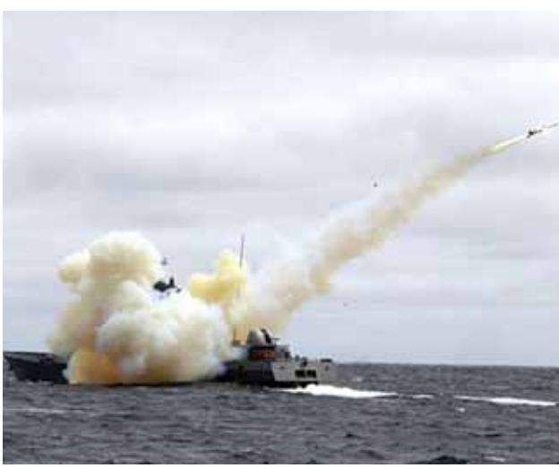
ကျွန်းစုများ

ကြောင်း၊ စစ်ရေးလေ့ကျင့်မှုများအတွက်သာ ရည်ရွယ်လေ့ကျင့်ခြင်းဖြစ်ကြောင်း ရေတပ်တာဝန်ရှိသူက ဆက်လက်ပြောကြားသည်။ ယခုပြုလုပ်မည့် စစ်ရေးလေ့ကျင့်မှုမှာ နိုဝင်ဘာ ၂ ရက်က တောင်ကိုရီးယားသမ္မတ ပတ်ဝွမ်ဟေးနှင့် ဂျပန်ဝန်ကြီးချုပ် ရှင်ဒိုအာဘေးတို့အကြား ထိပ်သီးဆွေးနွေးမှုများ ကျင်းပပြီးနောက် ဖြစ်ပေါ်လာခြင်းဖြစ်သည်။ အဆိုပါ စစ်ရေးလေ့ကျင့်မှုတွင် စစ်သင်္ဘော ၁၀ စင်းနှင့် လေယာဉ်အမြောက်အမြား ပါဝင်လေ့ကျင့်မည်ဟု ၎င်းက ဖြည့်စွက်ပြောကြားသည်။