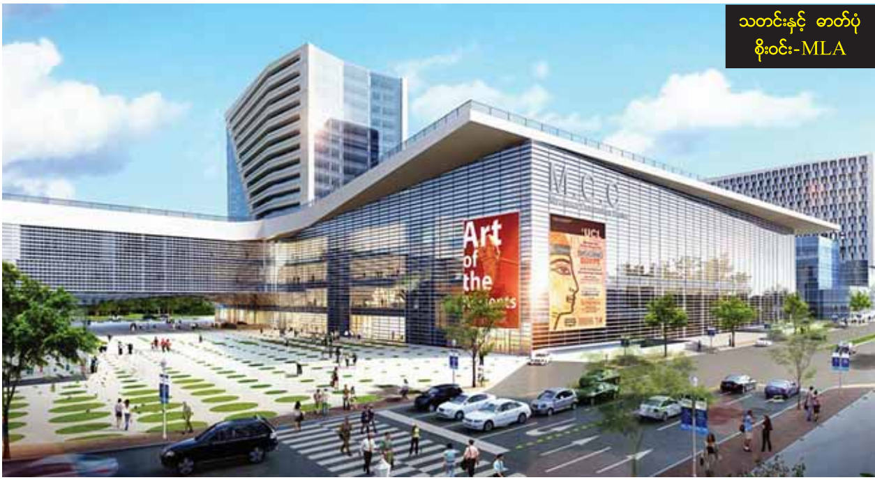
သတင်းနှင့် တတ်ပုံ ဝိုင်း-MLA