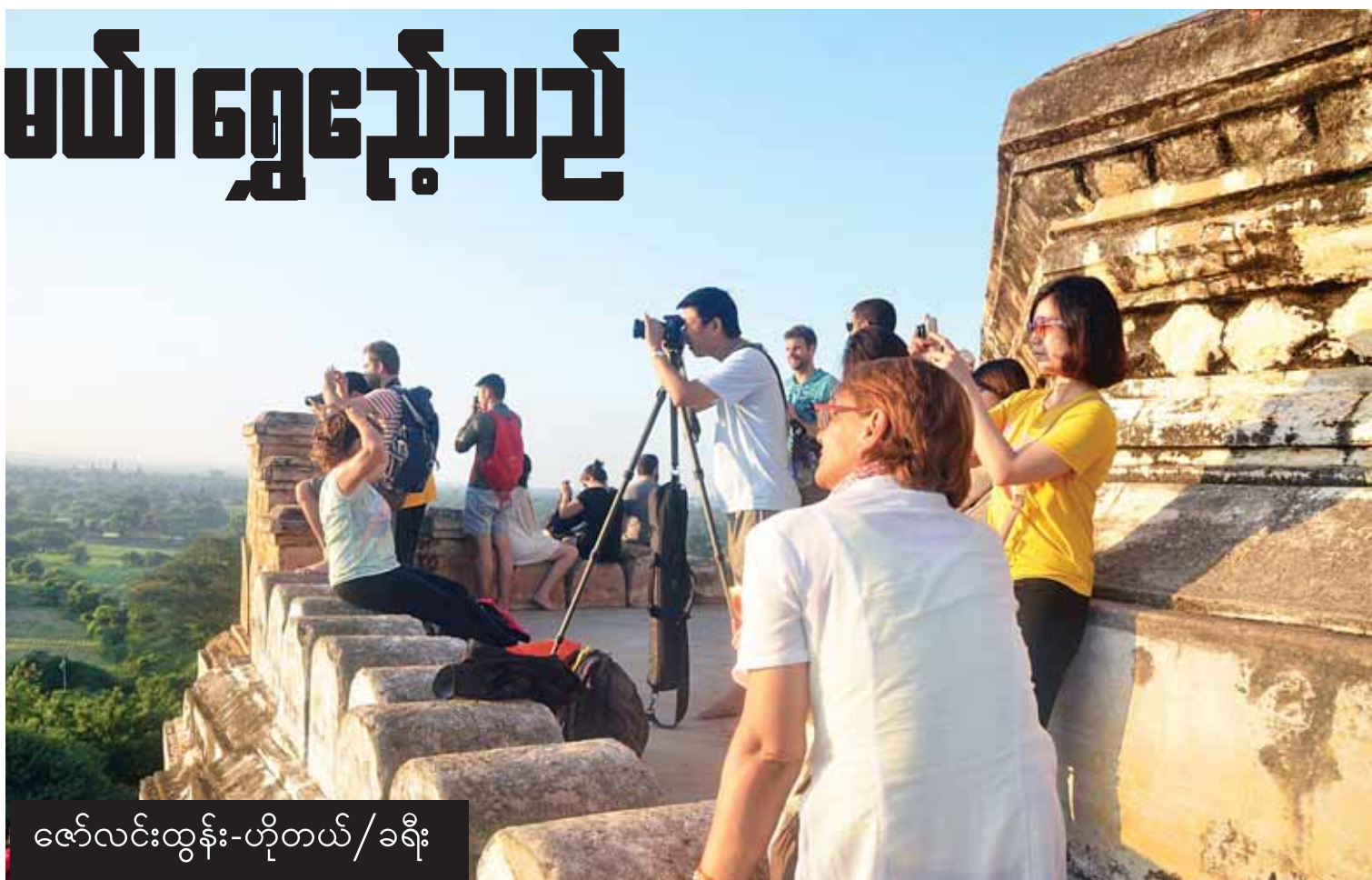
ဇော်လင်းတွန်း-ဟိုတယ်/ခရီး

အပြီးသတ်အလုပ်ရုံဆွေးနွေးပွဲများကို ပုဂ္ဂလိကကဏ္ဍနှင့် ရန်ကုန်မြို့တွင်လည်း ကောင်း၊ အစိုးရကဏ္ဍနှင့် နေပြည်တော်တွင်လည်းကောင်း ကျင်းပပြုလုပ်ခဲ့ပြီး မူဝါဒ