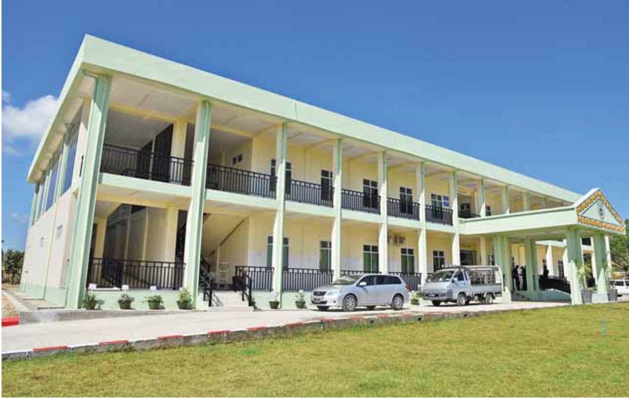
ခုတင် (၁၀၀)ဆုံ တိုင်းရင်းဆေးရုံကြီး(နေပြည်တော်)။

“ဒီနား ဝန်းကျင်မှာရှိတဲ့ လူဦးရေဆိုတာထက် တစ်နိုင်လုံး လွှမ်းမိုးနေသလို နေပြည်တော်မှာ ဖွင့်လှစ်ခဲ့တာပါ။ လူနာတက်ရောက် တဲ့အပေါ် မူတည်ပြီး ဆေးရုံကို အဆင့် မြှင့်တင်သွားမှာပါ။ ဒီနေ့စဖွင့်တဲ့နေ့ မှာပဲ လူနာ ၁၀ ဦး တက်ရောက်ကုသ နေပါတယ်။ နေပြည်တော်ကောင်စီ နယ်မြေတွင်မဟုတ်ဘဲ တခြားမြို့တွေ က လာတက်တာလည်းရှိတယ်။ ကုထုံး တွေအနေနဲ့ ရှိပြီးကုထုံးတွေအပြင် တိုင်းရင်းဆေးရုံအချင်းချင်း ပိတ်ခေါ် ပြီး ဆေးပညာရပ်တွေလည်းလည်းကူး ပို့ အစီအစဉ်တွေ အပြင်မှာကုသနေကြ တဲ့ သမားတော်ကြီးတွေကို ပင့်ဖိတ်ပြီး