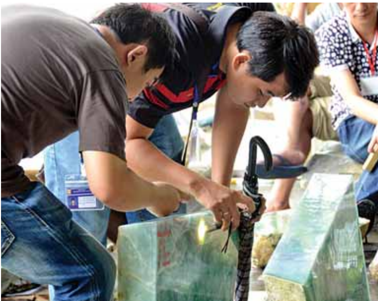
မြန်မာ့ကျောက်စိမ်းကို စိတ်ဝင်တစား လေ့လာနေကြသော ကျောက်မျက်ကုန်သည်များ။

မြန်မာ့ကျောက်မျက်ရတနာရောင်းဝယ် ရေးလုပ်ငန်းအနေဖြင့် လက်ရှိတွင် ကျောက်မျက်၊ ကျောက်စိမ်းတူးဖော်သည့် ကုမ္ပဏီ ၁၂၄ ခုကို မန္တလေးတိုင်းဒေသကြီး မိုးကုတ်ရတနာနယ်မြေ၊ ရှမ်းပြည်နယ် မိုင်းရှူးရတနာနယ်မြေ၊ ကချင်ပြည်နယ် နန်းယားဆိပ် ရတနာနယ်မြေ၊ ကချင်ပြည်နယ် လုံးခင်း၊ ဖားကန့် ရတနာနယ်မြေ၊ စစ်ကိုင်းတိုင်းဒေသကြီး ခန္တီးရတနာနယ်မြေ၊ ကချင်ပြည်နယ် မိုးညှင်း