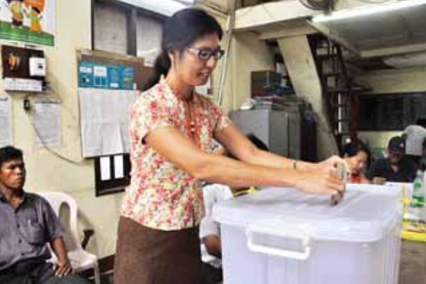
မရမ်းကုန်းမြို့နယ်တွင် ကြိုတင်ဆန္ဒမဲပေးနေသူတစ်ဦးကိုတွေ့ရစဉ်။

သုံးထောင်ကျော်နှင့် အထူးရဲ ၅၅၀၀ ခန့်တို့ဖြင့် လုံခြုံရေးဆောင်ရွက်သွားမည်ဖြစ်ကြောင်း ရန်ကုန်တိုင်းဒေသကြီး ရဲတပ်ဖွဲ့မှူးရုံးထံမှ သတင်းရရှိသည်။ “ရွေးကောက်ပွဲကျင်းပမယ့်နေ့မှာ