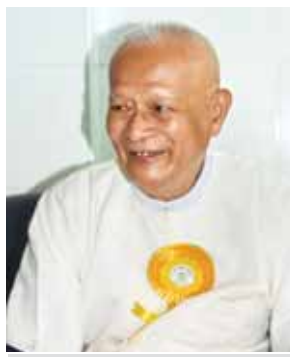
တိုင်းရင်းဆေးသမားတော်ကြီး ဦးသန်းညွန့်။