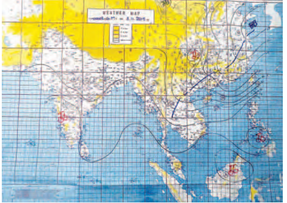
ရေးသားပြောဆိုမှုတွေနဲ့ ပတ်သက်လို့ ရာသီဥတုပြောင်းလဲမှု ဖြစ်စဉ်တွေဆိုတာ ရှိနေမှာပဲဖြစ်တယ်။ ဒါဟာ ဘယ်လိုမှ မဆက်စပ်ဘူးလို့ မြင်တယ်။ လိုရာဆွဲဆွဲရေးရင်၊ လိုရာ ဆွဲရေးရင် ကိုယ်လိုချင်တဲ့ဘက်ကို လူတိုင်းတွေးလို့ ရေးလို့ ရတာပဲလေ” ဟု ဆက်လက်ပြောကြားခဲ့သည်။