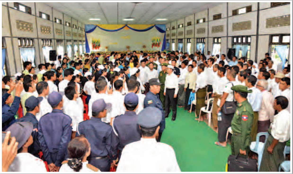
နိုင်ငံတော်သမ္မတ ဦးသိန်းစိန် မာန်အောင်မြို့ အောင်ဇေယျခန်းမ၌ မြို့မိ မြို့ဖများ၊ ကော်မတီများ၊ ဌာနဆိုင်ရာများနှင့် ပြည်သူများအား တွေ့ဆုံနှုတ်ဆက်စဉ်။ (သတင်းစဉ်)