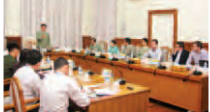
သတင်း စာမျက်နှာ-၃