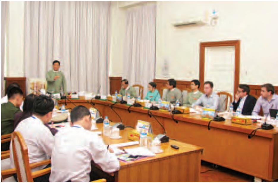
ပြည်နယ်မှာသာ ရမည်ဖြစ်ကြောင်း။

ရွေးကောက်ပွဲရလဒ်များ ထုတ်ပြန်ကြေညာခြင်းနှင့် ပတ်သက်၍ ညှိနှိုင်းအစည်းအဝေးကို ယနေ့မွန်းလွဲ ၁ နာရီခွဲတွင် နေပြည်တော်ရှိ ပြည်ထောင်စုရွေးကောက်ပွဲ ကော်မရှင်ရုံး အစည်းအဝေးခန်း၌ကျင်းပရာ ပြည်ထောင်စု ရွေးကောက်ပွဲကော်မရှင်ဥက္ကဋ္ဌနှင့် ကော်မရှင်အဖွဲ့ဝင်များ၊ အတွင်းရေးမှူး၊ ကော်မရှင်ရုံးမှ တာဝန်ရှိသူများ၊ မြန်မာ့ ရုပ်မြင်သံကြား၊ မြဝတီရုပ်မြင်သံကြား၊ သတင်းနှင့် စာနယ်ဇင်းလုပ်ငန်း၊ Forever Group၊ MITV နှင့် Skynet တို့မှ တာဝန်ရှိသူများ တက်ရောက်ခဲ့ကြ သည်။(ယာဝု)