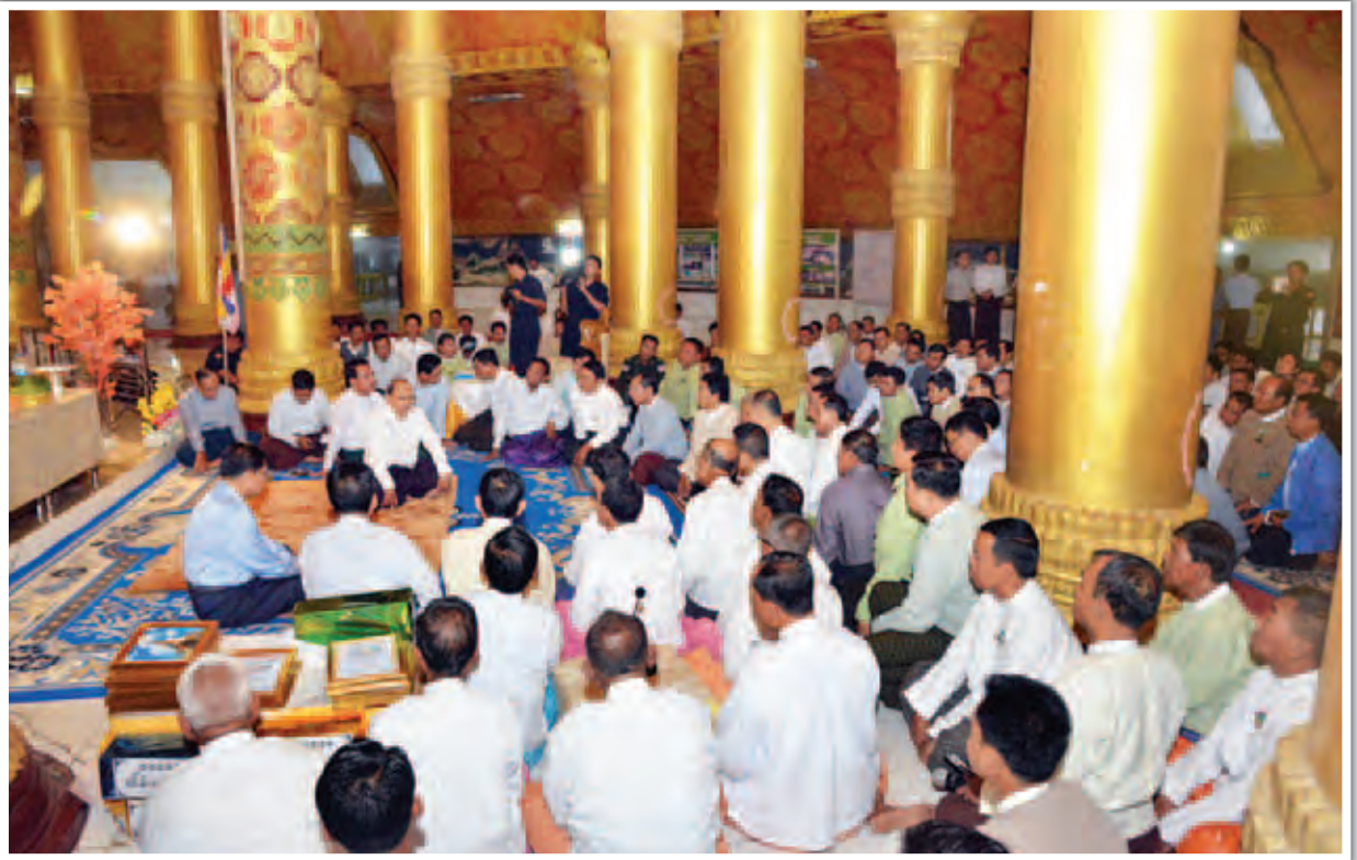
နိုင်ငံတော်သမ္မတ ဦးသိန်းစိန် လောကနန္ဒာ စေတီတော်လိုဏ်တော်အတွင်း၌ စစ်တွေမြို့မှ မြို့မိမြို့ဖများ၊ ကော်မတီများမှ ဥက္ကဋ္ဌများနှင့် အဖွဲ့ဝင်များအား တွေ့ဆုံအမှာစကားပြောကြားစဉ်။ (သတင်းစဉ်)