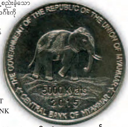
ငွေဒင်္ဂါးပြား၏ ကျောဘက်