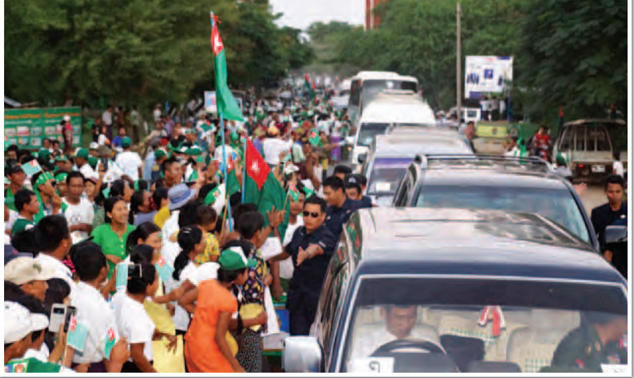
နိုင်ငံတော်သမ္မတ ဦးသိန်းစိန် မကွေးမြို့သို့ ရောက်ရှိလာရာ ဒေသခံပြည်သူများက သောင်းသောင်းဖြဖြကြိုဆိုနှုတ်ဆက်ကြစဉ်။ (သတင်းစဉ်)