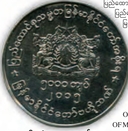
ငွေဒင်္ဂါးပြား၏ ရှေ့ဘက်

ပြည်ထောင်စုသမ္မတ မြန်မာနိုင်ငံတော်အစိုးရ ပထမသက်တမ်းအထိမ်းအမှတ် ငွေဒင်္ဂါးကို အကန့်အသတ်ဖြင့် သွန်းလုပ်ခြင်းဖြစ်ပြီး ဝယ်ယူလိုပါက မြန်မာ့ကျောက်မျက်ရတနာလုပ်ငန်းအရောင်းဆိုင်များတွင် ငွေကျပ် ၃၀၀၀၀ နှုန်းဖြင့် ရောင်းချမည်ဖြစ်ကြောင်း မြန်မာနိုင်ငံတော်ဗဟိုဘဏ်၏ ထုတ်ပြန်ချက်အရ သိရသည်။