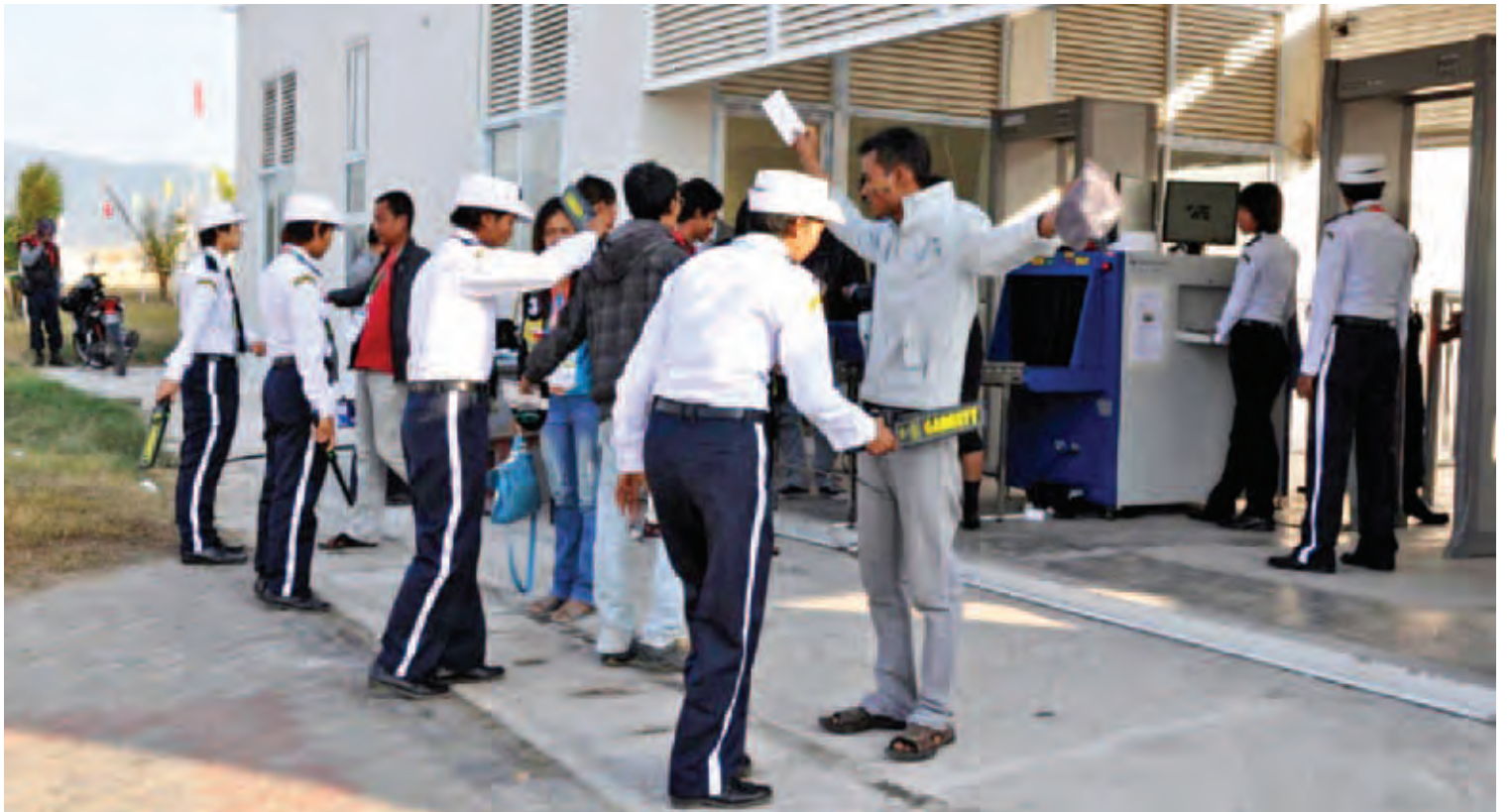
(၂၇)ကြိမ်မြောက် အရှေ့တောင်အာရှအားကစားပြိုင်ပွဲတွင် မြန်မာနိုင်ငံ ရဲတပ်ဖွဲ့ဝင်များ လုံခြုံရေးဆောင်ရွက်နေစဉ်။

အရေးကြီးအခမ်းအနားများတွင် အပြည် ပြည်ဆိုင်ရာ လေဆိပ်များအား အပြည်ပြည် ဆိုင်ရာ ရဲတပ်ဖွဲ့(အင်တာပိုလ်)နှင့်ပူးပေါင်း၍ လုံခြုံရေးဆိုင်ရာ ပူးပေါင်းဆောင်ရွက်မှုများ၊ အင်တာပိုလ် I-24/7 ဆက်သွယ်ရေးစနစ်မှ တစ်ဆင့် နိုင်ငံပြတ်ကျော်မှုခင်းများ တားဆီး