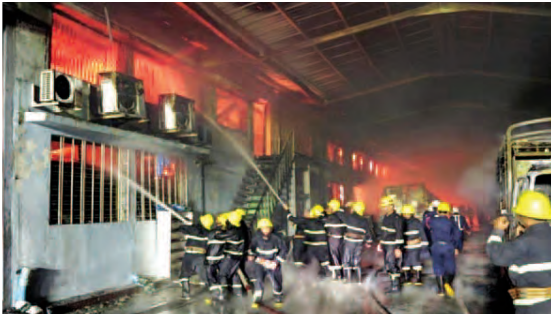
၃၁-၇-၂၀၁၅ ရက်နေ့တွင် ရန်ကုန်တိုင်းဒေသကြီး လှိုင်သာယာမြို့နယ် စက်မှုဇုန်(၃)၌ YES အထည်ချုပ်စက်ရုံ မီးလောင်မှုအား ငြိမ်းသတ်နေစဉ်။

ပြည်ထဲရေးဝန်ကြီးဌာနသည် အုပ်ချုပ်ရေးအာဏာ သက်ရောက်ခြင်းဖြင့် တရားဥပဒေစိုးမိုးမှုကိုရရှိစေပြီး နိုင်ငံတော်တည်ငြိမ်မှုနှင့် ဖွံ့ဖြိုးမှုတို့ကို ဖြစ်ထွန်းစေရေးဆိုသည့် အမျိုးသားလုံခြုံရေးမူဝါဒတစ်ရပ်ကို ချမှတ်အကောင်အထည်ဖော် ဆောင်ရွက်လျက်ရှိပါကြောင်း ရေးသားတင်ပြလိုက်ရပါသည်။