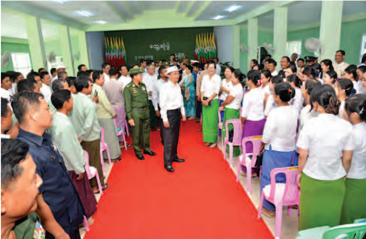
နိုင်ငံတော်သမ္မတ ဦးသိန်းစိန် ရမ်းဗြဲမြို့နယ် အထွေထွေအုပ်ချုပ်ရေးဦးစီးဌာနခန်းမ၌ မြို့မိမြို့ဖများ၊ ကော်မတီများ၊ ဌာနဆိုင်ရာများ၊ ပြည်သူများအား တွေ့ဆုံနှုတ်ဆက်စဉ်။ (သတင်းစဉ်)

စစ်တွေမြို့ရှိ ကန်တော်ကြီးမှ မြို့အတွက် လက်ရှိ ရေပေးဝေနိုင်မှုမှာ တစ်နေ့ ဂါလန် ၁ ဒသမ ၂ သန်းဖြစ်ပြီး မြို့၏ တစ်နေ့ရေလိုအပ်ချက်မှာ ဂါလန် ၂ ဒသမ ၆ သန်းဖြစ်၍ ပိုမိုရေသိုလှောင်နိုင်ပြီး လုံလောက်စွာ ရေပေးဝေနိုင်ရန်အတွက် အဆိုပါ ကန်တော်ကြီးအား ခန့်မှန်းငွေကျပ် ၂ ဒသမ ၄၁ ဘီလီယံ အကုန်အကျခံပြုပြင်မည်။ တောင်ကုတ်မြို့၌ တောင်ကုတ်ကောလိပ်ကို ဖွင့်လှစ်ပေးခဲ့သည့်အတွက် ရခိုင်ပြည်နယ်တောင်ပိုင်း မှ ကျောင်းသား ကျောင်းသူများ လွယ်ကူစွာ ပညာသင်ကြားနိုင်ပြီ။