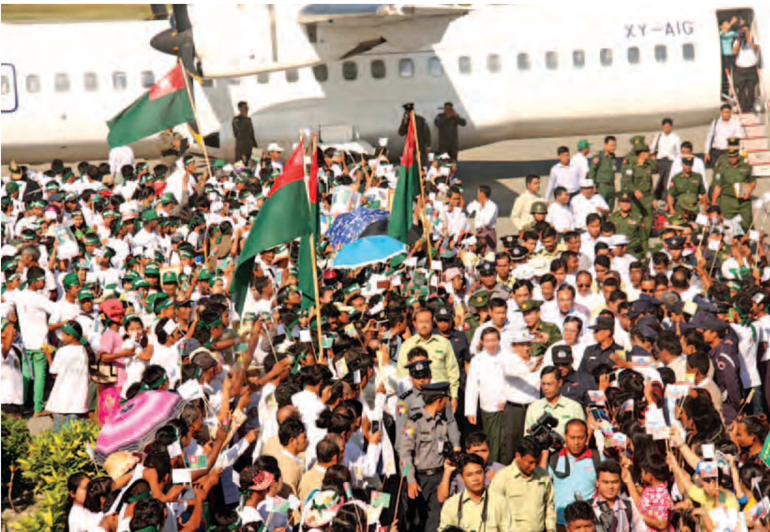
နိုင်ငံတော်သမ္မတ ဦးသိန်းစိန်အား သံတွဲလေဆိပ်တွင် ဒေသခံပြည်သူများက ကြိုဆိုနှုတ်ဆက်ကြစဉ်။ (သတင်းစဉ်)

နေပြည်တော် နိုဝင်ဘာ ၄ ရခိုင်ပြည်နယ် စစ်တွေမြို့၌ ရောက်ရှိနေသော ပြည်ထောင်စု သမ္မတ မြန်မာနိုင်ငံတော် နိုင်ငံတော်သမ္မတ ဦးသိန်းစိန်သည် တပ်မတော်ကာကွယ်ရေးဦးစီးချုပ် ဗိုလ်ချုပ်မှူးကြီး မင်းအောင်လှိုင်၊ ပြည်ထောင်စုဝန်ကြီးများ၊ ပြည်နယ် ခေတ္တဝန်ကြီးချုပ်၊ အနောက်ပိုင်း တိုင်းစစ်ဌာနချုပ်တိုင်းမှူး၊ ဒုတိယ ဝန်ကြီးများနှင့်အတူ ယနေ့နံနက် ၆ နာရီတွင် စစ်တွေမြို့ လောကနန္ဒာ စေတီတော်သို့ သွားရောက်ဖူးမြော် ကြည့်ညှိပြီး ဆွမ်း၊ ပန်း၊ ရေချမ်းများ ဆက်ကပ်လှူဒါန်းကြသည်။ ထို့နောက် နိုင်ငံတော်သမ္မတသည် စေတီတော် လိုဏ်တော်အတွင်း၌ စစ်တွေမြို့မှ မြို့မိမြို့ဖများ၊ မြို့နယ်စီမံခန့်ခွဲမှုကော်မတီ၊ မြို့နယ် ဖွံ့ဖြိုးတိုးတက်ရေးအထောက်အကူပြု ကော်မတီနှင့် မြို့နယ်စည်ပင် သာယာရေးကော်မတီတို့မှ ဥက္ကဋ္ဌ များနှင့် အဖွဲ့ဝင်များအား တွေ့ဆုံပြီး အမှာစကား ပြောကြားရာတွင် ဒေသတစ်ခု ဖွံ့ဖြိုးတိုးတက်စေရန် အတွက် လမ်းပန်းဆက်သွယ်မှု ကောင်းမွန်ရန်နှင့် လျှပ်စစ် ဓာတ်အားရရှိရေးသည် အရေးကြီး ကြောင်း၊ မိမိတို့အစိုးရ တာဝန် ယူချိန်တွင် လွတ်လပ်ရေးရရှိသည့် ၁၉၄၈ ခုနှစ်မှစပြီး ပထမဆုံးအကြိမ် အဖြစ် ရခိုင်ပြည်နယ်တစ်ခုလုံးတွင် စာမျက်နှာ ၈ ကော်လံ ၁ သို့