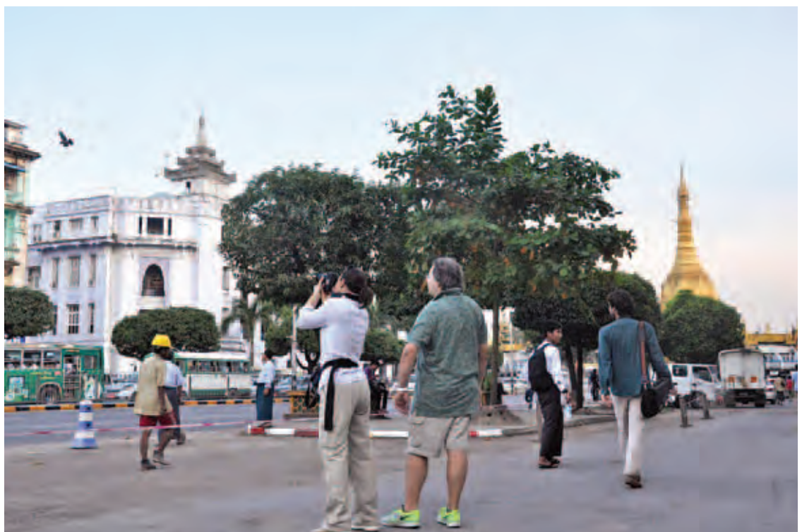
ရန်ကုန်မြို့အတွင်းရှိ ရှေးဟောင်းအဆောက်အအုံများကို လေ့လာနေသော ကမ္ဘာလှည့်ခရီးသွားတချို့ကို တွေ့ရစဉ်။

ရှုခင်းများနှင့် လက်မှုပညာရပ်များကို လေ့လာသိရှိလိုကြ၍ ကမ္ဘာလှည့်ခရီးသွားများအနေဖြင့် တစ်ဦးချင်းသော်လည်းကောင်း၊ အစုအဖွဲ့ဖြင့်သော်လည်းကောင်း လေကြောင်းခရီးစဉ်ဖြင့် လာရောက်ကြသကဲ့သို့ မော်တော်ယာဉ်တန်း၊ ဆိုင်ကယ်ယာဉ်တန်း၊ စက်ဘီးယာဉ်တန်း ခရီးစဉ်တို့ဖြင့် နယ်စပ်ဝင်ပေါက်များမှလည်း စဉ်ဆက်မပြတ် ပိုမိုလာရောက်လည်ပတ်လျက် ရှိသည်။ ထိုသို့ လာရောက်လည်ပတ်သူများကို လုံခြုံမှုပေးနိုင်ရန်အတွက် ကမ္ဘာလှည့်ခရီးသွားလုပ်ငန်း လုံခြုံရေးရတပ်ဖွဲ့ကို ၂၀၁၃ ခုနှစ် ဖေဖော်ဝါရီ ၁၄ ရက်တွင် မြို့နယ် ငါးမြို့နယ်၌ အခြေပြု၍ အဖွဲ့ငါးဖွဲ့ကို စတင်ဖွဲ့စည်းခဲ့သည်။ ယခုအခါ ကမ္ဘာလှည့်ခရီးသွားဧည့်သည်များ အများဆုံးသွားရောက်လည်ပတ်လေ့ရှိသည့် နေပြည်တော်၊ ရန်ကုန်၊ မန္တလေး၊ ကျိုက်ထီးရိုး၊ ငပလီ၊ ပုဂံအပါအဝင် နယ်မြေဒေသ ၂၄ ခုတွင် တပ်ဖွဲ့စု၊ တပ်ဖွဲ့စိတ်များ ဖွဲ့စည်း၍ ကူညီဆောင်ရွက်ပေး