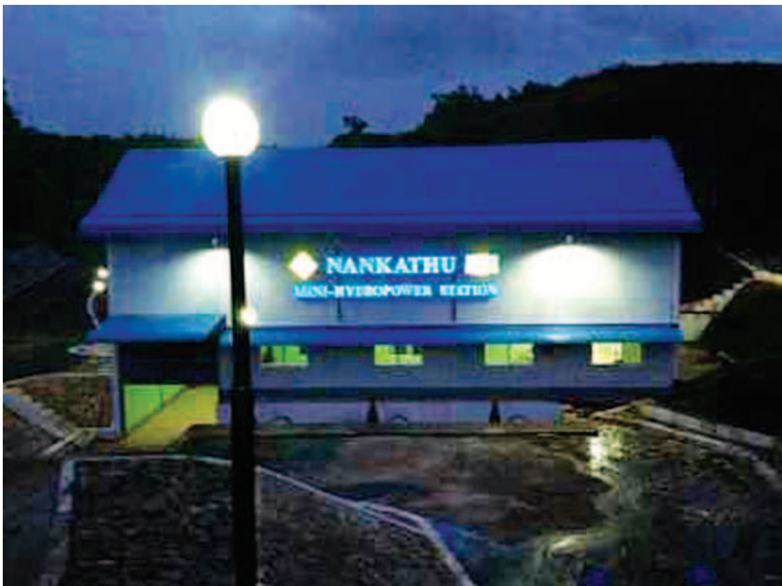
၂၀၁၅ ခုနှစ်အတွက် ASEAN Energy Award (Local Grid) ရရှိခဲ့သော နန်ကသူရေလျှောင်တစ်ရုံကို တွေ့ရစဉ်။

တပ်ဆင်ခဲ့သော တာဘိုင်အမျိုးအစားမှာ (200-KW) S-shape Tubular Turbine အမျိုးအစား သုံးစုံဖြစ်ပြီး နှစ်စဉ်လိုလိုဝန်ဆောင်ပေးနိုင်စွမ်းကောင်းစွာ အနီးရှိ ကျေးရွာ ငါးရွာဖြစ်သည့် (ကညွတ်ကွင်းကျေးရွာ၊ ရှားတောကျေးရွာ၊ ဝါဘိုကျေးရွာ၊ သရက်အုပ်ကျေးရွာ၊ လှည်းမှောက်ကျေးရွာ) စုစုပေါင်းအိမ်ခြေ ၅၀၀ ခန့်ကို (11-KV