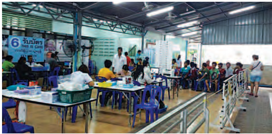
ပန်းရောင်ဘတ်ကတ်များ လာရောက်လုပ်ဆောင်နေကြသော ရွှေ့ပြောင်းအလုပ်သမားများအား One stop Service စခန်း၌ နိုဝင်ဘာ ၃ ရက် ညနေပိုင်းက တွေ့ရစဉ်။

မဟာချိုင် နိုဝင်ဘာ ၄ ထိုင်းနိုင်ငံတစ်ခွင်ရှိ ငါးဖမ်းလှေများ၌ အလုပ်လုပ်ကိုင်နေကြသော အထောက်အထားမရှိသည့် မြန်မာ၊ ကမ္ဘောဒီးယားနှင့် လာအိုနိုင်ငံတို့မှ ရွှေ့ပြောင်း အလုပ်သမားများအား ယာယီအလုပ်လုပ်ကိုင်ခွင့်နှင့် အလုပ်လုပ်ကိုင်ခွင့်ပန်းရောင်ဘတ်ကတ်များကို နိုင်ငံတစ်ခွင်ရှိ ခရိုင် ၂၂ ခု၌ နိုဝင်ဘာ ၂ ရက်မှ ၂၀၁၆ ခုနှစ် ဇန်နဝါရီ ၃၀ ရက်အထိ ပြုလုပ်ပေး မည်ဖြစ်ကြောင်း ထိုင်းနိုင်ငံရောက်မြန်မာနိုင်ငံသားများအဖွဲ့ (Myanmar Association in Thailand-MAT)၏ ဆက်သွယ်ပြောကြားချက်အရ သိရသည်။ စမတ်စာခွန်၊ စမုတ်ပါရကန်၊ ဆမုတ်ဆုန်ခါ၊ ဖစ်ချဘူရီ၊ ပကူတ်ခီရီခန်၊ ခြံဖော်၊ ခြံဘူရီ၊ ကျန်ထပူရီ၊ လယောင်၊ ရနောင်၊ ကဘီ၊ နခွန်စိဌာမရတ်၊ ဆုခလော၊ ဆခွန်း၊ ချချင်ဆောင်၊ နခီစိဌာမရ၊ ဆုရတ်ဌာနီ၊ ပါသနီ၊ နာရာသီဝပ်၊ ဖန်နှင့် ဖူးခက်ခရိုင် အစရှိသည့် ခရိုင်ပေါင်း ၂၂ ခရိုင်တွင် နိုဝင်ဘာ ၂ ရက်မှစတင်၍ ယာယီအလုပ်လုပ်ကိုင်ခွင့်နှင့် အလုပ်လုပ်ကိုင်ခွင့် ပန်းရောင်ဘတ်ကတ်ပြားကို ရွှေ့ပြောင်းအလုပ်သမားများအတွက် သုံးလတိုင်တိုင် One Stop Service စခန်းများ၌ နေ့ချင်းပြီး ပြုလုပ်ပေးမည်ဖြစ်သည်။ ထိုင်းနိုင်ငံအစိုးရအနေဖြင့် အဆိုပါ ရွှေ့ပြောင်း အလုပ်သမားများအတွက် ယာယီအလုပ်လုပ်ကိုင်ခွင့်နှင့် ဒုတိယအကြိမ်ပြုလုပ်ပေးခြင်းအစီအစဉ်မှာ ငါးဖမ်းလှေများ၌ အလုပ်လုပ်ကိုင်နေကြသည့် အထောက်အထားမဲ့ အလုပ်သမားများအတွက်သာ သီးသန့်ပြုလုပ်ပေးနေခြင်း ဖြစ်သည်။ ထိုင်းနိုင်ငံအစိုးရ၏ သတင်းထုတ်ပြန်ချက်များအရ ယာယီအလုပ်လုပ်ကိုင်ခွင့်(ပန်းရောင်ဘတ်)ပြုလုပ်ရာ၌ ကျန်းမာရေးဆေးစစ်ခ ဘတ်ငွေ ၅၀၀၊ ကျန်းမာရေး အာမခံကတ်ပြုလုပ်ခဘတ်ငွေ ၁၆၀၀၊ အလုပ်သမားမှတ်ပုံတင်ကြေးဆောင်ရွက်ခ ဘတ်ငွေ ၁၀၀၀ နှင့် ကိုယ်ရေးရာဇဝင် မှတ်ပုံတင်ကြေးခ ဘတ်ငွေ ၈၀ စုစုပေါင်း ဘတ်ငွေ ၃၁၀၀ ကုန်ကျမည်ဖြစ်ကြောင်းသိရပြီး