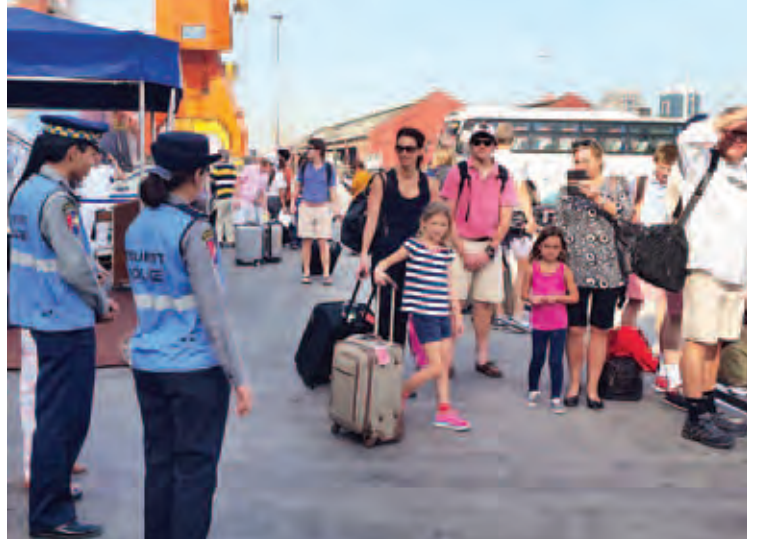
မြန်မာနိုင်ငံသို့ လာရောက်လည်ပတ်ကြသော ပြည်ပခရီးသွားဧည့်သည်များကို တွေ့ရစဉ်။