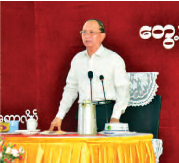
နိုင်ငံတော်သမ္မတ ဦးသိန်းစိန် တောင်ကုတ်မြို့ တောင်ကုတ်ကောလိပ်ခန်းမ၌ မြို့မိမြို့ဖများ၊ ကော်မတီများမှ ဥက္ကဋ္ဌများနှင့် အဖွဲ့ဝင်များ၊ ဌာနဆိုင်ရာတာဝန်ရှိသူများ၊ ဆရာ ဆရာမများနှင့် ပြည်သူများအား တွေ့ဆုံအမှာစကား ပြောကြားစဉ်။ (သတင်းစဉ်)

● ရှေ့ဖူးမှ လျှပ်စစ်မီးရရှိအောင် ဆောင်ရွက်ပေးခဲ့ကြောင်း။ ထို့ကြောင့် လျှပ်စစ်ဓာတ်အားကို သာမန်အိမ်သုံးအတွက်သာ အသုံးမပြုဘဲ အိမ်တွင်းစက်မှုလုပ်ငန်းများ ထွန်းကားစေရန်နှင့် ထိုမှတစ်ဆင့် အသေးစားနှင့်အလတ်စား စက်မှုလုပ်ငန်းများထွန်းကားအောင် ဆောင်ရွက်သွားရန်လိုကြောင်း။ ဒေသဖွံ့ဖြိုးရေးအတွက် မိုဘိုင်းတယ်လီဖုန်း ဆက်သွယ်ရေးလိုင်းများ တိုးချဲ့တပ်ဆင်ပြီး ဆက်သွယ်မှုအခြေအနေ ပိုမိုတိုးတက်ကောင်းမွန်အောင် ဆောင်ရွက်ပေးမည်ဖြစ်ကြောင်း။ ရရှိထားသည့် အခြေခံအဆောက်အအုံ ဖွံ့ဖြိုးတိုးတက်မှုများကို အသုံးပြုပြီး လယ်ယာထွက်ကုန်များနှင့် ရေထွက်ပစ္စည်းများကို တန်ဖိုးမြှင့်တင်ထုတ်လုပ်ရန် လိုအပ်ကြောင်း၊ ဒေသအတွင်း အလုပ်အကိုင်အခွင့်အလမ်းများကို ဖော်ထုတ်ပေးရန် လိုအပ်သကဲ့သို့ ဒေသနှင့်သင့်တော်သည့် သီးနှံများကိုလည်း စမ်းသပ်စိုက်ပျိုးရန် လိုအပ်ပါကြောင်း။ မိမိတို့တာဝန်ယူချိန်တွင် ရခိုင်ပြည်နယ်ဖွံ့ဖြိုးတိုးတက်ရေးအတွက် ငွေအား၊ လူအား စိုက်ထုတ်ဆောင်ရွက်ပေးခဲ့သည်ကို မျက်မြင်တွေ့ရှိ ခံစားနိုင်ပြီဖြစ်ကြောင်း။ ထို့ကြောင့် ဒေသတွင်းတည်ငြိမ်အေးချမ်းရေးနှင့် တရားဥပဒေစိုးမိုးရေးကို ဆက်လက်ထိန်းသိမ်းပြီး ဖွံ့ဖြိုးတိုးတက်အောင် ဆောင်ရွက်ကြစေလိုကြောင်း။ စစ်တွေမြို့ကို အဓိကရေပေးဝေနေသည့် ကန်တော်ကြီးကိုလည်း ပြုပြင်မွမ်းမံပြီး သောက်သုံးရေဖူလုံရေးအတွက် ဆောင်ရွက်ပေးမည်ဖြစ်ကြောင်း ပြောကြားသည်။ စစ်တွေမြို့ရှိ ကန်တော်ကြီးမှ မြို့အတွက် လက်ရှိရေပေးဝေနိုင်မှုမှာ