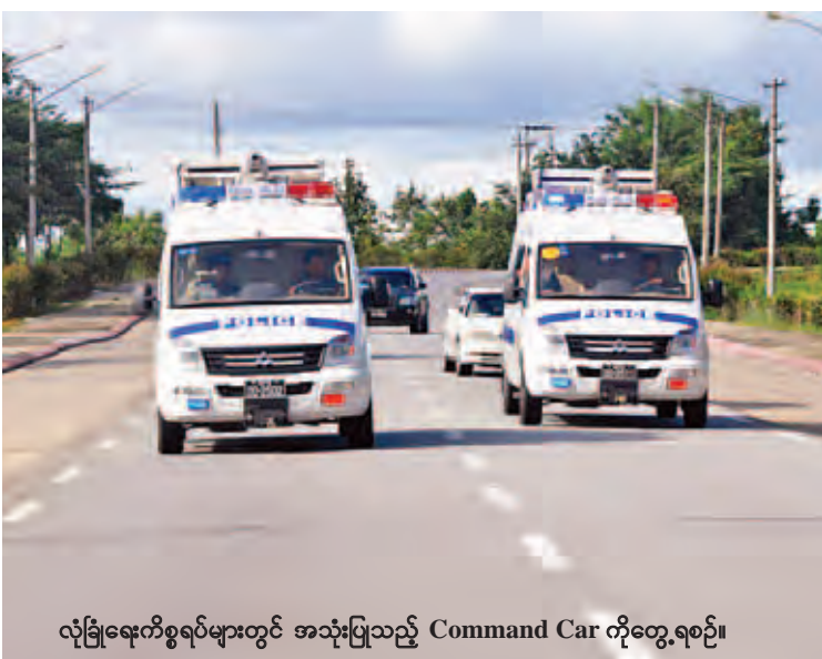
လုံခြုံရေးကိစ္စရပ်များတွင် အသုံးပြုသည့် Command Car တို့တွေ့ရစဉ်။

ပြည်သူများက ၎င်းတို့၏နစ်နာမှုများကို ပေးပို့တိုင်ကြားလာသည့် တိုင်ကြားစာများနှင့်ပတ်သက်၍ ၁-၄-၂၀၁၁ ရက်မှ ၁၀-၁၀-၂၀၁၅ ရက်အထိ တိုင်ကြားစာ ၄၀၀၀၀ ကျော် လက်ခံရရှိခဲ့ပြီး ပဏာမစိစစ်ချက်အရ ၅၁၉၆ စောင်ကို စိစစ်အရေးယူဆောင်ရွက်နိုင်ခဲ့သည်။