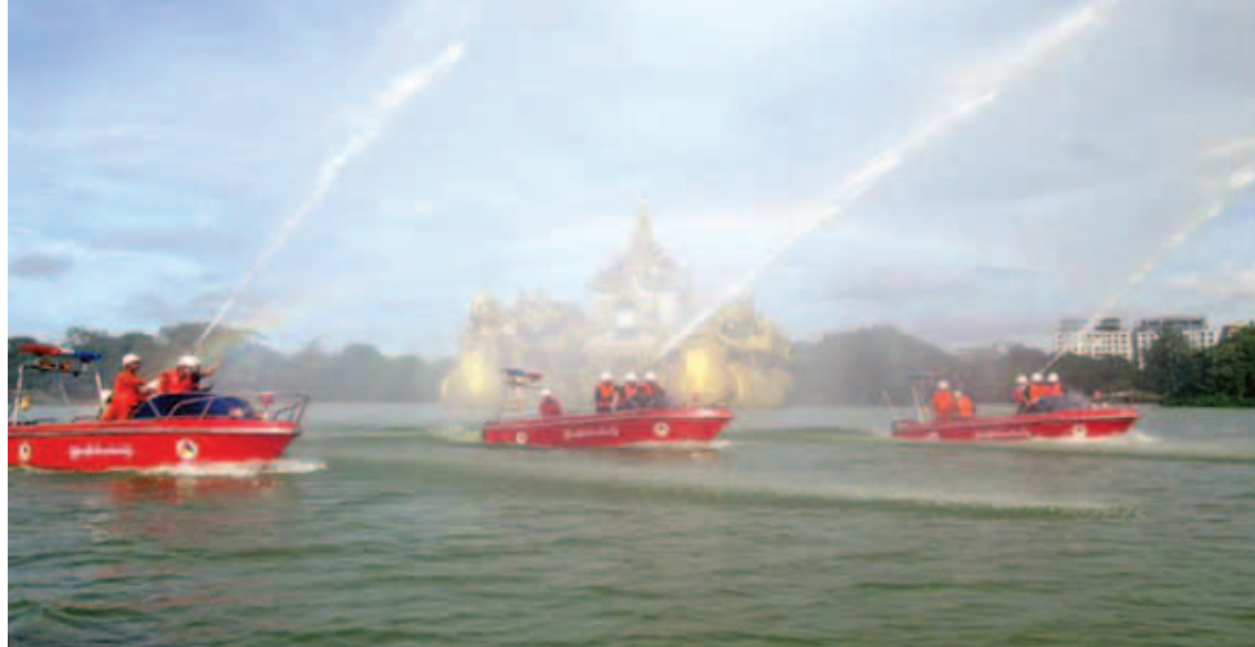
မီးငြိမ်းသတ်ရေးနှင့်ရှာဖွေကယ်ဆယ်ရေးလုပ်ငန်းများတွင် အသုံးပြုနိုင်ရန် ပြည်ထောင်စုဘဏ္ဍာရန်ပုံငွေဖြင့် ဝယ်ယူပြည့်တင်းထားသည့် အမြန်မီးသတ်ရေယာဉ်များကို တွေ့ရစဉ်။

လက်ရှိအစိုးရလက်ထက်တွင် လွတ်ငြိမ်းချမ်းသာခွင့်နှင့် ပြစ်ဒဏ်လွတ်ငြိမ်းခွင့်များ ခွင့်ပြုပေးခဲ့ရာ လွတ်ငြိမ်းချမ်းသာခွင့် (၅)ကြိမ်