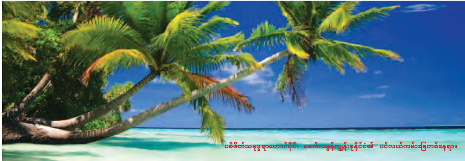
ပစိဖိတ်သမုဒ္ဒရာတောင်ပိုင်း ဆော်လမွန်ကျွန်းစုနိုင်ငံ၏ ပင်လယ်ကမ်းခြေတစ်နေရာ။

ပင်လယ်နက်ပိုင်းလွင်ပြင်သည် အနက်ပေ ၁၃၀၀၀ မှ ၂၀၀၀၀ ခန့်အထိ နက်ရှိုင်းသော အပိုင်းဖြစ်သည်။ အပိုင်းလေးပိုင်းတွင် အကျယ်ဝန်းဆုံး အပိုင်းဖြစ်သည်။ ဤအပိုင်းတွင် သမုဒ္ဒရာအလယ်တောင်ရိုးကြီးများ (Mid-Ocean Ridge) လည်းပါဝင်သည်။ ၎င်း သမုဒ္ဒရာအလယ်တောင်ရိုးကြီးတို့သည် မြေထုချပ်ကြီး (Plate) နှစ်ချပ် ဆန့်ကျင်ဘက်ဆီသို့ ရွေ့လျားသွားကြရာမှ သမုဒ္ဒရာအောက်ခင်းပြင် (Ocean Floor) စတင်ကွဲကွာလာစဉ် ကမ္ဘာ့အတွင်းပိုင်းမှ မဂ္ဂမာ (Magma) ခေါ် ကျောက်ရည်ပူများ ပန်းထွက်ကျလာရာမှ ဖြစ်ပေါ်လာကြသည်။ ဆက်လက်ဖော်ပြပါမည်။