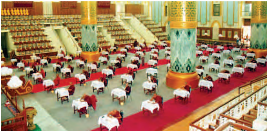
မဟာပါသာဏလိုဏ်ဂူတော်ကြီးအတွင်း၌ ဆရာတော်များ တိပိဋကဓရ တိပိဋကောဝိဒ ရွေးချယ်ရေးစာမေးပွဲပြေဆိုနေစဉ်။

အဆိုပါအစည်းအဝေးကြီးသို့ နိုင်ငံတော်အဆင့် သံဃာ့အဖွဲ့အစည်းများမှ ဆရာတော်ကြီးများ၊ ရိုက်ပေါင်းစုံမှ တိုင်းဒေသကြီး/