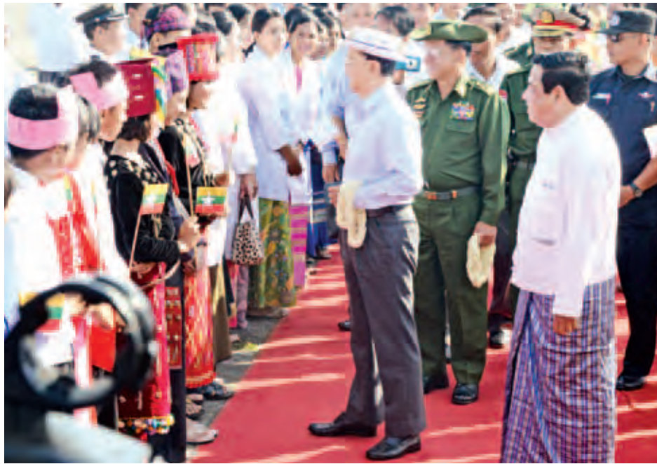
နိုင်ငံတော်သမ္မတ ဦးသိန်းစိန်အား ထားဝယ်လေဆိပ်တွင် မြို့မိမြို့ဖများနှင့် ဒေသခံပြည်သူများက တစ်ခဲနက် လှိုက်လှဲစွာ ကြိုဆိုနှုတ်ဆက်ကြစဉ်။

နိုဝင်ဘာ ၈ ရက်တွင် ကျင်းပမည့် ပါတီစုံ ဒီမိုကရေစီအထွေထွေရွေးကောက်ပွဲကြီးအား တည်တည်ငြိမ်ငြိမ် အေးအေးချမ်းချမ်းဖြင့် အောင်မြင်စွာ ကျင်းပနိုင်ရေးနှင့် လွတ်လပ်ပြီး တရားမျှတသည့် ရွေးကောက်ပွဲကြီးဖြစ်အောင် ပြည်သူတစ်ရပ်လုံးက အမျိုးသားရေးတာဝန် တစ်ရပ်အဖြစ် ဝန်ပေးပေးပါဝင် ဆောင်ရွက်ပေးကြရန် တိုက်တွန်းပြောကြားသည်။