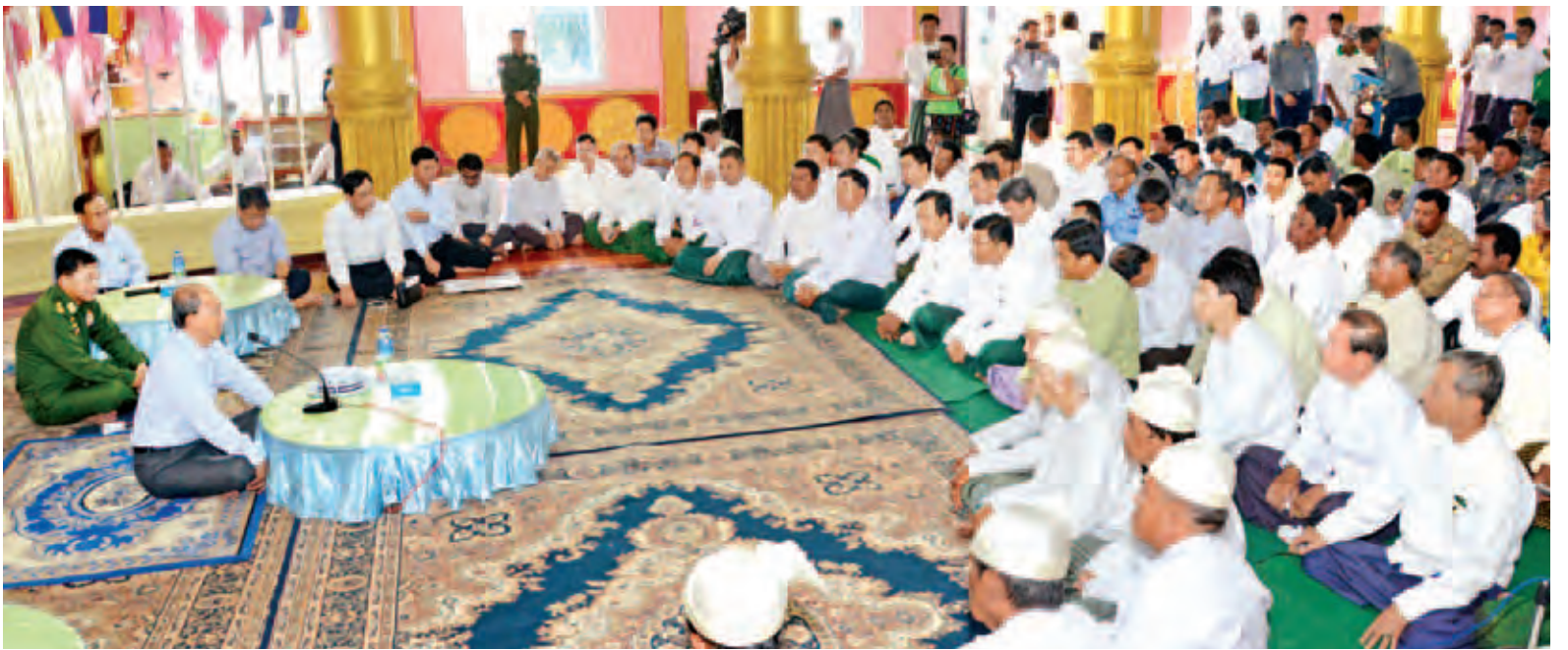
နိုင်ငံတော်သမ္မတ ဦးသိန်းစိန် ကော့သောင်းမြို့ပြည်တော်အေးသာသနာ့ဓိမာန်၌ မြို့မိမြို့ဖများ၊ ဒေသခံပြည်သူများအား ရင်းရင်းနှီးနှီး တွေ့ဆုံစဉ်။

ထိုမှတစ်ဆင့် နိုင်ငံတော်သမ္မတနှင့် အဖွဲ့ဝင်များသည် မြန်မာအမျိုးသားလေကြောင်းဖြင့် ကော့သောင်းမြို့သို့ရောက်ရှိရာ ကော့သောင်းလေဆိပ်၌ ဌာနဆိုင်ရာ တာဝန်ရှိသူများနှင့်