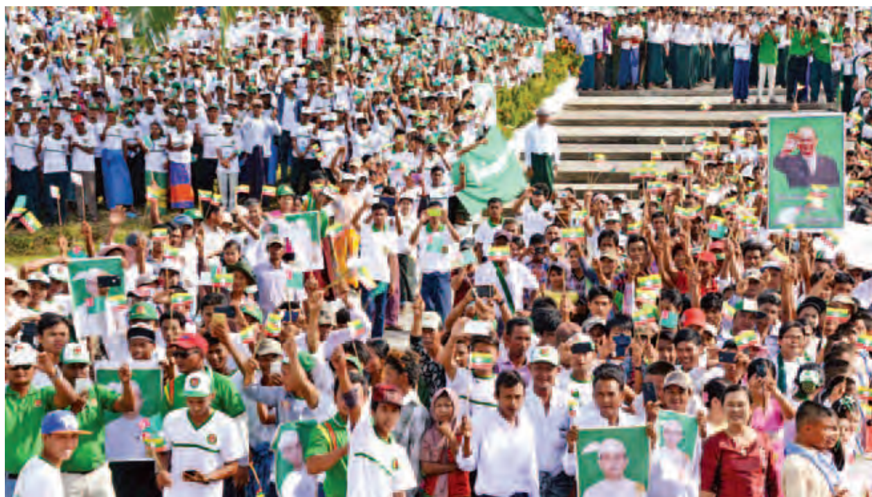
နိုင်ငံတော်သမ္မတ ဦးသိန်းစိန်အား ဘုတ်ပြင်းလေဆိပ်တွင် မြို့မိမြို့ဖများနှင့် ဒေသခံပြည်သူများက ကြိုဆိုနေသည်ကို တွေ့မြင်ရစဉ်။

နိုဝင်ဘာ ၈ ရက်တွင် ကျင်းပမည့် ပါတီစုံ ဒီမိုကရေစီအထွေထွေရွေးကောက်ပွဲကြီးအား တည်တည်ငြိမ်ငြိမ် အေးအေးချမ်းချမ်းဖြင့် အောင်မြင်စွာ ကျင်းပနိုင်ရေးနှင့် လွတ်လပ်ပြီး တရားမျှတသည့် ရွေးကောက်ပွဲကြီးဖြစ်အောင် ပြည်သူတစ်ရပ်လုံးက အမျိုးသားရေးတာဝန် တစ်ရပ်အဖြစ် ဝန်ပေးပေးပါဝင် ဆောင်ရွက်ပေးကြရန် တိုက်တွန်းပြောကြားသည်။