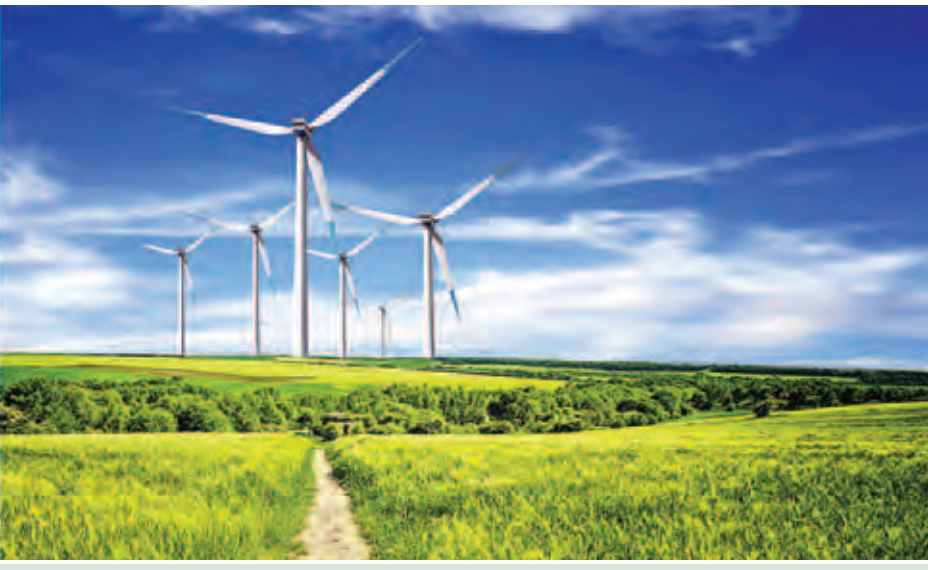
သဘာဝပတ်ဝန်းကျင်ကို ထိခိုက်မှုမရှိသော အစိမ်းရောင်ဖွံ့ဖြိုးတိုးတက်မှု။

အခြေခိုင်စ မြန်မာ့စီးပွားရေးအသိုက်အမြှူအတွင်း စီးပွားရေးအောင်မြင်မှုရရှိရန် ဆယ်စုနှစ် သုံးစု လုပ်ဆောင်ခဲ့သည့် သူ့ရည်မှန်းချက်သည် အကျိုး အမြတ်ဖြစ်ခဲ့သော်လည်း နာဂစ်ကဲ့သို့ သဘာဝဘေး ဒဏ်ကို ကိုယ်တိုင်ကြုံတွေ့ခဲ့ရပြီးနောက် သစ်ထုတ်လုပ် ရေးလုပ်ငန်းကို ရပ်နားခဲ့သည်မှာ ၂၀၁၀ ပြည့်နှစ် ကတည်းကပင်ဖြစ်သည်။