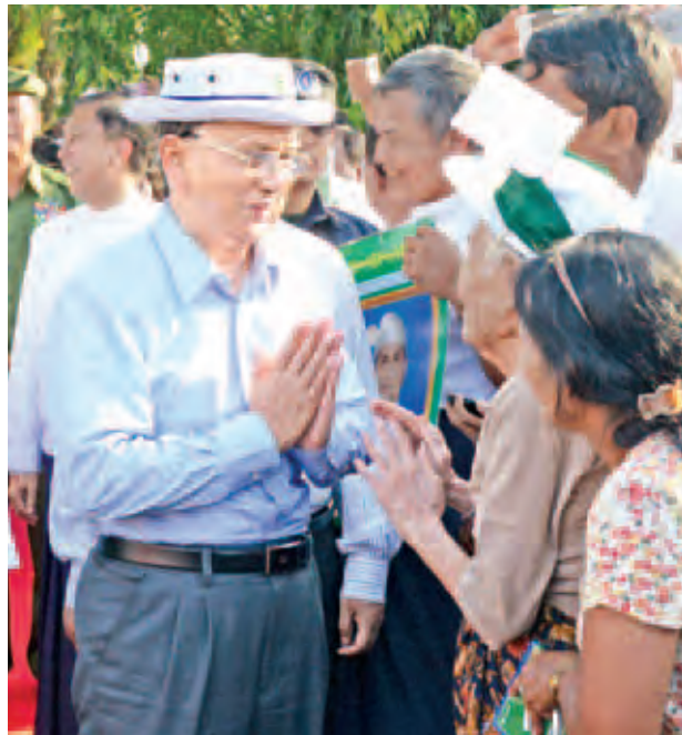
နိုင်ငံတော်သမ္မတ ဦးသိန်းစိန် မြိတ်လေဆိပ်တွင် ဒေသခံပြည်သူတစ်ဦးအား ရင်းရင်းနှီးနှီး နှုတ်ဆက်စဉ်။

ဆက်လက်၍ မိမိတို့အစိုးရလက်ထက်၌ နိုင်ငံရေး၊ စီးပွားရေး၊ အုပ်ချုပ်ရေးနှင့် ပုဂ္ဂလိကကဏ္ဍ ပြုပြင်ပြောင်းလဲမှုများကို တစ်ဆင့်ပြီး တစ်ဆင့် စနစ်တကျဖြင့် တည်ငြိမ်အေးချမ်းစွာ ဆောင်ရွက်နိုင်မှုကြောင့် ပြည်သူများ၏ လူမှုစီးပွားဘဝ ဖွံ့ဖြိုးတိုးတက်ရေးအတွက် လိုအပ်ချက်များ ဖြစ်သည့် စီးပွားရေး၊ ပညာရေး၊ ကျန်းမာရေး၊ လမ်းတံတား၊ တယ်လီဖုန်းဆက်သွယ်ရေး၊ လျှပ်စစ်မီးနှင့် သန့်ရှင်းသော သောက်သုံးရေရရှိရေး စသည့် ကဏ္ဍများတွင် တိုးတက်မှုများစွာ ရရှိနေပြီဖြစ်ကြောင်း၊ ရရှိပြီးဖြစ်သော တည်ငြိမ်အေးချမ်းမှုနှင့် ကဏ္ဍစုံဖွံ့ဖြိုးတိုးတက်မှု အရှိန်အဟုန်ကို ဆက်လက်ထိန်းသိမ်းပြီး တစ်နိုင်ငံလုံး တစ်ပြေးညီဖွံ့ဖြိုးတိုးတက်ရေးအတွက် နိုင်ငံတော်အစိုးရနှင့်အတူ ပြည်သူတစ်ရပ်လုံးက တက်ညီလက်ညီဖြင့် ပူးပေါင်းပါဝင်ဆောင်ရွက်ကြရန် လိုအပ်ကြောင်း။