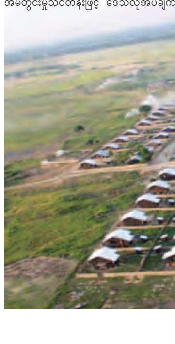
ရခိုင်ပြည်နယ် မောင်တောမြို့နယ် ရွှေရင်အေးကျေးရွာ၌ တန်ဖိုးနည်းအိမ်ရာများ ဆောက်လုပ်ပေးထားသည်ကို တွေ့ရစဉ်။

၂၀၁၁-၂၀၁၂ ဘဏ္ဍာရေးနှစ်မှ ၂၀၁၅-၂၀၁၆ ဘဏ္ဍာရေးနှစ် ၃၀-၉-၂၀၁၅ ရက်ထိ ဆောင်ရွက်ပေးခဲ့သော ပညာရေးအဆောက်အအုံ ဆောက်လုပ်မှုလုပ်ငန်းများ