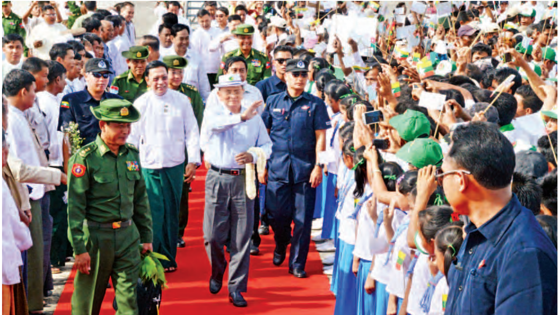
နိုင်ငံတော်သမ္မတ ဦးသိန်းစိန်အား ဘုတ်ပြင်းလေဆိပ်တွင် မြို့မိမြို့ဖများနှင့် ဒေသခံပြည်သူများက လှိုက်လှဲစွာကြိုဆိုနှုတ်ဆက်ကြစဉ်။ (သတင်းစဉ်)

နေပြည်တော် အောက်တိုဘာ ၃၁ ပြည်ထောင်စုသမ္မတမြန်မာနိုင်ငံတော် နိုင်ငံတော်သမ္မတ ဦးသိန်းစိန်သည် တစ်မတော်ကာကွယ်ရေးဦးစီးချုပ် ဝိုင်းချင်မျိုးကြီးမင်းအောင်လှိုင်၊ ပြည်ထောင်စုဝန်ကြီး ဦးစိုးသိန်း၊ ဒုတိယဗိုလ်ချုပ်ကြီးကျော်ဆွေ၊ ဦးအုန်းမြင့်၊ ဦးဝင်းထွန်း၊ ဦးဇေယျာအောင်၊ ဒေါက်တာသန်းအောင်၊ ဒုတိယဝန်ကြီးများ၊ တာဝန်ရှိသူများနှင့်အတူ ယနေ့နံနက်ပိုင်းတွင် ရန်ကုန်မြို့မှ မြန်မာအမျိုးသားလေကြောင်းဖြင့်ထွက်ခွာပြီး တနင်္သာရီတိုင်းဒေသကြီး ထားဝယ်မြို့သို့ရောက်ရှိရာ တိုင်းဒေသကြီး ဝန်ကြီးချုပ် ဦးမြတ်ကို၊ ကမ်းရိုးတန်းဒေသတိုင်းစစ်ဌာနချုပ် တိုင်းမှူး၊ တိုင်းဒေသကြီးဝန်ကြီးများ၊ လွှတ်တော်ကိုယ်စားလှယ်များ၊ တာဝန်ရှိသူများနှင့် ဒေသခံပြည်သူများက ကြိုဆိုနှုတ်ဆက်ကြသည်။ စာမျက်နှာ ၃ ကော်လံ ၁ သို့