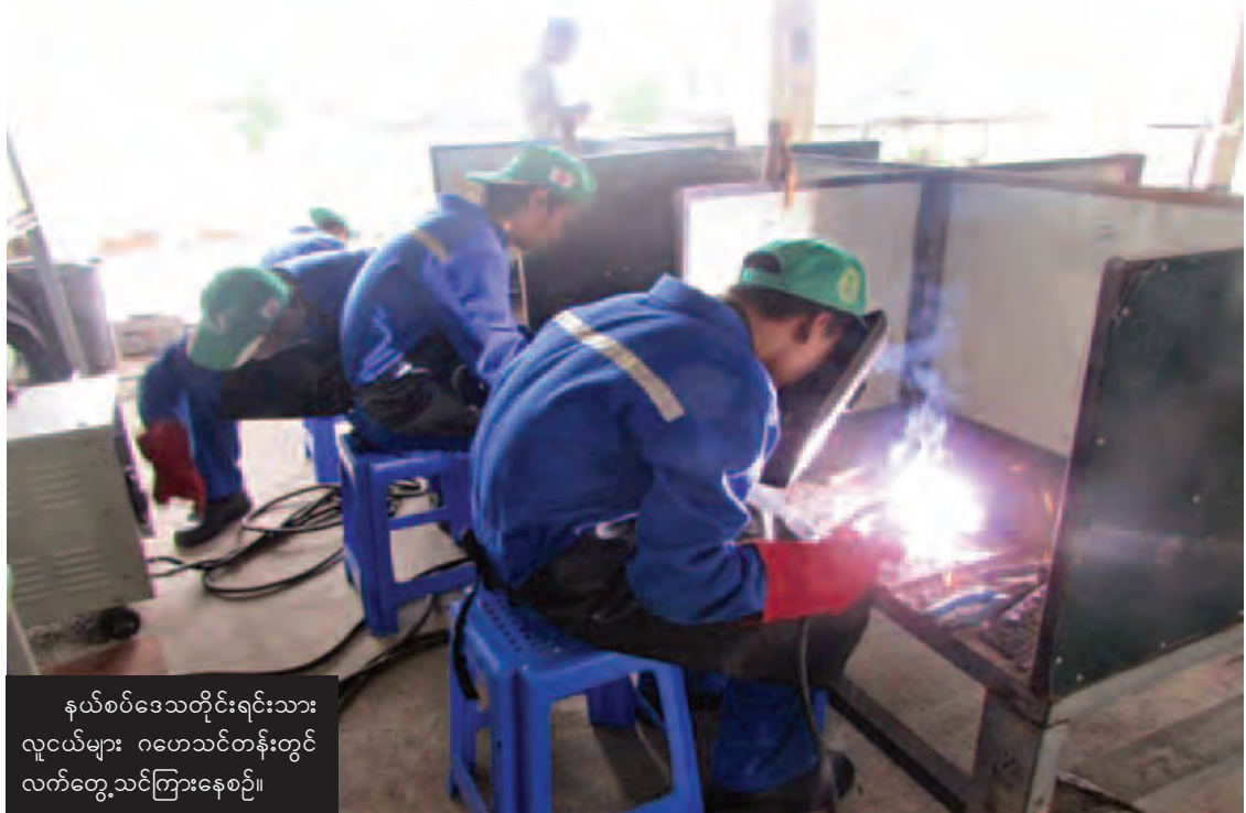
နယ်စပ်ဒေသတိုင်းရင်းသား လူငယ်များ ဂဟေသင်တန်းတွင် လက်တွေ့သင်ကြားနေစဉ်။