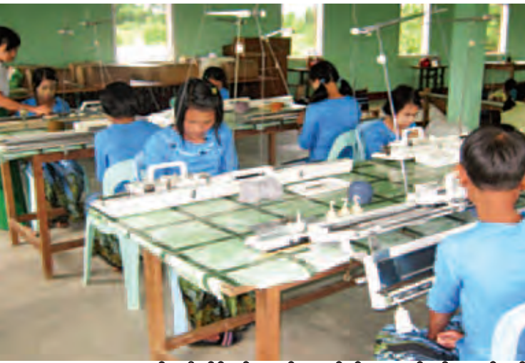
အမျိုးသမီးအိမ်တွင်းမှုသက်မွေးလုပ်ငန်းပညာသင်တန်းကျောင်းတွင် သိုးမွေးစက်ဆွဲသင်တန်း သင်ကြားနေစဉ်။

(၂) ငြိမ်းချမ်းရေးအတွက် တည်ဆောက်မှုလုပ်ငန်းများတွင် မြေလမ်း ၃၇၅ မိုင်၊ လမ်းတာချဲ့ခြင်း ၃ မိုင်၊ ကျောက်လမ်းမိုင် ၂၈၀၊ ကတ္တရာလမ်း ၆၄ မိုင်၊ ကတ္တရာထောက်ပံ့ခြင်း တန် ၄၅၀၀၊ လမ်းပြုပြင်ထိန်းသိမ်းခြင်း ၅ မိုင်၊ ကွန်ကရစ်လမ်း ၁၆ မိုင်၊ ဆိုင်ကယ်စီးမြေလမ်း ၃ မိုင်၊ ကွန်ကရစ်တံတားပေ ၁၀၀ အထက် ၁၄ စင်း၊ ပေ ၁၀၀ အောက် ၁၇၄ စင်း၊ တန်ဖိုးနည်းအိမ်ရာ ၁၃၅၀၊ သောက်သုံးရေရရှိရေးလုပ်ငန်း ၆၃ ခု၊ ရေကန် ၁၁ ကန်၊ ရေအားလျှပ်စစ်လုပ်ငန်း တစ်ခု၊ ဆိုလာ ၄၄၄၄ စုံ၊ မူလတန်းကျောင်း ၃၂ ကျောင်း၊ အလယ်တန်းကျောင်း ခြောက်ကျောင်း၊ အထက်တန်းကျောင်း လေးကျောင်း၊ စိုက်ပျိုးမြေဖော်ထုတ်ခြင်း ၄၃၄ ဧက၊ ရော်ဘာပျိုးပင် ၀.၆၆ ဧက၊ ရော်ဘာစိုက်ပျိုးခြင်း ဧက ၂၅၀၀၊ ပီလောပီစိုက်ပျိုးခြင်း ဧက ၅၀၊ နွေစပါးအတွက် ရေသွင်းမြောင်းဖောက်လုပ်ခြင်း ပေ ၄၃၉၀၀၊ စပါး/ငါးကန် ၁၇ ဧက၊ ကွန်ကရစ်ရေပြန် ၂၉၉ ခုနှင့် သစ်သားတံတား၊ ကြိုးတံတား၊ ဘေလီတံတား၊ စက်ရေတွင်း (တွင်းတိမ်) စက်ရေတွင်း(တွင်းနက်) လက်တူးတွင်း၊ ဘုန်းကြီးကျောင်း၊ ဘုန်းတော်ကြီးသင်ပညာရေးကျောင်း၊ သီလရှင်ကျောင်း၊ ဆွမ်းစားဆောင်၊ မူလတန်းကြိုကျောင်း၊ မီးစက်၊ မီးသွယ်တန်းခြင်း၊ ဘော်ဒါဆောင်၊ ဆေးပေးခန်း၊ ကျေးလက်ကျန်းမာရေးဌာနခွဲ၊ စိုက်ပျိုးရေးရရှိရေးလုပ်ငန်း၊ ရုပ်/သံထပ်ဆင့်လွှင့်စက်ရုံ၊ စာကြည့်တိုက်များကို ဆောင်ရွက်ပေးခဲ့သည်။