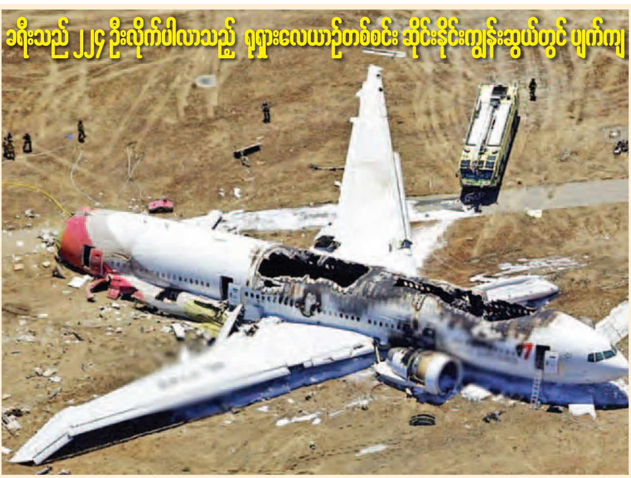
ခရီးသည် ၂၂၄ ဦးလိုက်ပါလာသည့် ရုရှားလေယာဉ်တစ်စင်း ဆိုင်းနိုင်းကျွန်းဆွယ်တွင် ပျက်ကျ မဖော်လိုသည့် အရာရှိတစ်ဦးက ဆိုသည်။ “လေယာဉ်က မီးလောင်ပြီး ပျက်စီးနေတယ်။ ကျောက်ဆောင်တစ်ခုနဲ့ ဝင်တိုက်ထားပုံရတယ်။ လေယာဉ်ထဲမှာ သေနေတဲ့ ခရီးသည် ၁၀၀ ကျော်လောက်ကို ဆွဲထုတ်ခဲ့ရတယ်။ လေယာဉ်ထဲမှာ လူတွေရှိနေသေးတယ်”ဟု ယင်းက ဆက်လက်ပြောသည်။ ဆိုင်းနိုင်းကျွန်းဆွယ် ဒေသသည် အစွလာမစ်နိုင်ငံ ထူထောင်ရေး နှိတ်တာ။

မော်စကို အောက်တိုဘာ ၃၁ ခရီးသည် ၂၂၄ ဦး လိုက်ပါစီးနင်းလာသည့် ရုရှားလေယာဉ်တစ်စင်းသည် အောက်တိုဘာ ၃၁ ရက်က အီဂျစ်နိုင်ငံ ဆိုင်းနိုင်းကျွန်းဆွယ် အလယ်ပိုင်းတစ်နေရာတွင် ပျက်ကျသွားခဲ့ကြောင်း အီဂျစ်လေကြောင်း အာဏာပိုင်များက ပြောကြားခဲ့သည်။ ရုရှားလေကြောင်း ကိုယ်လျှန် အဓိရာလေကြောင်းလိုင်းမှ အဘတ်စ် အေ ၃၂၀ လေယာဉ်သည် ဆိုင်းနိုင်း ပင်လယ်နီအပန်းဖြေစခန်း ရှိရန် အယ်-ရီးဒ်မှ ရုရှားနိုင်ငံ၏ ပင်လယ် ဆိပ်ကမ်းမြို့ဖြစ်သည့် စိန့်ပီတာဘက်သို့ ဦးတည်ပျံသန်းနေခဲ့ပြီး ဆိုင်းနိုင်းကျွန်းဆွယ် အလယ်ပိုင်း တောင်တန်းထူထပ်သည့်နေရာတွင် ပျက်ကျသွားခဲ့ကြောင်း လေကြောင်း ပျံသန်းမှုဝန်ကြီးဌာနက ပြောသည်။ လိုက်ပါစီးနင်းသူ အများစုမှာ သေဆုံးနိုင်ဖွယ်ရှိသည်ဟု လေယာဉ် ပျက်ကျသွားခဲ့သည့် နေရာသို့ ရောက်ရှိခဲ့သော လုံခြုံရေးအရာရှိ တစ်ဦးကဆိုသည်။ “လေယာဉ်ပျက်ကျတဲ့နေရာကို ရောက်တော့ ထိုင်ခဲ့တွေမှာ ခါးပတ်ပတ်ပြီး သေနေတဲ့ ခရီးသည်တွေ အများကြီးကိုတွေ့ရတယ်”ဟု အမည်