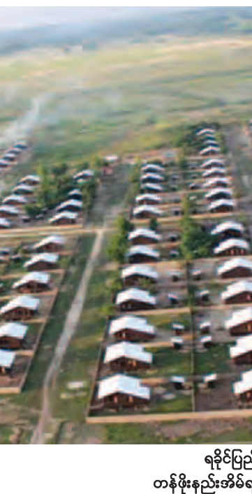
ရခိုင်ပြည်နယ် မောင်တောမြို့နယ် ရွှေရင်အေးကျေးရွာ၌ တန်ဖိုးနည်းအိမ်ရာများ ဆောက်လုပ်ပေးထားသည်ကို တွေ့ရစဉ်။

၂၀၁၁-၂၀၁၂ ဘဏ္ဍာရေးနှစ်မှ ၂၀၁၅-၂၀၁၆ ဘဏ္ဍာရေးနှစ် ၃၀-၉-၂၀၁၅ ရက်ထိ ဆောင်ရွက်ပေးခဲ့သော ကျန်းမာရေးအဆောက်အအုံများ ဆောက်လုပ်မှု