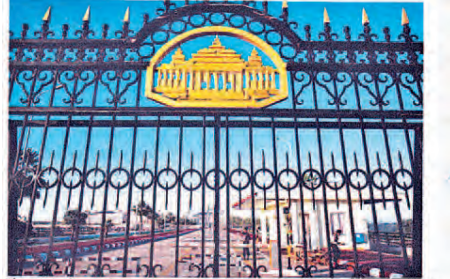
The gate to the massive compound of Myanmar's parliament building in Naypyitaw

Creating a sustainable democracy in Myanmar — ကြယ်စင်သာ —