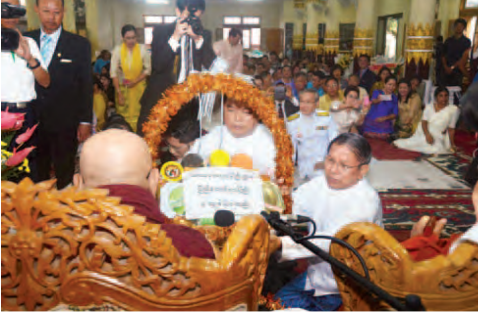
ကြီးကို မြတ်ဗုဒ္ဓ၏ အဆုံးအမဒေသနာတော်နှင့်အညီ မြန်မာနိုင်ငံတော်တွင် နှစ်စဉ်နှစ်တိုင်း အောင်မြင်စွာ ကျင်းပနိုင်ခဲ့သည်မှာ ယနေ့ထက်တိုင်ဖြစ်ပါကြောင်း၊ ယနေ့ အခမ်းအနားသည် နှစ်နိုင်ငံပြည်သူတို့၏ နှလုံးသားတွင် ထာဝရပိုမိုခိုင်မြဲသည့် အပြန်အလှန် ချစ်ကြည်ရင်းနှီးမှုနှင့် လေးစားမှုတို့ကိုအောင်မြင်စေနိုင်မည်ကို ဖော်ဆောင် ပါကြောင်း၊ မြန်မာနိုင်ငံသို့လည်းကောင်း၊ သို့မဟုတ် မြန်မာနိုင်ငံတော်၏ ချစ်ကြည်ရင်းနှီးမှုများ ပိုမိုခိုင်မြဲလာ စေရန် ဤတော်ဝင်ကထိန်သင်္ကန်းလှူဒါန်းပွဲကြီးကို နှစ်စဉ်ကျင်းပနိုင်ရန် မျှော်လင့်ပါကြောင်း ပြောကြားသည်။ ထိုင်းဘုရင့် မိသားစု၏ လှူဒါန်းငွေစုပေါင်းမှာ မြန်မာကျပ်ငွေ သိန်း ၄၀၀ ဖြစ်ကြောင်း သိရသည်။ (သတင်းစဉ်)