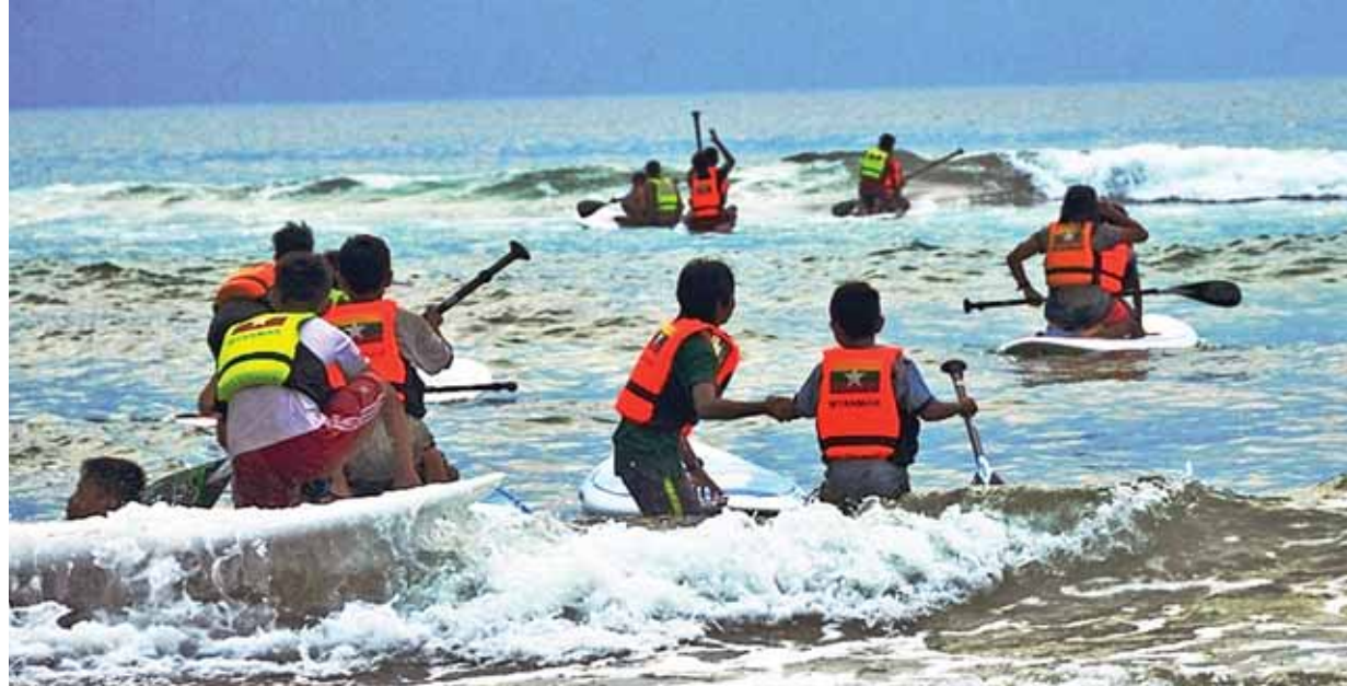
ဒေသခံကလေးငယ်တို့မျှော်လင့်နေသည့် Stand Up Paddle (SUP) ကစားနည်းအား ဖြည့်ဆည်းနေသူများ။