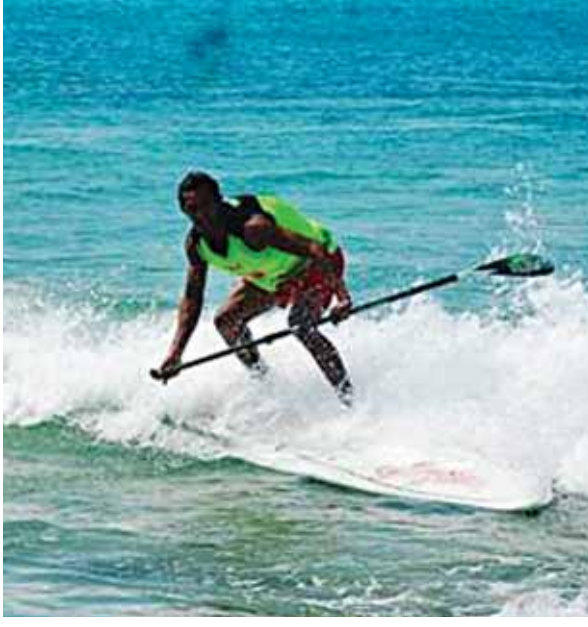
ငွေဆောင်ကမ်းခြေတွင် ပြုလုပ်သည့် Stand Up Paddle (SUP) ကလပ်ပြိုင်ပွဲများ၌ ပန်းဝင်ရန် အားကြီးမာန်တက်လှော်ခတ်နေသည့် ကစားသမားတစ်ဦး၏ မြင်ကွင်း။