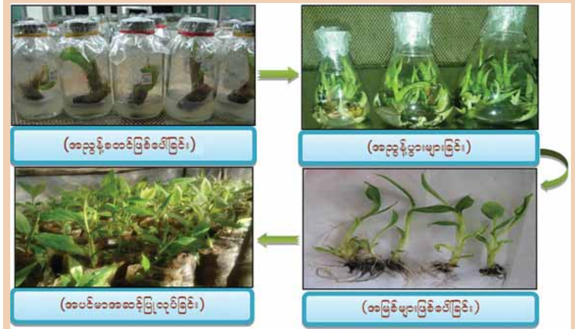
အပင်တစ်သျှူးမျိုးပွား သုတေသနလုပ်ငန်း

ထို့အပြင် အသိဉာဏ်ပစ္စည်းမူပိုင်ခွင့် ဆိုင်ရာကိစ္စရပ်များ၊ စံချိန်စံညွှန်းသတ်မှတ်ရေး ကိစ္စရပ်များ၊ အရည်အသွေးထိန်းသိမ်းရေး အခြေခံအောက်အဖွဲ့ဆိုင်ရာ ကိစ္စရပ်များ၊ နျူကလီးယား ဘေးအန္တရာယ်ကင်းရှင်းရေး ဆိုင်ရာကိစ္စရပ်များ၊ လူသားအရင်းအမြစ် ဖွံ့ဖြိုးရေးလုပ်ငန်းများကို စီမံချက်များရေးဆွဲ၍ ဆောင်ရွက်လျက်ရှိပါကြောင်း ရေးသားတင်ပြ လိုက်ရပါသည်။