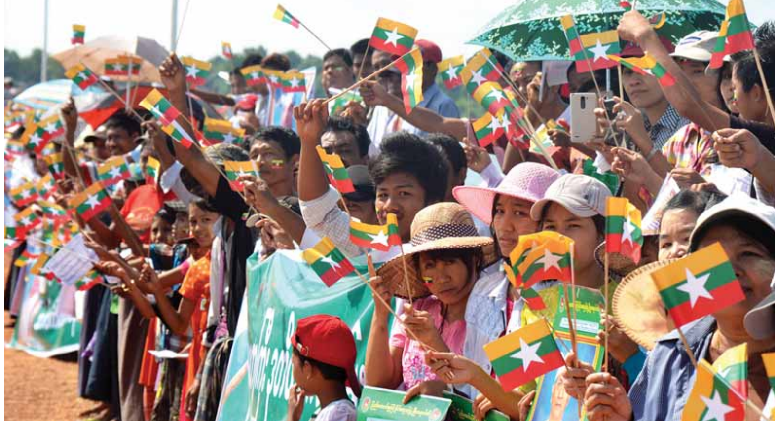
နိုင်ငံတော်သမ္မတ ဦးသိန်းစိန်အား မင်းရေလှောင်တံဆိပ်ဆု ခံယူနေကြောင်း မြင်ရပါသည်။ (သတင်းစဉ်)

မင်းရေလှောင်တံဆိပ် ပဲခူးမြို့၏ အနောက်ဘက်ရှိ မင်းချောင်းနှင့်ကြက်သောင်းချောင်းဆုံအထက်ပေ ၅၀၀ခန့်အကွာတွင် တည်ရှိပြီး ပဲခူးမြို့အတွက် သောက်သုံးရေနှင့် စက်ရုံ အလုပ်ရုံသုံးရေ နေ့စဉ်ဂါလန် ၁၁ သန်းပေးစေရန်၊ ပဲခူးမြို့အတွင်းရှိ မဲခန့်ကျေးရွာအုပ်စုနှင့် ဇိုင်းဂနိုင်းကြီးကျေးရွာအုပ်စုရှိ လယ်မြေဧက ၆၅၀ ခန့်ကို စိုက်ပျိုးရေးပေးစေရန်၊ ပဲခူးမြို့နှင့်ပတ်ဝန်းကျင်ဒေသများ မိုးရာသီ မြစ်ရေကြီးမှုမှ တစ်စိတ်တစ်ဒေသကာကွယ်ပေးနိုင်ရန်၊ ပတ်ဝန်းကျင်ဒေသများ စိမ်းလန်းစိုပြည်ရန်နှင့် တက်စေရန် ရည်ရွယ်ချက်များဖြင့် တည်ဆောက်ထားသည့် မြေသားရေလှောင်တံဆိပ်အမျိုးအစားဖြစ်သည်။ ပဲခူးမြို့သည် ပဲခူးမြစ်ကမ်းဘေးတွင်တည်ရှိပြီး မြေနိမ့်လွင်ပြင်ဖြစ်၍ ပဲခူးမြစ် ရေကြီးရေလျှံမှုကို နှစ်စဉ်ကြုံတွေ့နေရသည့်အတွက် မင်းရေလှောင်တံဆိပ် မင်းချောင်းတူးဖော်ခြင်းလုပ်ငန်းနှင့် ခေါင်းဆေးကျွန်းတံတားမှ ပဲခူးမြစ်အထိ ခေါင်းဆေးကျွန်းချောင်းတူးဖော်ခြင်းလုပ်ငန်းများ ဆောင်ရွက်နိုင်ခြင်းကြောင့် ပဲခူးမြို့ပေါ်ရပ်ကွက်များတွင် ရေကြီးရေလျှံမှုနှင့် ခေါင်းဆေးကျွန်းတံတားအနီးရှိ ရန်ကုန်-မန္တလေးကားလမ်းရေကျော်ခြင်းတို့မှ လျော့ပါးသက်သာစေပြီး ဒေသခံပြည်သူများ၏ စီးပွားရေး၊ လူမှုရေးနှင့်ကျန်းမာရေးဆိုင်ရာ ထိခိုက်မှုများမှ ကာကွယ်ပေးလျက်ရှိသည်။ ယင်းနောက် နိုင်ငံတော်သမ္မတနှင့် အဖွဲ့ဝင်များသည် မင်းရေလှောင်တံဆိပ် နှစ်စဉ်အကွာတွင်တည်ရှိသည့် ဆည်မြောင်းပညာရပ်ဖွံ့ဖြိုးမှုလေ့ကျင့်ရေးဌာနခွဲသို့ မော်တော်ယာဉ်များဖြင့် ဆက်လက်ထွက်ခွာရာ လမ်းတစ်လျှောက် ဝဲယာမှ ဒေသခံပြည်သူများက ကြိုဆိုနှုတ်ဆက်ကြသည်။