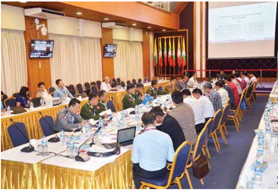
ပစ်ခတ်တိုက်ခိုက်မှုရပ်စဲရေး ပူးတွဲစောင့်ကြည့်ရေးကော်မတီ (JMC)ဒုတိယနေ့ အစည်းအဝေး ဆက်လက်ပြုလုပ်စဉ်။