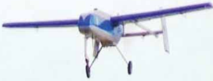
မောင်းသူမဲ့လေယာဉ်ဖြင့် သုတေသနလုပ်ငန်းများ ဆောင်ရွက်နေစဉ်။