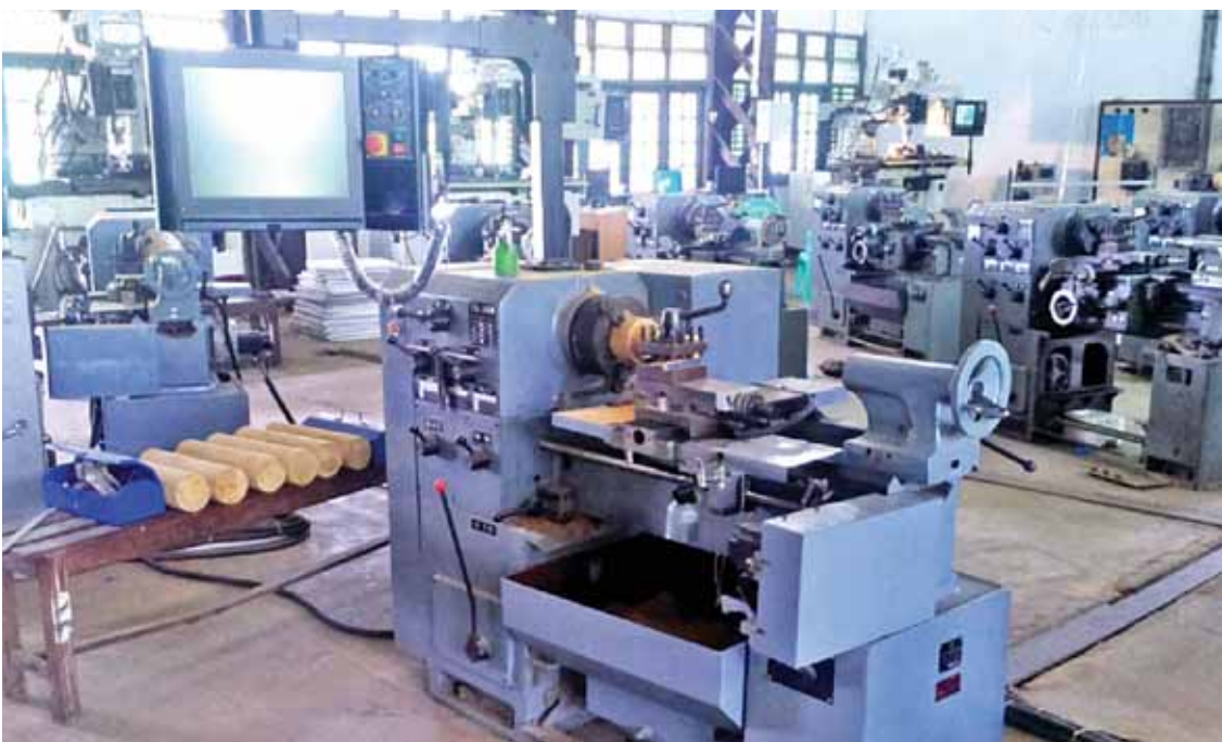
Conversion PC Based CNC Lathe Machine (TSL-360N)

Design and Construction of Wind Pumping System တည်ဆောက်ခြင်း၊ 1 KW Cross-Flow Turbine တည်ဆောက်ခြင်း၊ Pressure ဒဏ်ခံနိုင်သော အရည်အသွေးမြင့် ပလတ်စတစ် High