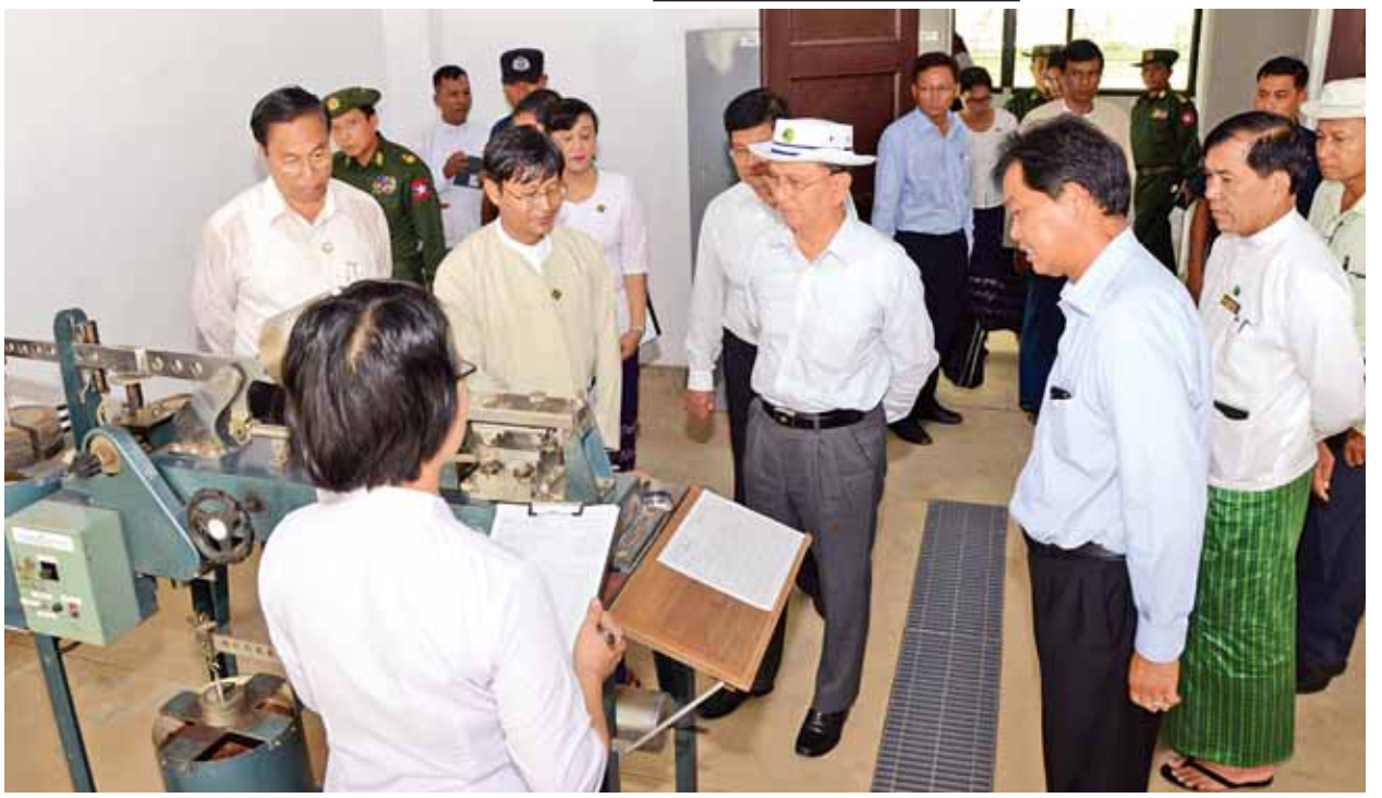
နိုင်ငံတော်သမ္မတ ဦးသိန်းစိန် ဆည်မြောင်းပညာရပ်ဖွံ့ဖြိုးမှုလေ့ကျင့်ရေးဌာနခွဲ(မင်း)အား ကြည့်ရှုစစ်ဆေးစဉ်။ (သတင်းစဉ်)

အလိုက် မိုးရေချိန်၊ ရေဝင်ရောက်မှု၊ ရေထုတ်လွှတ်ပေးနိုင်မှုနှင့် ပဲခူးမြို့ ရေကြီးရေလျှံမှုကာကွယ်ရန် ဆောင်ရွက်ထားရှိမှု အခြေအနေများကို ရှင်းလင်းတင်ပြကြသည်။ ယင်းနောက် နိုင်ငံတော်သမ္မတက မင်းရေလှောင်တံဆိပ် ပဲခူးမြို့သို့ သောက်သုံးရေနှင့် စိုက်ပျိုးရေးပေးစနစ်နှင့်ပတ်သက်ပြီး မှာကြားရာတွင် မင်းရေလှောင်တံဆိပ်နှင့် လေ့လာထုတ်လုပ်ရန်အတွက် အသစ်တည်ဆောက်မည့်ဟံသာဝတီလေဆိပ်အနီးတွင် တည်ရှိနေသည့်အတွက် နောင်ဖွံ့ဖြိုးတိုးတက်လာမည့် မြို့ပြနှင့် လူဦးရေကို မျှော်မှန်း၍ ကြိုတင်တွက်ဆဆောင်ရွက်သွားရန်နှင့် ဂျပန်နိုင်ငံ အပြည်ပြည်ဆိုင်ရာ ပူးပေါင်းဆောင်ရွက်ရေးအဖွဲ့(အီအိုအက်)နှင့် ပူးပေါင်းဆောင်ရွက်နေသည့်လုပ်ငန်းများကိုလည်း ဆောလျင်စွာ အကောင်အထည်ဖော် ဆောင်ရွက်ကြရန် ပြောကြားသည်။ ယင်းနောက် နိုင်ငံတော်သမ္မတသည် မင်းရေလှောင်တံဆိပ်ကြည့်ခန်းမှ အခြေအနေနှင့် ရေသိုလှောင်ထားရှိမှုအခြေအနေများကို တံဆိပ်ရုပ်မှ ကြည့်ရှုစစ်ဆေးသည်။