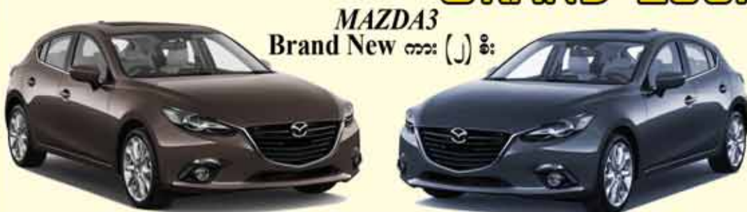
MAZDA3 Brand New ကား (၂) စီး