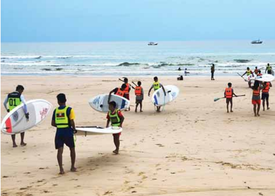
ငွေဆောင်ကမ်းခြေဒေသရှိ ကလေးငယ်တို့အတွက် မျှော်လင့်ချက်ကို ပုံဖော်သူများ။