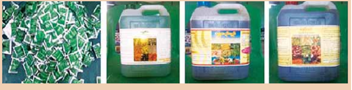
ရွှေစိမ်း(ထုပ်) ရွှေစိမ်း(ပုံး) ရွှေဆည်ရည်(ပုံး) ရွှေပိုးနှင့်(ပုံး)

ရွှေစိမ်း၊ ရွှေဆည်ရည်၊ ရွှေပိုးနှင့်ထုတ်လုပ်ရေးလုပ်ငန်း