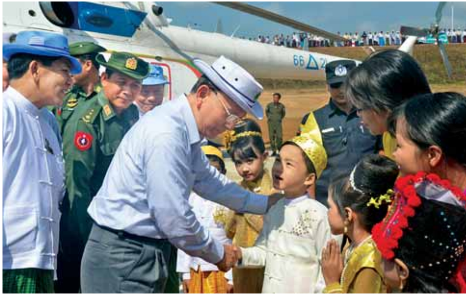
နိုင်ငံတော်သမ္မတ ဦးသိန်းစိန်အား မင်းရေလှောင်တံဆိပ်ဆု ခံယူနေကြောင်း မြင်ရပါသည်။ (သတင်းစဉ်)