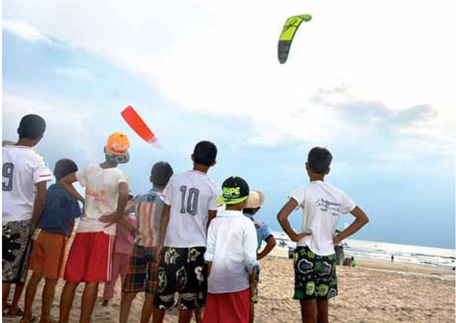
Kiteboarding ကလပ်ပြိုင်ပွဲဝင်ရန်အတွက် ပင်လယ်ပြင် စွန့်လွှတ်ကြသူများနှင့် ကလေးငယ်များ။