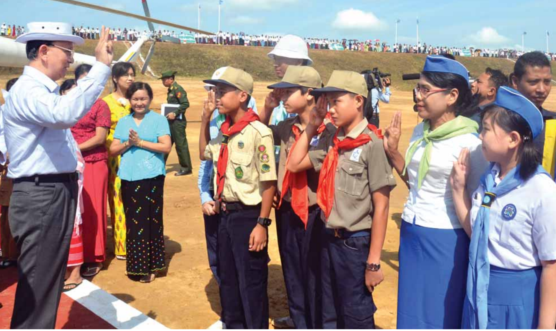
နိုင်ငံတော်သမ္မတ ဦးသိန်းစိန်အား မင်းရေလှောင်တံမံဆည်၌ ကင်းထောက်လူငယ်များက ကြိုဆိုနှုတ်ဆက်စဉ်။ (သတင်းစဉ်)