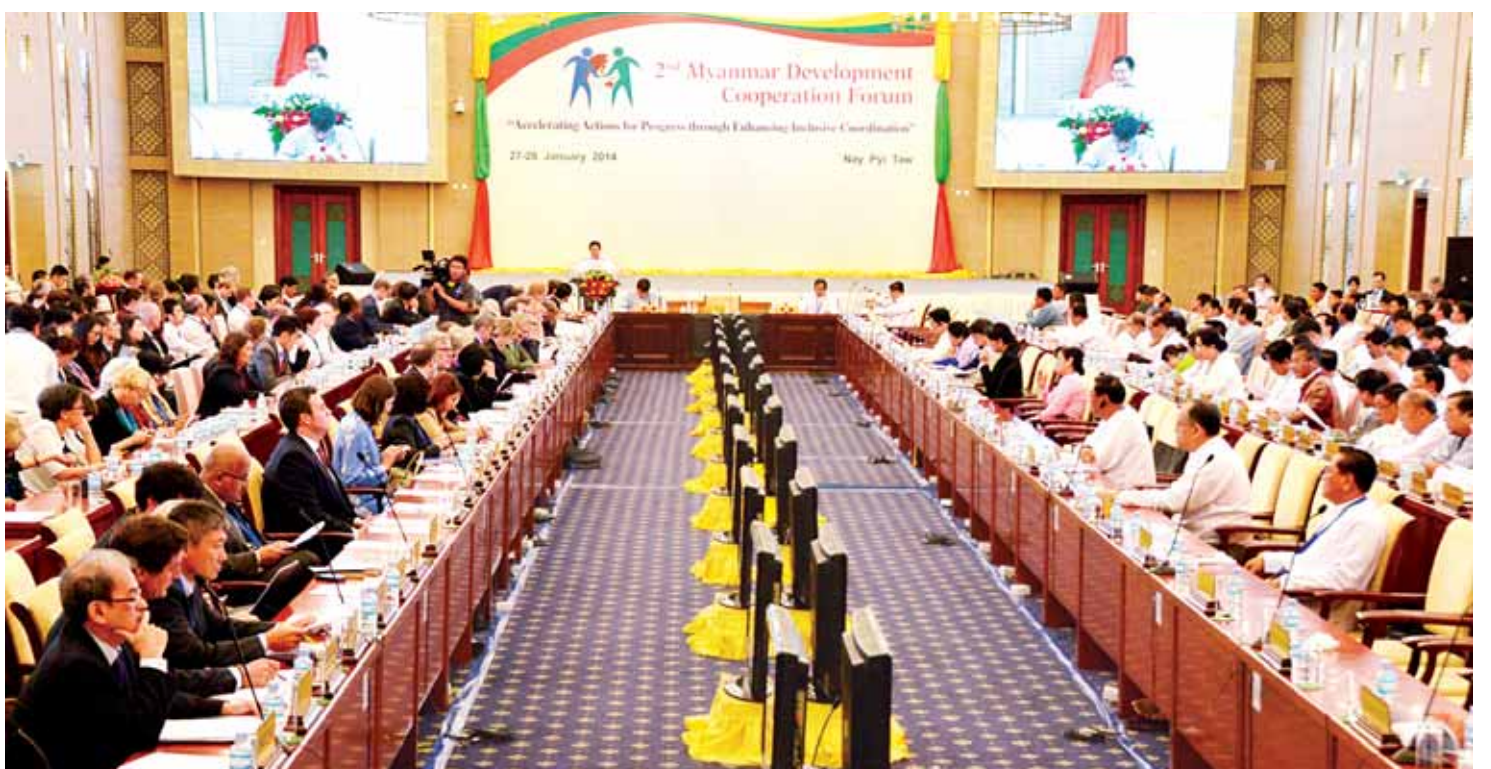
ဒုတိယအကြိမ် မြန်မာနိုင်ငံဖွံ့ဖြိုးတိုးတက်မှုပူးပေါင်းဆောင်ရွက်ရေးဖိုရမ်ကို ၂၀၁၄ ခုနှစ် ဇန်နဝါရီလက ကျင်းပခဲ့စဉ်။

၂၀၁၄ ခုနှစ် ဇန်နဝါရီ ၂၇ ရက်နှင့် ၂၈ ရက်တို့တွင် ဒုတိယအကြိမ် မြန်မာဖွံ့ဖြိုး တိုးတက်မှု ပူးပေါင်းဆောင်ရွက်ရေးဖိုရမ်၊ ၂၀၁၅ ခုနှစ် ဖေဖော်ဝါရီ ၇ ရက်နှင့် ၈ ရက် တို့တွင် တတိယအကြိမ် မြန်မာဖွံ့ဖြိုးတိုးတက်မှု ပူးပေါင်းဆောင်ရွက်ရေးဖိုရမ်တို့ကို ဦးဆောင် ကျင်းပကာ ဖွံ့ဖြိုးမှုမိတ်ဖက်များနှင့် ပူးပေါင်း ဆောင်ရွက်မှုများ ရေရှည်မြှင့်တင်နိုင်ရေးနှင့် ဦးစားပေးလုပ်ငန်းစဉ်များ ညှိနှိုင်းရေးအတွက် မြန်မာနိုင်ငံအစိုးရနှင့် ဖွံ့ဖြိုးမှုမိတ်ဖက်များ အကြား ယုံကြည်မှု၊ နားလည်မှုတို့ကို မြှင့်တင် နိုင်ခဲ့သည်။ စာမျက်နှာ ၃ သို့ >>>