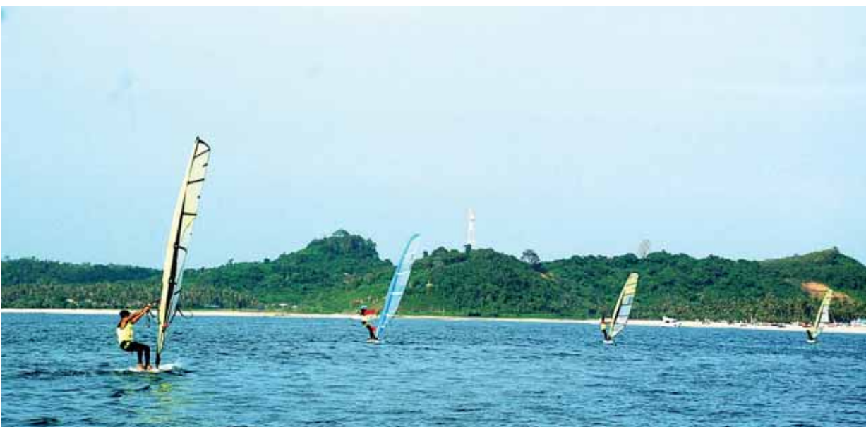
ငွေဆောင်ကမ်းခြေတွင် ပြုလုပ်သည့် Windsurfing ရွက်လှေပြိုင်ပွဲ မြင်ကွင်းပုံရိပ်များ။

မြန်မာနိုင်ငံ၏ ခရီးသွားလုပ်ငန်း ဖွံ့ဖြိုးတိုးတက်မှုကို အထောက်အကူပြုစေရန်နှင့် မြန်မာ့ရွက်လှေအားကစား မြှင့်တင်ပေးရန်အတွက် အောက်တိုဘာ ၂၈ ရက်မှ ၃၁ ရက်အထိ ပုသိမ်ခရိုင် ငွေဆောင်ကမ်းခြေတွင် Myanmar Wave Rider Cup and KTA Race Open 2015 ပြိုင်ပွဲများကို ကျင်းပလျက်ရှိရာ ငွေဆောင်ကမ်းခြေအလှနှင့် ရွက်လှေအားကစားပြိုင်ပွဲများ၊ ဒေသခံကလေးငယ်တို့၏ ပုံရိပ်မြင်ကွင်းများ၏ မှတ်တမ်းဓာတ်ပုံများအား ကြည့်နူးဖွယ်ခရီးသွားမြင်ကွင်းအဖြစ် ဖော်ပြအပ်ပါသည်။