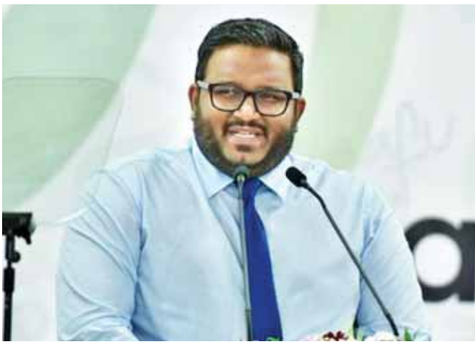
မော်လဒိုက် ဒုတိယသမ္မတ အာမက်အိဒ်ဟိတ်အား တွေ့ရစဉ်။

ပေါက်ကွဲမှုဖြစ်ပွားပြီး အရေးကြီးပုဂ္ဂိုလ်များအတွက် လုံခြုံရေးခြောက်လှန့်မှုတစ်ရပ် ဖြစ်ပွားနေစဉ် အောက်တိုဘာ ၁၄ ရက်တွင် သမ္မတ အဗ္ဗဒူလာယာမန်းက ကာကွယ်ရေးဝန်ကြီး မိုဆာအလီဂျာလယ်အား ထုတ်ပယ်ပြီးနောက် ဒုသမ္မတအာမက်အား ဖမ်းဆီးခဲ့ခြင်းဖြစ်သည်။ ယင်းဖြစ်ရပ်ဖြစ်ပွားပြီးနောက် အခြားစစ်ဘက်ဆိုင်ရာတာဝန်ရှိသူ နှစ်ဦးကို ချက်ချင်းဖမ်းဆီးခဲ့ကြောင်းသိရသည်။ ဒုသမ္မတအာမက်နှင့်အတူ မော်လဒိုက် အမျိုးသားကာကွယ်ရေးတပ်ဖွဲ့ (MNDF)မှ တာဝန်ရှိသူသုံးဦးကိုလည်း ဖမ်းဆီးခဲ့ကြောင်း ရဲတပ်ဖွဲ့ကဆိုသည်။ ဒုသမ္မတအာမက်မှာ တရုတ်နိုင်ငံ၌ကျင်းပသော ညီလာခံတက်ရောက်ပြီးပြန်လာစဉ် လေဆိပ်၌အဖမ်းခံခဲ့ရခြင်းဖြစ်သည်။ အာမက်သည် ပြည်ပတွင်နေထိုင်ရန် တိုင်းပြည်မှထွက်ခွာသွားခြင်းဖြစ်ကြောင်း ဒေသန္တရ မီဒီယာ အချို့ကထင်ကြေးပေးခဲ့ကြသော်လည်း တိုင်းပြည်သို့ ပြန်လာမည်ဖြစ်ကြောင်း ၎င်းက