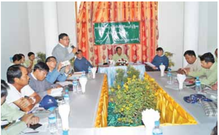
သွားလုပ်ငန်းများ အဆင်ပြေချောမွေ့စေရန် ခရီးသွားဧည့်သည်များ၊ ဌာနအသီးသီးမှ တာဝန်ရှိသူများ၊ ဟိုတယ်လုပ်ငန်းရှင်များ၊ ဒေသခံပြည်သူများက ပေါင်းစပ်ညှိနှိုင်း

တို့ကို ရှင်းလင်းပြောကြားပြီး ချောင်းသာ ဟိုတယ်ဇုန်လုပ်ငန်းရှင်များ၊ အသိပညာရှင် အတတ်ပညာရှင်များ၊ ချောင်းသာကျေးရွာ ဒေသခံတို့မှ ချောင်းသာကမ်းခြေ စည်းကမ်း ထိန်းသိမ်းရေးနှင့် သန့်ရှင်းသာယာလှပရေး တို့အတွက် ပထမလုပ်ငန်းစဉ်အဖြစ် အောက်တိုဘာ ၂၃ ရက်မှ နိုဝင်ဘာ ၂၃ ရက်အထိ ဟောပြောပွဲများ လက်ကမ်း စာစောင်များဖြင့် အသိပေးဆောင်ရွက် သွားမည်ဖြစ်ပြီး မလိုက်နာပါက ဒုတိယ အဆင့်အနေဖြင့် ပြစ်ဒဏ်များ ဥပဒေနှင့် အညီ အရေးယူဆောင်ရွက်သွားမည်ဖြစ် ကြောင်းနှင့်သာယာလှပသော ချောင်းသာ ကမ်းခြေရေရှည်ထိန်းသိမ်းသွားနိုင်ရန်၊ ခရီး