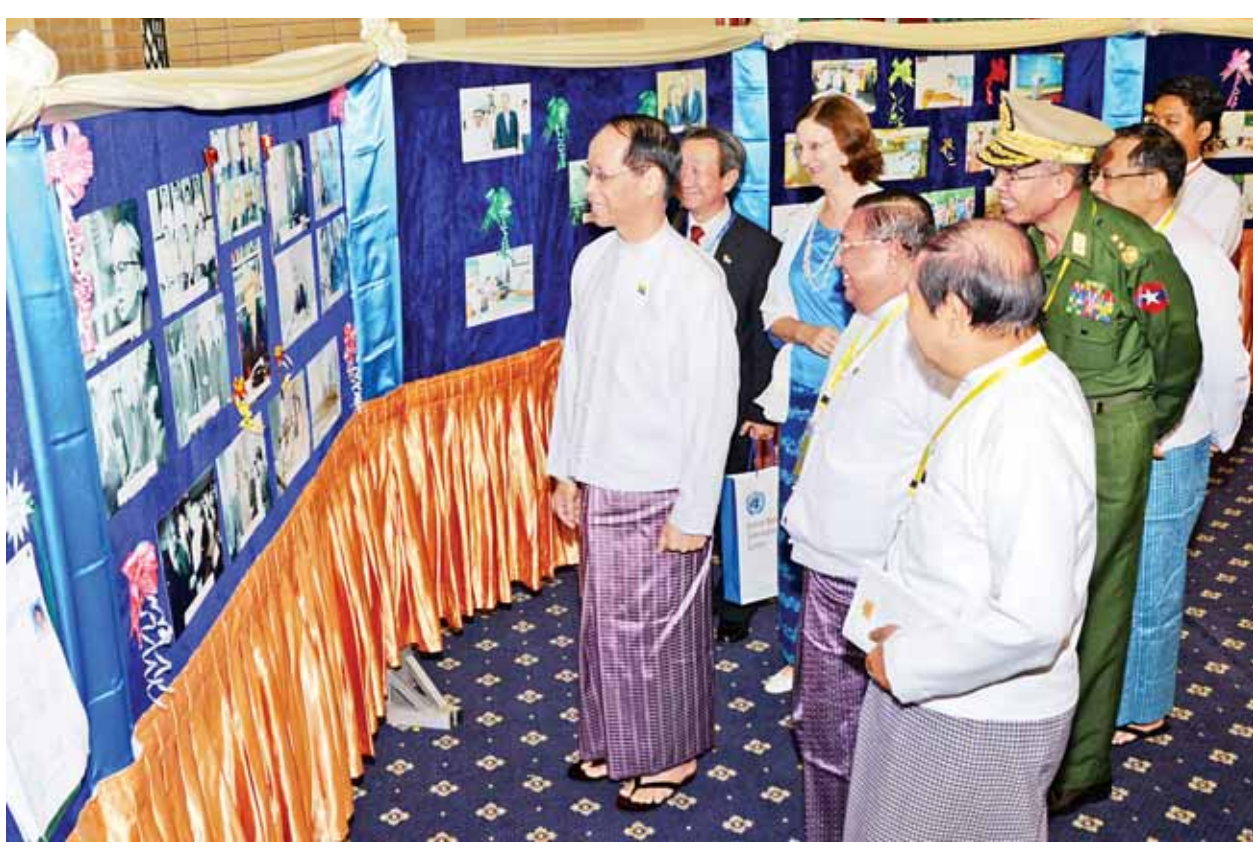
ဒုတိယသမ္မတ ဒေါက်တာစိုင်းမောင်ခမ်း ခင်းကျင်းပြသထားသော ဓာတ်ပုံပြခန်းအား လှည့်လည်ကြည့်ရှုအားပေးစဉ်။ (သတင်းစဉ်)

မိမိတို့နိုင်ငံအနေဖြင့် မြန်မာနိုင်ငံရှိ ကုလသမဂ္ဂဌာနအဖွဲ့သည် မြန်မာနိုင်ငံအတွက် ယုံကြည်အားထားရမည့်အဖွဲ့အဖြစ် မိမိတို့ အသိအမှတ်ပြုပြီး ယင်းသို့ နိုင်ငံတကာတွင် ပြည်သူ့ဝန်ဆောင်မှုများကို အကောင်းဆုံးစံနမူနာကြိုးပမ်းဆောင်ရွက်နေသည့် ကုလသမဂ္ဂဝန်ထမ်းများအား အိမ်ရှင်နိုင်ငံအနေ