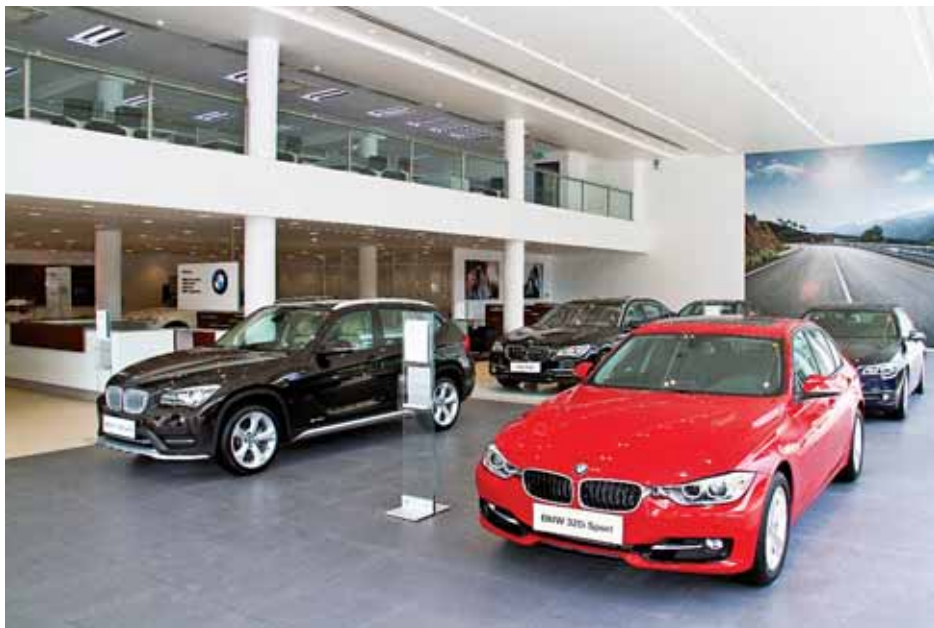
သွင်းကုန်လိုင်စင်ဖြင့် တင်သွင်းခဲ့သော ခေတ်ပေါ်ယာဉ်များကို ရန်ကုန်မြို့ BMW ကားအရောင်းပြခန်းတွင် ပြသထားစဉ်။

၂၀၁၁ ရက်နေ့မှစ၍ လုပ်ငန်းခွင်တွင် အမှန်တကယ်အသုံးပြုရန် လိုအပ် သည့် အရေအတွက်ကို အကန့် အသတ်မရှိ တင်သွင်းခွင့်ပြုခဲ့သည်။ ၂၀၁၅ ခုနှစ် ပြက္ခဒိန်နှစ်အတွင်း အရ လူစီးမော်တော်ယာဉ်များ၊ လုပ်ငန်းသုံးယာဉ်များနှင့် ယန္တရား ယာဉ်များ တင်သွင်းခွင့်ကို ယာဉ် အမျိုးအစားအလိုက် သတ်မှတ်ခဲ့ သည်။