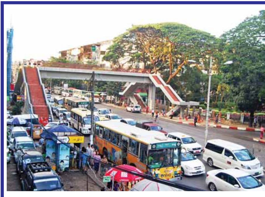
ပညာရေး၊ စီးပွားရေးအချက်အချာ ကျပြီး လူသွား၊ ယာဉ်သွား များပြား ရှုပ်ထွေးလှသည့် ရန်ကုန်မြို့ ကမာရွတ် မြို့နယ် လှည်းတန်းစီးပွိုင့်အနီးရှိ အင်းစိန် ယာဉ်သွားလမ်းမကြီးကို ဖြတ်ပြီး ရန်ကုန်မြို့တော်စည်ပင် သာယာရေးကော်မတီ အနောက်ပိုင်း ခရိုင် အင်ဂျင်နီယာဌာန (လမ်းနှင့် တံတား)မှ တာဝန်ယူတည်ဆောက် လျက်ရှိသော လူသွားခွဲကျော်စက္ကီ တံတားသည် ၉၀ ရာခိုင်နှုန်းခန့်ပြီးစီး နေပြီဖြစ်၍ မကြာမီအချိန်တွင် အများ ပြည်သူတို့ ယာဉ်အန္တရာယ်ကင်းရှင်းပြီး စိတ်အေးချမ်းသာစွာ ဖြတ်သန်းသွား လာခွင့်ရရှိတော့မည် မြင်ကွင်းကို အောက်တိုဘာ ၂၃ ရက်က တွေ့ရ စဉ်။ မြင့်သန်းကြည်(ရွှေပြည်သာ)

မြင်းမူ အောက်တိုဘာ ၂၄ တောင်သူများသီးနှံပေါ်ချိန် ဝယ်ယူမှုများသော ကြက်အုပ်ဆောင်းကို ဝယ်ပြီး အပေါက်ကိုကျက်ပြားဖြင့်ပိတ်ကာ သီးနှံထည့်၍ သယ်ယူကြသည်။ ကြက်၊ ဘဲ အစရှိသည့် အကောင်ပေါက်များ ကြောင့်၊ ခွေးရန်ကလွတ်ကင်းအောင် ဆောင်းဖြင့် အုပ်ပေးထားရသည်။ “ကြက်အုပ်ဆောင်းပြုလုပ်ရာတွင် အဓိကကုန်ကြမ်းမှာ တင်းဝါးဖြစ်ပါ တယ်။ တင်းဝါးဝယ်ယူရာတွင် သေချာကြည့်ပြီး ရွေးရပါတယ်။ ဝါးက ရေထဲ အကြာကြီးထားထားတော့ ရေနာပြီး နေပူထဲထောင်ထားတဲ့ဝါးမျိုးမဖြစ်စေ ရပါဘူး။ ဝါးကိုထက်ခြမ်းခွဲစိတ်ကာ ဆောင်းအကြီးနဲ့အသေးဆိုပြီး နှစ်မျိုး ရက်ပါတယ်။ အကြီးရက်မယ်ဆိုရင် အတိုင်ပင်က သုံးတောင်တစ်ထွာ၊ အသေး ရက်မယ်ဆိုရင် အတိုင်ပင်က သုံးတောင်လက်နှစ်လုံး ဖြတ်တောက်ခွာ၊ အကြောပင်ကိုယူပြီး အုပ်ပင်အချောင်းတစ်ရာကို ကျပ်တစ်ထောင်နဲ့ ရောင်းရပါ တယ်။ ဆောင်းရက်တဲ့အခါ အုပ်ပင်ထည့်မရက်ပါဘူး။ ပတ်ရက်မယ့် အကြောပင် က ဝါးတစ်ဆုံးပါ။ ဆောင်းရက်တော့မယ်ဆိုရင် နွှာထားတဲ့အကြောပင်တွေကို ရေဆွတ်ထားရတယ်။ တစ်ရက်ကို တကယ်လုပ်မယ်ဆိုရင် အကြီး နှစ်လုံး၊ အသေးနှစ်လုံး ပြီးပါတယ်။ ဝါးတစ်လုံးကို ကျပ်တစ်ထောင်ပေးရပါတယ်။ ဆောင်းအကြီးရက်မယ်ဆိုရင် ဝါးသုံးလုံးကုန်ပါတယ်။ ဆောင်းအသေးရက်မယ် ဆိုရင် ဝါးနှစ်လုံးကုန်ပါတယ်။ ဆောင်းအကြီးတစ်လုံးကို ကျပ်ငါးထောင်၊ အသေးတစ်လုံး ကျပ်သုံးထောင်ငါးရာ ရောင်းရပါတယ်။ အကြီးတစ်လုံးရောင်း ရရင် ကျပ်နှစ်ထောင်မြတ်ပါတယ်။ အသေးတစ်လုံးရောင်းရရင် ကျပ်တစ်ထောင် ငါးရာ မြတ်ပါတယ်။ နေ့တွက်ပါပဲ။ ဒါကျွန်တော်က အော်ဒါရက်တာ။ ရောင်းတန်းက ဒီလောက်မတောင့်ဘူး”ဟု ဆောင်းရက်လုပ်သူ ဦးသက်ဝေက ပြောသည်။ (၆၂၄)