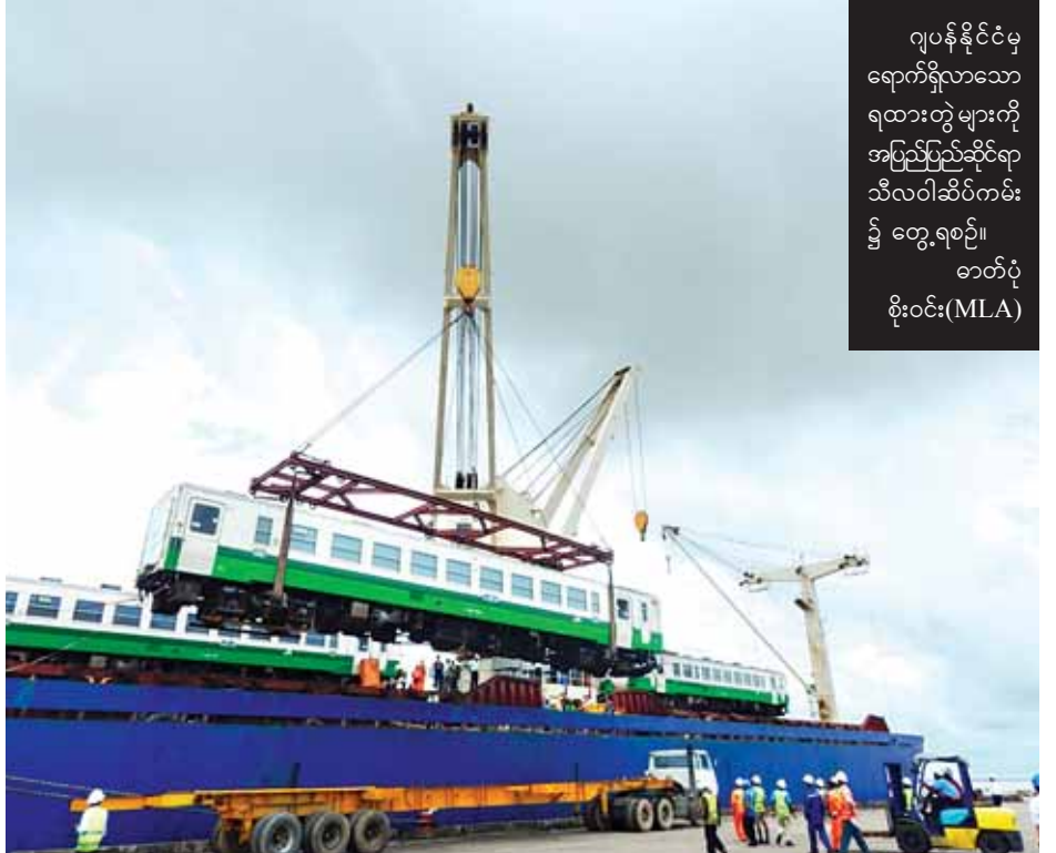
ဂျပန်နိုင်ငံမှ ရောက်ရှိလာသော ရထားတွဲများကို အပြည်ပြည်ဆိုင်ရာ သီလဝါဆိပ်ကမ်း၌ တွေ့ရစဉ်။

ရထားပို့ဆောင်ရေးဝန်ကြီးဌာနသည် ချမှတ်ထားသည့်မူဝါဒများနှင့် ရည်မှန်းချက်များအတိုင်း အကောင်အထည်ဖော်ဆောင်ရွက်လျက်ရှိသည့် လုပ်ငန်းစဉ်များကို စဉ်ဆက်မပြတ် ပြန်လည်သုံးသပ်၍ ထိရောက်အောင် မြင်မှုရရှိနိုင်မည့် နည်းလမ်းများဖြင့် ကြိုးပမ်း အကောင်အထည်ဖော်ဆောင်ရွက်လျက်ရှိကြောင်း ရေးသားတင်ပြလိုက်ရပါသည်။ ။