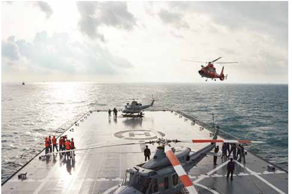
ဝန်ကြီး လူဟက်ပန်ဂျေတန်က ပြောကြားသည်။ ဗိုလ်ချုပ်ကြီးဟောင်းတစ်ဦးဖြစ်သူ ပန်ဂျေတန်သည် မီးခိုးမြူသနာကို ကိုင်တွယ်ဆောင်ရွက်ရာတွင် လုပ်ငန်း

လေထုညစ်ညမ်းမှုအခြေအနေကို ထိန်းချုပ်နိုင်ရန် မိမိတို့ အစွမ်းကုန်ကြိုးပမ်းလျက်ရှိပြီး နောက်ဆုံးနည်းလမ်းတစ်ရပ်အဖြစ် ကလေးများနှင့်ဒေသခံများအား လေသန့်စင်စက်တပ်ဆင်ထားသော အစိုးရရုံးအဆောက်အအုံများသို့ စစ်သင်္ဘောများ အသုံးပြု၍ ရွှေ့ပြောင်းပေးရန်အထိပင် စီမံချက်ရေးဆွဲထားကြောင်း လုံခြုံရေးဆိုင်ရာညွှန်ကြားရေး