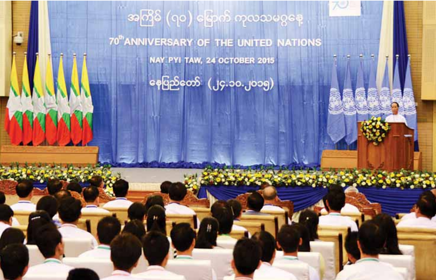
စာမျက်နှာ ၈ ကော်လံ ၁ သို့ ၁၆

နေပြည်တော် အောက်တိုဘာ ၂၄ ပြည်ထောင်စုသမ္မတမြန်မာနိုင်ငံတော် ဒုတိယသမ္မတ ဒေါက်တာစိုင်းမောက်ခမ်းသည် ယနေ့နံနက် ၁၀ နာရီတွင် နေပြည်တော်ရှိ မြန်မာအပြည်ပြည်ဆိုင်ရာကွန်ဗင်းရှင်း ဗဟိုဌာန-၂ (MICC-2)၌ ကျင်းပသည့် အကြိမ်(၇၀) မြောက် ကုလသမဂ္ဂနေ့အခမ်းအနားသို့ တက်ရောက်၍ အမှာစကားပြောကြားသည်။ (ယာဝု) အခမ်းအနားသို့ ဒုတိယသမ္မတနှင့်အတူ ပြည်ထောင်စုဝန်ကြီးများ၊ ဒုတိယဝန်ကြီးများ၊ ကုလသမဂ္ဂ အဖွဲ့အစည်းများမှ တာဝန်ရှိသူများ၊ ကျောင်းသား ကျောင်းသူများနှင့် ဆရာ ဆရာမများ၊ ဖိတ်ကြားထား သူများ တက်ရောက်ကြသည်။ ရှေးဦးစွာ ဒုတိယသမ္မတက အမှာစကားပြောကြား ရာတွင် ကုလသမဂ္ဂအဖွဲ့ကြီး၏ မိသားစုဝင်နိုင်ငံတစ်နိုင်ငံ အနေဖြင့် အဖွဲ့ကြီး၏ အောင်မြင်မှုများအတွက် များစွာ ဂုဏ်ယူဝမ်းမြောက်ပါကြောင်း၊ ၁၉၄၅ ခုနှစ်၊ ယနေ့ကဲ့သို့ အချိန်မျိုးတွင် ကုလသမဂ္ဂပဋိညာဉ်ကို ကနဦးအဖွဲ့ဝင် ၅၁ နိုင်ငံက ပါဝင်လက်မှတ်ရေးထိုးခဲ့တဲ့အချိန်မှစ၍ ကုလ သမဂ္ဂအဖွဲ့ကြီး တရားဝင် ပေါ်ပေါက်လာခဲ့ပါကြောင်း၊ မြန်မာနိုင်ငံသည် ကုလသမဂ္ဂ၏ ငြိမ်းချမ်းရေးနှင့် ဖွံ့ဖြိုး တိုးတက်ရေး၊ ယုံကြည်မှုနှင့် မျှော်မှန်းမှုဆိုင်ရာ မူဝါဒများ အပေါ် ကတိကဝတ်ပြုလျက် ၁၉၄၈ ခုနှစ်တွင် ၅၈ နိုင်ငံ မြောက် အဖွဲ့ဝင်အဖြစ် ကုလသမဂ္ဂသို့ ဝင်ရောက်ခဲ့ပါ ကြောင်း။