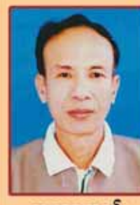
ဆရာသောင်း (ရမည်းသင်း)

Hot Line No-0930500100 www.facebook.com/themirroronline www.facebook.com/theirrordaily www.facebook.com/theirrordaily