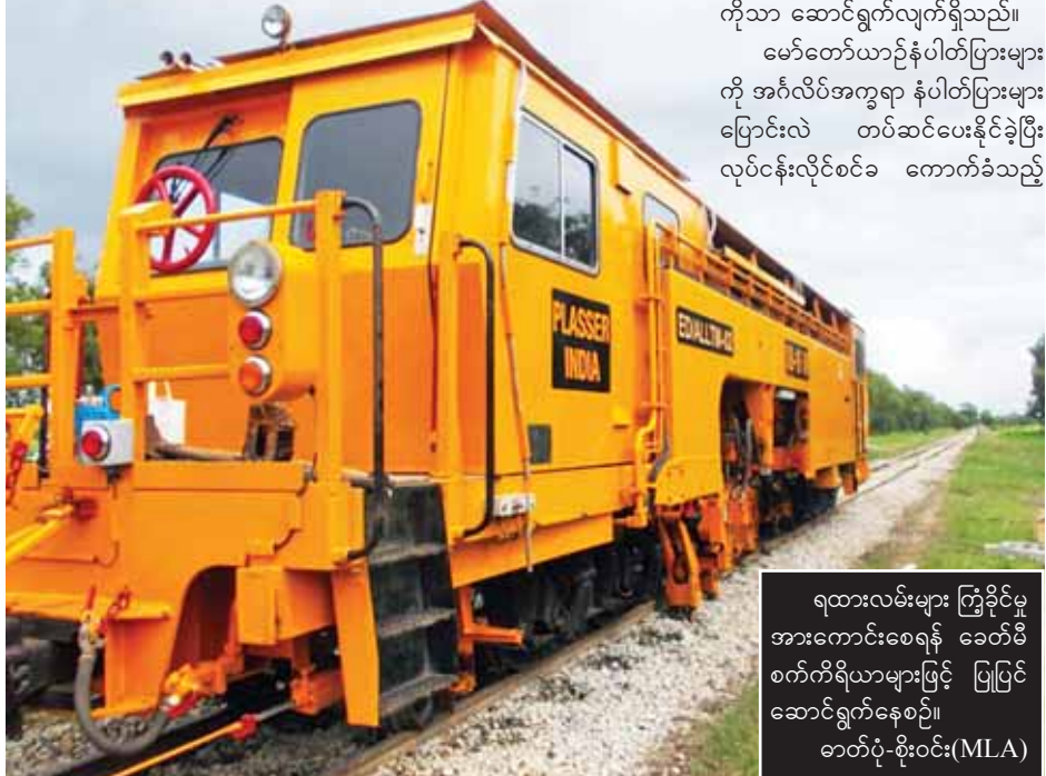
ရထားလမ်းများ ကြံ့ခိုင်မှုအားကောင်းစေရန် ခေတ်မီစက်ကိရိယာများဖြင့် ပြုပြင်ဆောင်ရွက်နေစဉ်။

လျှပ်စစ်ဆိုင်ကယ်၊ လျှပ်စစ်သုံးဘီးဆိုင်ကယ်များ အကွရာပြောင်းလဲသတ်မှတ်ခဲ့သည်။ မူဝါဒအမှတ်ရယူပြီး ကနဦးယာဉ်စစ်ဆေးသည့်နှင့်တစ်ပြိုင်နက် ဖောင်းကြွနံပါတ်ပြားကို တပ်ဆင်ပေးလျက်