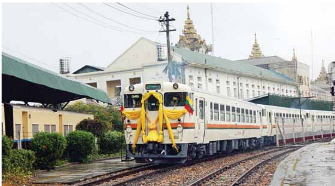
စိစိတီတိုက်မရာတပ်ဆင်ပြီးဆွဲလျက်ရှိသည့် ရန်ကုန်မြို့ပတ်လမ်းပိုင်း “(က)အထူးရထား” တွဲဆိုင်းအသစ် အား တွေ့ရစဉ်။

ရထားတွဲဆိုင်း ၂၅ ဆိုင်း ခေါက်ရေ ၂၂၅ ခေါက် ၇-၁၂-၂၀၁၄ ရက်နေ့မှစ၍ ကမ်းနားလမ်းတစ်လျှောက် ပုလွန်တောင်-ပန်းဆိုးတန်း-ထော်လီကျွေ အထိ RBE ရထားစတင်ပြေးဆွဲခဲ့သည်။