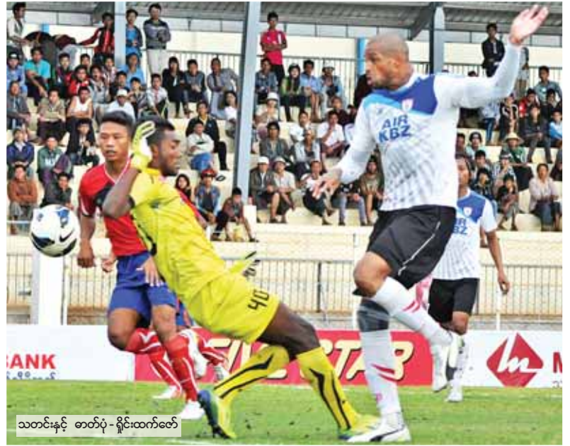
သတင်းနှင့် ဓာတ်ပုံ - ရှိမ်းထက်လတ်