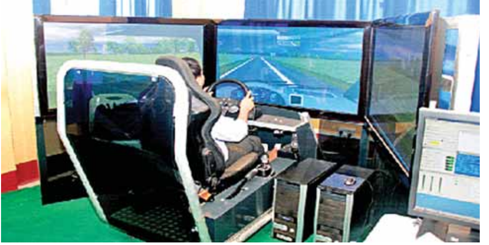
ယာဉ်မောင်းလိုင်စင်လျှောက်ထားသူများအား Simulator အသုံးပြုစေပြီး ယာဉ်မောင်းကျွမ်းကျင်မှုကို ဤသို့စစ်ဆေးလျက်ရှိ။

ယာဉ်ပိုင်ရှင်များ အဆင်ပြေချောမွေ့စေရေးအတွက် Road Safety မထိခိုက်စေသော Extra Accessories များ ပြောင်းလဲတပ်ဆင်ခြင်းကို ခွင့်ပြုပေးလျက်ရှိသည်။