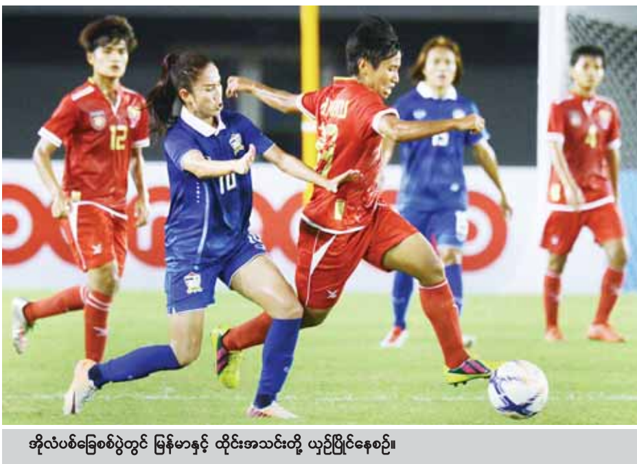
အိုလံပစ်ခြေစစ်ပွဲတွင် မြန်မာနှင့် ထိုင်းအသင်းတို့ ယှဉ်ပြိုင်နေစဉ်။