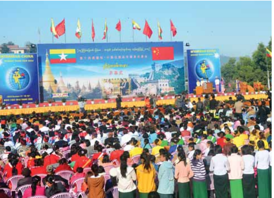
မူဆယ်မြို့တွင် ကျင်းပခဲ့သည့် (၁၄)ကြိမ်မြောက် မြန်မာ-တရုတ် နယ်စပ်ကုန်သွယ်ရေးကုန်စည်ပြပွဲ။