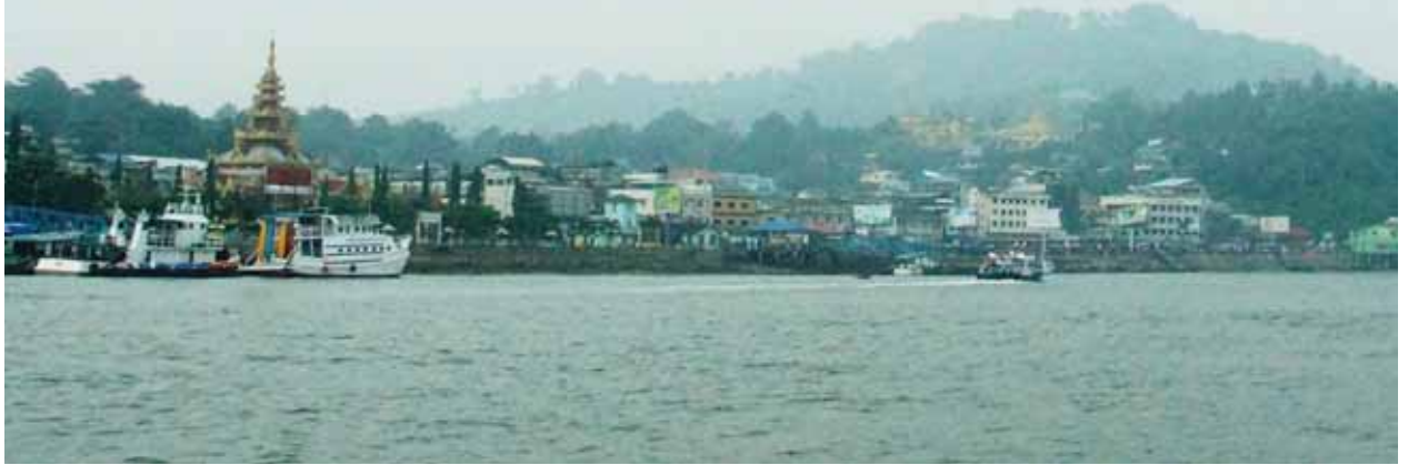
ကျေးသောင်းမြို့အနှံ့ မီးခိုးမိုးတိမ်ကဲ့သို့ ဖုံးလွှမ်းလျက်ရှိရာ ကျေးသောင်းမြို့အနီး အက်ဒမန်ပင်လယ်ပြင်အတွင်း မြင်နိုင်စွမ်း ရေမိုင် တစ်မိုင်အောက်ဖြစ်ရာ ယခင်အကြိမ် ဖုံးလွှမ်းမှုထက် ပိုမိုဆိုးရွားကြောင်း သိရသည်။ မြို့နေပြည်သူများ ကျန်းမာရေးထိခိုက်နိုင်သဖြင့် သက်ကြီးရွယ်အိုများ၊

ကလေးသူငယ်များ၊ ပြင်ပတွင် အလုပ်လုပ်ကိုင်သူများ ကျန်းမာရေးအသိ သတိပြုနေထိုင်ကြရေး ဒေသတာဝန်ရှိအဖွဲ့အစည်းများက အသိပေးနိုးဆော်မှု များ ပြုလုပ်လျက်ရှိကြောင်း သိရသည်။