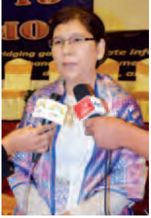
ဒေါက်တာဟာရင်နိုင်တီယမ်း။

သပ်တယ်။ နောက်တစ်ခါ မေလပြန် ရောက်ရင် ဆောင်းကာလမှာ ပြီးခဲ့တဲ့ focusတွေ ဘယ်လောက်မှန်ကန်မှု ရှိလဲ၊ sector အသီးသီးမှာ သူတို့ ဘယ်လိုအသုံးပြုခဲ့လဲဆိုတာ ကဏ္ဍအသီး သီးကလည်း ပြန်ပြီးတင်ပြပေးတယ်။ သူတို့ တင်ပြချက်တွေ အားနည်းချက် အားသာချက်တွေကိုလည်း ပြန်ပြီး တော့ သုံးသပ်ပါတယ်။ ဆောင်းကာလ မှာ ဖြစ်နိုင်တဲ့ ရာသီဥတုအပြင်