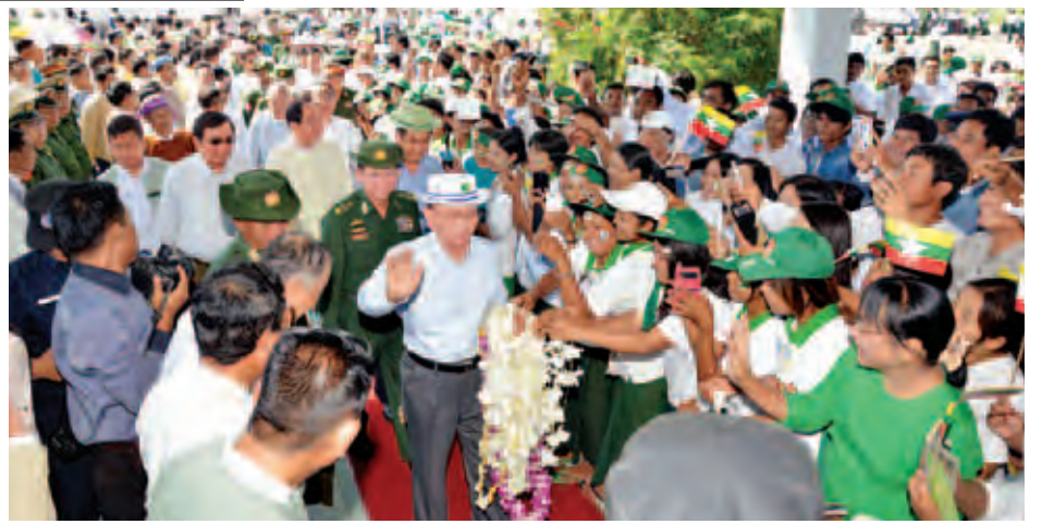
အောက်တိုဘာ ၂၁ ရက်က မုံရွာမြို့သို့ ရောက်ရှိလာသော နိုင်ငံတော်သမ္မတ ဦးသိန်းစိန်အား ဒေသခံများက ကြိုဆိုနှုတ်ဆက်စဉ်။