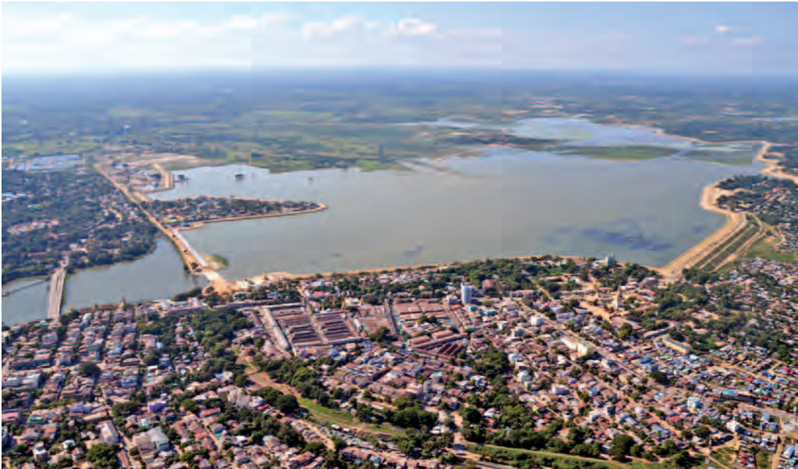
မိတ္ထီလာကန်အား ဝေဟင်မှ တွေ့ရစဉ်။ (သတင်း- ရွှေဖုံး) (သတင်းစဉ်)