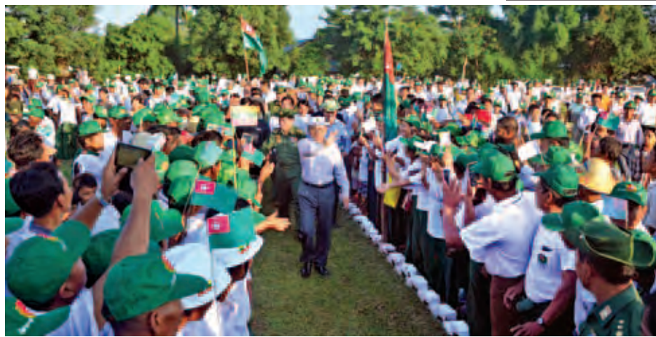
အောက်တိုဘာ ၂၁ ရက်က ကောလင်းမြို့သို့ရောက်ရှိလာသော နိုင်ငံတော်သမ္မတ ဦးသိန်းစိန်အား ဒေသခံများက ကြိုဆိုနှုတ်ဆက်စဉ်။