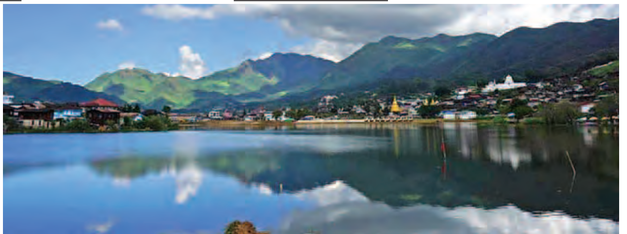
မိုးကုတ်မြို့လယ်အင်း(မုံကွင်း)အား အောက်တိုဘာ ၂၂ ရက်က လှပရှုမောဖွယ် တွေ့မြင်ရစဉ်။