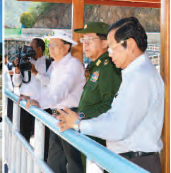
နိုင်ငံတော်သမ္မတ ဦးသိန်းစိန် မြို့ကြီးရေလျှောင့်တံစင်ဘက်စုံစီမံကိန်း ရှိ ပင်မရေလျှောင့်တံစင် တည်ဆောက်ပြီးစီးမှုကို ကြည့်ရှုစစ်ဆေးစဉ်။ (သတင်းစဉ်)

ဘက်စုံစီမံကိန်းတွင် ပူးပေါင်းဆောင်ရွက်လျက်ရှိသည့် တရုတ်ပြည်သူ့သမ္မတ နိုင်ငံ YMEC ကုမ္ပဏီမှ ပညာရှင်များအား သစ်သီးခြင်း လက်ဆောင်ပေးအပ် သည်။ ထို့နောက် နိုင်ငံတော်သမ္မတ၊ တပ်မတော်ကာကွယ်ရေးဦးစီးချုပ်နှင့် အဖွဲ့သည် မော်တော်ယာဉ်များဖြင့် မြို့ကြီးပင်မရေလျှောင့်တံစင်အပေါ်သို့ ရောက်ရှိကြပြီး ရေယူအဆောက်အအုံ တည်ဆောက်ပြီးစီးမှုနှင့် ရေဝင်ရောက်မှု