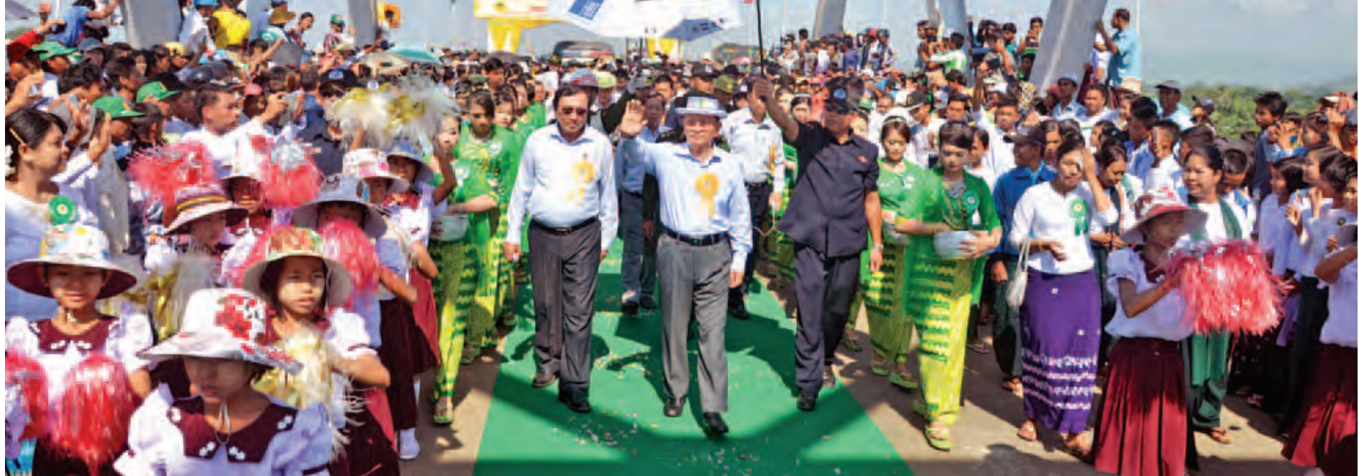
အောက်တိုဘာ ၂၂ ရက်က ကျင်းပသော ထီးချိုင့်တားဖွင့်ပွဲတွင် နိုင်ငံတော်သမ္မတ ဦးသိန်းစိန်အား ဒေသခံပြည်သူများက ကြိုဆိုနှုတ်ဆက်စဉ်။