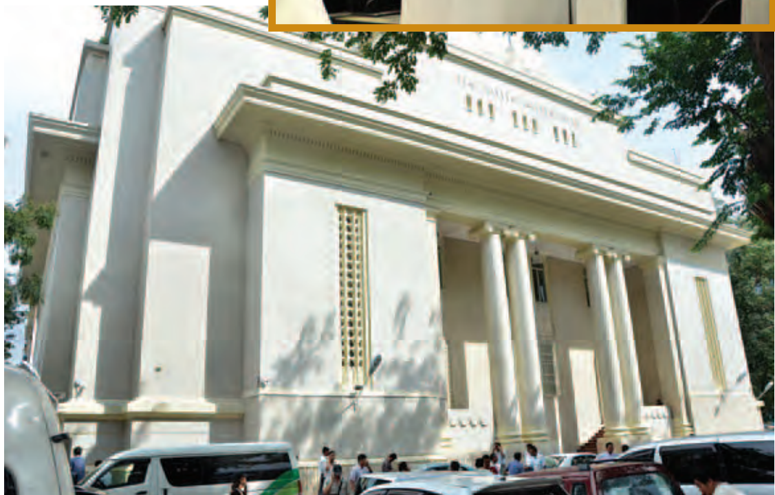
၂၀၁၅ ခုနှစ် ဒီဇင်ဘာလတွင် ဖွင့်လှစ်ရန်ဆောင်ရွက်လျက်ရှိသည့် ရန်ကုန်စတော့အိတ်ချိန်းအဆောက်အအုံ။

နိုင်ငံတကာနဲ့ ရင်ပေါင်တန်းတဲ့အထိ စီးပွားရေးအောင်မြင်မှုကိုရဖို့ မှန်ကန်တဲ့ ငွေကြေးဈေးကွက်နဲ့ အာမခံချက်ရှိတဲ့ ဘဏ်စနစ်တွေရှိလာဖို့ လိုအပ်ပါတယ်။ လက်ရှိမှာ မြန်မာ့စီးပွားရေးကို ဦးဆောင်မယ့် ငွေကြေးဈေးကွက်က မြန်မာ့ငွေကြေးတန်ဖိုး ကျဆင်းနေတာတွေရှိပါတယ်။ သို့သော် သွင်းကုန်နဲ့ ထွက်ကုန်သာ မျှတလာမယ်၊ ဘဏ်တွေရဲ့ ငွေကြေးလည်ပတ်မှုတွေ အားကောင်းလာမယ် ဆိုရင် မြန်မာ့ငွေကြေးက မြင့်မားလာမယ့်အနေအထား ရှိပါတယ်။