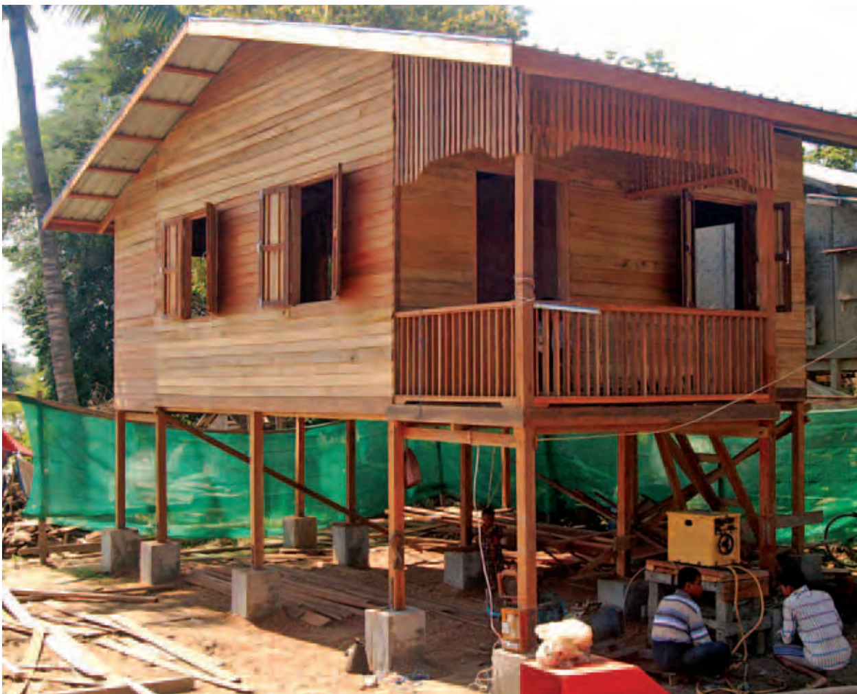
ကလေးမြို့နယ် ပြင်သာကျေးရွာတွင် ရေကြီးနစ်မြုပ်မှုများကြောင့် ပျက်စီးသွားသော အိမ်ထောင်စုများအတွက် ပြန်လည်တည်ဆောက်ပေးထား သော လုံးချင်းအိမ်ကို တွေ့ရစဉ်။ (သတင်းစဉ်)

ဟားခါး အောက်တိုဘာ ၂၃ ချင်းပြည်နယ် အစိုးရအဖွဲ့နှင့် ပြည်နယ်လွှတ်တော်အဆောက်အအုံ သစ်ဖွင့်ပွဲအခမ်းအနားကို ယနေ့ နံနက် ၈ နာရီခွဲတွင် အဆိုပါ အဆောက်အအုံသစ်ရှေ့မှက်နာစာ၌ ကျင်းပရာ ပြည်ထောင်စုဝန်ကြီး ဦးစိုးသိန်း၊ ဦးဝင်းထွန်း၊ ပြည်နယ် ဝန်ကြီးချုပ် ဦးဟုန်းဦးနှင့် ပြည်နယ် ဝန်ကြီးများ၊ ပြည်နယ်လွှတ်တော် ဥက္ကဋ္ဌနှင့် လွှတ်တော်ကိုယ်စားလှယ် များ၊ ပြည်နယ်ယဉ်ကျေးမှုအဖွဲ့ဝင်များ၊ လူမှုရေးအသင်းအဖွဲ့များနှင့် တာဝန် ရှိသူများ တက်ရောက်ကြပြီး စည်ကား သိုက်မြိုက်စွာဖွင့်လှစ်သည်။ ယင်းနောက် ပြည်ထောင်စုဝန်ကြီး များနှင့် အဖွဲ့ဝင်များသည် ဟားခါးမြို့ မြို့ကွက်သစ် ဖော်ထုတ်နေမှုများအား လှည့်လည်ကြည့်ရှုကြပြီး ရှင်းလင်း ဆောင်၌ မြို့သစ်တည်ဆောက်ရေး လုပ်ငန်းများ ဆောင်ရွက်လျက်ရှိသည့် ကုမ္ပဏီများ၊ တာဝန်ရှိသူများနှင့် တွေ့ဆုံသည်။ တွေ့ဆုံပွဲတွင် ပြည်နယ်ဝန်ကြီး ဦးဝင်းထွန်းအောင်က ဟားခါးမြို့သစ်၌ ဘေးသင့်ပြည်သူများ ပြန်လည်နေရာ ချထားရေး အစီအမံများကိုလည်း ကောင်း၊ ပြည်နယ်ဝန်ကြီးချုပ်က မြို့သစ်ထပ်မံတိုးချဲ့မည့် စီမံကိန်း ဆိုင်ရာများကို လည်းကောင်း၊ ပတ်ဝန်းကျင် ထိန်းသိမ်းရေးနှင့် စာမျက်နှာ ၅ ကော်လံ ၁ သို့ ❖