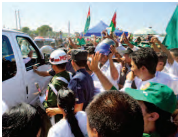
အောက်တိုဘာ ၂၃ ရက်က မိတ္ထီလာမြို့သို့ ရောက်ရှိလာသော နိုင်ငံတော်သမ္မတ ဦးသိန်းစိန်အား ဒေသခံပြည်သူများက ကြိုဆိုနှုတ်ဆက်စဉ်။ (YHT)