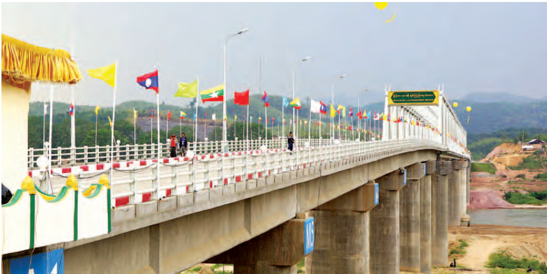
»» အထူးကဏ္ဍ အချုပ်ပို့ စာမျက်နှာ ၁ မှ