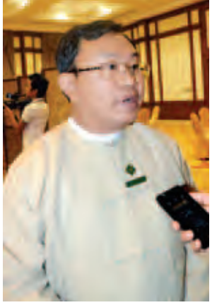
ဒေါက်တာအောင်သန်းဦး။

Multi-Hazard Early Warning System က Regional ဆိုတော့ အာရှဒေသတွေမှာ အဖွဲ့ဝင် ၁၄ နိုင်ငံမှာ ပါပါတယ်။ မြန်မာနဲ့ ပူးပေါင်း ဆောင်ရွက်တာကတော့ ၂၀၀၅ ကတည်းက ဖြစ်ပါတယ်။ အခုမှာတော့ Cooperation Agreement လက်မှတ်ရေးထိုးနိုင်ခဲ့တာ ဖြစ်ပါတယ်။ ကြိုတင်သတိပေးတဲ့ Earling Warning System စနစ်ကောင်းမွန်