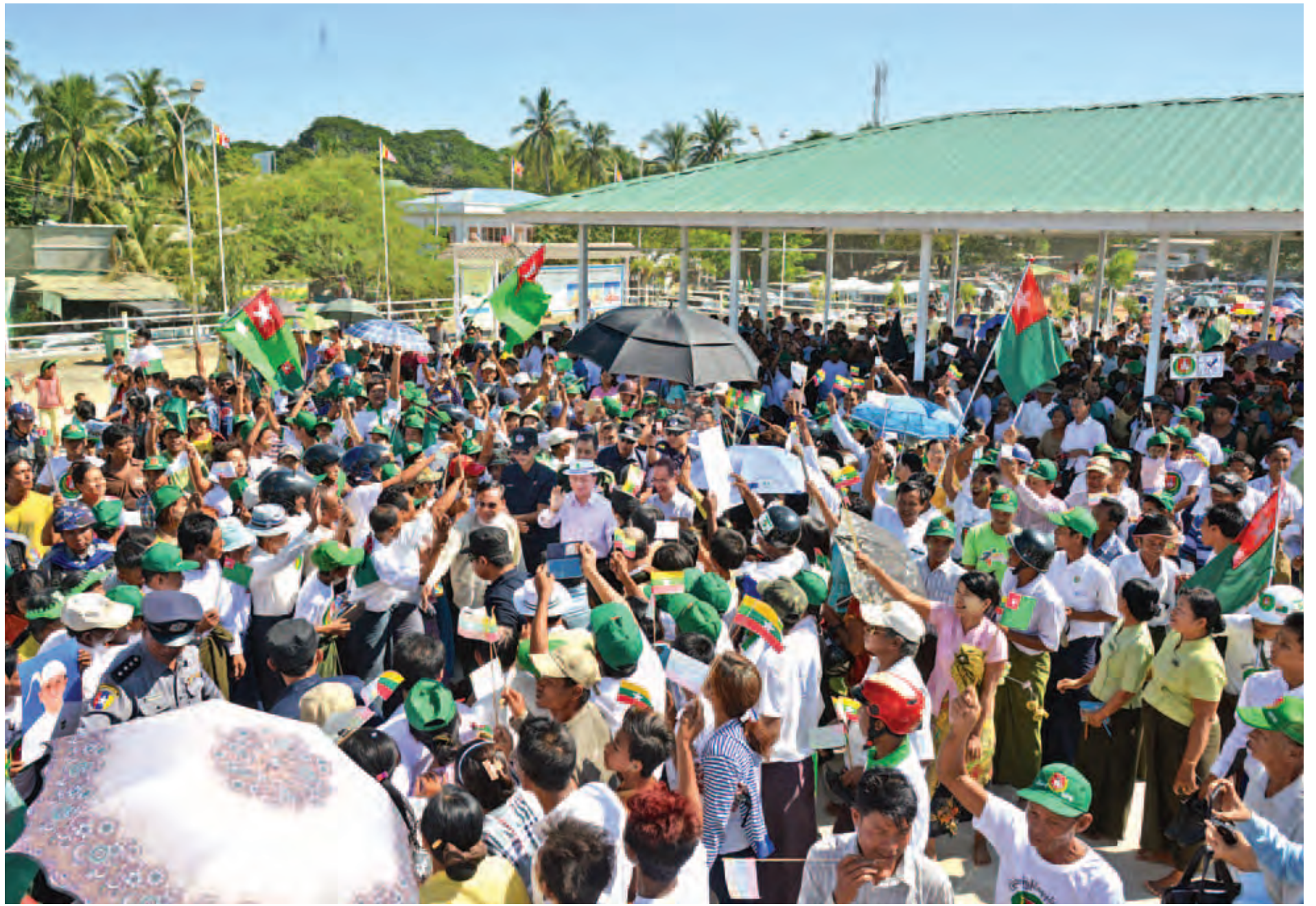
နိုင်ငံတော်သမ္မတ ဦးသိန်းစိန် မိတ္ထီလာဒေသခံပြည်သူများအား ရင်းရင်းနှီးနှီးနှုတ်ဆက်စဉ်။ (သတင်းစဉ်)

ပြည်ထောင်စုသမ္မတမြန်မာနိုင်ငံတော် နိုင်ငံတော်သမ္မတ ဦးသိန်းစိန်သည် တပ်မတော်ကာကွယ်ရေးဦးစီးချုပ် ဗိုလ်ချုပ်မှူးကြီး မင်းအောင်လှိုင်၊ ပြည်ထောင်စုဝန်ကြီးများ၊ မန္တလေးတိုင်းဒေသကြီးဝန်ကြီးချုပ်၊ ဒုတိယဝန်ကြီးများနှင့်အတူ ယနေ့ နံနက်ပိုင်းတွင် ပြင်ဦးလွင်မြို့မှ ရဟတ်ယာဉ်များဖြင့် ထွက်ခွာခဲ့ကြရာ ရှမ်းပြည်နယ် ရွာငံမြို့နယ်ရှိ မြို့ကြီးရေလှောင်တံစံ ဘက်စုံစီမံကိန်း တည်ဆောက်ရေးလုပ်ငန်းခွင်သို့ ရောက်ရှိကြပြီး ရှမ်းပြည်နယ်ဝန်ကြီးချုပ် ဦးစင်အောင်မြတ်နှင့် ဒေသခံပြည်သူများက ကြိုဆိုကြရာ နိုင်ငံတော်သမ္မတက ရင်းရင်းနှီးနှီး ပြန်လည်နှုတ်ဆက်သည်။ စာမျက်နှာ ၈ ကော်လံ ၁ သို့