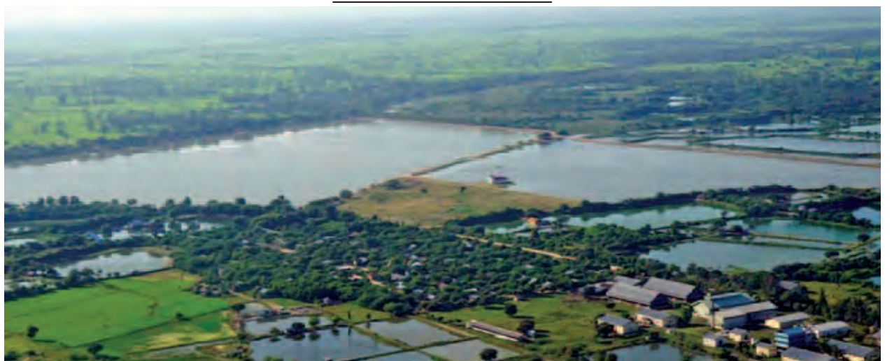
ရွှေဘိုမြို့ မဟာနန္ဒာကန်အား အောက်တိုဘာ ၂၂ ရက်က ဝေဟင်မှ တွေ့ရစဉ်။