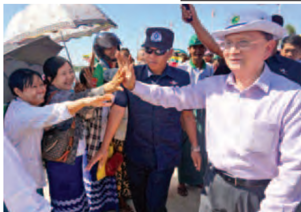
အောက်တိုဘာ ၂၃ ရက်က မိတ္ထီလာမြို့သို့ ရောက်ရှိလာသော နိုင်ငံတော်သမ္မတ ဦးသိန်းစိန်အား ဒေသခံပြည်သူများက ကြိုဆိုနှုတ်ဆက်စဉ်။