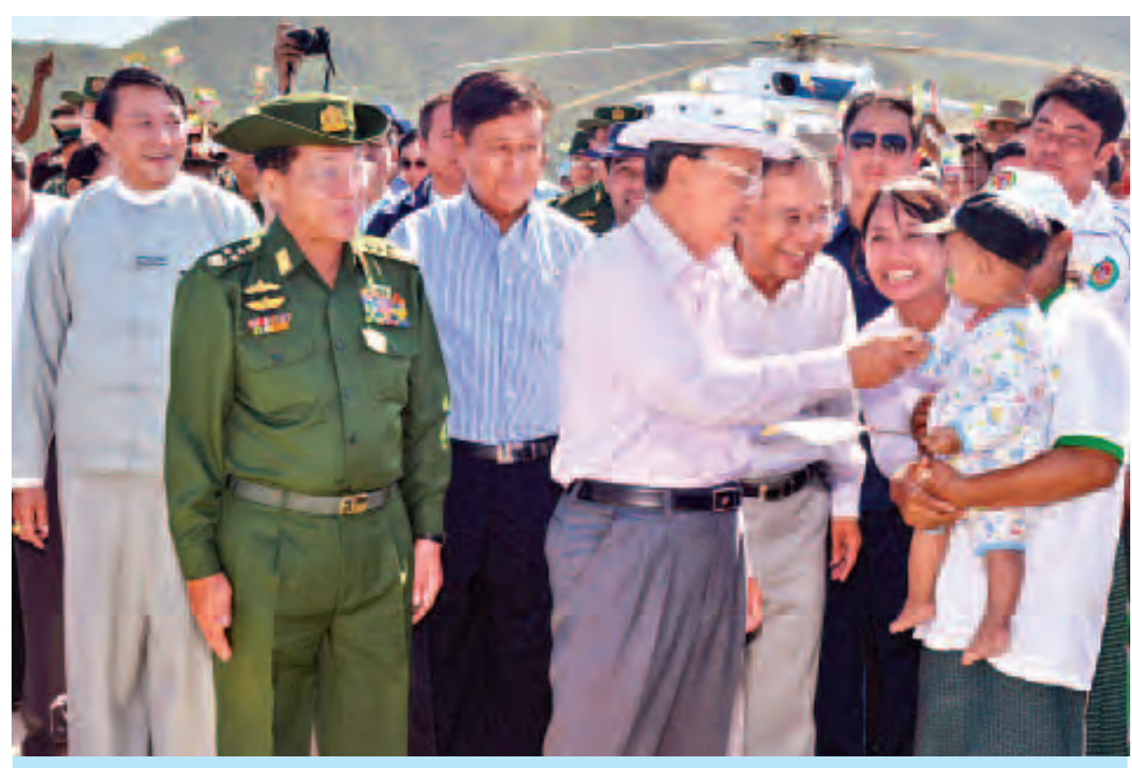
နိုင်ငံတော်သမ္မတ ဦးသိန်းစိန် မြို့ကြီးရေလျှောင့်တံစင်တွင် ဒေသခံများအား ရင်းရင်းနှီးနှီးနှုတ်ဆက်စဉ်။ (သတင်းစဉ်)

ရေဖုံးမှ ယင်းနောက် နိုင်ငံတော်သမ္မတ၊ တပ်မတော်ကာကွယ်ရေးဦးစီးချုပ်နှင့် အဖွဲ့သည် မြို့ကြီးရေလျှောင့်တံစင်အတွင်း ၃၀ မဂ္ဂါဝပ်ဓာတ်အားထွက်ရှိမည့် ရေအားလျှပ်စစ်စက်ရုံ တည်ဆောက်မှုနှင့် ဂျင်နရေတာ တာဘိုင်များ တပ်ဆင် ပြီးစီးမှု အခြေအနေများကို ကြည့်ရှုစစ်ဆေးပြီး မြို့ကြီးရေလျှောင့်တံစင်