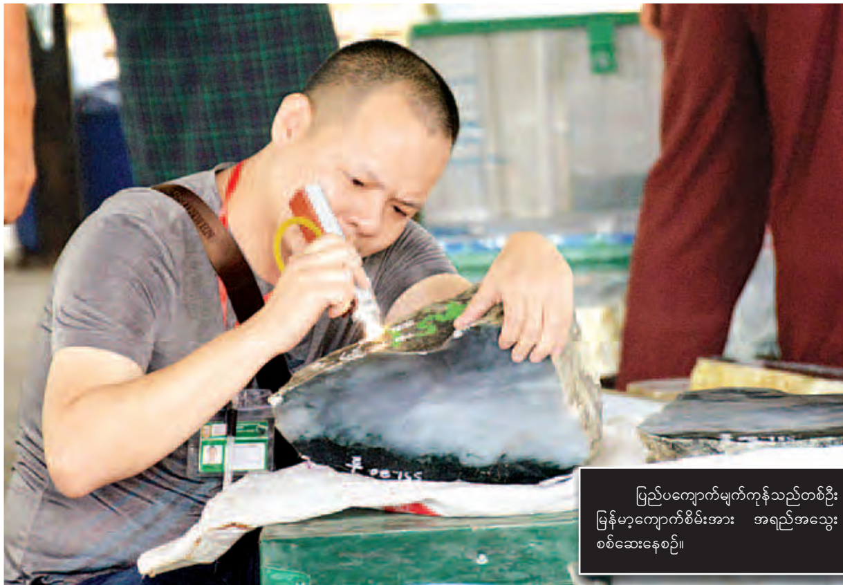
ပြည်ပကျောက်မျက်ကုန်သည်တစ်ဦး မြန်မာ့ကျောက်စိမ်းအား အရည်အသွေး စစ်ဆေးနေစဉ်။

သတ္တုတွင်းဝန်ကြီးဌာန၏ ဦးစီးဌာနနှင့်လုပ်ငန်းများ၏ လုပ်ငန်း ဆောင်ရွက်မှုမှ ဝင်ငွေရရှိမှုမှာ ၂၀၁၁-၂၀၁၂ ဘဏ္ဍာနှစ်၌ လျာထားချက် ကျပ်သန်းပေါင်း ၆၂၄၃၅ ဒဿမ ၅၈ သန်းတွင် ရရှိငွေမှာ ကျပ်သန်းပေါင်း ၈၆၆၀၆ ဒဿမ ၅၇ သန်း၊ ၂၀၁၂-၂၀၁၃ ဘဏ္ဍာနှစ်၌ လျာထားချက် ကျပ် သန်းပေါင်း ၂၆၃၈၆၈ ဒဿမ ၇၀ သန်းတွင် စာမျက်နှာ ၃ သို့ >>>