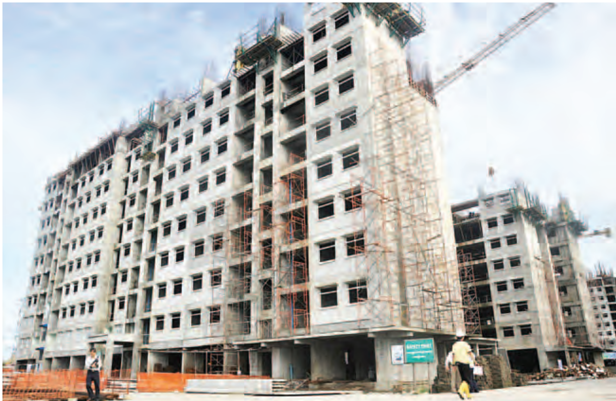
ရန်ကုန်တိုင်းဒေသကြီး ဒဂုံမြို့သစ်(ဆိပ်ကမ်း)မြို့နယ်တွင် ဆောက်လုပ်လျက်ရှိသော ဧရာဝတီ-ရတနာ တန်ဖိုးသင့်အိမ်ရာစီမံကိန်းကို တွေ့ရစဉ်။

ရန်ကုန်တိုင်းဒေသကြီး မြောက်ဥက္ကလာပမြို့နယ် ရွှေပေါက်ကံ ၁၄ ရပ်ကွက် တန်ဖိုးနည်းအိမ်ရာများအနေဖြင့် စာမျက်နှာ ၂ သို့ >>>