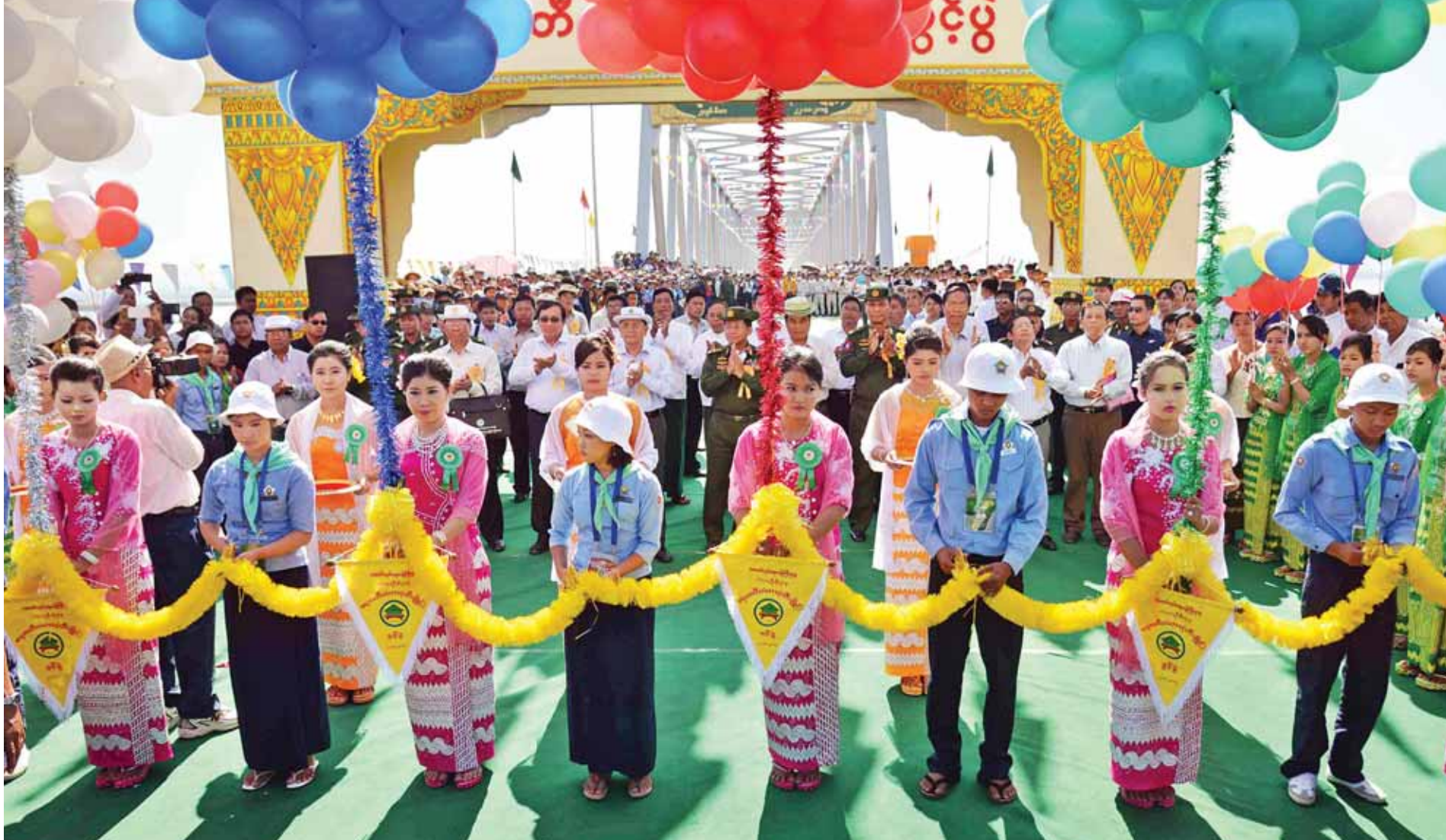
ဧရာဝတီတံတား(ထီးချိုင့်)ဖွင့်ပွဲအခမ်းအနားတွင် ထူးချွန်လူငယ်များက ဖဲကြိုးဖြတ်ဖွင့်လှစ်စဉ်။ (သတင်းစဉ်)

ပန္နလေးမြို့ ရေပေးဝေရေးစနစ် ပိုမိုတိုးတက်ကောင်းမွန်ရေး သန့်ရှင်းသည့်သောက်သုံးရေများဖြန့်ဖြူးမည် စာမျက်နှာ - ၂