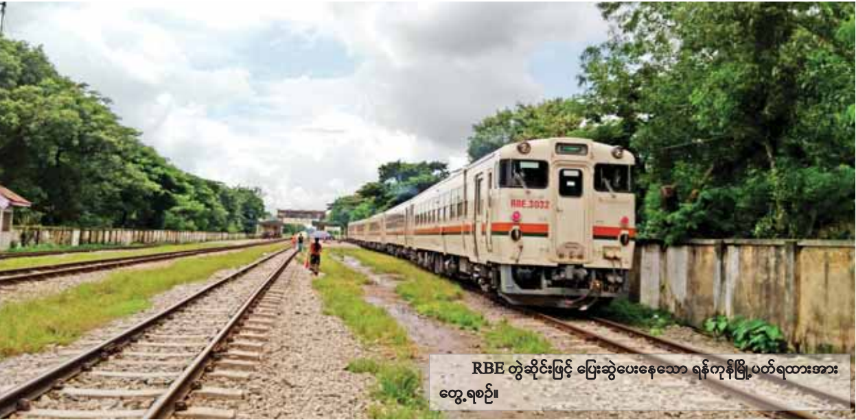
RBE တွဲဆိုင်ဖြင့် ပြေးဆွဲပေးနေသော ရန်ကုန်မြို့ပတ်ရထားအား တွေ့ရစဉ်။

မီးကြိုး (လျှပ်စစ်ဓာတ်အားကြိုး) ထုတ်လုပ်သောကုမ္ပဏီကြီးတစ်ခုဖြစ်သည့် LS Cable & System ကုမ္ပဏီသည် ၎င်း၏ကုမ္ပဏီခွဲတစ်ခုဖြစ်သော ဗီယက်နမ်အခြေစိုက် LS-VINA ကုမ္ပဏီက မြန်မာနိုင်ငံ၌ ဓာတ်အားကြိုး ပေးသွင်းရေးဆိုင်ရာ ကန်ထရိုက်တစ်ခုရရှိထားခဲ့ပြီး ယင်းကန်ထရိုက်အရ အမေရိကန်ဒေါ်လာ ၁၃ သန်းတန်ဖိုးရှိ လျှပ်စစ်မီးကြိုးပေးသွင်းရမည် ဖြစ်ကြောင်း၊ ယင်းပေးသွင်းရမည့် လျှပ်စစ်မီးကြိုးပမာဏသည် လျှပ်စစ်စွမ်းအား ဝန်ကြီးဌာနက နှစ်စဉ်ဝယ်ယူသော လျှပ်စစ်မီးကြိုးပမာဏ၏ တစ်ဝက်ခန့်ရှိ ကြောင်း အောက်တိုဘာ ၂၁ ရက်က ထုတ်ဖော်ပြောကြားခဲ့သည်ဟု ကိုရီးယား တိုင်းဒေသကြီးစာက ရေးသားဖော်ပြထားသည်။ ကိုရီးယားအခြေစိုက် အဆိုပါကုမ္ပဏီ၏ ထုတ်ပြန်ချက်အရ ယခုကဲ့သို့ လျှပ်စစ်ဓာတ်အားကြိုး ပေးသွင်းရေးဆိုင်ရာ ကန်ထရိုက်ရရှိလိုက်ခြင်းသည် စာမျက်နှာ ၉ ကော်လံ ၃ သို့