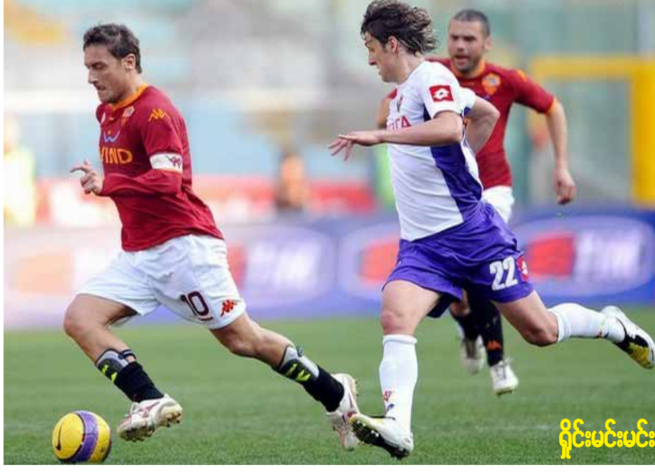
ရှိုင်းမင်းမင်း

တတ်တဲ့ အတ္တလန္တာကို ဖီအားလေးကစားသွားဖို့ အစီမံလန်ဟာ နောက်ဆုံးပွဲစဉ်မှာ တိုရီနိုကို မခက်ပါဘူး။ ဂျူဗင်တပ်သာ နိုင်ပွဲရသွားမှာပါ။ အထူးသဖြင့် အစီမံလန်ဟာ နောက်ဆုံးပွဲစဉ်မှာ အထူးသဖြင့် အစီမံလန်ရဲ့