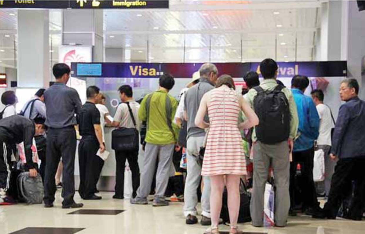
ကမ္ဘာလှည့်ခရီးသွားများအတွက် Online Visa e-Visa စနစ်ဖြင့် လျှောက်ထားဆောင်ရွက်လျက်ရှိသည်ကို တွေ့ရစဉ်။

လုပ်ငန်းဆောင်ရွက်မှုကာလများ အနေဖြင့် မိုးပွင့်စီမံချက် အဆင့်(၁)