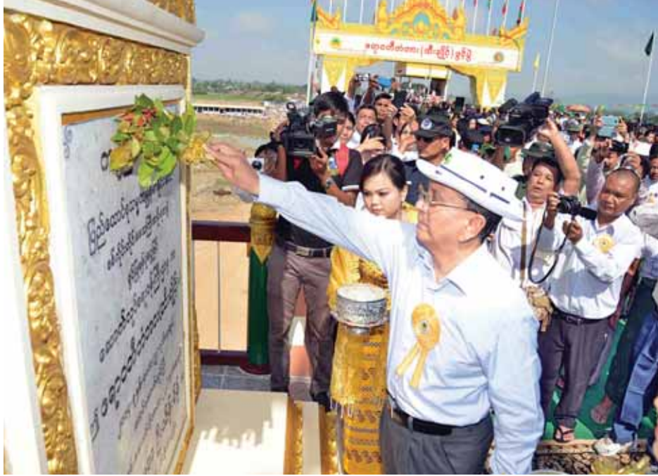
နိုင်ငံတော်သမ္မတ ဦးသိန်းစိန် ဧရာဝတီတံတား (ထီးချိုင့်) ကမ္ဘာ့မော်ကွန်းကျောက်စာတိုင်ကို အမွှေးနံ့သာရည်များဖြင့် ပက်ဖျန်းပေးစဉ်။ (သတင်းစဉ်)

အချက်အလက်များကို ရှင်းလင်းတင်ပြပြီး ထီးချိုင့်မြို့နယ် ဒေသခံ ရပ်ဖိရပ်ဖက်စစ်ဦးစီးက တံတားတည်ဆောက်ပေးမှုအတွက် ကျေးဇူးတင်စကားပြောကြားသည်။ ထို့နောက် နိုင်ငံတော်သမ္မတက အမှာစကားပြောကြားရာတွင် ဒေသဖွံ့ဖြိုးတိုးတက်ရေးအတွက် လမ်းပန်းဆက်သွယ်ရေးသည် အရေးကြီးပါကြောင်း၊ ထို့ကြောင့် ဧရာဝတီမြစ်ခြားနေသော ကသာခရိုင် ထီးချိုင့်မြို့နယ်ရှိ ထီးချိုင့်မြို့နှင့် မြတောင်ကျေးရွာတို့ ဆက်စပ်ပြီး ဖွံ့ဖြိုးတိုးတက်စေရန်အတွက် ဤတံတားကြီးကို တစ်နှစ်နှင့် ငါးလအတွင်း တည်ဆောက်ပေးခဲ့ခြင်းဖြစ်ကြောင်း။ မိမိတို့အစိုးရသည် စနစ်တစ်ခုမှတစ်ဆင့် အသွင်ကူးပြောင်းရေးကို တာဝန်ယူအကောင်အထည်ဖော်ရသည့် အတွက် ခြေလှမ်းတိုင်းကိုသတိထားဆောင်ရွက်ခဲ့ကြောင်း၊ ထိုသို့ အရာရာကိုချိန်ဆဆောင်ရွက်ခဲ့သည့်အတွက် မိမိတို့နိုင်ငံ၏ ဒီမိုကရေစီ အသွင်ကူးပြောင်းရေးသည် အရှေ့အလယ်ပိုင်းဒေသနိုင်ငံများ၏ အသွင်ကူးပြောင်းရေးကဲ့သို့ စစ်ပွဲများ၊ အကြမ်းဖက်မှုများ၊ နိုင်ငံရေးပဋိပက္ခများ၊ သိန်းချီသည့် စစ်ဒုက္ခသည်များနှင့် ရင်ဆိုင်ရခြင်းမရှိဘဲ အေးချမ်းစွာဖြစ်ပေါ်ခဲ့ကြောင်း၊ ထိုအောင်မြင်မှုသည် မည်သို့မျှမငြင်းနိုင်သည့် အောင်မြင်မှုဖြစ်ကြောင်း။ မိမိတို့၏ အသွင်ကူးပြောင်းရေးသည် ပြည်သူ့ဆန္ဒ နှစ်ရပ်ဖြစ်သည့် တည်ငြိမ်အေးချမ်းရေးနှင့် ဖွံ့ဖြိုးတိုးတက်ရေးကို ဖော်ဆောင်နိုင်ရန်အတွက် နိုင်ငံရေး၊ စီးပွားရေး၊ အုပ်ချုပ်ရေး ကဏ္ဍစုံတွင် ပြုပြင်ပြောင်းလဲရေးဆောင်ရွက်ခဲ့ခြင်းဖြစ်ကြောင်း။ နိုင်ငံရေးပြုပြင်ပြောင်းလဲမှုတွင် နိုင်ငံရေးတည်ငြိမ်မှုရှိစေရန်နှင့် နိုင်ငံရေးဖြစ်စဉ်တွင် အားလုံးပါဝင်နိုင်ရန်အတွက် ၂၀၁၂ ခုနှစ် ကြားဖြတ်ရွေးကောက်ပွဲကျင်းပခြင်း