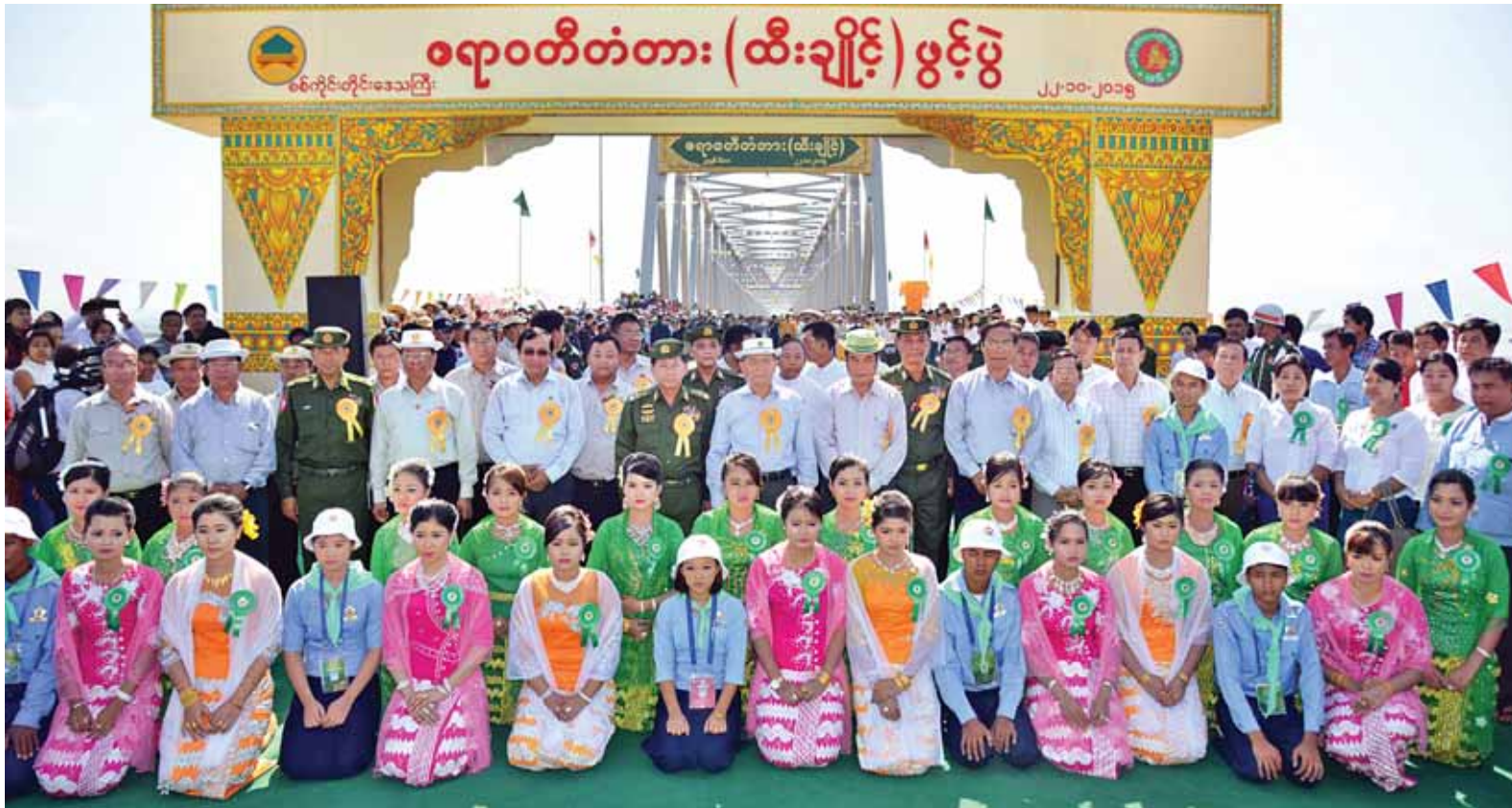
နိုင်ငံတော်သမ္မတ ဦးသိန်းစိန် မိုးကုတ်မြို့ လယ်အင်း(မုံကွင်း) စီမံကိန်းအား ကြည့်ရှုစစ်ဆေး စဉ်။ (သတင်း-ရှေ့ဖုံး) (ပြန်/ဆက်)