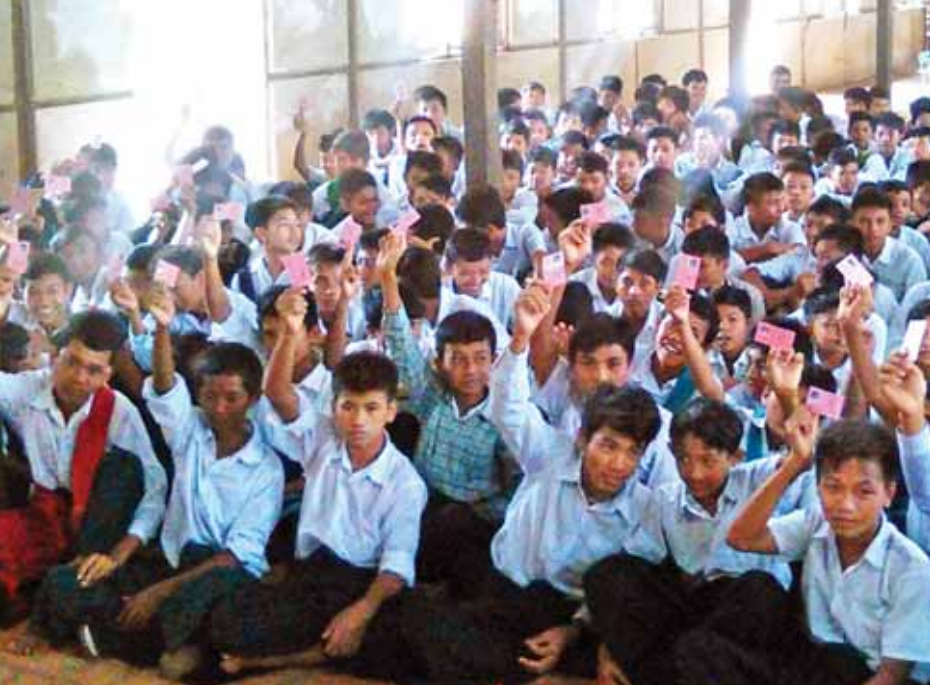
နိုင်ငံသားစိစစ်ရေးကတ်ပြားများ ရရှိကိုင်ဆောင်ထားကြသည့် ညောင်ဦးမြို့နယ် တောင်ဝင်း(အထက်) ကျောင်းမှ ကျောင်းသားကလေးများကို တွေ့ရစဉ်။

ကို ၁-၇-၂၀၁၁ မှ ၃၁-၁၀-၂၀၁၁ ရက်နေ့အထိ မိုးပွင့်စီမံချက်