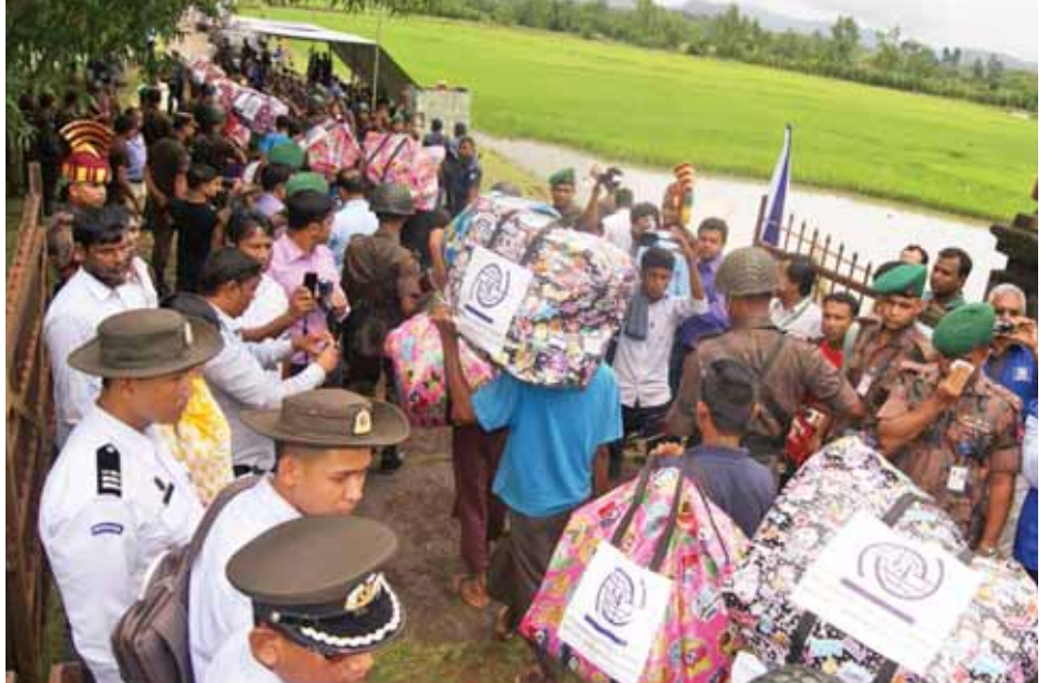
ဘင်္ဂလားဒေ့ရှ်နိုင်ငံသား လေ့စီးရွှေ့ပြောင်းသွားလာသူများအား ဘင်္ဂလားဒေ့ရှ်နိုင်ငံဘက်သို့ လွှဲပြောင်းပေးအပ်နေသည်ကို တွေ့ရစဉ်။

မြန်မာနိုင်ငံ၏လူဦးရေမှာ ၅၁ ဒသမ ၄၂ သန်း (၅၁၄၁၉၄၂၀) ဖြစ်ပြီး အိမ်ထောင်စုအရေအတွက်မှာ ၁၀ ဒသမ ၉ သန်း (၁၀၈၈၉၃၄၈) အိမ်ထောင်စုဖြစ်သည်။ ပင်မအစီရင်ခံစာ လူဦးရေစာရင်းအရ မြန်မာနိုင်ငံ၏ လူဦးရေမှာ ၅၁ ဒသမ ၄၈ သန်း (၅၁၄၈၆၂၅၃) ဦး ဖြစ်ပြီး အိမ်ထောင်စုအရေအတွက်မှာ ၁၀ ဒသမ ၉ သန်း (၁၀၈၇၇၈၃၂) အိမ်ထောင်စုဖြစ်သည်။ သန်းခေါင်စာရင်းရလဒ်များအပေါ် မူတည်၍ လူဦးရေနှင့်လူမှုစီးပွားရေး ဆိုင်ရာ အချက်အလက်များကို အသေးစိတ်ဆန်းစစ်လေ့လာသည့် မွေးဖွားခြင်း(Fertility)၊ သေဆုံးခြင်း (Mortality)၊ ပြောင်းရွှေ့သွားလာခြင်းနှင့် မြို့ပြထွန်းကားလာခြင်း (Migration Urbanization)၊ မသန်စွမ်းမှု (Disability)၊ လူဦးရေပြောင်းလဲခြင်း (Population Dynamic)၊ လူဦးရေခန့်မှန်းခြင်း (Projections)၊ ကလေးသူငယ်နှင့် လူငယ်များ (Children and Young People)၊ သက်ကြီးရွယ်အိုများ (Elderly)၊ ပညာရေး(Education)၊ လုပ်သားအင်အား (Labour Force)၊ အိမ်ထောင်စု၊ အိမ်အကြောင်းအရာနှင့် အိမ်ထောင်စုရှိ ပစ္စည်းများ (Housing conditions and amenities)၊ ကျား/မအလိုက် ခွဲခြားလေ့လာခြင်း (Gender Dimensions)၊ သန်းခေါင်စာရင်းရလဒ်မြေပုံများ(Census Atlas) ဟူသည့် သုတေသနစာတမ်း ၁၃ စောင် ဆက်လက်ထုတ်ပြန်နိုင်ရန်အတွက် ဆောင်ရွက်လျက်ရှိသည်။ လူဝင်မှုကြီးကြပ်ရေးနှင့် ပြည်သူ့အင်အားဝန်ကြီးဌာနသည် အထက်ပါအတိုင်း ကဏ္ဍများအလိုက် ၂၀၁၁ ခုနှစ်မှ ၂၀၁၅ ခုနှစ်အထိ အကောင်အထည်ဖော်ဆောင်ရွက်နိုင်ခဲ့သည်ကို မှတ်တမ်းပြုရေးသားတင်ပြလိုက်ရပါသည်။ ။