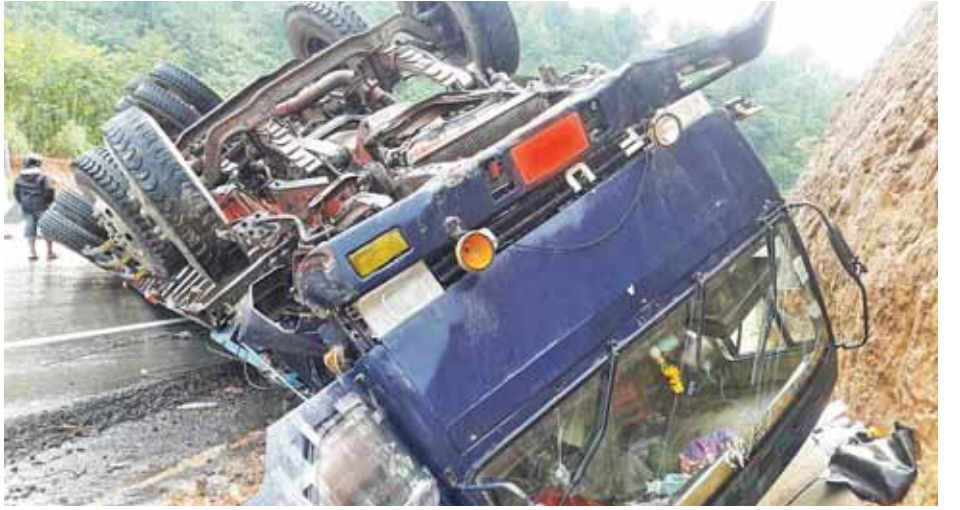
ယာဉ်တိုက်မှုများပြင်းပွားနေသည့် မြဝတီ-ကော့ကရိတ် အာရှလမ်းသစ်တွင်

ကော့ကရိတ် အောက်တိုဘာ ၂၂ မြဝတီ-ကော့ကရိတ် အာရှလမ်းသစ်တွင် အောက်တိုဘာ ၂၀ ရက် ညနေ ၇ နာရီခန့်က ယာဉ်တိုက်မှုများပြင်းပွားကြောင်း သိရသည်။