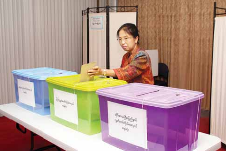
ပြည်ပတွင် မြန်မာနိုင်ငံသားတစ်ဦး ကြိုတင်ဆန္ဒမဲပေးနေစဉ်။

နေပြည်တော် အောက်တိုဘာ ၂၂ သံရုံး၊ မြန်မာအမြဲတမ်းကိုယ်စား လှယ်အဖွဲ့ရုံး၊ မြန်မာကောင်စစ်ဝန် ချုပ်ရုံး၊ မြန်မာကောင်စစ်ဝန် ချုပ်ရုံး၊ မြန်မာအမြဲတမ်းကိုယ်စားလှယ်အဖွဲ့ရုံး၊ မြန်မာကောင်စစ်ဝန်ချုပ်ရုံးများ အနေ ဖြင့် လိုအပ်သည်များ စနစ်တကျ စီမံဆောင်ရွက်ပေးလျက်ရှိကြောင်း (သတင်းစဉ်) နေပြည်တော် အောက်တိုဘာ ၂၂ သံရုံး၊ မြန်မာအမြဲတမ်းကိုယ်စား လှယ်အဖွဲ့ရုံး၊ မြန်မာကောင်စစ်ဝန် ချုပ်ရုံး၊ မြန်မာအမြဲတမ်းကိုယ်စားလှယ်အဖွဲ့ရုံး၊ မြန်မာကောင်စစ်ဝန်ချုပ်ရုံးများ အနေ ဖြင့် လိုအပ်သည်များ စနစ်တကျ စီမံဆောင်ရွက်ပေးလျက်ရှိကြောင်း (သတင်းစဉ်)