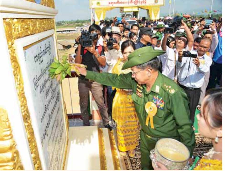
တပ်မတော်ကာကွယ်ရေးဦးစီးချုပ် ဗိုလ်ချုပ်မှူးကြီး မင်းအောင်လှိုင် ဧရာဝတီတံတား (ထီးချိုင့်) ကမ္ဘာ့မော်ကွန်းကျောက်စာတိုင်ကို အမွှေးနံ့သာရည်များဖြင့် ပက်ဖျန်းပေးစဉ်။ (သတင်းစဉ်)

ရေးဦးစီးချုပ်နှင့်အဖွဲ့သည် တံတားပေါ်သို့ဖြတ်သန်းကြည့်ရှုစစ်ဆေးပြီး ဒေသခံပြည်သူများအား ရင်းရင်းနှီးနှီးနှုတ်ဆက်သည်။ ထို့နောက် နိုင်ငံတော်သမ္မတ၊ တပ်မတော်ကာကွယ်ရေးဦးစီးချုပ်နှင့် အဖွဲ့ဝင်များသည် ရဟတ်ယာဉ်များဖြင့် ဆက်လက်ထွက်ခွာခဲ့ရာ မိုးကုတ်မြို့သို့ရောက်ရှိပြီး နိုင်ငံတော်သမ္မတသည် မိုးကုတ်မြို့လယ်အင်း(မုံတွင်း)စီမံကိန်းဆောင်ရွက်နေမှုအခြေအနေများကို ကြည့်ရှုစစ်ဆေးပြီး လိုအပ်သည်များကို လမ်းညွှန်မှာကြားသည်။ ထိုမှတစ်ဆင့် နိုင်ငံတော်သမ္မတ၊ တပ်မတော်ကာကွယ်ရေးဦးစီးချုပ်နှင့်အဖွဲ့သည် ရဟတ်ယာဉ်များဖြင့် ရွှေဘိုမြို့သို့ရောက်ရှိကြပြီး မဟာနန္ဒာကန်ပြန်လည်ပြုပြင် မွမ်းမံပြီးစီးမှုအခြေအနေကို မော်တော်ယာဉ်များဖြင့် လှည့်လည်ကြည့်ရှုစစ်ဆေးပြီး လိုအပ်သည်များကို လမ်းညွှန်မှာကြားသည်။ ဆက်လက်၍ မဟာအောင်မြေ ဆုတောင်းပြည့်မြတ်စွာဘုရားအား ဖူးမြော်ကြည့်ညို၍ အလှူငွေများပေးအပ်လှူဒါန်းသည်။ ယင်းနောက် နိုင်ငံတော်သမ္မတ၊ တပ်မတော်ကာကွယ်ရေးဦးစီးချုပ်နှင့်အဖွဲ့သည် ရွှေဘိုမြို့ မဟာအောင်မြေ