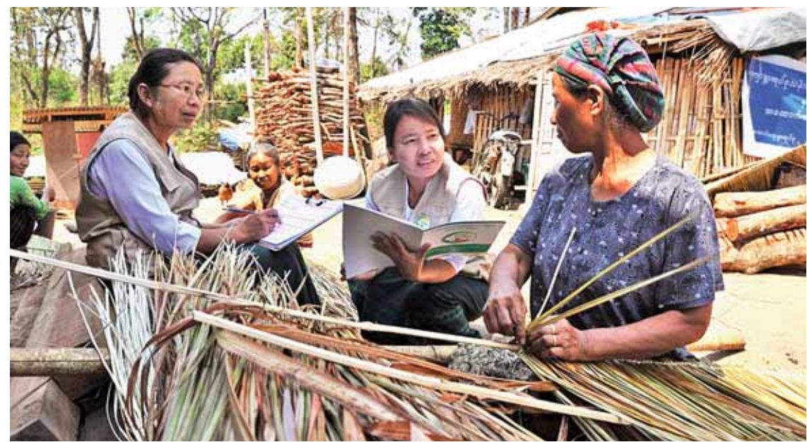
မန်စီမြို့နယ်၌ ၂၀၁၄ ခုနှစ် ဧပြီ ၁၀ က လူဦးရေနှင့် အိမ်အကြောင်းအရာ သန်းခေါင်စာရင်းကောက်ယူမှုနေ့မှတို့ တွေ့ရစဉ်။

နိုင်ငံတော်အစိုးရသစ်၏ ရွေ့လုပ်ငန်းစဉ် အပေါ် အခြေခံ၍ ဝန်ကြီးဌာန၏ အဓိက လုပ်ငန်းတာဝန် သုံးရပ်ဖြစ်သော လူဝင်မှု ကြီးကြပ်ရေးလုပ်ငန်း၊ အမျိုးသားမှတ်ပုံတင် ရေးနှင့် နိုင်ငံသားမှတ်ပုံတင်ရေးလုပ်ငန်း၊ ပြည်သူ့အင်အားစာရင်း ကောက်ယူထိန်းသိမ်း ရေးလုပ်ငန်းများကို နိုင်ငံတော်အစိုးရ၏ မူဝါဒ များနှင့်အညီ စနစ်တကျ အကောင်အထည် ဖော်ဆောင်ရွက်လျက်ရှိသည်။ ခရီးသည် သုံးသိန်းကျော် ဆိုက်ရောက်ပီဇာခွင့်ပြု နိုင်ငံတော်၏ ပြည်ဝင်ပီဇာစနစ်အရ နိုင်ငံအတွင်းသို့ ဝင်/ထွက်ရန် နည်းလမ်း သုံးသွယ်ဖြစ်သော အပြည်ပြည်ဆိုင်ရာ လေဆိပ်၊ ရေဆိပ်နှင့် နယ်စပ်ဝင်/ထွက်ပေါက် များမှတစ်ဆင့် ပီဇာ ခြောက်မျိုးဖြင့် ဝင်/ထွက် ခွင့်ပြုလျက်ရှိသည်။ နိုင်ငံတော်အစိုးရ၏ Open Up Policy အရ ဒုတိယပြုပြင်ပြောင်းလဲရေးအစီအမံတွင် အထောက်အကူဖြစ်စေရန် Visa Policy in Myanmar ပထမအဆင့်အနေဖြင့် လုပ်ငန်း ပီဇာ၊ ပြည်ဝင်ပီဇာနှင့် ဖြတ်သန်းပီဇာ သုံး မျိုးကို ဆိုက်ရောက်ပီဇာ (Visa On