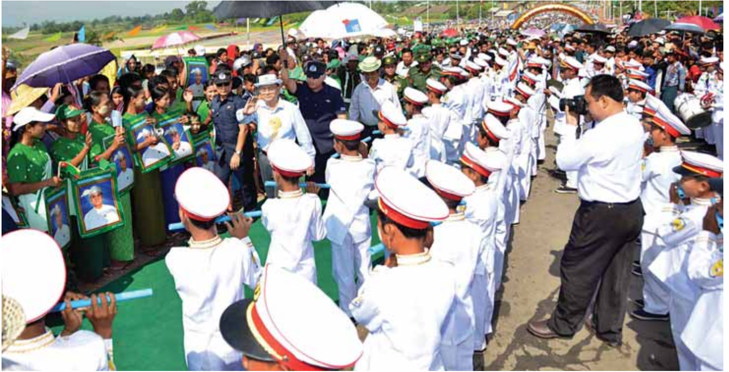
နိုင်ငံတော်သမ္မတ ဦးသိန်းစိန် ဧရာဝတီတံတား (ထီးချိုင့်)ဖွင့်ပွဲသို့ တက်ရောက်လာသော ဒေသခံပြည်သူများအား ရင်းရင်းနှီးနှီးနှုတ်ဆက်စဉ်။ (သတင်းစဉ်)

ယင်းနောက် ဆောက်လုပ်ရေးဝန်ကြီးဌာန တံတားဦးစီးဌာန အင်ဂျင်နီယာချုပ် ဦးစိုးမင်းက တံတားဆိုင်ရာ