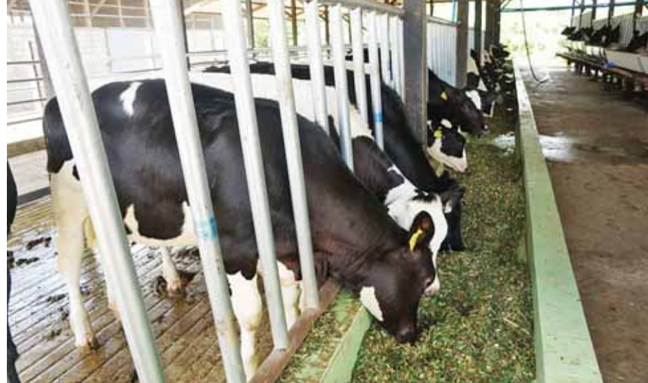
နယူးဇီလန်နိုင်ငံ၏ နည်းပညာပံ့ပိုးမှုဖြင့် မိတ္ထီလာမြို့နယ် ညောင်ပင်သာကျေးရွာတွင် နို့စားကျွန်းများ မွေးမြူထားသည်ကို တွေ့ရစဉ်။

ရေရှည် တည်တံ့စေရေးအတွက် တစ်ရွာလျှင် ကျပ်သန်း ၃၀ ဖြင့် နွား ၁၇၈၉ ကောင်၊ ဝက် ၂၀၂၁၅ ကောင်၊ သိုး/ဆိတ် ၁၁၄၉၆ ကောင် ဖြန့်ဖြူး ပြီးဖြစ်သည်။ ပျားမွေးမြူရေးနည်းပညာ နို့စားကျွန်း မွေးမြူထုတ်လုပ်မှု တိုးတက်စေရေး၊ တိရစ္ဆာန်အာဟာရ နှင့် ကူးစက်ရောဂါဆိုင်ရာ၊ ပျားမွေးမြူ ထုတ်လုပ်ရေးဆိုင်ရာ စသည့်စီမံကိန်း ၁၅ ခုဖြင့် အကောင်အထည်ဖော် ဆောင်ရွက်လျက်ရှိသည်။ ပျားဖယောင်းမှ ဖယောင်းတိုင် ထုတ်လုပ်ခြင်းနှင့်ပျားရည်များ ပြည်ပ ဈေးကွက်ရရှိရန်၊ မိသားစုဝင်ငွေရရှိ ရန် အရင်းအနှီးနှင့် ပျားမွေးမြူရေး နည်းပညာကို ကူညီပေးလျက်ရှိ သည်။ စာမျက်နှာ ၂ သို့ >>>