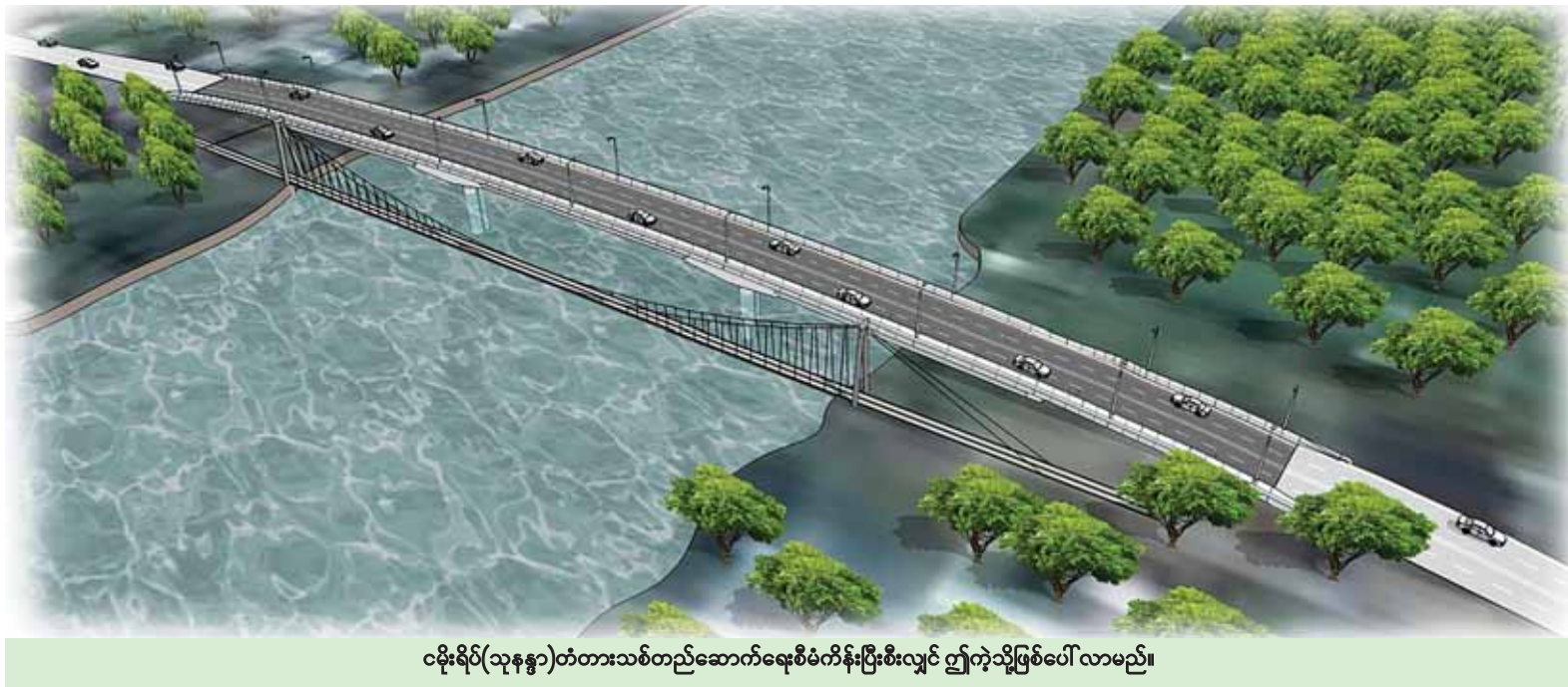
ငမိုးရိပ်(သုနန္ဒာ)တံတားသစ်တည်ဆောက်ရေးစီမံကိန်းပြီးစီးလျှင် ဤကဲ့သို့ဖြစ်ပေါ်လာမည်။