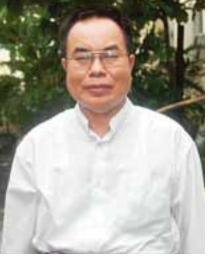
ဦးလားလ်ဆွီဆုန်း

ငြိမ်းချမ်းရေးလက်မှတ်ရေးထိုးနိုင် တာကို သာမန်ပြည်သူတစ်ယောက် အနေနဲ့ ကြိုဆိုဝမ်းသာပါတယ်။ ဒါပေမယ့် ၁၅ ဖွဲ့လုံးထိုးနိုင်ရင်တော့ ပိုပျော်ရမှာပေါ့ဗျာ။ ကျွန်တော်တို့ ပြည်နယ် ငြိမ်းချမ်းတယ်ဆိုရင်ကို အများကြီး ဝမ်းသာရမှာပါ။ ကျွန်တော် တို့ ကရင်ပြည်နယ်မှာ မြေအောက် သယ်ဇာတတွေ အများကြီးရှိပြီး စစ်ပွဲ တွေရှိနေတဲ့အတွက် ဘာမှသုံးစား ခံစားခွင့်မရှိဘူး။ နောက်ပြီး မြေမြှုပ် မိုင်းတွေကြောင့် မြေပြတ်၊ လက်ပြတ်နဲ့ ဒုက္ခိတတွေ အများကြီးဖြစ်နေကြ