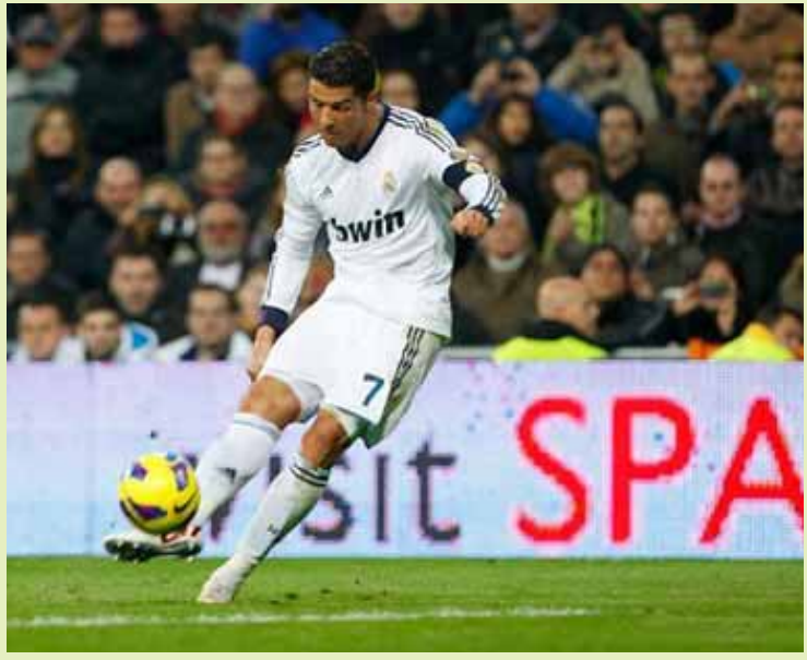
ရှိုင်ယန်ဟော့ဒင်

ဘေးလ်နဲ့ ခရစ်တို့ကိုသာ ကန်ခိုင်းရင် ရိုးယဲလ်အနေနဲ့ ဝေဖန်ချက်တွေ ထွက်လာပါတယ်။ စီရိုနယ်လ်ဒိုဟာ အရင်က အလွတ်တည်ကန်ဘောကန်သွင်းရာမှာ ကျွမ်းကျင်တဲ့ဂျူနီယာတို့ ဘက်ခမ်းနဲ့ ရောဘတ်တိုကားလို့တို့ရဲ့ စွမ်းရည်ကိုမမီပါဘူး။