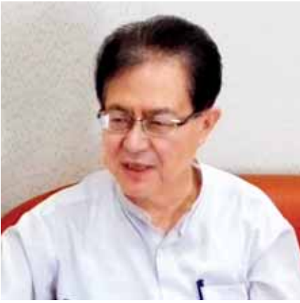
စာမျက်နှာ ၅ ကော်လံ ၁ သို့

ပြည်ပရှိ မြန်မာသံရုံး၊ မြန်မာအမြဲတမ်းကိုယ်စားလှယ်အဖွဲ့ရုံးနှင့် မြန်မာကောင်စစ်ဝန်ချုပ်ရုံးများ တွင် ပြည်ပရောက်မြန်မာနိုင်ငံသား မဲဆန္ဒရှင်များ ကြိုတင်ဆန္ဒမဲပေးလျက်ရှိသော်လည်း အခက်အခဲ များရှိနေခြင်း၊ နိုင်ငံခြားရေးဝန်ကြီးဌာနမှ ကူညီဖြေရှင်းပေးနေခြင်းများအပါအဝင် မြန်မာနိုင်ငံသား ဦးရေများပြား မဲပေးရက်ရှည် သတ်မှတ်ထားသည့် သုံးနိုင်ငံ၌ မဲလိုအပ်ချက်စာရင်းတောင်းခံ၍ အချိန်မီ မဲပေးနိုင်ရန် စီစဉ်ဆောင်ရွက်နေမှုများနှင့်ပတ်သက်၍ နိုင်ငံခြားရေးဝန်ကြီးဌာန ဒုတိယဝန်ကြီး ဦးသန်းကျော်ကို တွေ့ဆုံမေးမြန်း ဖော်ပြအပ်ပါသည်။ မေး။ ။ မေးမြန်းခွင့်ရလို့ ကျေးဇူးတင်ပါတယ်။ ပြည်ပရောက် မြန်မာနိုင်ငံသားတွေ ကြိုတင်မဲပေးရာမှာ အခက်အခဲတွေရှိနေတာနဲ့ပတ်သက်ပြီး နိုင်ငံခြားရေးဝန်ကြီးဌာနရဲ့ ဆောင်ရွက်ပေးမှု၊ ကူညီဖြေရှင်း နေမှုအခြေအနေ သိလိုပါတယ်။