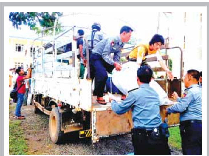
ကယားပြည်နယ် ဖားဆောင်းမြို့နယ် မော်ချီးဒေသမှ သဘာဝဘေးသင့်ပြည်သူများအား ကယားပြည်နယ် ရဲတပ်ဖွဲ့မှူးရုံးကြီးမြင်းမှုမြို့နှင့် စနစ်တကျ ပြေးဆောင်သော ပြည်နယ်၊ မြို့၊ ခရိုင်မှ ရဲတပ်ဖွဲ့ဝင်မိသားစုများမှ မြို့စောင် ၁၅၅ ထည်၊ တီဂျပ်အထည် ၁၅၀၊ ထောပတ်မုန့်ကြွပ်ရစ်စာ စုစုပေါင်းတန်ဖိုးကျပ် ၆၄၀၀၀၀ နှင့် အဝတ်အထည် ၂၁ ဆီတို့ကို ယမန်နေ့က ကယားပြည်နယ် လွိုင်ကော်မြို့ သာသနာဗိမ္မာန်တော်ကြီး၌ နံနက် ၉ နာရီခန့်က သွားရောက်လှူဒါန်းခဲ့ကြောင်း သိရသည်။

တစ်နာရီလျှင် ရေလီတာ ၅၀၀ သန့်စင် အသုံးပြုနိုင်သည်။ အလားတူ မြို့နယ်ပုဂ္ဂလိက ဖော်တော်ယာဉ်များ စနစ်တကျပြေးဆွဲရေးကော်မတီသည် မြင်းမှုမြို့ ညောင်ဦးဖိနပ်ရုံ အမှတ်(၆) အခြေခံပညာလူတန်းကျောင်းသို့ ငွေကျပ်ငါးသိန်းရှိ 10 KVA မီးအားမြှင့်စက် တစ်စက်ကိုလည်း လှူဒါန်းခဲ့ကြောင်း သိရသည်။ အောင်စိုးဝေ