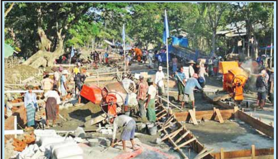
အောက်တိုဘာ ၁၇ ရက်က ကလေး-ပြင်သာလမ်း RD-0+800 ပေတွင် ကွန်ကရစ်လောင်းခြင်းလုပ်ငန်း ဆောင်ရွက်နေသည်ကို တွေ့ရစဉ်။ (ဂျိုးနက်)