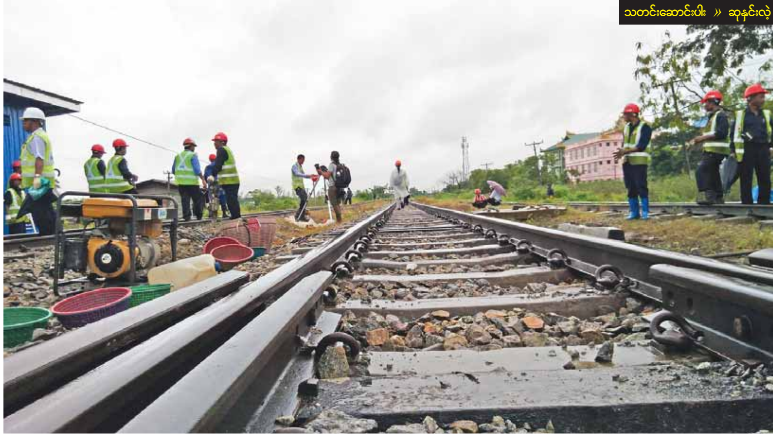
ရန်ကုန်-မန္တလေးရထား မြန်နှုန်းမြှင့်မောင်းနှင်နိုင်ရန် ရထားလမ်းပိုင်းအဆင့်မြှင့်တင်မှုများဆောင်ရွက်နေစဉ်။

ယနေ့ မာတိကာ အသက်သွေးကြော ရောဂါတီ စာမျက်နှာ - ၂ တိုင်ဖုန်းမှန်တိုင်း “ကွတ်ပူ” ဖိလစ်ပိုင် နိုင်ငံသို့ ဝင်ရောက် တိုက်ခတ် စာမျက်နှာ - ၄ မော်ချီးဒေသရှိ မြေပြို ဘေးသင့်ပြည်သူများ အတွက် ကယ်ဆယ်ရေး ပစ္စည်းများ ပေးပို့ ထောက်ပံ့ စာမျက်နှာ - ၈ ဒိုင်ယာနာအကြောင်း ရှားရှားပါးပါး ထည့်သွင်းပြောကြားခဲ့တဲ့ မင်းသားဝီလျံ စာမျက်နှာ - ၁၂