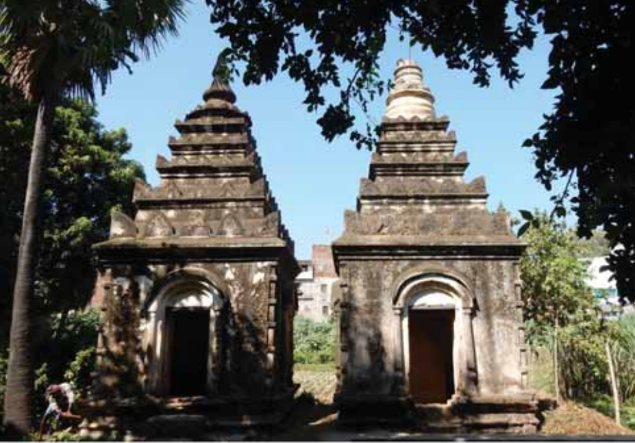
အလှူတော်များ သိမ်းဆည်းထားသည့် အုတ်တိုက် ဘဏ္ဍာအိမ်၊ ကျောက်စာစေတီကွန်ထရိုက်၊ ကျောက်စာတိုက်

(အဆောက်အအုံများကို ခေသစ်အိန္ဒိယနိုင်ငံသားများ ပြုပြင်ထားသောကြောင့် မြန်မာ့လက်ရာများ မကျန်ရှိတော့ပေ။)