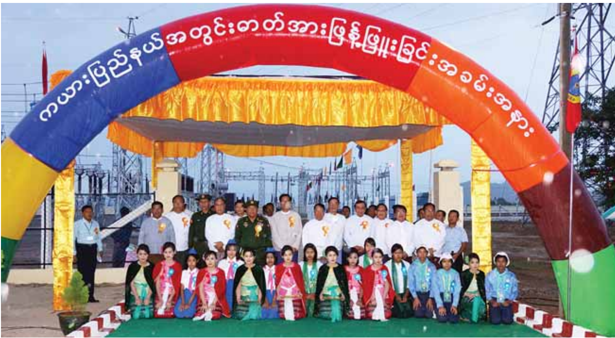
၂၀၁၅ ခုနှစ် ဇူလိုင် ၁၇ ရက်က ကယားပြည်နယ်အတွင်း ဓာတ်အားဖြန့်ဖြူးခြင်း အခမ်းအနားသို့ တက်ရောက်လာကြသူများနှင့် ဒေသခံ တိုင်းရင်းသား တိုင်းရင်းသူများ မှတ်တမ်းတင်ဓာတ်ပုံရိုက်ကြစဉ်။ (ပြန်/ဆက်)

ကယားပြည်နယ်၏ လျှပ်စစ်ကဏ္ဍ မြင့်မားလာစေဖို့အတွက် ဩဂုတ် ၂၃ ရက်က ဘီလူးချောင်းအမှတ် (၃) ရေအားလျှပ်စစ်စက်ရုံကို ဖွင့်လှစ်ပေးခဲ့ပြီး ၂၅ မဂ္ဂါဝပ် ထွက်ရှိသည့် ယင်းဓာတ်အားပေးစက်ရုံသည် ယခင်ရရှိထားသည့် လှိုင်ကော်၊ ဒီးမော့ဆို၊ ဖရူဆို၊ ဘောလခဲနှင့် ဖားဆောင်းတို့သာမက ရှားတော၊ ရွာသစ်နှင့် မဲ့စွဲမြို့အပါအဝင် ကျေးရွာပေါင်း ၂၅၄ ရွာကို တိုးချဲ့ကာ လျှပ်စစ်