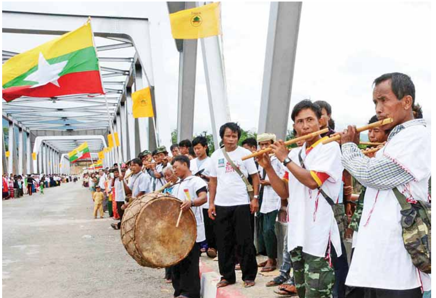
၂၀၁၅ ခုနှစ် ဇူလိုင် ၁၇ ရက်က သံလွင်တံတား(ဖားဆောင်း)ဖွင့်ပွဲတွင် ဒေသခံတိုင်းရင်းသားများက ဇိုးရာတေးသီချင်းဖြင့် ဖျော်ဖြေခဲ့ကြစဉ်။ (ပြန်/ဆက်)

သံလွင်တံတား(ဖားဆောင်း)ကို ဇူလိုင် ၁၉ ရက်က ဖွင့်လှစ်ခဲ့ပြီး မဲ့စဲမှ ဖားဆောင်းသို့ လမ်းပန်းဆက်သွယ်မှုမြန်ဆန်လာခြင်းကြောင့် ရှမ်းပြည်နယ်သို့ လည်းကောင်း၊ လွိုင်ကော်မှ မော်ချီး၊ ဆက်လက်၍ တောင်ငူမြို့သို့ လည်းကောင်း လွယ်ကူစွာ သွားနိုင်ပြီး တစ်နိုင်ငံလုံးနှင့် လွယ်လင့်တကူ ချိတ်ဆက်သွားလာနိုင်တော့မည်ဖြစ်