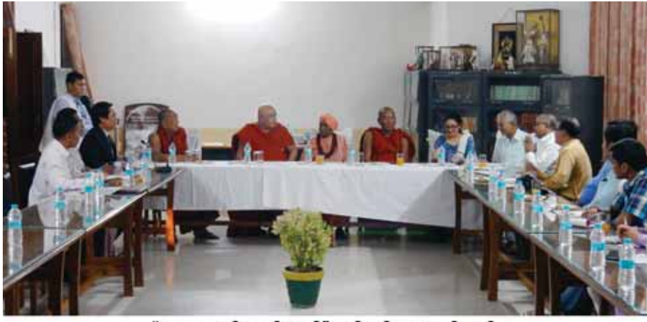
"မဟာဗောဓိစေတီတော်" အုပ်ချုပ်ရေးရုံးခန်းတွင် သီတဂူဆရာတော်ကြီးနှင့် အုပ်ချုပ်ရေးအဖွဲ့များအစည်းအဝေးကျင်းပနေစဉ်

စိန်အလုံးရေ (၅၁၁)၊ မြအလုံးရေ (၃၁၁)၊ ကျောက်နီလုံးရေ (၃၉၆၆)၊ ပုလဲလုံးရေ (၆၂၃)၊ ဆွေတော်/မျိုးတော်၊ သားတော်/သမီးတော်တို့လှူသော ရွှေထီး၊ တံခွန်၊ ကုက္ကား၊ မုလေးပိုး၊ ရွှေပန်းခိုင်၊ ငွေပန်းခိုင်တို့ကား များပြားစွာ ဘိတောင်း။ မြန်မာဘာသာကျောက်စာ၌ 'အပရာဇိ' ညောင်ဗောဓိသို့ အသဒိသ၊ မြတ်ဒါနဟု၊ စိန်၊ မြ၊ ပတ္တမြား၊ ကိုးပါးနဝရတ်၊ လျှောက်ပတ်ခြယ်လှယ်၊ လွန်ဆန်းကြယ်ကို ကျယ်မကုန်နိုင်၊ ဆုံးမပိုင်တည်း။ နိုင်ငံသုံးလူ၊ သာဓုယူလျက်၊ လှူရေစက်ဖြင့်၊ ပန္နက်ဆူကြီး၊ မဂ်ဖိုလ် ထီးဟု၊ ညီးညီး ပွင့်လျက်၊ မြင့်ထက်မြင့်သား၊ ကြည်မင်းဗိမာန်၊ မြိုက်နိဗ္ဗာန်ကို၊ ဧကန်မျက်မှောက်၊ ပြုရမြောက်စိမ့်၊ လျှင်တောက်တပို့၊ မိန့်မြှောက်ဆိုပြီး၊ ထိုသည့်ဒါန၊ ဒါတဗ္ဗကို ရ စသည်ဖြင့် ရေးထိုးထားခဲ့လေသည်။