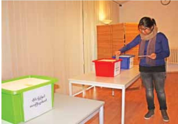
ဘာလင်မြို့ မြန်မာသံရုံး၌ ပြည်ပရောက်မြန်မာနိုင်ငံသားတစ်ဦး ကြိုတင်ဆန္ဒမဲ ပေးနေစဉ်။

အောက်တိုဘာ ၁၇ရက်ကလည်း ထိုင်းနိုင်ငံ၊ တရုတ်၊ ဂျာမနီ၊ ဘယ်လ်ဂျီယံ၊ အီဂျစ်၊ ဩစတြေးလျ၊ ဘင်္ဂလားဒေ့ရှ်၊ ဗီယက်နမ်၊ ပါကစ္စတန်၊ နီပေါ၊ ကူဝိတ်၊ ဗြိတိန်၊ ဖိလစ်ပိုင်၊ အိန္ဒိယ၊ နော်ဝေ၊ ကနေဒါ၊ ပြင်သစ်၊ တောင်ကိုရီးယား၊ စင်ကာပူ၊ ဂျပန်၊ လာအိုနှင့် အမေရိကန်ပြည်ထောင်စုရှိ မြန်မာသံရုံး (၂၂) ရုံး၊ အမေရိကန်ပြည်ထောင်စု နယူးယောက်မြို့နှင့် ဆွစ်ဇာလန်နိုင်ငံ ဂျီနီဗာမြို့ရှိ မြန်မာအမြဲတမ်း ကိုယ်စားလှယ်အဖွဲ့ရုံး (၂) ရုံး၊ ဟောင်ကောင်မြို့၊ အိန္ဒိယနိုင်ငံ ကိုလံကတ္တာမြို့၊ တရုတ်နိုင်ငံ ကူမင်းမြို့နှင့် နန်နင်းမြို့၊ အမေရိကန်ပြည်ထောင်စု လော့စ်အိန်ဂျလစ်မြို့နှင့် ထိုင်းနိုင်ငံ ချင်းမိုင်မြို့ရှိ မြန်မာကောင်စစ်ဝန်ချုပ်ရုံး (၆) ရုံးတို့၌ မဲဆန္ဒရှင် ၆၃၆၉ ဦးတို့ လာရောက်၍ ကြိုတင်ဆန္ဒမဲပေးခဲ့ကြသဖြင့် အောက်တိုဘာ ၁၃ ရက်မှ ၁၇ ရက်အထိ ကြိုတင်ဆန္ဒမဲပေးခဲ့ကြသည့် မဲဆန္ဒရှင်စုစုပေါင်း ၁၁၉၀၆ ဦးရှိကြောင်း သိရသည်။ ကြိုတင်ဆန္ဒမဲလာရောက်ပေးကြသည့် ပြည်ပရောက် မြန်မာနိုင်ငံသားများ အဆင်ပြေချောမွေ့စွာ မဲပေးနိုင်ရေးအတွက် မြန်မာသံရုံး၊ မြန်မာအမြဲတမ်းကိုယ်စားလှယ်အဖွဲ့ရုံး၊ မြန်မာကောင်စစ်ဝန်ချုပ်ရုံးများအနေဖြင့် လိုအပ်သည်များ စီမံဆောင်ရွက်ပေးလျက်ရှိကြောင်း သိရသည်။