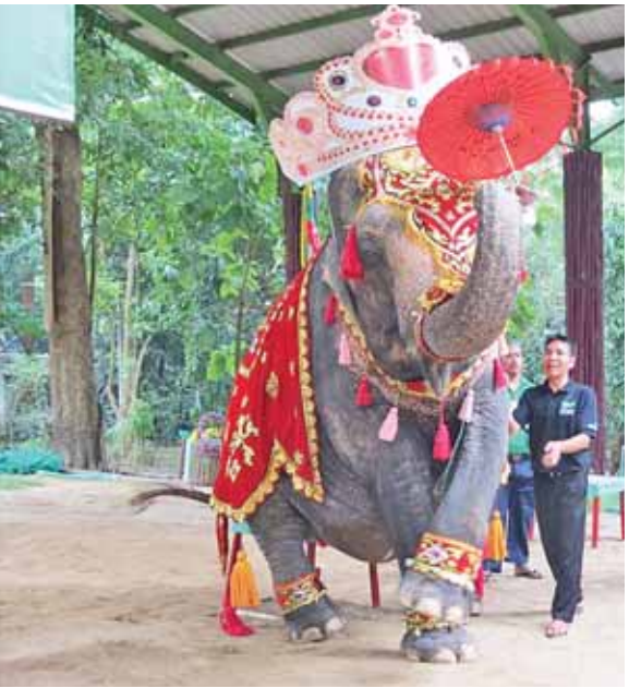
ဆင်မကြီးမိမိ၏ (၆၂)နှစ်မြောက် မွေးနေ့ပွဲတွင် ပရိသတ်များကို ဖျော်ဖြေနေစဉ်။