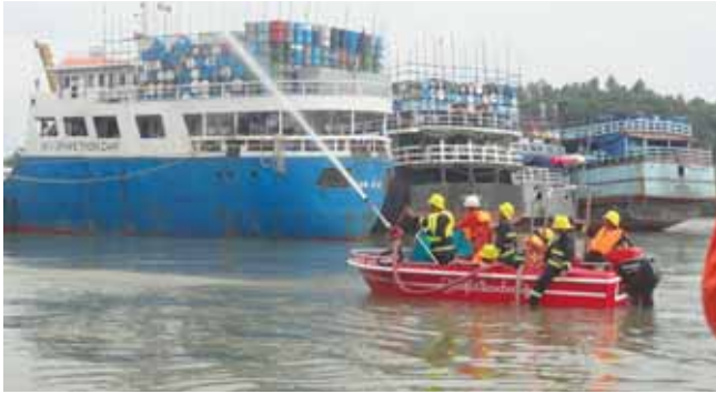
လယ်ကမ်းစပ်နေ ပြည်သူများ၏ အိုးအိမ်များသို့ ကူးစက်လောင်ကျွမ်း ပျက်စီးဆုံးရှုံးမှု ကြုံတွေ့နိုင်ပြီး ရေယာဉ်မီးလောင်ကျွမ်းမှုဖြစ်စဉ်များ အခါအားလျော်စွာ ဖြစ်ပေါ်လေ့ရှိသဖြင့် မြို့နယ်မီးသတ်

ကျောသောင်းမြို့သည် ပင်လယ်ဝန်းရံလျက်ရှိသည့် ဆိပ်ကမ်းမြို့ဖြစ်သည့်အားလျော်စွာ ပင်လယ်ကမ်းရိုးတန်းသွား ကုန်တင်ရေယာဉ်ကြီးများ၊ ခရီးသည်တင်ရေယာဉ်ကြီးများ၊ ဒေသခံပြည်သူများ၏ ငါးဖမ်းရေယာဉ်ငယ်များ သွားလာဝင်ထွက် ဆိုက်ကပ်မှုများပြားပြီး ရေလုပ်ငန်းဖြင့် အသက်မွေးဝမ်းကျောင်းပြုသည့် မြို့နေပြည်သူများ၏ နေအိမ်များ ပင်လယ်ကမ်းစပ်တစ်လျှောက် အစီအစဉ်ဆောင်ရွက်လုပ်ငန်းထိုင်ကြသဖြင့် ရေယာဉ်များ မီးဘေးကြုံတွေ့ပါက ပင်