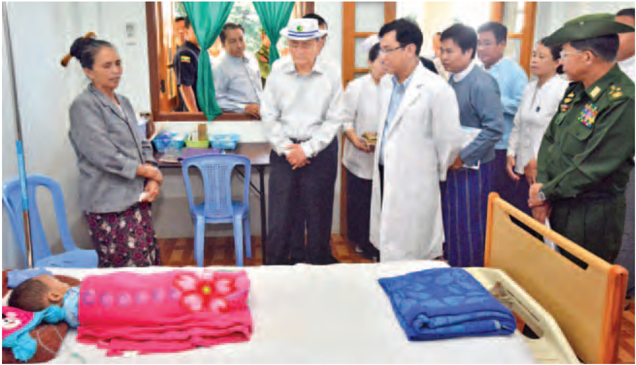
ကွင်းဆင်းလေ့လာပြီး ဘီလူးချောင်းပေါ်တွင် ဓာတ်အားပေးစက်ရုံ သုံးရုံ တည်ဆောက်လျှင်(၁၂၄)မဂ္ဂါဝပ်ရရှိနိုင်ကြောင်းနှင့် အင်းလေးကန်မှရေကို ရေလှောင်ကန်တစ်ခုပြုလုပ်ထိန်းသိမ်းပေးခြင်းဖြင့် (၂၄၀) မဂ္ဂါဝပ်ခန့်ရရှိနိုင်ကြောင်း တင်ပြခဲ့သည်။

အဆိုပါ ဆေးရုံကြီးသည် ကျန်းမာရေးဝန်ဆောင်မှုကောင်းခြင်းနှင့် အခမဲ့ကုသပေးမှုများကြောင့် ဆေးကုသမှုခံယူသည့် လူနာများမှာ ၂၀၁၁ ခုနှစ်တွင် ၁၄၉၈၆ ဦး၊ ၂၀၁၂ ခုနှစ်တွင် ၂၀၇၀၆ ဦး၊ ၂၀၁၃ ခုနှစ်တွင် ၂၄၁၀၄၂၊ ၂၀၁၄ ခုနှစ်တွင် ၂၇၄၄၈ ဦးနှင့် ၂၀၁၅ ခုနှစ် အောက်တိုဘာလအထိ ၂၄၀၅၄