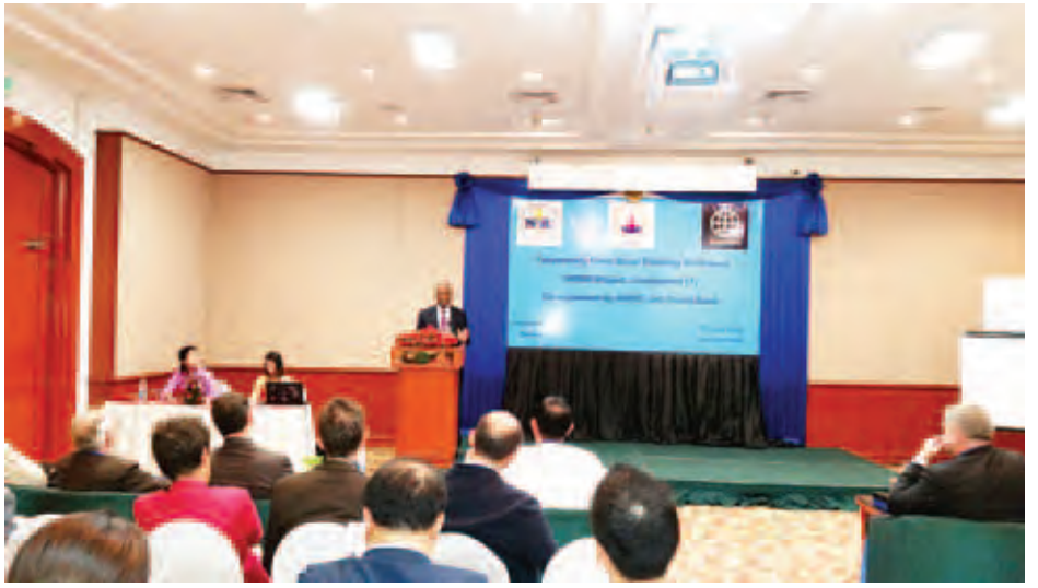
ပေးဝေရေးလုပ်ငန်းများနဲ့ ပတ်သက်ပြီး ရေရရှိအကျိုးရှိ စေဖို့အတွက် ပူးပေါင်းဆောင်ရွက်ကြဖို့လည်း တိုက်တွန်း လိုပါတယ်”ဟု ကမ္ဘာ့ဘဏ်၏ ဌာနကိုယ်စားလှယ် Dr. Abdulaye Seck က ပြောသည်။ အဆိုပါ အခမ်းအနားတွင် ဧရာဝတီမြစ်ဝှမ်းဖွံ့ဖြိုး

“မြန်မာနိုင်ငံမှာ ရေရရှိဖွံ့ဖြိုးတိုးတက်မှုတွေ ဖြစ်ပေါ်စေဖို့ ပံ့ပိုးကူညီဆောင်ရွက်သွားမှာဖြစ်ပါတယ်။ ရေအားလျှပ်စစ်ထုတ်လုပ်ရေး၊ ရေကြောင်းသွားလာမှု တိုးတက်ကောင်းမွန်စေရေး၊ စိုက်ပျိုးရေးနဲ့ သောက်သုံးရေ