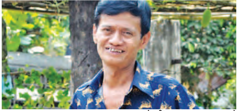
(ဇာတ်ပုံ - Myanmar Online News)

ရုပ်ရှင်ရိုက်ကူးရန်အတွက် လိုင်စင်ကြေး၊ ဒါရိုက်တာကြေးနှင့် ဇာတ်လမ်း၊ ဇာတ်ညွှန်းကြေးများ ပေးချေထားသော်လည်း ပျက်ကွက်ကာ အခြားရုပ်ရှင်ထုတ်လုပ်ရေးလုပ်ငန်းတစ်ခုနှင့် ရိုက်ကူးထုတ်လုပ်ခဲ့သဖြင့် တိုင်ကြားခံရသူတို့ကို ခေါ်ယူသော်လည်း လာရောက်ဖြေရှင်းခြင်းမရှိသောကြောင့် မူလတိုင်ကြားသူသဘောအတိုင်း ဆက်လက်လုပ်ဆောင်နိုင်သည်ဟု မြန်မာနိုင်ငံရုပ်ရှင်အစည်းအရုံးက ပြန်ကြားထားကြောင်း သိရသည်။