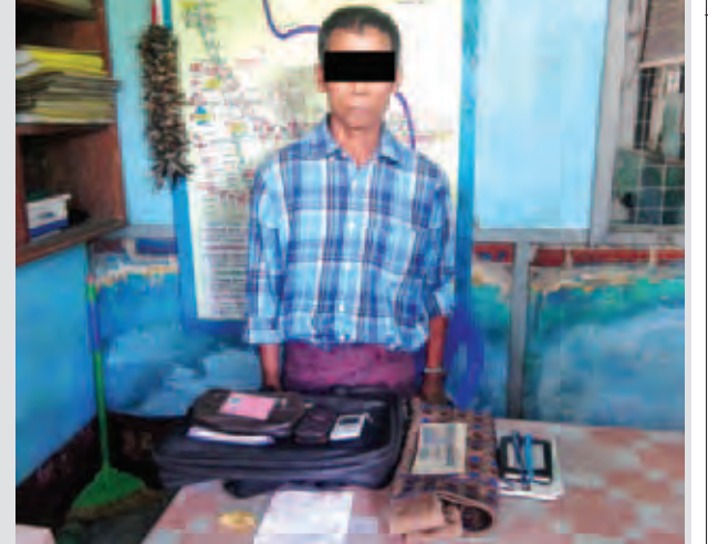
နှစ်လုံး၊ သုံးလုံး ချွဲထိလောင်းကစားရာတွင်အသုံးပြုသည့် သက်သေခံပစ္စည်း၊ စာရွက်စာတမ်း၊ လောင်းကြေးငွေများနှင့်အတူ ရွှေဆွဲကြိုးအတူ၊ ဘောက်ချာစရွက်တို့အား သိမ်းဆည်းရမိ၍ တပ်ကုန်းမြို့မရဲစခန်းက အရေးယူဆောင်ရွက်လျက်ရှိကြောင်း သိရသည်။