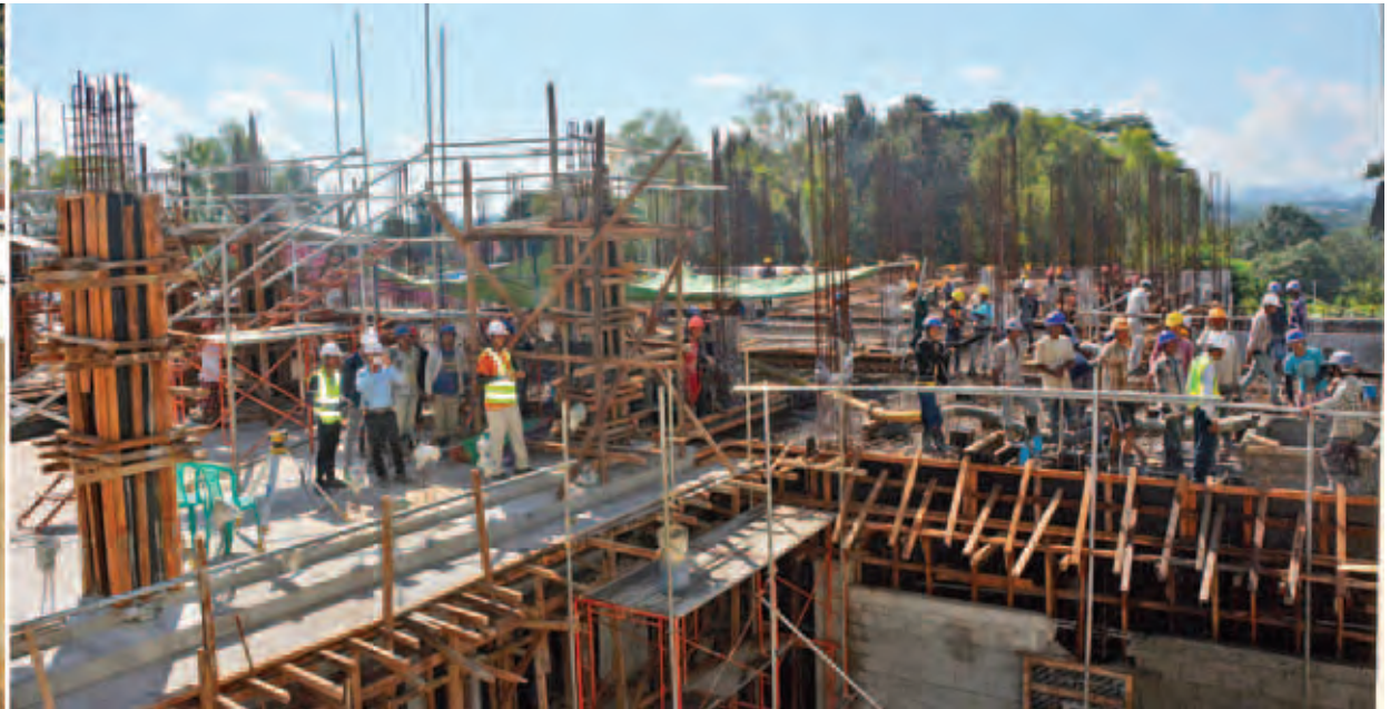
နိုင်ငံတော်သမ္မတ ဦးသိန်းစိန် လွိုင်ကော်ပြည်နယ်ပြည်သူ့ဆေးရုံ တိုးချဲ့ဆေးရုံတည်ဆောက်ခြင်းလုပ်ငန်းကို ကြည့်ရှုစစ်ဆေးစဉ်။ (သတင်း-ရှေ့ဖုံး)