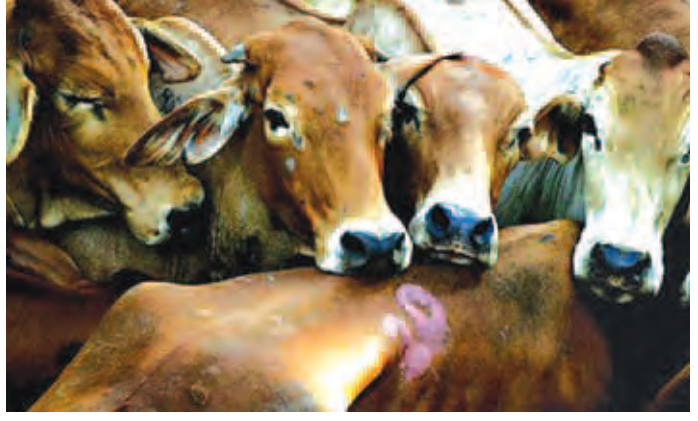
ပိုးရောင်းချနေခြင်းဖြစ်ကြောင်း ယင်းဒေသခံများထံမှ သိရသည်။ ထို့ကြောင့်တရားမဝင် ကျွဲ၊ နွားကုန်ကူးခြင်းသည် ဒေသတွင်းရှိတောင်သူများ၏ လယ်ယာလုပ်ငန်းခွင်သို့ ခိုင်းကျွဲ၊ ခိုင်းနွားများ ပျောက်ဆုံးမှု ဘေးအန္တရာယ်ကျရောက်လာစေပြီး တရားမဝင် ကျွဲ၊ နွားများကုန်ကူးခြင်းသည် တိုင်းဒေသကြီး အစိုးရအဖွဲ့၏ အခွန်ဘဏ္ဍာများကို ထိခိုက်နစ်နာစေကြောင်း သိရသည်။ စိုင်းလူမင်း

ကန်ဘလူ အောက်တိုဘာ ၁၇ တရားမဝင်ကုန်သွယ်မှုများသည် တိုင်းပြည်၏အခွန်ဘဏ္ဍာများကို ထိခိုက်နစ်နာစေနိုင်ခြင်းကြောင့် သက်ဆိုင်ရာကတရားမဝင်ကုန်သွယ်မှုများကို မျက်မြင်မပြတ် လေ့လာစောင့်ကြပ်၍ ဖော်ထုတ်ဖမ်းဆီးလျက်ရှိသော်လည်း တရုတ်နယ်စပ်မှောင်ခိုဈေးကွက်သို့ တင်ပို့မည့် ကျွဲ၊ နွားများကို ညအချိန်များ၌ ဖြတ်သန်းသွားလာနေကြောင်း မျက်မြင်တွေ့ရှိသည့် ဒေသခံများက ပြောသည်။ အဆိုပါ တရားမဝင် ကျွဲ၊ နွားမှောင်ခိုကုန်ကူးသူများသည် စစ်ကိုင်းတိုင်းဒေသကြီး ကန်ဘလူမြို့နယ်နှင့် ကောလင်း၊ ဝန်းသို၊ ပင်လည်ဘူးအတွင်းရှိ ကျေးရွာများတွင် ကျွဲ၊ နွားများကိုစုဆောင်းပြီး ကန်ဘလူမြို့နယ်မှ ဝယ်ယူစုဆောင်းထားသည့် ကျွဲ၊ နွားများကို ကိုးတောင်ဘို့နယ် မိဿလင်းကုန်းကျေးရွာများအနီးရှိ ယာခင်း