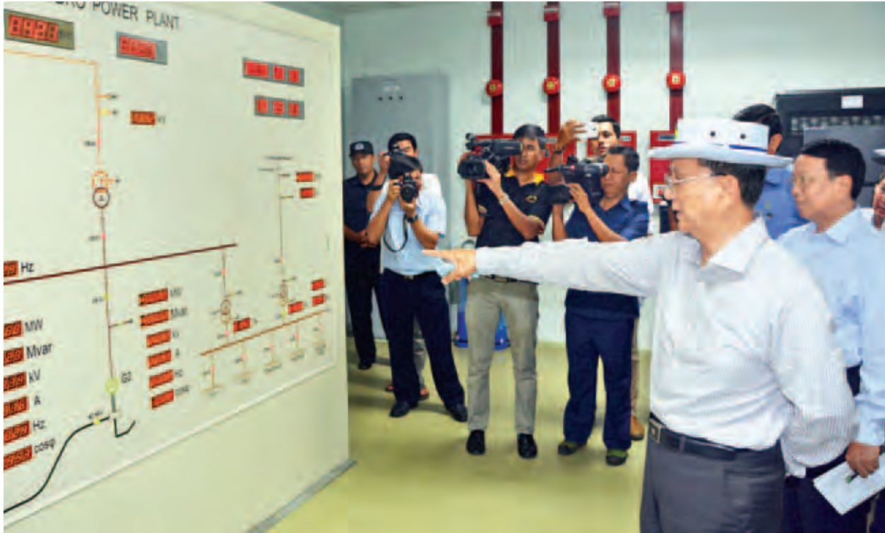
နိုင်ငံတော်သမ္မတ ဦးသိန်းစိန် ဘီလူးချောင်း အမှတ်(၃)ရေအားလျှပ်စစ်စက်ရုံအတွင်း ကြည့်ရှုစစ်ဆေးစဉ်။ (သတင်းစဉ်)

၁၉၅၄ ခုနှစ်တွင် ဘီလူးချောင်းအမှတ်(၂)ဓာတ်အားပေးစက်ရုံ၏ ပထမအဆင့်စက်သုံးလုံးကို တည်ဆောက်ခဲ့ရာ ၁၉၆၀ ပြည့်နှစ်တွင် ပြီးစီး၍ (၈၄) မဂ္ဂါဝပ်အား စတင်ထုတ်လုပ်ဖြန့်ဖြူးပေးနိုင်ခဲ့သည်။