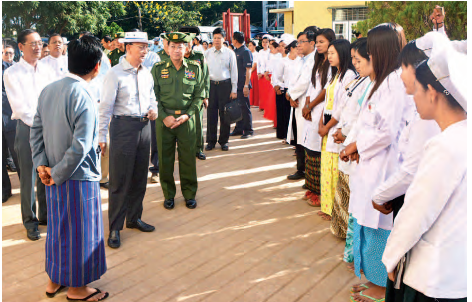
နိုင်ငံတော်သမ္မတ ဦးသိန်းစိန် လွိုင်ကော် ပြည်နယ်ပြည်သူ့ဆေးရုံရှိ ဆရာဝန်များ၊ သူနာပြုများ၊ ကျန်းမာရေးဝန်ထမ်းများအား ရင်းရင်းနှီးနှီး နှုတ်ဆက်စဉ်။ (သတင်းစဉ်)