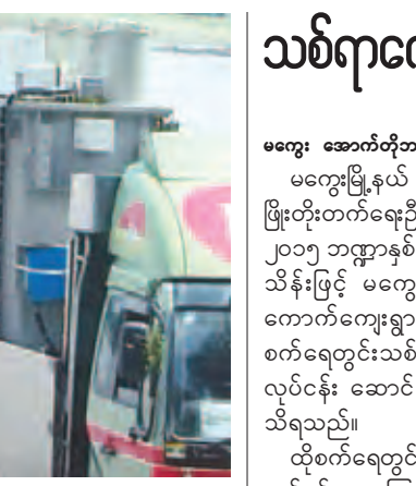
KV ဓာတ်အားပို့လွှတ်နိုင်ရေး 200KV ထရန်စဖော်မာ နှစ်လုံးတပ်ဆင်၍ 11KV ဓာတ်အားလိုင်းကြိုးများ တပ် ဆင်ပြီးစီးပြီဖြစ်ရာ ဓာတ်အားရရှိပါ က မြို့ အတွင်း နေရာညပါ ၂၄ နာရီ လျှပ်စစ်မီးသုံးစွဲရတော့မည်ဖြစ် သည်။ ရင်းတွင်းသား(iprd)

စစ်ကိုင်းတိုင်းဒေသကြီး မင်းကင်း မြို့အတွက် ရန်ကုန်(တောင်ပိုင်း) စက်မှုဝန်ကြီးဌာနရှိ အလုပ်ရုံမှ ပေးပို့ သော 66/11 KV. 5 MVA ထရန်စဖော် မာအား ရွှေပြည်တော်ကုမ္ပဏီက ရန်ကုန်မြို့မှ မင်းကင်းမြို့သို့ အောက် တိုဘာ ၆ ရက်ကရောက်ရှိခဲ့သည်။ ယခင်က မင်းကင်းမြို့တွင် တစ်နေ့ နှစ်နာရီကြာ မီးစက်ဖြင့် မြို့တွင်းမီး များ ဖြန့်ဝေပေးခဲ့ပြီး (303-D005 AN စက်အမျိုးအစားဖြင့် တစ်နေ့ လေး နာရီဖြင့်ပိုမိုဖြန့်ဝေပေးလျက်ရှိသည်။ ယခုအခါ 66/11 5 MVAစက်အား ခွဲရုံ တည်ဆောက်ပြီး မြို့တွင်းသို့ 11