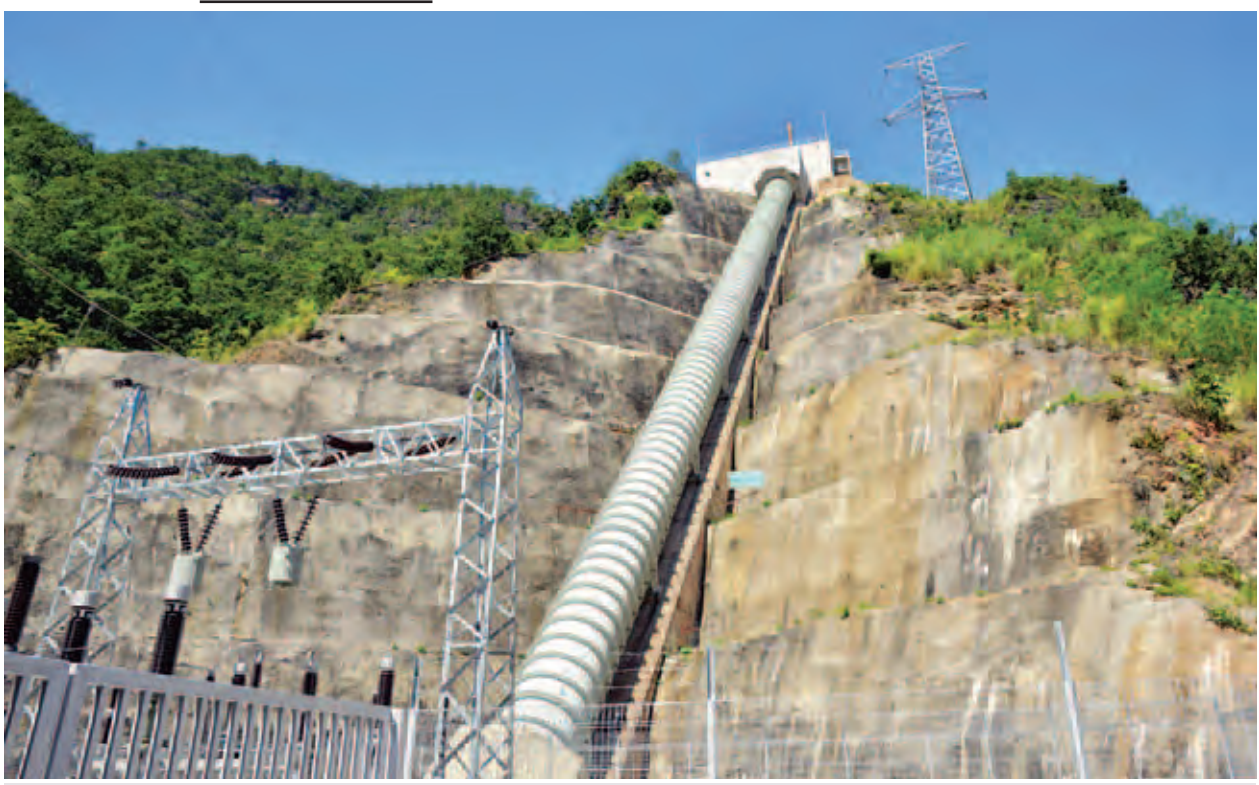
ဘီလူးချောင်း အမှတ်(၃)ရေအားလျှပ်စစ်စက်ရုံ၏ ရေသွယ်ပိုက်လိုင်းအား တွေ့ရစဉ်။ (သတင်းစဉ်)

ဘီလူးချောင်းပေါ်တွင် ရေအားလျှပ်စစ်စီမံကိန်းများ အကောင်အထည်ဖော်ဆောင်ရွက်နိုင်ရန် အမေရိကန်နိုင်ငံ KTA ကုမ္ပဏီက ၁၉၅၃ ခုနှစ်တွင် စတင်လေ့လာအစီရင်ခံစာတင်ပြခဲ့ရာ ယင်းအစီရင်ခံစာကို အခြေခံ၍ ၁၉၅၄ ခုနှစ်နှစ်ဆန်းပိုင်းတွင် ဂျပန်နိုင်ငံ Nippon Koei ကုမ္ပဏီမှ ဘီလူးချောင်းဒေသကို