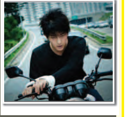
မေရဲ့ဆင်း - ရေးသားသည်

အဆိုပါရွေးချယ်မှု၏ နံပါတ်(၂)နှင့်(၃)နေရာ တွင် ရုပ်တည်နေသော Wall-E နှင့် Finding Nemo ကာတွန်းဇာတ်ကား နှစ်ကားကိုလည်း ဒစ္စနေပစ်ဇာမှ တင်ဆက်ခဲ့ခြင်းဖြစ်သည်။