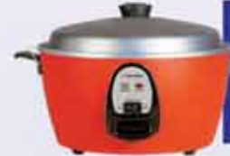
ဘက်စုံသုံးပေါင်းအိုး

စပရင်မွေ့ရာ၊ ရေမြှုပ်မွေ့ရာ၊ ပရိဘောဂ၊ မင်္ဂလာခန်းဝင်ပစ္စည်း အမျိုးမျိုးအပြင် ပြည်ပမှ တင်သွင်းသော အိပ်ခန်းသုံး ပစ္စည်းအမျိုးမျိုး နှင့် မီးဖိုချောင်သုံး ပစ္စည်းအမျိုးမျိုးတို့အား