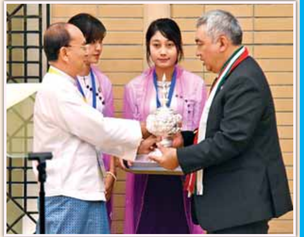
နိုင်ငံတော်သမ္မတ ဦးသိန်းစိန် ချင်းအမျိုးသားတပ်ဦး (CNF) ဥက္ကဋ္ဌ ဦးပူးနန်လျန်ထန်အား လက်ဆောင်ပစ္စည်းပေးအပ်စဉ်။ (သတင်းစဉ်)