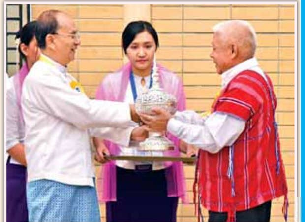
နိုင်ငံတော်သမ္မတ ဦးသိန်းစိန် ကရင်အမျိုးသားအစည်းအဖွဲ့/ကရင် အမျိုးသားလွတ်မြောက်ရေးတပ်မတော် (KNU / KNLA-PC) မှ စောရင်နုအား လက်ဆောင်ပစ္စည်းပေးအပ်စဉ်။ (သတင်းစဉ်)