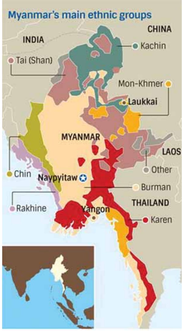
ဒီမိုကရေစီအမြစ်တွယ်ခိုင်မာဖို့အတွက် လုပ်ဆောင်နေခြင်းလည်း ဖြစ်ပါတယ်။