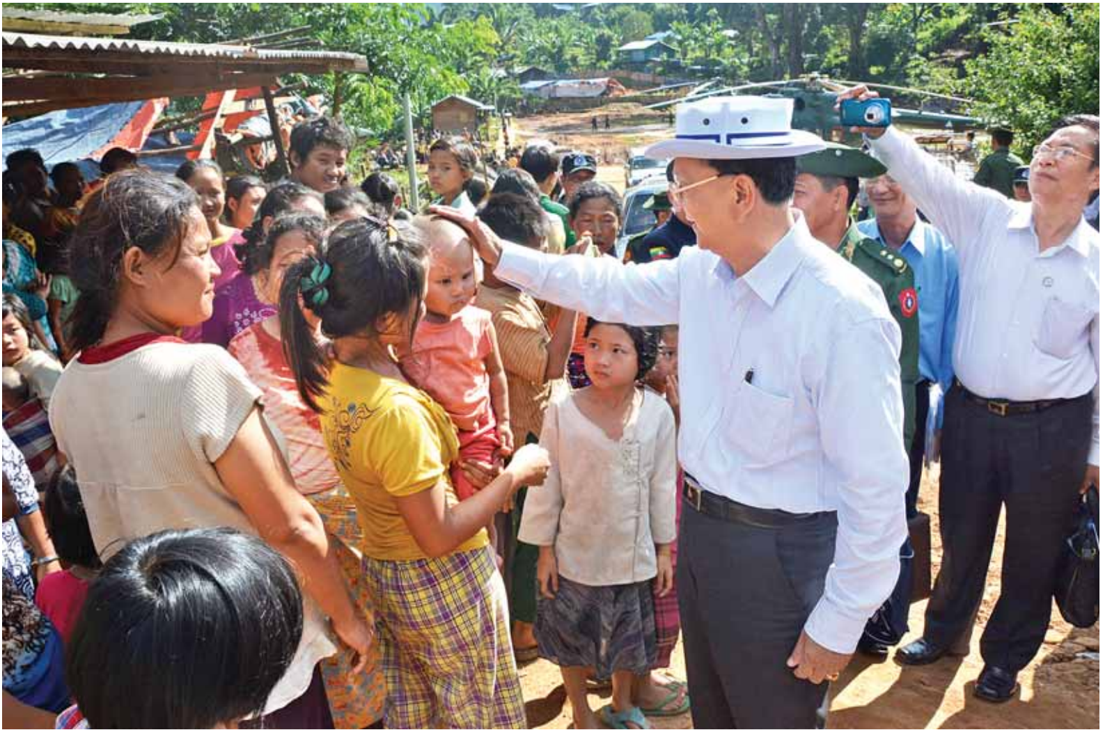
နိုင်ငံတော်သမ္မတ ဦးသိန်းစိန် မော်ချီးဒေသမှ ဘေးသင့်ပြည်သူများအား ရင်းရင်းနှီးနှီးနှုတ်ဆက်အားပေးစဉ်။

အဆိုပါ ယာယီကယ်ဆယ်ရေးစခန်းတွင် ဘေးသင့်ပြည်သူ ၁၂၉ ဦးကို လိုအပ်သည့်ကူညီထောက်ပံ့မှုများနှင့် ကျန်းမာရေးစောင့်ရှောက်မှုများ ဆောင်ရွက်ပေးလျက်ရှိသည်။ စာမျက်နှာ ၅ ကော်လံ ၁ သို့ ❖