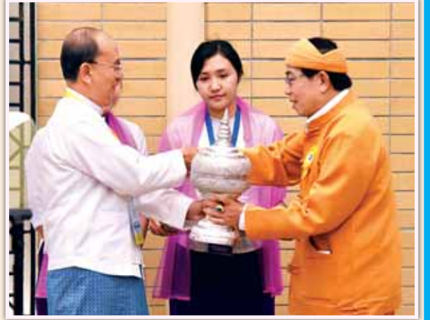
နိုင်ငံတော်သမ္မတ ဦးသိန်းစိန် ရှမ်းပြည်နယ် ပြန်လည်ထူထောင်ရေး ကောင်စီ/ရှမ်းပြည်တပ်မတော် (တောင်ပိုင်း) (RCSS/SSA-S) ဥက္ကဋ္ဌ ဦးရွှင်ဆစ်အား လက်ဆောင်ပစ္စည်းပေးအပ်စဉ်။ (သတင်းစဉ်)