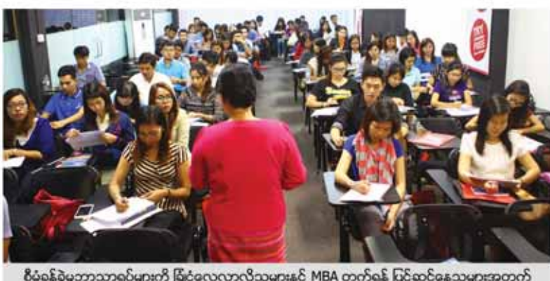
စီမံခန့်ခွဲမှုဘာသာရပ်များကို ဖြင့်လေ့လာလိုသူများနှင့် MBA တက်ရန် ပြင်ဆင်နေသူများအတွက်