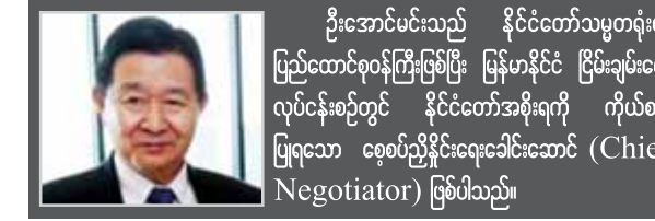
ဦးအောင်မင်းသည် နိုင်ငံတော်သမ္မတရုံး၏ ပြည်ထောင်စုဝန်ကြီးဖြစ်ပြီး မြန်မာနိုင်ငံ ငြိမ်းချမ်းရေး လုပ်ငန်းစဉ်တွင် နိုင်ငံတော်အစိုးရကို ကိုယ်စား ပြုရသော စေ့စပ်ညှိနှိုင်းရေးခေါင်းဆောင် (Chief Negotiator) ဖြစ်ပါသည်။

ငြိမ်းချမ်းရေးလုပ်ရတာ တကယ်မလွယ်ကူတဲ့ အလုပ်ပါ။ ကိုယ်နဲ့ အရင်တုန်းက ရန်သူဖြစ်ဖူးတဲ့ သူတွေနှင့် သူငယ်ချင်းလုပ်ရတဲ့ အလုပ်၊ တစ်ခါတလေ ကိုယ်နဲ့ သေတူရှင်ဖက် ဖြစ်နေတဲ့ ကိုယ့်ရဲဘော်တွေကိုတောင် မာမာထန်ထန်ပြောရတဲ့ အလုပ်လည်း ပါဝင်ပါတယ်။ လေးနှစ်တာကာလ ပတ်လုံး ကျွန်တော်နှင့်အတူ ကဏ္ဍပေါင်းစုံ၊ ဘက်ပေါင်းစုံကနေပြီးတော့ ငြိမ်းချမ်းရေးအတွက် အားသွန်ခွန်စိုက် မနားမနေ ကြိုးပမ်းအားထုတ်ခဲ့တဲ့သူ တွေကို ပြောချင်ပါတယ်။ ကျွန်တော်တို့က အရင်တုန်းက ရန်သူတွေပါ။ အခုတော့ ငြိမ်းချမ်းရေးအတွက် ကျားကုတ်ကျားခဲ ဆောင်ရွက်နေကြတဲ့ အကျိုးတူပါတနာတွေဖြစ်ပါတယ်။ လက်နက်ကိုင်ပဋိပက္ခတွေရဲ့ ဒဏ်ကို လည်း တိုက်ရိုက်ခံစားခဲ့ကြဖူးပါတယ်။ အခုတော့ ကျွန်တော်တို့အားလုံးက ငြိမ်းချမ်းရေးဆွေးနွေးပွဲမှာ အတိတ်ဒဏ်ရာကိုယ်စီနှင့်အတူ ရောက်ရှိနေပြီ ဖြစ်ပါတယ်။ ကျွန်တော်တို့အရှေ့က သွားနှင့်လေပြီးတဲ့ ရဲဘော်တွေလိုပဲ ကျွန်တော်တို့ မသေဆုံးခင်အချိန်လေးမှာ ကျွန်တော်တို့ ခံစားနာကျင်ခဲ့ သလိုမျိုး ကျွန်တော်တို့ရဲ့ အနာဂတ်ကလေးတွေ မခံစားရစေမယ့် လမ်းကြောင်းအသစ်တစ်ခုကို ကျွန်တော်တို့ ရှာဖွေတွေ့ရှိပြီးဖြစ်ပါတယ်။ နည်းသည့်ဖြစ်စေ၊ များသည့်ဖြစ်စေ ကျွန်တော်တို့အားလုံးအတူတူ ရယူ ဆွတ်ခူးနိုင်ခဲ့တဲ့ အောင်မြင်မှုတွေကို ခင်ဗျားတို့အားလုံးနှင့် မျှဝေခံစားခွင့်ရတဲ့ အတွက် ကျွန်တော်အတိုင်းမသိဂုဏ်ယူမိပါတယ်။ ကျွန်တော်တို့အားလုံးရဲ့ အနာဂတ်ကောင်းတစ်ခုအတွက် ကျွန်တော်တို့ ဆက်လက်ကြိုးပမ်းဆောင်ရွက် သွားနိုင်ကြပါစေ။ ။