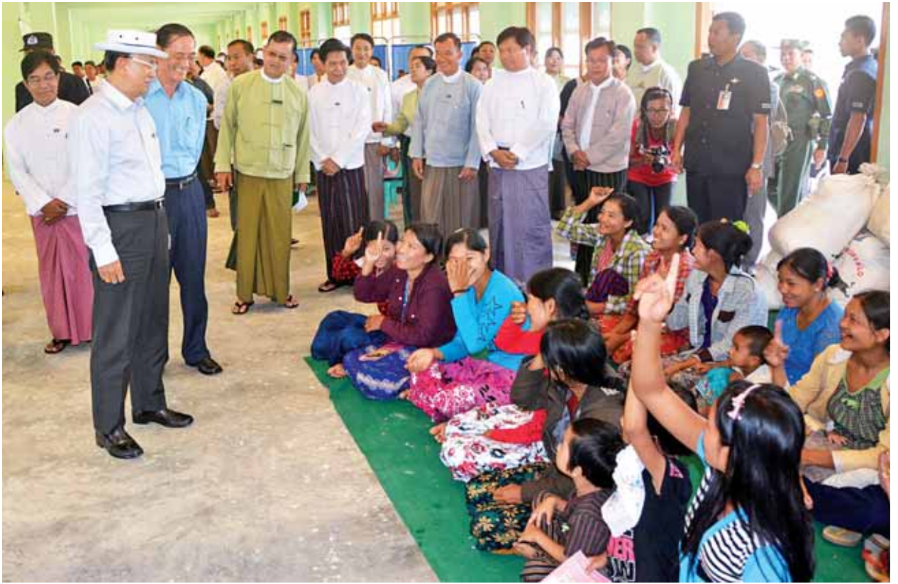
နိုင်ငံတော်သမ္မတ ဦးသိန်းစိန် လွိုင်ကော်မြို့ သာသနာ့ဗိမာန်ရှိ ဘေးသင့်ပြည်သူများအား ရင်းရင်းနှီးနှီး နှုတ်ဆက်အားပေးစဉ်။ (သတင်းစဉ်)

ဆက်လက်အသုံးပြုရန်အတွက် လုံခြုံမှုမရှိတော့သည့် မူလတန်းကျောင်း များကို နေရာသစ်ရွှေ့ချယ်ဆောင်ရွက်ပေးမည်ဖြစ်ကြောင်း။