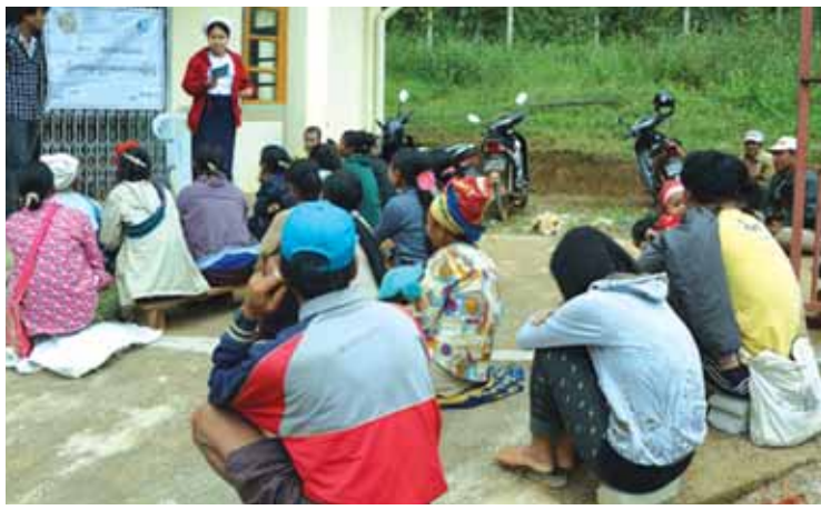
ပြည်သူ့ဆက်ဆံရေးဦးစီးဌာနမှ ဝန်ထမ်းများက နေပြည်တော်ဘူတာကြီးရှိ စာပေရေချမ်းစင်တွင် ပြည်သူများအား စာပေဖတ်ရှုစေရန်အတွက် စာပေရေချမ်းစင် ထားရှိပေးသည့်အတွက် မီးရထားဝန်ထမ်းများ၊ ခရီးသွားပြည်သူနှင့် ရဟန်းသံဃာများ စာပေဖတ်ရှုလေ့လာမှုများ ပြားပြားနေကြောင်း သိရသည်။