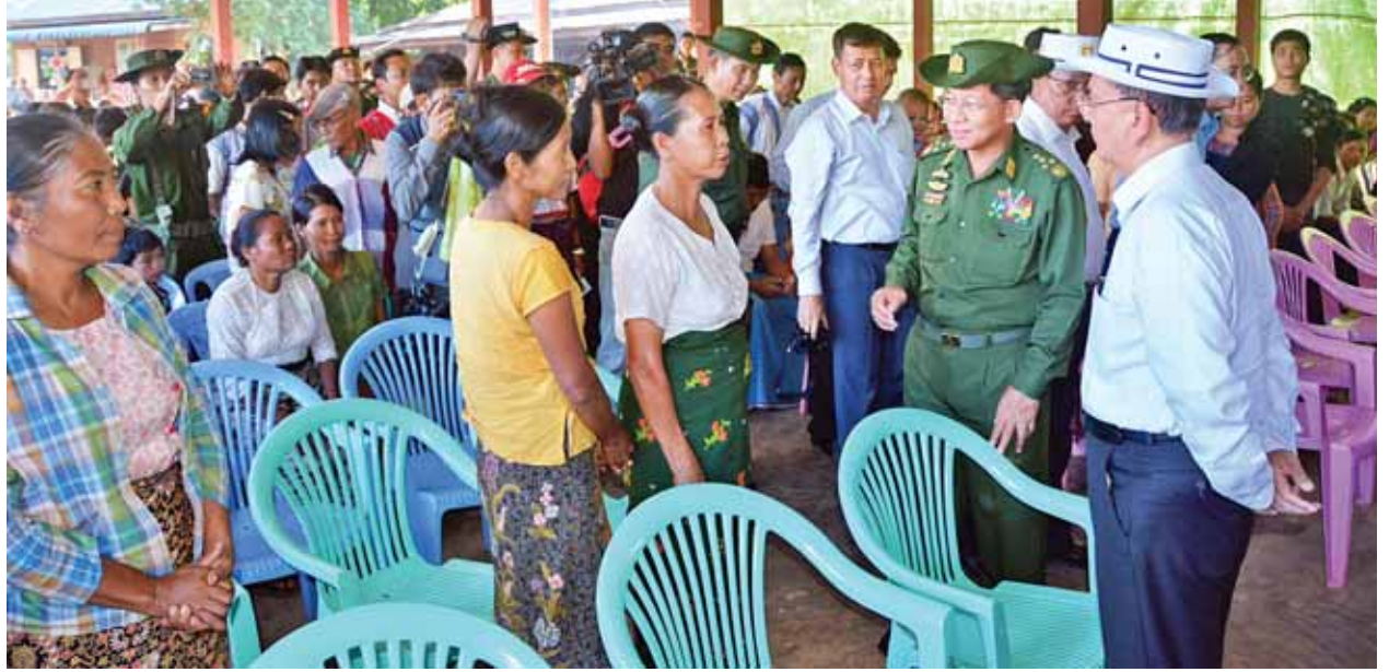
နိုင်ငံတော်သမ္မတ ဦးသိန်းစိန် မော်ချီးဒေသတွင် ဖွင့်လှစ်ထားသည့် ယာယီကယ်ဆယ်ရေးစခန်း၌ ဘေးသင့်ပြည်သူများအား တွေ့ဆုံအားပေးစကား ပြောကြားစဉ်။ (သတင်းစဉ်)

ယင်းနောက် နိုင်ငံတော်သမ္မတ၊ တပ်မတော်ကာကွယ်ရေးဦးစီးချုပ်နှင့် အဖွဲ့သည် မော်ချီးဒေသ လိုခါးလိုကျေးရွာမှ ရဟတ်ယာဉ်များဖြင့် ပြန်လည် ထွက်ခွာခဲ့ကြရာ ညနေပိုင်းတွင် လွိုင်ကော်မြို့သို့ ပြန်လည်ရောက်ရှိကြသည်။ (သတင်းစဉ်)