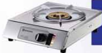
ဂက်(စ်)မီးဖို