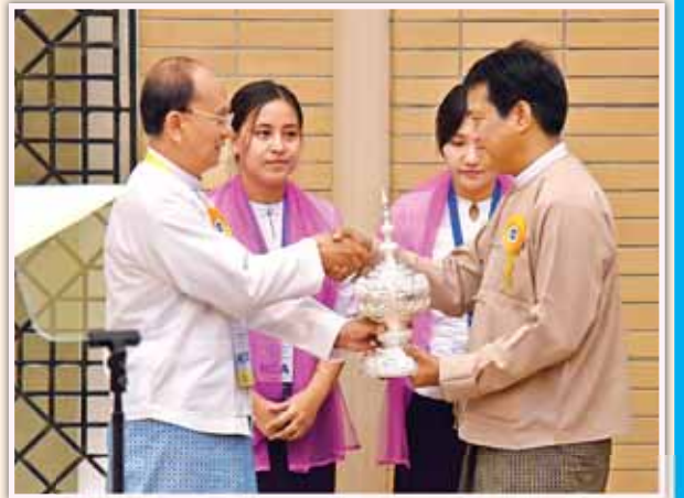
နိုင်ငံတော်သမ္မတ ဦးသိန်းစိန် မြန်မာနိုင်ငံလုံးဆိုင်ရာ ကျောင်းသားများ ဒီမိုကရက်တစ်တပ်ဦး (ABSDF) ဥက္ကဋ္ဌ ရဲဘော်သံခဲအား လက်ဆောင် ပစ္စည်းပေးအပ်စဉ်။