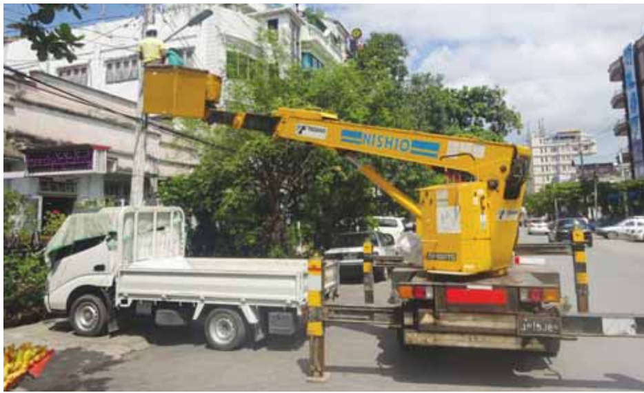
မန္တလေး၊ အောက်တိုဘာ ၁၆

မန္တလေးမြို့သည် စီးပွားရေးဖွံ့ဖြိုးလာပြီး ယာဉ်သုံးစွဲမှုများပြားလာရာ မြို့နေပြည်သူများ ယာဉ်အန္တရာယ်ကင်းရှင်းစေရေး၊ ထိခိုက်မှုလျော့နည်းစေရေး၊ မြို့တွင်းလမ်းများ လုံခြုံမှုအထောက်အကူဖြစ်စေရေးအတွက် မန္တလေးမြို့တော် စည်ပင်သာယာရေးကော်မတီ အဆောက်အအုံနှင့် ကုန်ရုံဌာနက ချမ်းအေးသာစံမြို့နယ်အတွင်း (၈၁)လမ်း၊ (၈၂)လမ်း၊ (၈၃)လမ်းများတွင် LED (၈၀) ဝပ် လမ်းမီးများတပ်ဆင်ခြင်း၊ လျှပ်စစ်အန္တရာယ်ကင်းဝေးစေရေး ဖိုက်ဖာကာ