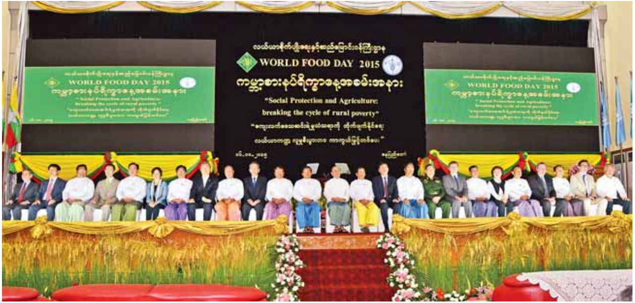
နိုင်ငံတော်သမ္မတ ဦးသိန်းစိန်၊ ပြည်ထောင်စုဝန်ကြီးများ၊ အထူးဧည့်သည်တော်များ၊ ဂုဏ်ပြုမှတ်တမ်း ချီးမြှင့်ခံရသော ပုဂ္ဂိုလ်များနှင့်အတူ မှတ်တမ်းဓာတ်ပုံရိုက်စဉ်။ (သတင်းစဉ်)

ယင်းနောက် နိုင်ငံတော်သမ္မတက အမှာစကားပြောကြားရာတွင် ကမ္ဘာ့ကုလသမဂ္ဂမှ ချမှတ်ထားသည့် ထောင်စုနှစ်ရည်မှန်းချက် (Millennium Development Goals-MDGs) (၁) (၈) အရ ၂၀၁၅ ခုနှစ်တွင် ကမ္ဘာတစ်ဝန်းလုံး ငတ်မွတ်သူဦးရေကို ထက်ဝက်အထိလျော့ချရန် ရည်မှန်းထားရှိပါကြောင်း၊ ၂၀၁၅ ခုနှစ် ဇွန်လအတွင်းက ကျင်းပခဲ့သည့် ကမ္ဘာ့စားနပ်ရိက္ခာနှင့် စိုက်ပျိုးရေးအဖွဲ့၏ (၃၉)ကြိမ်မြောက် ညီလာခံတွင် အဆိုပါထောင်စုနှစ်ရည်မှန်းချက် ပြည့်မီစေရန် ဆောင်ရွက်နိုင်သည့် နိုင်ငံပေါင်း (၇၂)နိုင်ငံတွင် မြန်မာနိုင်ငံပါဝင်ခဲ့ပြီး အသိအမှတ်ပြု ဂုဏ်ပြုလွှာချီးမြှင့်ခြင်းခံရသည့်အတွက် မြန်မာနိုင်ငံ