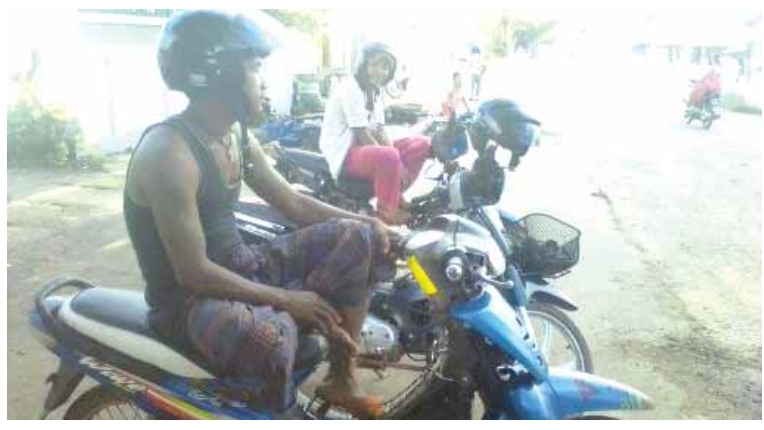
ရေးမြို့နယ်သည် ယခင်ကထက် ဒေသ အတွင်း လမ်းတံတားများမှာ အချိန်အခါမရွေး ဖြတ်သန်းသွားလာနိုင်ကြသည့်အပြင် ပြည် တွင်းခရီးသွားများလည်း အရင်ကထက် ပိုမို လာရောက်ကြ၍ ခရီးသွားလုပ်ငန်းများမှာတွင် ကျယ်လာကြောင်းသိရသည်။ ထွင်ထွင် (ရေး)

“ပုံမှန်တော့မရှိဘူး။ မဆွဲရတဲ့နေ့တွေဆို ကျပ် ၅၀၀၀ လောက်အထိ အနည်းဆုံးရကြပါ တယ်”ဟု ဆိုင်ကယ်ကယ်ရီဆွဲသူတစ်ဦးက ပြောသည်။