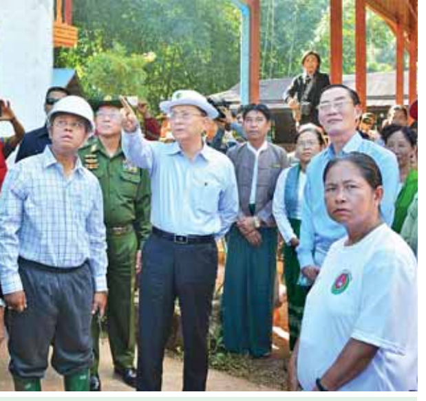
(သတင်းစဉ်)

မော်ချီးမြို့ အနေဖြင့်လည်း မြို့ပြအင်္ဂါရပ်များနှင့်ကိုက်ညီပြီး လုံခြုံစိတ်ချ ရသော၊ ရေရှည်တည်တံ့နိုင်သော၊ သဘာဝဘေးဒဏ်ကို ကာကွယ်နိုင်သော မြို့အဖြစ် ပြန်လည်တည်ဆောက်ရန်အတွက် ပြည်နယ်အစိုးရက ဆောင်ရွက် ပေးသွားမည်ဖြစ်ကြောင်း၊ ပြည်ထောင်စုအစိုးရမှလည်း ကူညီပံ့ပိုးပေးသွားမည် ဖြစ်ကြောင်း။