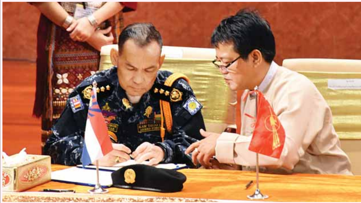
ဒီမိုကရေစီအကျိုးပြု ကရင်အမျိုးသားတပ်မတော် (DKBA) စစ်ဦးစီးချုပ် စောလားဘွယ် တစ်နိုင်ငံလုံးပစ်ခတ်တိုက်ခိုက်မှုရပ်စဲရေး သဘောတူစာချုပ် အား လက်မှတ်ရေးထိုးစဉ်။ (သတင်းစဉ်)