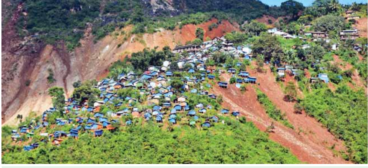
နိုင်ငံတော်သမ္မတ ဦးသိန်းစိန် မော်ချီးဒေသတွင် မြေပြိုမှုအခြေအနေအား ကြည့်ရှုစဉ်။ (သတင်းစဉ်)