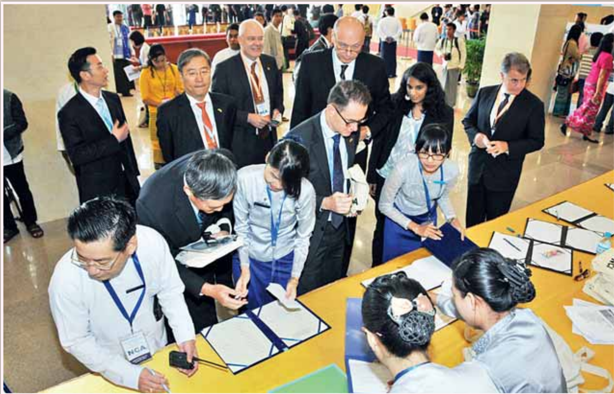
တစ်နိုင်ငံလုံးပစ်ခတ်တိုက်ခိုက်မှုရပ်စဲရေး သဘောတူစာချုပ် လက်မှတ်ရေးထိုးပွဲသို့ တက်ရောက်လာကြသူများအား တွေ့ရစဉ်။ (သတင်းစဉ်)