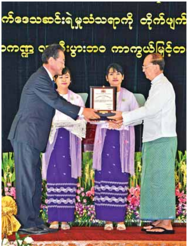
နိုင်ငံတော်သမ္မတ ဦးသိန်းစိန် ကမ္ဘာ့စားနပ်ရိက္ခာနေ့အထိမ်းအမှတ် ဂုဏ်ပြုမှတ်တမ်းလွှာကို ဂျပန်သံအမတ်ကြီးအား ပေးအပ်ချီးမြှင့်စဉ်။ (သတင်းစဉ်)

ထို့နောက် နိုင်ငံတော်သမ္မတသည် ပြည်ထောင်စုဝန်ကြီးများ၊ အထူးဧည့်သည်တော်များ၊ ဂုဏ်ပြုမှတ်တမ်းချီးမြှင့်ခံရသော ပုဂ္ဂိုလ်များနှင့်အတူ မှတ်တမ်းဓာတ်ပုံရိုက်သည်။ (သတင်းစဉ်)