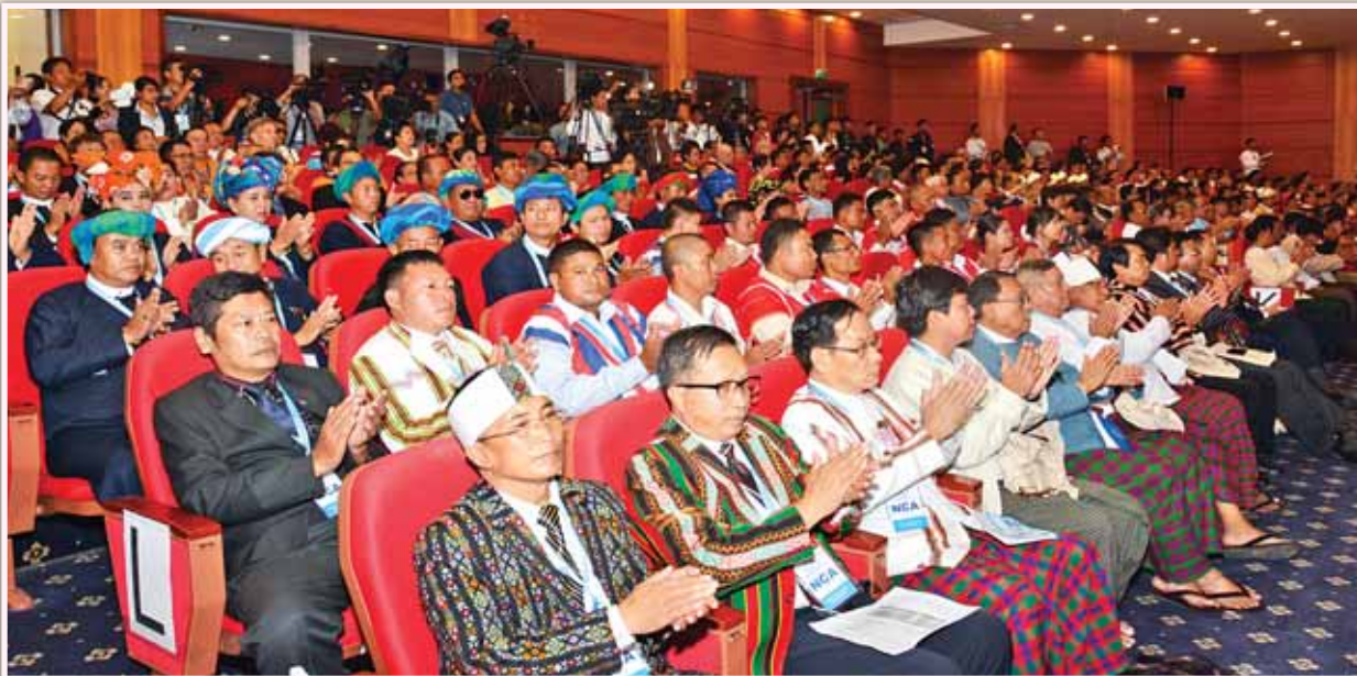
တစ်နိုင်ငံလုံး ပစ်ခတ်တိုက်ခိုက်မှုရပ်စဲရေး သဘောတူစာချုပ် လက်မှတ်ရေးထိုးပွဲသို့ တက်ရောက်လာကြသူများအား တွေ့ရစဉ်။ (သတင်းစဉ်)