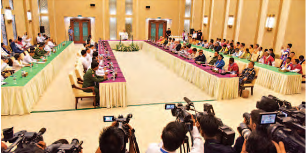
နိုင်ငံတော်သမ္မတ ဦးသိန်းစိန် တစ်နိုင်ငံလုံး ပစ်ခတ်တိုက်ခိုက်မှုရပ်စဲရေးသဘောတူစာချုပ် အကောင်အထည်ဖော်မှုဆိုင်ရာ ညှိနှိုင်းအစည်းအဝေးတွင် အမှာစကားပြောကြားစဉ်။

ဤစာချုပ်ကိုလက်မှတ်ရေးထိုးသည့် နှစ်ဖက်လုံးက ခိုင်ခိုင်မာမာအကောင်အထည်ဖော်နိုင်သည့်အပေါ်တွင် ကျန်ခဲ့သည့်အဖွဲ့များကလည်း ဤဖြစ်စဉ်ထဲတွင် ပါဝင်လာကြလိမ့်မည်ဟုမိမိမျှော်လင့်ပါကြောင်း၊ ယခုစာချုပ်၏ အကောင်အထည်ဖော်မှုက အားလုံးပါဝင်ရေးအတွက် အရေးပါသည့် ဒေါက်တိုင်တစ်ခု ဖြစ်ပါကြောင်း၊ NCA စာချုပ်ကိုအကောင်အထည်ဖော်ရာတွင် အခက်အခဲများစွာနှင့် ရင်ဆိုင်ရမည့် အခြေအနေများရှိလာနိုင်ပါကြောင်း၊ အဆိုပါ အခက်အခဲများကို နှစ်ဖက်ပူးပေါင်းပြီး စိတ်ရှည်သည်းခံမှုများဖြင့် ကျော်လွှားကြရမည်ဖြစ်ပါကြောင်း၊ မိမိတို့၏ ဘုံရည်မှန်းချက်ဖြစ်သည့် ဒီမိုကရေစီဖက်ဒရယ် ပြည်ထောင်စုကြီးကိုအကောင်အထည်ဖော်ရာတွင် ပန်းတိုင်ကိုမျက်ခြည်မပြတ်ရန် အရေးကြီးပါကြောင်း။