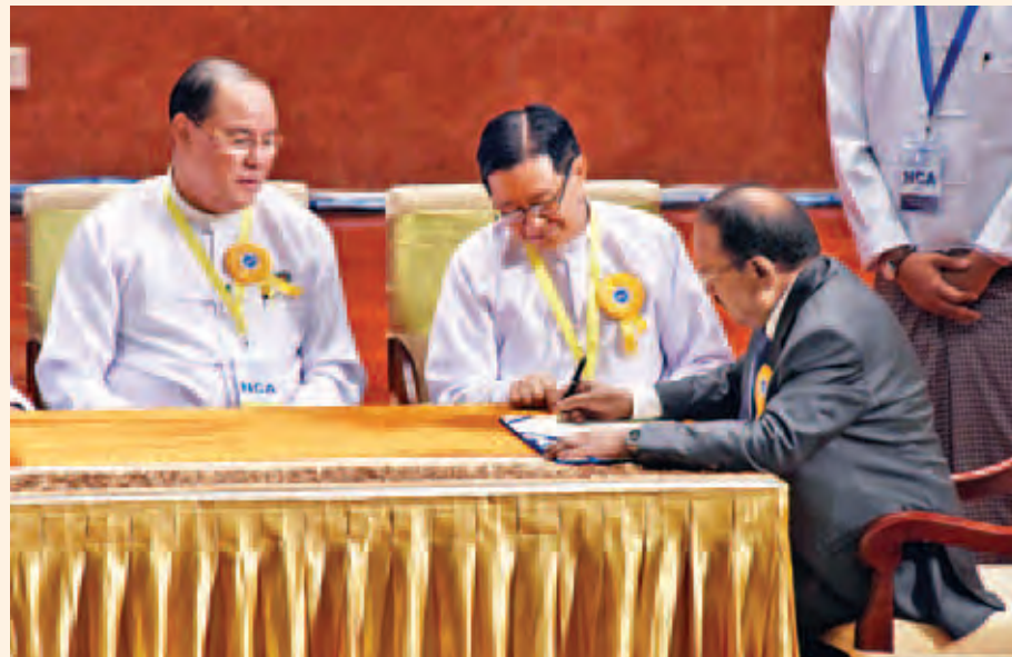
အိန္ဒိယသမ္မတနိုင်ငံမှ အထူးကိုယ်စားလှယ် H.E. Shri Ajit Kumar Doval တစ်နိုင်ငံလုံးပစ်ခတ် တိုက်ခိုက်မှု ရပ်စဲရေးသဘောတူစာချုပ်အား အသိသက်သေအဖြစ် လက်မှတ်ရေးထိုးစဉ်။