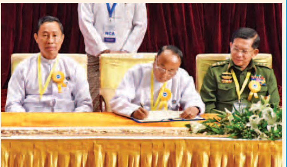
အမျိုးသားလွှတ်တော်ဥက္ကဋ္ဌ ဦးခင်အောင်မြင့် တစ်နိုင်ငံလုံးပစ်ခတ်တိုက်ခိုက်မှုရပ်စဲရေးသဘောတူစာချုပ်အား လက်မှတ်ရေးထိုးစဉ်။ (သတင်းစဉ်)