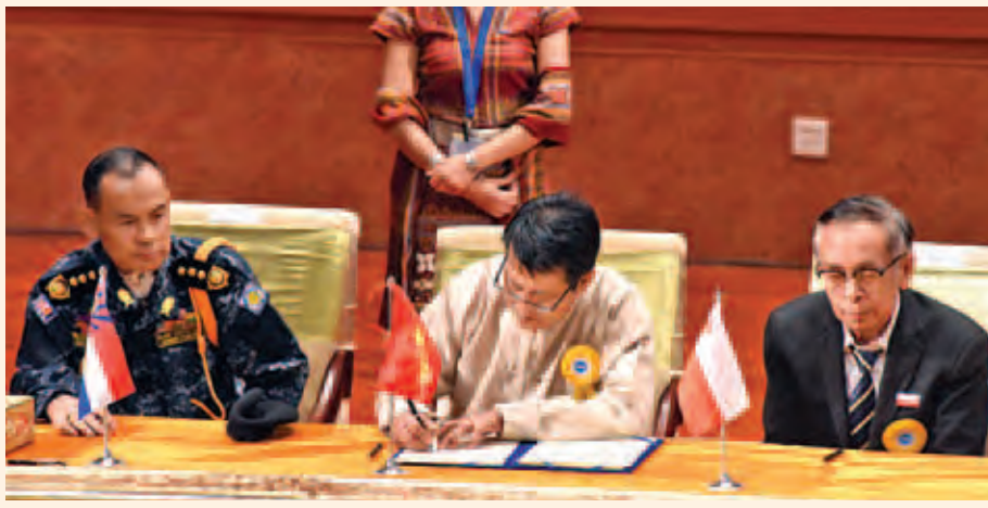
မြန်မာနိုင်ငံလုံးဆိုင်ရာကောင်းသားများဒီမိုကရက်တစ်တပ်ဦး(ABSDF) ဥက္ကဋ္ဌ ရဲဘော်သဲခဲ တစ်နိုင်ငံ လုံးပစ်ခတ်တိုက်ခိုက်မှုရပ်စဲရေး သဘောတူစာချုပ်အား လက်မှတ်ရေးထိုးစဉ်။ (သတင်းစဉ်)