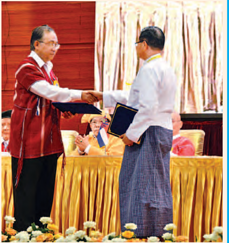
တစ်နိုင်ငံလုံးပစ်ခတ်တိုက်ခိုက်မှု ရပ်စဲရေးသဘောတူစာချုပ်ကို ပြည်ထောင်စုဝန်ကြီး ဦးအောင်မင်းနှင့် KNU အထွေထွေအတွင်းရေးမှူး ပဒိုစောကွယ်ထူးဝင်းတို့ အပြန်အလှန်လဲလှယ်ကြစဉ်။ (သတင်းစဉ်)