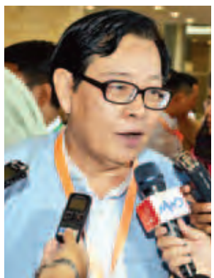
ဦးကျော်ဝင်း

မြန်မာနိုင်ငံရဲ့ နိုင်ငံရေးဖြစ်စဉ်ဟာ မြန်မာနိုင်ငံ ဖွံ့ဖြိုးတိုးတက်ရေးရဲ့ တစ်စိတ်တစ်ဒေသပါ။ ပြီးတော့ ငြိမ်းချမ်းရေးဖြစ်စဉ်အတွက် ယုံကြည်မှုတွေ၊