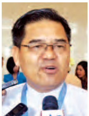
ဦးခက်ထိန်နန်