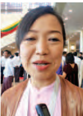
နော်တာဟေးနော်

နားလည်မှုတွေနဲ့ အခုအဆင့်ကနေ ဆက်လက်တည်ဆောက်ကြရဦးမှာပါ။ အခုလိုလက်မှတ်ရေးထိုးဖြစ်ခြင်းဟာ ရှေ့အလားအလာတွေအတွက် ခြေလှမ်းကောင်းတစ်ခုပါ။