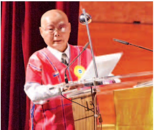
တိုင်းရင်းသားလက်နက်ကိုင်အဖွဲ့များကိုယ်စား ကရင်အမျိုးသားအစည်းအရုံး (KNU) ဥက္ကဋ္ဌ စောမူတူးစေးဖိုး ရှင်းလင်းပြောကြားစဉ်။ (သတင်းစဉ်)

အခမ်းအနားတွင် နိုင်ငံတော်သမ္မတ ဦးသိန်းစိန်က အမှာစကားပြောကြားသည်။ (နိုင်ငံတော်သမ္မတ၏ အမှာစကားကို ရှေ့ဖုံးတွင် ဖော်ပြထားပါသည်။)