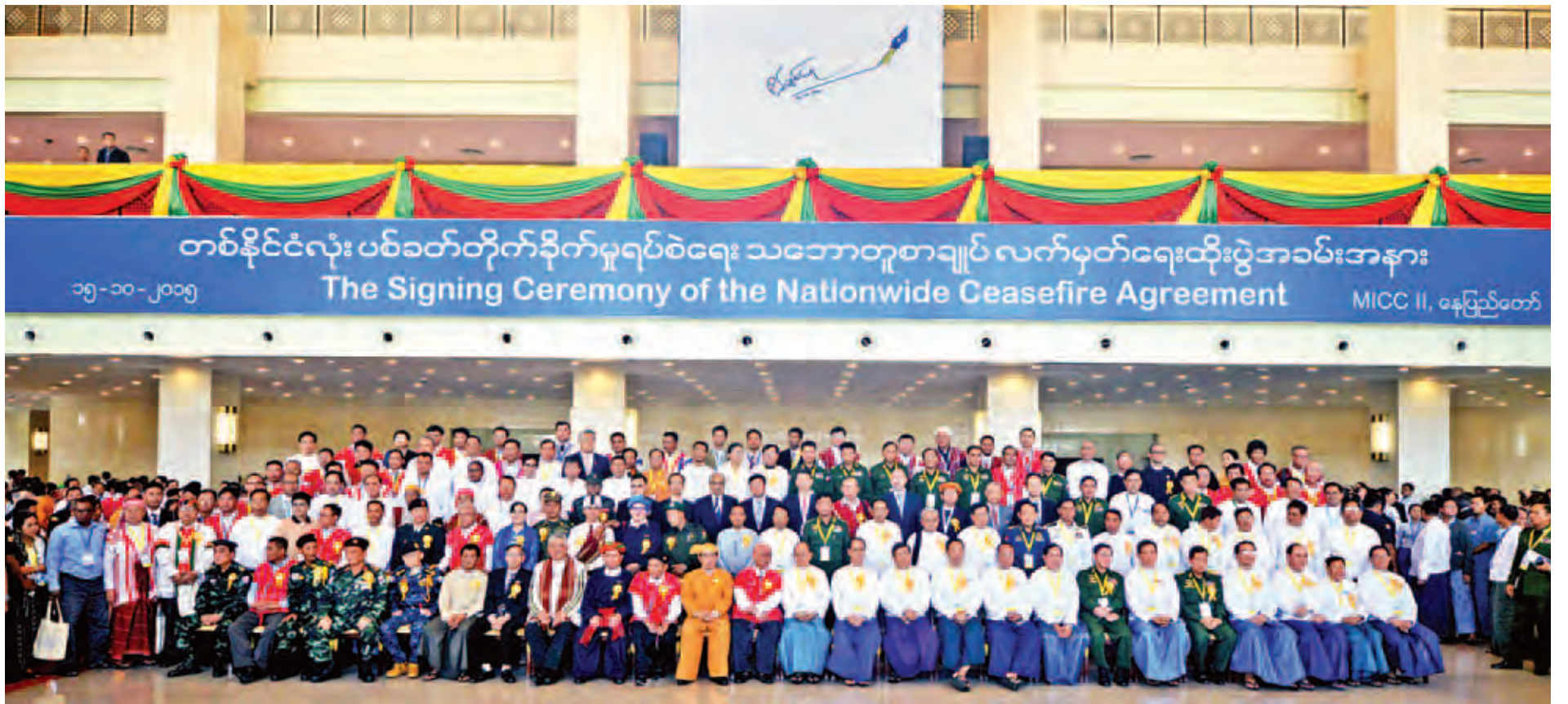
နိုင်ငံတော်သမ္မတ ဦးသိန်းစိန်နှင့် တိုင်းရင်းသားခေါင်းဆောင်များ၊ တက်ရောက်လာကြသူများ စုပေါင်း၍ မှတ်တမ်းတင်ဓာတ်ပုံရိုက်ကြစဉ်။ (သတင်းစဉ်)