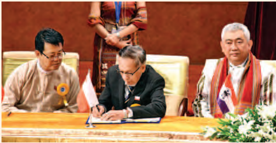
ရခိုင်လွတ်မြောက်ရေးပါတီ(ALP) ဗဟိုဥက္ကဋ္ဌ ဦးခိုင်စိုးနိုင်အောင် တစ်နိုင်ငံလုံးပစ်ခတ်တိုက်ခိုက်မှု ရပ်စဲရေးသဘောတူစာချုပ်အား လက်မှတ်ရေးထိုးစဉ်။ (သတင်းစဉ်)