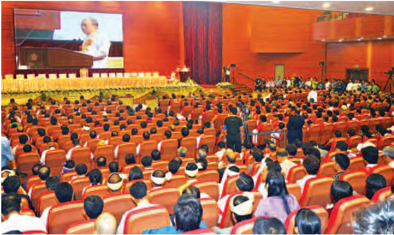
တစ်နိုင်ငံလုံး ပစ်ခတ်တိုက်ခိုက်မှုရပ်စဲရေးသဘောတူစာချုပ်လက်မှတ်ရေးထိုးပွဲ အခမ်းအနား ကျင်းပစဉ်။ (သတင်းစဉ်)

ကျွန်တော်တို့အစိုးရအနေနဲ့ကတော့ အားလုံးလက်ခံတဲ့ ငြိမ်းချမ်းရေး ဖြစ်စဉ်တစ်ခုပေါ်ပေါက်လာဖို့က လက်မှတ်ရေးထိုးရေးထက် ပိုပြီးအရေးကြီး ပါတယ်။ အားလုံးလက်ခံတဲ့ ငြိမ်းချမ်းရေးဖြစ်စဉ်တစ်ခုကို အုတ်မြစ်ချနိုင်ရေး က မြန်မာပြည်အနာဂတ်အတွက် အရေးကြီးတဲ့လုပ်ငန်းစဉ်တစ်ခုလို့ ကျွန်တော် တို့အစိုးရကယူပြီး NCA သဘောတူညီမှုရအောင် အကောင်အထည်ဖော်