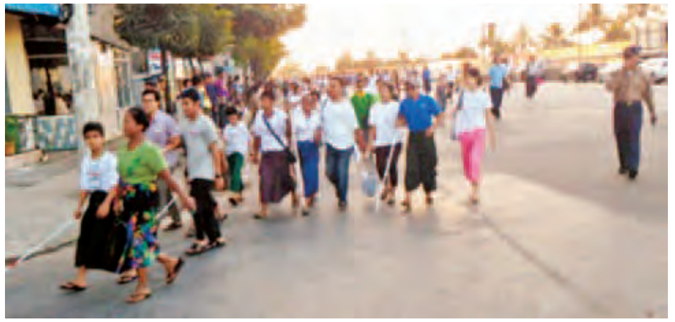
အောက်တိုဘာ ၁၅ ရက် နံနက် ၆နာရီက မျက်မမြင်လမ်းလျှောက်ပွဲကို ရန်ကုန်မြို့လယ်တွင် ကျင်းပရာ ပြိုင်ပွဲလမ်းတစ်လျှောက်တွင် ပြည်သူများက သောက်ရေသန့်များ၊ စားသောက်ဖွယ်ရာများ၊ အလှူငွေများပေးအပ်ပေးနေသည်ကို ကျောက်တံတား၊ ပန်းဘဲတန်း၊ လသာ၊ လမ်းမတော်မြို့နယ်များတွင် မြင်တွေ့ရစဉ်(မောင်စေအောင်)

ဂျပန်-မြန်မာ ပူးပေါင်းဆောင်ရွက်မှုများတွင် ရန်ကုန်မြို့တော် ရေပေးဝေရေးကဏ္ဍအတွက် ရန်ကုန်အရွှေ့ပိုင်းရှိ ဒဂုံမြို့သစ်မြို့နယ်များနှင့် သီလဝါအထူးစီးပွားရေးဇုန် ရေပေးဝေရေးအတွက် ODA Loan အနေဖြင့် အမေရိကန်ဒေါ်လာ သန်း ၂၃၀ ခန့် ကုန်ကျဆောင်ရွက်မည်ဖြစ်ပြီး ရန်ကုန်မြို့တော် ရေပေးဝေရေးစီမံကိန်း ပြင်ဆင်မှုစခန်း အဆင့်မြှင့်တင်ဆောင်ရွက်ခြင်းနှင့် ရေပိုက်လိုင်းများ လဲလှယ်ခြင်းအတွက် Grant Aid ထောက်ပံ့ကူညီမှုဖြင့် ဆောင်ရွက်ခြင်းဖြစ်ပြီး ဂျပန်ယန်း ၁ ဒသမ ၉ ဘီလီယံခန့် ဖြစ်ကြောင်း သိရသည်။ ၂၀၄၀ အထိ ရည်ရွယ်ရေးဆွဲအကောင်အထည်ဖော် ဆောင်ရွက်နေသော ရန်ကုန်မြို့တော် ရေပေးဝေရေးစီမံကိန်းတွင် ထိရောက်စွာ ရေပေးဝေနိုင်ရေးအတွက် ရေလေလွင့်ဆုံးရှုံးမှုများကို အဓိကထားဆောင်ရွက်နေပြီး ၂၀၄၀ ခုနှစ်တွင် ရေဆုံးရှုံးမှုပမာဏ ၁၀ ရာခိုင်နှုန်းအထိ လျော့ကျသွားမည်ဟု သိရသည်။ (၀၀၀)