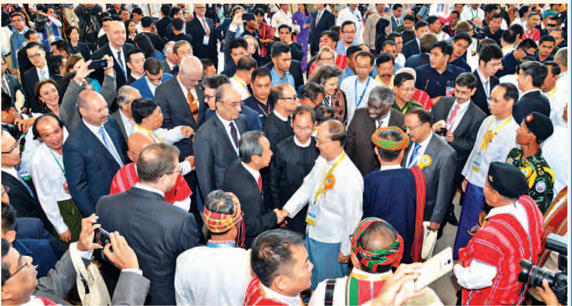
နိုင်ငံတော်သမ္မတ ဦးသိန်းစိန် တစ်နိုင်ငံလုံးပစ်ခတ်တိုက်ခိုက်မှုရပ်စဲရေးသဘောတူစာချုပ် လက်မှတ်ရေးထိုးပွဲအခမ်းအနားသို့ တက်ရောက်လာကြသူများအား ရင်းရင်းနှီးနှီးနှုတ်ဆက်စဉ်။