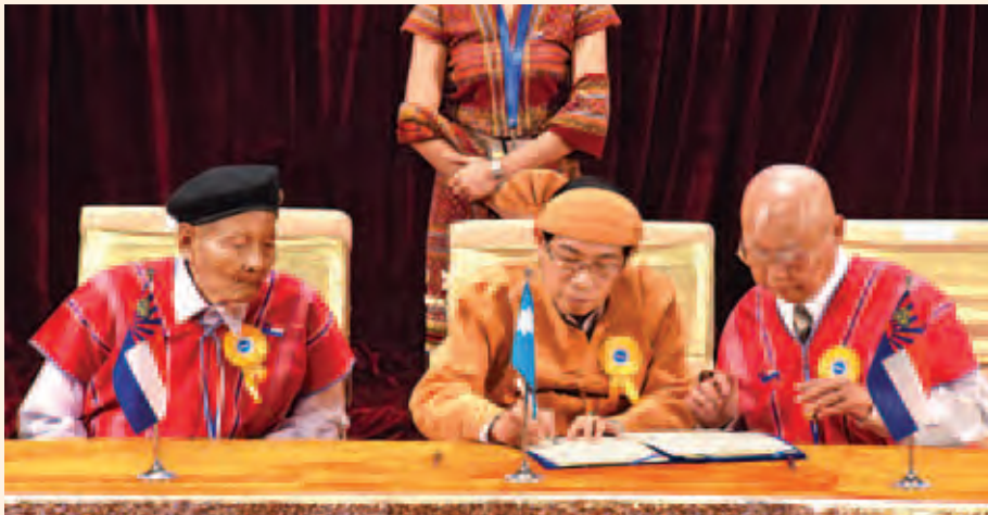
ရှမ်းပြည်ပြန်လည်ထူထောင်ရေးကောင်စီ/ရှမ်းပြည်တပ်မတော်(တောင်ပိုင်း)(RCSS/SSA-S) ဥက္ကဋ္ဌ ဦးရွတ်ဆစ် တစ်နိုင်ငံလုံးပစ်ခတ်တိုက်ခိုက်မှုရပ်စဲရေးသဘောတူစာချုပ်အား လက်မှတ်ရေးထိုးစဉ်။ (သတင်းစဉ်)