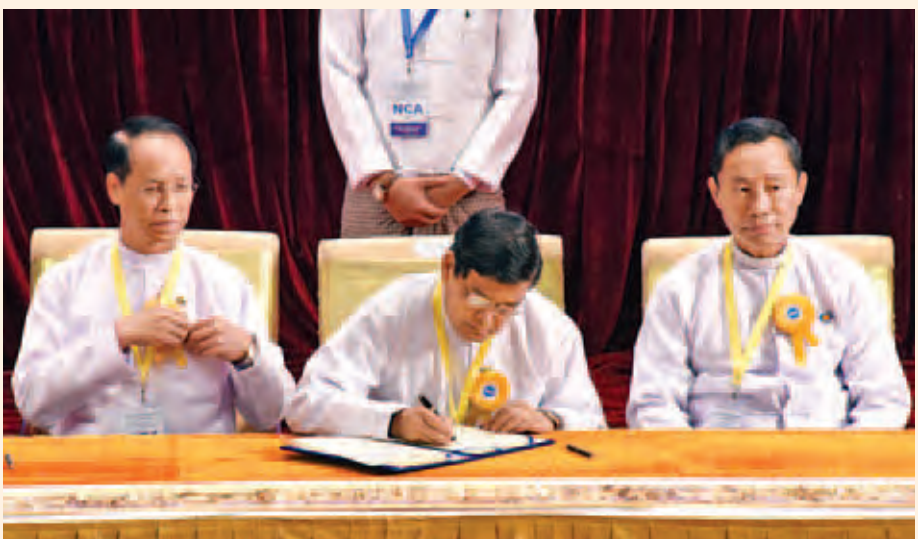
ဒုတိယသမ္မတ ဦးဉာဏ်ထွန်း တစ်နိုင်ငံလုံးပစ်ခတ်တိုက်ခိုက်မှုရပ်စဲရေးသဘောတူစာချုပ်အား လက်မှတ်ရေးထိုးစဉ်။ (သတင်းစဉ်)