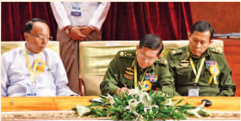
တပ်မတော်ကာကွယ်ရေးဦးစီးချုပ် ဗိုလ်ချုပ်မှူးကြီးမင်းအောင်လှိုင် တစ်နိုင်ငံလုံးပစ်ခတ်တိုက်ခိုက်မှုရပ်စဲရေးသဘောတူစာချုပ်အား လက်မှတ်ရေးထိုးစဉ်။ (သတင်းစဉ်)