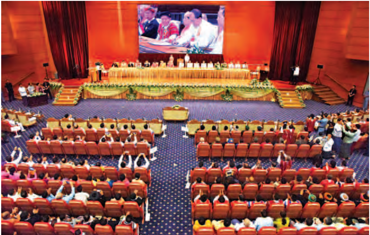
တစ်နိုင်ငံလုံး ပစ်ခတ်တိုက်ခိုက်မှုရပ်စဲရေး သဘောတူစာချုပ်လက်မှတ်ရေးထိုးပွဲ အခမ်းအနားကျင်းပစဉ်။ (သတင်းစဉ်)

မိမိတို့ အသီးသီး၏ ဆန္ဒသဘောထားကိုသာ ရှေ့တန်းမတင်ဘဲ အပြန်အလှန်လေးစားတန်ဖိုးထားမှုနှင့် အမျိုးသားပြန်လည်သင့်မြတ်ရေးကို ဦးတည်ကာ အားလုံးပါဝင်ကြသည့် နိုင်ငံရေးဆွေးနွေးပွဲများမှတစ်ဆင့် ငြိမ်းချမ်းရေးလုပ်ငန်းစဉ်အောင်မြင်သည်အထိ ရလဒ်ကောင်းများရရှိရန် ကြိုးစားကြရမည်