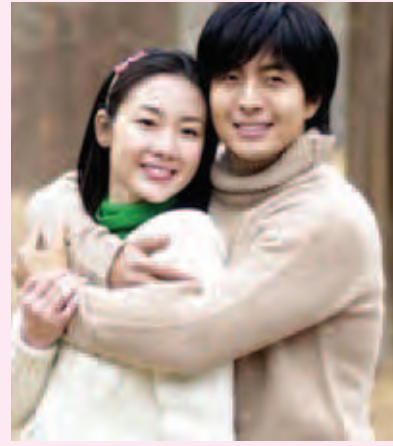
Winter Sonata မှ ဘေယောင်းဂျွန်းနှင့် ချာဂျီဝူး ရုပ်သံဇာတ်လမ်းတွဲအများစုတွင် လူငယ်သရုပ်ဆောင်များက ရေပန်းစားလာခဲ့ပြီး ယင်းလူငယ်သရုပ်ဆောင်များသည် ဂျပန်နိုင်ငံ၏ ရုပ်ရှင်ပရိသတ်ဖြစ်သော အသက်အရွယ်ကြီးသူများနှင့် သဟဇာတမဖြစ်တော့ကြောင်း ရေးသားဖော်ပြခဲ့သည်။

ဇာတ်လမ်းတွဲများ ထုတ်လွှင့်ခြင်းကို ရုပ်နားခဲ့ပြီး နောက်ပိုင်းတွင် ယခုကဲ့သို့ ကိုရီးယားရုပ်သံဇာတ်လမ်းတွဲများ ထပ်မံထုတ်လွှင့်တော့မည် မဟုတ်ကြောင်း ကြေညာခဲ့ခြင်းဖြစ်သည်။ ယင်းရုပ်သံဌာနမှ ကျွမ်းကျင်ဝန်ထမ်းတစ်ဦး၏ ပြောကြားချက်အရ ဂျပန်ဂျပန်ရုပ်သံဇာတ်လမ်းတွဲများအနေဖြင့် မကြာသေးမီက ထုတ်လွှင့်ခဲ့သော ကိုရီးယားရုပ်သံဇာတ်လမ်းတွဲများသည် စံယူအားကျဖွယ်ရာအချစ်ဇာတ်လမ်းများမှ သွေဖည်လာခဲ့ပြီး ပထမဆုံးထုတ်လွှင့်ခဲ့သည့် ဟေမန်ဆောင်း၏ ချစ်သံစဉ်ရုပ်ရှင်မှ မင်းသားနှင့်မင်းသမီးတို့၏ အချစ်လောက်လေးနက်မှုမရှိတော့သည်ကို ခံစားလာရသည့်အတွက် ရုပ်သံဇာတ်လမ်းတွဲများ ထုတ်လွှင့်ခြင်းကို ရုပ်နားခဲ့ခြင်းဖြစ်ကြောင်း ပြောကြားခဲ့သည်။ ဂျပန်စာရေးဆရာတစ်ဦးကမူ တောင်ကိုရီးယား