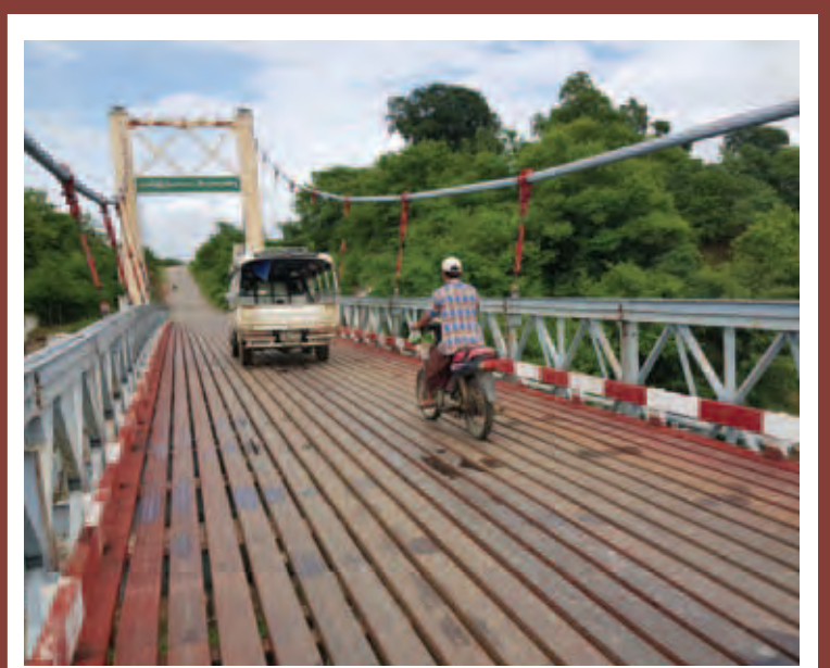
မကွေးတိုင်းဒေသကြီး မင်းဘူးခရိုင် ပွင့်ဖြူမြို့နယ် ပုသိမ်-မုံရွာလမ်း မိုင် (၂၉၆/၀)နှင့် (၂၉၆/၁) အကြားရှိ အရှည် ၉၄၀ ရှိ မဲလီကြီးတံတား၏ အပေါ်အောက် သံဆိုင်ကြီးပေါက်-၇ လက်ယာဘက်ခြမ်း အရှည် ၁၃ ပေတစ်ချောင်း ဖြတ်တောက်သွားခဲ့ပြီး ယာဉ်ငယ်များသာ ဖြတ်သန်းသွားလာခွင့်ပြုခဲ့ရာမှ တံတားဆောက်လုပ်ရေးစီမံကိန်းအထူးအဖွဲ့(၃)က အောက်တိုဘာ ၈ ရက်တွင် သံဆိုင်ကြီးအသစ် လဲလှယ်တပ်ဆင်ပြီးဖြစ်၍ ယခုအခါ ယာဉ်များပုံမှန်အတိုင်း ဖြတ်သန်းလာလျက်ရှိကြောင်း သိရသည်။

ရိုက်နှိပ်ရမည့်ပုံစံများအား သရုပ်ပြခြင်း၊ ပြည်သူများအား လက်တွေ့ဆောင်ရွက်စေခြင်းတို့ ပြုလုပ်ခဲ့သည်။ ဒေသခံပြည်သူတစ်ဦးက “ဒီနေ့တံဆိပ်ရိုက်နှိပ်ပေးပုံစံ ဆောင်ရွက်ကြတာ လူ ၁၀ ဦးမှာ ခုနစ်ဦးလောက်မှားနေသေးတယ်” ဟုပြောပြခဲ့သည်။ မောင်မောင်(မောင်မောင် ပြန်/ဆက်)