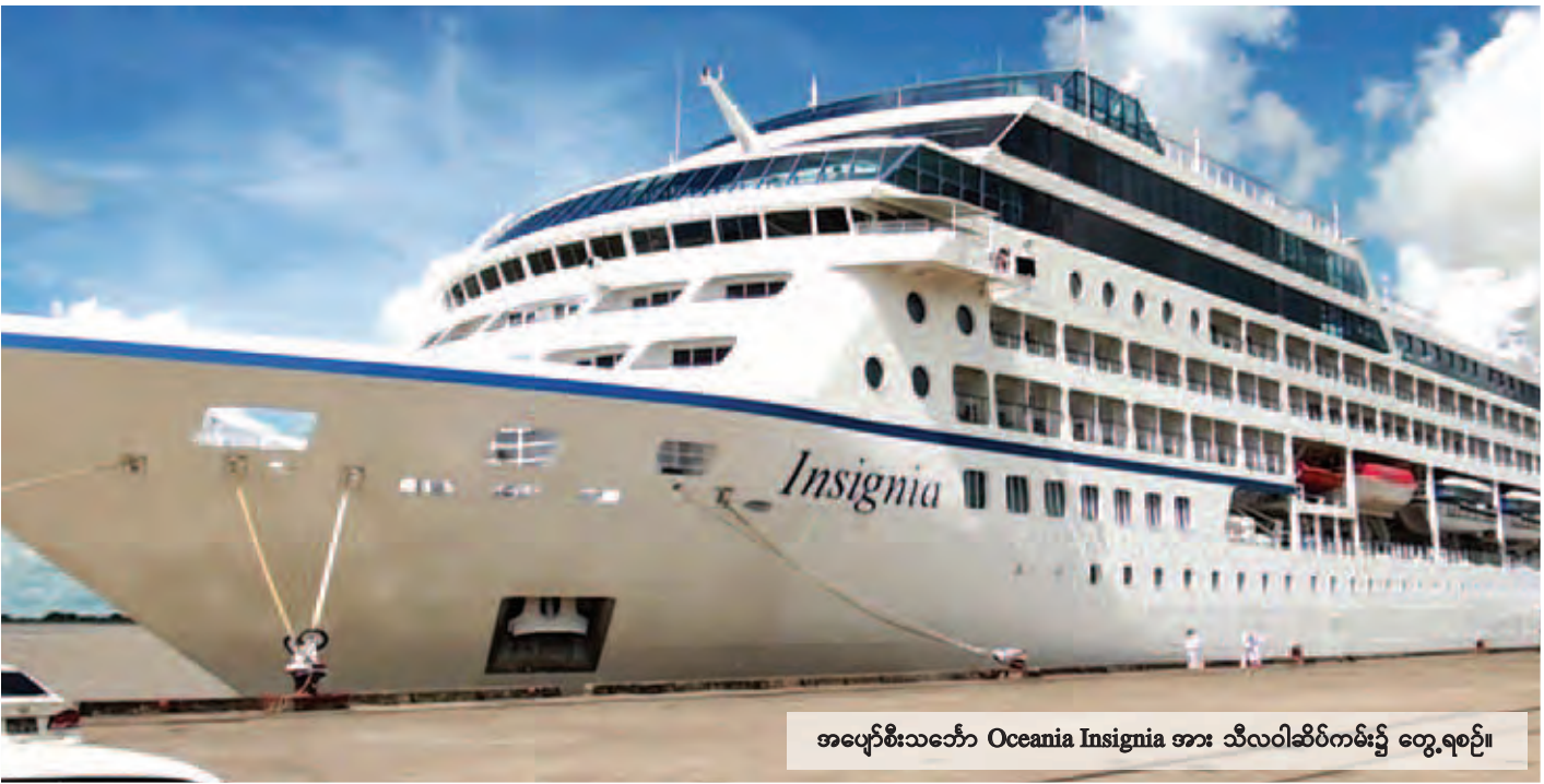
အပျော်စီးသင်္ဘော Oceania Insignia အား သီလဝါဆိပ်ကမ်း၌ တွေ့ရစဉ်။

နေပြည်တော် အောက်တိုဘာ ၁၂ ဟိုတယ်နှင့် ခရီးသွားလာရေးလုပ်ငန်းဝန်ကြီးဌာန၏ ကြီးကြပ်မှု၊ ခရီးသွားကုမ္ပဏီများ၏ စီစဉ်ဆောင်ရွက်မှုဖြင့် ကမ္ဘာလှည့်ခရီးသွားဧည့်သည်များသည် မြန်မာနိုင်ငံသို့ ကုန်းကြောင်း၊ လေကြောင်းခရီးစဉ်များ၊ နယ်စပ်ဖြတ်ကျော် ခရီးစဉ်သာမက ရေကြောင်းခရီးစဉ်များဖြစ်သည့် ဧရာဝတီ မြစ်ကြောင်း၊ ချင်းတွင်းမြစ်ကြောင်းခရီးစဉ်များဖြင့် လာရောက်လည်ပတ်သည့်အပြင် ပွင့်လင်းရာသီသို့ ကူးပြောင်းရောက်ရှိလာပြီဖြစ်ပါသဖြင့် ကမ္ဘာလှည့် အပျော်စီးသင်္ဘောခရီးစဉ်များဖြင့်လည်း လာရောက် လည်ပတ်လျက်ရှိသည်။ Destination Asia Co.,Ltd. ၏ အစီအစဉ်ဖြင့် ကမ္ဘာလှည့်ခရီးသည် ၆၃၅ ဦးနှင့် သင်္ဘောအမှုထမ်း ၄၀၀ ပါဝင်သော အပျော်စီးသင်္ဘော Oceania Insignia သည် အောက်တိုဘာ ၄ ရက်တွင် သီရိလင်္ကာနိုင်ငံ ကိုလံဘို ဆိပ်ကမ်းမှ ရန်ကုန်အပြည်ပြည်ဆိုင်ရာ သီလဝါဆိပ်ကမ်း သို့ ရောက်ရှိခဲ့ပြီး သင်္ဘောဆိပ်ကမ်းရပ်နားစဉ်အတွင်း ရန်ကုန်မြို့တွင်းခရီးစဉ်၊ ရန်ကုန်-ပဲခူး (နေချင်းပြန်ခရီးစဉ်)၊ ရန်ကုန်-ပုဂံ၊ ရန်ကုန်-မန္တလေး (တစ်ညအိပ်ခရီးစဉ်) များကိုလေ့လာခဲ့ပြီး မော်တော်ယာဉ်များဖြင့် သွားရောက် လည်ပတ်ကာ စာမျက်နှာ ၃ ကော်လံ ၁ သို့ ❖