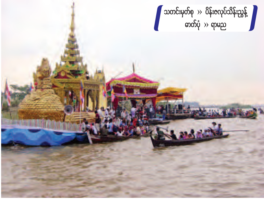
ယမန်နှစ်က သီတင်းကျွတ်မီးပွဲပူဇော်ပွဲကို ရွှေကျင်မြို့ ရွှေကျင်ချောင်းအတွင်း၌ ကျင်းပခဲ့စဉ်။

တောင်စွယ်ပေါ်ရှိ အရှေ့မဟာဗုဒ္ဓ ဘုရားကြီး၌ နံနက်အရံတက်ချိန်မှ စ၍ ရွှေကျင်မြို့နယ်အတွင်းနှင့် ရပ်ဝေး မှ ဘုရားပူဇော်သည့်အခါက သဒ္ဓါထက်သန် စွာဖြင့် ဆွမ်းတော်ကြီးတင်လှူပွဲ ကျင်းပမည်ဖြစ်ကြောင်း သိရသည်။ ပွဲတော်၏ အထွတ်အထိပ်ဖြစ်သည့် သီတင်းကျွတ်လပြည့်ကျော် ၁ ရက်နေ့ နံနက်ခင်းအလင်းရောင်ရသည်နှင့် ရွှေကျင်ချောင်းအတွင်း၌ တက်ခတ် ယိမ်း၊ တက်ပုံယိမ်း၊ ယိမ်းအဖွဲ့၊ ကရင်ရိုးရာဗုံယိမ်း၊ ရှမ်းတိုင်းရင်းသား အကအဖွဲ့များက အလွန်မြူးကြသည့် အကမျိုးစုံကို လေ့ကျင့်ပြီး စက်တပ် လှေ ဖောင်များဖြင့် ကပြဖော်ပြေပြိုင်ပွဲ ဝင်ကြတော့မည်ဖြစ်သည်။ တာဝန်ရှိ သူများက ခိုးရာမပျက် ပြိုင်ပွဲဝင် ယိမ်း အကအဖွဲ့သားများကို အကဖြတ်အဖွဲ့ များဖြင့် အက၊ အလှ၊ သဘာဝစိစစ်ပြီး ထိုကထိကတန်တန် ဆုများချီးမြှင့် ပေးမည်ဖြစ်သည်။ နှစ်စဉ်ဆုများကို တာဝန်ရှိသူများနှင့် ပွဲတော်ကျင်းပရေး ကော်မတီမှ ချီးမြှင့်ပေးခဲ့သည်။ ဆုများ ချီးမြှင့်ပေးအပ်ပြီး ယင်းနေ့ ညနေ ၆ နာရီတွင် ရွှေကျင်ချောင်းအတွင်း ဆီမီးရောင်စုံ မီးကြာခွက်များဖြင့် ရှင်ဥပဂုတ္တမထေရ်မြတ်ကို ရည်စူး၍ ရေပူဇော်ပွဲပေးမည်ဖြစ်သည်။ မြန်မာ့ရိုးရာ ယဉ်ကျေးမှုပွဲတော် ဖြစ်သည့် မီးပွဲပူဇော်ပွဲနှင့် ယိမ်း အကပွဲများ နှစ်ပေါင်းများစွာ တည်တံ့