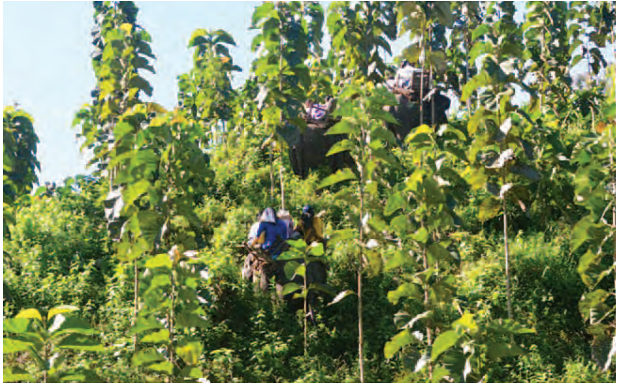
ဂေဟခရီးသွားလုပ်ငန်းတွင် တစ်ခုအပါအဝင်ဖြစ်သည့် ဖိုးကျားဆင်စခန်းမှ တောတွင်းခရီးစဉ်တစ်ခုခုခု။