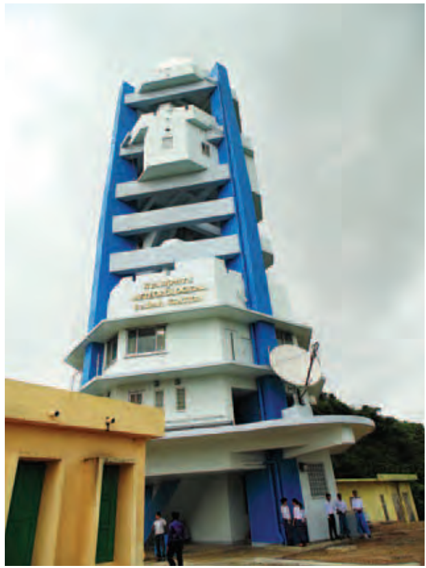
ကျောက်ဖြူမြို့လေဝသတိုင်းတာရေး ရေဒါစခန်းကို တွေ့ရစဉ်။