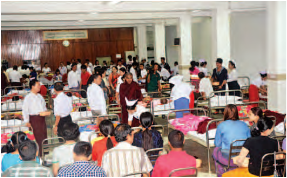
အဆောက်အအုံ ရှစ်ခုရှိနေပြီး ခုတင် ၂၀၀ ဆံ့ ဆေးရုံကြီးကို အတွင်းလူနာအဖြစ် လက်ခံကုသပေးလျက်ရှိကြောင်း အဖြစ် သံယာတော်အပါး ၁၃၀၊ သီလရှင် အပါး ၅၀နှင့် ခွဲစိတ်လူနာ အမျိုးသား ၁၀ ဦး၊ အမျိုးသမီး ၁၀ ဦးတို့ [သတင်း - မင်းသစ်]

နှင့် ဝန်ထမ်းများ၊ သွေးလှူဒါန်းမည့် သံယာတော်၊ သီလရှင်နှင့် လူပုဂ္ဂိုလ်များ တက်ရောက်ကြသည်။ ဇီဝိတဒါနသံယာဇေးရုံကြီး(ရန်ကုန်)ကို ၁၉၄၀ ပြည့်နှစ် မေ ၈ ရက်တွင် မြန်မာမျိုးချစ်ပုဂ္ဂိုလ်ကြီးများက ဇီဝိတဒါနကုသိုလ်ဖြစ်ဆေးခန်းအဖြစ် ဗဟန်းမြို့နယ် ကြားတောရလမ်းဇရပ်အမှတ် (၇၃)တွင် စတင်ဖွင့်လှစ်ခဲ့ကြောင်း၊ ၁၉၅၂ ခုနှစ်တွင် လက်ရှိနေရာဖြစ်သည့် အမှတ် (၃၈) ကိုယ့်မင်းကိုယ့်ချင်းလမ်း ဗဟန်းမြို့နယ်သို့ ပြောင်းရွှေ့ကာ ဇီဝိတဒါနဆေးရုံအဖြစ်ပါ ဖွင့်လှစ်ခဲ့ပြီး ၁၉၇၂ ခုနှစ်တွင် ဇီဝိတဒါနသံယာဇေးရုံအဖြစ် အမည်ပြောင်းလဲခဲ့သည်။ ဇီဝိတဒါနသံယာဇေးရုံကြီးသည် ပရဟိတ ကုသိုလ်ဖြစ်ဆေးရုံဖြစ်ပြီး အလှူရှင်များ၏ အလှူငွေနှင့် လုပ်အားအပေါ် ရပ်တည်ခဲ့ကာ ၂၀၁၂ ခုနှစ်တွင် သံယာတော်များအတွက် ဗာရာဏသီ ခြောက်ထပ်ဆေးကုသဆောင်၊ ၂၀၁၃ ခုနှစ်တွင် သီလရှင်ဆေးရုံ တိုးချဲ့နှစ်ထပ်ဆောင် တို့ကို တိုးချဲ့တည်ဆောက်ခဲ့ရာ ယနေ့ ဆေးရုံဝင်းအတွင်း