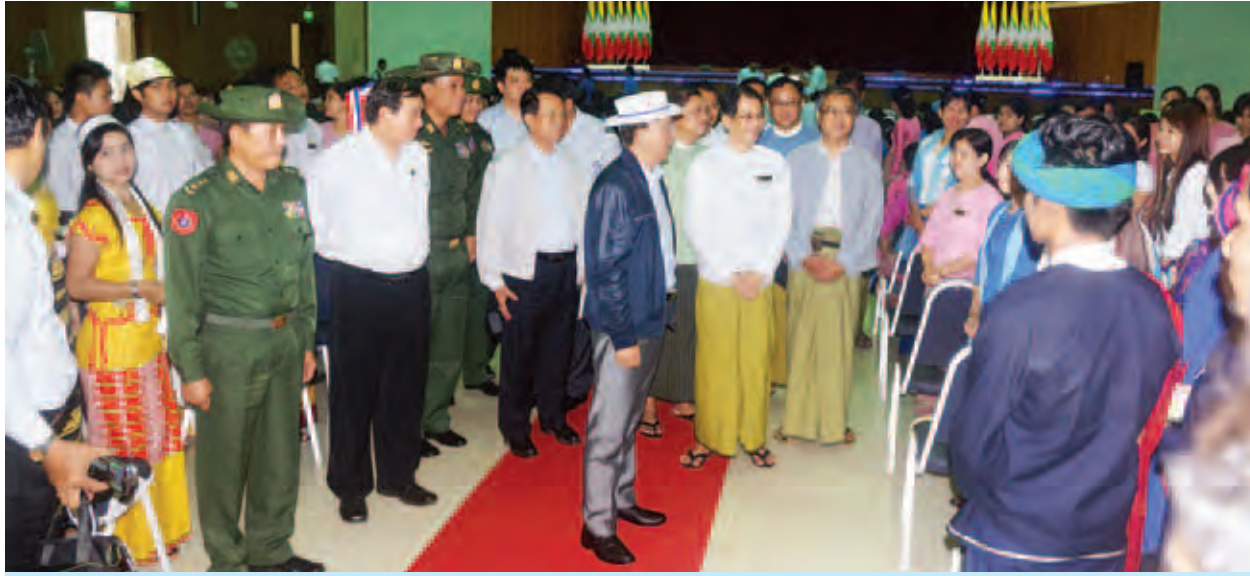
နိုင်ငံတော်သမ္မတ ဦးသိန်းစိန် မော်လမြိုင်တက္ကသိုလ် ဘက်စုံခန်းမ၌ တက္ကသိုလ် ဆရာ ဆရာမများ၊ ကျောင်းသား ကျောင်းသူများ၊ ဒေသခံပြည်သူများအား ရင်းရင်းနှီးနှီးနှုတ်ဆက်စဉ်။ (သတင်းစဉ်)

ယင်းနောက် နိုင်ငံတော်သမ္မတနှင့် အဖွဲ့ဝင်များသည် အထူးလေယာဉ်ဖြင့် မော်လမြိုင်မြို့မှထွက်ခွာခဲ့ရာ ညနေပိုင်းတွင် ရန်ကုန်မြို့သို့ ပြန်လည်ရောက်ရှိကြသည်။ (သတင်းစဉ်)