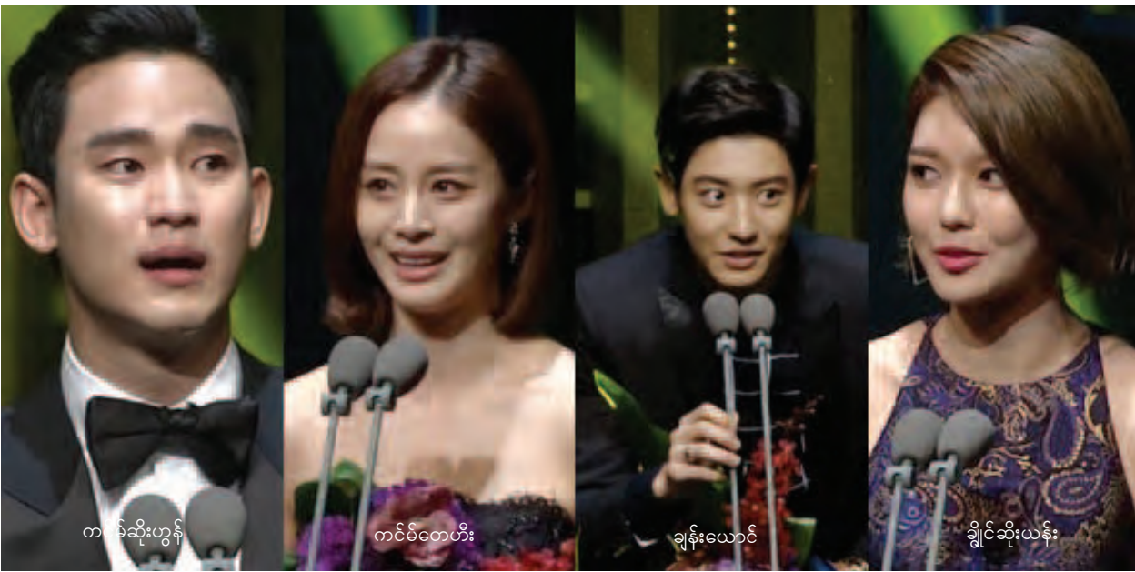
ကမ်ဆိုးဟွန်