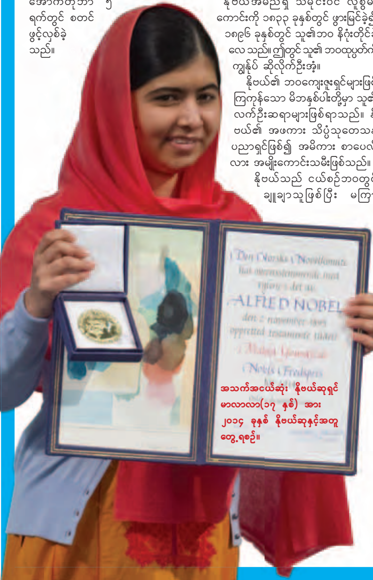
အသက်အငယ်ဆုံး နိုဗယ်ဆုရင် မာလာလာ(၁၇ နှစ်) အား ၂၀၁၄ ခုနှစ် နိုဗယ်ဆုနှင့်အတူ တွေ့စေခဲ့သည်။

အတတ်နှင့် ပညာသည် အကျိုးဝိပါက် ချင်းမတူပါလေ။ လောကီအတတ်မှန်သမျှ ကို 'ဝိဇ္ဇာ' (ဝါ) 'ပညာ' တည်းဟူသော ပိုင်း ခြားဝေဖန်နိုင်စွမ်း၊ အမှား အမှန်သိနိုင်စွမ်း၊ ကုသိုလ်နှင့် အကုသိုလ် ခွဲခြားနိုင်စွမ်း၊ အကြောင်းနှင့် အကျိုး ဝေဖန်နိုင်စွမ်းတို့ ပေါင်းစပ်နိုင်မှုသာလျှင် လောကလူရွာကို အကျိုးပြုနိုင်မည်ဖြစ်သည်။ မိမိ၏ အတတ် သည် ပညာနှင့် သတိတို့နှင့် ဖွဲ့နွဲ့နေအပ် ၏ဟု ကျွန်ုပ်တို့တွေ့ဆင်မိပါသည်။