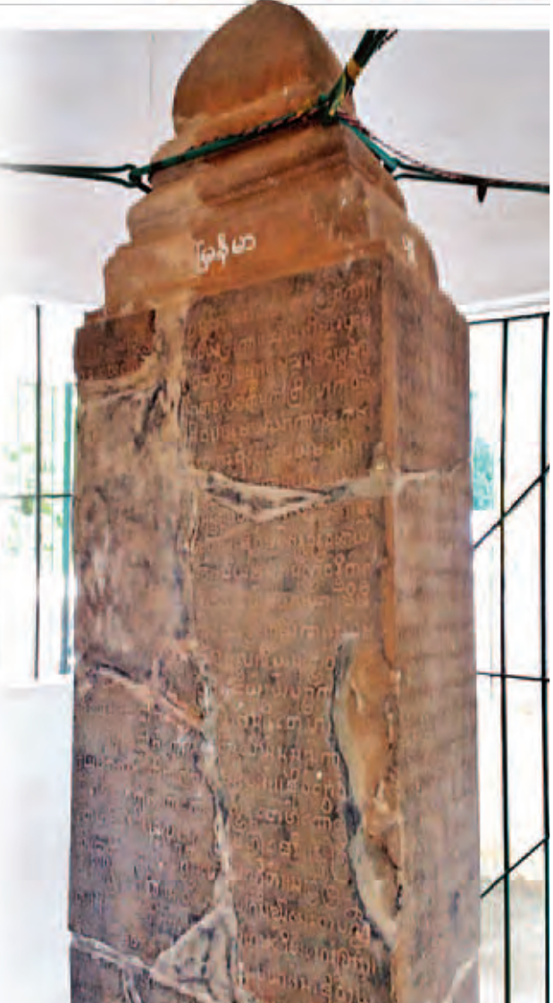
မြစေတီကျောက်စာနှင့် အလောင်းမင်းတရား၏ ရွှေပေလွှာတို့ ကမ္ဘာ့မှတ်တမ်းအမွေအနှစ်စာရင်းအဖြစ် သတ်မှတ်ခံရ

ကို ပြုပြင်ထိန်းသိမ်းရန်နှင့် ကာကွယ်စောင့်ရှောက်ရန် မှတ်တမ်းအမွေအနှစ်များအား သိမြင်အလေးထားမှု မြှင့်တင်ရန်နှင့် အပြန်အလှန်အလေးထားမှုရှိစေရန်အတွက် နိုင်ငံတကာ ပူးပေါင်းဆောင်ရွက်ရေးနှင့် ထောက်ပံ့ကူညီရေးတို့ လိုအပ်ပါသည်။ ယင်းအချက်များကို ဖြည့်ဆည်းနိုင်ရန်အတွက် ကမ္ဘာ့နိုင်ငံအသီးသီးတွင် ရှိနေသော မှတ်တမ်းအမွေအနှစ်များအား ကမ္ဘာ့မှတ်တမ်းအမွေအနှစ်စာရင်းအဖြစ် သတ်မှတ်နိုင်ရန် ယူနက်စကို၏ ကမ္ဘာ့မှတ်တမ်းအမွေအနှစ်အစီအစဉ်ကို အကောင်အထည်ဖော် ဆောင်ရွက်ခဲ့ခြင်းဖြစ်သည်။ ယူနက်စကို၏ ကမ္ဘာ့မှတ်တမ်းအမွေအနှစ် အစီအစဉ်ကို ၁၉၇၂ ခုနှစ်တွင် စတင်ဖွဲ့စည်းခဲ့ပြီး ယခုအချိန်အထိ ကမ္ဘာတစ်ဝန်းမှ မှတ်တမ်းအမွေအနှစ်ပေါင်း ၃၄၈ ခုကို ကမ္ဘာ့မှတ်တမ်းအမွေအနှစ်အဖြစ် သတ်မှတ်ခဲ့ပြီးဖြစ်သည်။ မြန်မာနိုင်ငံအပါအဝင် အာဆီယံနိုင်ငံများဖြစ်သော ကမ္ဘောဒီးယား၊ အင်ဒိုနီးရှား၊ မလေးရှား၊ ဖိလစ်ပိုင်၊ ဗီယက်နမ်၊ တီမောလက်စ်တေနှင့် ထိုင်းနိုင်ငံတို့မှ မှတ်တမ်းအမွေအနှစ်များလည်း ကမ္ဘာ့မှတ်တမ်းအမွေအနှစ်စာရင်းဝင်အဖြစ် သတ်မှတ်ခံရပြီးဖြစ်သည်။ ၂၀၁၁ ခုနှစ် အင်ဒိုနီးရှားနိုင်ငံတွင် ကျင်းပခဲ့သော ယူနက်စကို၏ ကမ္ဘာ့မှတ်တမ်း အမွေအနှစ်အစီအစဉ် အလုပ်ရုံဆွေးနွေးပွဲတွင် မြန်မာနိုင်ငံမှ မှတ်တမ်းအမွေအနှစ်ခြောက်ခုကို ကနဦးစာရင်းအဖြစ် ဝင်သွင်းခဲ့သည်။ စာမျက်နှာ ၈ ကော်လံ ၄ သို့