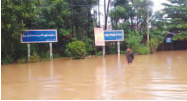
ခဲသော မိုးရေချိန်လက်မများမှာ ကောလင်းမြို့နယ်၌ အောက်တိုဘာ ၈ ရက်တွင် သူညီ ဒသမ ၇၂ လက်မ၊ ၉ ရက်တွင် ၅ ဒသမ ၀၆ လက်မနှင့် ၀န်းသိုမြို့နယ်၌ အောက်တိုဘာ ၆ ရက်မှ ၈ ရက်ထိ ၁ ဒသမ ၄၁ လက်မ၊ ၉ ရက်တွင် ၆ ဒသမ ၁၀ လက်မတို့ဖြစ်ကြောင်း သိရသည်။ မြို့နယ်(ပြန်/ဆက်)

ရေကြီးရေလျှံမှုကြောင့် စပါးစိုက်ကွင်းများ ရေနစ်မြုပ်နိုင်ပြီး အောက်တိုဘာ ၉ ရက် နံနက် ၁၀ နာရီအထိ မိုးဆက်လက်ရွာသွန်းလျက်ရှိသည်။ မိုးရွာသွန်း