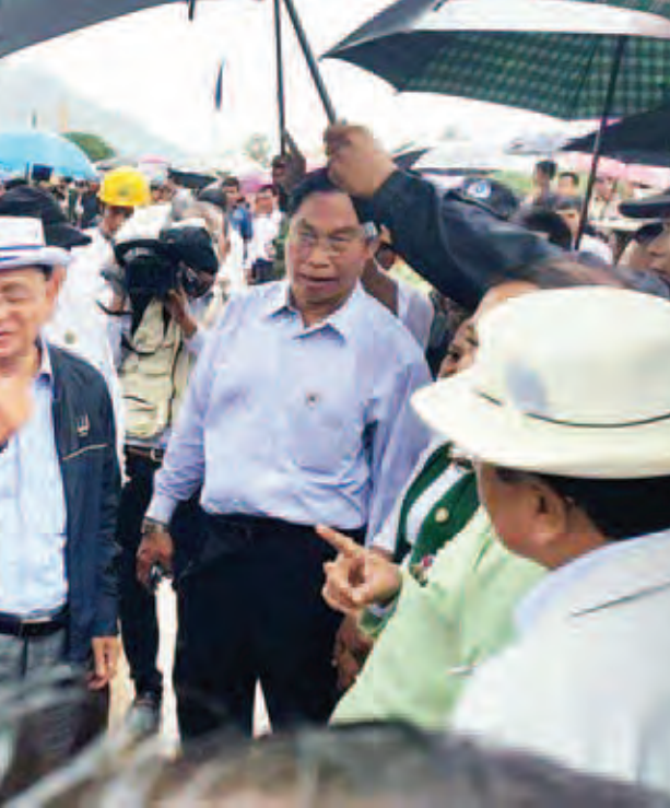
နိုင်ငံတော်သမ္မတ ဦးသိန်းစိန်အား အတ္ထရတ်တားပေါ်တွင် ဒေသခံပြည်သူများက ကြိုဆိုနှုတ်ဆက်စဉ်။ (သတင်းစဉ်)

အမြင်မတူမှု အမျိုးမျိုးကို နားလည်လက်ခံပြီး နိုင်ငံအပေါ် ချစ်မြတ်နိုးသည့်စိတ်ဓာတ်ဖြင့် ကိုယ့်တိုင်းပြည် ကိုယ့်လူမျိုးအကျိုးရှိသော အလုပ်ကိုလုပ်ရန်ဟူသည့် သန်စင်သော ရည်မှန်းချက်ထားရှိကာ