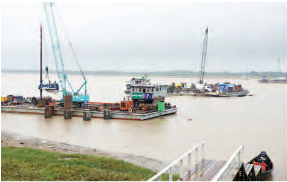
၅၂၀၃ ဒေသမ ၄ ပေ ( ၁၅၈၆ မီတာ) ရှိကြောင်း သိရသည်။

ယင်းနောက် နိုင်ငံတော်သမ္မတနှင့် အဖွဲ့ဝင်များသည် သံလွင်တံတား (ချောင်းဆုံ) စီမံကိန်းရှင်းလင်းဆောင်ရွက်ရာ ဆောက်လုပ်ရေးဝန်ကြီးဌာန ပြည်ထောင်စုဝန်ကြီး ဦးကျော်လွင်က နိုင်ငံတော်သမ္မတ၏ ၂၀၁၂ ခုနှစ် ဒီဇင်ဘာ ၁၅ ရက် မွန်ပြည်နယ် ခရီးစဉ်တွင် လမ်းညွှန်ချက်အရ ယခုတံတားစီမံကိန်းကို စတင်ဆောင်ရွက်ခဲ့ခြင်းဖြစ်ကြောင်း၊ လျာထားတံတားအကြောင်း ငါးကြောင်းအနက် ပတ်ဝန်းကျင်ထိခိုက်မှု အနည်းဆုံးနှင့် အတိုဆုံး၊ အထိရောက်ဆုံး တံတားအကြောင်းကို ရွေးချယ်ပြီး ၂၀၁၅ ခုနှစ် ဖေဖော်ဝါရီ ၈ ရက်တွင် တည်ဆောက်ရေးလုပ်ငန်းများ စတင်ခဲ့ကြောင်း၊ ၂၀၁၆ ခုနှစ် ဧပြီလတွင် သံပေါင်တပ်ဆင်ခြင်းလုပ်ငန်းများ