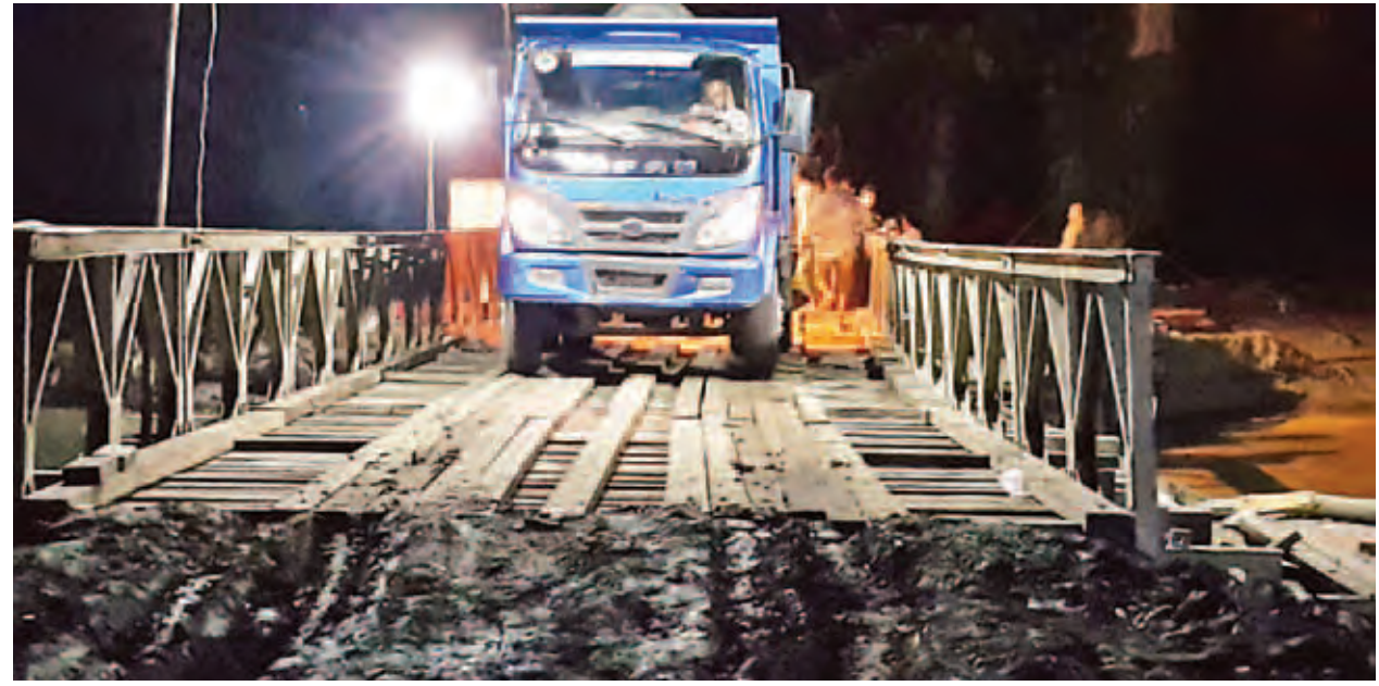
ဂန့်ဂေါ - ကလေးလမ်းရှိ ဇင်းကလင်းချောင်းတံတား ရေတိုက်စားမှုကြောင့် ပျက်စီးခဲ့ရာ ဘေလီတံတားပြုလုပ်ပြီးဖြစ်၍ ပြန်လည်သွားလာ

ပူးပေါင်း၍ တံတားအရှည် ပေ ၇၀ ယာယီ ဘေလီတံတားကို ညတွင်းချင်း ဆောက်လုပ်ခဲ့ရာ အောက်တိုဘာ ၁၀ ရက် နံနက် ၂ နာရီ ၄၅ မိနစ်တွင် ဆောက်လုပ်ပြီးစီးခဲ့သဖြင့် ယာဉ်များဖြတ်သန်းသွားလာနေပြီဖြစ်ကြောင်း သိရသည်။ ခရိုင်(ပြန်/ဆက်)