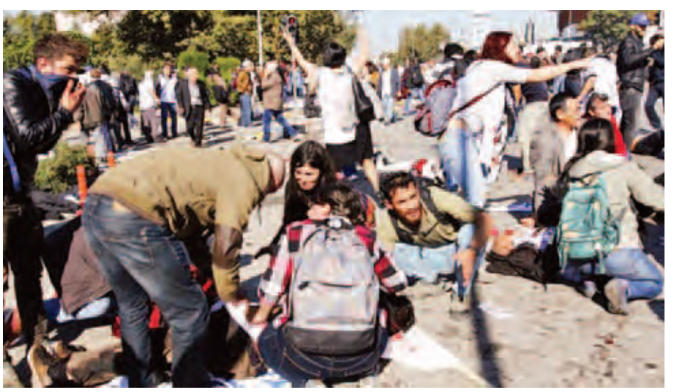
ရောက်ရှိလာခဲ့ပြီး ထိခိုက်ဒဏ်ရာရရှိသူများကို နီးစပ်ရာ ဆေးရုံသို့ပို့ဆောင်ပေးခဲ့ကြသည်။ ပထမဦးဆုံးသည် ဘူတာရုံမျက်နှာစာဘက်တွင် ပေါက်ကွဲ ခဲ့ပြီး ဒုတိယဦးမှာ ဘူတာရုံ၏ မျက်နှာချင်းဆိုင်ဘက်တွင် ပေါက်ကွဲခဲ့ခြင်းဖြစ်ကြောင်း မျက်မြင်သက်သေများက ဆိုသည်။ ဆင်ယူ။

အန်ကာရာ အောက်တိုဘာ ၁၀ တူရကီနိုင်ငံမြို့တော် အန်ကာရာတွင် ပုံးနှစ်လုံးဆင့် ပေါက်ကွဲခဲ့ရာ လူပေါင်း ၃၀ ထက်မနည်းသေဆုံးခဲ့ပြီး ၁၂၆ ဦးကျော် ထိခိုက်ဒဏ်ရာများရရှိခဲ့ကြောင်း တူရကီ ပြည်ထဲရေးဝန်ကြီးဌာနက ပြောသည်။ အဆိုပါပုံးပေါက်ကွဲမှုသည် မီးရထားဘူတာရုံ၏ မျက်နှာစာတွင် ဖြစ်ပွားခဲ့ခြင်းဖြစ်သည်။ ပုံးပေါက်ကွဲသည့် အချိန်တွင် တူရကီအစိုးရနှင့် ကာဗေဒီစစ်သွေးကြွများ အကြားဖြစ်ပွားလျက်ရှိသည့် ပဋိပက္ခကိုရပ်တန့်ရန် ဆန္ဒ ထုတ်ဖော်မည့် သမဂ္ဂအဖွဲ့အစည်းများ၊ လူမှုရေးရာအဖွဲ့ အစည်းများနှင့် ကာဗေဒီအမျိုးသားဒီမိုကရေစီပါတီကို ထောက်ခံသူများအပါအဝင် ငြိမ်းချမ်းရေးကိုလိုလားသည့် ပြည်သူ့အစည်းအဝေးများစွာ စုဝေးလျက်ရှိကြောင်း သိရသည်။ ပုံးပေါက်ကွဲမှုသည် အသေခံပုံးဖောက်ခွဲခြင်းဖြစ် ကြောင်း မျက်မြင်သက်သေများကဆိုသည်။ ယင်းပေါက်ကွဲ မှုကြောင့် ဘူတာရုံတွင်လည်း ထိခိုက်ပျက်စီးမှုများစွာရှိခဲ့ သည်။ အခင်းဖြစ်ပွားရာနေရာသို့ လူနာတင်ယာဉ်များ