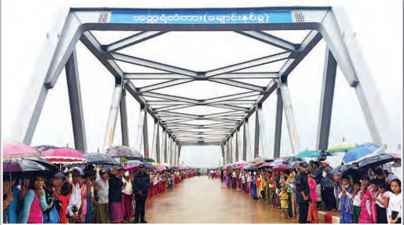
အတ္ထရံမြစ်ကွန်း (ချောင်းနစ်ခွ) မှတ်တမ်းဓာတ်ပုံများ

နိုင်ငံတော်သမ္မတဦးသိန်းစိန် (ချောင်းနစ်ခွ)