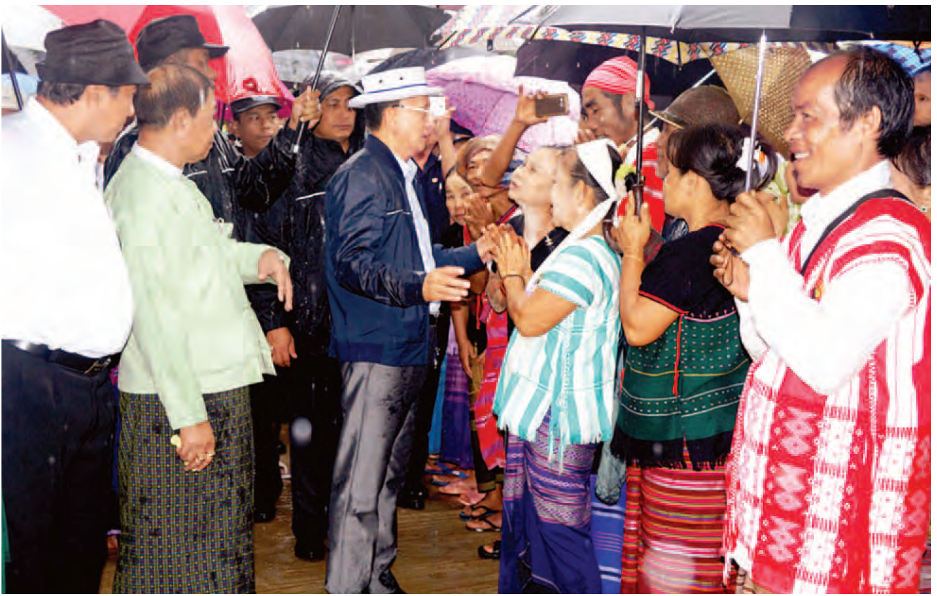
နိုင်ငံတော်သမ္မတ ဦးသိန်းစိန်အား အတ္ထရံတံတားပေါ်တွင် ဒေသခံပြည်သူများက ကြိုဆိုနှုတ်ဆက်စဉ်။ (သတင်းစဉ်)

ရန်ကုန်မြို့တွင် ရောက်ရှိနေသော ပြည်ထောင်စုသမ္မတမြန်မာနိုင်ငံတော် နိုင်ငံတော်သမ္မတ ဦးသိန်းစိန်သည် အဖွဲ့ဝင်များနှင့်အတူ ယနေ့နံနက်ပိုင်းတွင် အထူးလေယာဉ်ဖြင့် ရန်ကုန်မြို့မှထွက်ခွာပြီး မွန်ပြည်နယ် မော်လမြိုင်လေဆိပ်သို့ရောက်ရှိရာ ပြည်နယ်ဝန်ကြီးချုပ် ဦးအုန်းမြင့်၊ အရှေ့တောင်တိုင်းစစ်ဌာနချုပ်တိုင်းမှူး ဗိုလ်မှူးချုပ်မျိုးဝင်း၊ ပြည်နယ်လွှတ်တော်ဥက္ကဋ္ဌ၊ ပြည်နယ်တရားလွှတ်တော်တရားသူကြီးချုပ်၊ ပြည်နယ်စာရင်းစစ်ချုပ်၊ ပြည်နယ်ဝန်ကြီးများ၊ ယဉ်ကျေးမှုအဖွဲ့ဝင်များ၊ လူမှုရေးအသင်းအဖွဲ့များနှင့် တာဝန်ရှိသူများက ကြိုဆိုကြသည်။ စာမျက်နှာ ၃ ကော်လံ ၁ သို့ ၂