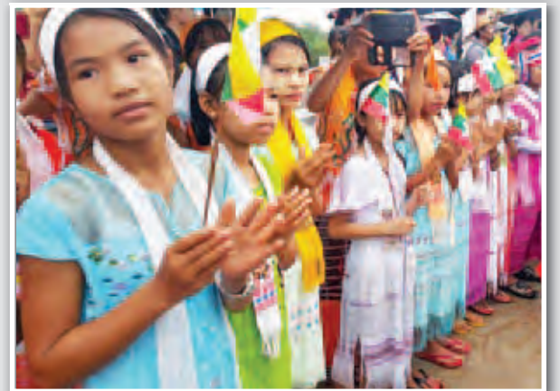
နိုင်ငံတော်သမ္မတဦးသိန်းစိန်၏ မွန်ပြည်နယ်ခရီးစဉ်မှတ်တမ်းဓာတ်ပုံများ