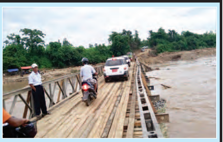
စစ်ကိုင်းတိုင်းဒေသကြီးအတွင်း ကလေး-ကျီးကုန်း-တမူးလမ်း မိုင်(၇၁/၂-၇၃/၃) ကြားရှိ တွဲပန်တံတား (၃/၇၂) ပေ ၂၁၀ ဆောင်ရွက်ပြီးစီး၍ ယာဉ်များဖြတ်သန်းသွားလာနေသည်ကို တွေ့ရစဉ်။ (ဆောက်လုပ်ရေး)