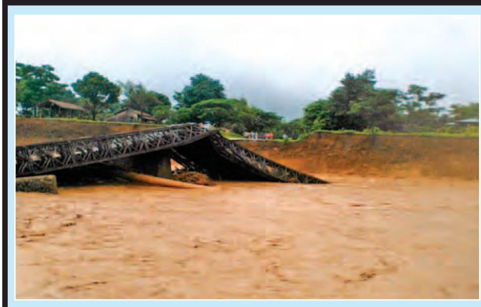
စစ်ကိုင်းတိုင်းဒေသကြီးအတွင်း ကလေး-ကျီးကုန်း-တမူးလမ်း မိုင်(၇၁/၂-၇၃/၃) ကြားရှိ တွဲပန်တံတား (၃/၇၂) ပေ ၂၁၀ ဘေလီတံတား ရေတိုက်စားမှုကြောင့် ပျက်စီးသွားသည်ကို တွေ့ရစဉ်။ (ဆောက်လုပ်ရေး)