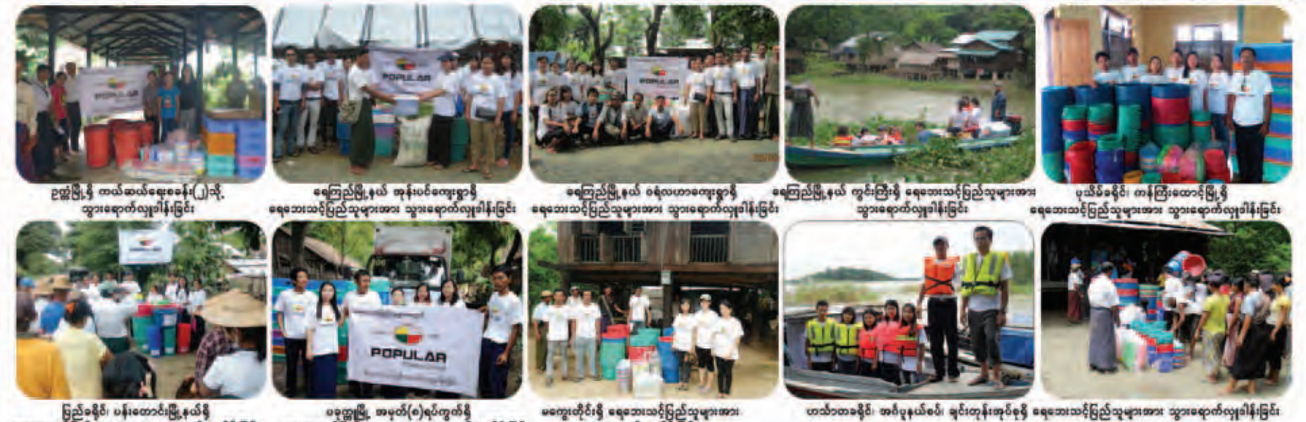
၂။ ဥက္ကံမြို့နယ် အထွေထွေစခန်း(၂)သို့ သွားရောက်လှူဒါန်းခြင်း ရေကြည်မြို့နယ် အုန်းပင်စုကျေးရွာရှိ ရေဘေးသင့်ပြည်သူများအား သွားရောက်လှူဒါန်းခြင်း ရေကြည်မြို့နယ် ဝရံလဟာကျေးရွာရှိ ရေဘေးသင့်ပြည်သူများအား သွားရောက်လှူဒါန်းခြင်း ရေကြည်မြို့နယ် ကွင်းကြီးရှိ ရေဘေးသင့်ပြည်သူများအား သွားရောက်လှူဒါန်းခြင်း ပုသိမ်ခရိုင်၊ ကန်ကြီးထောင်မြို့နယ် ရေဘေးသင့်ပြည်သူများအား သွားရောက်လှူဒါန်းခြင်း ပြည်ခရိုင်၊ ပန်းတောင်းမြို့နယ်ရှိ ရေဘေးသင့်ပြည်သူများအား သွားရောက်လှူဒါန်းခြင်း ပခုက္ကူမြို့ အမှတ်(၈)ရပ်ကွက်ရှိ ရေဘေးသင့်ပြည်သူများအား သွားရောက်လှူဒါန်းခြင်း မကွေးတိုင်းရှိ ရေဘေးသင့်ပြည်သူများအား သွားရောက်လှူဒါန်းခြင်း ဟင်္သာတခရိုင်၊ အင်္ဂပူနယ်စပ်၊ ချင်းတုန်းအုပ်စုရှိ ရေဘေးသင့်ပြည်သူများအား သွားရောက်လှူဒါန်းခြင်း