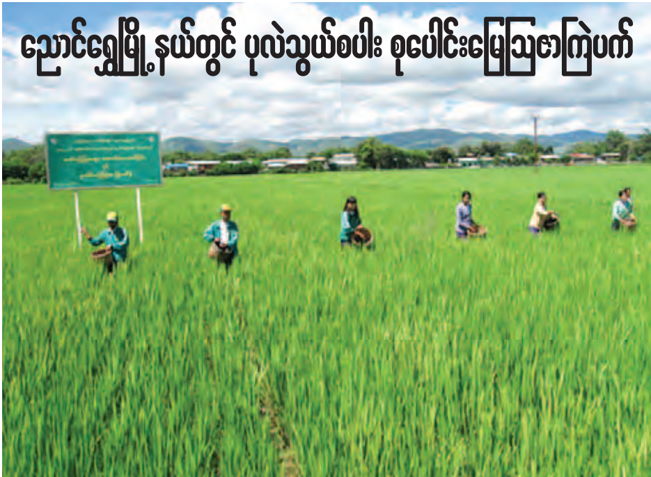
ကို ရှင်းလင်းပြောကြားသည်။ ပိုးသတ်ဆေးနှင့် မြေဩဇာများ စုပေါင်း၍ မြေဩဇာများ ကြပ်ပတ်ခဲ့ ထို့နောက် တောင်သူများထံသို့ ထောက်ပံ့ပေးအပ်ပြီး စံပြုကွက်အတွင်း ကြောင်း သိရသည်။