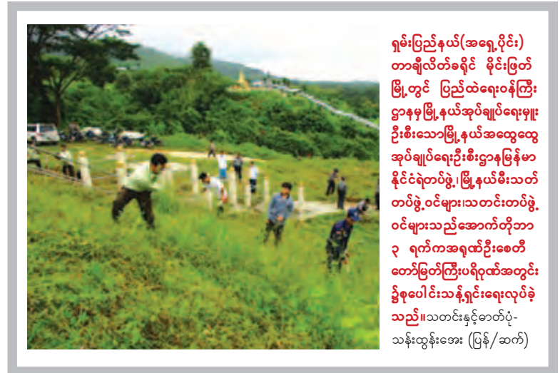
ရှမ်းပြည်နယ်(အရှေ့ပိုင်း) တာချီလိတ်ခရိုင် မိုင်းမြတ် မြို့တွင် ပြည်ထဲရေးဝန်ကြီး ဌာနမှမြို့နယ်အထွေထွေ အုပ်ချုပ်ရေးဦးစီးဌာနမြန်မာ နိုင်ငံရဲတပ်ဖွဲ့၊ မြို့နယ်မီးသတ် တပ်ဖွဲ့၊ ဝင်များသတင်းတပ်ဖွဲ့ ဝင်များသည်အောက်တိုဘာ ၃ ရက်ကအရေထိဦးစေတီ တော်မြတ်ကြီးပရိယုတ်အတွင်း ၌စုပေါင်းသန့်ရှင်းရေးလုပ်ခဲ့ သည်။

နွားထိုးကြီး အောက်တိုဘာ ၇ နွားထိုးကြီးမြို့နယ် ထန်းကွဲအုပ်စု ညောင်ပင်ဇောက်ကျေးရွာရှိ အိမ်ခြေ ၆၀ ကျော်အတွက် ၂၄ နာရီလျှပ်စစ်မီးလိုင်း ကိုယ့်အားကိုယ်ကိုး ဖွင့်ပွဲကို အောက်တိုဘာ ၅ ရက် နံနက် ၉ နာရီက ယင်းကျေးရွာ၌ ကျင်းပခဲ့သည်။ နွားထိုးကြီးမြို့နယ်လုံးကျွတ် လျှပ်စစ်မီးလိုင်းရေးအတွက် ဝန်ကြီးက လျှပ်စစ်လျှောင့်အိုး (ထရန်စဖော်မာ) ၅၃ လုံးလျှောင့်အိုးခွဲသဖြင့် ၂၄ နာရီ လျှပ်စစ်မီးလိုင်းနေပြီဖြစ်သည်။ ဌေးမြင့်မောင်