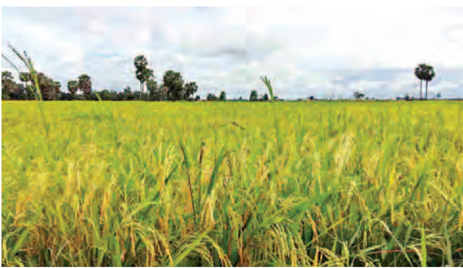
စရိတ်တွေ နုတ်လိုက်ရင် ငွေကျပ်သိန်း ၃၀ တော့ အသားတင်ကျန်ပါတယ်။