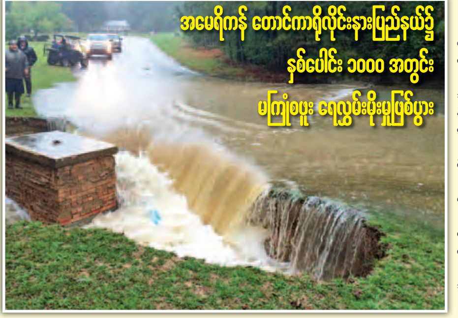
အမေရိကန်ပြည်ထောင်စု တောင်ကာရိုလိုင်းနားပြည်နယ်တွင် ရက်သတ္တပတ်ကုန်က ဖြစ်ပွားခဲ့သော ရေလွှမ်းမိုးမှုများ ကြောင့် လူ ၁၁ ဦးထက် မနည်းသေဆုံးပြီး ဒေသခံထောင်ပေါင်းများစွာတို့မှာ လျှပ်စစ်ဓာတ်အားပြတ်တောက်မှုနှင့် သောက်သုံးရေပြတ်လပ်မှုများ ခံစားကြရကြောင်း ယနေ့ ရိုက်တာသတင်းတွင် ဖော်ပြသည်။

အမေရိကန်နိုင်ငံတွင် ကလေးငယ်များ သေနတ် ပစ်ခတ်သည့် မတော်တဆမှုများ တိုးမြင့်လာမှုမှာ သေနတ်တိုင်ဆောင်မှုကို ထိန်းချုပ်ကန့်သတ်ရန် တောင်းဆိုမှုဖြစ်စေခဲ့သော်လည်း ယင်းပြဿနာနှင့် ပတ်သက်၍ ပြည်သူများကြားတွင် သဘောထားကွဲလွဲ မှုများရှိနေဆဲဖြစ်သည်။ အင်န်အိတ်ချီကေ။