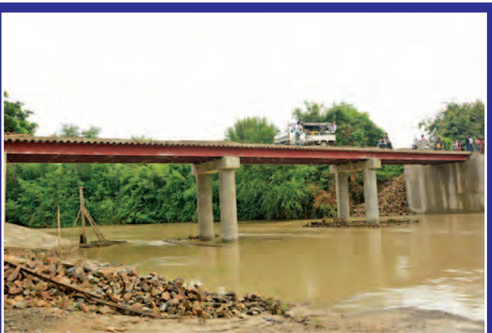
နေပြည်တော်ကောင်စီနယ်မြေ တပ်ကုန်းမြို့နယ်နှင့် ဘုရင့်နောင်ရပ်ကွက်(ပိန်းတော)ဆက်သွယ်ထားသည့် တပ်ကုန်း- ပိန်းတော ကွန်ကရစ်တံတားကြီးသည် ဟောင်းနွမ်းပျက်စီးနေသည့်အတွက် နေပြည်တော်ကောင်စီရန်ပုံငွေဖြင့် ပြန်လည်ပြုပြင် တည်ဆောက်ခဲ့ရာ ၈၀ ရာခိုင်နှုန်းခန့် ပြီးစီးနေပြီဖြစ်သည်။ ယခုအခါ မိုးတွင်းကာလချောင်းရေလာသဖြင့် ပြည်သူများသွားလာမှု လွယ်ကူစေရန် အောက်တိုဘာ ၄ ရက်က ဒေသထွားလာခွင့်ပြုထားသည်ကို တွေ့ရစဉ်။