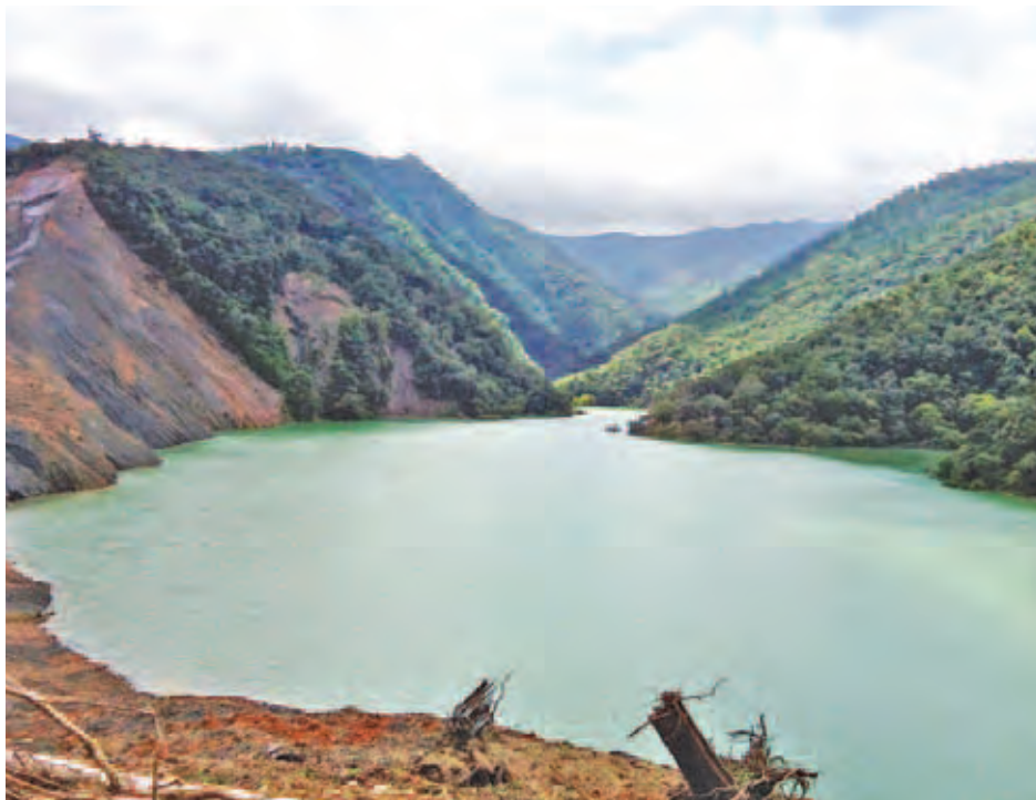
ရာဇဂြိုဟ်ရေလျှောက်တံမဲ့အတွင်းစီးဝင်မည့် နေရလွှာချောင်း၏ချောင်းလက်တက်ဖြစ်သော တွန်းဇံမြို့နယ်အတွင်းတွင်

ချင်းပြည်နယ် တွန်းဇံမြို့နယ်အတွင်းရှိ ဆယ်ဘော်ရွာမှ သုံးမိုင်ခန့်ရှိတောင်ယာအနီးတွင် ဩဂုတ် ၁ ရက်က မြေပြိုမှုဖြစ်ပွားခဲ့ပြီး လူခုနစ်ဦး ပျောက်ဆုံးခဲ့မှုဖြစ်စဉ်ကို ချင်းပြည်နယ်အစိုးရအဖွဲ့မှ ဩဂုတ် ၄ ရက်တွင် အမျိုးသား သဘာဝဘေးအန္တရာယ်ဆိုင်ရာ စီမံခန့်ခွဲမှုလုပ်ငန်း ကော်မတီသို့ တင်ပြထားရှိပြီး ဘေးသင့်သေဆုံးစာရင်းတွင် ထည့်သွင်းထားရှိမှုနှင့်အတူ သေဆုံးသူများ၏ အထောက်အထားများ ဆက်သွယ်တောင်းခံ၍ ထောက်ပံ့ငွေပေးအပ်နိုင်ရန် ဆက်လက်ဆောင်ရွက်လျက်ရှိကြောင်း သိရသည်။