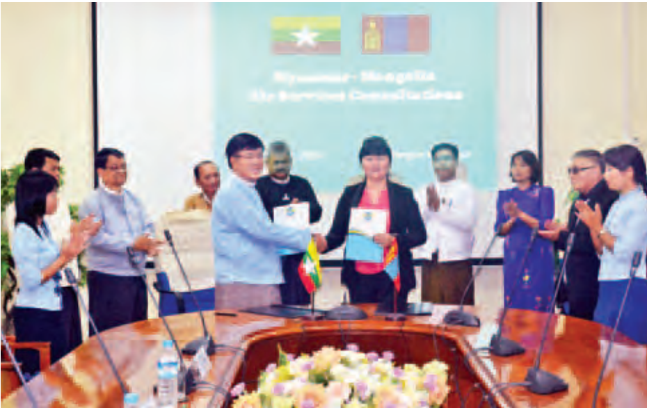
သဘောတူညီခဲ့ပြီး ၎င်းစာချုပ်အား ကို ဆက်လက်ဆောင်ရွက်သွားရန် အတည်ပြုလက်မှတ်ရေးထိုးနိုင်ရေး သဘောတူညီခဲ့ကြပြီး လေကြောင်းသဘောတူညီခဲ့ကြသည်။ (ကြေးမုံ)

ရန်ကုန် အောက်တိုဘာ ၆ - မြန်မာနှင့် မွန်ဂိုလီးယားနိုင်ငံတို့အကြား နှစ်နိုင်ငံလေကြောင်းသဘောတူစာချုပ် ချုပ်ဆိုရေးဆိုင်ရာ ညှိနှိုင်းဆွေးနွေးပွဲကို စက်တင်ဘာ ၃၀ ရက်နှင့် အောက်တိုဘာ ၁ ရက်တို့တွင် ရန်ကုန်မြို့ရှိ လေကြောင်းပို့ဆောင်ရေးညွှန်ကြားမှု ဦးစီးဌာန၌ ကျင်းပခဲ့ကြောင်း သိရသည်။