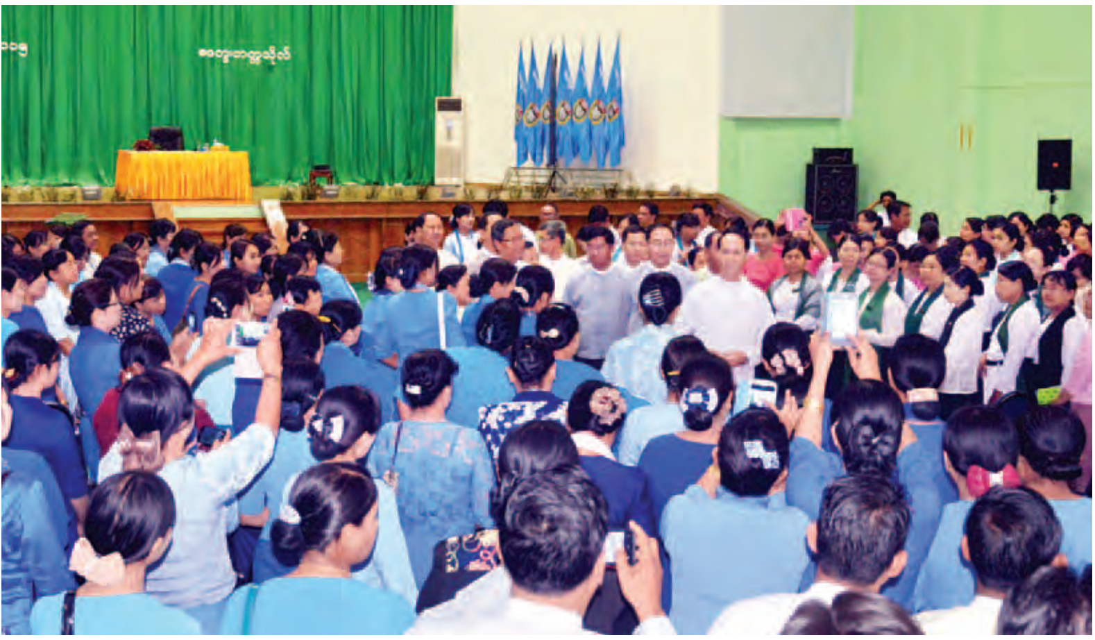
ဒုတိယသမ္မတ ဒေါက်တာစိုင်းမောက်ခမ်း မကွေးတက္ကသိုလ်တွင် ဆရာ ဆရာမများအား ရင်းရင်းနှီးနှီးနှုတ်ဆက်စဉ်။ (သတင်းစဉ်)

နေပြည်တော် အောက်တိုဘာ ၆ ပြည်ထောင်စုသမ္မတ မြန်မာနိုင်ငံတော် ဒုတိယသမ္မတ ဒေါက်တာစိုင်းမောက်ခမ်းသည် ဒုတိယဝန်ကြီးများ၊ တာဝန်ရှိသူများနှင့်အတူ ယနေ့နံနက် ၈ နာရီ မိနစ် ၄၀ တွင် မြန်မာအမျိုးသားလေကြောင်းဖြင့် မကွေးတိုင်းဒေသကြီး မကွေးမြို့သို့ ရောက်ရှိကြရာ တိုင်းဒေသကြီးဝန်ကြီးချုပ် ဦးဘုန်းမော်ရွှေ၊ တိုင်းဒေသကြီး အစိုးရအဖွဲ့ဝင် ဝန်ကြီးများနှင့် တာဝန်ရှိသူများက လေဆိပ်၌ ကြိုဆိုနှုတ်ဆက်ကြသည်။ ထို့နောက် ဒုတိယသမ္မတနှင့် အဖွဲ့ဝင်များသည် မကွေးတက္ကသိုလ် ဘက်စုံခန်းမ၌ ကျင်းပမည့် မကွေးတက္ကသိုလ်၊ နည်းပညာတက္ကသိုလ်၊ ကွန်ပျူတာတက္ကသိုလ်နှင့် ပညာရေးကောလိပ်တို့မှ ပါမောက္ခချုပ်များ၊ ပါမောက္ခများ၊ ဆရာဆရာမများနှင့် တွေ့ဆုံပွဲအခမ်းအနားသို့ တက်ရောက်သည်။ ထိုမှတစ်ဆင့် ဒုတိယသမ္မတနှင့် အဖွဲ့ဝင်များသည် မကွေးမြို့မှ မြန်မာ အမျိုးသားလေကြောင်းဖြင့် ဆက်လက်ထွက်ခွာရာ ပခုက္ကူမြို့သို့ ရောက်ရှိကြပြီး ပခုက္ကူတက္ကသိုလ် စာမျက်နှာ ၃ ကော်လံ ၁ သို့ ☆