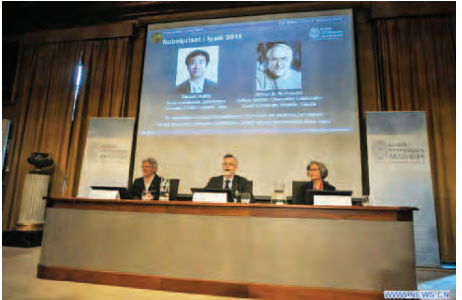
အပိုင်းမှ လှုပ်ရှားမှုများကို သူတို့နှစ်ဦး၏ လေ့လာတွေ့ရှိချက်က ပြောင်းလဲစေခဲ့ကြောင်း နိဘယ်လ်ဆုရှေးချယ်သည့် ဆွီဒင်တော်ဝင်သိပ္ပံအကယ်ဒမီက ပြောကြားသည်။ အင်န်အိတ်ချီကေ။

မက်ဒေါ့နယ်သည်လည်း ကနေဒါနိုင်ငံတွင် နျူထရီယွန် လေ့လာမှုအဖွဲ့ကို ဦးဆောင်လှုပ်ရှားခဲ့သူဖြစ်သည်။ လူအများသိရှိထားသည့် ဖြစ်ထုများ၏ အတွင်းအကျဆုံး