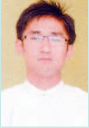
ဦးဇေယျာလင်း သရုပ်ပြ၊ ဘူမိဗေဒဌာန ကလေးတက္ကသိုလ်။