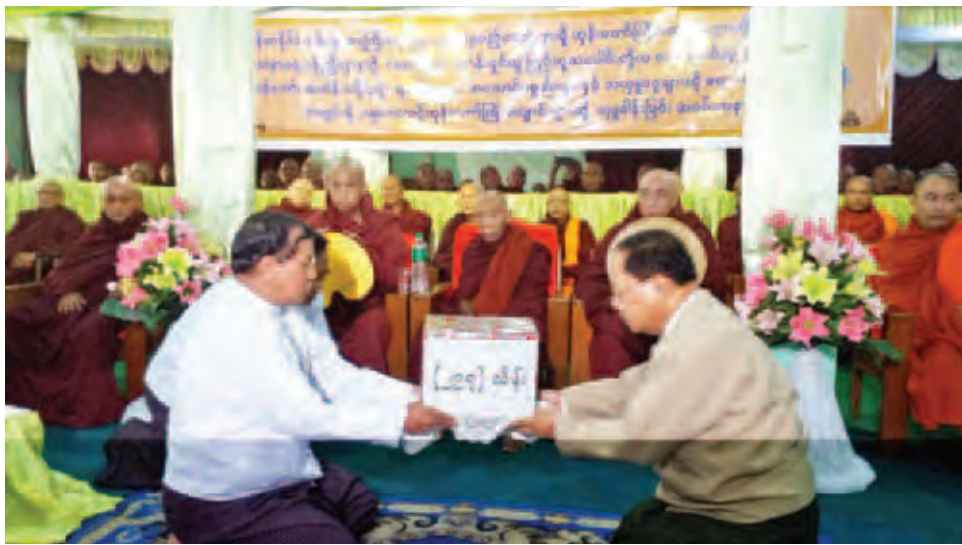
ပြည်ထောင်စုဝန်ကြီး ဦးစိုးဝင်းက နိုင်ငံတော်ဗဟိုသံဃာ့ဝန်ဆောင် အင်္ဂပူမြို့ စံကျောင်းတိုက်ဦးစီးပဓာနနာယက ဘဒ္ဒန္တစက္ကိန္ဒ (ဂန္ထဝါစက ပဏ္ဍိတ အဂ္ဂမဟာအကျော်) ထံ လှူဖွယ်ဝတ္ထုပစ္စည်းများ ဆက်ကပ်လှူဒါန်းသည်။

ဧရာဝတီတိုင်းဒေသကြီးအတွင်းရှိ ရေဘေးသင့် ဘုန်းတော်ကြီးကျောင်းများသို့ ဆွမ်းဆန်တော်၊ သင်္ကန်း၊ သပိတ်၊ ပရိကွရ၊ ရဟန်းအသုံးအဆောင်ပစ္စည်းများနှင့် ရေဘေးဒဏ်ကြောင့် ပျက်စီးခဲ့သည့် ဘုန်းတော်ကြီးကျောင်းများ ပြန်လည်ပြုပြင်ရန် အလှူငွေပေးအပ်လှူဒါန်းပွဲ အခမ်းအနားကို ဧရာဝတီတိုင်းဒေသကြီးအင်္ဂပူမြို့နယ် ဇေယျသုခကျောင်းတိုက်၌ ကျင်းပရာ နိုင်ငံတော်ဗဟိုသံဃာ့ဝန်ဆောင် အင်္ဂပူမြို့ စံကျောင်းတိုက်ဦးစီးပဓာနနာယက ဘဒ္ဒန္တစက္ကိန္ဒ (ဂန္ထဝါစက ပဏ္ဍိတ အဂ္ဂမဟာအကျော်) အရှင်သူမြတ်အမှူးပြုသော မြို့နယ်သံဃာနာယက ဆရာတော်များနှင့် ဧရာဝတီတိုင်းဒေသကြီး အတွင်းရှိ ဘုန်းတော်ကြီး ကျောင်းများမှ ဆရာတော်သံဃာတော်များ တက်ရောက်ကြသည်။