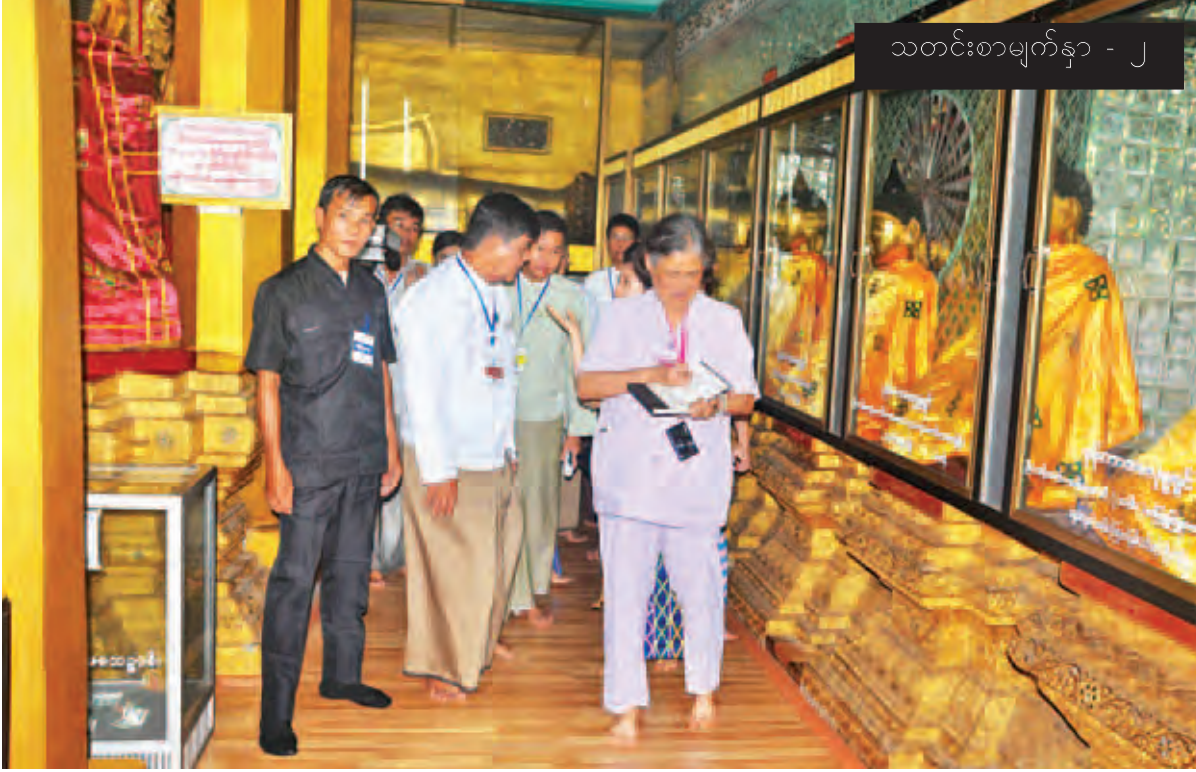
ထိုင်းနိုင်ငံဘုရင့်သမီးတော် မဟာချက်ကရီသီရိဒုံ မြတ်မြို့ရှိ လေးကျွန်းဆိမီးသိမ်တော်ကြီးပြတိုက်ကို ကြည့်ရှုလေ့လာစဉ်။ (ဓာတ်ပုံ-ပြန်/ဆက်)