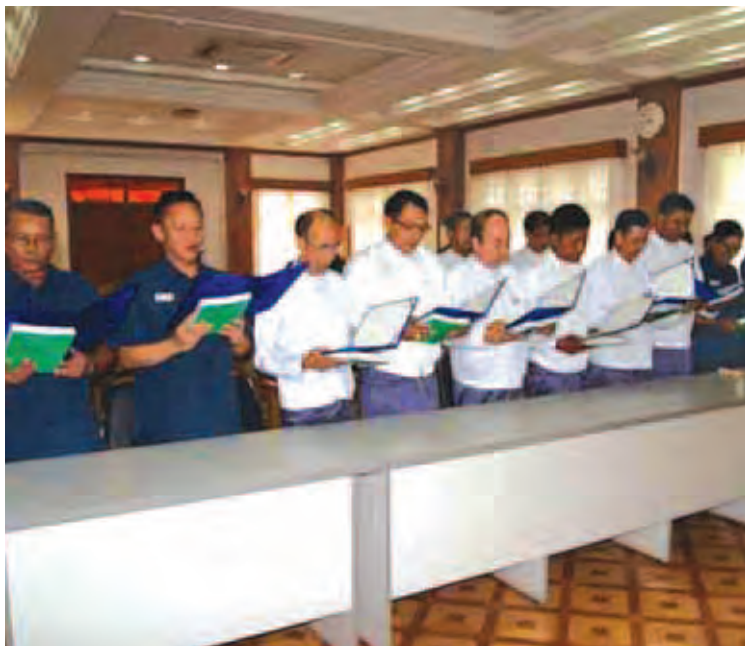
စေရေးအတွက် မြို့တော်စည်ပင်သာယာရေးကော်မတီဝင်များနှင့် ဝန်ထမ်းများက ကိုယ်စွမ်း၊ ဉာဏ်စွမ်းရှိသရွေ့ ဥပဒေနှင့်အညီ စေတနာထားကြိုးပမ်းဆောင်ရွက် တိုက်တွန်းမှာကြားခဲ့ကြောင်း သိရသည်။ ခေမင်းနိုင်(မန္တလေး)

ဝန်ကြီး ဦးကျော်ဆန်းနှင့် ဘဏ္ဍာရေး ဝန်ကြီးဒေါက်တာမြင့်ကြူ တိုင်းဒေသကြီး ဥပဒေချုပ် ဦးရဲအောင်မြင့် တိုင်းဒေသကြီး အစိုးရအဖွဲ့ အတွင်းရေးမှူး ဦးဝင်းရှိန်နှင့် တာဝန်ရှိသူများတက်ရောက်ခဲ့ကြသည်။ အစီအစဉ်အရ တိုင်းဒေသကြီးအစိုးရအဖွဲ့ ဝန်ကြီးချုပ်ရှေ့မှောက်၌ မြို့တော်စည်ပင်သာယာရေး ကော်မတီဝင်များက ကတိသစ္စာပြုကြသည်။ ယင်းနောက် တိုင်းဒေသကြီးဝန်ကြီးချုပ်က အမှာစကား ပြောကြားရာတွင် မြို့တော်သန့်ရှင်း သာယာလှပရေး၊ မြို့တော်ဖွံ့ဖြိုးတိုးတက်ရေး၊ မြို့တော်နေပြည်သူလူထုစိတ်ချမ်းမြေ့