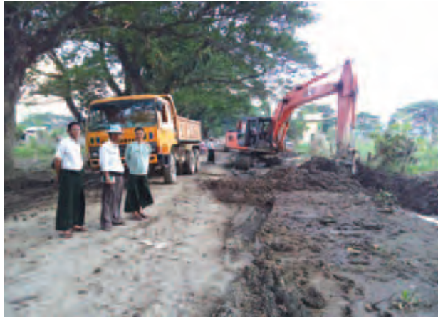
ကလေး အောက်တိုဘာ ၄ ကလေးဒေသ ရေကြီးရေလျှံမှုကြောင့် ပျက်စီးသွားသော ကလေး-

ပြင်သာလမ်း ပြုပြင်ခြင်း လုပ်ငန်းများကို နိုင်ငံတော်သမ္မတ၏ လမ်းညွှန်ချက်ဖြင့် မူလအနေအထားထက်