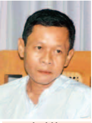
ဦးသန်းနိုင်

ဖြေ။ ဒီ ၂၀၁၅ ရွေးကောက်ပွဲဆန္ဒမဲလက်မှတ်တွေကတော့ ပိုကောင်းတယ်လို့ ပြောချင်ပါတယ်။ ဘာဖြစ်လို့လဲဆိုတော့ စက္ကူအနေအထားအရလည်းကောင်းတယ်။ ရေစာဆိုတဲ့ လုံခြုံရေးအမှတ်တံဆိပ်တွေလည်း ထည့်သွင်းထားတယ်။ ၂၀၁၀ မဲလက်မှတ်တွေကတော့ စက္ကူက အညိုရောင်ဖြစ်ပြီး အထူစားဖြစ်တယ်။ ဒါပေမယ့် လုံခြုံရေးအမှတ်အသားတွေက ပုံနှိပ်တဲ့အခါမှ ထည့်တာဖြစ်တဲ့အတွက် ဒီ ၂၀၁၅ ဆန္ဒမဲလက်မှတ်တွေကတော့ အရည်အသွေးလည်း ပိုကောင်းတဲ့အပြင် စက္ကူမှာကိုက် လုံခြုံရေးရေစာသုံးထားတဲ့အတွက် ပိုပြီးလုံခြုံစိတ်ချမှု အပြည့်အဝရှိပါတယ်။