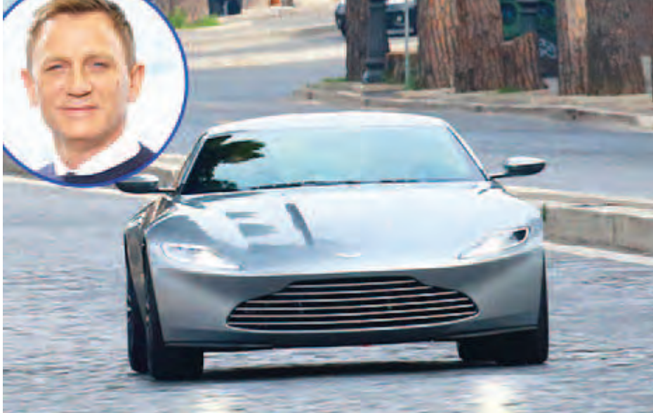
အဆိုပါရုပ်ရှင်တွင် ကားစုစုပေါင်း ရိုက်ကူးခဲ့ပြီး ရိုက်ကွင်းများကို ကိုလို ဗြိတိန်အနီးတွင် သွားရောက် ညွှန်ကြားရေးမှူးက ပြောကြားခဲ့သည်။ ခုနစ်စီးကို အပျက်စီး အဆုံးရှုံးခံကာ စီယမ်၊ တင်းမ်ဘားမြစ်နှင့် ဘာတီကန် ရိုက်ကူးခဲ့ကြောင်း သိရသည်။

ကမ္ဘာကျော် အက်ရှင်ဇာတ်ကားများအနက် ယနေ့ထိတိုင် ကျော်ကြားနေဆဲဖြစ်သော ကျမ်းစာရုပ်ရှင်များ၏ ရုပ်ရှင်သစ် "Spectre" တွင် အပေရီကန်ဒေါ်လာ နှစ်သန်းတန်ဖိုးရှိ အော်စတရန်မာတင်အမျိုးအစားကားများကို အပျက်အစီးခံကာ ရိုက်ကူးခဲ့ကြောင်း အဆိုပါရုပ်ရှင်၏ ညွှန်ကြားရေးမှူး ဂရော့ပေါ့ဝဲလ်က ဒေးလီမေးသတင်းစာနှင့်ပြုလုပ်သော အင်တာဗျူးတစ်ခုတွင် ထုတ်ဖော်ပြောကြားခဲ့သည်။