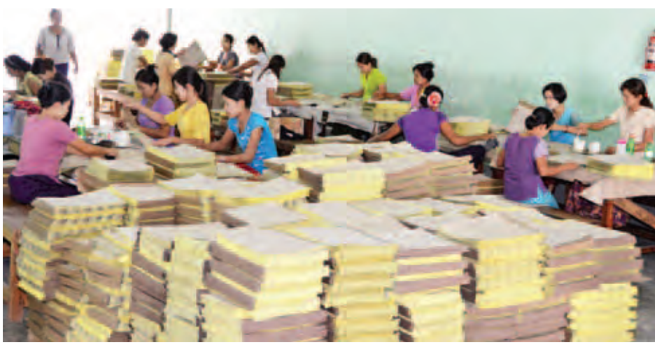
ဆန္ဒမဲလက်မှတ်များကို မဲဆန္ဒနယ်မြေအလိုက် ခွဲခြားထုတ်ပေးနေသည်ကို တွေ့ရစဉ်။