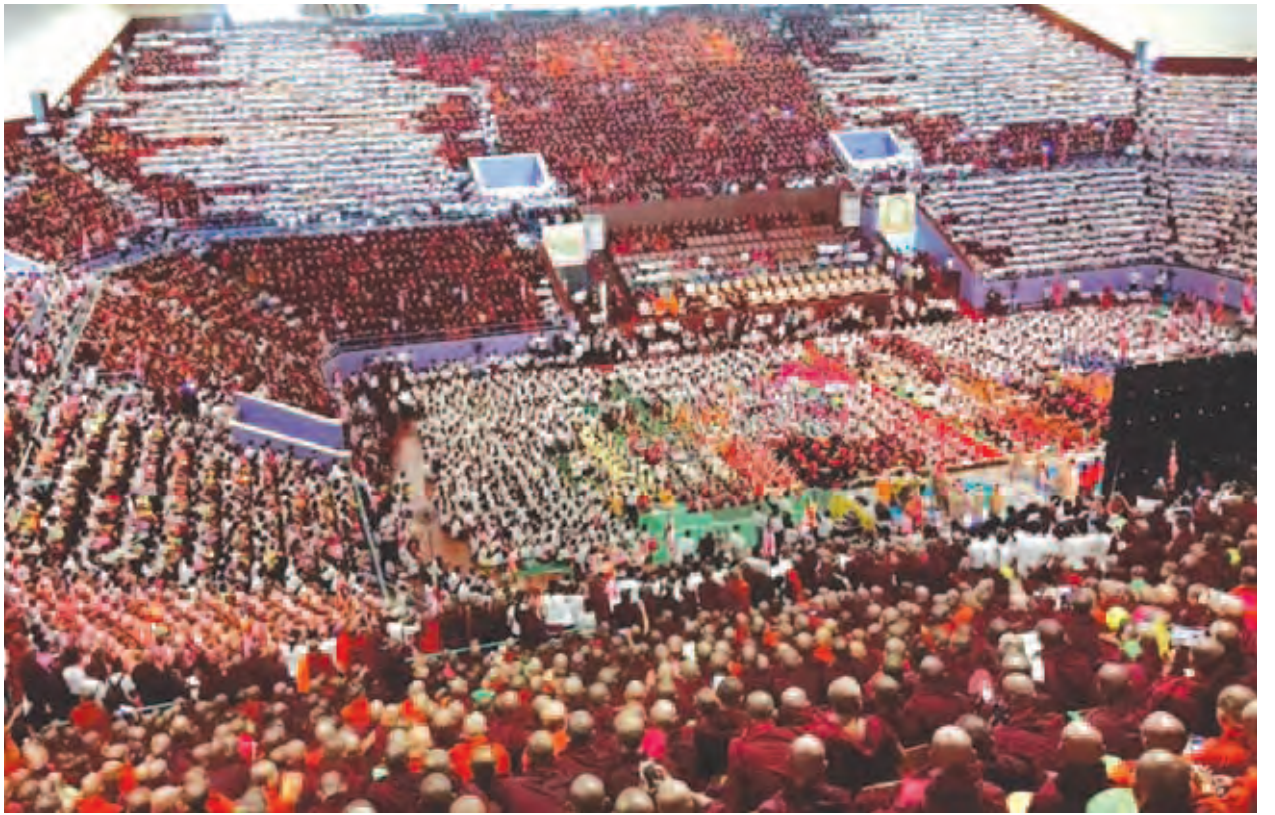
စောင့်ရှောက်ရေးအဖွဲ့(ဗဟို)၏ သဘောထားကို ထုတ်ပြန်ကြေညာခဲ့သည်။ အမျိုးဘာသာ သာသနာစောင့်ရှောက်ရေးအဖွဲ့(ဗဟို)မှ ဦးဆောင်ကျင်းပသည့် အဆိုပါ အခမ်းအနားသို့ အမျိုးဘာသာ သာသနာစောင့်ရှောက်ရေးအဖွဲ့များ၊ သံတမန်များ၊ ဘာသာပေါင်းစုံအဖွဲ့အစည်းများ၊ အရပ်ဘက်လူ့အဖွဲ့အစည်းများနှင့် နိုင်ငံရေးပါတီများအပါအဝင် လူဦးရေ တစ်သိန်းကျော် တက်ရောက်ခဲ့ကြောင်း သိရသည်။