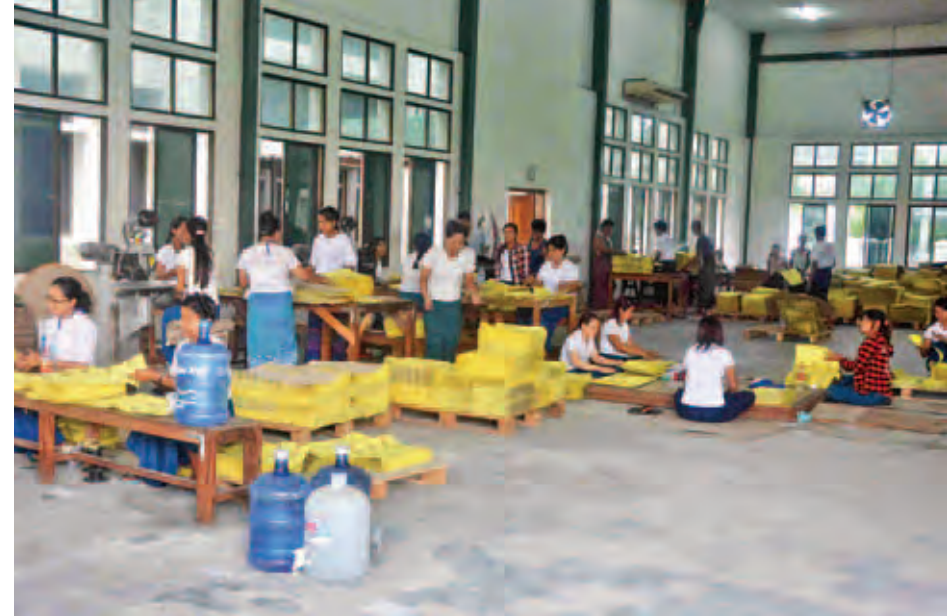
ဆန္ဒမဲလက်မှတ်များ အချိန်မီပြီးစီးရေး ဝန်ထမ်းများအဆင့်လိုက် ခေါက်၊ ချုပ်တွဲလုပ်ငန်းများ ပြုလုပ်နေသည်ကို တွေ့ရစဉ်။

ဖြေ။ ဒီ ၂၀၁၅ ရွေးကောက်ပွဲဆန္ဒမဲလက်မှတ်တွေကို ကျွန်တော်တို့ရဲ့ စာပြင်တွေ၊ စာစစ်အဖွဲ့တွေက ကိုယ်စားလှယ်လောင်းအမည်၊ ပါတီလိုဂိုတံဆိပ်၊ မဲဆန္ဒနယ်အစ ရှိတဲ့ စာသားတွေမှန်မှန် အဆင့်ဆင့် စစ်ဆေးမှုတွေ ပြုလုပ်ပါတယ်။