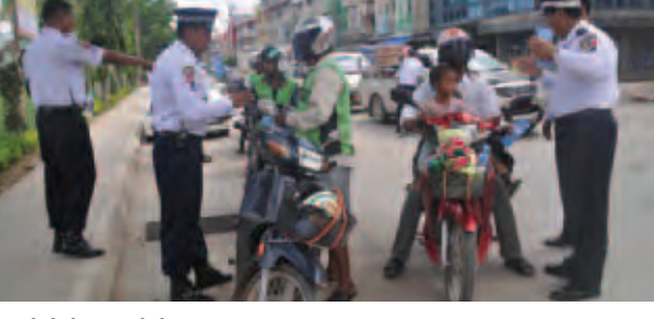
တာချီလိတ် အောက်တိုဘာ ၄