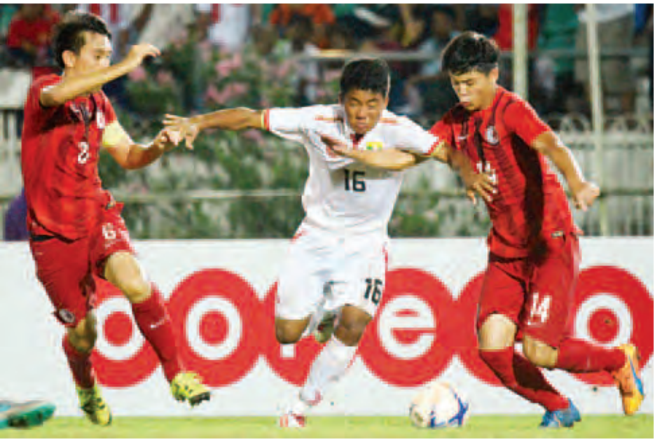
မြန်မာနှင့်ဟောင်ကောင်တို့ အကြိတ်အနယ် ယှဉ်ပြိုင်နေစဉ်။

ယနေ့ပွဲစဉ်များအပြီးတွင် ဗီယက်နမ်အသင်းကသုံး ပွဲကစားကိုးမှတစ်မြန်မာအသင်းက ခုနစ်မှတ်ရရှိကာ တိုက် ရိုက်ခြေစစ်ပွဲအောင်မြင်ရေးအပြင်ဖြစ်နေပြီး မြန်မာ