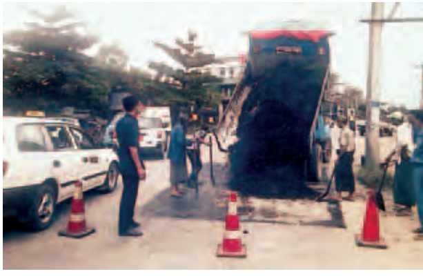
ပိုလ်ဗထူးလမ်းမကြီးသည် မြောက်ကော်မတီရုံးရှိ မြို့နယ်အခြေပြု ဥက္ကလာပမြို့နယ်၊ ဒဂုံမြို့သစ် မြေပုံကားချပ်တွင် ဖော်ပြထားမှုအရ (အရှေ့ပိုင်း) မြို့နယ်တို့နှင့် ဆက်သွယ်ထားသည့် လမ်းမကြီးများဖြစ်ကြောင်း မြို့နယ်စည်ပင်သာယာရေး