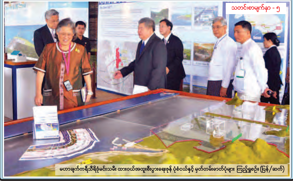
သတင်းစာမျက်နှာ - ၅