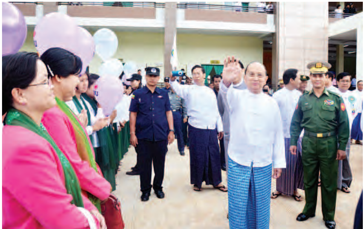
နိုင်ငံတော်သမ္မတ ဦးသိန်းစိန် ဆေးတက္ကသိုလ်(တောင်ကြီး)ဖွင့်ပွဲအခမ်းအနားသို့ တက်ရောက်လာကြသူများအား ရင်းရင်းနှီးနှီးနှုတ်ဆက်စဉ်။ (သတင်းစဉ်)

သက်သာပျောက်ကင်းအောင် ကုသပေးနိုင်သည့် ဆရာဝန်၊ ဆရာဝန်မကြီးများစွာလိုအပ်ပါကြောင်း၊ ထိုကဲ့သို့ ဆေးပညာနားလည်တတ်ကျွမ်းသည့် ဆရာဝန်၊ ဆရာဝန်မကြီး များစွာပေါ်ထွန်းလာစေရန်အတွက် ယခုကဲ့သို့ ဆေးတက္ကသိုလ်ကြီးများ မရှိမဖြစ်လိုအပ်ပါကြောင်း။