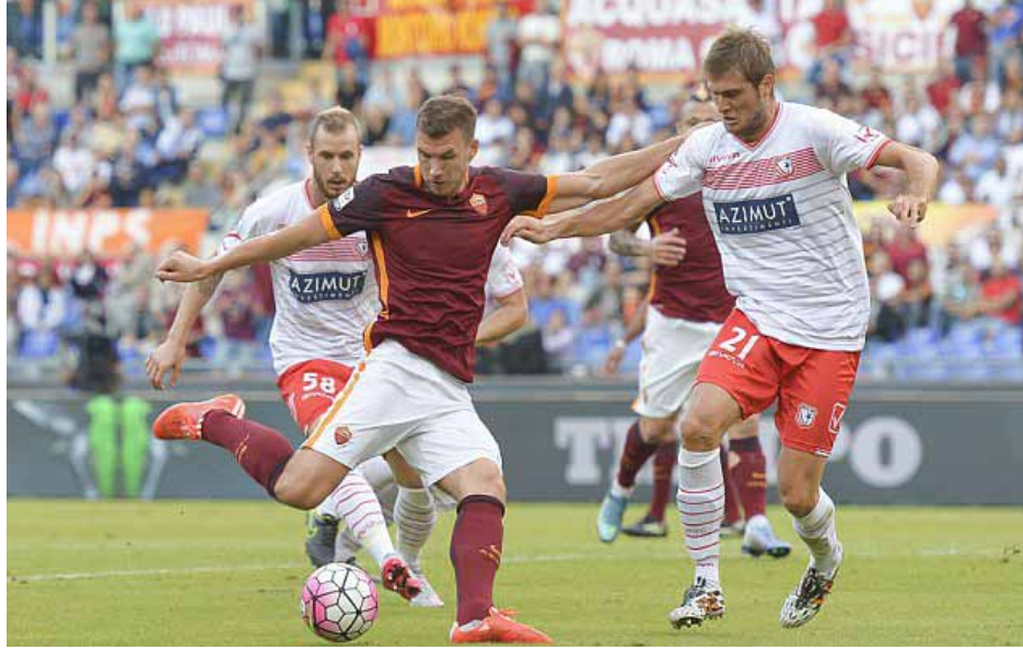
ငွေကြေးပမာဏလောက်ဖြင့်ရရှိသည်မှာ ရိုးမားအတွက် ကံကောင်းမှုတစ်ရပ်ပင်ဖြစ်သည်။ ရိုးမားအသင်းဘက်မှ ကစားသမားနှစ်ဦးအပြီးသတ်ခေါ်ယူချင်သည့်အတွက် ခန့်မှန်းပမာဏအတိုင်းပေးချေခွင့်ရရှိရန်မူတောင်းခဲ့သည်။

စီးရီးအေကလပ်ရိုးမားအသင်းသည် ပရီမီယာလိဂ်မှ အငှားဖြင့်လာရောက်ကစားပေးနေသော ဆာလာနှင့် ဇက်ကိုတို့နှစ်ဦးအား အပြီးသတ်ခေါ်ယူချင်သည့်အတွက် ခန့်မှန်းပမာဏလောက်ဖြင့်ရရှိသည်မှာ ရိုးမားအတွက် ကံကောင်းမှုတစ်ရပ်ပင်ဖြစ်သည်။ ရိုးမားအသင်းဘက်မှ ကစားသမားနှစ်ဦးအပြီးသတ်ခေါ်ယူချင်သည့်အတွက် ခန့်မှန်းပမာဏအတိုင်းပေးချေခွင့်ရရှိရန်မူတောင်းခဲ့သည်။