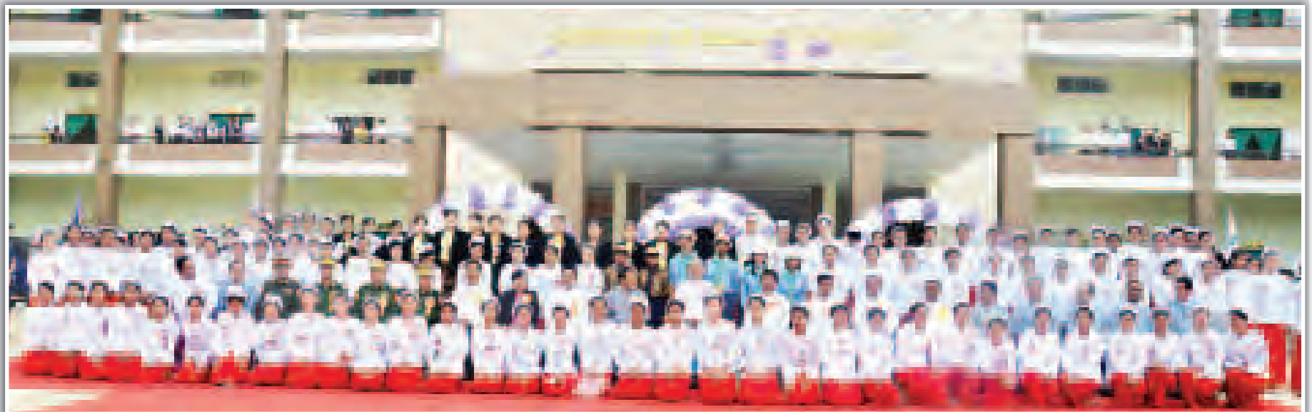
နိုင်ငံတော်သမ္မတ ဦးသိန်းစိန် (အလယ်) နှင့် အခြားအဖွဲ့ဝင်များနှင့် တက်ရောက်ခဲ့သည့် ဆေးတက္ကသိုလ် (တောင်ကြီး) ဖွင့်ပွဲအခမ်းအနား