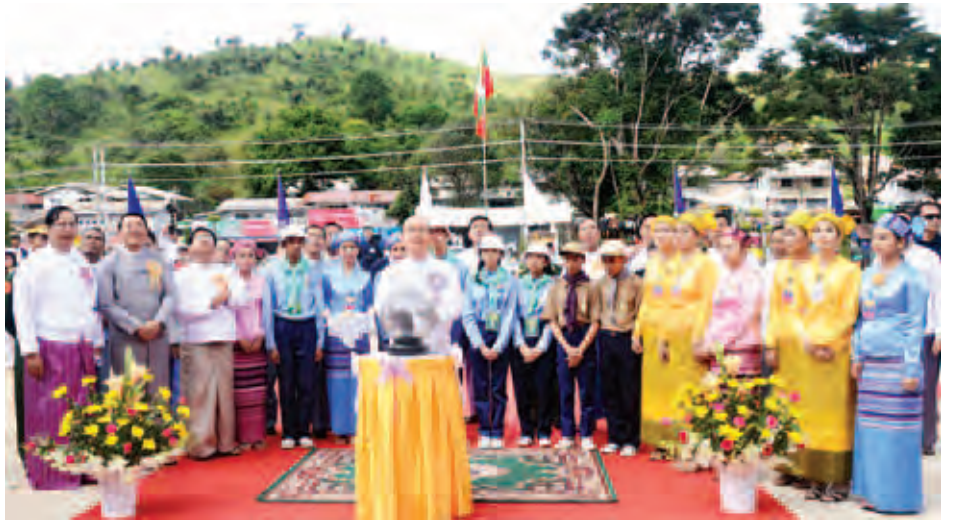
နိုင်ငံတော်သမ္မတ ဦးသိန်းစိန် ဆေးတက္ကသိုလ်(တောင်ကြီး)ဆိုင်းဘုတ်အား စက်ခလုတ်နှိပ်ဖွင့်လှစ်ပေးစဉ်။