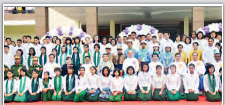
နိုင်ငံတော်သမ္မတ ဦးသိန်းစိန် (အလယ်) နှင့် အခြားအဖွဲ့ဝင်များနှင့် တက်ရောက်ခဲ့သည့် ဆေးတက္ကသိုလ် (တောင်ကြီး) ဖွင့်ပွဲအခမ်းအနား ဓာတ်ပုံ (ဝေါ်ဖို)