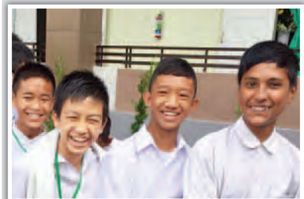
နိုင်ငံတော်သမ္မတ ဦးသိန်းစိန် (အလယ်) နှင့် အခြားအဖွဲ့ဝင်များနှင့် တက်ရောက်ခဲ့သည့် ဆေးတက္ကသိုလ် (တောင်ကြီး) ဖွင့်ပွဲအခမ်းအနား