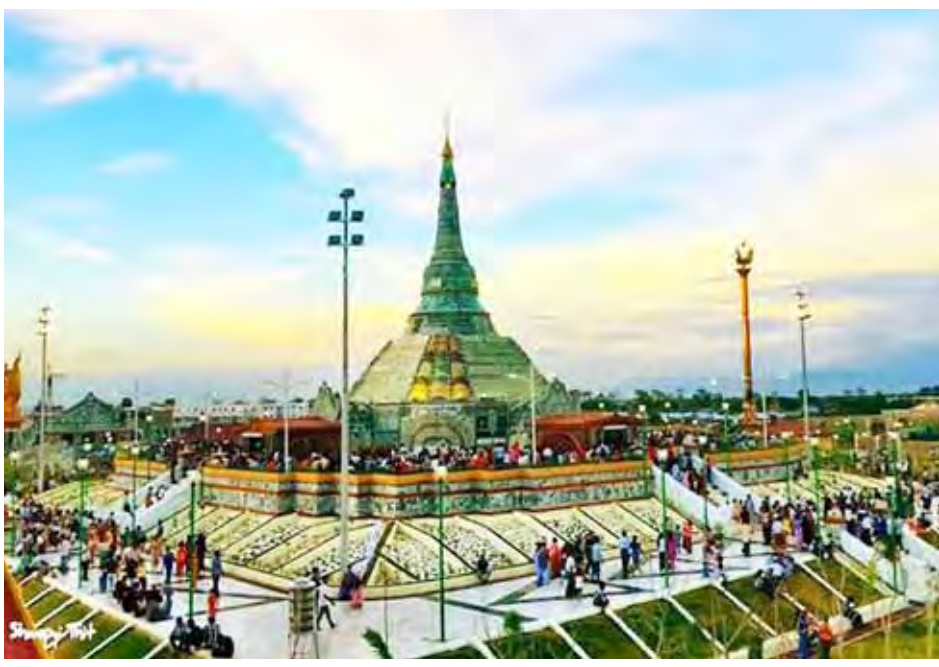
ဝေရောစန ကျောက်စိမ်းစေတီတော်မြတ်ကြီးအား ကြည့်ညိဖွယ် ဖူးတွေ့ရစဉ်။

ကျောက်စိမ်းစေတီတော်အနီးတွင် ကျောက်စိမ်းဓမ္မာရုံကို တည်ဆောက်ထားပြီး နိုင်ငံတကာအဆင့်မီ ကျောက်မျက်စေးနှင့် ထူးဆန်းထွေလာကျောက်စိမ်းကမ္ဘာပြတိုက်တို့ကို ဆက်လက်တည်ဆောက်လျက်ရှိသည်။ ကျောက်စိမ်းသည် လှပခြင်း၊ ကြာရှည်ခံခြင်း၊ ရှားပါး