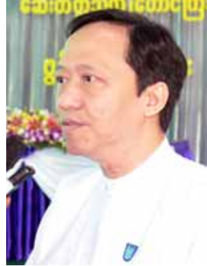
ဒေါက်တာ သက်ခိုင်ဝင်း(ပါမောက္ခ) အမြဲတမ်းအတွင်းဝန်၊ ကျန်းမာရေးဝန်ကြီးဌာန