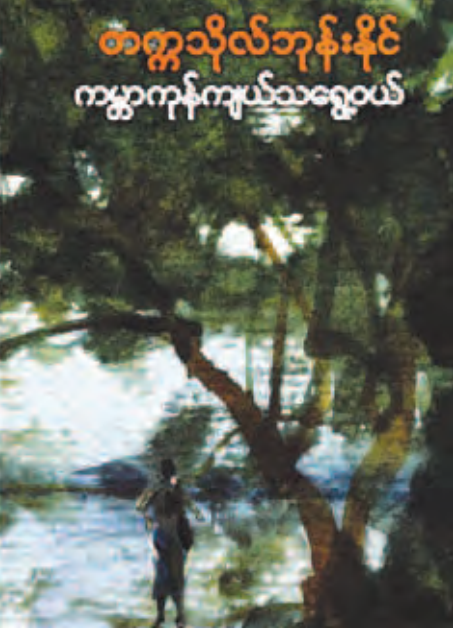
တက္ကသိုလ်ဘုန်းနိုင် ကျွန်ုပ်ကျယ်သရွေ့ဝယ်