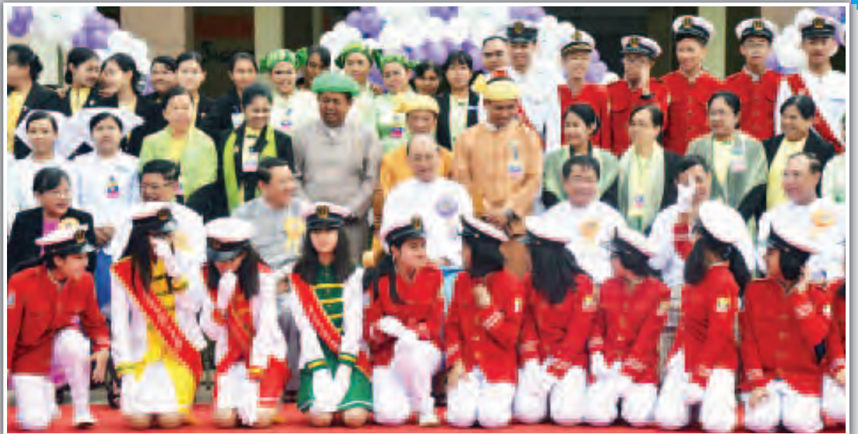
နိုင်ငံတော်သမ္မတ ဦးသိန်းစိန် (အလယ်) နှင့် အခြားအဖွဲ့ဝင်များနှင့် တက်ရောက်ခဲ့သည့် ဆေးတက္ကသိုလ် (တောင်ကြီး) ဖွင့်ပွဲအခမ်းအနား

နိုင်ငံတော်သမ္မတ ဦးသိန်းစိန် ရှမ်းပြည်နယ် တောင်ကြီးမြို့ ဆေးတက္ကသိုလ် (တောင်ကြီး) ဖွင့်ပွဲအခမ်းအနား တက်ရောက် ခဲ့မှု မှတ်တမ်းဓာတ်ပုံများ။