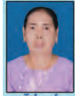
ခေါ်ခေါ်ဓမ္မစင်စမ်း (ရွှေပြည်နန်း သနပ်ခါးသုံးစွဲခြင်းကြောင့် ရရှိသောအကျိုးကျေးဇူးများနှင့် ပတ်သက်၍ ကိုယ်တိုင်ကြံတွေးရသော မြစ်ရပ်များကို အခြေခံပြီး (စာမျက်နှာ တန်ဆာထုတ်မရှိ) နေရပ်လိပ်စာအပြည့်အစုံ ဆက်သွယ်ရန်ဖုန်းနံပါတ်တို့ဖြင့် အမှတ်- ၂၈(H) အင်းယားမြိုင်လမ်း၊ ရွှေတောင်ကြား(၁)ရပ်ကွက်၊ ဗဟန်းမြို့နယ်၊ ရန်ကင်းမြို့သို့ လိပ်စာဖြင့် ရေးသားပေးပို့နိုင်ပါကြောင်း လေးစားစွာဖြင့် မိတ်ခေါ်အပ်ပါသည်။)

တောင်ကြီးဆေးတက္ကသိုလ်သည် မြန်မာနိုင်ငံ၏ ပဉ္စမမြောက်ဆေးတက္ကသိုလ်ဖြစ်ပြီး ရှမ်းပြည်နယ်နှင့် ကယားပြည်နယ်အတွင်းရှိ တိုင်းရင်းသားညီအစ်ကို မောင်နှမများအတွက် ကျန်းမာရေးဆိုင်ရာ လူ့စွမ်းအားအရင်းအမြစ်များ မွေးထုတ်ပေးနိုင်ရန် ရည်ရွယ်ချက်ဖြင့် တည်ဆောက်ဖွင့်လှစ်ပေးခြင်းဖြစ်။