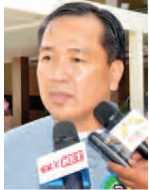
ဒေါက်တာမျိုးထွန်း ရှမ်းပြည်နယ် လူမှုရေးဝန်ကြီး