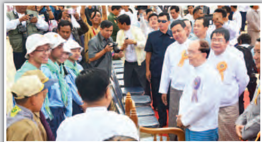
နိုင်ငံတော်သမ္မတ ဦးသိန်းစိန် (အလယ်) နှင့် အခြားအဖွဲ့ဝင်များနှင့် တက်ရောက်ခဲ့သည့် ဆေးတက္ကသိုလ် (တောင်ကြီး) ဖွင့်ပွဲအခမ်းအနား