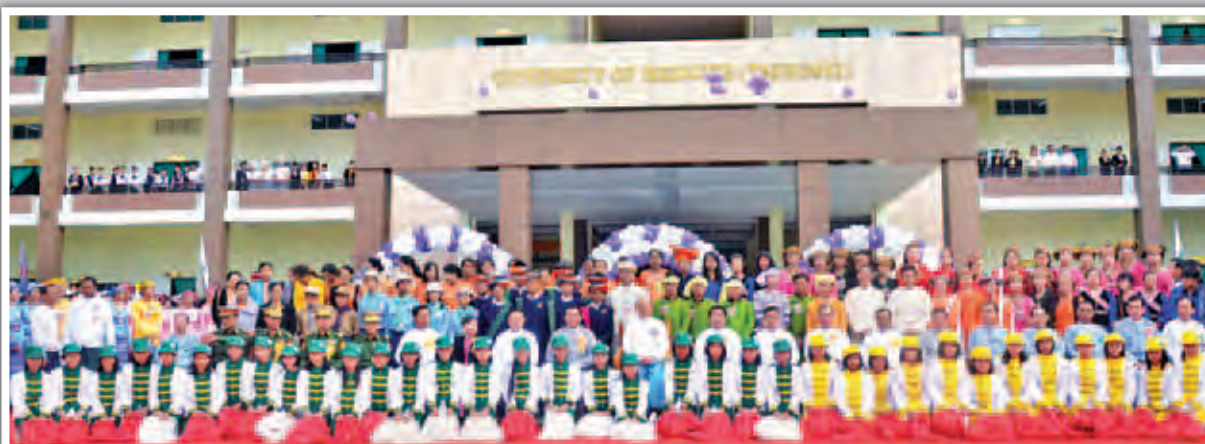
နိုင်ငံတော်သမ္မတ ဦးသိန်းစိန် (အလယ်) နှင့် အခြားအဖွဲ့ဝင်များနှင့် တက်ရောက်ခဲ့သည့် ဆေးတက္ကသိုလ် (တောင်ကြီး) ဖွင့်ပွဲအခမ်းအနား