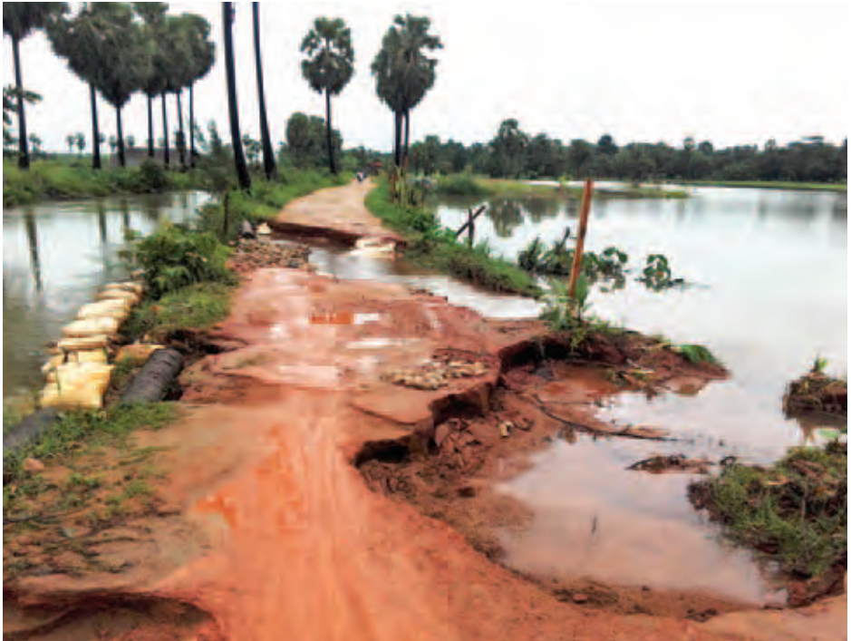
စက်တင်ဘာ ၂၄ ရက်က တစ်နေ့လုံးမိုးများရွာသွန်းမှုကြောင့် ထားဝယ်ခရိုင် လောင်းလုံးမြို့နယ် (က)ရပ်ကွက်နှင့် ပြင်းထိန်ကျေးရွာချင်းဆက်လမ်း ချောင်းရေလျှံကာ ရေကျော်တိုက်စားသဖြင့် သွားရေးလာရေး အခက်တွေ့နေသည်ကို တွေ့ရစဉ်။ စိုးထွန်း(ပြန်/ဆက်)

ယင်းအပြင် အေးသာယာကျေးရွာတွင် အိမ်အလုံး ၃၆ လုံး ဆောက်လုပ်ပေးရန် လျာထားရာမှ ယခုအခါတွင် တိုင်ထူတန်းထိုး ရှစ်လုံးနှင့် ကျင်တွယ်စိုက်နှစ်လုံးတို့အား တောင်လေပ်ကုမ္ပဏီက စတင်ဆောက်လုပ်နေပြီ ဖြစ်သည်။ ကလေးဒေသ ရေကြီးရေလျှံမှုကြောင့် ရပ်ကွက်နှင့်ကျေးရွာ ၆၈ ရွာမှ ကျေးရွာသစ်ပြန်လည်ထူထောင်ရေးနှင့် နေအိမ်ဆောက်လုပ်ပေးရေးအတွက် စုစုပေါင်း အိမ် ၃၅၈ လုံး ဆောက်လုပ်ပေးသွားမည်ဖြစ်ကြောင်း သိရသည်။ (ချင်းတွင်းသား)