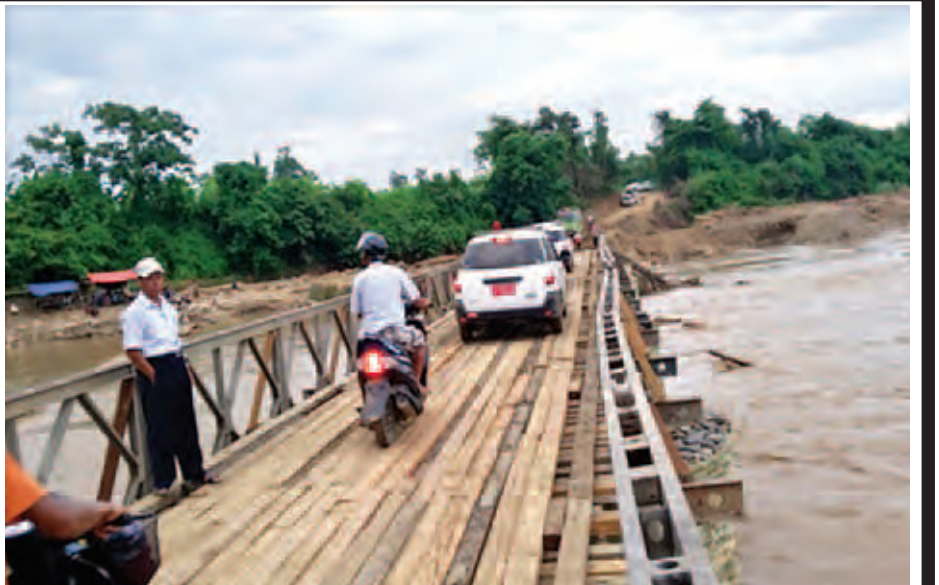
ဇူလိုင်လအတွင်း မိုးသည်းထန်စွာ ရွာသွန်းမှုကြောင့် စစ်ကိုင်းတိုင်းဒေသကြီး၌ ပျက်စီးခဲ့သော ကလေး-ကျိုက်ကုန်း-တမူးလမ်း မိုင်တိုင်အမှတ်(၇၁/၂-၇၃/၃)အကြားရှိ တွိပ်ကုတ်တား(၃/၇၂) ပေ ၂၀၀ ဆောင်ရွက် ပြီးစီး၍ ယာဉ်များ ဖြတ်သန်းနေစဉ်။ (ဆောက်လုပ်ရေး)