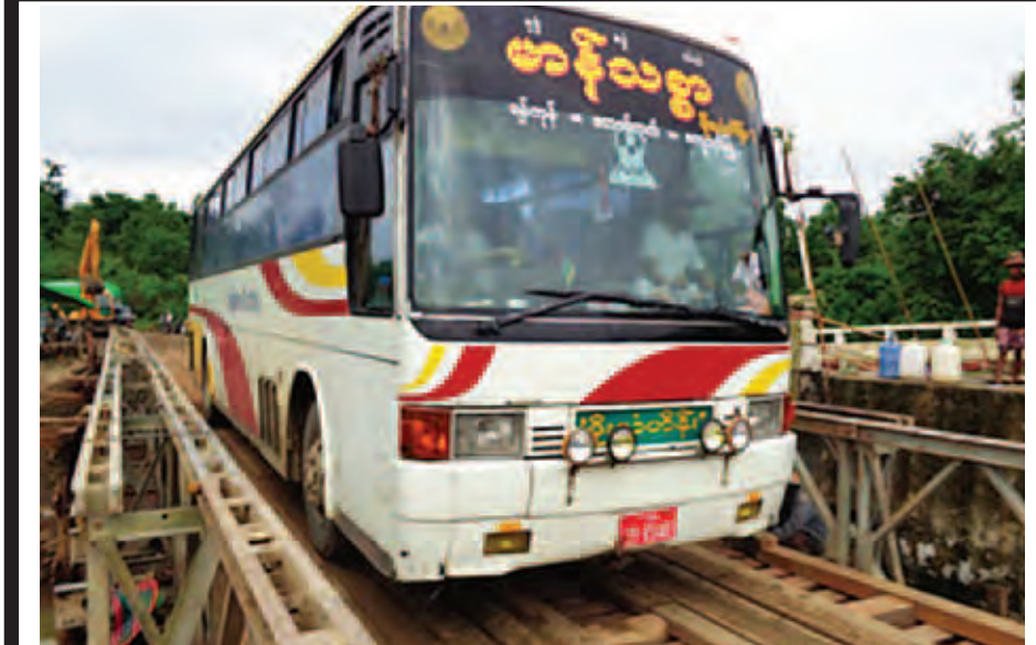
ဇွန်လနှင့် ဇူလိုင်လအတွင်း မိုးသည်းထန်စွာ ရွာသွန်းမှုကြောင့် ရခိုင်ပြည်နယ်၌ ပျက်စီးခဲ့သော ရန်ကုန်-ကျောက်ဖြူလမ်း(တောင်ကုတ်-မအီအပိုင်း) ငှက်ပျောချောင်းတံတား(၂/၁၅) ပေ ၁၂၀ ယာယီဘေးလိတ်တား တည်ဆောက်ပြီးစီး၍ ယာဉ်များ ဖြတ်သန်းနေစဉ်။ (ဆောက်လုပ်ရေး)

နေပြည်တော် အောက်တိုဘာ ၁ ဘာသာရေးအဖွဲ့အစည်းကြီးတွေ နေရသည့် ရေဘေးသင့်ဒေသရှိ ပြည်သူများထံသို့ ကယ်ဆယ်ရေး ပစ္စည်းများ ထောက်ပံ့ပေးအပ်နိုင်ရန် ပြည်တွင်းလေကြောင်းလိုင်းမှ လေယာဉ်များဖြင့် ဆက်လက်ပေးပို့လျက် ရှိရာ ယနေ့တွင် ပြည်တွင်း လေကြောင်းလိုင်းဖြစ်သည့် ကမ္ဘောဇ လေကြောင်းမှ စစ်ကိုင်းတိုင်းဒေသ ကြီး ကလေးလေဆိပ်သို့ ခေါက်ရေ တစ်ခေါက်ဖြင့် ကျောက်စိမ်းပိတ်စလိပ် များကို ပေးပို့ခဲ့သည်။ ထို့ပြင် သဘာဝဘေးအန္တရာယ် ကြုံတွေ့နေရသည့် ရေဘေးသင့်ဒေသရှိ ပြည်သူများထံသို့ ကယ်ဆယ်ရေး ပစ္စည်းများ ထောက်ပံ့ပေးအပ်နိုင်ရန် စက်တင်ဘာ ၃၀ ရက်က တရုတ် ပြည်သူ့သမ္မတနိုင်ငံမှ လှူဒါန်းသည့် ရေစုပ်စက် အလုံး ၁၃၀၀ နှင့် ခြင်ထောင် ၂၂၃၆လုံး စုစုပေါင်း ကုန်တန်ချိန် ကီလိုဂရမ် ၁၀၄၄၀ အား Uni-Top Airlines B 747-200F လေယာဉ်ဖြင့် ရန်ကုန် အပြည်ပြည်ဆိုင်ရာ လေဆိပ်သို့ ရောက်ရှိခဲ့ရာ အဆိုပါပစ္စည်းများကို ကျန်းမာရေးဝန်ကြီးဌာန၊ မီးသတ် ဦးစီးဌာနနှင့် လူမှုဝန်ထမ်း၊ ကယ်ဆယ်ရေးနှင့် ပြန်လည်နေရာချထားရေး ဝန်ကြီးဌာနသို့ လွှဲပြောင်းပေးအပ်ပြီး ဆက်လက်၍ ပြန့်ဝေပို့ဆောင်နိုင်ရေး စီစဉ်ဆောင်ရွက်လျက် ရှိကြောင်း သိရသည်။ (သတင်းစဉ်)