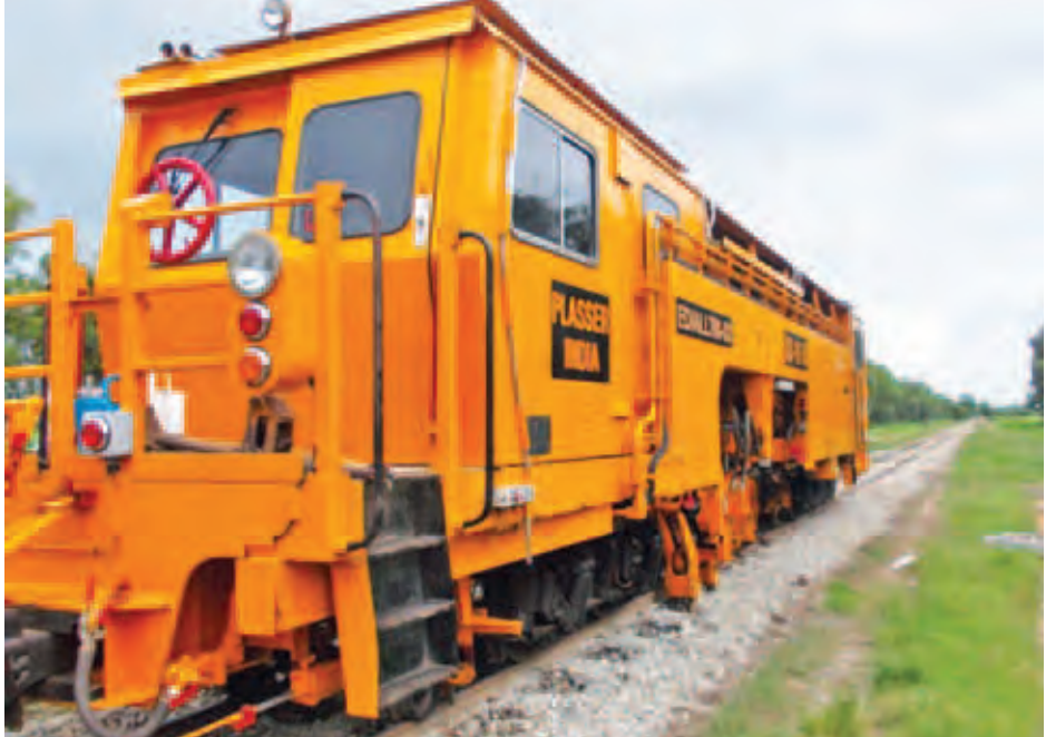
ရန်ကုန်-ငဖြူကလေးကြားရှိ လမ်းပိုင်းတစ်နေရာ၌လက်ရှိ ALLTM စက်ဖြင့် ပတ်ကင်ရိုက်ခြင်းလုပ်ငန်း ဆောင်ရွက်လျက်ရှိသည်ကို တွေ့ရစဉ်။