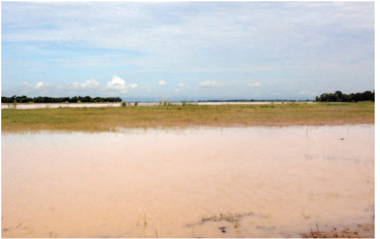
နိုင်ငံတော်သမ္မတ ဦးသိန်းစိန် လေးမျက်နှာမြို့နယ် ကညင်သာကျေးရွာအုပ်စု ရွှေဘိုစုကျေးရွာရှိ ရွှေဘိုစုရေကာတာကို ကြည့်ရှုစစ်ဆေးစဉ်။