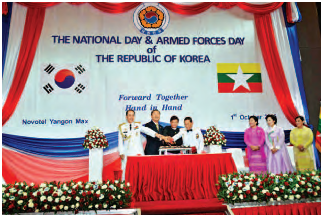
ရန်ကုန် အောက်တိုဘာ ၁

ပြည်ထောင်စုသမ္မတ မြန်မာနိုင်ငံတော် ဒုတိယသမ္မတ ဦးညွှန်ထွန်းနှင့် ဇနီး ဒေါ်ခင်အေးမြင့်တို့သည် ယနေ့ ညပိုင်းတွင် ရန်ကုန်မြို့၊ ပြည်လမ်းရှိ နိုဗိုတယ်ဟိုတယ်တွင် ကိုရီးယားသမ္မတနိုင်ငံ အမျိုးသားနေ့နှင့် တပ်မတော်နေ့အထိမ်းအမှတ်ညွှန်ပွဲသို့ တက်ရောက်ချီးမြှင့်ကြသည်။ အဆိုပါညပွဲသို့ ရန်ကုန်တိုင်းဒေသကြီးဝန်ကြီးချုပ် ဦးမြင့်ဆွေနှင့် ဇနီး၊ ကာကွယ်ရေးဦးစီးချုပ်ရုံး(ကြည်း)မှ ဒုတိယဗိုလ်ချုပ်ကြီးရဲအောင်နှင့် ဇနီး၊ ရန်ကုန်တိုင်းစစ်ဌာနချုပ် တိုင်းမှူးနှင့် ဇနီး၊ နိုင်ငံခြားရေးဝန်ကြီးဌာန ဒုတိယဝန်ကြီး၊ ရန်ကုန်တိုင်းဒေသကြီးဝန်ကြီးများ၊ တပ်မတော်အရာရှိကြီးများ၊ ဌာနဆိုင်ရာအကြီးအကဲများ၊ မြန်မာနိုင်ငံ