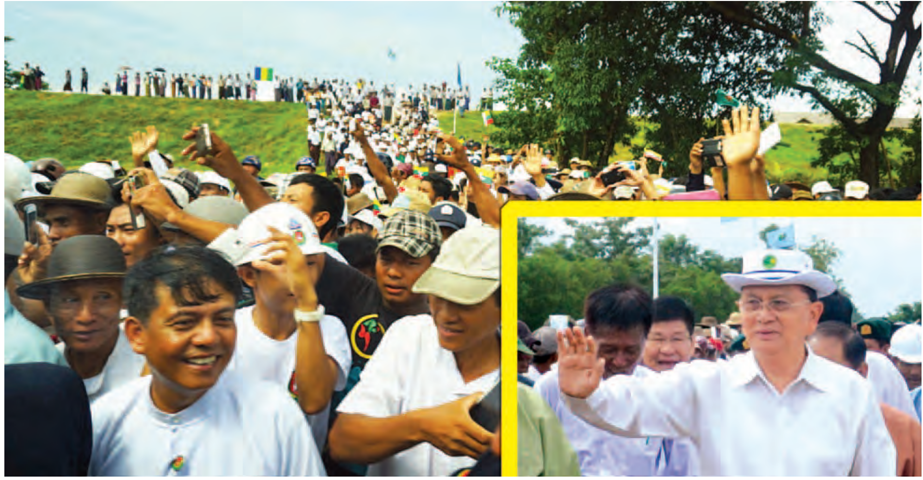
လေးမျက်နှာမြို့နယ် ကညင်သာကျေးရွာအုပ်စု ရွှေဘိုစုကျေးရွာမှ ဒေသခံပြည်သူများက နိုင်ငံတော်သမ္မတ ဦးသိန်းစိန်အား တစ်ခဲနက်ကြိုဆိုနေကြသည်ကို တွေ့ရစဉ်။

နေပြည်တော် အောက်တိုဘာ ၁ ရောဝတီတိုင်းဒေသကြီးတွင်ရောက်ရှိနေသော ပြည်ထောင်စုသမ္မတမြန်မာနိုင်ငံတော် နိုင်ငံတော်သမ္မတ ဦးသိန်းစိန်သည် ပြည်ထောင်စုဝန်ကြီးများ၊ တိုင်းဒေသကြီးဝန်ကြီးချုပ် ဦးသိန်းအောင်၊ ဒုတိယဝန်ကြီးများ၊ တာဝန်ရှိသူများနှင့်အတူ ယနေ့နံနက်ပိုင်းတွင် အင်္ဂပူမြို့မှ မော်တော်ယာဉ်များဖြင့် ထွက်ခွာခဲ့ကြပြီး လေးမျက်နှာမြို့၊ ငါးသိုင်းချောင်းမြို့၊ ရေကြည်မြို့နှင့် ကျုံပျော်မြို့နယ်များရှိ မြို့ရွာများ၏ ဖွံ့ဖြိုးတိုးတက်မှုအခြေအနေများကို ကြည့်ရှုစစ်ဆေးရာ ဒေသခံပြည်သူများ ဌာနဆိုင်ရာများနှင့် ကျောင်းသားကျောင်းသူများက လမ်းဘေးဝဲ၊ ယာတစ်လျှောက်မှ ကြိုဆိုနှုတ်ဆက်ကြသည်။ စာမျက်နှာ ၃ ကော်လံ ၁ သို့ ၂