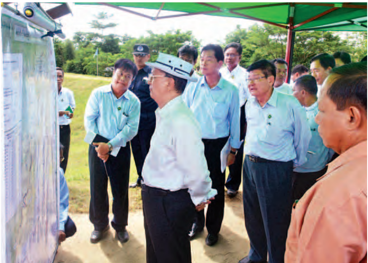
နိုင်ငံတော်သမ္မတ ဦးသိန်းစိန်အား ပုသိမ်ခရိုင် ငါးသိုင်းချောင်းမြို့နယ်ရှိ ငဝန်တာဝန် ကြိုခိုင်မှုနှင့် ရေဝင်ရောက်မှုအခြေအနေများကို တာဝန်ရှိသူများက ရှင်းလင်းတင်ပြစဉ်။

လေးမျက်နှာမြို့နယ်အတွင်း ငဝန်တာဝန်၏ ၃၅ မိုင် ၄ ဖာလုံမှ ၃၆ မိုင် ၆ ဖာလုံအတွင်းရှိ ရွှေဘိုစုနေရာမှာ မြစ်ကမ်းတိုက်စားသည့် အတွက် တာဝန်များ အကြိမ်ကြိမ် နောက်သို့ရွှေ့၍ တည်ဆောက်ခဲ့ရသည်။ ထို့ကြောင့် မြစ်ရေဖြောင့်တန်းစွာ စီးဆင်းနိုင်ရန် သောင်ဘုတ်ရွာအနီးတွင် ဖြစ်မြောင်းငယ်တစ်ခုကို ၂၀၀၁ ခုနှစ်က စတင်တူးဖော်ခဲ့ပြီး ၂၀၀၆ ခုနှစ်နှင့် ၂၀၁၁ ခုနှစ်တို့တွင် ထပ်မံတူးဖော်ခဲ့သည်။ ယခုအခါ ငဝန်မြစ်ရေလွှဲဖြတ်မြောင်းမှာ မူလမြစ်မကဲ့သို့ ရေစီးဆင်းမှုကောင်းမွန်ပြီး ငဝန်တာဝန်(ရွှေဘိုစု) တွင် ကမ်းပြိုတိုက်စားမှုများ သိသာစွာ လျော့ကျသွားကြောင်း တွေ့ရှိရသည်။ ထို့ပြင် လေးမျက်နှာမြို့အတွင်းရှိ ငဝန်တာဝန် ၂၉ မိုင် ၁ ဖာလုံမှ ၃၉