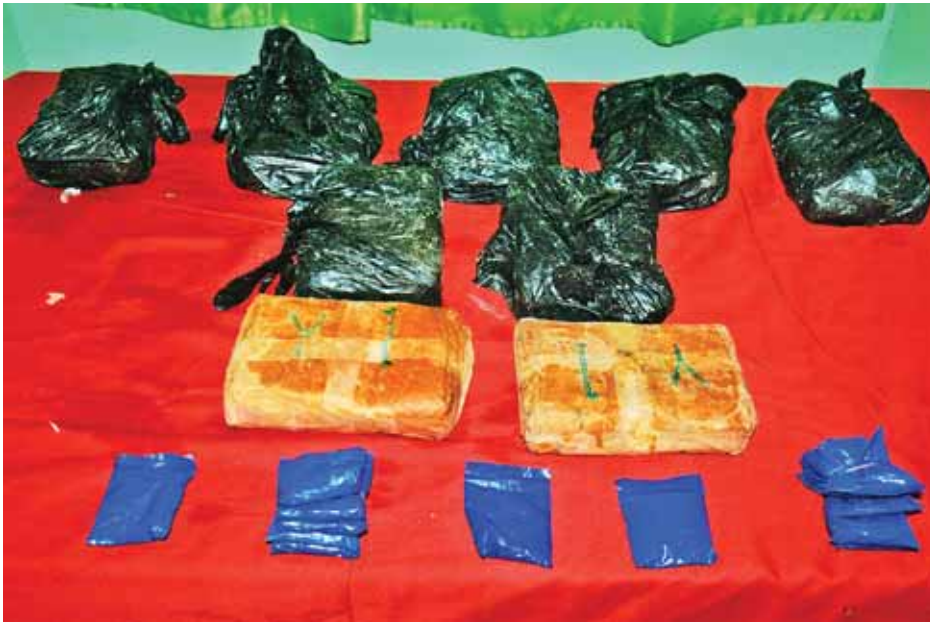
မူးယစ်ဆေးဝါးဥပဒေအရ အမှုဖွင့်ထားပြီး ပြစ်မှုကျူးလွန်သူအား ဖမ်းဆီးရမိရေး ဘုရင့်နောင်နယ်မြေ ခုံရုံးက စုံစမ်းစစ်ဆေးဆောင်ရွက်လျက်ရှိကြောင်း သိရသည်။

ရန်ကုန်တိုင်းဒေသကြီး မရမ်းကုန်းမြို့နယ် သမိုင်း(၁)ရပ်ကွက် မြို့သစ်(၁)လမ်းထိပ် ရိုးကြီးချောင်းအတွင်း စက်တင်ဘာ ၂၇ ရက် မွန်းလွဲ ၂ နာရီက စိတ်ကြွေးသွပ်ဆေးပြားများ ပိုင်ရှင်မဲ့ သိမ်းဆည်းရမိခဲ့သည်။