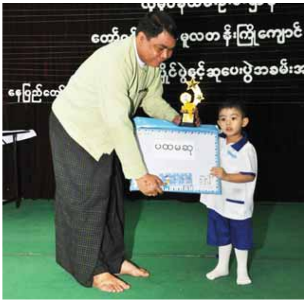
လူမှုဝန်ထမ်း၊ ကယ်ဆယ်ရေးနှင့်ပြန်လည်နေရာချထားရေးဝန်ကြီးဌာန လူမှုဝန်ထမ်းဦးစီးဌာန တော်ဝင်ရတနာပွဲလှူတန်းကြိုကျောင်း နေပြည်တော်၏ ရင်သွေးဝယ်များ ဉာဏစွမ်းရည်ပြိုင်ပွဲနှင့် ဆုပေးပွဲအခမ်းအနားကို စက်တင်ဘာ ၂၂ ရက်တွင် ကျောင်းခန်းမဆောင်၌ ကျင်းပရာ နေပြည်တော်တိုင်း လူမှုဝန်ထမ်းဦးစီးဌာနမှ ညွှန်ကြားရေးမှူးက ဆုရရင်သွေးဝယ်တစ်ဦးအား ဆုချီးမြှင့်စဉ်။ (လူမှုဝန်ထမ်း)

ငါးများနှင့်အတူ သဘာဝအရင်းအမြစ် ထားရှိမည်ဖြစ်သည်။ ထို့အပြင် တောင်သမန်အင်းအတွင်း ရေဆိုးဝင်ရောက်မှု မရှိစေရေးအတွက် မန္တလေးမြို့တော်စည်ပင်သာယာရေးကော်မတီက စီမံဆောင်ရွက်လျက်ရှိသည်။ ငါးသေဆုံးမှု ဖြစ်စဉ်များသည်လည်း သမားရိုးကျသေဆုံးခြင်းမဟုတ်သည့်အတွက် မန္တလေးမြို့တော် စည်ပင်သာယာရေးကော်မတီအနေဖြင့် သက်ဆိုင်ရာဌာနများနှင့်အတူ ပူးပေါင်းကာစစ်ဆေးဖော်ထုတ်အရေးယူနိုင်ရေး စီစဉ်ဆောင်ရွက်လျက်ရှိကြောင်း သိရသည်။ (တင်မောင်(မန္တလေး) ဓာတ်ပုံ-သူရိန်(မန်း))