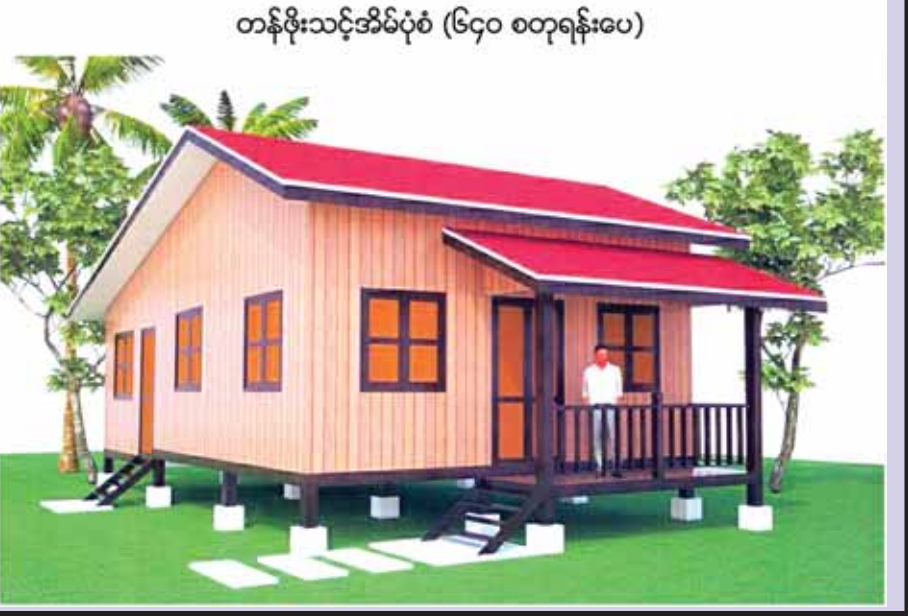
တန်ဖိုးသင့်အိမ်ပုံစံ (၆၄၀ စတုရန်းပေ)