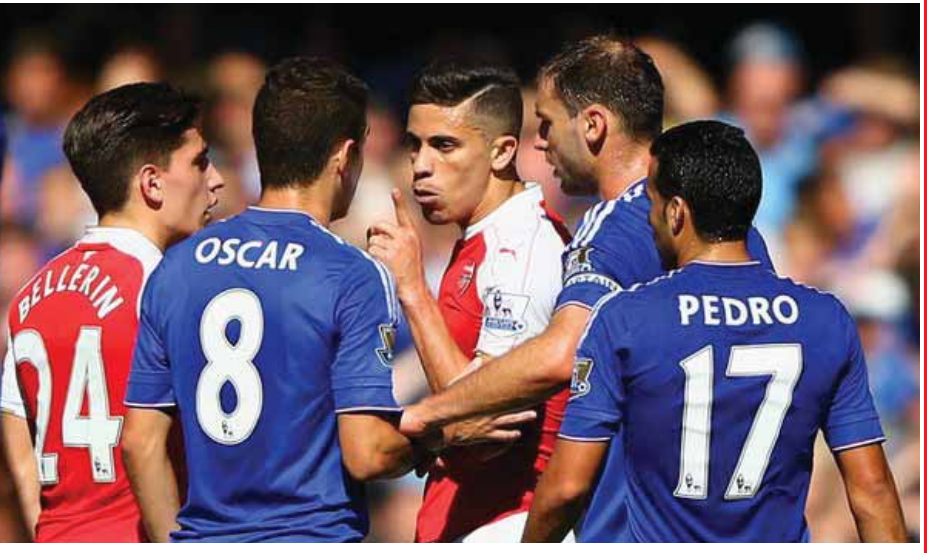
တင်ခဲ့သည်။ သို့ရာတွင် အင်္ဂလန်ဘောလုံးအဖွဲ့ချုပ်က အာဆင်နယ်နောက်တန်းဂန်နားဂရီလ်အား တစ်ပွဲပယ်ပြစ်ဒဏ်နှင့် ပေါင်တစ်သောင်းဒဏ်တပ်ခဲ့ကြောင်းသိရသည်။ (ငွေကြယ်)

အဆိုပါ နောက်တန်းဂန်နားဂရီလ် အနီကတ်ပြထုတ်ပယ်ခြင်းခံခဲ့ရခြင်းကြောင့် အာဆင်နယ်အသင်းက အင်္ဂလန်ဘောလုံးအဖွဲ့ချုပ်သို့ သုံးပွဲပယ်ပြစ်ဒဏ်မကျခံရစေရေးအတွက် လျှောက်လဲချက်