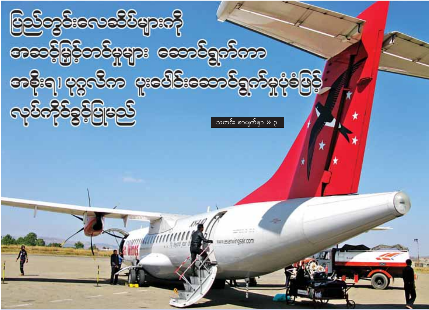
အေးရှားဝင်းလေကြောင်းလိုင်းမှ ပြည်တွင်းသွားလေယာဉ်တစ်စင်းကို ရန်ကုန်အပြည်ပြည်ဆိုင်ရာလေဆိပ်တွင် တွေ့ရစဉ်။