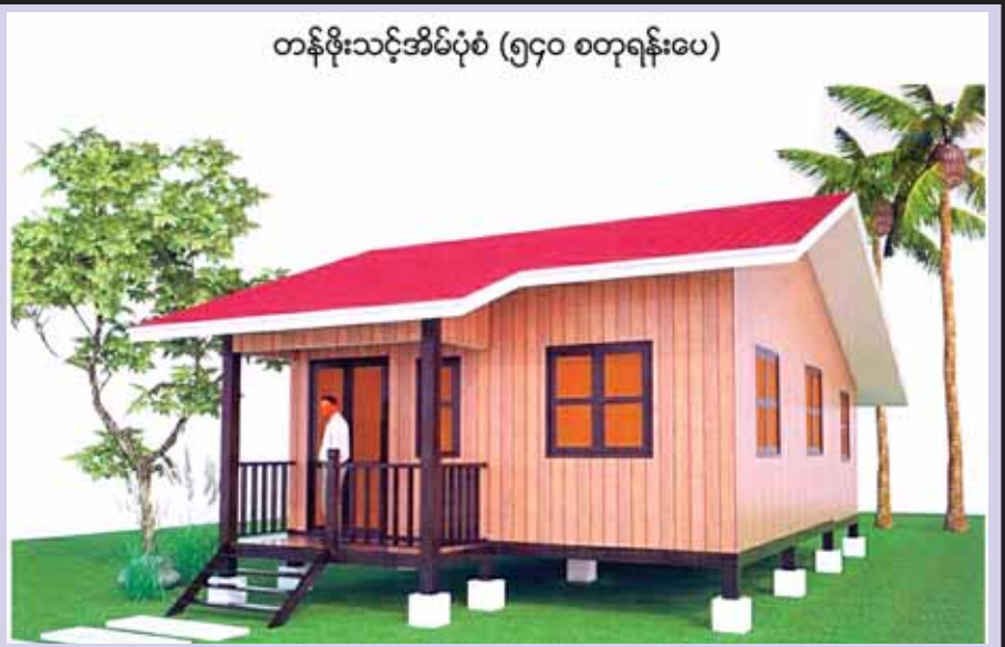
တန်ဖိုးသင့်အိမ်ပုံစံ (၅၄၀ စတုရန်းပေ)

ဇွန်လနှင့်ဇူလိုင်လအတွင်း မိုးသည်းထန်စွာရွာသွန်းမှုကြောင့် ရခိုင်ပြည်နယ်၌ ပျက်စီးခဲ့သော ပေါက်တော-မင်းပြားလမ်းပေါ်ရှိ ငတန်ပြင်းတံတား (၁/၂၀) ပေ ၁၂၀ ပြင်ဆင်ပြီးစီး၍ ယာဉ်များဖြတ်သန်းနေစေပါ။ (ဆောက်လုပ်ရေး)