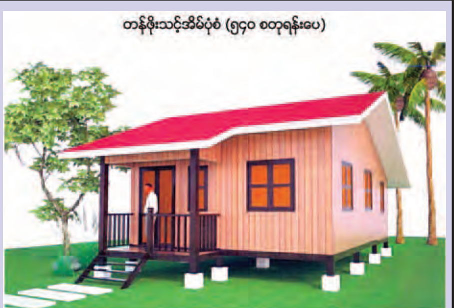
တန်ဖိုးသင့်အိမ်ပုံစံ (၅၄၀ စတုရန်းပေ)

* ရေဘေးသင့်မှ စီမံဆောင်ရွက်နေမှုများအား ကြည့်ရှုအားပေးခဲ့ပါသည်။ ၎င်းမီးစက်များကို ကားများပေါ်မှ ကိုးသိန်းအားစားစားခန်းမထဲသို့ သယ်ချရာတွင် တပ်မတော်သားများ၊ မြန်မာနိုင်ငံရဲတပ်ဖွဲ့၊ မီးသတ်တပ်ဖွဲ့ဝင်များက ပစ္စည်းများ မပျက်စီးစေရန် စနစ်တကျစီစဉ်အတွက် ကူညီဆောင်ရွက်ပေးခဲ့ကြောင်း သိရသည်။ (မောင်မောင်မြင့်)