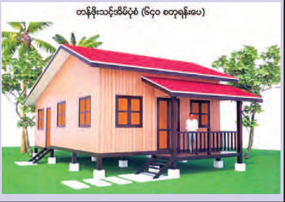
တန်ဖိုးသင့်အိမ်ပုံစံ (၆၄၀ စတုရန်းပေ)