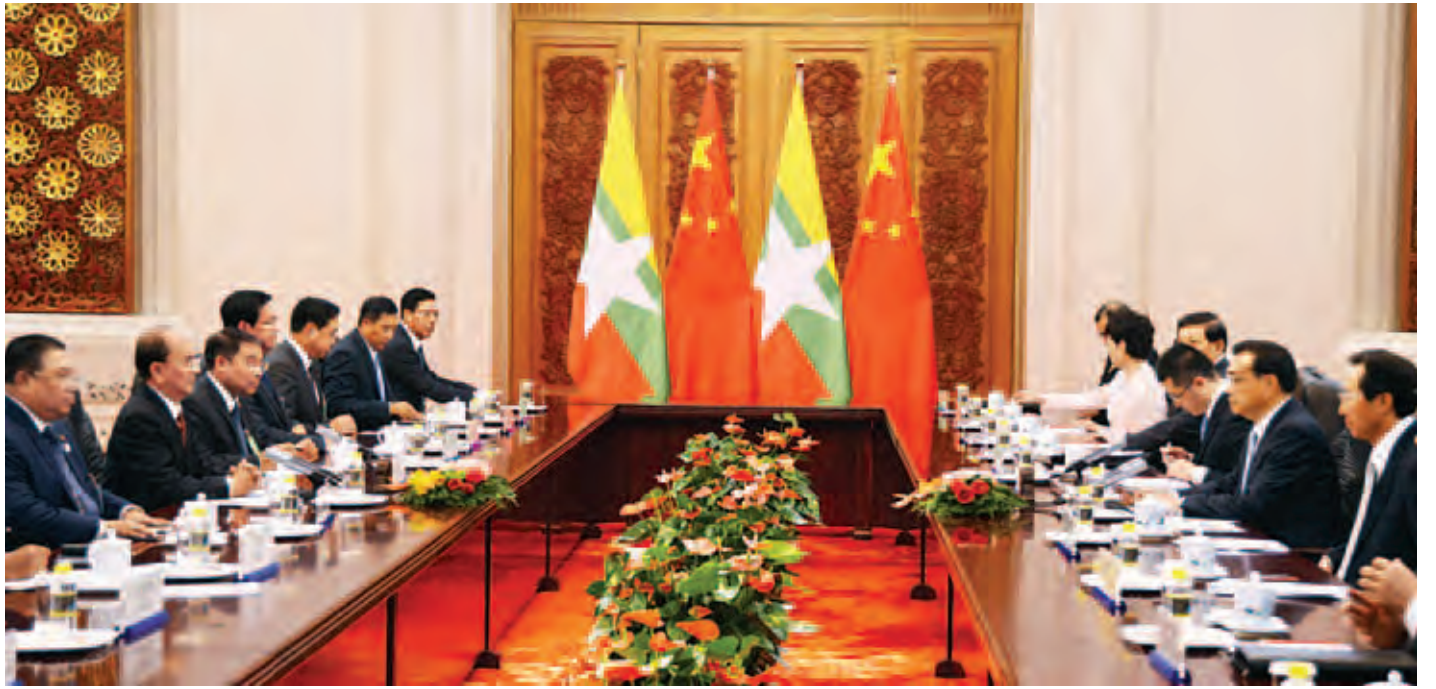
နိုင်ငံတော်သမ္မတ ဦးသိန်းစိန် တရုတ်ပြည်သူ့သမ္မတ နိုင်ငံဝန်ကြီးချုပ် မစ္စတာ လီခချန်းနှင့် တွေ့ဆုံဆွေးနွေး စဉ်။ (သတင်းစဉ်)