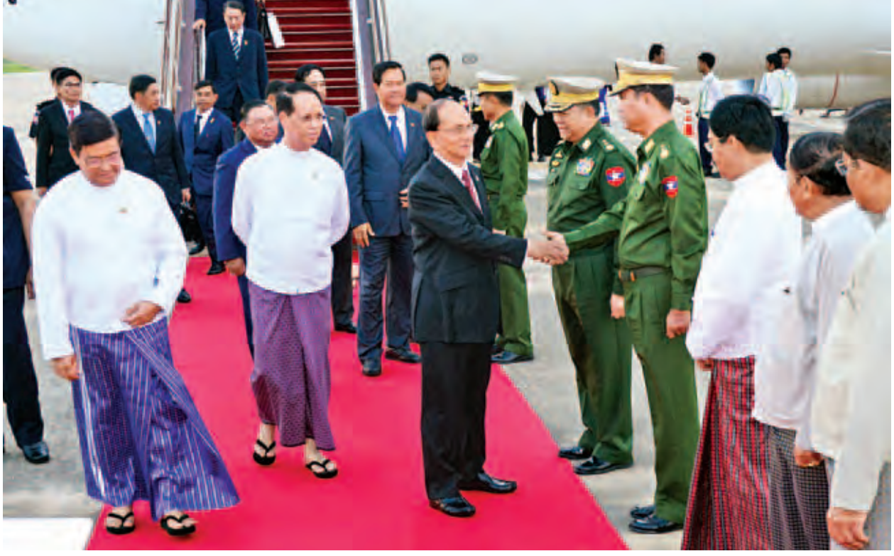
တရုတ်ပြည်သူ့သမ္မတနိုင်ငံ ပေကျင်းမြို့၌ ကျင်းပခဲ့သည့် ကမ္ဘာ့ဖက်ဆစ်စနစ် ဆန့်ကျင်မှုအောင်မြင်သည့် နှစ်(၇၀)ပြည့် နှစ်ပတ်လည်အခမ်းအနားသို့ တရုတ် ပြည်သူ့သမ္မတနိုင်ငံ သမ္မတ မစ္စတာရီကျင့်ဖိုင်၏ ဖိတ်ကြားချက်အရ ပြည်ထောင်စုသမ္မတမြန်မာနိုင်ငံတော် နိုင်ငံတော်သမ္မတ ဦးသိန်းစိန်သည် နိုင်ငံပေါင်း ၄၈ နိုင်ငံမှ နိုင်ငံအကြီးအကဲများ၊ အစိုးရအဖွဲ့အကြီးအကဲများနှင့် အထူးသံတမန်များ၊ နိုင်ငံတကာအဖွဲ့အစည်း ၁၀ ဖွဲ့မှ ခေါင်းဆောင်များနှင့်အတူ တက်ရောက်ခဲ့ခြင်းဖြစ်သည်။ (သတင်းစဉ်)

နိုင်ငံတော်သမ္မတနှင့်အဖွဲ့သည် ညနေ ၅ နာရီ မိနစ် ၅၀ တွင် နေပြည်တော် သို့ ပြန်လည်ရောက်ရှိကြရာ ဒုတိယသမ္မတ ဒေါက်တာစိုင်းမောက်ခမ်းနှင့် ဦးညက်ထွန်း၊ ဒုတိယတပ်မတော်ကာကွယ်ရေးဦးစီးချုပ် ကာကွယ်ရေးဦးစီးချုပ် (ကြည်း)ဒုတိယဗိုလ်ချုပ်မှူးကြီးစိုးဝင်း၊ ပြည်ထောင်စုဝန်ကြီးများနှင့် တာဝန် ရှိသူများက ကြိုဆိုကြသည်။ (အပေါ်ယာပုံ)