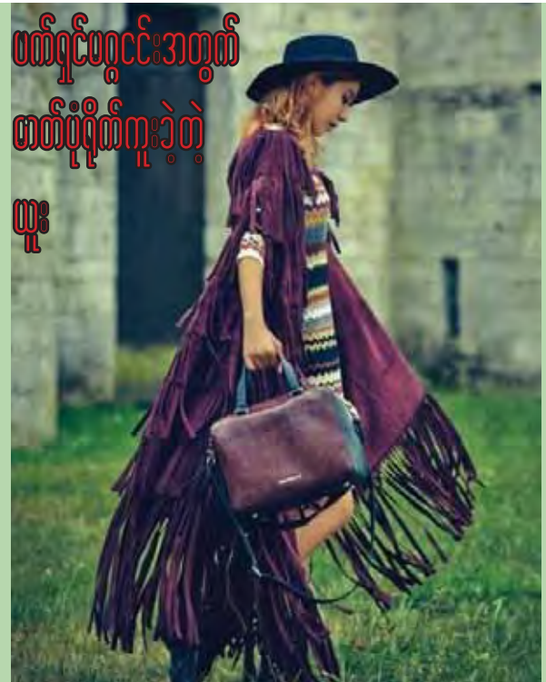
တောင်ကိုရီးယားအမျိုးသမီးပေါင်တေးဂီတအဖွဲ့ After School မှ အဖွဲ့ဝင်ယူးသည် ကမ္ဘာကျော်ဖက်ရှင်မဂ္ဂဇင်းတစ်ချုပ်ဖြစ်သည့် marie claire မဂ္ဂဇင်း၏ စက်တင်ဘာလထုတ်မဂ္ဂဇင်းအတွက် ဓာတ်ပုံများရိုက်ကူးပေးခဲ့သည်။