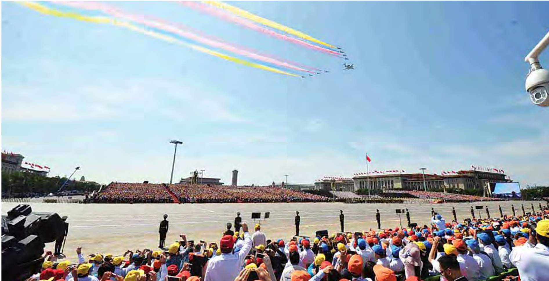
ကမ္ဘာ့ဖက်ဆစ်စနစ်ဆန့်ကျင်မှုအောင်မြင်သည့် နှစ် (၇၀) ပြည့် နှစ်ပတ်လည်အခမ်းအနားကို တရုတ်ပြည်သူ့သမ္မတနိုင်ငံ တီယန်မင် ရင်ပြင်၌ ကျင်းပစဉ်။ (သတင်းစဉ်)