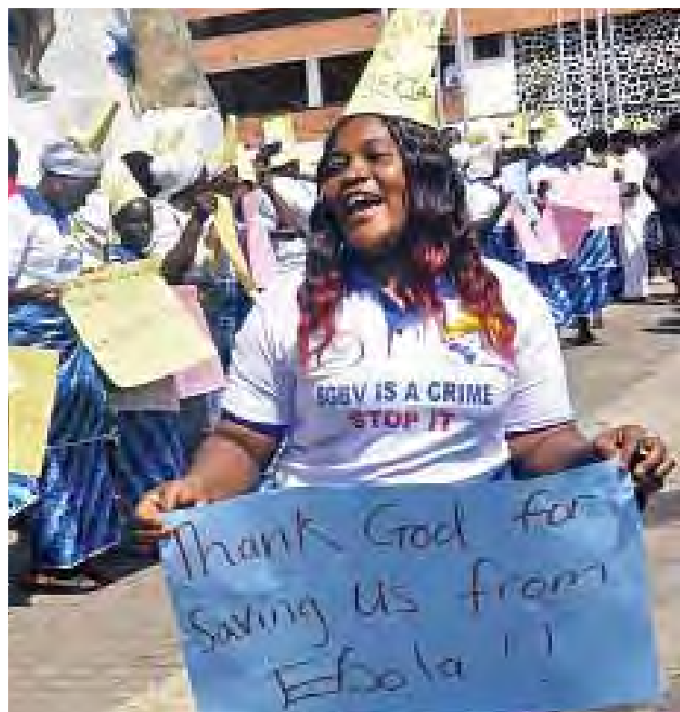
လိုင်ဘေးရီးယားနိုင်ငံတွင် အိဘိုလာဗိုင်းရပ်စ်ကူးစက်မှုမရှိတော့ကြောင်း ကမ္ဘာ့ကျန်းမာရေးအဖွဲ့ကြေညာ

ဆရီနာဂါ စက်တင်ဘာ ၃ အိန္ဒိယတပ်ဖွဲ့နှင့် ပါကစ္စတန်တပ်ဖွဲ့များသည် နှစ်နိုင်ငံစလုံးက ပိုင်ဆိုင်မှုအငြင်းပွားနေသည့် ကက်ရှီမီးယားဒေသ ထိန်းချုပ်ရေး မျဉ်းတစ်လျှောက်တွင် အပြန်အလှန် ပစ်ခတ်တိုက်ခိုက်မှုများ ဖြစ်ပွားခဲ့ကြသည်ဟု တာဝန်ရှိသူများက စက်တင်ဘာ ၃ ရက်တွင် ပြောကြားသည်။ နှစ်နိုင်ငံ တပ်ဖွဲ့များသည် အိန္ဒိယနိုင်ငံက ထိန်းချုပ်ထားသည့် ဆရီနာဂါမြို့ အနောက်တောင်ဘက် ပွန်ချီခရိုင်ခရစ်ရှ်နာ ဂါတီနယ်စပ်တွင် လက်နက်ငယ်များဖြင့် အပြန်အလှန် ပစ်ခတ်ခဲ့ကြသည်။ အဆိုပါအပြန်အလှန်ပစ်ခတ်မှုတွင် အိန္ဒိယနိုင်ငံဘက်၌ ကျွမ်းမှုနှင့် ပျက်စီးဆုံးရှုံးမှုတစ်စုံတစ်ရာမရှိကြောင်း တာဝန်ရှိသူများက ပြောကြားသည်။ အိန္ဒိယနှင့် ပါကစ္စတန်တို့ အကြား လုံခြုံရေးဆွေးနွေးပွဲများသည်လည်း လွန်ခဲ့သည့်လက ပျက်ပြယ်သွားခဲ့သည်။ ဆင်ဟွာ။