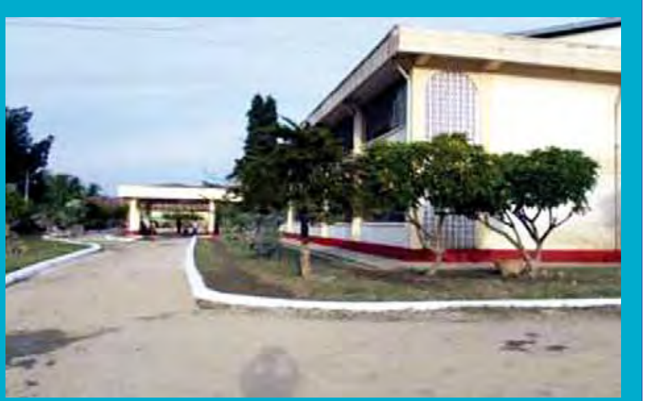
ကလေးမြို့ ပြည်သူ့ဆေးရုံကြီးတွင် ရွှံ့ညွှန်ဖယ်ရှားကာ သန့်ရှင်းရေးလုပ်ငန်းများ ဆောင်ရွက်ပြီးနောက် တွေ့ရစဉ်။ (ဂျိုးနက်)