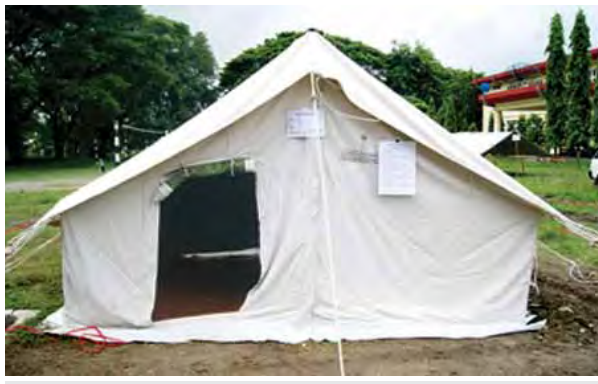
သဘာဝဘေးအန္တရာယ်သင့်ပြည်သူများအတွက် လူဦးရေ လေးဦးမှ ခုနစ်ဦးအထိ နေထိုင်နိုင်သော အလှူပေး ၁၂ ပေ၊ အနံ ၁၀ ပေ၊ အမြင့် ၇ ပေရှိ ယာယီခိုကွယ်ရာ နမူနာထိုးထားသည်ကို တွေ့ရစဉ်။ (ဇိုဟောဆာ)

နေပြည်တော် စက်တင်ဘာ ၃ သဘာဝဘေးအန္တရာယ်ကြုံတွေ့နေရသည့် ရေဘေးသင့်ဒေသရှိ ပြည်သူ များထံသို့ ကယ်ဆယ်ရေးပစ္စည်းများ ထောက်ပံ့ပေးအပ်လျက်ရှိရာ ယနေ့တွင် တောင်ကိုရီးယားသမ္မတနိုင်ငံမှ လှူဒါန်းသည့် Mineral Water(ရေသန့်) စုစုပေါင်း ကုန်တန်ချိန် ၁၉၁၉ Kg အား ကိုရီးယားလေကြောင်းလိုင်းဖြင့် ပို့ဆောင်ခဲ့ရာ ရန်ကုန်အပြည်ပြည်ဆိုင်ရာလေဆိပ်သို့ရောက်ရှိပြီး ရေဘေးသင့် ပြည်သူများထံသို့ ဆက်လက်ပို့ဆောင်ရန်စီစဉ်ဆောင်ရွက်လျက်ရှိကြောင်း သိရသည်။ (သတင်းစဉ်)