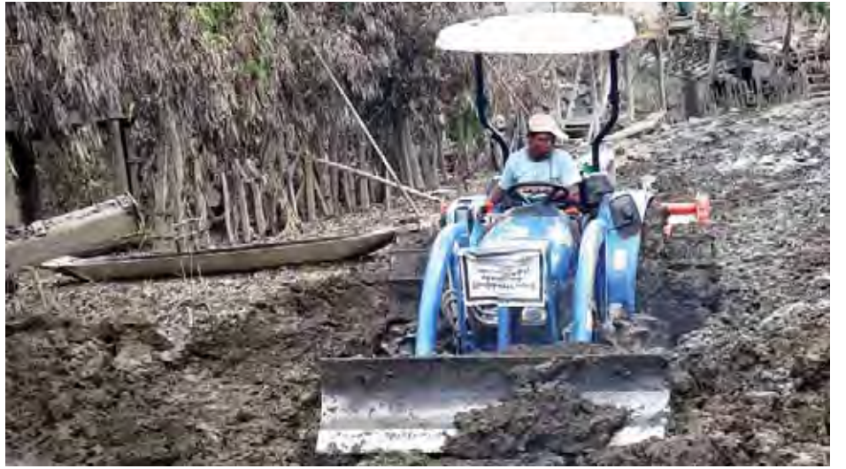
ကလေးမြို့ သမန်းအိုင်ကျေးရွာတွင် နန်းမြေများ ရှင်းလင်းနေစဉ်။

အားဖြင့် တစ်လခန့်ကြာမြင့်မည်ဖြစ်ကြောင်း သိရသည်။ “အေဒင်အုပ်စုက ပြန်လည်ထူထောင်ရေးလုပ်ငန်းတွေမှာ ပါဝင်ချင်ပါတယ်ဆိုပြီး လာပြီးညှိနှိုင်းလို့ လုပ်ချင်တဲ့ အဖွဲ့အစည်းနဲ့သက်ဆိုင်ရာ ဆည်မြောင်းဦးစီး၊ မြို့နယ်စည်ပင်သာယာရေးကော်မတီတို့နဲ့ ပေါင်းစပ်ပြီး ယန္တရားတွေခွဲပြီးတော့ စီမံခန့်ခွဲပြီးပြန်လုပ်ပေးပါတယ်။ အဲဒီထဲမှာ သမန်းအိုင်ကတော့ အခုထိနန်းတွေရှင်းဖို့ခက်နေလို့ ရွာသူရွာသားတွေပြန်ဖို့ခက်နေတဲ့အတွက် အဲဒီရွာကို အဓိကထား လုပ်ဆောင်နေပါတယ်။ ဒီရွာကိုတော့ မြို့နယ်စည်ပင်နဲ့ အေဒင်အုပ်စုတို့က လုပ်ဆောင်နေတာပါ”ဟု မြို့နယ်