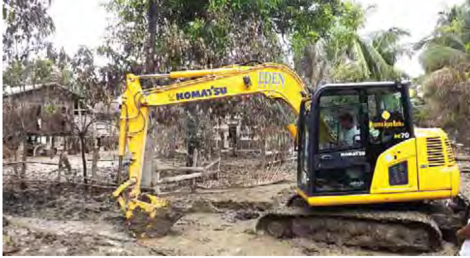
ကလေးမြို့ သမန်းအိုင်ကျေးရွာတွင် နန်းမြေများ ရှင်းလင်းနေစဉ်။

သွားလို့လာ လို့မရဘူး။ အခု အိမ်ပြန်လို့ရှိရင် ရေက ဆေးစရာမရှိ။ ညွှန်ကျန်ရင်တောင်မှ ခြေထောက်ပါနဲ့ပြီး ထုတ်ရတာ။ အိမ်ပေါ်မှာလည်း ရွှံ့တွေနဲ့လေ။ သွားလို့လာလို့ရရင် အိမ်ပြန်မယ်။ ကိုယ့်အိမ်ကိုယ်ရာမှာ အမြန်ပြန်နေချင်တယ်”ဟု ပြောသည်။