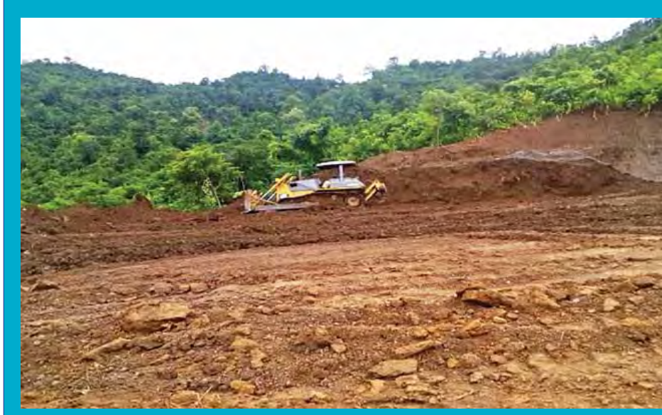
ကလေးမြို့ အေးသာယာရွာ ရွာသစ်ဖော်ထုတ်ရန်အတွက် မြေနေရာရှင်းလင်းခြင်းလုပ်ငန်းများ ဆောင်ရွက်နေစဉ်။ (ဂျိုးနက်)

နေရာချထားပေးလျက်ရှိကြောင်း သိရသည်။ အဆိုပါ မြစ်ရေဝင်ရောက်မှုကြောင့် လူ၊ တိရစ္ဆာန်၊ ပစ္စည်းများ ဆုံးရှုံးမှုမရှိကြောင်း သိရသည်။ ကူညီကယ်ဆယ်ရွှေ့ပြောင်းရေးလုပ်ငန်းများကို တာဝန်ရှိသူများက အချိန်နှင့်တစ်ပြေးညီ ဆောင်ရွက်ပေးလျက်ရှိကြောင်း သိရသည်။ (ခရိုင်ပြန်/ဆက်)