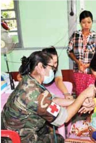
ကျေးဇူးတင်စကား ပြန်လည်ပြောကြားသည်။ ဆက်လက်၍ ၂၀၁၅ ခုနှစ် ဇွန်လမှ

လေယာဉ်ဖြင့် ရောက်ရှိလာခဲ့သည်။ ထိုင်းဘုရင့် တပ်မတော်ဆေးအဖွဲ့သည် ဩဂုတ် ၂၈ ရက်တွင် လေ့နံမြို့နယ် ဒေါင့်ကြီးကျေးရွာနှင့် ဟင်္သာတမြို့နယ် ဓမ္မိတိုက်နယ်တို့၌လည်း ကောင်း၊ ဩဂုတ် ၂၉ ရက်တွင် အင်္ဂပူမြို့နယ်ရှိ ထန်းပင်ကုန်းကျေးရွာနှင့် ကွင်းကောက်ကျေးရွာတို့တွင်လည်းကောင်း၊ ဩဂုတ် ၃၀ ရက်တွင် အင်္ဂပူမြို့နယ်ရှိ ထူးကြီးမြို့နှင့် မဲလီကုန်းကျေးရွာတို့၌ လည်းကောင်း၊ ဩဂုတ် ၃၁ ရက်တွင် မြန်အောင်မြို့နယ်ရှိ ကောင်းမြတ်တော ကျေးရွာနှင့် သာခွကျေးရွာတို့၌ လည်းကောင်း၊ စက်တင်ဘာ ၁ ရက်တွင် လေးမျက်နှာမြို့နယ်ရှိ အိုင်သပြေကျေးရွာတွင်လည်းကောင်း၊ စက်တင်ဘာ ၂ ရက်တွင် ကြိုင်ခင်းမြို့နယ် အောင်မြင်တိုင်းကျေးရွာ၌လည်းကောင်း ဆေးကုသမှုပေးခဲ့ပြီး မြို့ပေါ်ရပ်ကွက်များ၊ ကျေးရွာများနှင့် စာသင်ကျောင်းများတွင် သွေးလွန်တုပ်ကွေးကာကွယ်နှိမ်နင်းရေးလုပ်ငန်းအဖြစ် ခြင်ဆေးမှုတိုင်းလုပ်ငန်း ဆောင်ရွက်ခြင်း၊