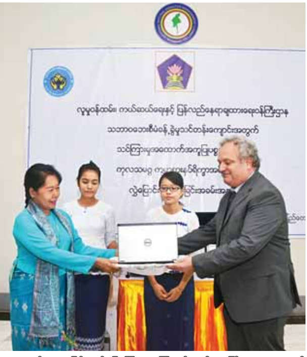
ကျေးဇူးတင်စကား ပြန်လည်ပြောကြားသည်။ ဆက်လက်၍ ၂၀၁၅ ခုနှစ် ဇွန်လမှ

နေပြည်တော် စက်တင်ဘာ ၂ လူမှုဝန်ထမ်း၊ ကယ်ဆယ်ရေးနှင့် ပြန်လည်နေရာချထားရေးဝန်ကြီးဌာန သဘာဝဘေးအန္တရာယ် စီမံခန့်ခွဲမှုဆိုင်ရာဘုန်းတော်ကြီး (Disaster Management Training Center) နှင့် အရေးပေါ်အခြေအနေ စီမံခန့်ခွဲမှု ဗဟိုဌာန (Emergency Operation Centre EOC)တို့အတွက် World Food Programme (WFP)မှ သင်ထောက်ကူပစ္စည်းများ လွှဲပြောင်းပေးအပ်ခြင်း အခမ်းအနားကို စက်တင်ဘာ ၂ ရက် နံနက် ၁၀ နာရီတွင် အဆိုပါဝန်ကြီးရုံး၌ ကျင်းပရာ ရှေးဦးစွာ ကမ္ဘာ့စားနပ်ရိက္ခာ အစီအစဉ်မှ Country Director Mr.Domenico SCAIPEW က ရှင်းလင်းပြောကြားပြီး အမေရိကန် ဒေါ်လာ ၁ ဒသမ ၉၁၁ သိန်းခန့် တန်ဖိုးရှိသော သင်ထောက်ကူပစ္စည်းများ လွှဲပြောင်းပေးအပ်ရာ ပြည်ထောင်စုဝန်ကြီး ဒေါက်တာ ဒေါ်မြတ်မြတ်အုန်းခင်က လက်ခံ၍