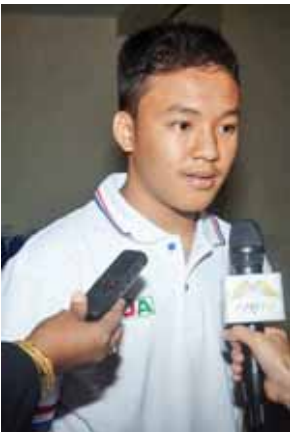
မောင်ခွန်ဇင်ကိုနိုင်။