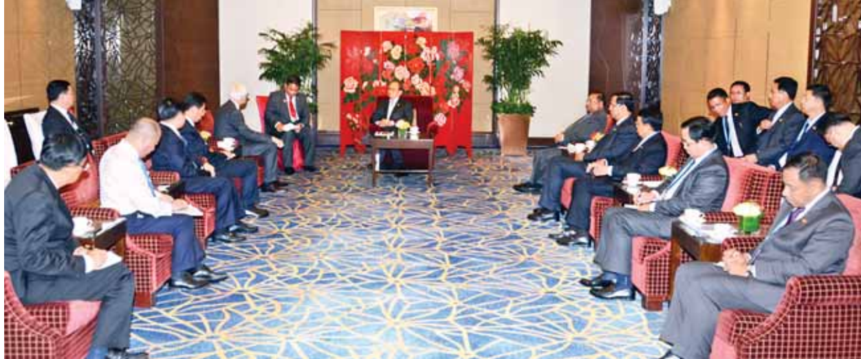
နိုင်ငံတော်သမ္မတ ဦးသိန်းစိန် တရုတ်-မြန်မာချစ်ကြည်ရေးအသင်းဥက္ကဋ္ဌ Mr. GEN ZHI YUAN နှင့် တွေ့ဆုံစဉ်။ (ပြန်/ဆက်)