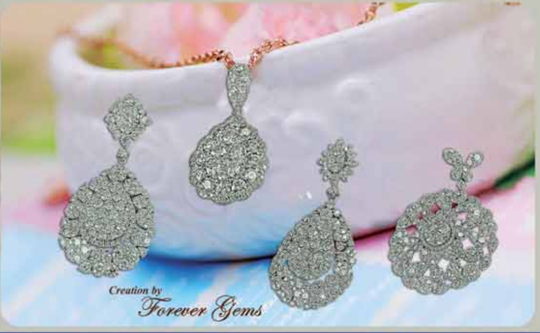
Creation by Forever Gems