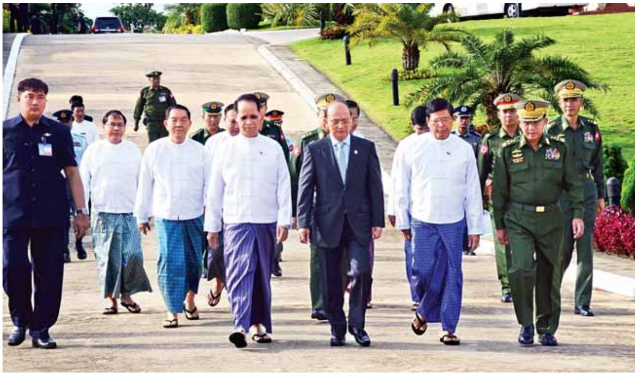
နိုင်ငံတော်သမ္မတ ဦးသိန်းစိန်အား ဒုတိယသမ္မတ ဒေါက်တာစိုင်းမောက်ခမ်း၊ ဦးညွှန်ထွန်းနှင့် တပ်မတော်ကာကွယ်ရေးဦးစီးချုပ် ဗိုလ်ချုပ်မှူးကြီး မင်းအောင်လှိုင်တို့က နေပြည်တော်အပြည်ပြည်ဆိုင်ရာလေဆိပ်၌ ပို့ဆောင်နှုတ်ဆက်ကြစဉ်။ (ပြန်/ဆက်)

ခန္တီး၊ ဟုမ္မလင်းနှင့် ငါးသိုင်းချောင်းမြို့တို့ စိုးရိမ်ရေမှတ်အထက် ဆက်လက်တည်ရှိ နေပြည်တော် စက်တင်ဘာ ၂ ယနေ့မုန်းလွဲ ၁၂ နာရီခွဲအချိန် တိုင်းထွာချက်များအရ ချင်းတွင်း မြစ်ရေသည် ခန္တီးမြို့တွင် လေးပေခန့်နှင့် ဟုမ္မလင်းမြို့တွင် နှစ်ပေခန့် ယင်းမြို့များ၏ စိုးရိမ်ရေမှတ်အထက်သို့ ကျော်လွန်နေပြီး နောက်တစ်ရက် အတွင်း ခန္တီးမြို့တွင် တစ်ပေခွဲခန့်နှင့် နောက်နှစ်ရက်အတွင်း ဟုမ္မလင်းမြို့ တွင် သုံးပေခန့် ဆက်လက်တက်လာနိုင်ပြီး ယင်းမြို့တို့၏ စိုးရိမ်ရေမှတ် အထက် ဆက်လက်တည်ရှိနိုင်သည်။ ယနေ့မုန်းလွဲ ၁၂ နာရီခွဲအချိန် တိုင်းထွာချက်အရ ငဝန်မြစ်ရေသည် ငါးသိုင်းချောင်းမြို့တွင် ပေဝက်ခန့် ယင်းမြို့၏ စိုးရိမ်ရေမှတ်အထက်သို့ ကျော်လွန်နေသည်။ နောက်နှစ်ရက်အတွင်း သုံးလက်မခန့် ဆက်လက် တက်လာနိုင်ပြီး ယင်းမြို့၏ စိုးရိမ်ရေမှတ်အထက် ဆက်လက်တည်ရှိနိုင် သည်။ ခန္တီးမြို့နယ်၊ ဟုမ္မလင်းမြို့နယ်တို့အတွင်းနှင့် ငဝန်မြစ်တစ်လျှောက်ရှိ မြစ်ကမ်းအနီးနှင့် မြေနိမ့်ပိုင်း နေထိုင်သူများအနေဖြင့် အထူးသတိပြု နေထိုင်ကြပါရန် အကြံပြုထားကြောင်း သိရသည်။ (ကြေးမုံ)