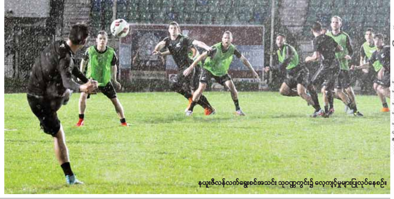
နယူးဇီလန်လက်ရွေးစင်အသင်း သုဝဏ္ဏကွင်း၌ လေ့ကျင့်မှုများပြုလုပ်နေစဉ်။

ရန်ကုန် စက်တင်ဘာ ၂ ၂၀၁၈ ကမ္ဘာ့ဖလားခြေစစ်ပွဲ ယှဉ်ပြိုင်လျက်ရှိသည့် မြန်မာ့လက်ရွေးစင် အသင်းနှင့် နယူးဇီလန်လက်ရွေးစင်အသင်းတို့၏ ခြေစမ်းပွဲကို စက်တင်ဘာ ၇ ရက်တွင် သုဝဏ္ဏကွင်း၌ ကျင်းပမည်ဖြစ်ပြီး နယူးဇီလန်အသင်းမှာ ရန်ကုန်မြို့ ၌ တစ်ပတ်ကြိုတင်လေ့ကျင့်လျက်ရှိသည်။ မြန်မာအသင်းနှင့် ခြေစမ်းမည့် နယူးဇီလန်အသင်းမှာ သမုဒ္ဒရာပိုင်းဇုန် မှအသင်းဖြစ်ပြီး ယခင်က သမုဒ္ဒရာပိုင်းဇုန်ကို ကြီးစိုးထားသည့် ဩစတြေးလျ အသင်း အာရှဇုန်သို့ ကူးပြောင်းသွားခြင်းနှင့်အတူ နာမည်ထွက်လာသည့် အသင်းဖြစ်သည်။ ကမ္ဘာ့ဖလားပြိုင်ပွဲကို ၁၉၈၂ ခုနှစ်၌ စတင်ယှဉ်ပြိုင်ဖူး သော်လည်း ၂၀၁၀ ခုနှစ်ကျမှ ဒုတိယအကြိမ် ယှဉ်ပြိုင်နိုင်ခဲ့ကာ ၂၀၁၅ ယူ-၂၀ ကမ္ဘာ့ဖလားပြိုင်ပွဲကို စာမျက်နှာ ၁၀ ကော်လံ ၁ သို့