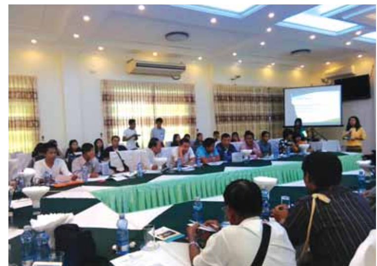
လက်ကြည့် Internews Human Rights Reporting မှ တာဝန်ရှိသူများ၊ မီဒီယာများ၊ အရပ်ဘက်လူမှုအဖွဲ့အစည်းများ တက်ရောက်ကြပြီး အပြန်အလှန်ဝိုင်းဝန်းအကြံပြု ဆွေး

ရေး စက်တင်ဘာ ၂ မွန်ပြည်နယ် မော်လမြိုင်မြို့ ရွှေမြင့်ခိုင်ရိက္ခန်းတိုက်၌ လူ့အခွင့်အရေးဆိုင်ရာ သတင်းတင်ပြချက်များ တိုးတက်ကောင်းမွန်စေရေး မီဒီယာနှင့်အရပ်ဘက် လူမှုအဖွဲ့အစည်းများ တွေ့ဆုံ ဆွေးနွေးပွဲကို Internews Human Rights Reporting မှစီစဉ်ဆောင်ရွက်မှုဖြင့် ဩဂုတ် ၃၁ ရက် မွန်းလွဲ ၁ နာရီက ကျင်းပခဲ့ကြောင်းသိရသည်။