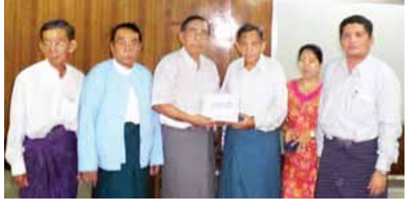
သတင်းနှင့်စာနယ်ဇင်းဝန်ထမ်းဟောင်းများအသင်းအစည်းအဝေးကျင်းပ

သော အထွေထွေအုပ်ချုပ်ရေးဦးစီးဌာန၊ ပြည်နယ်လယ်ယာမြေစီမံခန့်ခွဲရေးနှင့် စာရင်းအင်းဦးစီးဌာန၊ ပြည်နယ်စည်ပင်သာယာရေး၊ ပြည်တွင်းအခွန်များဦးစီးဌာန၊ ပြည်နယ်လူဝင်မှုကြီးကြပ်ရေးနှင့် အမျိုးသားမှတ်ပုံတင်ရေးဦးစီးဌာန၊ လျှပ်စစ်ဓာတ်အားပို့လွှတ်ရေးနှင့် ကွပ်ကဲရေးဦးစီးဌာန၊ လူမှုဖူလုံရေး၊ ပြန်လည်နေရာချထားရေးဦးစီးဌာန စသည်တို့ဖြင့် ဖွင့်လှစ်ထားသည်။