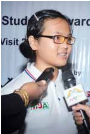
မပန်ရွှေအိယာနား။