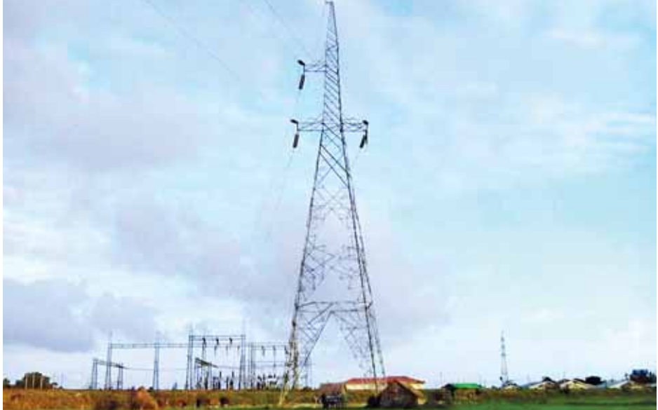
၂၃၀ ကေပီ အမ်း-မြောက်ဦး-ပုဏ္ဏားကျွန်း ဓာတ်အားလှိုင်း တာဝါတိုင်အမှတ် (MP 96) တာဝါတိုင်အသစ် ပြန်လည်စိုက်ထူခြင်းလုပ်ငန်းနှင့် ချိတ်ဆက်ကြိုးဆွဲခြင်းလုပ်ငန်း ဆောင်ရွက်ပြီးစီးမှုကို တွေ့ရစဉ်။ (သတင်းစဉ်)

၆၀ တန်ဖိုးရှိ Aquatabs ဆေးပြား ၅၀၀၀၀ စသည်တို့ကို လာရောက်လှူဒါန်းရာ အမျိုးသားသဘာဝဘေးအန္တရာယ်ဆိုင်ရာစီမံခန့်ခွဲမှုလုပ်ငန်းကော်မတီဥက္ကဋ္ဌ လူမှုဝန်ထမ်း၊ ကယ်ဆယ်ရေးနှင့် ပြန်လည်နေရာချထားရေးဝန်ကြီးဌာန ပြည်ထောင်စုဝန်ကြီး ဒေါက်တာဒေါ်မြတ်မြတ်အုန်းခင်နှင့် အမျိုးသားသဘာဝဘေးအန္တရာယ်ဆိုင်ရာ စီမံခန့်ခွဲမှုကော်မတီ အတွင်းရေးမှူး ဒုတိယဝန်ကြီး ဦးဘုန်းဆွေ တို့ကလက်ခံရယူကာ ကျေးဇူးတင်စကားပြန်လည်ပြောကြားပြီး ဂုဏ်ပြုမှတ်တမ်းလွှာများ ပြန်လည်ပေးအပ်သည်။ သို့ဖြစ်၍ ဇူလိုင် ၂၉ ရက်မှ စက်တင်ဘာ ၂ ရက်အထိ အလှူရရှိငွေစုစုပေါင်းမှာ ငွေကျပ် ၂၇၆၀၂၅၄၀၊ အမေရိကန်ဒေါ်လာ ၁၂၅၉၀၈၂ ဒသမ ၂၆၊ ထိုင်းဘတ် ၁၆၈၀၅၅၊ မလေးရှားရင်းဂစ် ၂၀၀၀၊ တရုတ်ယွမ် ၁၃၆၀၀၊ ယူရို ၄၂၀၊ ဂျပန်ယန်း ၂၉၆၀၀၀၊ ဩစတြေးလျဒေါ်လာ ၅၇၀၊ စင်ကာပူဒေါ်လာ ၁၀၀၀ ဖြစ်ပြီး အဆိုပါ လက်ခံရရှိသော အလှူငွေနှင့် ပစ္စည်းများကို ရေဘေးသင့်ပြည်သူများသို့ ထောက်ပံ့လျက်ရှိကြောင်း သတင်းရရှိသည်။ (သတင်းစဉ်)