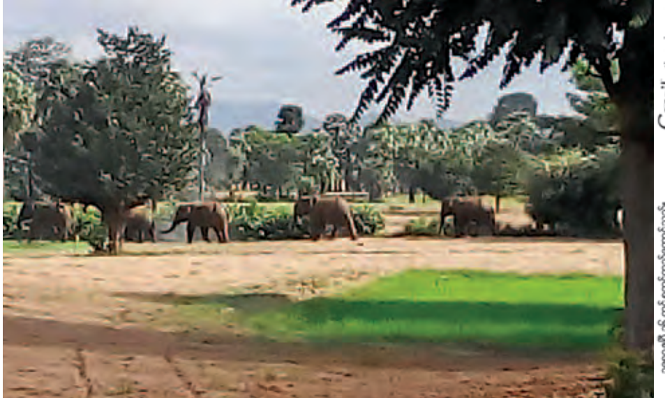
ကျောက်ပန်းတောင်းမြို့နယ်အတွင်းရှိ လွန်ပင်ကုန်းရွာအနီး လျှိုတစ်ခုအတွင်းရောက်ရှိနေသော တောဆင်ရိုင်း များကို ဩဂုတ် ၂၇ ရက် ညနေပိုင်းက တွေ့ရစဉ်။

ယခုအခါတွင် ယင်းဆင်ရိုင်းအုပ်စုကို ရိုးမတောသို့ ပြန်လည်ထိန်းကျောင်း မောင်းနှင်ပို့ဆောင်နိုင်ရန် သက်ဆိုင်ရာ တာဝန်ရှိအဖွဲ့အစည်းများနှင့်အတူ ပဲခူး တိုင်းဒေသကြီး သာယာဝတီခရိုင်မှ ဆင်ယဉ်များ ရောက်ရှိ လာပြီး ယနေ့ညနေပိုင်းမှစ၍ ထိန်းကျောင်းမောင်းနှင်နေ ပြီဖြစ်ကြောင်း ဆင်ယဉ်များသယ်ဆောင်လာသူများက ဆင်အုပ်၏ စာမျက်နှာ ၁၃ ကော်လံ ၁ သို့ ❖