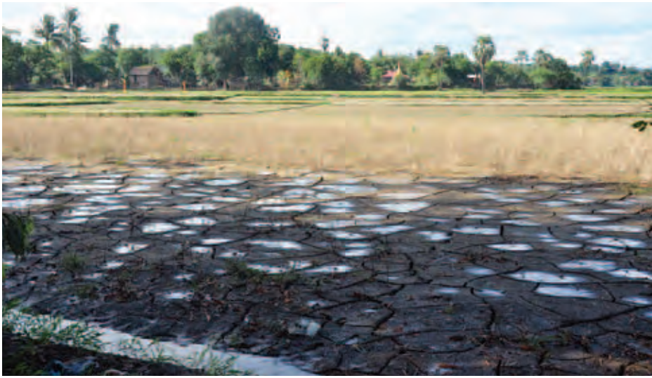
စေတုတ္တရာမြို့အဝင်လမ်းဘေးရှိ မရိတ်သိမ်းရသေးသည့် နှမ်းခင်းများ၏ ရေလွှမ်းပြီးနောက် အခြေအနေ။

ရွာသားများပြောပြချက်အရ ရေလျှံမှုကြောင့် ရွာသို့ ရောက်ရှိနိုင်သည့် လှည်းလမ်းများနှင့် မုန်းချောင်းကို အမှီပြုစိုက်ပျိုးထားသည့် စပါးခင်းများ ပျက်စီးသွားခဲ့ကြောင်း၊ ပင်းချောင်း ကျေးရွာအတွက် လက်ရှိတွင်အခက်ခဲဆုံးပြဿနာမှာ ဆန်ရရှိရန်ပင် ဖြစ်ကြောင်း သိရသည်။ “အခက်ခဲဆုံးကတော့ စားဖို့ ဆန်က အခက်ခဲဆုံးပါ။ ဩဂုတ် ၂၂ ရက်က ဆန်အိတ် ၂၆ အိတ်ပဲရသေးတယ်။ ဒါပထမဆုံးရတဲ့ အလှူပါ” ဟု ပင်းချောင်းရွာ၏ရာအိမ်မှူးက ပြောသည်။ ပင်းချောင်း ကျေးရွာသည် စေတုတ္တရာမြို့နယ်တွင် ပါဝင်ပြီး မြို့နှင့် မိုင်သုံးဆယ်ကွာဝေးပြီး ဆောမြို့အစပ်တွင် တည်ရှိသည်။ လူဦးရေ ၁၇၄ ဦးနှင့် အိမ်ခြေ ၃၈ အိမ်ရှိသည်။ ဇူလိုင်လနှင့် ဩဂုတ်လတွင် ဖြစ်ပွားခဲ့သည့် စေတုတ္တရာ ရေကြီးမှုတွင် ပင်းချောင်းရွာသည် ရေနစ်မြုပ်ခဲ့ခြင်း မရှိပေ။ ဖုန်းလှိုင်းမရှိသည့် ပင်းချောင်းရွာသည် နေရာသီတွင် လှည်းလမ်းဖြင့်သာ သွားလာနိုင်သည်။ ယခင်က ပင်းချောင်းသည် ဆန်ကို ဆောမြို့သို့ သွားရောက်ဝယ်ယူသော်လည်း မုန်းချောင်းရေလျှံမှုကြောင့် လမ်းများပျက်စီးကုန်သည်။ စေတုတ္တရာသို့ သွားရောက်ရန်လည်း ကားလမ်းပေါက်သည့် နေရာအထိ ရှစ်မိုင်ကျော် လမ်းလျှောက်ရသည်။ စေတုတ္တရာမှ ပင်းချောင်းတည်ရှိရာ အနီးစပ်ဆုံး ကားလမ်းသို့ ကုန်ကားငှားခမှာ တစ်သိန်းနှစ်သောင်းကျပ်ကျသည်။ သယ်ယူစရိတ် ကြီးမြင့်သဖြင့် အလှူရရှိသည့် ဆန်အိတ်များကို ကုန်ကားတစ်စီးတိုက် ပစ္စည်းရရှိမှသာ ရွာသို့သယ်နိုင်မည်ဖြစ်သည်။ ကားလမ်းမပေါက်သည့် ရှစ်မိုင်ခရီးအတွက် အလှူရသည့်ဆန်ကို ရွာသားများက တစ်အိမ်တစ်ယောက်နှုန်းကျ လူထမ်းဖြင့် လမ်းလျှောက်သယ်ကြရမည်ဟု ရာအိမ်မှူးက ပြောပြသည်။ “ကားငှားခရဖို့ ရွာကလူတွေဆီက စေတနာရှိသလောက် အလှူထည့်