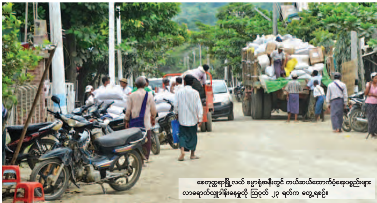
စေတုတ္ထရာမြို့လယ် မြွေရုံအနီးတွင် ကယ်ဆယ်ထောက်ပံ့ရေးပစ္စည်းများ လာရောက်လျှောက်ခံနေမှုကို ဩဂုတ် ၂၃ ရက်က တွေ့ရစဉ်။

ဆောင်းပါး - မြတ်သန္တာမောင်၊ တက်ပုံ - အယ်လေး