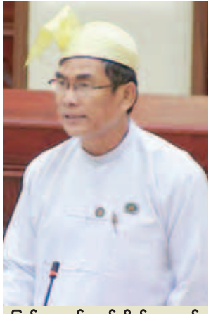
ပြည်သူ့လွှတ်တော်ကိုယ်စားလှယ် ဦးသိန်းထွန်း။

ပြည်သူ့လွှတ်တော် ပုံမှန်အစည်းအဝေး အောင်မြင်စွာ ကျင်းပပြီးစီးကြောင်း ကြေညာသည်။ ပထမအကြိမ် ပြည်သူ့လွှတ်တော် (၁၂)ကြိမ်မြောက် ပုံမှန်အစည်းအဝေးကို (၈၉)ကြိမ် ကျင်းပခဲ့ရာ