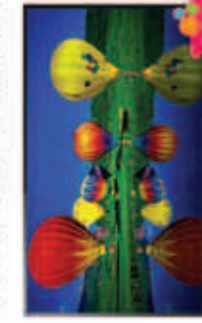
40R550C / 40R552C