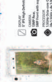
XPERIA™ M4 Aqua