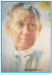
တက္ကသိုလ်ဘုန်းနိုင်