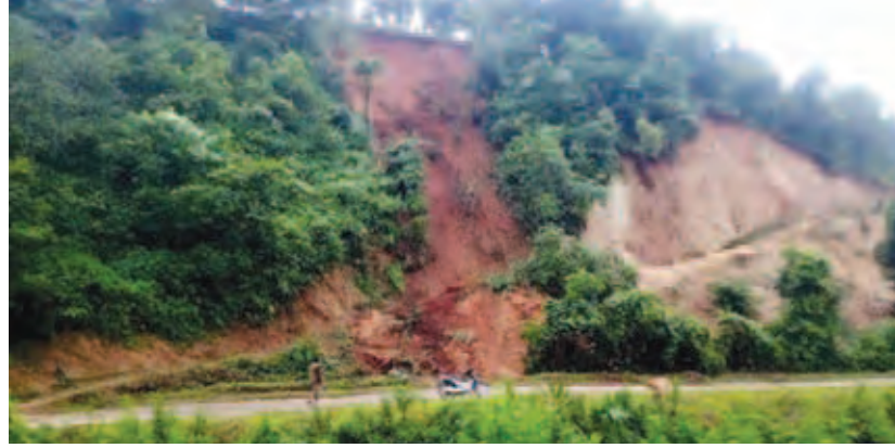
ကူညီကယ်ဆယ်ရေးကော်မတီဝင်များ၊ လူမှုရေးအသင်းအဖွဲ့များစုပေါင်း၍ ပြည်သူများနှင့်အတူ ကယ်ဆယ်ရှင်းလင်းရေးလုပ်ငန်းများ ဆောင်ရွက်နေသည်။ မိုးကုတ်(ပြန်/ဆက်)