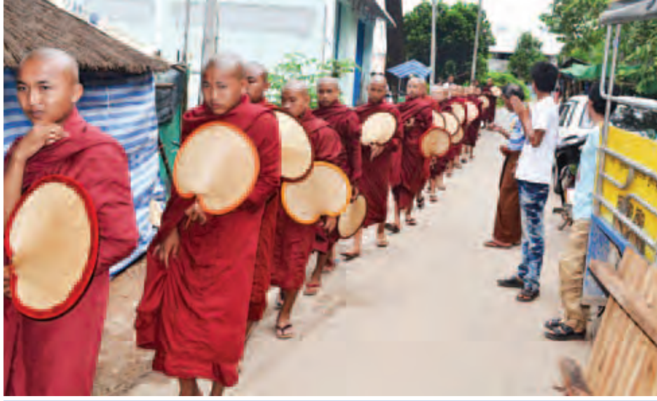
နှစ်စဉ်ဝါခေါင်လတွင် ကျင်းပသော မဟာဒုက္ခစာရေးတံမဲ ဆွမ်းကပ်အလှူပွဲမှ သံဃာတော်များကို ဖူးတွေ့ရစဉ်။

“ရတု၊ ကဗျာ၊ ယျုံ၊ လင်္ကာနှင့် သာသည့်သီချင်း အဲဆောင်းဦးနှင့်မကင်းမပြတ်နေအပ်၏” ဟု ဝန်ကြီး ပဒေသရာဇာက ညွှန်းဆိုထားသည်အတိုင်း ရှေးကပင် စာဆိုများ၏ စာကောင်းပေမယ့်အစား မပြတ်လေ့ လာရင်း ရေးဖွဲ့သီကုံးနေကြသည်။ ဖော်ထုတ်နေကြရ မည်။