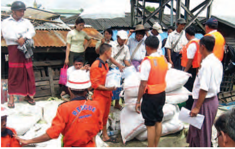
ကန်ကြီးထောင့်မြို့နယ်တွင် ရေဘေးသင့်ပြည်သူများသို့ ပစ္စည်းများပေးအပ်လျှို့ဝှက်

အနေများကို ဆန်းစစ်ခြင်း၊ ကူးစက် ရောဂါ စောင့်ကြပ်ကြည့်ရှုခြင်းနှင့် ဆေးဝါးပစ္စည်းများ ဖြန့်ဖြူးခြင်းလုပ် ငန်းများကိုလည်းကောင်း ကွင်းဆင်း ဆောင်ရွက်ခဲ့ကြသည်။ ကူးစက်ရောဂါ ကာကွယ်ရေးနှင့် တုံ့ပြန်ဆောင်ရွက်မှုများ အနေဖြင့် ရခိုင်ပြည်နယ် ဘူးသီးတောင်မြို့နယ် တွင် အသည်းရောင် အသားဝါ ရောဂါသည်များအား ယာယီဆေးခန်း ဖွင့်လှစ်၍ ကုသပေးခြင်း၊ ကျန်းမာရေး ပညာပေးခြင်း၊ ရေတွင်း၊ ရေကန်နှင့် လက်နီပုံတံများကို ကလိုရင်း ဆေးခတ်ခြင်း၊ ရောဂါစောင့်ကြပ် ကြည့်ရှုခြင်း လုပ်ငန်းများကိုလည်း ကောင်း၊ စစ်ကိုင်းတိုင်းဒေသကြီး ကလေးမြို့နယ် နတ်ချောင်းတိုက်နယ် ထိုမာကျေးရွာတွင် သာမန် ဝမ်းပျက် ဝမ်းလျှော ရောဂါသည်များအား ဆေးကုသပေးခြင်း၊ ရေတွင်း၊ ရေကန်များကို ကလိုရင်းဆေးခတ် ခြင်း၊ ကျန်းမာရေးပညာပေးခြင်းနှင့် ရောဂါကာကွယ်နှိမ်နင်းခြင်းလုပ်ငန်း များကိုလည်းကောင်း၊ ပဲခူးတိုင်းဒေသ ကြီး သာယာဝတီမြို့နယ် သုံးဆယ်မြို့ ရေဘေး ကယ်ဆယ်ရေးစခန်းတွင် ဦးနှောက်ရောင်ရောဂါ စောင့်ကြပ် ကြည့်ရှုခြင်းနှင့် ကျန်းမာရေးပညာပေး ခြင်း လုပ်ငန်းများကိုလည်းကောင်း ကွင်းဆင်းဆောင်ရွက်လျက်ရှိသည်။ အလားတူ ကျန်းမာရေးဦးစီးဌာနက ပြည်နယ်နှင့် တိုင်းဒေသကြီးများရှိ ရေဘေးသင့်ဒေသများသို့ ဆေးနှင့်