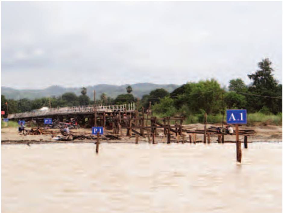
ထို့နောက် မကွေးတိုင်းဒေသကြီးနှင့် ရခိုင်ပြည်နယ် တို့မှ မြို့နယ်၊ ခရိုင်၊ အထူးအဖွဲ့များမှ တာဝန်ခံ အင်ဂျင်နီယာများနှင့်တွေ့ဆုံပြီး ပျက်စီးသွားသော လမ်းတံတား များ အမြန်ပြန်လည်ပြုပြင်၍ လမ်းပန်းဆက်သွယ်ရေး မပြတ်တောက်စေရန် တာဝန်ခံအင်ဂျင်နီယာများ ကိုယ်တိုင် အနီးကပ်ကြီးကြပ်ပြီး မြို့နယ်၊ ခရိုင်၊ အထူးအဖွဲ့များပေါင်းစပ်၍ စောင့်ကြည့်ပေးရန်နှင့် လမ်းလုပ်ငန်း ဆောင်ရွက်သူများ အန္တရာယ်ကင်းရှင်းရေး ဂရုပြုဆောင် ရွက်ရန်တို့ကို မှာကြားခဲ့သည်။ (ကြေးမုံ)

ထို့နောက် မင်းဘူး-ပဒါန်း-အမ်းလမ်း (ပဒါန်း-အမ်း အပိုင်း)ကို ကြည့်ရှုစစ်ဆေးသည်။ ဆက်လက်၍ နတ်ရေကန်ရွှေငါးလမ်း ၂၂ မိုင် ၄ ဖာလုံတွင် ဇူလိုင်လအတွင်း မိုးသည်းထန်စွာ ရွာသွန်းမှုကြောင့် တောင်ပြိုမြေများဖြင့် လမ်းပိတ်ဆို့ပျက်စီးသွားသော မကွေးတိုင်းဒေသကြီးအပိုင်း မိုင်တိုင် (၃/၄ နှင့် ၃/၆) ကြား၊ မိုင်တိုင်အမှတ် (၅/၂ နှင့် ၅/၃) ကြား၊ မိုင်တိုင်အမှတ် (၁၆/၅ နှင့် ၁၆/၇) ကြား၊ မိုင်တိုင်အမှတ် (၁၈/၀ နှင့် ၁၈/၁) ကြားနှင့် မြေပြိုပျက်စီးမှု ကြီးမားစွာဖြစ်ပေါ်ခဲ့သော (၁၉/၅ နှင့် ၁၉/၇) ကြား၊ (၂၀/၄ နှင့် ၂၀/၅) ကြားတို့ တွင် လူအင်အား၊ စက်ယန္တရားများဖြင့် လမ်းကြောင်း ပွင့်အောင် ဆောင်ရွက်ပြီးဖြစ်၍ ယာဉ်ကြီး၊ ယာဉ်ငယ်များ ဖြတ်သန်းသွားလာနိုင်ရေး ဆောင်ရွက်နေမှုကို လည်း ကောင်း၊ ရခိုင်ပြည်နယ်အပိုင်း မိုင်တိုင်အမှတ်(၆၂/၄ နှင့် ၆၂/၅)ကြား၊ (၆၅/၅ နှင့် ၆၅/၆)ကြား တောင်ပြိုကျ၍ ပျက်စီးသွားသည့်နေရာအား လမ်းဦးစီးဌာန တည်ဆောက် ရေး(၃) လမ်းအထူးအဖွဲ့(၁၆)မှ တာဝန်ခံအင်ဂျင်နီယာ များကိုယ်တိုင် အနီးကပ်ကြီးကြပ်ပြီး စက်ယန္တရားများ၊ အလုပ်သမားများဖြင့် အချိန်နှင့်တစ်ပြေးညီ အင်တိုက် အားတိုက် ပြုပြင်နေမှုကြောင့် လမ်းကြောင်းပွင့်၍ ယာဉ် ကြီး၊ ယာဉ်ငယ်များ၊ ကုန်စည်ပို့ဆောင်သည့် ကုန်တင်ယာဉ် များ ဖြတ်သန်းသွားလာမှုတို့ကို ကြည့်ရှုစစ်ဆေးသည်။