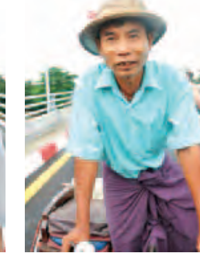
ကိုသိန်းတန်။