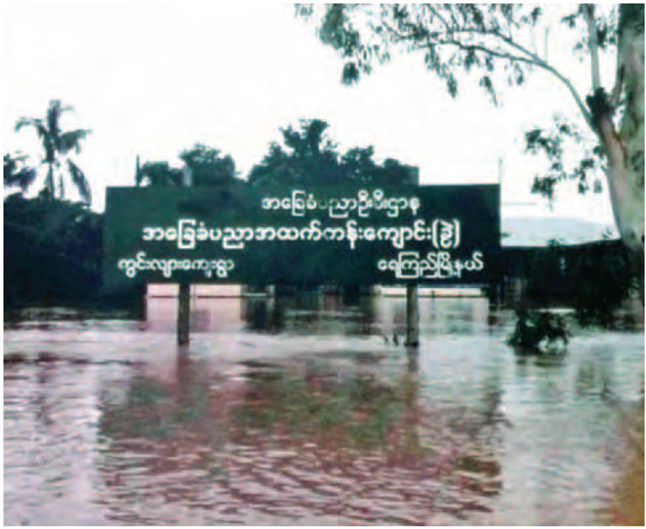
ဧရာဝတီတိုင်းဒေသကြီး ရေကြည်မြို့နယ် ကွင်းလျားကျေးရွာအခြေခံပညာအထက်တန်းကျောင်း(ခွဲ)ရေနစ်မြုပ်နေစဉ်။