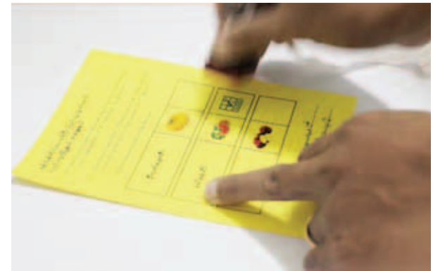
မိမိဆန္ဒပြုလိုသော လွှတ်တော်ကိုယ်စားလှယ်လောင်း၏ ညာဘက်အစွန်းရှိ အတွက်တွင် အမှန်ခြစ်တံဆိပ်လွယ်ကူစွာ နှိပ်နိုင်ပုံ။