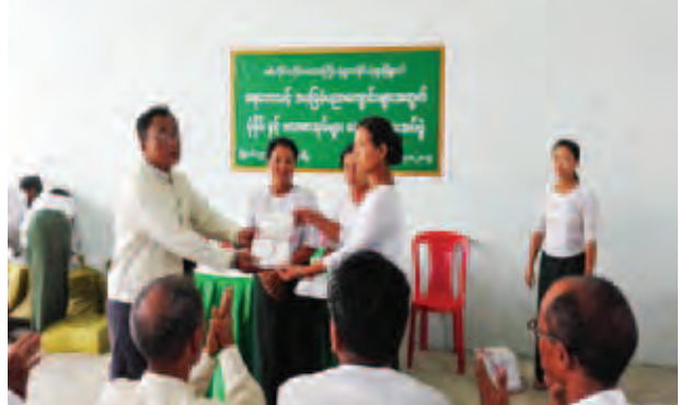
(ဖိုးချမ်း-ပုံရွာ)

ထားပေးသော ကျောင်းသုံးပုံနှိပ် စာအုပ်များနှင့် ကျောင်းထောက်ပံ့ ကြေးငွေများ ပေးအပ်ပွဲကို ဩဂုတ် ၁၄ ရက် မွန်းလွဲ ၂ နာရီခွဲက ပုံရွာမြို့ မြို့နယ်ပညာရေးမှူးရုံး အစည်းအဝေးခန်းမ၌ ကျင်းပခဲ့ သည်။ အခမ်းအနားတွင် ရေဘေးသင့် ကျောင်း ၄၇ ကျောင်းရှိ သူငယ်တန်းမှ ဒသမတန်းအထိ ကျောင်းသား