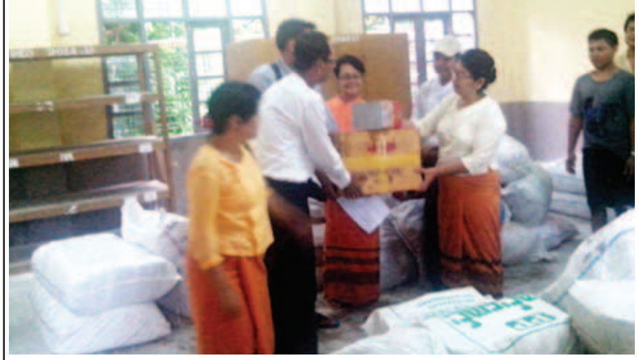
စေတနာရှင် အလှူရှင်များက ရေဘေးသင့်ကျောင်းသား ကျောင်းသူများအတွက် ကျောင်းသုံးပစ္စည်းများကို ရန်ကုန်မြောက်ပိုင်းခရိုင်ပညာရေးမှူးထံ ပေးအပ်လှူဒါန်းစဉ်။ (သတင်းစဉ်)