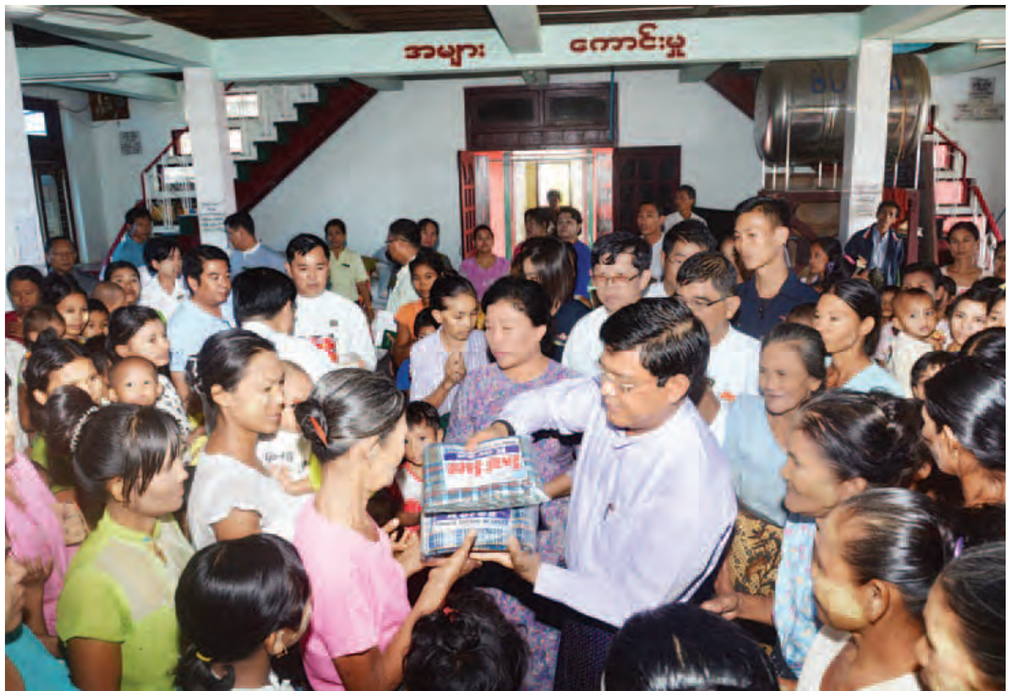
ဒုတိယသမ္မတ ဦးညွှန်ထွန်းနှင့် ဇီးကုန်းဒေသခံအဖွဲ့တို့ သာယာဝတီမြို့ မင်္ဂလာအုဋ်ကျောင်းတိုက် ကယ်ဆယ်ရေးစခန်းတွင် ရေဘေးသင့်ပြည်သူများအား ထောက်ပံ့ရေးပစ္စည်းပေးအပ်စဉ်။ (သတင်းစဉ်)