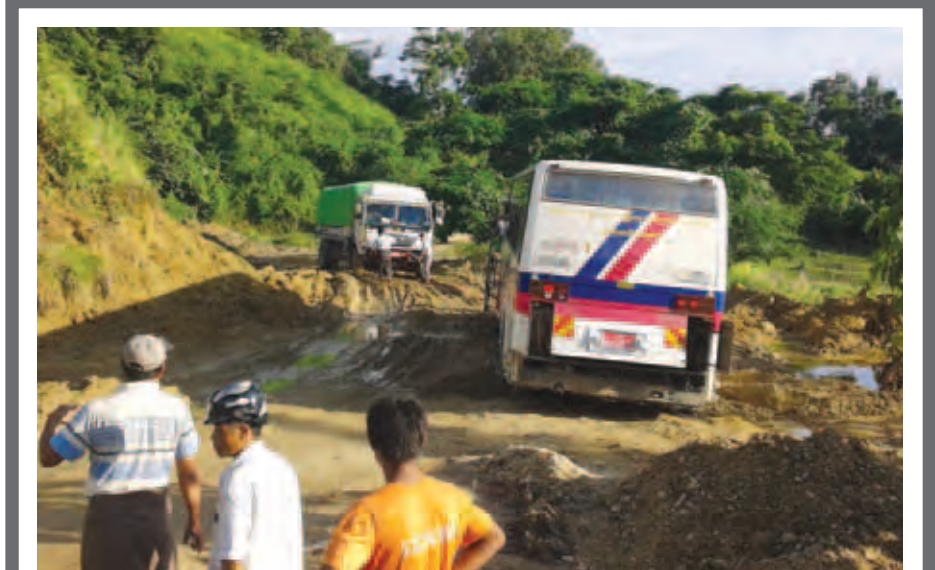
စစ်ကိုင်းတိုင်းဒေသကြီး အင်းတော်-ဗန်းမောက်ကားလမ်း မိုင်တိုင်အမှတ်(၂၀/၃)အနီးရှိ တောင်တန်းတွင် ရုလိုင် ၂၉ ရက်တွင် တောင်ပြိုမှုဖြစ်ပွားခဲ့သည်။ ဩဂုတ် ၁၃ ရက်ကလည်း မိုးရွာသွန်းပြီး ထပ်မံတောင်ပြိုခဲ့သောကြောင့် ခရီးသွားလာမှု နှောင့်နှေးကြန့်ကြာမှု ဖြစ်ပွားခဲ့သည်။

က-ညီမရေ။ ဒီလောက်ဆို သဘောပေါက်သွားပြီထင်ပါတယ်။ ဒါနဲ့ညီမရေ ဆီးချိုရောဂါသည်တွေအတွက် ဘဝနေထိုင်မှုနဲ့ ရောဂါရန်၊ ဆောင်ရန် အစားအစာလေးတွေကို မမေးပေးထားဖို့ပါတယ်။ မမရဲ့ ‘Promsie Pauk’ Facebook နဲ့ ‘အလှအပ၊ ဖက်ရှင်နှင့် ကျန်းမာရေးဆိုင်ရာ ဆောင်းပါးရှင် Promise Pauk’ ပေချီ (page) တို့မှာ ဝင်ရောက်ဖတ်ရှုလိုက်ပါနော်။ ကျန်းမာပျော်ရွှင်ပါစေကွယ်။ ။