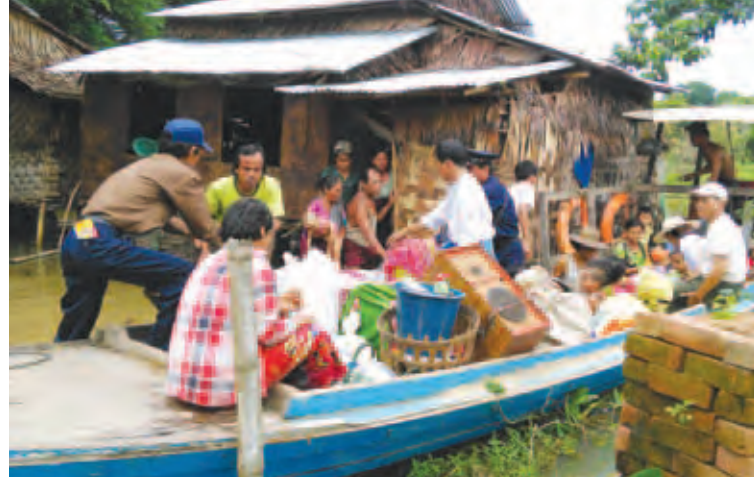
လက်ရှိတွင် ကျုံပျော်မြို့နယ်အတွင်း စီးဝင်လာသော ရေပမာဏမှာ နေ့စဉ်များပြားလျက် ရှိသောကြောင့် အနီးပိုင်းကျေးရွာများ၊ လယ်များတွင် ရေဝင်နစ်မြုပ်မှုများ ထပ်မံဖြစ်ပေါ်လျက်ရှိကြောင်း သိရသည်။ မောင်ဌေး(ပြန်/ဆက်)

ကျုံပျော်၊ ဩဂုတ် ၁၅ ဧရာဝတီတိုင်းဒေသကြီး ကျုံပျော်မြို့နယ် တွင် ဒါးကချောင်းရေနှင့်မြစ်ရေများ တိုးဝင်လာမှုကြောင့် ချောင်းနံဘေးကျေးရွာများနှင့် အနီးပိုင်းကျေးရွာများတွင် ရေဝင်ရောက်မှုများ ထပ်မံဖြစ်ပေါ်လျက်ရှိပြီး ဩဂုတ် ၁၃ ရက်အထိ စာသင်ကျောင်း ၁၉ ကျောင်းနှင့် အိမ် ၂၂၇ လုံးတို့တွင် ရေနစ်မြုပ်မှုများ ဖြစ်ပေါ်လျက်ရှိကြောင်း သိရသည်။ အဆိုပါ ရေဘေးသင့်နေအိမ်များမှ ပြည်သူ ၈၈၃ ဦးတို့ကို ရေဘေးကယ်ဆယ်ရေးအဖွဲ့များက ကယ်ဆယ်ရေးစခန်း ငါးခုတွင် ရွှေ့ပြောင်းဆောင်ရွက်ပေးထားကာ ကျန်းမာရေး၊ နေထိုင်စားသောက်ရေးနှင့် လုံခြုံရေးတို့ကို မြို့နယ်မှ တာဝန်ရှိသူများ၊ လူမှုရေးအသင်းအဖွဲ့များနှင့် အလှူရှင်များကလည်း နေ့စဉ်ဆောင်ရွက်ပေးလျက်ရှိပြီး အနယ်နယ်အရပ်ရပ်မှ အလှူရှင်များကလည်း နေ့စဉ် လာရောက်လှူဒါန်းလျက်ရှိကြောင်း သိရသည်။