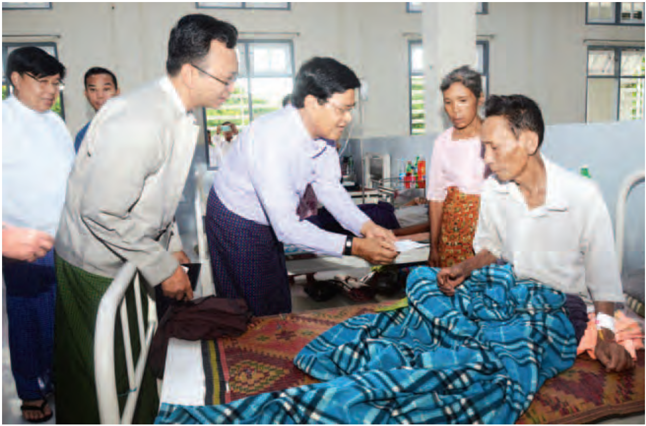
နှင့် ရင်းရင်းနှီးနှီးတွေ့ဆုံပြီး ဒေသဖွံ့ဖြိုးရေးလိုအပ်ချက်များကို ဖြည့်ဆည်း ပေးခဲ့သည်။ (သတင်းစဉ်)

ထို့နောက် မြသိန်းတန်စေတီတော် ပရိဝုဏ်အတွင်း ဒေသခံပြည်သူများ