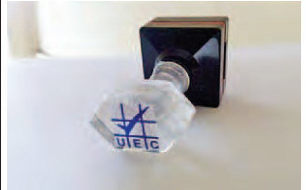
တံဆိပ်နှိပ်ရာတွင် အမှန်ခြစ်ကို အတည့်ဖြစ်စေရန် တံဆိပ်တုံး၏ လက်ကိုင်တွင် ပြသထားသည့် သင်္ကေတ။