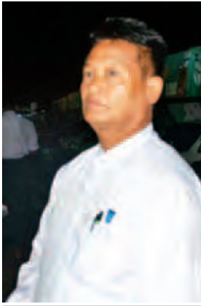
ကျော်ကျော်ကို။

ယာဉ်မတော်တဆမှု အများစုက သတ်မှတ် မိုင်နှုန်းထက်ကျော်ပြီး မောင်းကြည့် ဖြစ်တာလို့ ထင်ပါ တယ်။ နှုန်းထား ကီလိုမီတာ ၁၀၀ အောက်မှာပဲ မောင်းတယ်ဆိုရင် အရေးအကြောင်းဆို ယာဉ်မောင်း က ထိန်းနိုင်ပါတယ်။ ကျွန်တော်တို့ လည်း အဲဒီလောက်ပဲမောင်းတယ်။ မှောက်တယ်ဆိုတာ ၁၀၀ ကျော် လို့လို့ ထင်ပါတယ်။ ပြီးတော့ ကျွန်တော် ကားမောင်းချိန်ဆို ထမင်းစားဘူး။ အအေးလေးနဲ့ မုန့်လေး ဒါလောက်ပဲစားတယ်။ ဘာလို့လည်းဆိုတော့ ထမင်းစား လိုက်ရင် ဒါမှမဟုတ် အစားအများ ကြီးစားလိုက်ရင် ယာဉ်မောင်းက အိပ်ငိုက်တယ်။ လမ်းအနေနဲ့ ကတော့ မဆိုးလှပါဘူး။