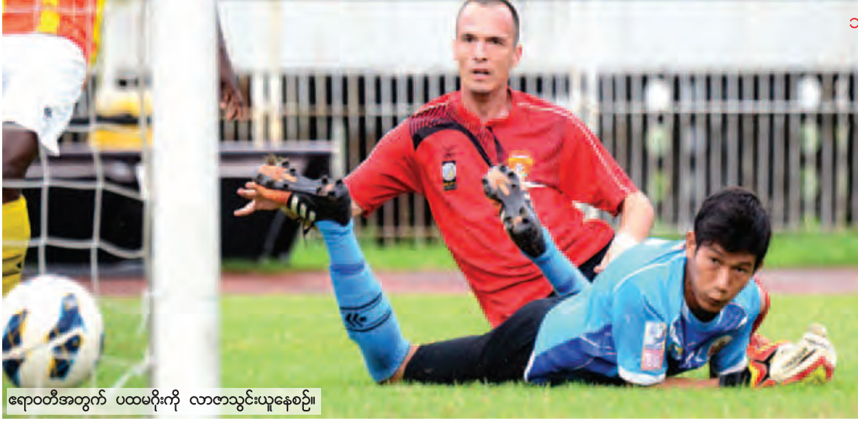
ဂျော့ပတ်အတွက် ပထမဂိုးကို လာလာသွင်းယူနေစဉ်။

၂၀၁၅ ရာသီ ဗိုလ်ချုပ်အောင်ဆန်း ဇိုင်း နူး/ထွက်ပြိုင်ပွဲ ဆီမီဖိုင်နယ်(၂) ပထမအကျော့ပွဲစဉ်ကို ယနေ့ညနေပိုင်းက သုဝဏ္ဏကွင်း၌ ကျင်းပရာ ဧရာဝတီအသင်းက ရခိုင်အသင်းကို နှစ်ဂိုးပြတ်အနိုင်ရရှိခဲ့သည်။ ဧရာဝတီ - နှစ်ဂိုး။ ရခိုင် - ဂိုးမရှိ။ အိမ်ကွင်းအဖြစ် သုဝဏ္ဏကွင်း၌ လက်ခံကစားရသည့် ပထမအကျော့ပွဲစဉ်တွင် နှစ်ဂိုးပြတ်အနိုင်ရခဲ့သည့် ဧရာဝတီအသင်းမှာ ဗိုလ်လုပွဲသို့ တက်ရောက်ရန် အခြေအနေကောင်းသွားပြီဖြစ်သည်။ ရခိုင်အသင်းမှာ စာမျက်နှာ ၄ ကော်လံ ၅ သို့