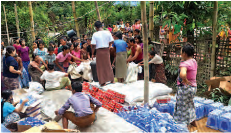
ရိုးမမြေဆောက်လုပ်ရေးကုမ္ပဏီနှင့် ရခိုင်ပြည်နယ်ကျေးလက်ဒေသဖွံ့ဖြိုးတိုးတက်ရေးဦးစီးဌာနတို့ ပူးပေါင်း၍ မြောက်ဦးမြို့နယ်ရှိ ခဲမောင်းတောကျေးရွာသို့ သွားရောက်ကာ ရေဘေးသင့်ပြည်သူများအား ဆန်၊ ရေ ငါးစည်သွတ်ဘူး၊ ရေသန့်ဆေးပြား၊ ခေါက်ဆွဲခြောက်၊ ဘီစကွတ်မုန့်မျိုးစုံတို့ကို လှူဒါန်းစဉ်။ (ဌေးအောင်)