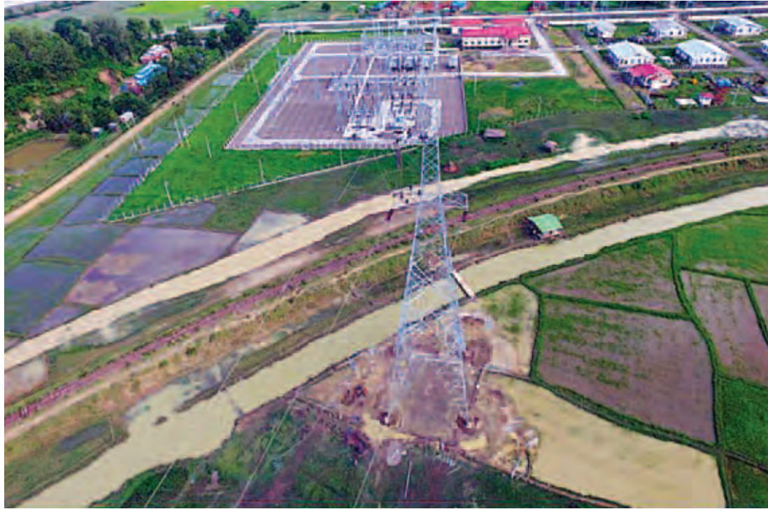
၂၃၀ ကေစီ အမ်း-မြောက်ဦး-ပုဏ္ဏားကျွန်း ဓာတ်အားလိုင်း တာဝါတိုင်အမှတ် (MP-96)တာဝါတိုင်အသစ် ပြန်လည်စိုက်ထူခြင်းလုပ်ငန်းနှင့် ချိတ်ဆက်ကြိုးဆွဲခြင်းလုပ်ငန်း ဆောင်ရွက်ပြီးစီးနေသည်ကို တွေ့ရစဉ်။

ရခိုင်ပြည်နယ်အတွင်း ဓာတ်အားဖြန့်ဖြူးပေးလျက် ရှိသော ဓာတ်အားလိုင်းနှင့် ဓာတ်အားခွဲရုံများအနက် ၂၃၀ ကေစီ အမ်း-မြောက်ဦး-ပုဏ္ဏားကျွန်း ဓာတ်အားလိုင်း တာဝါတိုင်အမှတ် MP-96, MP-60, MP-61 တာဝါတိုင် သုံးတိုင်သည် ဇူလိုင် ၃၀ ရက်တွင် လေပြင်းတိုက်ခတ်မှုကြောင့် ပြိုလဲခဲ့သဖြင့် အဆိုပါဓာတ်အားလိုင်းမှ ဓာတ်အား ပေးထားသော စစ်တွေ၊ ကျောက်တော်၊ မြောက်ဦးနှင့် ပုဏ္ဏားကျွန်းမြို့များတွင် ဓာတ်အားပြတ်တောက်မှုများ ဖြစ်ပေါ်ခဲ့သည်။