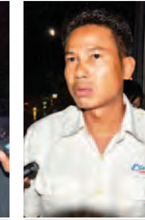
ထွန်းထွန်းလတ်။

ရန်ကုန်၊ မန္တလေးကို မကြာခဏ သွားနေတာပါ။ ကားတွေ မကြာ ခဏ မှောက်တာ တွေလည်းတွေ့ တယ်။ ကြားလည်း ကြားရတယ်။ ဒီလမ်းပေါ်မှာ မကြာခဏသွားနေ တဲ့သူတစ်ယောက်အနေနဲ့ အတွေ့ အကြုံအရဆိုရင် ဖြစ်ပွားမှု တော်တော်များများ အရှိန်များလို့ လို့ ကျွန်တော်ထင်တယ်။ အတွေ့ အပိုက်တွေရှိတယ်။ အဲဒီနေရာလေး တွေရောက်ရင် အရှိန်လျှော့ပြီး သတိထားသင့်တာပေါ့။ လမ်း တစ်လျှောက်မှာ အရှိန်တိုင်း ကိရိယာတွေရှိပါတယ်။ ကိုယ်ပိုင် ကားတွေရော၊ လိုင်းကားတွေပါ အဲဒီကိရိယာတွေမှ အရှိန်လျှော့ တာမျိုးတွေ တွေ့ရတယ်။