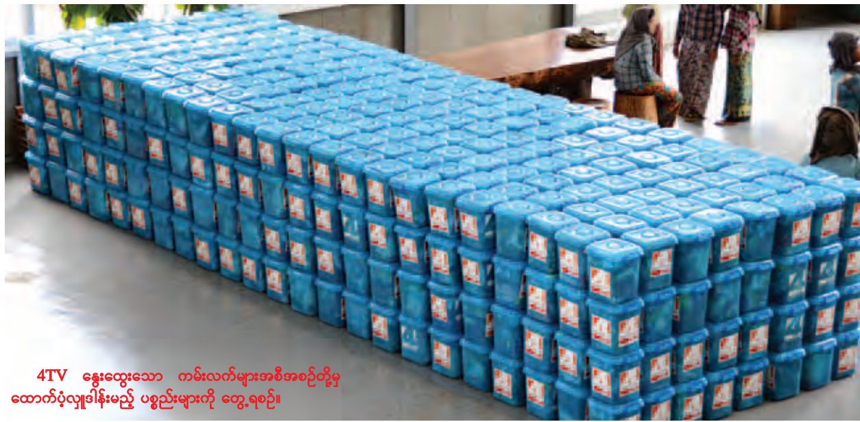
4TV နွေးထွေးသော ကမ်းလက်များအစီအစဉ်တို့မှ ထောက်ပံ့လှူဒါန်းမည့် ပစ္စည်းများကို တွေ့ရစဉ်။