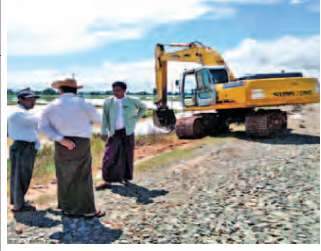
စစ်ကိုင်းတိုင်းဒေသကြီး ကောလင်းမြို့နယ် ဝါးရုံခုံအုပ်စုအတွင်းရှိ ရေမကျသေးသည့် လယ်စေ ၁၅၀၀ ကျော်ကို ရေကျသွားစေရန်နှင့် စိုက်ပျိုးရာသီအမီ ပြန်လည်စိုက်ပျိုးနိုင်ရေးအတွက် ဩဂုတ် ၁၀ ရက်မှ စတင်ကာ စက်ယန္တရားများဖြင့် လမ်းဦးစီးဌာနက လယ်စိုက်ကွင်းများဘေးရှိ ရေမြောင်းများကိုတူးဖော်နေစဉ်။ မြို့နယ်(ပြန်/ဆက်)