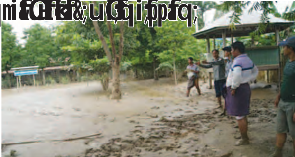
ကမ်းပါးပြိုကျမှု၊ လမ်းများ၊ အခြေခံအထက်တန်းကျောင်းဝင်းနှင့် စာသင်ခန်းများအတွင်း နွံဝင်ရောက်မှုများကို ကွင်းဆင်း စစ်ဆေးဆောင်ရွက်ခဲ့ကြောင်း သိရသည်။

ကနီ ဩဂုတ် ၁၁ စစ်ကိုင်းတိုင်းဒေသကြီး ယင်းမာပင်ခရိုင် ကနီမြို့နယ်တွင် ကျေးရွာပေါင်း ၆၅ ရွာ အိမ်ထောင်စု ၇၅၆၂ စုမှ ၇၃၄၀ အိမ် စာသင်ကျောင်း ၂၈ ကျောင်း၊ ဘုန်းတော်ကြီးကျောင်း ၆၉ ကျောင်းတို့တွင် ချင်းတွင်းမြစ်ရေဝင်ရောက်ခဲ့ပြီး မြစ်ရေနှင့်အတူ သဲနုန်းနှင့် နွံများဝင်ရောက်မှုများ ရှိခဲ့သည်။