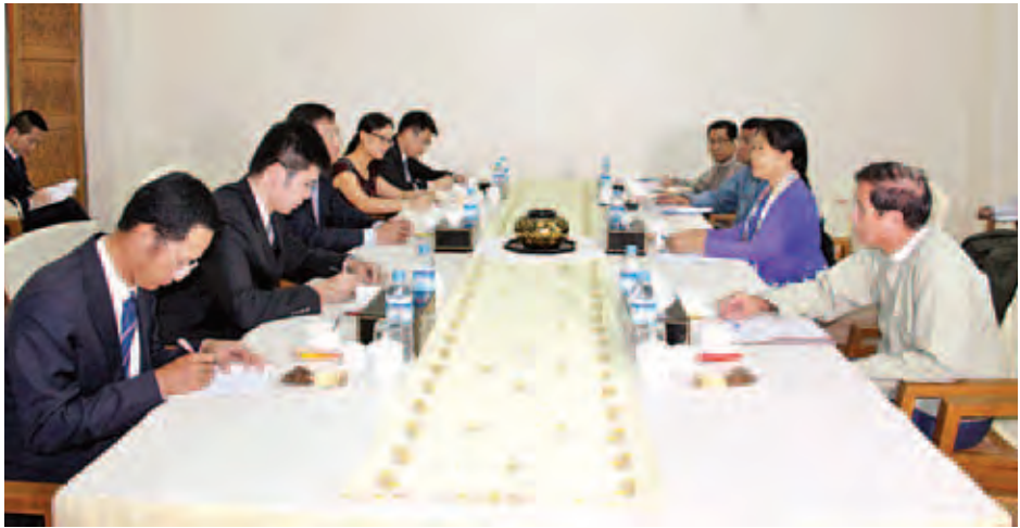
(၈)ခုပါ မြန်မာနိုင်ငံလူမှုကာကွယ်စောင့်ရှောက်ရေး ရွက်မည့် အစီအစဉ်များကို ရင်းနှီးပွင့်လင်းစွာဆွေးနွေး ဆိုင်ရာ အမျိုးသားအဆင့်မဟာဗျူဟာစီမံချက်နှင့် ခွဲကြကြောင်း သတင်းရရှိသည်။ (သတင်းစဉ်)

ဆောင်ရွက်နေမှုများ၊ ရေကြီးရေလျှံမှုများကြောင့် ထိခိုက်ပျက်စီးဆုံးရှုံးမှုများ၊ အရေးပေါ်ကယ်ဆယ်ရေးအတွက် ဆောင်ရွက်နိုင်မှုအခြေအနေများနှင့် ပြန်လည်ထူထောင်ရေးအတွက် လိုအပ်မှုအခြေအနေများ၊ ကယ်ဆယ်ရေးစခန်းများရှိ ရေဘေးသင့်ပြည်သူများ၏ အခြေအနေများ၊ တရုတ်ပြည်သူ့သမ္မတနိုင်ငံ ယူနန်ပြည်နယ်ဘက်မှ အရေးပေါ်ကူညီပေးမှုများ၊ မကြာမီဖွင့်လှစ်မည့် မြန်မာနိုင်ငံရှိ တစ်ခုတည်းသောဟင်္သာတမြို့ သဘာဝဘေးအန္တရာယ်စီမံခန့်ခွဲမှုသင်တန်းကျောင်း(Disaster Management Training Center)အတွက်သင်တန်းနည်းပြဆရာများ၊ နည်းပညာနှင့် အကူအညီပေးနိုင်မှုများ၊ ရေကြီးရေလျှံမှုပြီးနောက် ဖြစ်ပေါ်လာနိုင်သည့် ကျန်းမာရေးကိစ္စများအတွက် အကူအညီပေးနိုင်မှုများ၊ သဘာဝဘေးသင့်ပြည်သူများအား ထောက်ပံ့ခြင်းအပါအဝင် လုပ်ငန်းစဉ်