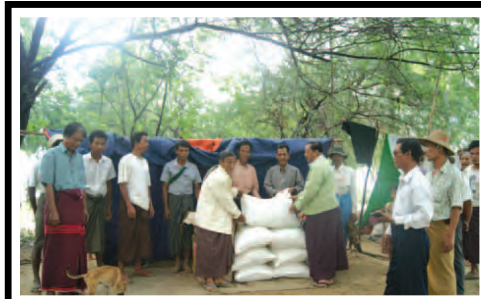
မကွေးတိုင်းဒေသကြီး ချောက်မြို့နယ် ဌာနဆိုင်ရာများနှင့် 'နှင်းသစ်' ဆောက်လုပ်ရေးကုမ္ပဏီတို့ ပူးပေါင်းပါဝင်လှူဒါန်းမှုဖြင့် ပဒေသာ(တောင်)၊ ပဒေသာ (မြောက်)၊ ကျွန်းသစ်(အရှေ့) ကျေးရွာများမှ ဆိပ်ဖြူမြို့နယ်နှင့် စလင်းမြို့နယ်များသို့ ရွှေ့ပြောင်းနေထိုင်သော လူဦးရေ ၆၅၁၉ ဦးအတွက် ဆန်၊ ခေါက်ဆွဲခြောက်ပစ္စည်း တန်ဖိုးငွေကျပ် ၄၂၃,၂၀၀ အား ထောက်ပံ့ပေးအပ်လှူဒါန်းခဲ့သည်။