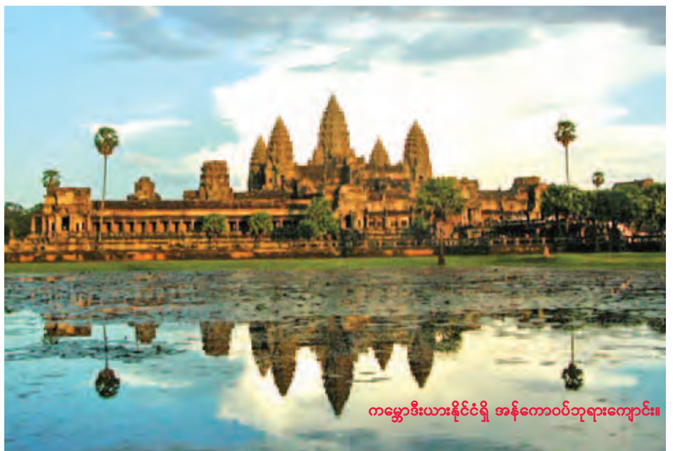
ကမ္ဘောဒီးယားနိုင်ငံရှိ အန်ကောဝပ်ဘုရားကျောင်း။

ဟု ၎င်းက ဆိုသည်။ အဆိုပါတောင်းဆိုချက်ကို အိန္ဒိယအစိုးရထံ ပို့ဆောင်ရန် ပတ်နီခံက ကတိပေးခဲ့သည်။ ကမ္ဘောဒီးယားအစိုးရက အိန္ဒိယအစိုးရထံ ကန့်ကွက်စာတစ်စောင် ပေးပို့ပြီးနောက် အိန္ဒိယနိုင်ငံအရှေ့ပိုင်း ဘီဟာပြည်နယ်အခြေစိုက် ဟိန္ဒူအဖွဲ့အစည်းတစ်ခုဖြစ်သည့် Mahavir Mandir က နိုင်ငံအရှေ့ပိုင်း ဘီဟာပြည်နယ်၌ ကမ္ဘာကျော် အန်ကောဝပ်ဘုရားကျောင်းပုံစံတူတစ်ခု တည်ဆောက်မည့် အစီအစဉ်ကို ရွှေ့ဆိုင်းခဲ့ရသည်။ ကမ္ဘောဒီးယားနိုင်ငံ အနောက်မြောက်ပိုင်း ဆီရမ်ယီပြည်နယ်တွင် တည်ရှိသည့် အန်ကောဝပ်ဘုရားကျောင်းမှာ ကမ္ဘောဒီးယားနိုင်ငံ၏ ခရီးသွားဝင်ရောက်မှုအများဆုံး ခရီးသွားနယ်မြေဖြစ်သည်။ အစိုးရ၏ ကိန်းဂဏန်းများအရ အဆိုပါအန်ကောဝပ်ဘုရားကျောင်းသည် ၂၀၁၅ ခုနှစ် ပထမအရပ်အတွင်း ကမ္ဘာလှည့်ခရီးသည် ၁ ဒသမ ၂၄ သန်းနီးပါးကို ဆွဲဆောင်ခဲ့ပြီး လက်မှတ်ရောင်းချမှုမှ ဝင်ငွေ အမေရိကန်ဒေါ်လာ ၃၅ သန်း ရရှိခဲ့သည်ဟု သိရသည်။ (ဆင်ဟွာ)