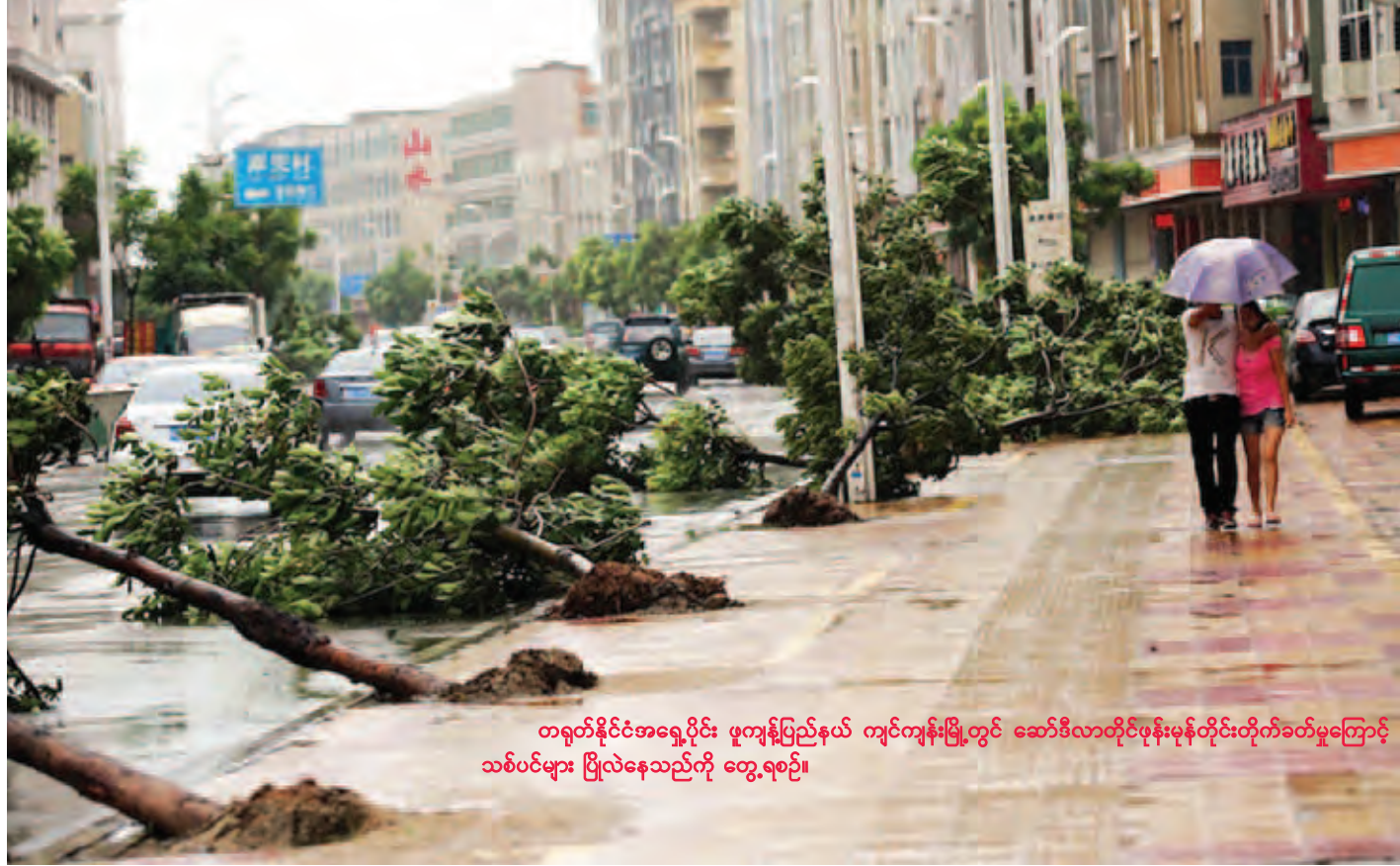
တရုတ်နိုင်ငံအရှေ့ပိုင်း ဖူကျွန်းပြည်နယ် ကျင်ကျန်းမြို့တွင် ဆော်ဒီလာတိုင်ပုန်းမုန်တိုင်းတိုက်ခတ်မှုကြောင့် သစ်ပင်များ ပြိုလဲနေသည်ကို တွေ့ရစဉ်။

၇၃ ဘီလီယံ အမေရိကန်ဒေါ်လာ ၁ ဒသမ ၄၃ ဘီလီယံ ရှိသည်။ ဆော်ဒီလာတိုင်ပုန်းမုန်တိုင်းသည် ထိုင်ဝမ်ကျွန်းသို့ ပထမဆုံးတိုက်ခတ်ခဲ့ပြီး လူ ကြောက်ဦးသေဆုံးခဲ့သည်။ စနေနေ့ညတွင် ဖူကျွန်းပြည်နယ်၊ ကျွန်းပြည်နယ်နှင့် ကျွန်းပြည်နယ်တို့သို့ ဆက်လက်ဝင်ရောက်တိုက်ခတ်ခဲ့ခြင်းဖြစ်သည်။ အဆိုပါ တိုင်ပုန်းမုန်တိုင်းသည် တစ်နာရီလျှင် ကီလိုမီတာ ၂၀ နှုန်းဖြင့် အရှေ့မြောက်ဘက်သို့ ရွေ့လျားတိုက်ခတ်သွားမည်ဟု မျှော်လင့်ရပြီး အနီးတွင်းပြည်နယ်၊ ကျွန်းပြည်နယ်၊ ကျွန်းပြည်နယ်မြောက်ပိုင်း၊ ဟူပေပြည်နယ်အရှေ့ပိုင်းနှင့် မြို့တော်ရှန်ဟိုင်းတို့တွင် မိုးသည်းထန်စွာရွာသွန်းနိုင်ဖွယ်ရှိသည်။ (ဆင်ဟွာ)