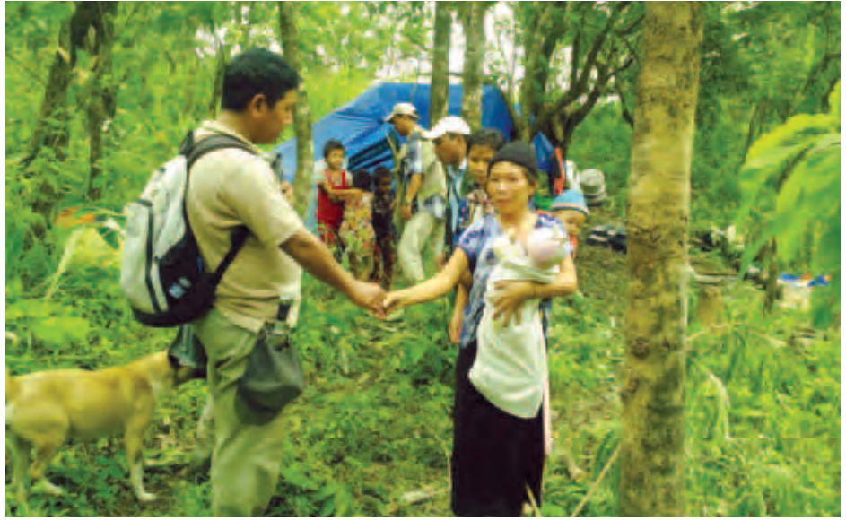
ဘေးလွတ်ရာသို့ ရွှေ့ပြောင်းနေထိုင်ကြသည့် ရေဘေးသင့်ပြည်သူများအား ကူညီထောက်ပံ့ရေးအဖွဲ့များ သွားရောက်တွေ့ဆုံစဉ်။

လမ်းနှစ်ခြမ်းအသင်းတော်တွင် ဖွင့်လှစ်ထားပြီး မြေပြိုမှုများ နှင့် ကြုံတွေ့နေရသည့် ကင်ကျေးရွာအုပ်စု၊ ကင်ကျေးရွာ မှ ပြောင်းရွှေ့လာသည့် ကျောင်းသား ကျောင်းသူ ၄၇ ဦးအပါအဝင် လူဦးရေ ၁၂၇ ဦးကို လက်ခံစောင့်ရှောက်ထားသည်။