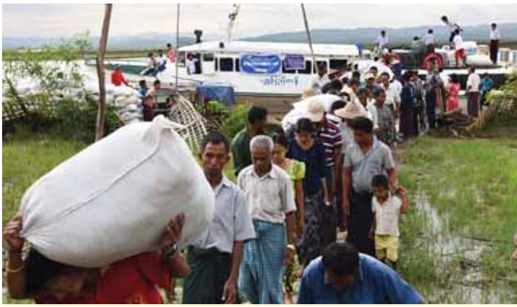
မင်းပြားမြို့နယ် ကျားရဲပြင်ကျေးရွာသို့ရောက်ရှိစဉ် ရွာသားများ ပစ္စည်းများသယ်ချပေးစဉ်။

သင်္ဘောထွက်ခွာသည့်အချိန်မှာ ၆ နာရီ ၁၅ မိနစ်ခန့်ဖြစ်၍ တစ်နာရီခွဲခန့်မောင်းပြီး ချိန်တွင် မင်းပြားမြို့နယ်၏ ရေဘေးသင့် ကျေးရွာဖြစ်သော ကျားရဲပြင်ကျေးရွာအုပ်စု သို့ စတင်ရောက်ရှိသည်။ ကမ်းစပ်မှစ၍ အလှူပွဲ အခမ်းအနားကျင်းပမည့် အဆောက် အအုံသို့ သွားရာလမ်းတစ်လျှောက် စပါးခွံအိတ်များ ခင်းပေးထားသည်။ သင်္ဘောပေါ်ရှိ လှူဒါန်းမည့် ဆန်၊ ဆေး၊ အသုံးအဆောင်ပစ္စည်း မျိုးစုံထည့်ထားသည့်