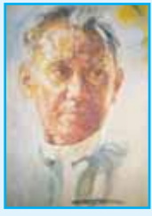
တက္ကသိုလ်ဘုန်းနိုင်