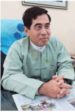
ဒုတိယအမြဲတမ်းအတွင်းဝန် ဦးလှဦး။

လူငယ်ဝတ် ရုပ်တို့၊ မဝတ်ဘဲလောက် အင်္ကျီ၊ အင်္ကျီအင်္ကျီ၊ မလုံချည်၊ မဝတ်ပန်းရိုက်လက်တို့၊ ကလေး ဝတ်စုံနဲ့ နှစ်ယောက်အိပ် ချည်ခြင် ထောင်တွေပါမယ်။ မီးဖိုချောင်သုံး ပစ္စည်းခြောက်မျိုးမှာဆိုရင် ကြောရည် သုတ် ပန်းကန်ပြား ပုံစံတစ်မျိုးစီနဲ့ နှစ်ချပ်၊ ဇလုံနှစ်လုံး၊ ဇွန်းရှည်တစ် ချောင်း၊ စတီးမတ်ခွက်တစ်လုံးနဲ့ စတီးလ်ရေဖလားတစ်လုံး ပါပါတယ်” ဟု ယင်းဝန်ကြီးဌာနဒုတိယအမြဲတမ်း အတွင်းဝန်ဦးလှဦးက ပြောပြသည်။ ဆက်လက်ပြီး ၎င်းက “ကျွန်တော် တို့ ထောက်ပံ့ဖို့ တွက်ချက်တဲ့အခါ အိမ်ထောင်စုတစ်ခုကို လူဦးရေ ငါး ဦးနှုန်းနဲ့ သတ်မှတ်တွက်ချက်ပါတယ်။ ဒီပစ္စည်း ၁၆ မျိုးကို တစ်ယူနစ် သတ်မှတ်ပြီးတော့ အိမ်ထောင်စု တစ်စုကို တစ်ယူနစ်စီ ထောက်ပံ့ ပေးသွားပါမယ်။ ဒီနေရာမှာ ငါးဦး ထက်ပိုတဲ့ အိမ်ထောင်စုတစ်စုဆိုရင် တော့ နှစ်ယူနစ်၊ သုံးယူနစ် စသဖြင့် ပေါ့။ တကယ်လို့ ငါးဦးအောက်ရှိတဲ့ အိမ်ထောင်စုဆိုလည်း တစ်ယူနစ်ပဲ ထောက်ပံ့ပေးသွားမှာပါ။ ဒီလို ရေကြီးရေလျှံဖြစ်ပေါ်ရာ ဒေသတွေဖြစ်တဲ့ ချင်းပြည်နယ်၊ ရခိုင်ပြည်နယ်၊ စစ်ကိုင်းတိုင်းဒေသကြီး နဲ့ မကွေးတိုင်းဒေသကြီးတွေမှာ ဩဂုတ် ၄ ရက်အထိ စာရင်းတွေအရ ရေဘေးသင့်အိမ်ထောင်စု ၁၄၀၃၉၉ စု