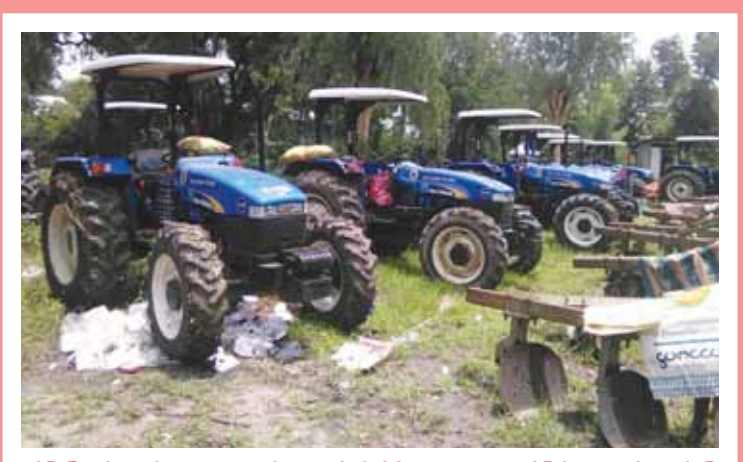
ပွင့်ဖြူမြို့နယ်အတွင်း ဒေသခံတောင်သူများ၏ စိုက်ပျိုးထားသော ရေနစ်မြုပ်သွားသည့် လယ်မြေများ အချိန်မီ ပြန်လည်ထွန်ယက်စိုက်ပျိုးနိုင်စေရန်အတွက် လယ်ထွန်စက်ကြီး ၅၈ စီးနှင့် လက်ထွန်းထွန်စက်များကို ထောက်ပံ့ပေးအပ်ရာ မြို့နယ် စက်မှုလယ်ယာစခန်းရှိရာမှူးသို့ ဩဂုတ် ၆ ရက်မှစတင်၍ အသင့်ရောက်ရှိနေပြီဖြစ်ကြောင်း သိရသည်။

အဆိုပါ စက်မှုနှင့်အသက်မွေးပညာရွေ့လျားသင်တန်းသို့ သံဖြူဇရပ်၊ မုဒုံ၊ ရေမြို့နယ်တို့မှ သင်တန်းသား ၂၀ တက်ရောက်ပြီး သင်တန်းကို ဇူလိုင် ၁၃ ရက်မှ ဩဂုတ် ၇ ရက်ထိ ရက်သတ္တလေးပတ်ကြာ ဖွင့်လှစ်သင်ကြားပေးခဲ့သည်။ ကျော်ဝင်း(မြို့နယ်မြန်/ဆက်)