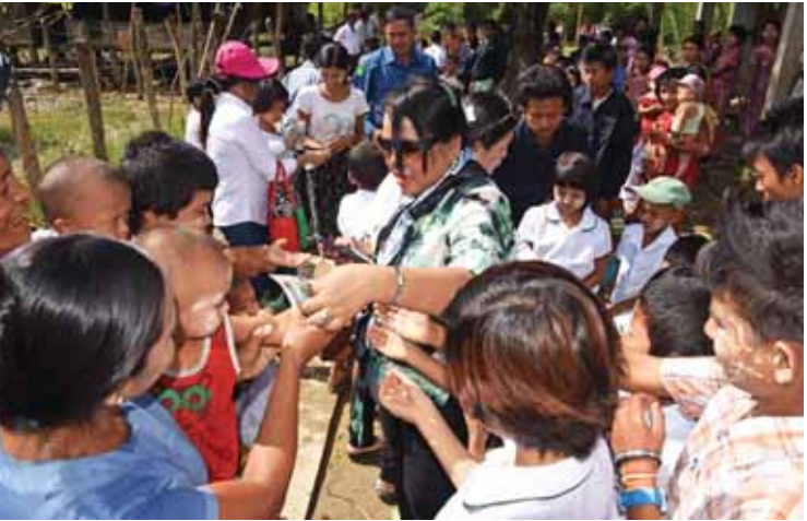
မင်းပြားမြို့နယ် ဇီးပင်ရွာတွင် အလှူရှင်များက ကလေးများအား ငွေကြေးများ လာရောက်လှူဒါန်းကြသည့်အတွက် ပျော်ရွှင်နေကြစဉ်။

အပျော်ရွှင်ဆုံးချိန်မှာ လှူဒါန်းပွဲအပြီး ပြန်အထွက်တွင် အလှူရှင်များက ပိုက်ဆံအိတ် ထဲမှ ပိုက်ဆံအထပ်လိုက်ကိုင်၍ ဆီးကြိုနေ ကြသည့် ကျောင်းသား ကျောင်းသူများနှင့် ရွာတွင်းရှိကလေးအားလုံးအား တစ်ထောင် တန်တစ်ရွက်စီ လိုက်လံပေးဝေခြင်းဖြစ် ရာ ကလေးများအားလုံး ပျော်မဆုံးသည့်