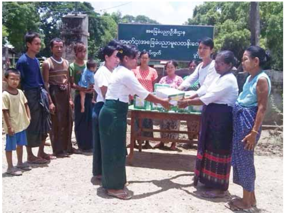
မကွေးတိုင်းဒေသကြီး ပွင့်ဖြူမြို့နယ် အမှတ်(၃) အခြေခံပညာမူလတန်းကျောင်းသို့ ပညာရေးဝန်ကြီးဌာနကိုယ်စား တာဝန်ရှိသူတစ်ဦးက ကျောင်းသုံးပလာစတစ်အိတ်များ ပေးအပ်လှူဒါန်းစဉ်။

အဆိုပါမြစ်ရေ မြင့်တက်လာမှုကြောင့် ညောင်တုန်းမြို့နယ်တွင် စိုက်ပျိုးဧက ၉၉၈၈ ဧက ရေဖုံးလွှမ်းခဲ့ပြီး ဘုန်းတော်ကြီးကျောင်း ၄၄ ကျောင်း၊ စာသင်ကျောင်းပေါင်း ၆၈ ကျောင်း ရေလွှမ်းမိုးခံခဲ့ရသည်။ ရေဘေးသင့်ဦးရေ ၄၆၇၀၃ ဦးနှင့် အိမ်ထောင်စု ၁၀၆၇၄ စု ရေဘေးသင့်ခံခဲ့ရသည်။ လက်ရှိအနေအထားတွင် ခုနစ်ရက်မြောက်နေ့အဖြစ် လိမ္မော်ရောင်အဆင့် အန္တရာယ်ရှိအနေအထားဖြင့် သတ်မှတ်ထားဆဲဖြစ်ကြောင်း သိရသည်။ ထွန်းကျော်(ညောင်တုန်း)