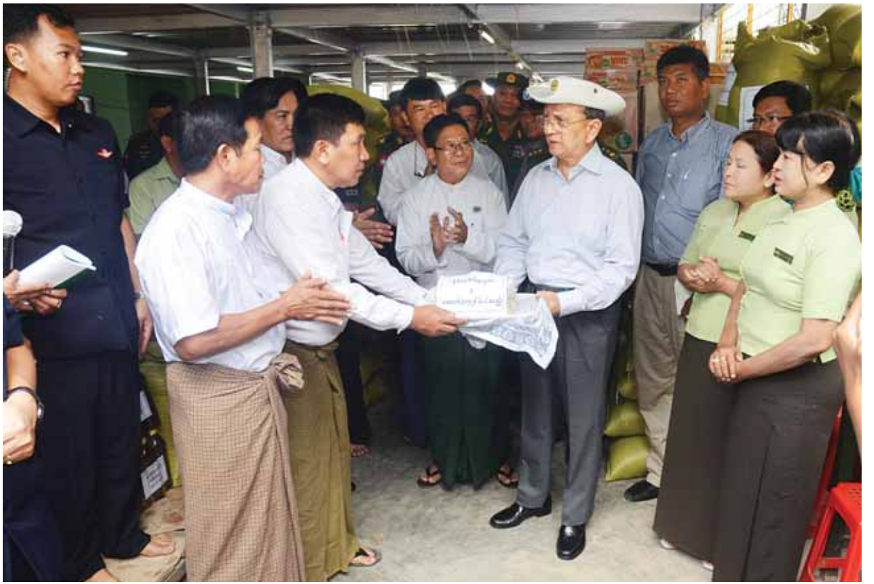
အခြေအနေတို့ကို ရှင်းလင်းတင်ပြသည်။ ရှင်းလင်းတင်ပြချက်များအပေါ် နိုင်ငံတော်သမ္မတက လက်ရှိနဝင်းတာကို ထူးကဲမြစ်ကြေးမုံမှ ကာကွယ်နိုင်ရန်အတွက် အမြင့်ပေကို တိုးမြှင့်တည်ဆောက်ပေးရမည်ဖြစ်ကြောင်း၊ နဝင်းချောင်းအနီးရှိ လော့သော့ချောင်းမှ

ပဲခူးတိုင်းဒေသကြီး ပြည်မြို့၌ ရောက်ရှိနေသော နိုင်ငံတော်သမ္မတ ဦးသိန်းစိန်သည် ပြည်ထောင်စုဝန်ကြီးများ၊ တိုင်းဒေသကြီးဝန်ကြီးချုပ်၊ ကာကွယ်ရေးဦးစီးချုပ်ရုံး(ကြည်း)မှ ဒုတိယဗိုလ်ချုပ်ကြီးကျော်ဆွေ၊ ဒုတိယ ဝန်ကြီးများ၊ တာဝန်ရှိသူများနှင့်အတူ ယနေ့နံနက်ပိုင်းတွင် ပြည်မြို့ရွှေပလ္လင်မှော် စေတီတော်ဓမ္မာရုံ၌ ဖွင့်လှစ်ထားသည့် ရေဘေးကယ်ဆယ်ရေးစခန်းသို့ သွား ရောက်ပြီး ရေဘေးသင့်ပြည်သူများအား တွေ့ဆုံအားပေးသည်။(အောက်ပုံ)