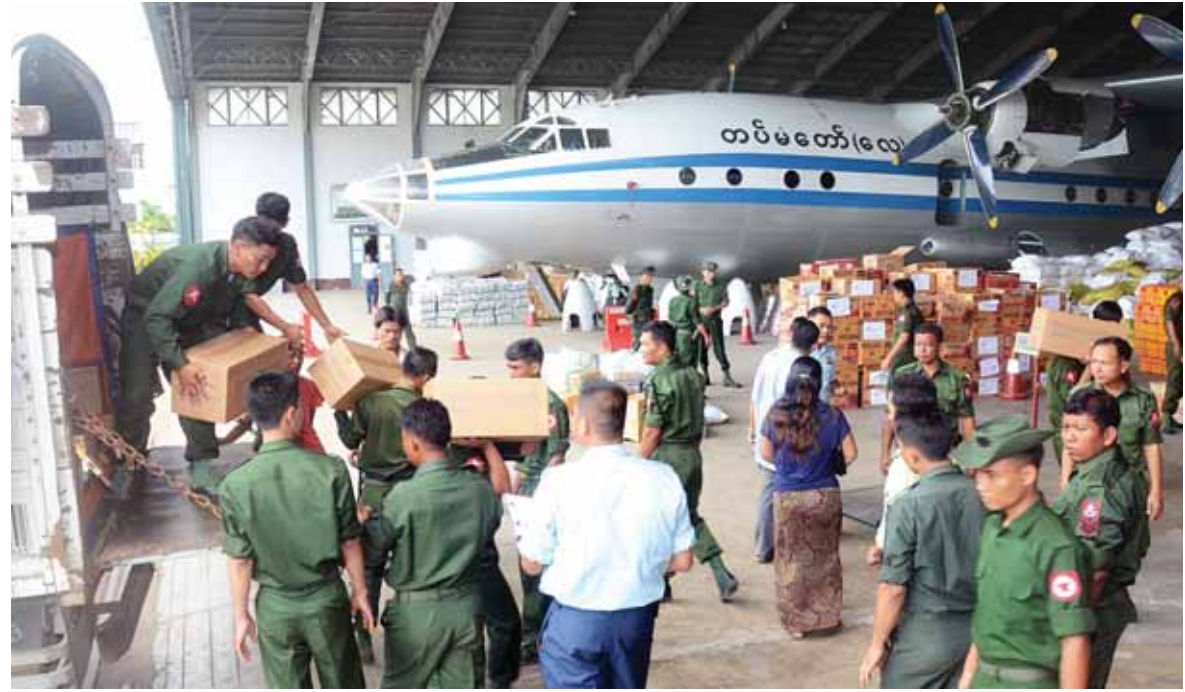
ရန်ကုန်မင်္ဂလာဒုံလေတပ်စခန်းဌာနချုပ်တွင် ရေဘေးသင့်ပြည်သူများအတွက် ထောက်ပံ့ပစ္စည်းများကို ပို့ဆောင်ပေးနိုင်ရန် တပ်မတော်သားများ၊ ရဲတပ်ဖွဲ့ဝင်များ ပြင်ဆင်ဆောင်ရွက်ပေးနေစဉ်။

နေပြည်တော် ဩဂုတ် ၁၀ သဘာဝဘေးအန္တရာယ် ကြုံတွေ့နေရသည့် ရေဘေးသင့်ဒေသများရှိ ပြည်သူများထံသို့ တပ်မတော်နှင့် ပြည်တွင်း ပြည်ပလေကြောင်းလိုင်းများမှ လေယာဉ်များဖြင့် ကယ်ဆယ်ရေးပစ္စည်းများ ပေးပို့ထောက်ပံ့လျက်ရှိသည်။ ပို့ဆောင်ရေး ဝန်ကြီးဌာနသည် ပြည်တွင်း လေကြောင်းလိုင်းမှ လေယာဉ်များဖြင့် ကယ်ဆယ်ရေးနှင့် ထောက်ပံ့ပစ္စည်းများ ပို့ဆောင်ပေးလျက်ရှိရာ ဩဂုတ် ၁၀ ရက်တွင် ရခိုင်ပြည်နယ် စစ်တွေလေဆိပ်သို့ မြန်မာအမျိုးသား လေကြောင်းမှ ခေါက်ရေတစ်ခေါက်ဖြင့် ရေဘေးသင့်ပြည်သူများအတွက် လျှာဒါန်းသည် လူသုံးကုန်ပစ္စည်း၊ ရေသန့်ဆေး၊ ဆေးဝါးမျိုးစုံ၊ အဝတ်အထည်မျိုးစုံ၊ မုန့်မျိုးစုံ၊ ကယ်ဆယ်ရေးပစ္စည်းနှင့် စာမျက်နှာ ၄ ကော်လံ ၂ သို့