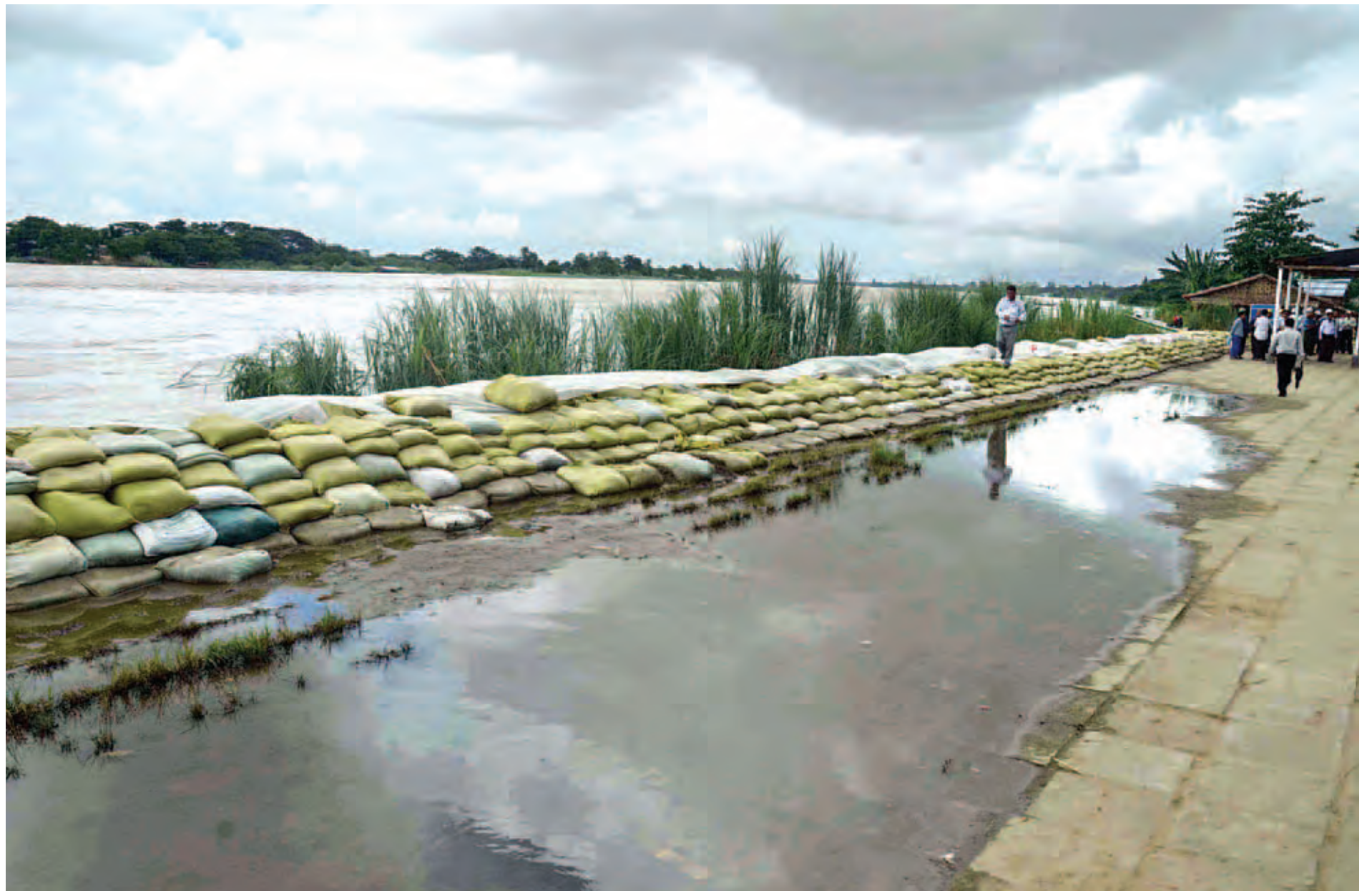
ညောင်တုန်းမြို့ မြစ်ကမ်းထိန်းတာအား ရေဝင်ရောက်မှုမရှိစေရန် သဲအိတ်များဖြင့် တာပေါင်မြင့်တင်ခြင်းလုပ်ငန်း ဆောင်ရွက်ထားမှုကို တွေ့ရစဉ်။ (သတင်းစဉ်)

ထိုမှတစ်ဆင့် နိုင်ငံတော်သမ္မတနှင့်အဖွဲ့ဝင်များသည် တိုင်းဒေသကြီးဝန်ကြီးချုပ်၊ တိုင်းမှူးတို့နှင့်အတူ ဧရာဝတီ တိုင်းဒေသကြီးအတွင်း ရေကြီးရေလျှံမှုဖြစ်ပွားလျက်ရှိသည့် ဒေသများသို့ ရဟတ်ယာဉ်များဖြင့် သွားရောက် ကြည့်ရှုအားပေးသည်။ ရှေးဦးစွာ နိုင်ငံတော်သမ္မတသည် ညောင်တုန်းမြို့သို့ရောက်ရှိပြီး အရှည်နှစ်မိုင်ရှိသည့် မြို့မြစ်ကမ်းထိန်းတာအား ဒေသခံပြည်သူများနှင့် တပ်မတော်သားများက မြို့တွင်းသို့ ရေဝင်ရောက်မှုမရှိစေရန် သဲအိတ်များဖြင့် တာပေါင်မြင့်တင် ခြင်းလုပ်ငန်းဆောင်ရွက်နေမှုများကို ကြည့်ရှုပြီး ရင်းရင်းနှီးနှီးနှုတ်ဆက်သည်။ စာမျက်နှာ ၃ ကော်လံ ၁ သို့