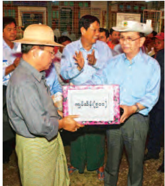
နိုင်ငံတော်သမ္မတ ဦးသိန်းစိန် ရေဘေးသင့်ပြည်သူများအတွက် အလှူငွေ ကျပ် သိန်း ၅၀၀ ကို တိုင်းဒေသကြီးဝန်ကြီးချုပ် ပေးအပ်စဉ်။(သတင်းရှေ့ဖုံး) (သတင်းစဉ်)