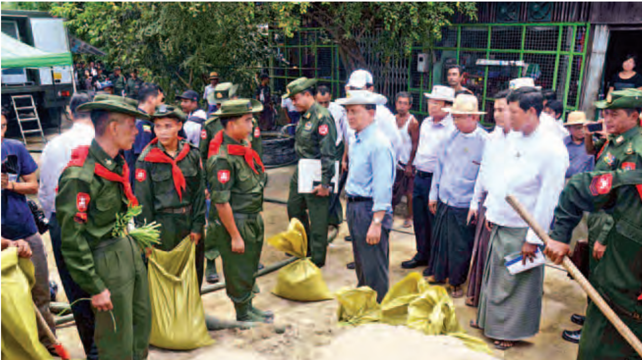
နိုင်ငံတော်သမ္မတ ဦးသိန်းစိန် ညောင်တုန်းမြို့တွင် ဒေသခံပြည်သူများနှင့် တပ်မတော်သားများက ရေဝင်ရောက်မှုမရှိစေရန် သဲအိတ်များဖြင့် တာပေါင်မြင့်တင်ခြင်းလုပ်ငန်း ဆောင်ရွက်နေမှုကို ကြည့်ရှုအားပေးစဉ်။ (သတင်းရှေ့ဖုံး)