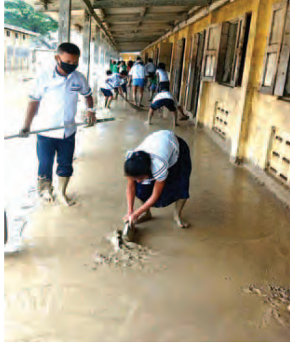
စစ်ကိုင်းတိုင်းဒေသကြီးအတွင်းရှိ ရေဘေးသင့်အခြေခံပညာကျောင်းများ သန့်ရှင်းရေးများ ပြန်လည်ပြုလုပ်နေစဉ်။ (ပညာရေး)