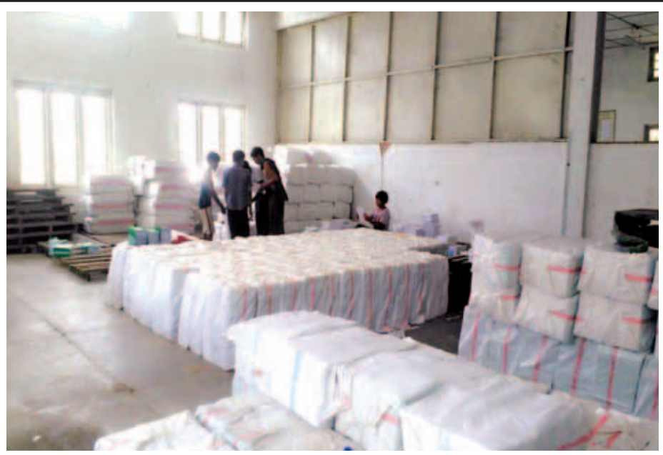
တိုင်းဒေသကြီးနှင့် ပြည်နယ်များရှိ ရေဘေးသင့်ကျောင်းသားကျောင်းသူများအား ထောက်ပံ့မည့် ကျောင်းသုံးပုံနှိပ်စာအုပ်များနှင့် ဗဟုစာအုပ်များ ပြန်ဝေရန် စီစဉ်နေစဉ်။ (ပညာရေး)