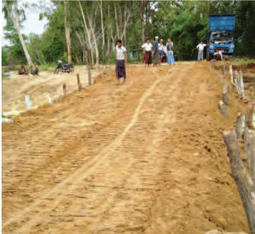
နံ့ထက်ရှင်

အဆိုပါရေတိုက်စားသည့်နေရာသို့ မြို့နယ်အုပ်ချုပ်ရေးမှူးနှင့် ဌာနဆိုင်ရာများကြီးကြပ်၍ လမ်းပိုင်းဌာနမှ ဦးဆောင်မှုဖြင့် လမ်းပန်းဆက်သွယ်မှု မပြတ်တောက်စေရန် ချက်ချင်းစီစဉ် ဆောင်ရွက်ခဲ့သည်။ မြို့နယ်(မြန်/ဆက်)