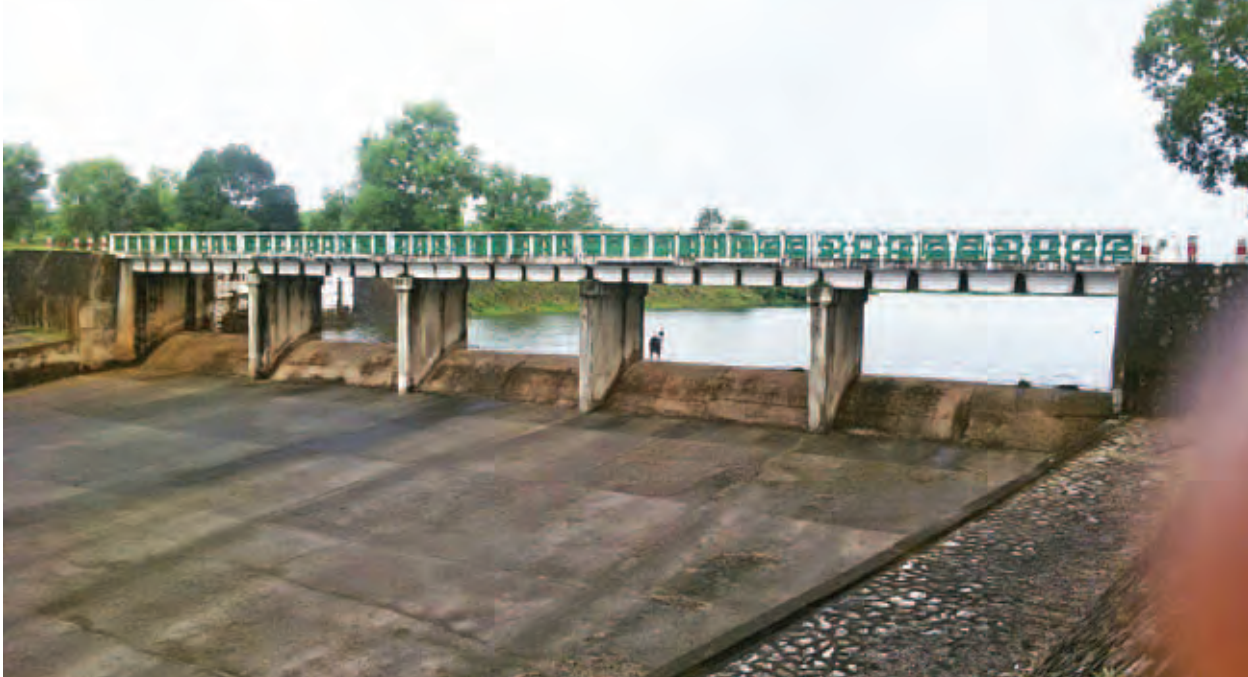
ရန်ကုန်တိုင်းဒေသကြီး လှည်းကူးမြို့နယ်ရှိ ငမိုးရိပ်ဆည် ရေသိုလှောင်မှုပမာဏပြည့်မီခြင်းမရှိသေးသည့်ကို တွေ့ရစဉ်။