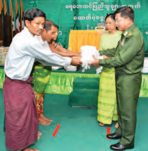
တပ်မတော်ကာကွယ်ရေးဦးစီးချုပ် ဗိုလ်ချုပ်မှူးကြီးမင်းအောင်လှိုင် မင်းပြားမြို့ရေဘေးသင့်ပြည်သူများအား စားသောက်ဖွယ်ရာများ ပေးအပ်စဉ်။ (မြဝတီ)

ထိခိုက်မှုမရှိစေရန် ဦးစားပေးလုပ်ဆောင်နေကြောင်း၊ ရခိုင်ပြည်နယ်အတွင်း လယ်မြေဧက ၆၀၀၀ ကျော် ရေခဲမြုပ်ပျက်စီးခဲ့၍ မိုးစပါးများ ရရှိရေး ကူညီဆောင်ရွက်သွားမည်ဖြစ်ကြောင်း၊ ၎င်းအပြင်နယ်မြေဒေသအတွင်း ဆန်နှင့်စားသောက်ကုန်ပစ္စည်းများ ဈေးနှုန်းကြီးမြင့်မှုမရှိစေရေး ပိုင်းဝန်းဆောင်ရွက်သွားမည်ဖြစ်ကြောင်း၊ ဒေသအတွင်း ဆန်ပြတ်လပ်မှုမရှိစေရေးအတွက် တပ်မတော်မှ စုပုံထားသည့် ရိက္ခာဆန်များ ဖြန့်ဝေပေးလျက်ရှိပြီး တပ်မတော်ကုန်တင်လေယာဉ်သုံးစင်းဖြင့် ရန်ကုန်မှ ဆန်များ ပို့ဆောင်ပေးနေကြောင်း၊ ပြည်သူလူထု နိုင်ငံတော်အစိုးရနှင့်