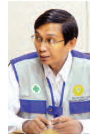
ဒေါက်တာထွန်းတင်။