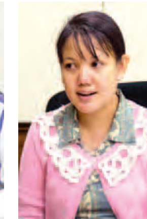
ဒေါက်တာတိုးသိရီအောင်။

နိုင်ငံတော်သမ္မတသည် ရေကြီးရေလျှံမှုနှင့် မြေပြိုမှုများ ဖြစ်ပေါ်ခဲ့သည့် ချင်းပြည်နယ်၊ စစ်ကိုင်းတိုင်းဒေသကြီး၊ မကွေးတိုင်းဒေသကြီးနှင့် ရခိုင်ပြည်နယ်များကို သဘာဝဘေးအန္တရာယ်ကျရောက်သော ဒေသများအဖြစ်ကြေညာပြီး ကယ်ဆယ်ရေး၊ ထောက်ပံ့ရေးနှင့် ပြန်လည်နေရာချထားရေးလုပ်ငန်းများကို အင်တိုက်အားတိုက် ဆောင်ရွက်ပေးလျက်ရှိသည်။