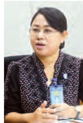
ဒေါက်တာသီတာလှ။