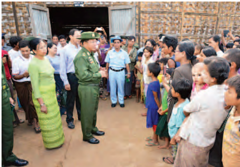
တပ်မတော်ကာကွယ်ရေးဦးစီးချုပ် ဗိုလ်ချုပ်မှူးကြီး မင်းအောင်လှိုင် ပွင့်ဖြူမြို့ ရေဘေးသင့်ပြည်သူများအား ရင်းရင်းနှီးနှီး နှုတ်ဆက်အားပေးစကားပြောကြားစဉ်။

နေပြည်တော် ဩဂုတ် ၃ တပ်မတော်ကာကွယ်ရေးဦးစီးချုပ် ဗိုလ်ချုပ်မှူးကြီး မင်းအောင်လှိုင်နှင့် အဖွဲ့သည် ယမန်နေ့မှန်းလွဲပိုင်းတွင် ရခိုင်ပြည်နယ်မှတစ်ဆင့်မကွေးတိုင်းဒေသကြီးအတွင်းရှိ ရေကြီးရေလျှံမှု ဖြစ်ပွားနေသော ပွင့်ဖြူမြို့သို့ ရောက်ရှိကြရာ မကွေးတိုင်းဒေသကြီး ဝန်ကြီးချုပ် ဦးဘုန်းမော်ရွှေ အလယ်ပိုင်းတိုင်းစစ်ဌာနချုပ်တိုင်းမှူး ဗိုလ်ချုပ် စိုးထွဋ်နှင့်တာဝန်ရှိသူများက ကြိုဆိုကြသည်။