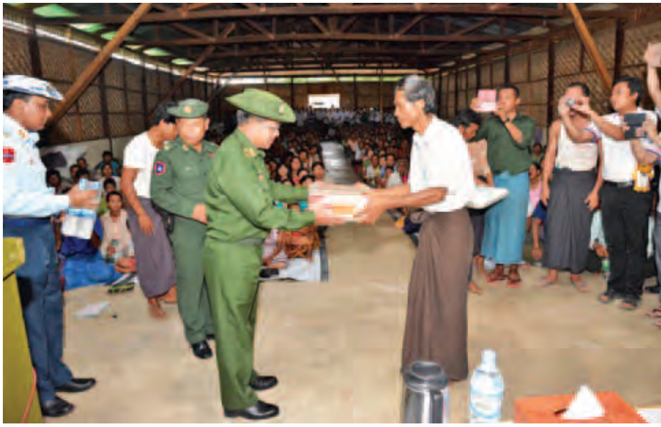
တပ်မတော်ကာကွယ်ရေးဦးစီးချုပ် ဗိုလ်ချုပ်မှူးကြီး မင်းအောင်လှိုင် ပွင့်ဖြူမြို့ ရေဘေးသင့်ပြည်သူများအား စားသောက်ဖွယ်ရာများပေးအပ်စဉ်။

များသည် ညနေပိုင်းတွင် ပွင့်ဖြူမြို့နယ်မှတစ်ဆင့် စေတုတ္ထရာမြို့နယ်သို့ သွားရောက်၍ နယ်မြေခံတပ်ရင်း