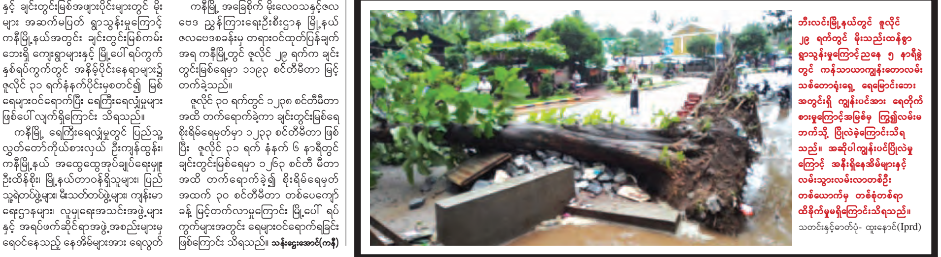
ဘီးလင်းမြို့နယ်တွင် ဇူလိုင် ၂၉ ရက်တွင် မိုးသည်းထန်စွာ ရွာသွန်းမှုကြောင့် ညနေ ၅ နာရီခွဲတွင် ကန်သာယာကျွန်းတောင်လမ်း သစ်တောရုံးရှေ့ ရေမြောင်းဘေး အတွင်းရှိ ကျွန်းပင်အား ရေတိုက်စားမှုကြောင့် အမြစ်မဲ့ ကြွ၍ လမ်းမဘက်သို့ ပြိုလဲခဲ့ကြောင်း သိရသည်။ အဆိုပါကျွန်းပင်ပြိုလဲမှုကြောင့် အနီးရှိနေအိမ်များနှင့် လမ်းသွားလမ်းလာတစ်ဦး တစ်ယောက်မှ တစ်စုံတစ်ရာ ထိခိုက်မှုမရှိကြောင်း သိရသည်။

ပခုက္ကူ မြို့နယ်၌ သဘာဝရေဘေးမှ ပြောင်းရွှေ့နေထိုင်ရန် ကြိုတင်စီစဉ်ထားရှိပေး