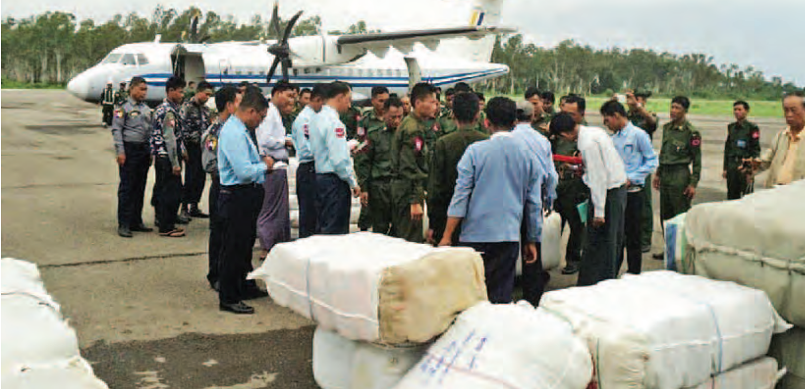
ကလေးမြို့ ရေဘေးသင့်ပြည်သူများအတွက်ပို့ဆောင်မည့် ကယ်ဆယ်ရေးပစ္စည်းများကို တွေ့ရစဉ်။ (သတင်း စာမျက်နှာ-၈)

ကလေးခရိုင်အတွင်း မိုးအဆက်မပြတ်ရွာသွန်းသဖြင့် ရေဘေးသင့်ပြည်သူ ၈၀၀၀ ကျော်ရှိ ရဟတ်ယာဉ် လေယာဉ်များအသုံးပြုပြီး ကူညီထောက်ပံ့ရေး နေ့စဉ်ဆောင်ရွက်