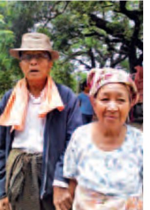
ဦးတင်နှင့် ဇနီး

ကို သွားရောက်ကယ်ဆယ်မှုတွေလုပ်နေ တယ်။ ကယ်ဆယ်ရေးအတွက် အသုံး ပြုမယ့် တပ်မတော်က speed boat တွေလည်း ရောက်နေပါပြီ။ ပြီးတော့ ပဲ့တောင်တွေနဲ့လည်း ကယ်ဆယ်ရေး အတွက် ဆောင်ရွက်နေပါတယ်။