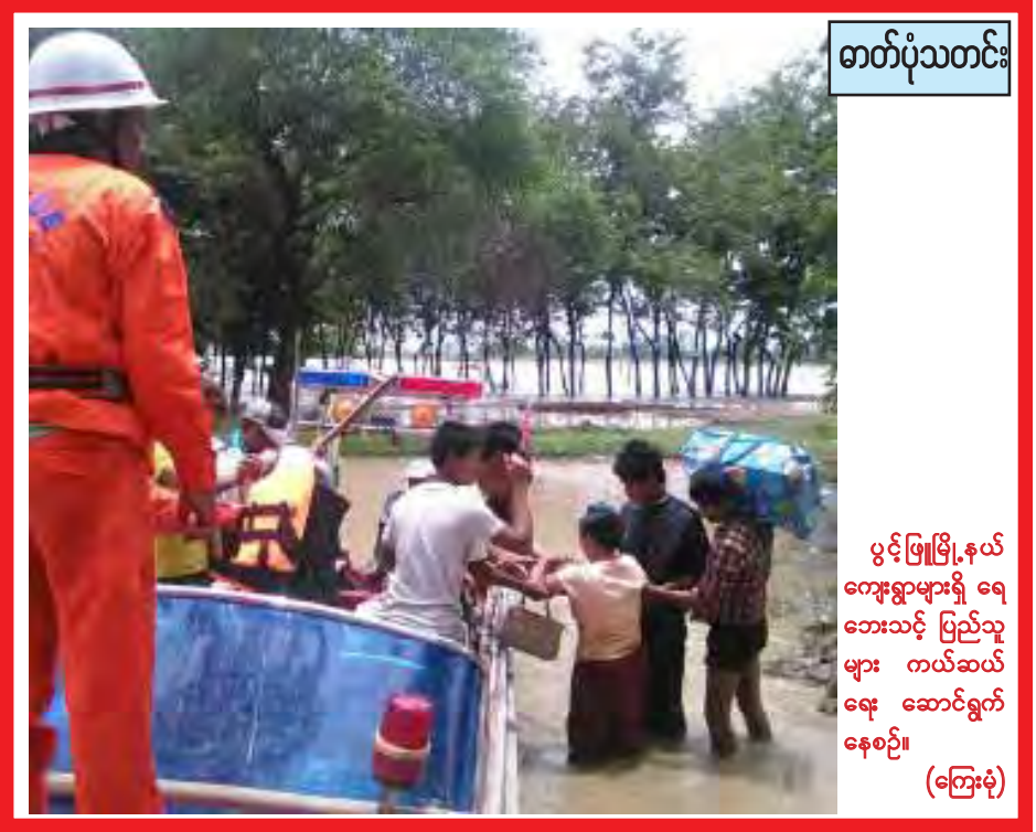
ဓာတ်ပုံသတင်း