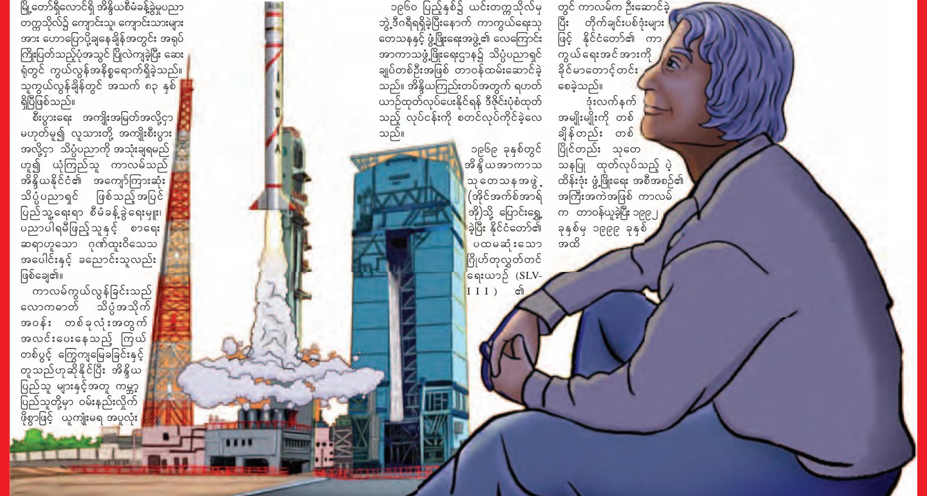
၁၉၆၉ ခုနှစ်တွင် အိန္ဒိယအာကာသ သုတေသနအဖွဲ့ (အိုင်အက်စ်အာရ်အို)သို့ ပြောင်းရွှေ့ခဲ့ပြီး နိုင်ငံတော်၏ ပထမဆုံးသော ဂြိုဟ်တုလွှတ်တင်ရေးယာဉ် (SLV-III) ၏

အစ္စလာမ် ဘာသာဝင် ကာလမ်သည် အတွေးအမြင်များကို ပေးစွမ်းသော စာအုပ်များအပြားကိုလည်း ရေးသားပြုစုခဲ့သည်။ သူ၏ “India 2020” အမည်ရှိ စာအုပ်မှာ အထူးကျော်ကြားလှပြီး ၂၀၂၀ ပြည့်နှစ်ထက် နောက်မကျဘဲ အိန္ဒိယနိုင်ငံအား ဖွံ့ဖြိုးပြီးနိုင်ငံအဖြစ်သို့ ထူထောင်ရန် မျှော်မှန်းချက်ကို ရေးဖွဲ့ထားလေသည်။