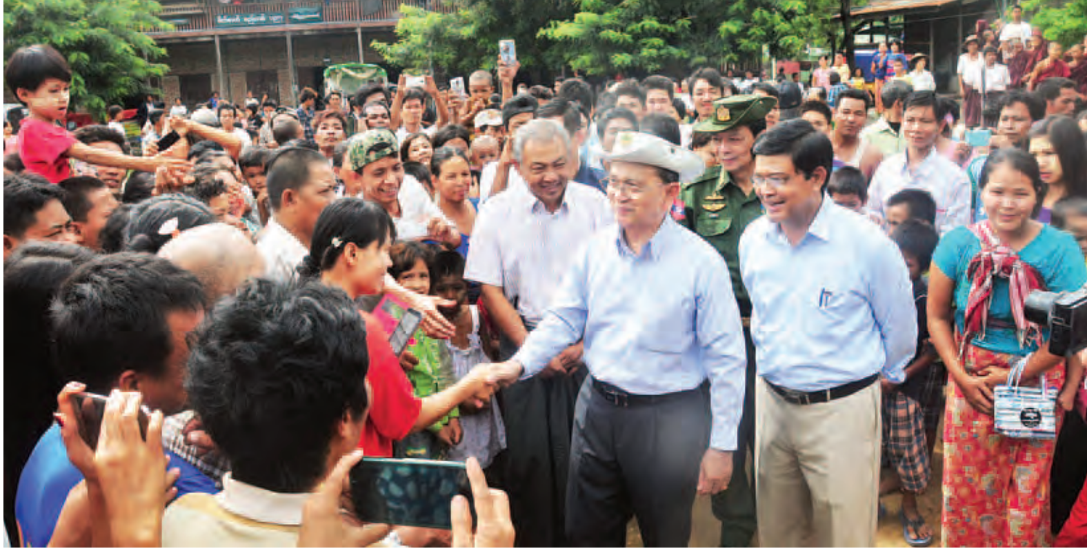
နိုင်ငံတော်သမ္မတ ဦးသိန်းစိန်နှင့် ဒုတိယသမ္မတ ဦးညွှန်ထွန်းတို့ ကလေးမြို့ အမှတ်(၅)ရေဘေးကယ်ဆယ်ရေးစခန်းရှိ ရေဘေးသင့်ပြည်သူများအား တွေ့ဆုံအားပေးစကားပြောကြားစဉ်။ (သတင်းစဉ်)

လုပ်ငန်းများ ဆောင်ရွက်ပေးရန်တို့ကို ဦးစားပေးဆောင်ရွက်လိုကြောင်း၊ ပျက်စီးသွားသော လယ်ယာမြေများ ပြန်လည်ဖော်ထုတ်ရန်၊ စိုက်ပျိုးမွေးမြူ ရေးလုပ်ငန်းများ ဆောင်ရွက်ရန် အတွက် ရေရှည်စီမံချက်ဖြင့် ဆောင် ရွက်သွားရန်လိုကြောင်း။ ရေကျပြီးနောက် မိမိတို့ကျေးရွာ များသို့ ပြန်သွားချိန်တွင် လိုအပ်မည့် ခိုကွာ၊ မျိုးစပါးစသည်များကို တွက်ချက် ထောက်ပံ့ပေးရန် လိုကြောင်း၊ တိုင်းဒေသကြီး အစိုးရအနေဖြင့် လိုအပ်သည့် ငွေကြေးပမာဏကို တွက်ချက်တင်ပြရန်နှင့် ပြည်ထောင်စု အစိုးရအနေဖြင့် လိုအပ်သည့်ပံ့ပိုးပေး မည်ဖြစ်ကြောင်း၊ စစ်ကိုင်းတိုင်းဒေသကြီး နှင့် ဆက်စပ်နေသည့် ချင်းပြည်နယ် တွင်လည်း တောင်ပြိုမှုများဖြစ်နေ သဖြင့် ဆက်သွယ်ရေးလမ်းကြောင်း ပွင့်အောင် အမြန်ဆောင်ရွက်ပြီး ဆန်နှင့်ရိက္ခာများ အမြန်ပေးပို့ရန် ဆောင်ရွက်သွားမည်ဖြစ်ကြောင်း၊ မိမိတို့အနေဖြင့် ကလေးခရိုင်အတွက် သာမက နိုင်ငံတစ်ဝန်းရှိ သဘာဝဘေး ဒဏ်ခံစားနေရသည့် ပြည်သူများ ကို အစွမ်းကုန် ကူညီသွားမည် ဖြစ်ကြောင်းဖြင့် မှာကြားသည်။