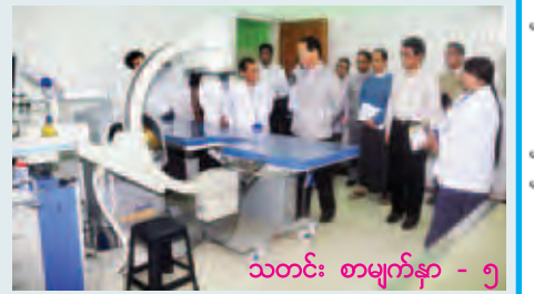
သတင်း စာမျက်နှာ - ၅

ကလေးခရိုင်အတွင်း မိုးအဆက်မပြတ်ရွာသွန်းသဖြင့် ရေဘေးသင့်ပြည်သူ ၈၀၀၀ ကျော်ရှိ ရဟတ်ယာဉ် လေယာဉ်များအသုံးပြုပြီး ကူညီထောက်ပံ့ရေး နေ့စဉ်ဆောင်ရွက်