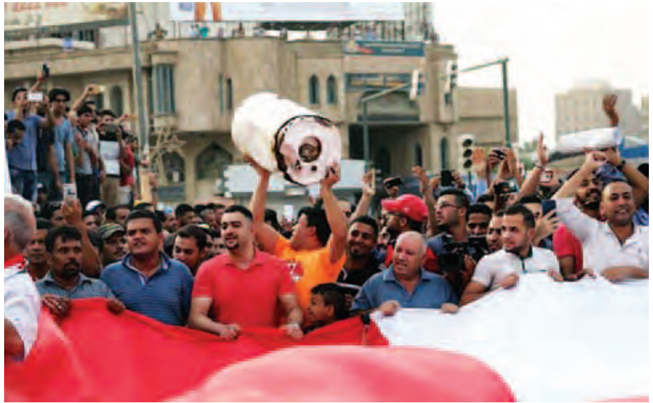
အစိုးရအဖွဲ့အစည်းများ၏ အဆောက်အအုံများကို သို့သော် ဘဂ္ဂဒတ်မြို့တော်လမ်းများပေါ်မှ ဆန္ဒပြသူ လျှပ်စစ်မီးဖြတ်တောက်ရန် အမိန့်ပေးခဲ့သည်။ များက ဒေါသထွက်နေကြဆဲဖြစ်သည်။ ရိုက်တာ။