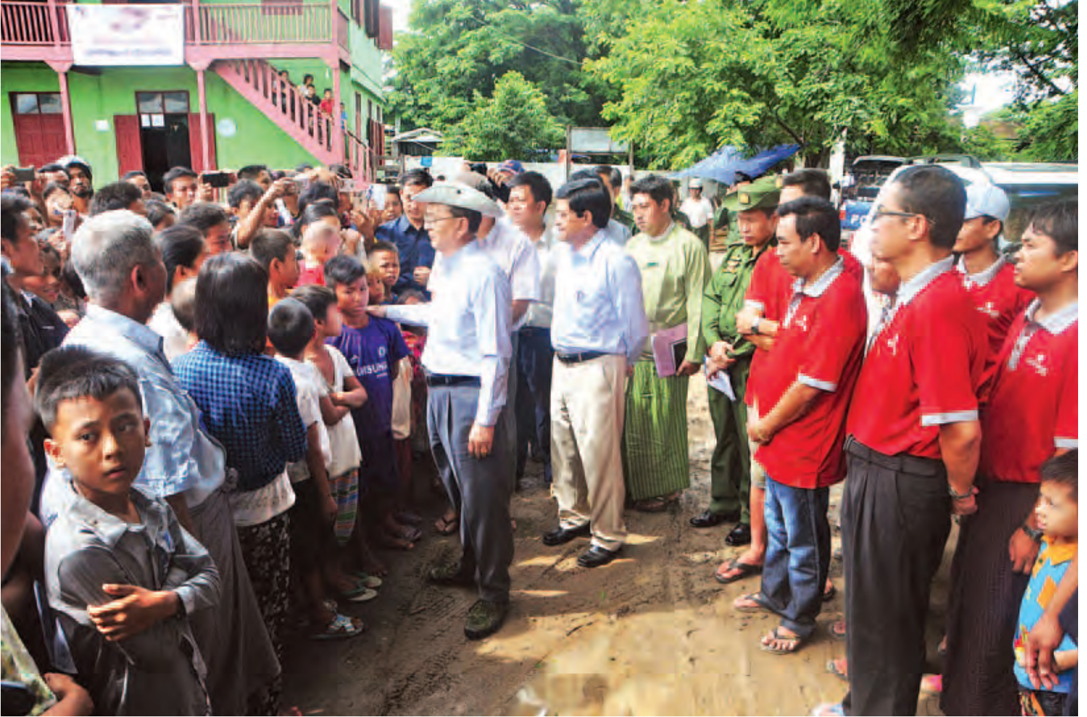
နိုင်ငံတော်သမ္မတ ဦးသိန်းစိန်နှင့် ဒုတိယသမ္မတ ဦးညွှန်ထွန်းတို့ ကလေးမြို့ အမှတ်(၄)ရေဘေးကယ်ဆယ်ရေးစခန်းရှိ ရေဘေးသင့်ပြည်သူများအား တွေ့ဆုံအားပေးစကားပြောကြားစဉ်။ (သတင်းစဉ်)

စစ်ကိုင်းတိုင်းဒေသကြီး ကလေး မြို့ရှိ ဌာနဆိုင်ရာတာဝန်ရှိသူများ၊ မြို့မိမြို့ဖများနှင့် တွေ့ဆုံရာတွင် လည်းကောင်း၊ ကယ်ဆယ်ရေးစခန်း များမှ ရေဘေးသင့်ပြည်သူများနှင့် တွေ့ဆုံအားပေးရာတွင်လည်းကောင်း နိုင်ငံတော်သမ္မတက ပြောကြားရာတွင် ကလေးခရိုင်အတွင်း နှစ်ပေါင်း တစ်ရာကျော်အတွင်း မကြုံစဖူး ရေလွှမ်းမိုးမှုဖြစ်စဉ် ပေါ်ပေါက်ခဲ့ခြင်း ကြောင့် မိမိတို့တိုင်လာရောက် ကူညီအားပေးခြင်းဖြစ်ကြောင်း၊ ပြီးခဲ့ သည့်နှစ်ရက်တွင် ရာသီဥတုဆိုးရွား မှုကြောင့် လေယာဉ်၊ ရဟတ်ယာဉ်များ ဆင်းသက်နိုင်ခြင်းမရှိကြောင်း၊ ယနေ့ ရာသီဥတုကောင်းမွန်သည်နှင့် မိမိ