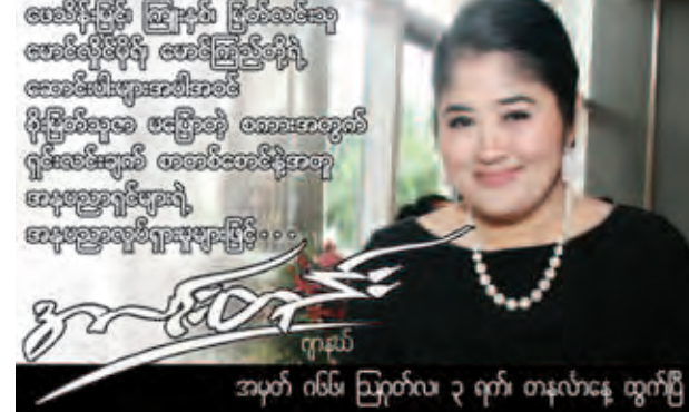
အမှတ် ၀၆၆၊ ဩဂုတ်လ ၃ ရက်၊ တနင်္လာနေ့ ထွက်ပြီ

မြောက်ဦးမြို့နယ်အသင်း (ရန်ကုန်) နဝမအကြိမ်မြောက် စုပေါင်းဝါဆိုသင်တန်းကပ်လှပွဲနှင့် ပညာရည်ချွန်ဆုပေးပွဲကို ကျင်းပပြုလုပ်မည် ဖြစ်ပါ၍ အသင်းဝင်များနှင့် မြို့နယ်သူ/နယ်သားများအားလုံး ကြွရောက်ကြပါရန် ဖိတ်ကြားအပ်ပါသည်။