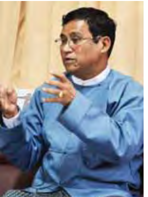
ဦးစိုးအောင် အမြဲတမ်းအတွင်းဝန်။

ကန့်ဘလူ၊ ကောလင်း၊ ကျွန်းလှဘက်မှာဖြစ်တဲ့ ရေကြီး၊ ရေလျှံမှု