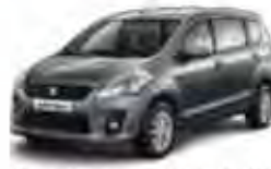
Granite Grey Metallic (ZTN)