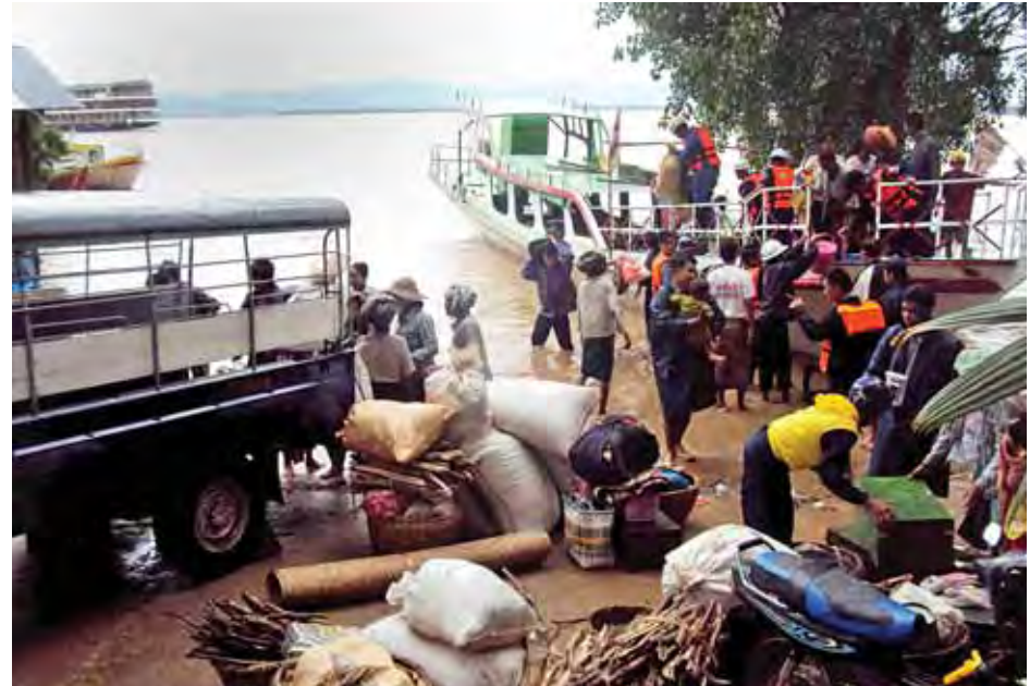
ဧရာဝတီမြစ်ရေမြင့်တက်မှုကြောင့် ညောင်ဦးမြို့နယ် ရေဘေးသင့်ကျေးရွာများတွင် ကူညီကယ်ဆယ်ရေး လုပ်ငန်းများ ဆောင်ရွက်နေသည်ကို ဇူလိုင် ၃၁ ရက်က တွေ့ရစဉ်။ (သတင်း စာမျက်နှာ - ၈) ရဲသူရအောင် (ညောင်ဦး)

သဘာဝဘေးဒဏ် ခံရသူများကို ကူညီ စာမျက်နှာ >> ၂ ဟင်္သာတ၊ ကလေးဝ၊ ဘားအံ၊ မဒေါက်နှင့် ငါးသိုင်းချောင်း မြို့များ စိုးရိမ်ရေပွတ်ကျော် စာမျက်နှာ >> ၃ ဆိုင်ကလုန်းပုန်တိုင်း ရိုက်ခတ်မှုအရှိန်ကြောင့် ရခိုင်ပြည်နယ်အတွင်း လေပြင်းများတိုက်ခတ် စာမျက်နှာ >> ၉