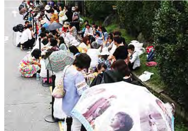
ဘေရောင်ဂျွန်းနဲ့ ပက်ဆိုးဂျင်တို့ရဲ့လက်ထပ်ပွဲ နေကြစဉ်။

ခြင်းဖြစ်သည်။ ၎င်းရုပ်ရှင်တွင် အသက်(၂၅) နှစ်ရှိပြီဖြစ်သော မင်းသမီးသည် ယောက်ျားပီသခန့်ညားသည့် အမျိုး သား တစ်ဦး၏စိတ်ကို ပုံပေါ်အောင် သရုပ်ဆောင်ထားသည်။ပတ်ရှင်ဟေး သည် ၂၀၀၉ခုနှစ်တွင် SBS ရုပ်သံ လိုင်းက ထုတ်လွှင့်ပြသခဲ့သော "You're Beautiful" ရုပ်ရှင်တွင် လည်း ယောက်ျားလေးတစ်ဦးအဖြစ် သရုပ်ဆောင်ခဲ့ဖူးသည်။