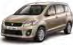
Ecu Beige Metallic (ZPY)