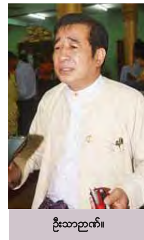
ဦးသာဉာဏ်။

ထိုသို့ တွေ့ဆုံရာတွင် မြန်မာနိုင်ငံတွင် ၂၀၁၅ ခုနှစ်တွင် ကျင်းပမည့် ရွေးကောက်ပွဲတွင် အမျိုးသမီးများ ဆန္ဒမဲပေးရာတွင် ပိုမိုပါဝင်နိုင်ရေး၊ လက်ရှိအခြေခံမဲဆန္ဒရှင်စာရင်း ကြေညာထားရှိမှုအခြေအနေ၊ ရောင်ခြည်သစ်အဖွဲ့အစည်းမှ မြန်မာနိုင်ငံတစ်ဝန်းတွင် ဆောင်ရွက်နေသည့် အမျိုးသမီးခေါင်းဆောင်မှုနှင့် ရွေးကောက်ပွဲအသိပညာပေးသင်တန်းဆိုင်ရာကိစ္စရပ်များကို ဆွေးနွေးခဲ့ကြောင်း သိရသည်။