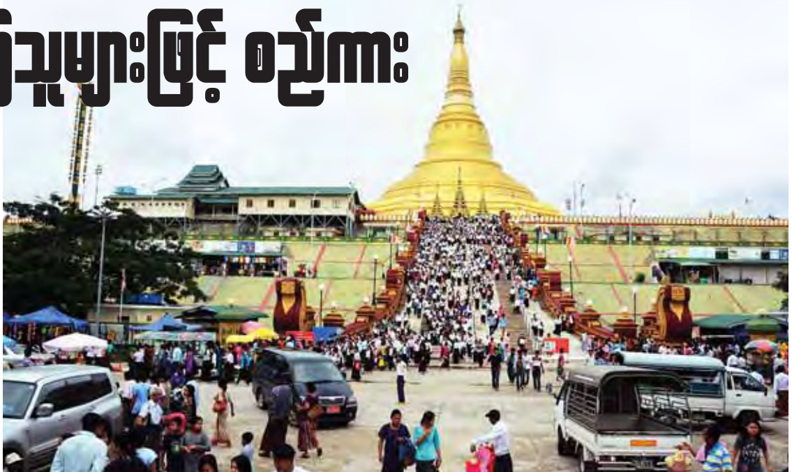
ဝါဆိုလပြည့်(ဓမ္မစကြာအခါတော်နေ့) တွင် ဥပ္ပါတသန္တိဓေတီတော်မြတ်ကြီး၌ ဘုရားဖူးများဖြင့် စည်ကားလျက်ရှိသည်ကို တွေ့ရစဉ်။ (သတင်းစဉ်)

နေပြည်တော် ဇူလိုင် ၃၁ “သန္တေ၊ တောထွက်၊ ဓမ္မစက်၊ နှုတ်မြွက် သံချို လဝါဆို” ဆိုသည့်အတိုင်း ဝါဆိုလပြည့်နေ့သည် ဗုဒ္ဓဘာသာဝင်တို့၏ အထွတ်အမြတ်ထားရာ ဂေါတမမြတ်စွာဘုရားရှင် ပဋိသန္ဓေ ယူတော်မူသောလ၊ တောထွက်တော်မူသောလ၊ ဓမ္မစကြာတရားဦးဟောတော်မူသောလ ဤနေ့ထူးနေ့မြတ် ဂုဏ်သုံးထပ်နှင့် ပြည့်စုံပေသည်။ ထို့ပြင် ဝါဆိုလပြည့်နေ့ကို ဓမ္မစကြာအခါတော်နေ့အဖြစ် သတ်မှတ်ကာ ဝတ်အသင်းအဖွဲ့များက ဓမ္မစကြာတရားတော်မြတ်ကို ရွတ်ဖတ်ပူဇော်ခြင်း၊ ရဟန်းခံခြင်း၊ ဝါဆိုသင်္ကန်းနှင့် ဝါဆိုပန်းများကို ကပ်လှူပူဇော်ခြင်း၊ တရားဘာဝနာပွားများ ကျင့်ကြံအားထုတ်ခြင်း၊ ဒါနပြု ကုသိုလ်ယူ သီလဆောက်တည်ခြင်း စာမျက်နှာ ၅ ကော်လံ ၄ သို့ □