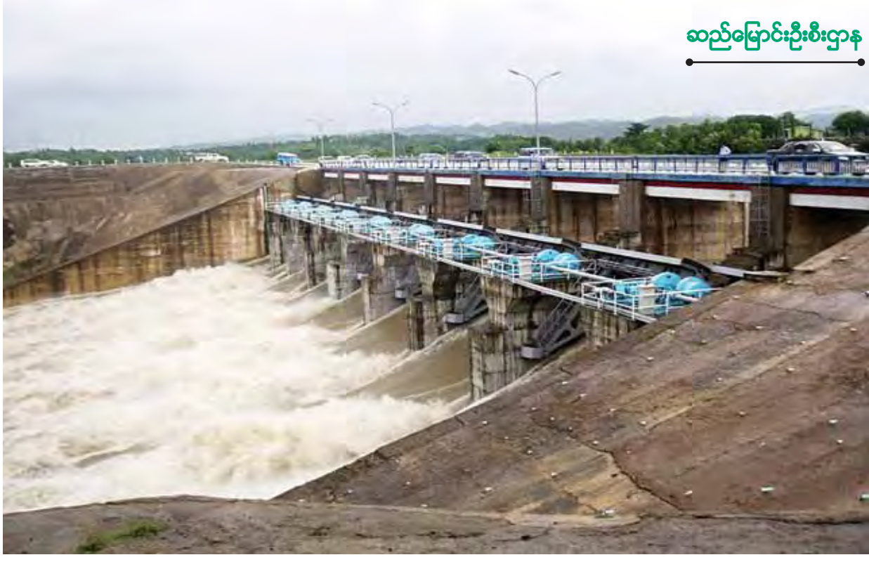
ကြီးအုံကြီးဝ ရေလျှောင့်တံခံ၏ ပင်မရေပိုလွှဲမှ ရေကျော်နေမှုကို တွေ့ရစဉ်။

လယ်ယာစိုက်ပျိုးရေးနှင့် ဆည်မြောင်းဝန်ကြီးဌာန ဆည်မြောင်းဦးစီးဌာနအနေဖြင့် မိုးရာသီတွင် ရေလျှောင့်တံခံများ ကြိုခိုင်ရေးနှင့် လုံခြုံစိတ်ချစွာ ရေသိုလျှောင့်ထားနိုင်ရေးအတွက် ဌာနမှထုတ်ပြန်ထားသော လုပ်ထုံးလုပ်နည်း ညွှန်ကြားချက်များအတိုင်း အထူးအလေးထား ကြီးကြပ်စီမံဆောင်ရွက်လျက်ရှိပါသည်။