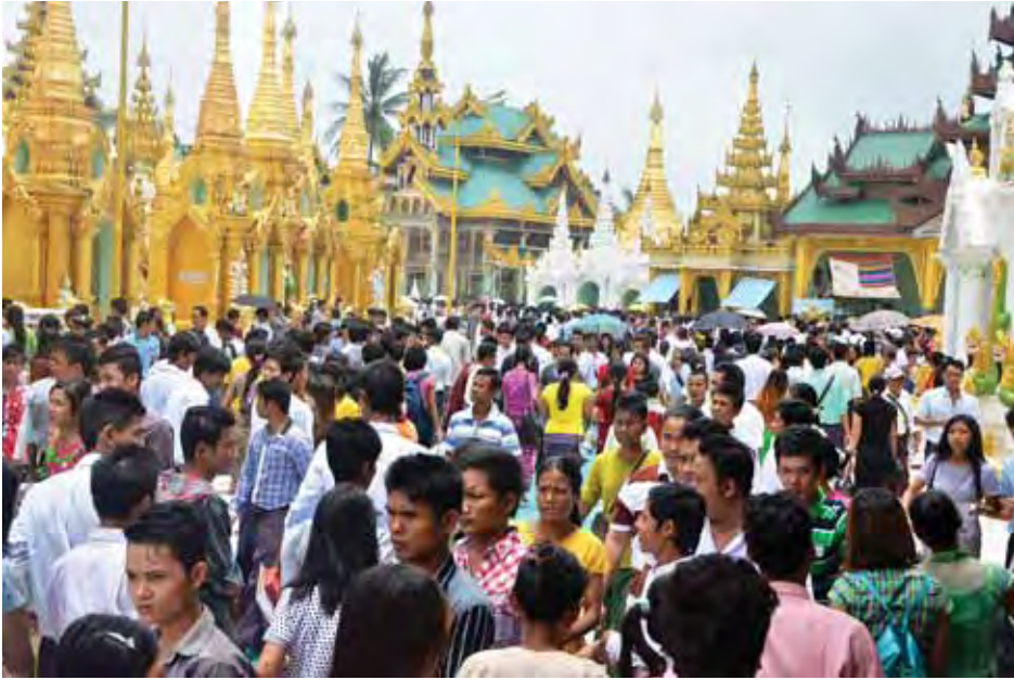
ဒုတိယဝါဆိုလပြည့် ဓမ္မစကြာအခါတော်နေ့တွင် ရွှေတိဂုံစေတီတော်ရင်ပြင်တော်ပေါ်၌ ဘုရားဖူးပြည်သူများ ကြိတ်ကြိတ်တိုးစည်ကားလျက်ရှိပုံ။

ယနေ့သည် ၁၃၇၇ ခုနှစ် ဒုတိယဝါဆိုလပြည့် (ဓမ္မစကြာအခါတော်နေ့)ဖြစ်သည်။ ဗုဒ္ဓမြတ်ဘုရားရှင်သည် ဝါဆိုလပြည့် ညဦးဦးတွင် ပဉ္စဝဂ္ဂို ငါးဦးတို့အား ဓမ္မစကြာ တရားတော်ကို စတင်ဟောကြားတော်မူသည့်နေ့ဖြစ် သည့် အားလျော်စွာ ဗုဒ္ဓဘာသာဝင်တို့၏ အထွတ်အမြတ် ထားရာ ထူးမြတ်သည့် အခါတော်နေ့ဖြစ်သည်။ သို့ဖြစ်ရာ ယနေ့တွင် ရန်ကုန်မြို့ရှိ ဘုရားပုထိုးစေတီများ၌ ဘုရားဖူးပြည်သူများ၊ ဥပုသ်သီတင်း သီလဆောက်တည်ကြ သူများနှင့် ကုသိုလ်ကောင်းမှုပြုသူများဖြင့် အထူးစည်ကား လျက်ရှိသည်။