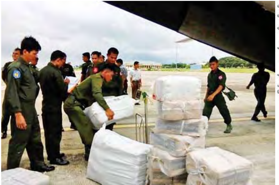
ရခိုင်ပြည်နယ် ရေဘေးသင့်ပြည်သူများအတွက် ကယ်ဆယ်ရေးပစ္စည်းများကို တပ်မတော်လေယာဉ်ဖြင့် ပို့ဆောင်ရန် ပြင်ဆင်နေသည်ကို ဇူလိုင် ၃၁ ရက်က တွေ့ရစဉ်။ (သတင်း စာမျက်နှာ - ၈) (သတင်းစဉ်)