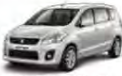
Superior White (26U)