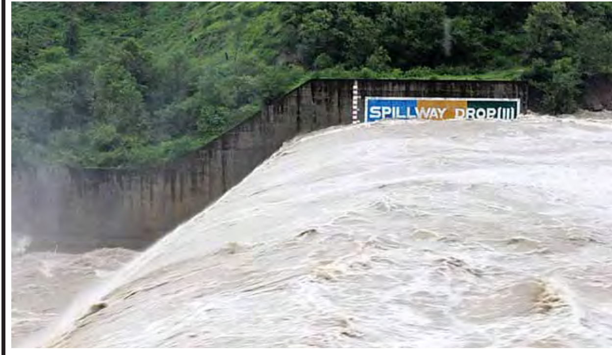
မုန်းချောင်းရေလျှောင့်တံခံ၏ ရေပိုလွှဲမှ ရေကျော်မှုအခြေအနေကို တွေ့ရစဉ်။

ယခုအခါတွင် အဓိကမြစ်ကြီးများဖြစ်သော ဧရာဝတီမြစ်၊ ချင်းတွင်းမြစ်၊ စစ်တောင်းမြစ်၊ ငဝန်မြစ်၊ ပဲခူးမြစ်နှင့် သံလွင်မြစ် စသည့်မြစ်ကြီးများ၏ ရေဆင်းဧရိယာများတွင် မိုးသည်ထန်စွာရွာသွန်းခဲ့သဖြင့် ၎င်းမြစ်များ၏ စိုးရိမ်ရေမှတ်များသို့ ရောက်ရှိကျော်လွန်လာပြီဖြစ်ပါသည်။ ထို့ကြောင့် သက်ဆိုင်ရာ ရေဘေးကာကွယ်ရေးတာဝန်များ ကြိုခိုင်မှုအတွက် ကြိုတင်ကာကွယ်ဆောင်ရွက်ခြင်း ၂၄ နာရီ စောင့်ကြည့်စီမံခြင်း၊ အရေးပေါ်ရေဘေးကာကွယ်ရေးပစ္စည်းများ အရန်သင့်စုဆောင်းခြင်း၊ ဒေသဆိုင်ရာအဖွဲ့အစည်းများဖြင့် ပူးပေါင်းကာ ရေဘေးကြိုတင်ကာကွယ်ရေးလုပ်ငန်းများ ဆောင်ရွက်ခြင်းကို အတွေ့အကြုံရှိပြီး ကျွမ်းကျင်သည့် အင်ဂျင်နီယာဝန်ထမ်းများဖြင့် စုဖွဲ့ကာ အချိန်ပြည့် စောင့်ကြည့်စီမံဆောင်ရွက်လျက်ရှိပါသည်။ ပြည်သူလူထုအနေဖြင့်လည်း မိမိဒေသ၏ လက်ရှိဖြစ်ပေါ်နေသော ရေကြီးမှုဘေးအန္တရာယ်အခြေအနေနှင့် လိုက်လျောညီထွေသော အသိ၊ သတိများဖြင့် အနိမ့်ပိုင်းဒေသများနှင့် မြစ်ချောင်းများ ကမ်းနံဘေးတွင် နေထိုင်ခြင်းမပြုကြပါရန် အထူးလိုအပ်ပါကြောင်း အသိပေးနှိုးဆော်တင်ပြအပ်ပါသည်။ ။