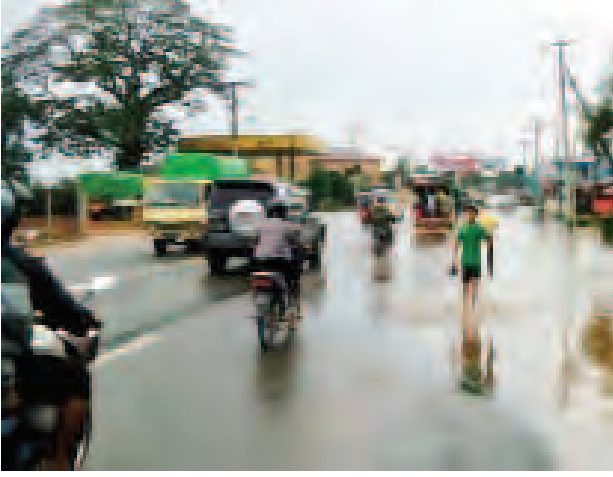
ပဲခူးမြစ်ရေသည် ပဲခူးရန်ကုန်ကားလမ်းမကြီးအား ကျော်ဖြတ်တက်ရောက်လာခြင်းမရှိသည့်အတွက် ခရီးသည်ယာဉ်ကြီး ယာဉ်ငယ်များအဆင်ပြေချောမွေ့စွာသွားလာပြေးဆွဲလျက်ရှိနေသည်ကို တွေ့ရစဉ်။ (၅၈၈)

နေပြည်တော် ဇူလိုင် ၃၀ မြန်မာ့မီးရထား တိုင်းအမှတ်(၉)၊ ဟင်္သာတ-ဘုရားပေါ် ရထားလမ်းပိုင်း၊ မယ်ဇော်ကုန်းနှင့် ထူးကြီးဘူတာကြား မိုင်တိုင်(၁၃၉။၁၆-၁၇)ရှိ တံတားအမှတ် (၇၆)၏ မယ်ဇော်ကုန်း ဘူတာဘက်ခြမ်း (၅၅x၁၄၅ x၉၅) တာဘောင်ရေတိုက် စားမှုကြောင့် အဆိုပါ ရထားလမ်းပိုင်းအား ဇူလိုင် ၂၉ ရက်တွင် ပိတ်ထားခဲ့ရပြီး အမှတ်(၁၈၁) အဆန်ရထားဖြင့် မယ်ဇော်ကုန်းသို့ ရောက်ရှိလာသော ခရီးသည် ၅၃ ဦးနှင့် အမှတ်(၁၈၂) အစုန်ရထားဖြင့် ထူးကြီးသို့ ရောက်ရှိလာသော ခရီးသည် ၇၁ ဦးအား ထူးကြီးနှင့် မဲဇော်သို့ အပြန်အလှန် ကူးပြောင်းပေးခဲ့ပြီး အမှတ်(၁၈၁)အဆန်ရထားအား (၁၈၂) အစုန်ရထားအဖြစ် လည်းကောင်း၊ အမှတ်(၁၈၂) အစုန်ရထားအား (၁၈၁) အဆန်ရထားအဖြစ်လည်းကောင်း ဆက်လက်ပြေးဆွဲ ပို့ဆောင်ပေးခဲ့ကြောင်း သိရှိရသည်။