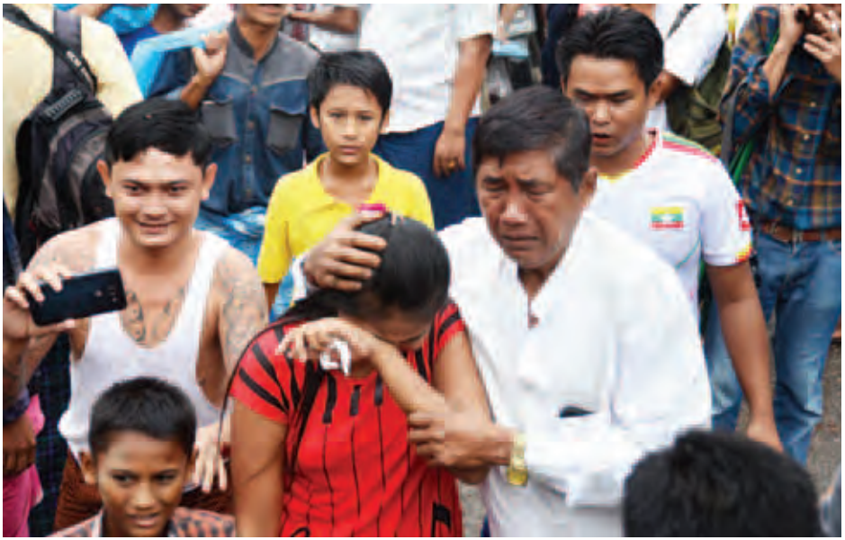
နိုင်ငံတော်သမ္မတ၏ လွတ်ငြိမ်းသက်သာခွင့်ဖြင့် အင်းစိန်ထောင်မှ လွတ်မြောက်လာသူများကို တွေ့ရစဉ်။