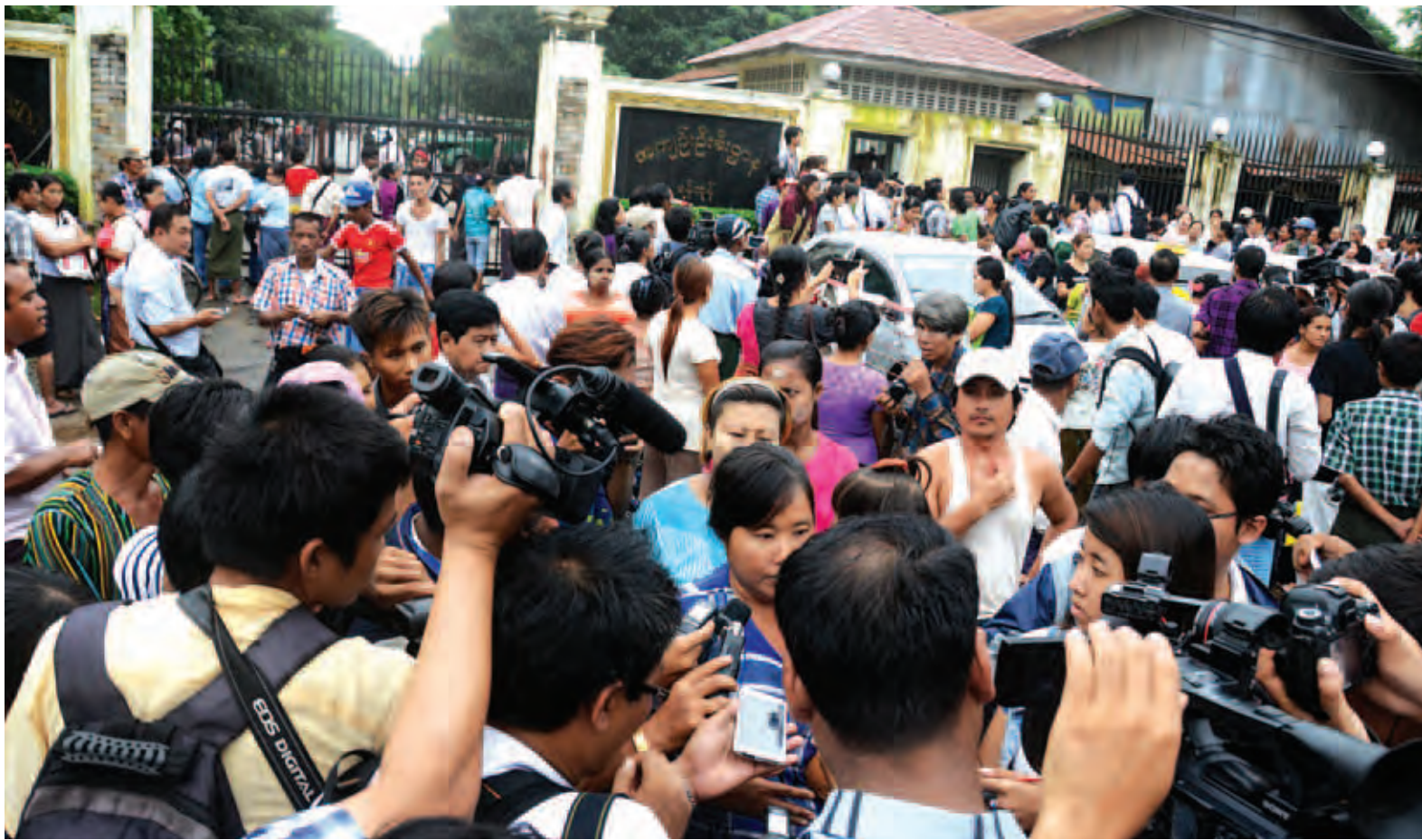
ဇူလိုင် ၃၀ ရက်က နိုင်ငံတော်သမ္မတ၏ လွတ်ငြိမ်းသက်သာခွင့်ဖြင့် အင်းစိန်အကျဉ်းထောင်မှ လွတ်မြောက်လာသူများအား ကြိုဆိုနှုတ်ဆက်သူများနှင့်အတူ တွေ့ရစဉ်။