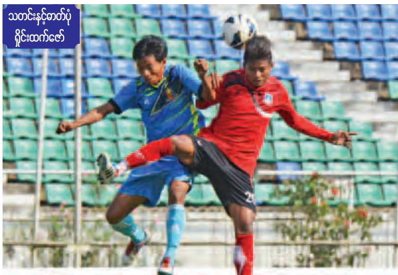
သတင်းနှင့်တတ်ပုံ ရှိုင်းထက်ဇော်

ကွင်း၌ ဇွဲကပင်အသင်းနှင့် ဧရာဝတီအသင်း၊ သုဝဏ္ဏကွင်း၌ မနောမြေအသင်းနှင့်ရခိုင်အသင်း တို့ ယှဉ်ပြိုင်ကစားကြမည်ဖြစ်သည်။ ကွာတား ဖိုင်နယ်ရောက်အသင်းရှစ်သင်းတွင် MNL အသင်းခုနှစ်သင်း၊ MNL-2 အသင်းတစ်သင်းတို့ တက်ရောက်နိုင်ခဲ့သည်။ ဒုတိယအဆင့်တွင် MNL အသင်းများအစုံအလင် ပါဝင်လာခဲ့ပြီး နာမည်ကြီးအသင်းများဖြစ်သည့် ရန်ကုန်၊ ဇေယျာရွှေမြေနှင့် ကမ္ဘောဇအသင်းတို့မှာ ပြိုင်ပွဲမှ ဝေးစီးစွာ ထွက်ခဲ့ရသည်။ ရန်ကုန်အသင်းမှာ စာမျက်နှာ ၁၀ ကော်လံ ၆ သို့ ၀