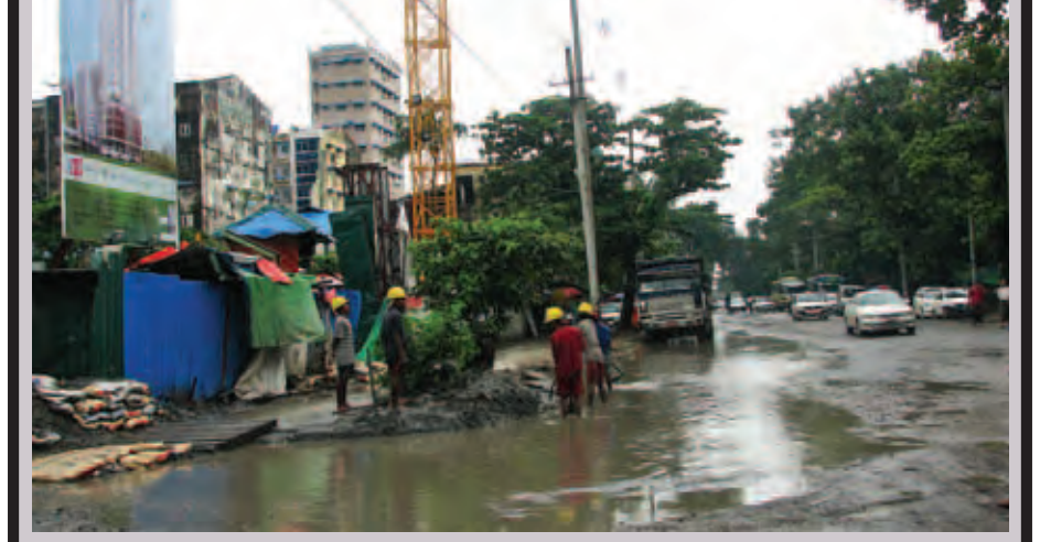
ရန်ကုန်မြို့ ကုန်သည်လမ်းပေါ်ရှိ လမ်း ၅၀ ကားမှတ်တိုင်ရှေ့တွင် ရေများအမြဲတင်လျက်ရှိပြီး လမ်းသွားလမ်းလာများနှင့် မော်တော်ယာဉ်များကို အနှောင့်အယှက်ပေးလျက်ရှိနေသည်။