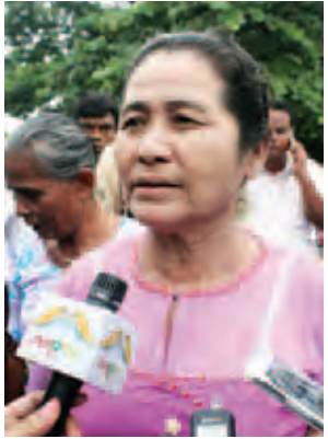
မကြည်ငွေ။