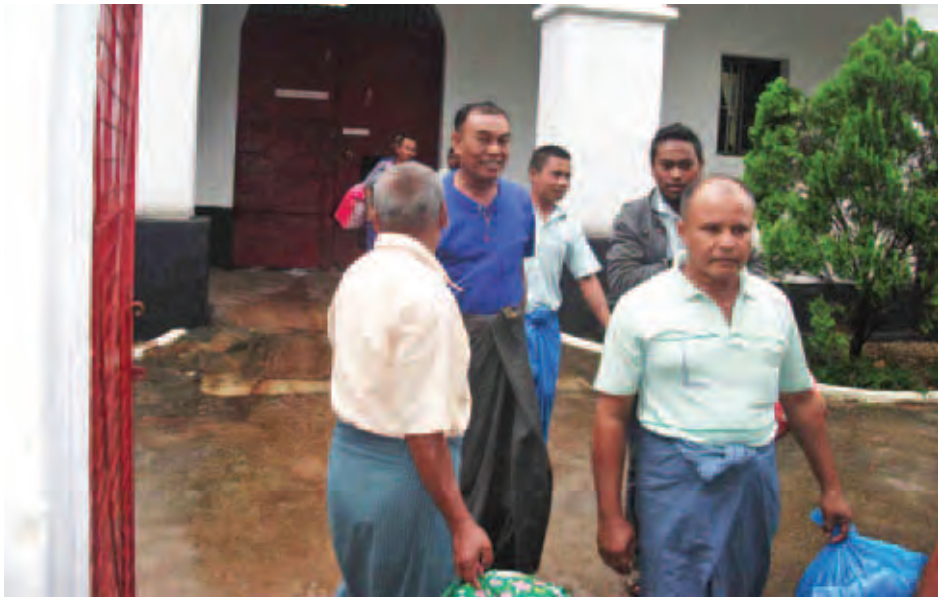
နိုင်ငံတော်သမ္မတ၏ လွတ်ငြိမ်းသက်သာခွင့်ဖြင့် ထားဝယ်အကျဉ်းထောင်မှ လွတ်မြောက်လာသူများကို ခရိုင်(ပြန်/ဆက်) တွေ့ရစဉ်။