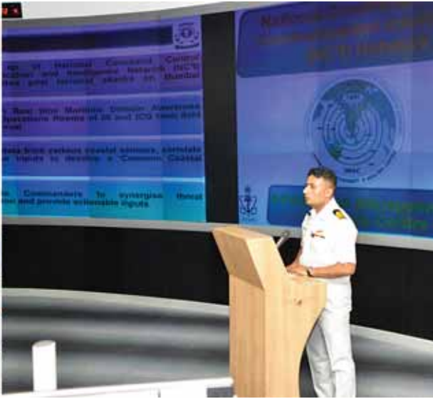
ဆောင်ရွက်မှုများကို တာဝန်ရှိသူများက ရှင်းလင်းတင်ပြပြီး(အပေါ်ပုံ) တပ်မတော်ကာကွယ်ရေးဦးစီးချုပ်နှင့်အဖွဲ့ဝင်များက သိရှိလိုသည်များ