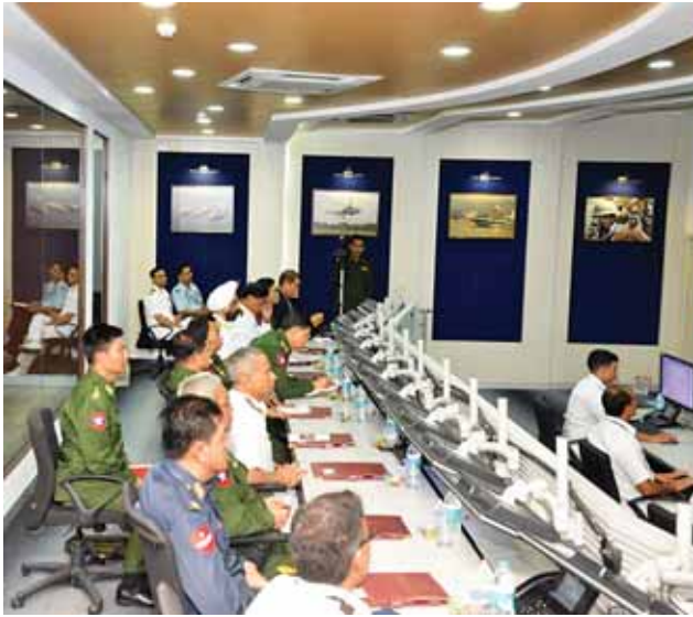
Centre - IMAC Gurgaon သို့ မွန်းလွဲ ၂ နာရီ ၁၅ မိနစ်တွင် ရောက်ရှိပြီး IMAC Gurgaon မှ Deputy Chief of Naval Staff Vice

ယင်းနောက် တပ်မတော် ကာကွယ်ရေးဦးစီးချုပ်နှင့်အဖွဲ့သည် Delhi Cantoment ရှိ Army Base Workshop သို့ ရောက်ရှိကြပြီး Conference hall တွင် Army Base Workshop နှင့် ပတ်သက်သည့် သမိုင်းကြောင်း၊ ဖွဲ့စည်းပုံနှင့် စွမ်းဆောင်နိုင်ရည်များကို တာဝန်ရှိသူတစ်ဦးက ပါဝါပွင့်ဖြင့် ရှင်းလင်းတင်ပြရာ တပ်မတော်ကာကွယ်ရေးဦးစီးချုပ်က သိရှိလိုသည့်အချက်များကို မေးမြန်းပြီးနောက် အထိမ်းအမှတ်တံဆိပ်များ အပြန်အလှန်ပေးအပ်ကြသည်။