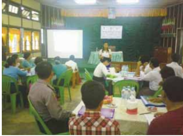
ရေး ဇူလိုင် ၂၉

မွန်ပြည်နယ် ရေးမြို့ မြို့နယ်အထွေထွေအုပ်ချုပ်ရေးဦးစီးဌာန အစည်းအဝေးခန်းမ၌ ကျား မ အခြေပြု အကြမ်းဖက်မှုကာကွယ်စောင့်ရှောက်ရေးဆိုင်ရာ ရက်တိုသင်တန်းကို ဇူလိုင် ၂၈ ရက်မှ ဇူလိုင် ၂၉ ရက်အထိ ၂ ရက်တာ သင်တန်းဖွင့်လှစ်ပို့ချပေးခဲ့ကြောင်း သိရသည်။