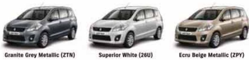
Granite Grey Metallic (ZTN) Superior White (26U) Ecrú Beige Metallic (ZPY)