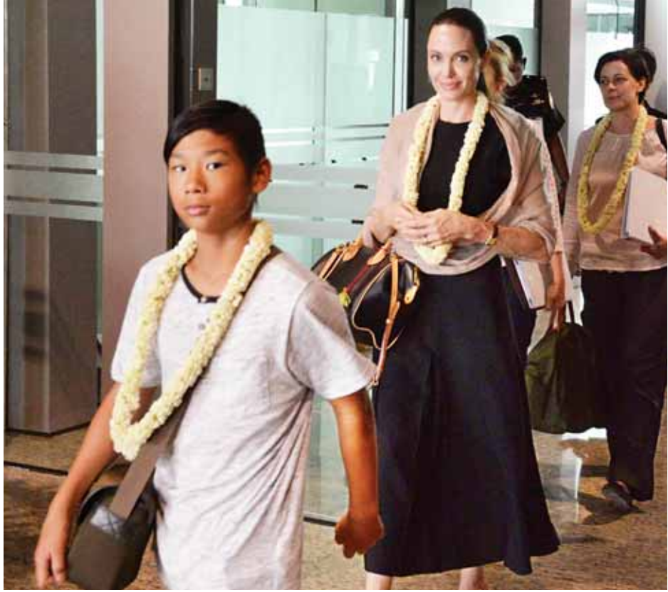
ကုလသမဂ္ဂဒုက္ခသည်များဆိုင်ရာ မဟာမင်းကြီးရုံး၏ အထူးကိုယ်စားလှယ် မစ္စ အင်ဂျလီနာ ဂျီလီပစ် နေပြည်တော်လေဆိပ်သို့ ရောက်ရှိလာစဉ်။

★ရှေ့မှ မြစ်ကြီးနားမြို့ရှိ ပဋိပက္ခများအတွင်း လိင်ပိုင်းဆိုင်ရာ အကြမ်းဖက်မှုများ အား အကာအကွယ်ပေးမှုဆိုင်ရာ လူမှုအဖွဲ့အစည်းများနှင့် တွေ့ဆုံရန် ရှိကြောင်း သိရသည်။ ထို့နောက် ဇူလိုင် ၃၀ရက် ညနေ ပိုင်းတွင် ရန်ကုန်မြို့ရှိ လူမှုအဖွဲ့အစည်းများနှင့် တွေ့ဆုံမည်ဖြစ်ကာ ဩဂုတ် ၁ရက်၌ ရွှေတိဂုံစေတီတော်သို့ သွားရောက်ဖူးမြော်ခြင်းနှင့် ညနေပိုင်း တွင် ဗြိတိန်သံအမတ်ကြီး၏ နေအိမ်သို့ သွားရောက်လည်ပတ်မည်ဖြစ်ကြောင်း သိရသည်။ မစ္စ အင်ဂျလီနာ ဂျီလီပစ်သည် ဟောလီးဝုဒ်မှ ကမ္ဘာကျော် ရုပ်ရှင် မင်းသမီးတစ်ဦးဖြစ်ပြီး ၂၀၀၀ပြည့်နှစ် တွင် ပြည်တွင်းစစ်ဒဏ်ခံစားခဲ့ရသော ကမ္ဘောဒီးယားနိုင်ငံသို့ Lara Croft: