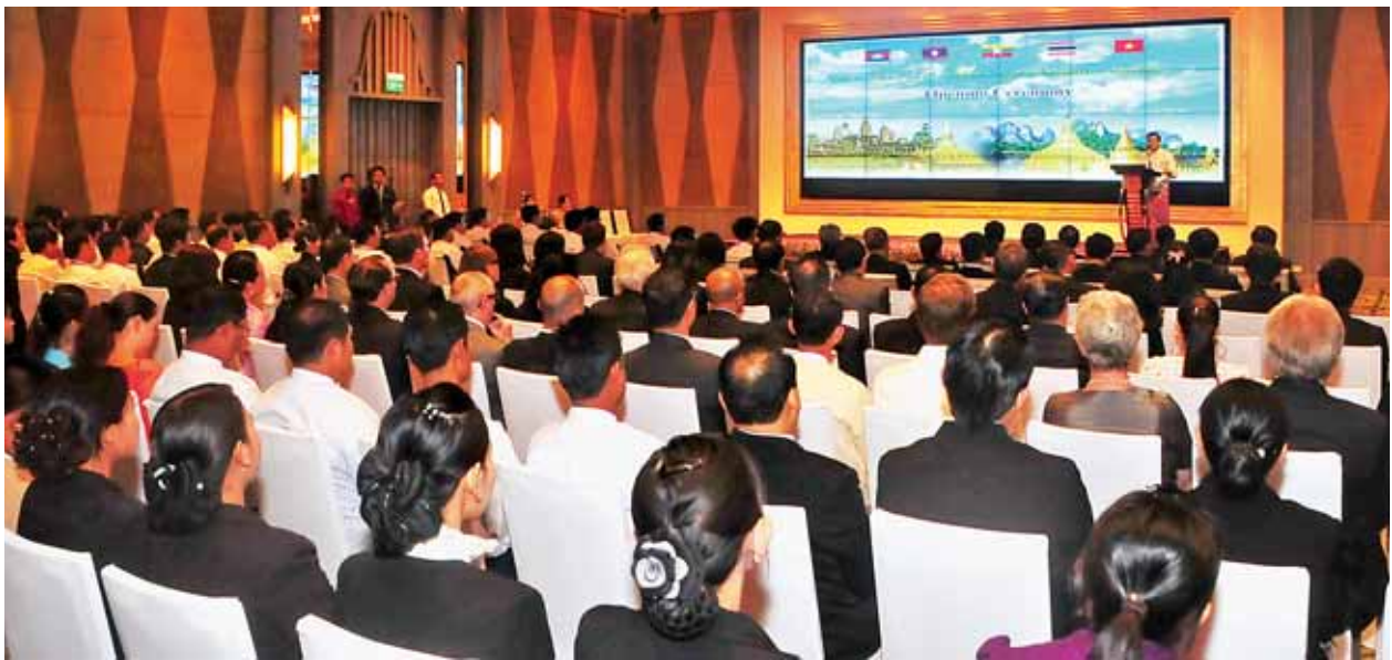
ဒုတိယသမ္မတ ဦးညွှန်ထွန်း တတိယအကြိမ်မြောက် စီအယ်လ်အမ်စီနှင့် ဒုတိယအကြိမ်မြောက် အက်မက်စ် ခရီးသွားလုပ်ငန်းဝန်ကြီးများ အစည်းအဝေး ဖွင့်ပွဲတွင် မိန့်ခွန်းပြောကြားစဉ်။

အက်မက်စ်နိုင်ငံများ၏ ပူးပေါင်းဆောင်ရွက်ရေး အထူးဦးစားပေးကဏ္ဍ (၈)ရပ်အနက် တစ်ခုအပါအဝင်ဖြစ်သော ခရီးသွားလုပ်ငန်းဆိုင်ရာ ကနဦး ဆောင်ရွက်မှုများဖြစ်သည့် အက်မက်စ်နိုင်ငံများအကြား နိုင်ငံပြတ်ကျော် ခရီးသွားလာမှု မြှင့်တင်ရေး၊ အဖွဲ့ဝင်(၅)နိုင်ငံကို တစ်ခုတည်းသောခရီးစဉ်ဒေသ