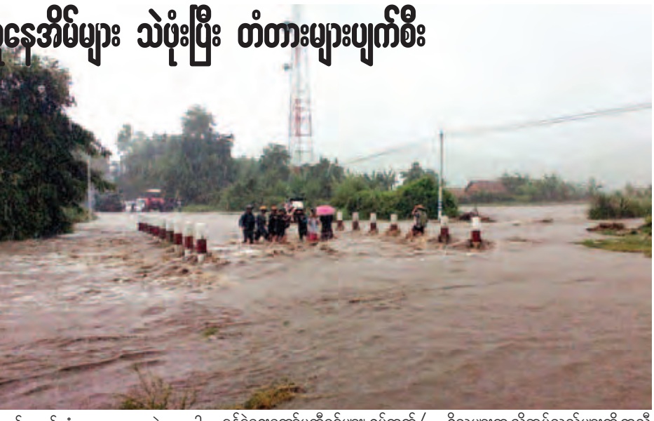
ကွန်ကရစ်တံတားမှာ ရေထဲမျောပါ သွားခဲ့သဖြင့် မြို့နယ်အုပ်ချုပ်ရေး ဌာနနှင့် ဌာနဆိုင်ရာများ၊ မြို့နယ်စီမံခန့်ခွဲရေးကော်မတီဝင်များ၊ ရပ်ကွက်/ကျေးရွာအုပ်ချုပ်ရေးမှူးများနှင့် လူမှုရေးအသင်းအဖွဲ့များမှ တာဝန် ရှိသူများက လိုအပ်သည်များကို ကူညီပံ့ပိုးလျက်ရှိကြောင်း သိရသည်။ မြင့်သူ(စဉ့်ကူး)

မန္တလေးတိုင်းဒေသကြီး ပြင်ဦးလွင် ခရိုင် စဉ့်ကူးမြို့နယ်အတွင်း ဇူလိုင် ၂၄ ရက်နှင့် ၂၅ ရက်တို့တွင် မိုးများ အဆက်မပြတ် ရွာသွန်းမှုကြောင့် ခူလယ်ကျေးရွာအုပ်စု ရေမျက်ကျေးရွာအတွင်း မိုးရေနှင့်အတူ သဲများ ဝင်ရောက်စီးဆင်းသွားရာ လူနေအိမ် ၄၀ ခန့်အတွင်းသို့ သဲခြောက်လက်မမှ တစ်ပေခန့်အထိ ရောက်ခဲ့ပြီး နှစ်ခန်းပတ်လည် သက်ငယ်မိုး၊ ထရီကာ နေအိမ် လေးလုံးပြိုကျပျက်စီးခဲ့သည်။