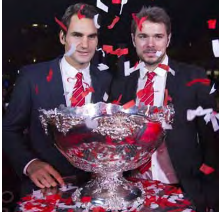
၂၀၁၄ ဒေးဗစ်ဖလားတွင် ဆွစ်ဇာလန်အသင်း ဗိုလ်စွဲပြီးနောက် တွေ့ရသည့် ဖက်ဒီရာ နှင့် ဝေါ်ရင်ကာ။

ဒေးဗစ်ဖလား အုပ်စုအဆင့်ရှုံးထွက်ပွဲစဉ်၌ ဆွစ်ဇာလန်အသင်းကိုယ်စားပြုအဖြစ် ဆွစ်တင်းနစ်အကျော်အမော် ဖက်ဒီရာနှင့်ဝေါ်ရင်ကာတို့နှစ်ဦးလုံးဝင်ရောက်ယှဉ်ပြိုင်ကြမည် ဟု ဆွစ်ဇာလန်တင်းနစ်အဖွဲ့ချုပ်က အတည်ပြုထုတ်ပြန်ခဲ့သည်။ ယင်းရှုံးထွက်ပွဲစဉ်ကို စက်တင်ဘာ ၁၈မှ ၂၀ ရက်အထိ ကစားရမည်ဖြစ်ပြီး ဆွစ်ဇာလန်နှင့် နယ်သာလန်အသင်းတို့ တွေ့ဆုံယှဉ်ပြိုင်ရမည်ဖြစ်သည်။ ပြီးခဲ့သည့် ၂၀၁၄ နိုဝင်ဘာကပင် ကမ္ဘာ့အဆင့်(၂)ဖက်ဒီရာနှင့် အဆင့်(၄)ဝေါ်ရင်ကာတို့ နှစ်ဦးတို့ဝင်ရောက်ကစားခဲ့သည့် ဆွစ်ဇာလန်အသင်းက ပြင်သစ်အသင်းအား အနိုင်ယူကာ ဆွစ်ဇာလန် နိုင်ငံအတွက် ပထမဆုံးသော ဒေးဗစ်ဖလားကို ဆွတ်ခူးစားခဲ့သည်။ ဆွစ်ဇာလန် အသင်းသည် ပထမအဆင့်ပတ်လည်ပွဲစဉ်တွင် အဆိုပါကြယ်ပွင့်ကစားသမားနှစ်ဦးမပါဘဲ ဘယ်လ်ဂျီယံအသင်းနှင့်ယှဉ်ပြိုင်ခဲ့ရာ ၃-၂ဖြင့်အရေးနိမ့်ခဲ့သည်။ ဆွစ်ဇာလန်နှင့်နယ်သာလန်အသင်းတို့သည် ၂၀၁၂ကလည်း ယခုကဲ့သို့ပင် ရှုံးထွက်ပွဲစဉ် ၌တွေ့ဆုံယှဉ်ပြိုင်ခဲ့ရာ ၅-၃ဖြင့်အနိုင်ရခဲ့သေးသည်။ ထို့ပြင် ဆွစ်ဇာလန် အသင်းအနေဖြင့် အိမ်ကွင်းကစားခဲ့သည့်ပွဲစဉ်များတွင် နယ်သာလန်အသင်းအား ၁၉၈၃ ခုနှစ်ကတည်းက ရှုံးနိမ့် ခဲ့ခြင်းမရှိခဲ့ရာ ဆွစ်ဗရိသတ်များ အပြည့်အဝကျေနပ်ပျော်ရွှင်ရန်အလားအလာများနေသည်။ ဖက်ဒီရာက ဆွစ်ဇာလန်အသင်းအနေဖြင့်နောက်တစ်ဆင့်တက်ရောက်နိုင်မည်ဟု မျှော်လင့်ထား ကြောင်းဆိုခဲ့သည်။ နိုင်ငံအလိုက် တင်းနစ်ကမ္ဘာ့အဆင့်ရပ်တည်မှုတွင် ဆွစ်ဇာလန်က ချက်အသင်း၏အောက် ဒုတိယနေရာ၌ ရပ်တည်နေသည်။