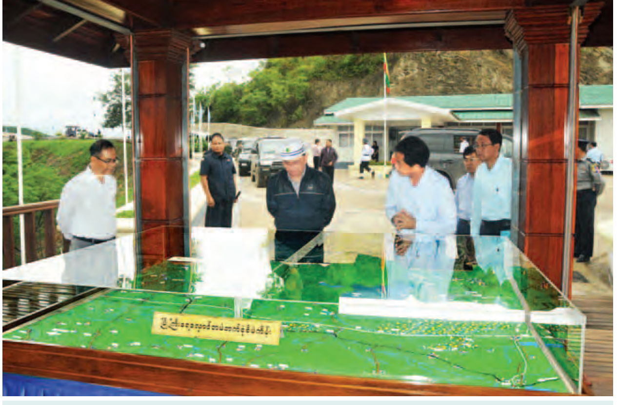
နိုင်ငံတော်သမ္မတ ဦးသိန်းစိန် မြို့ကြီးရေလျှောင့်တစ်ပုံစံစီမံကိန်း ပုံစံငယ်ကို ကြည့်ရှုစဉ်။ (သတင်းစဉ်)

အဆိုပါ ဖြစ်စဉ်များကြောင့် မိုးညှင်း-ချပ်သင်း ရထားလမ်းပိုင်းများ ပိတ်ထားသော်လည်း မိုးညှင်း-မြစ်ကြီးနား-မိုးညှင်း အထူးရထားနှင့် မန္တလေး- ချပ်သင်း-မန္တလေး အထူးရထားအား ဆက်လက်ပြေးဆွဲပေးလျက်ရှိကြောင်း နှင့် ပျက်စီးသွားသော ရထားလမ်း၊ တံတားပြုပြင်နေမှုများ အမြန်ဆုံးပြီးစီးနိုင်ရေး အတွက် မြန်မာ့မီးရထားတာဝန်ရှိသူများက ကြိုးပမ်းဆောင်ရွက်လျက်ရှိကြောင်း သိရသည်။ (သတင်းစဉ်)