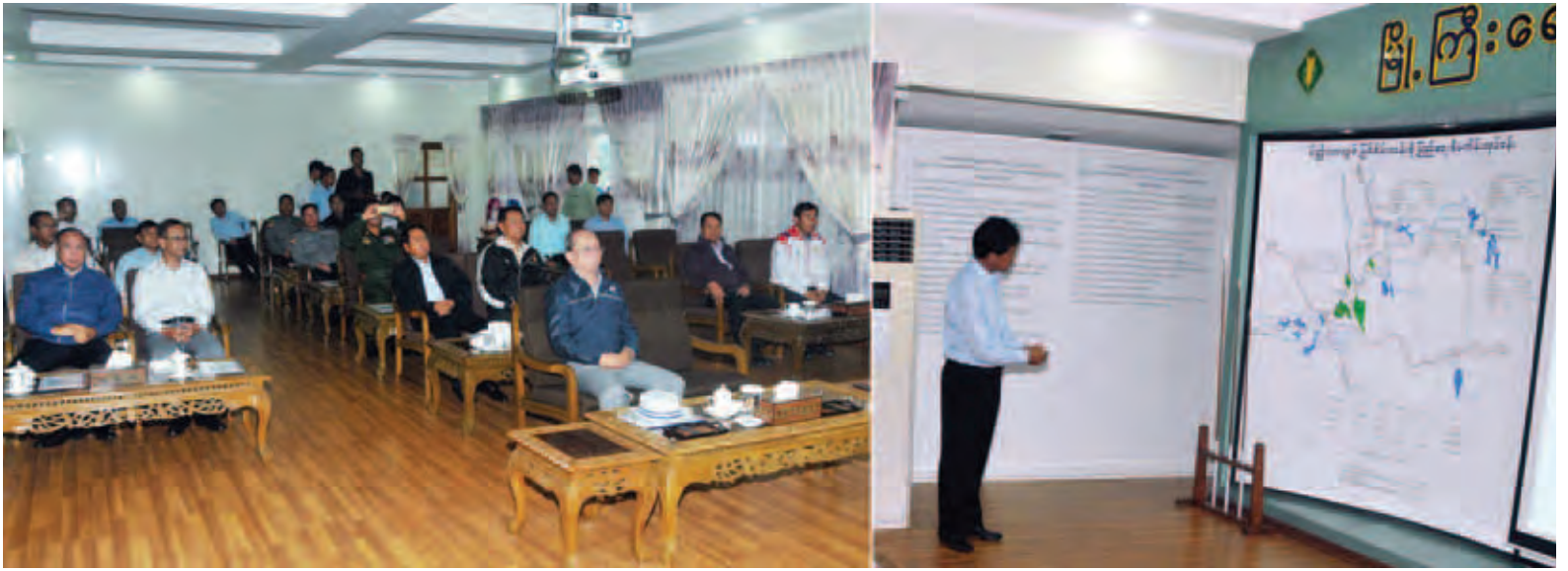
နိုင်ငံတော်သမ္မတ ဦးသိန်းစိန်အား စီမံကိန်းရှင်းလင်းဆောင်၌ ညွှန်ကြားရေးမှုအဖွဲ့ချုပ် ဦးကျော်မြင့်လှိုင်က စီမံကိန်းဆိုင်ရာအချက်အလက်များကို ရှင်းလင်းတင်ပြစဉ်။ (သတင်းစဉ်)

တင်ပြချက်များနှင့် စပ်လျဉ်း၍ နိုင်ငံတော်သမ္မတက စီမံကိန်းလုပ်ငန်း များနှင့်ပတ်သက်၍ ယခင်ကာလက မပြုပြင်ခဲ့သည့် စီမံကိန်းလုပ်ငန်း များကို မိမိတို့အစိုးရလက်ထက်တွင် အပြီးသတ်နိုင်ရန် ကြိုးပမ်းဆောင်ရွက် ပေးလျက်ရှိကြောင်း၊ မြို့ကြီးရေလျှောင့် တစ်ပုံစံ မိတ္ထီလာလွင်ပြင်စီမံကိန်းစီမံခြင်း စေရေးနှင့် လျှပ်စစ်ဓာတ်အား ပိုမို