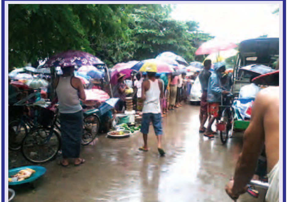
ရန်ကုန်မြောက်ပိုင်းခရိုင် လှိုင်သာယာမြို့နယ် အမှတ်(၈)ရပ်ကွက် အခြေခံပညာအလယ်တန်းကျောင်း အမှတ်(၁၇)ကျောင်းရှေ့မျက်နှာစာ၌ ယာဉ်နှင့်လူသွားလမ်းပေါ်တွင် ကျောင်းဆင်း ကျောင်းတက်ချိန်မရွှေ့ပျံ့ကျနေသည့်များ စည်းကမ်းမဲ့စွာကျော်ရောင်းချနေမှုကြောင့် ခရီးသွားပြည်သူများနှင့် ကျောင်းသား ကျောင်းသူများ လမ်းပိတ်ဆို့မှုများ ကြုံတွေ့နေရစဉ်။ မင်းထက်ပိုင်(လှိုင်သာယာ)

တပ်မတော်အနေဖြင့် ရေဘေးကယ်ဆယ်ရေးလုပ်ငန်းများတွင် အသုံးပြုရန် မော်တော်ယာဉ် ၂၅ စင်း၊ အသက်ကယ်လှေ အစင်း ၄၀ နှင့် အသက်ကယ်အင်္ကျီ အထည် ၂၀၀ တို့ကို ရန်ကုန်တိုင်းဒေသကြီး အင်းတကော်တပ်နယ်တွင် စုစည်း၍ ယနေ့နံနက်ပိုင်းမှစပြီး တောင်ပိုင်းတိုင်းစစ်ဌာနချုပ်နယ်မြေအတွင်းရှိ ပဲခူးမြို့၊ ညောင်လေးပင်မြို့နှင့် ရွှေကျင်မြို့များသို့လည်းကောင်း၊ အနောက်တောင်တိုင်းစစ်ဌာနချုပ် နယ်မြေအတွင်းရှိ ဟင်္သာတမြို့နှင့် အင်္ဂပူမြို့နယ် ကွင်းကောက်သို့လည်းကောင်း အသီးသီးပို့ဆောင်ကာ ရေဘေးကြိုတင်ကာကွယ်မှုလုပ်ငန်းများ ဆောင်ရွက်နိုင်ရေး အသင့်စီမံဆောင်ရွက်လျက်ရှိကြောင်း သတင်းရရှိသည်။ (မြဝတီ)