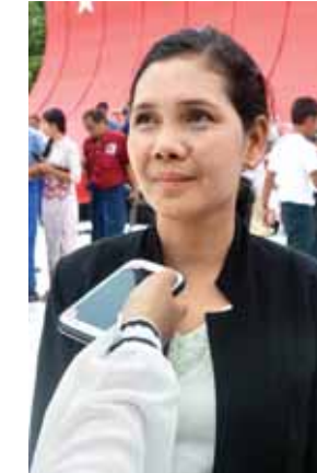
မဓုဓမာသွင်။