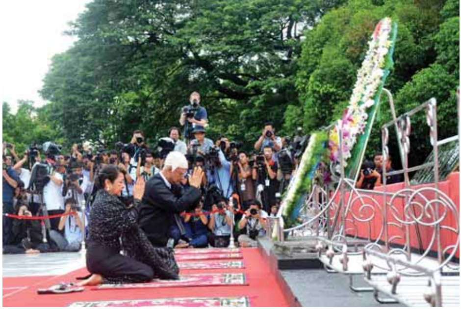
ဗိုလ်ချုပ်အောင်ဆန်း၏ သားဖြစ်သူ ဦးအောင်ဆန်းဦးနှင့်ဇနီး ဒေါ်လှလှနွယ်သိန်းတို့ လွမ်းသူ့ပန်းခွေချ ကန်တော့စဉ်။ (သတင်းစဉ်)

ရှေးဦးစွာ ပြည်ထောင်စုသမ္မတ မြန်မာနိုင်ငံတော် နိုင်ငံတော်သမ္မတ ဦးသိန်းစိန်ကိုယ်စား ဒုတိယသမ္မတ ဒေါက်တာစိုင်းမောက်ခမ်း၊ ပြည်သူ့ လွှတ်တော်ဥက္ကဋ္ဌ သူရဦးရွှေမန်း၊ အမျိုးသားလွှတ်တော် ဥက္ကဋ္ဌ ဦးခင်အောင်မြင့်၊ ပြည်ထောင်စု တရားသူကြီးချုပ် ဦးထွန်းထွန်းဦး၊ (၆၈)နှစ်မြောက် အာဇာနည်နေ့ အခမ်းအနားကျင်းပရေးပဟိုက်မတ်တီ ဥက္ကဋ္ဌ ပြည်ထောင်စုဝန်ကြီး ဦးအေးမြင့်ကြူ၊ ပြည်ထောင်စုဝန်ကြီး ဦးတင်ဆန်းနှင့် ရန်ကုန်တိုင်းဒေသကြီး ဝန်ကြီးချုပ် ဦးမြင့်ဆွေတို့သည် အာဇာနည်ဗိမာန် နားနေဆောင် ခန်းမ၌ ဗိုလ်ချုပ်အောင်ဆန်းနှင့်တကွ အာဇာနည်ခေါင်းဆောင်ကြီးများ၏ မိသားစုဝင်များအား ရင်းရင်းနှီးနှီး တွေ့ဆုံနှုတ်ဆက်သည်။ ထို့နောက် ပြည်ထောင်စုသမ္မတ မြန်မာနိုင်ငံတော် နိုင်ငံတော်သမ္မတ ဦးသိန်းစိန်ကိုယ်စား ဒုတိယသမ္မတ ဒေါက်တာစိုင်းမောက်ခမ်းနှင့် တက် ရောက်လာကြသူများသည် အာဇာနည် ဗိမာန်ရင်ပြင်၌ နေရာယူကြပြီး ဗိုလ်ချုပ်အောင်ဆန်းနှင့် တကွ အာဇာနည်ခေါင်းဆောင်ကြီးများ၏ အထိမ်းအမှတ်ဂူဗိမာန်၌ ပြည်ထောင်စု သမ္မတမြန်မာနိုင်ငံတော်၏ လွမ်းသူ့ ပန်းခွေကိုချ၍ အလေးပြုကြသည်။ ယင်းအချိန်တွင် ပြည်ထောင်စု သမ္မတမြန်မာနိုင်ငံတော်အလံကို ဝမ်းနည်းခြင်းအထိမ်းအမှတ်အဖြစ် တိုင်ဝက်သို့ လျှော့ချလွှင့်ထူကာ ဂုဏ်ပြု တပ်ဖွဲ့ဝင် စာမျက်နှာ ၉ သို့ *