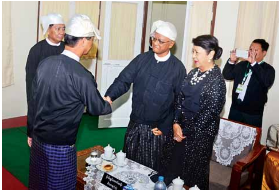
ဒုတိယသမ္မတ ဒေါက်တာစိုင်းမောက်ခမ်း အာဇာနည်ခေါင်းဆောင်ကြီးများ၏ မိသားစုများအား ရင်းရင်းနှီးနှီး နှုတ်ဆက်စဉ်။ (သတင်းစဉ်)