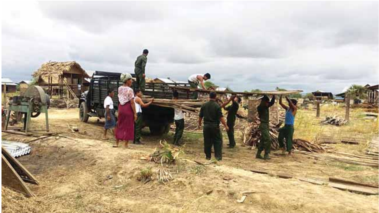
စစ်ကိုင်းတိုင်းဒေသကြီးအတွင်း မိုးအဆက်မပြတ်ရွာသွန်းမှုကြောင့် ရေကြီးရေလျှံမှုများ ဖြစ်ပွားရာဒေသများ၌ ကူညီကယ်ဆယ်ရေးလုပ်ငန်းများ ဆောင်ရွက်နေသည်ကို တွေ့ရစဉ်။ (သတင်းစဉ်)