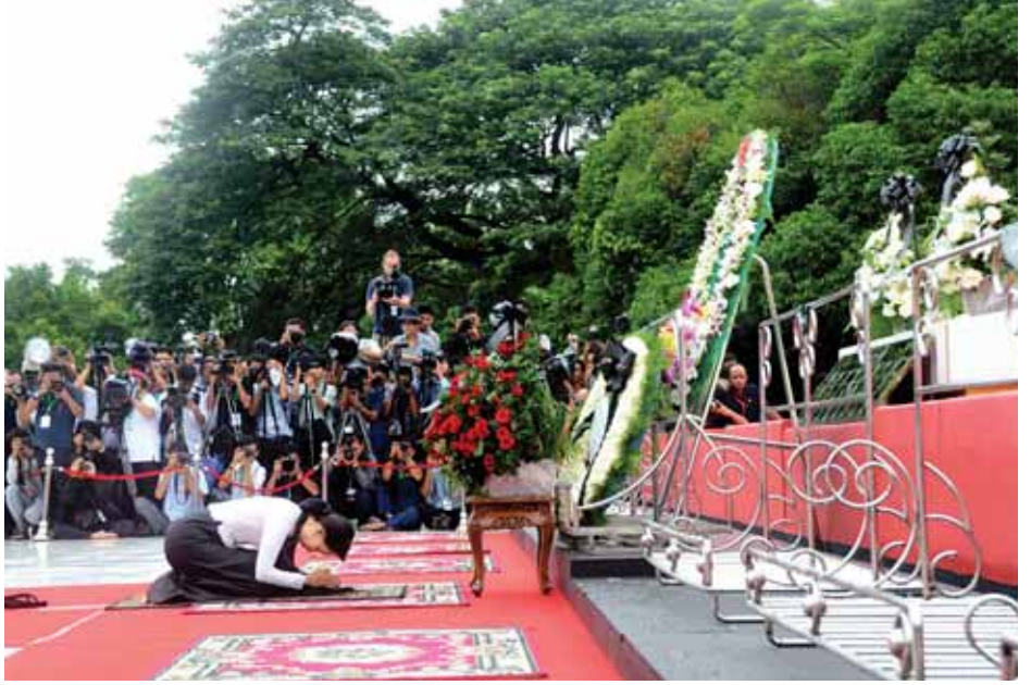
ဗိုလ်ချုပ်အောင်ဆန်း၏ သမီးဖြစ်သူ ဒေါ်အောင်ဆန်းစုကြည် လွမ်းသူ့ပန်းခွေချကန်တော့စဉ်။ (သတင်းစဉ်)