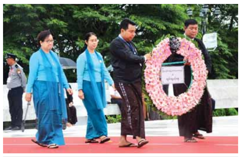
မြန်မာနိုင်ငံအမျိုးသမီးရေးရာအဖွဲ့ချုပ် ကိုယ်စားလှယ်များ အာဇာနည်ခေါင်းဆောင်ကြီး များ၏ အထိမ်းအမှတ်ဂူပိမာန်၌ လွမ်းသူ့ပန်းခွေချရန် လာရောက်စဉ်။ (သတင်းစဉ်)