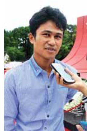
ကိုကိုထိုက်။