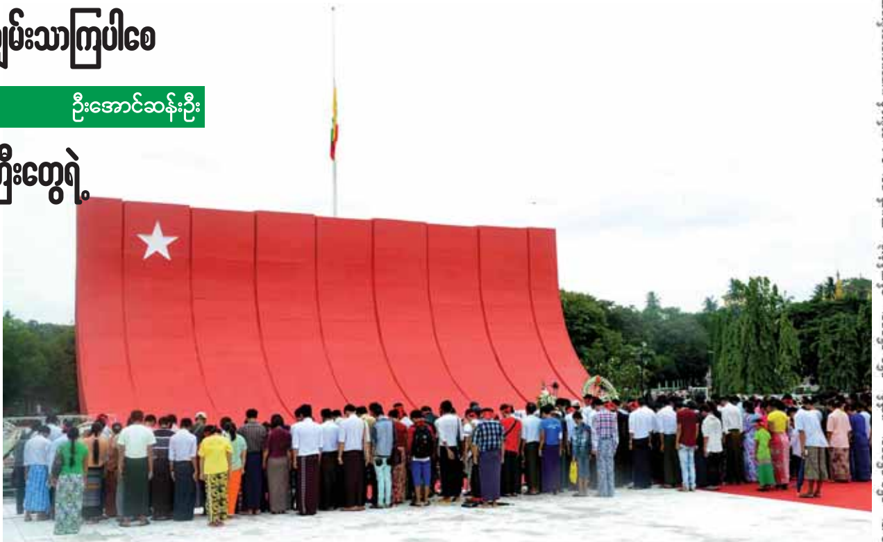
ဇူလိုင် ၁၉ ရက်(အာဇာနည်နေ့)တွင် အာဇာနည်ခေါင်းဆောင်ကြီးများ၏ အထိမ်းအမှတ်ဂူမိမိမိ ပြည်သူများ လာရောက်ဝါရပ်ပြုကြစဉ်။

ထို့အတူ ပြည်ထောင်စုသမ္မတမြန်မာနိုင်ငံတော် နိုင်ငံတော်သမ္မတ ဦးသိန်းစိန် ကိုယ်စား စာမျက်နှာ ၄ ကော်လံ ၁ သို့ ✽