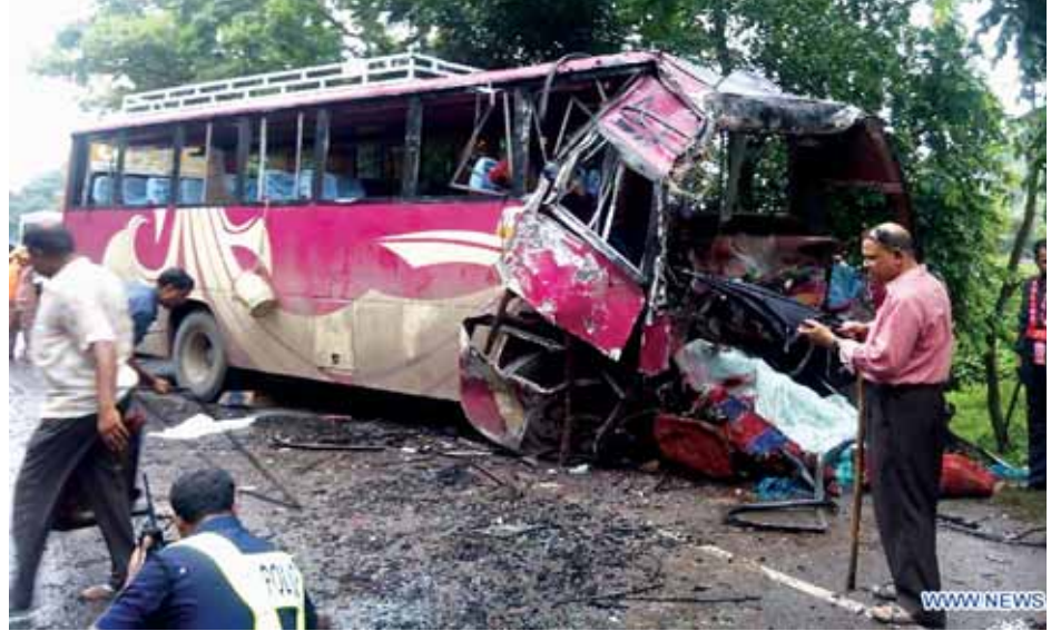
ဆေးကုသမှုခံယူစေလျက်ရှိပြီး ယင်းတို့အထဲမှ အချို့မှာ တိုးမြှင့်ဖွယ်ရှိကြောင်း ရဲအဖွဲ့က ပြောကြားသည်။ စိုးရိမ်ဖွယ်ရာ အခြေအနေရှိသဖြင့် သေဆုံးမှုဦးရေ ဆင်ယူ။

သင်္ဂြိုဟ်စရိတ်အထောက်အပံ့အဖြစ် တာကာငွေ ၁၀၀၀၀ (အမေရိကဒေါ်လာ ၁၂၉ ဒေါ်လာစီ)ထောက်ပံ့ပေးအပ်ခဲ့သည်။ ယင်းဖြစ်ရပ်နှင့် အလားတူ ခရီးသယ်တင် မော်တော်ယာဉ် နှစ်စင်းတိုက်ခိုက်မိမှုတစ်ရပ် ဘင်္ဂလားဒေ့ရှ်နိုင်ငံအနောက်ပိုင်းရှိ ဒီရာဂျီရာနယ် ခရိုင်အတွင်း ဖြစ်ပွားခဲ့ရာ လူ ၁၄ ဦးထက် မနည်းသေဆုံးပြီး လူ ၃၀ ခန့် ထိခိုက်ဒဏ်ရာရမှုတစ်ရပ်လည်း ဖြစ်ပွားခဲ့သည်။ အဆိုပါဘတ်စ်ကားနှစ်စီးအနက်တစ်စီးမှာ ဘင်္ဂလားဒေ့ရှ်နိုင်ငံမြို့တော် ဒါကာမှမောင်းနှင်လာခြင်းဖြစ်ပြီး အခြားဘတ်စ်ကားမှာ နိုင်ငံအနောက်ပိုင်း ရာဂျာဂျာဟီမှ မောင်းနှင်လာခြင်းဖြစ်သည်။ အဆိုပါဘတ်စ်ကားနှစ်စီးသည် ဘင်္ဂလားဒေ့ရှ်နိုင်ငံ၏ အနောက်ပိုင်းဒေသအဆုံး ဘန်ဂါဘန်ဒုအမည်ရှိ ယမုံနာမြစ်ကူးတံတားပေါ်တွင် ဇူလိုင် ၁၈ ရက် နံနက် အစောပိုင်း၌ တိုက်မိမှု ဖြစ်ပွားခဲ့ခြင်းဖြစ်သည်။ ယင်းယာဉ်တိုက်မှုကြောင့် ထိခိုက်ဒဏ်ရာရသူများအား ဒေသတွင်းရှိ ဆေးရုံများသို့ ဖြန့်၍ ပို့ဆောင်ကာ