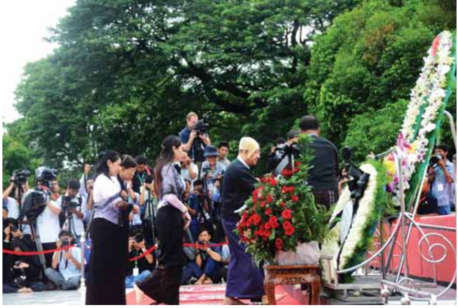
သခင်မြ၏ ဂူဗိမာန်၌ သခင်မြ၏ မိသားစုများ လွမ်းသူ့ပန်းခွေချစဉ်။ (သတင်းစဉ်)