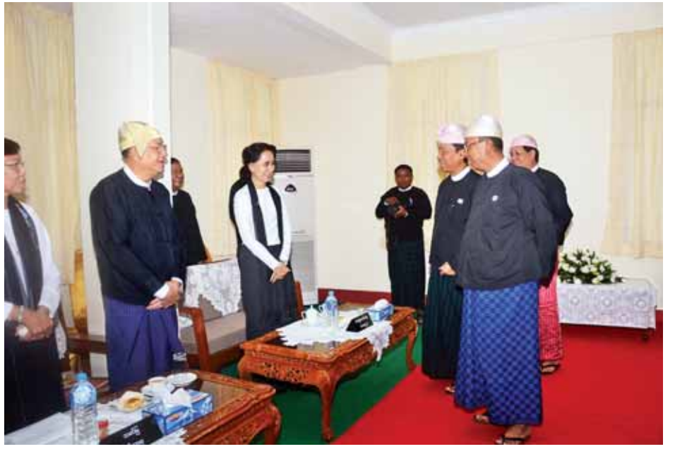
ပြည်သူ့လွှတ်တော်ဥက္ကဋ္ဌ သူရဦးရွှေမန်း၊ အမျိုးသားလွှတ်တော်ဥက္ကဋ္ဌ ဦးခင်အောင်မြင့် အာဇာနည် ခေါင်းဆောင်ကြီးများ၏ မိသားစုများအား ရင်းရင်းနှီးနှီးနှုတ်ဆက်စဉ်။ (သတင်းစဉ်)