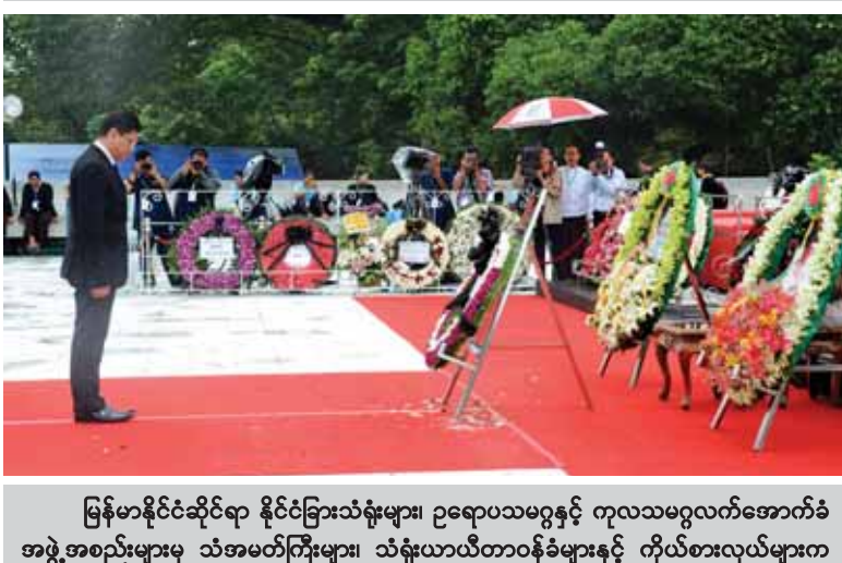
မြန်မာနိုင်ငံဆိုင်ရာ နိုင်ငံခြားသံရုံးများ၊ ဥရောပသမဂ္ဂနှင့် ကုလသမဂ္ဂလက်အောက်ခံ အဖွဲ့အစည်းများမှ သံအမတ်ကြီးများ၊ သံရုံးယာယီတာဝန်ခံများနှင့် ကိုယ်စားလှယ်များက အာဇာနည်ခေါင်းဆောင်ကြီးများ၏ အထိမ်းအမှတ်ဂူပိမာန်၌ လွမ်းသူ့ပန်းခွေချ အလေးပြုစဉ်။ (သတင်းစဉ်)