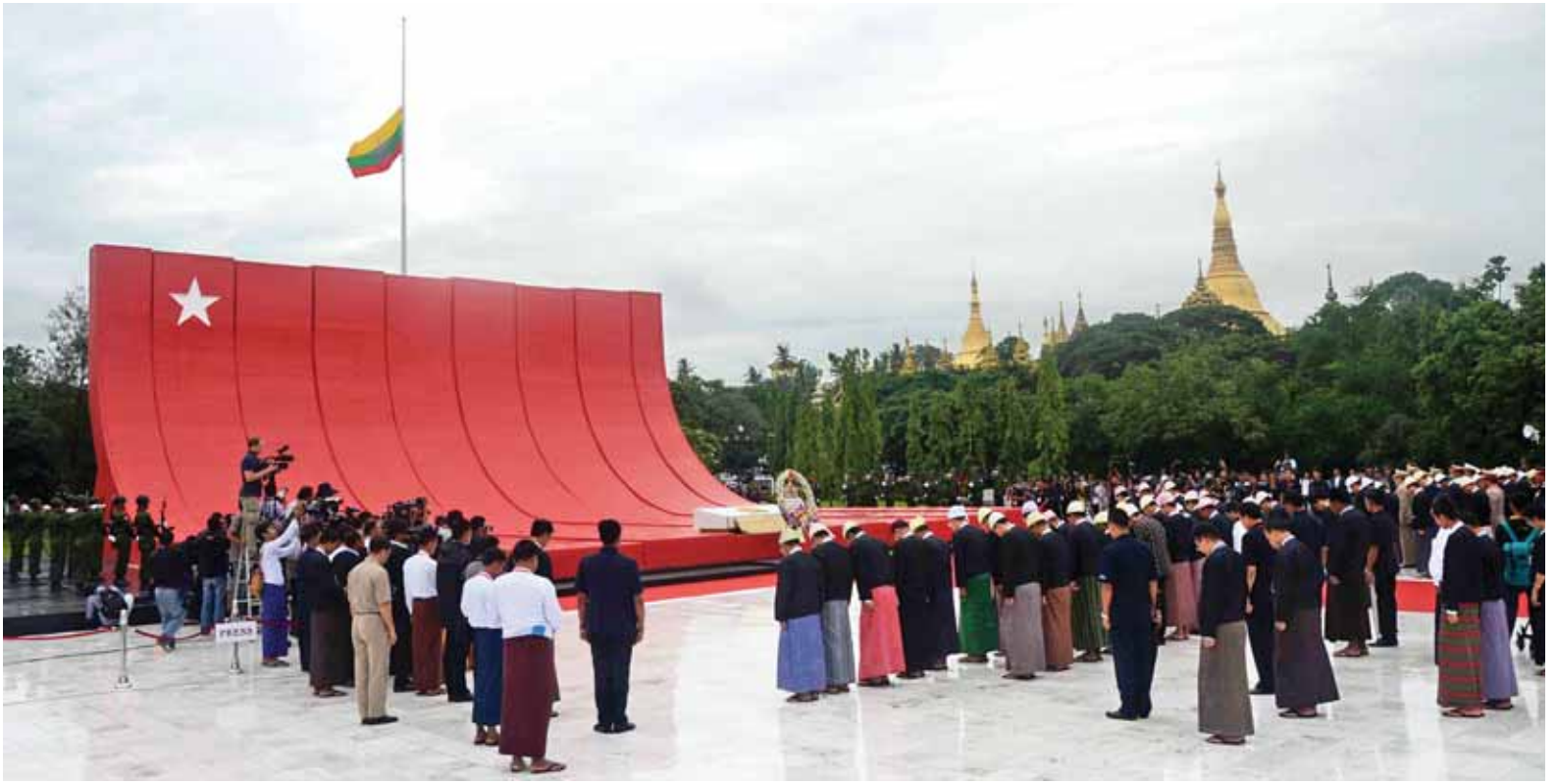
ဒုတိယသမ္မတ ဒေါက်တာစိုင်းမောက်ခမ်း၊ ပြည်သူ့လွှတ်တော်ဥက္ကဋ္ဌ သူရဦးရွှေမန်း၊ အမျိုးသားလွှတ်တော်ဥက္ကဋ္ဌ ဦးခင်အောင်မြင့်၊ ပြည်ထောင်စုတရားသူကြီးချုပ် ဦးထွန်းထွန်းဦးနှင့် အခမ်းအနားသို့တက်ရောက်လာကြသူများ ဗိုလ်ချုပ်အောင်ဆန်းနှင့်တကွ အာဇာနည်ခေါင်းဆောင်ကြီးများ၏ အထိမ်းအမှတ်ဂူဗိမာန်၌ လွမ်းသူ့ပန်းခွေချအလေးပြုကြစဉ်။ (သတင်းစဉ်)

(၆၈)နှစ်မြောက် အာဇာနည်နေ့ အခမ်းအနားသို့ ပြည်သူ့လွှတ်တော် ဒုတိယဥက္ကဋ္ဌ ဦးနန္ဒကျော်စွာ၊ အမျိုးသား လွှတ်တော်ဒုတိယဥက္ကဋ္ဌ ဦးမြည့်မိုး၊ (၆၈)နှစ်မြောက် အာဇာနည်နေ့ အခမ်းအနားကျင်းပရေးပဟိုက်မတ်တီ ဥက္ကဋ္ဌ ယဉ်ကျေးမှုဝန်ကြီးဌာန ပြည်ထောင်စုဝန်ကြီး ဦးအေးမြင့်ကြူ၊ အားကစားဝန်ကြီးဌာန ပြည်ထောင်စု ဝန်ကြီး ဦးတင်ဆန်း၊ (၆၈)နှစ်မြောက် အာဇာနည်နေ့ အခမ်းအနားကျင်းပရေး ပဟိုက်မတ်တီ ဒုတိယဥက္ကဋ္ဌ ရန်ကုန် တိုင်းဒေသကြီးဝန်ကြီးချုပ် ဦးမြင့်ဆွေ၊ ညှိနှိုင်းကွပ်ကဲရေးမှူး (ကြည်း၊ ရေ၊ လေ)ဗိုလ်ချုပ်ကြီးလှဌေးဝင်း၊ ကာကွယ် ရေးဦးစီးချုပ်ရုံး(ကြည်း)မှ ဒုတိယ ဗိုလ်ချုပ်ကြီးကျော်ဆွေ၊ စစ်ရေးချုပ် ဗိုလ်ချုပ်ဆန်းဦး၊ ရန်ကုန်တိုင်း စစ်ဌာနချုပ် တိုင်းမှူး ဗိုလ်ချုပ် ထွန်းထွန်းနောင်၊ ဒုတိယဝန်ကြီးများ၊ ပြည်သူ့လွှတ်တော်နှင့် အမျိုးသား လွှတ်တော်တို့မှ လွှတ်တော် ကိုယ်စားလှယ်များ၊ (၆၈)နှစ်မြောက် အာဇာနည်နေ့ ကျင်းပရေးဦးစီး ကော်မတီနှင့် လုပ်ငန်းကော်မတီဝင် များ၊ တပ်မတော်အရာရှိကြီးများ၊ ဗိုလ်ချုပ်အောင်ဆန်းနှင့် တက္က အာဇာနည်ခေါင်းဆောင်ကြီးများ၏ မိသားစုဝင်များ၊ ဌာနဆိုင်ရာတာဝန် ရှိသူများနှင့် ဖိတ်ကြားထားသူများ တက်ရောက်ကြသည်။