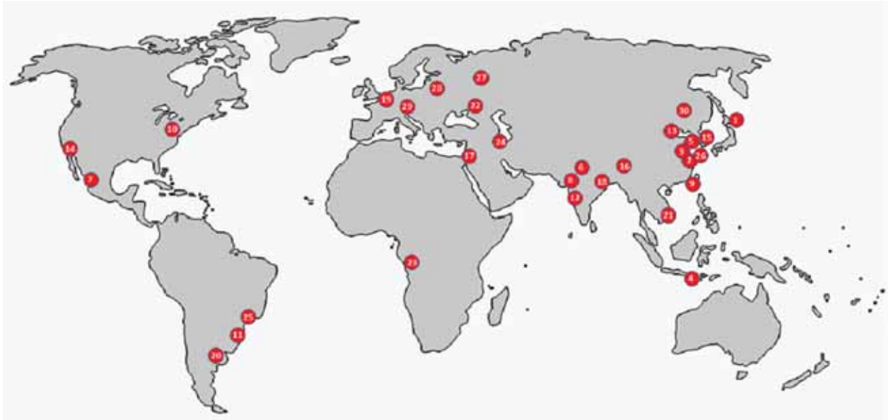
Megacity မြို့ကြီးများ တည်နေရာပြပုံ

လူဦးရေ တိုးတက်လာမှုနှင့်အတူ မြို့ပြနေလူဦးရေအချိုးအစားမှာလည်း အလွန်လျင်မြန်စွာ တိုးတက်လာခဲ့ပါသည်။ မြို့ပြနေလူဦးရေ တိုးတက်လာသည်နှင့်အညီ မြို့ကြီးများ အရေအတွက်မှာလည်း အလွန်လျင်မြန်စွာ တိုးတက်များပြားလာခဲ့ပါသည်။ ကျေးလက်ဒေသမှ မြို့ပြဒေသများသို့ ရွှေ့ပြောင်းနေထိုင်မှုသည် ကမ္ဘာ့သမိုင်းတွင် မယုံကြည်နိုင်လောက်အောင် ထူးကဲစွာ ဖြစ်ပေါ်လာလျက်ရှိပါသည်။ ၂၀၃၀ ပြည့်နှစ်တွင် ကမ္ဘာ့လူဦးရေ၏ သုံးပုံနှစ်ပုံသည် မြို့ပြများတွင် အခြေချနေထိုင်ကြတော့မည် ဖြစ်ပါသည်။ ထိုကဲ့သို့ တိုးပွားလာနေသည့် မြို့ပြနေထိုင်သူအများစုမှာ ဖွံ့ဖြိုးဆဲနိုင်ငံများတွင် ဖြစ်ပေါ်နေပြီး တစ်လချင်းစီ တွင်ပင် မြို့ပြရွှေ့ပြောင်းနေထိုင်သူ ၅ သန်းကျော်ထိ တိုးတက်များပြားလာခဲ့ပါသည်။ မြို့ပြသည် ကျေးလက်ဒေသထက် လုံခြုံစိတ်ချရမှု၊ ဘေးကင်းမှု၊ ကျန်းမာရေးစောင့်ရှောက်မှု၊ လမ်းပန်းဆက်သွယ်ရေး အဆင်ပြေချောမွေ့မှု၊ ဆက်သွယ်ရေးစနစ်များ ကောင်းမွန်မှု၊ အသိပညာ၊ ယဉ်ကျေးမှုနှင့်ပတ်သက်သည့် အချိုးအစား ပိုမိုရရှိလွယ်မှု၊ စီးပွားရေး အခွင့်အလမ်း ကောင်းများ ပိုမိုရရှိနိုင်မှု စသည့် အကြောင်းအရာများစွာတို့အား တစ်ပြိုင်နက်တည်း ရရှိခံစားနိုင်သောကြောင့် မြို့ပြနေလူဦးရေမှာ အလွန်လျင်မြန်စွာ တိုးတက်လာခဲ့ပြီး မြို့ပြ