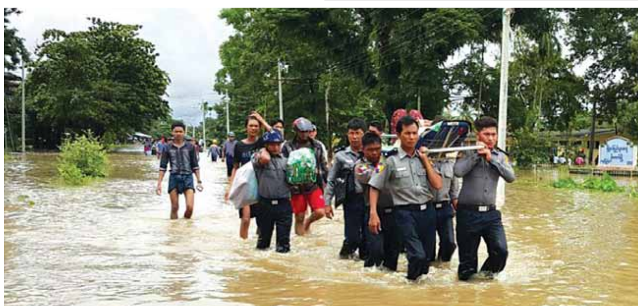
မိုးကောင်းမြို့နယ် ရဲတပ်ဖွဲ့မှတပ်ဖွဲ့ဝင်များ၊ နယ်မြေခံတပ်မှ တပ်မတော်သားများ၊ မြို့နယ်အထောက်အကူပြုအဖွဲ့များ၊ အရန်ဖိသတ်တပ်ဖွဲ့ဝင်များနှင့်ကြက်ခြေနီတပ်ဖွဲ့ဝင်များ ပူးပေါင်း၍ ကူညီဆောင်ရွက်ပေးလျက်ရှိကြောင်း သိရသည်။ (ကြေးမုံ)