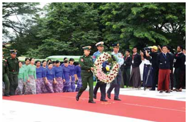
တပ်မတော်(ကြည်း၊ ရေ၊ လေ)မှ မိသားစုဝင်များ အာဇာနည်ခေါင်းဆောင်ကြီးများ၏ အထိမ်းအမှတ်ဂူပိမာန်၌ လွမ်းသူ့ပန်းခွေချရန်လာရောက်စဉ်။ (သတင်းစဉ်)