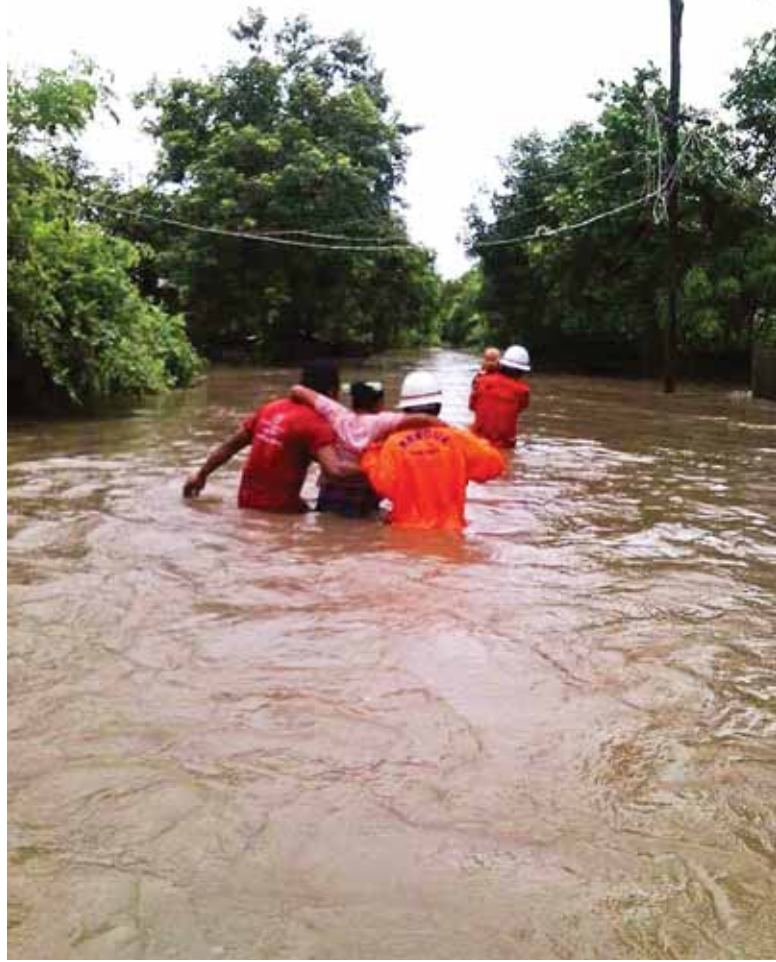
ရေကြီးရေလျှံမှုများဖြစ်ပွားသည့်နေရာများတွင် ကူညီကယ်ဆယ်ရေးလုပ်ငန်းများ ဆောင်ရွက်နေသည်ကို တွေ့ရစဉ်။ (အပေါ်ပုံ နှင့် ယာပုံ)

မြန်မာနိုင်ငံတစ်ဝန်းတွင် ယခုရက်ပိုင်းအတွင်း မိုးသည်းထန်စွာ ရွာသွန်းမှုကြောင့် ဆည်တာတမံများကျိုးပေါက်မှုမရှိစေရေး လယ်ယာ စိုက်ပျိုးရေးနှင့် ဆည်မြောင်းဝန်ကြီးဌာနမှ တာဝန်ရှိသူများက ရေကင်းများချထားပြီး စောင့်ကြပ်ကြည့်ရှုဆောင်ရွက်လျက်ရှိရာ ရေလျှောင့်တစ် ၁၂ ခုတွင် သတ်မှတ်ရေလျှောင့်ပမာဏ ပြည့်မီသဖြင့် ဆည်တာတမံများ ကျိုးပေါက်မှုမရှိစေရေး ရေပိုလွှဲများမှ ရေထုတ် လွှတ်လျက်ရှိကြောင်း သိရသည်။