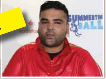
အေးပြည့်

ဗြိတိန်သို့ချင်းထုတ်လုပ်သူ နော့တီဘွိုင်းက သူ့ရဲ့ခြေလှမ်းသစ်တွေကို အကျဉ်းထောင်တွေဆီ ဦးတည်ခဲ့ပါတယ်။ အကြောင်းကတော့ သူဟာ အကျဉ်းကျနေတဲ့သူတွေကို သီချင်းရေးစပ်တဲ့ ပညာရပ်နဲ့ ဂီတသံစဉ်တွေကို ဖန်တီးတဲ့ ပညာရပ်တွေကို သင်ကြားပေးဖို့ဖြစ်ပါတယ်။