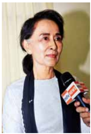
ဒေါ်အောင်ဆန်းစုကြည်။

အရေးကြီးတာပေါ့။ လွတ်လပ်ရေးရ အောင်လုပ်တယ်ဆိုတာကလည်း နိုင်ငံကို ကိုယ့်နိုင်ငံသူ နိုင်ငံသားတွေ အကောင်းဆုံးဖြစ်အောင် တည် ဆောက်ဖို့ပဲ။ နိုင်ငံတည်ဆောက်ရေး လမ်းစဉ်မှာ ဒီလိုပဲ ကျဆုံးရသူတွေ၊ အနစ်နာခံရသူတွေ ရှိတာပဲ။