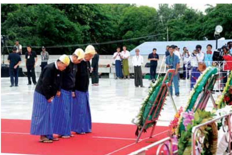
နိုင်ငံရေးပါတီများ အာဇာနည်ခေါင်းဆောင်ကြီးများ၏ အထိမ်းအမှတ်ဂူပိမာန်၌ လွမ်းသူ့ ပန်းခွေချ အလေးပြုစဉ်။ (သတင်းစဉ်)