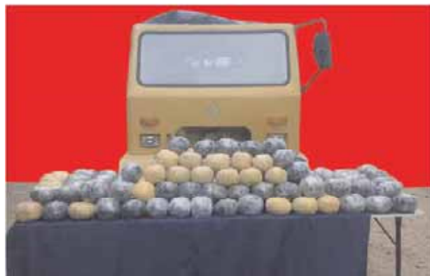
သိမ်းဆည်းရမိ ဘိန်းစိမ်းများနှင့် ထော်လာဂျီယာဉ်အား တွေ့ရစဉ်။