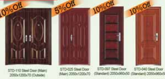
STD-110 Steel Door (Main) 2050x1200x70 (Outside) 10% Off STD-025 Steel Door (Main) 2050x1200x70 5% Off STD-097 Steel Door (Standard) 2050x960x50 10% Off STD-040 Steel Door (Standard) 2050x960x50 10% Off