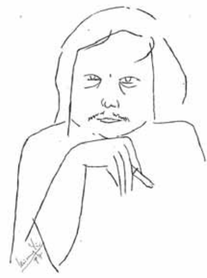
ဝိသုကာ ခင်မောင်ရင် (၁၉၃၈ - )

ထားသော မိန်းကလေးကို ဘမုန့်အဖြစ်နှင့်လည်းကောင်း၊ ဘဇံအဖြစ်နှင့်လည်းကောင်း စရိုက်သဘာဝနှစ်မျိုးနှင့် နှစ်ကိုယ်ခွဲပြီး တစ်လှည့်စီပိုးပြတဲ့ဇာတ်လမ်းဖြစ်တယ်။ (တစ်ပြိုင်နက် နှစ်ကိုယ်ခွဲ မဟုတ်ပါဘူး။ တစ်နည်းဆိုရရင် ကင်မရာလိမ်တဲ့ဇာတ်ကားမျိုးမဟုတ်ပါဘူး) "ဘမုန့်ဘဇံအကြောင်း"မှာ လေးနက်တဲ့နိုင်ငံရေး၊ စီးပွားရေး၊ လူမှုရေး ပြဿနာတစ်ရပ်ရပ်ကို တင်ပြရှင်း လင်းရန် အားထုတ်မှုမရှိပါဘူး။ အပျိုကြီးဖြစ်လေ့ဖြစ်ထ ရှိတဲ့၊ ခေတ်ပညာတတ် အမျိုးသမီးတစ်ဦးကို စိတ္တ ဗေဒပညာရှင်တစ်ဦးက စိတ်ပညာနည်းများကိုသုံးပြီး မရရအောင် ပိုးသွားခြင်းကိုအကြောင်းရင်းခံပြီး ဇာတ်ဖွဲ့ ထားပါတယ်။ ဟာသရသကိုအပြည့်အဝပေးထားတယ်။ ဇာတ်ဆောင်တွေများပြီး ဇာတ်ရံနည်းတဲ့ ဇာတ်ကား