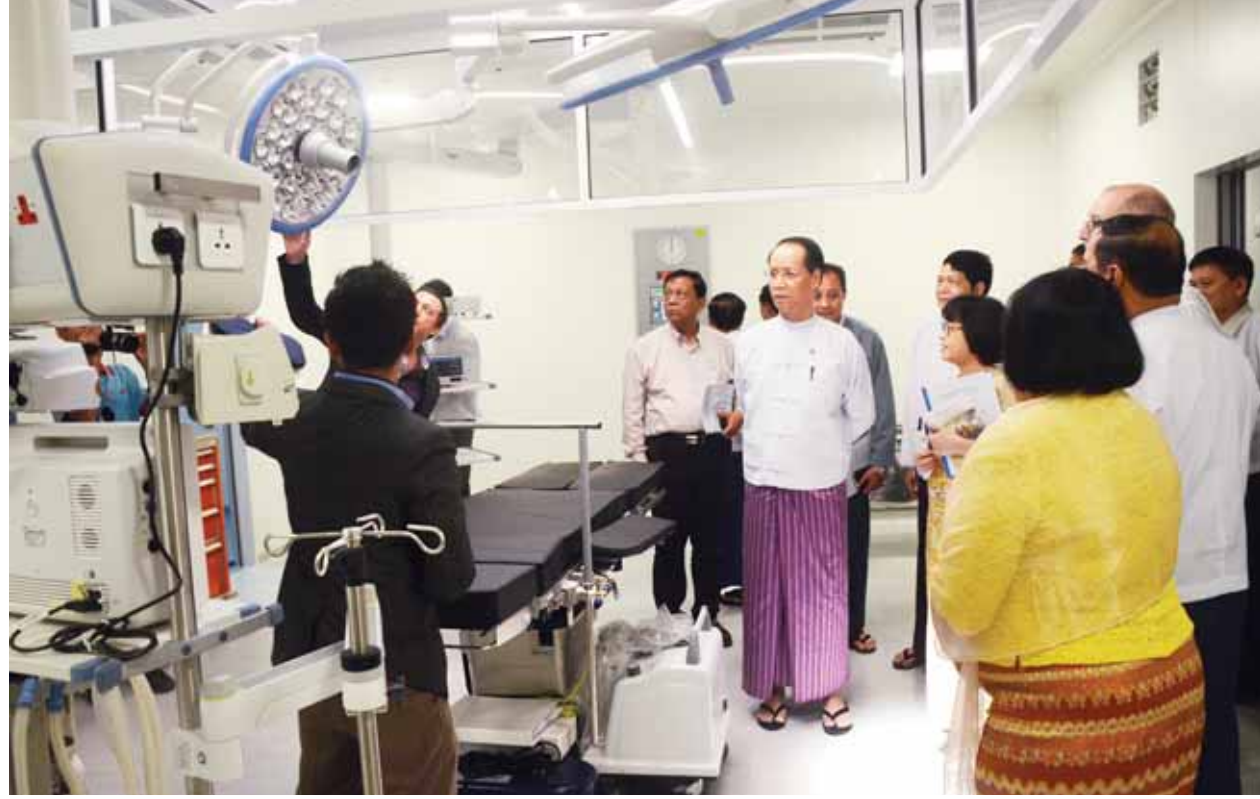
ဒုတိယသမ္မတ ဒေါက်တာစိုင်းမောက်ခမ်း ရန်ကုန်ပြည်သူ့ဆေးရုံကြီးတွင် စက်ပစ္စည်းများတပ်ဆင်ပြီးစီးမှုအခြေအနေကို ကြည့်ရှုစစ်ဆေးစဉ်။ (သတင်းစဉ်)

ထောက်ပံ့ပစ္စည်းများ ပေးအပ်ခြင်းအခမ်းအနားသို့တက်ရောက်၍ ရေဘေးသင့် လုံးကျော်ရွာအတွက် ဆန်၊ ဆီ၊ အဝတ်အထည်၊ ခြင်ထောင်၊ စောင် စသည့် ထောက်ပံ့ပစ္စည်းများနှင့် ဆိုလာမီးအိမ်များကို ရေဘေးသင့်ပြည်သူများထံ ပေးအပ်သည်။