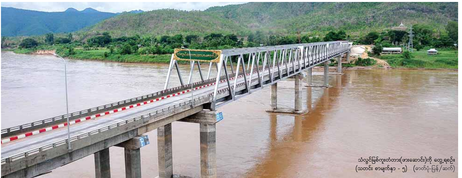
သံလွင်မြစ်ကူးတံတား(ဖားဆောင်း)ကို တွေ့ရစဉ်။ (သတင်း စာမျက်နှာ - ၅) (ဓာတ်ပုံ-ပြန်/ဆက်)