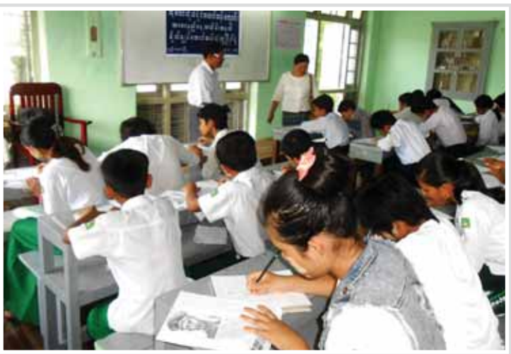
(၆၈)နှစ်မြောက် အာဇာနည်နေ့အထိမ်းအမှတ်အဖြစ် ဗိုလ်ချုပ်အောင်ဆန်းပုံတူ ပန်းချီပြိုင်ပွဲကို ယှဉ်းမနားမြို့နယ် ရန်အောင်(၂)ရပ်ကွက်ရှိ ကံကော်ကိုယ်ပိုင်အထက်တန်း ကျောင်းတွင် ဇူလိုင် ၁၅ ရက်က ကျင်းပရာ ပဉ္စမတန်းမှ ဒဿမတန်းအထိ ကျောင်းသား၊ ကျောင်းသူများ ဝင်ရောက်ယှဉ်ပြိုင်ကြစဉ်။