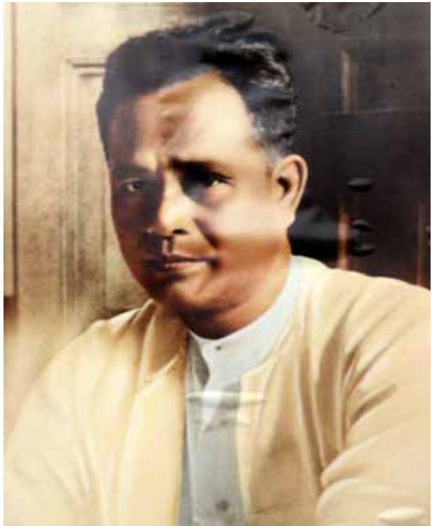
အာဇာနည်ခေါင်းဆောင် မန်းဘခိုင်။

ဖြေ။ အထူးသဖြင့် အာဇာနည်မိမိမာန်သွားရင် အခု ဘာမှ အမှတ်တရမရှိတော့ ဘူး။ ဟိုတုန်းက အုတ်ဂူတွေမှာဆိုရင် ဝန်ကြီးဌာနနဲ့တကွ နာမည်တွေ၊ ဘယ်နှစ်တွေမှာမွေးဖွားတယ်၊ ဘယ်ဝန်ကြီးဌာနမှာ တာဝန်ထမ်းဆောင်တယ်၊ ပြီးတော့ အဲဒီဂူရဲ့အပေါ်မှာ ဓာတ်ပုံတွေ အသီးသီးရှိတယ်။