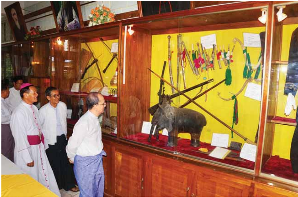
နေပြည်တော် ဇူလိုင် ၁၇

ပြည်ထောင်စုသမ္မတမြန်မာနိုင်ငံတော် နိုင်ငံတော်သမ္မတ ဦးသိန်းစိန်သည် အဖွဲ့ဝင်များနှင့်အတူ ယနေ့ညနေ ၄ နာရီတွင် ကယားပြည်နယ် လွိုင်ကော်မြို့နယ်ရှိ ဆရာတော်ကြီးများအား လွိုင်ကော်မြို့ ရွှေတောင်ပရိယတ္တိစာသင်တိုက် ဓမ္မဒါယဗိမာန်၌ ဖူးမြော်ကြည်ညိုသည်။