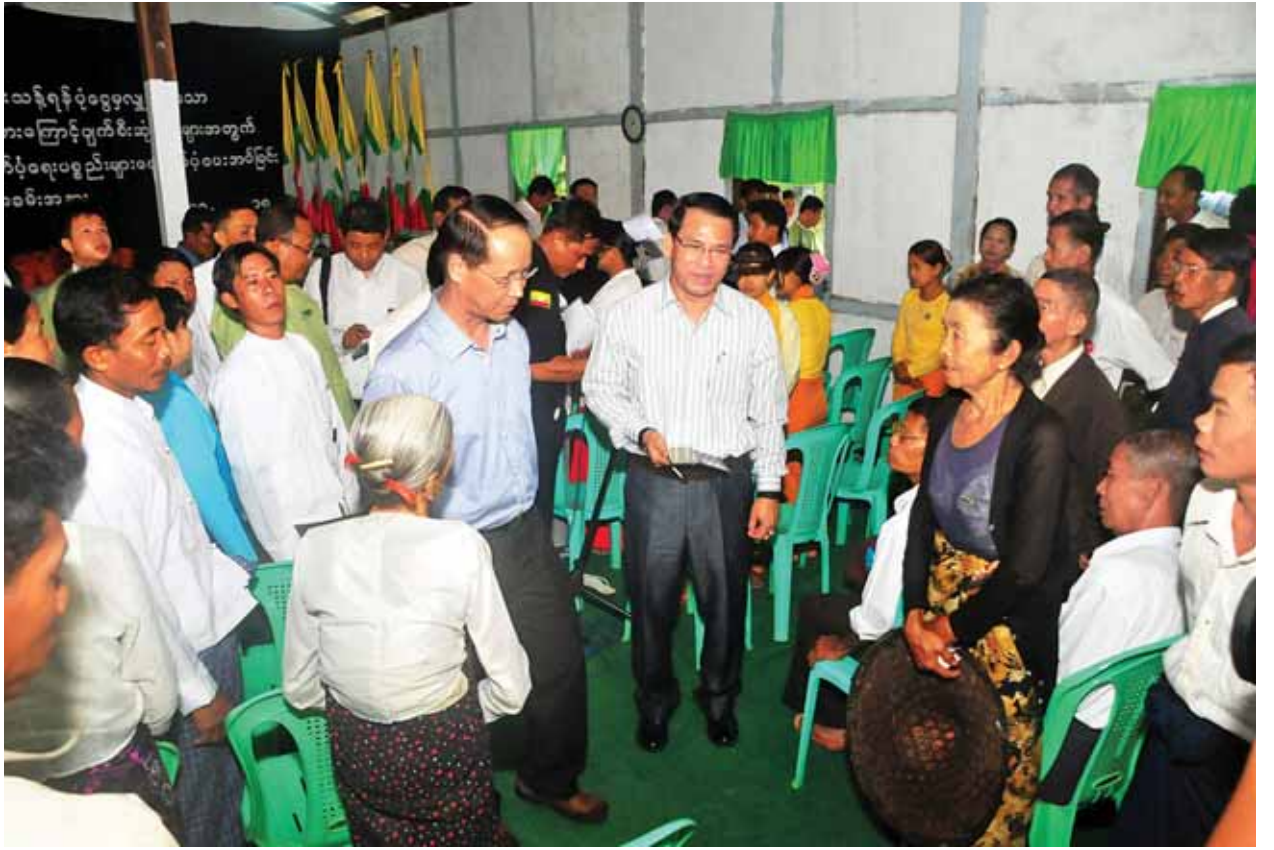
ဒုတိယသမ္မတ ဒေါက်တာစိုင်းမောက်ခမ်း အမ်းမြို့နယ် လုံးကျော်ရွာသူ ကျေးရွာသားများအား ရင်းရင်းနှီးနှီးနှုတ်ဆက်စဉ်။ (သတင်းစဉ်)

ရခိုင်ပြည်နယ်ဖွံ့ဖြိုးတိုးတက်ရေးအတွက် လိုအပ်ချက်များ၊ ရေဘေးကြောင့် လတ်တလော ဖြည့်ဆည်းဆောင်ရွက်ပေးရမည့်အခြေအနေများနှင့် ရေရှည်တွင် သဘာဝဘေးအန္တရာယ်ဖြစ်ပေါ်လာနိုင်မှုအတွက် လိုအပ်ချက်များကို တင်ပြ ဆွေးနွေးကြရန်နှင့် လိုအပ်သည်များ ပေါင်းစပ်ညှိနှိုင်းဆောင်ရွက်ပေးသွားမည် ဖြစ်ကြောင်း ပြောကြားသည်။