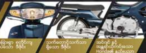
ထူးခြားစွာ စတိုင်ကျ လှပသော ဗီရိုင်း၊ သက်တောင့်သက်သာ ရှိသော ဒီဇိုင်း၊ အင်ဂျင် နှင့် အနုစက်ကိုင်သော Honda၏ နည်းပညာ

နိုင်ငံတစ်ဝန်းမှာ Honda NCX အရောင်းပြခန်းတွေမှာ ခေတ်သစ်အတွက် တစ်ခေတ်ဆန်းသစ်တဲ့ ထူးခြားသစ်များကို အခုပဲစားကြည့် လိုက်ပါ။