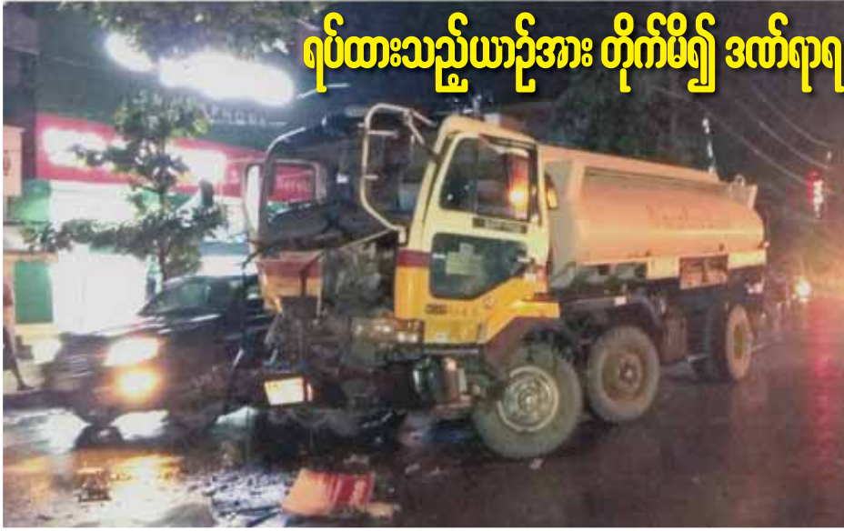
ရပ်ထားသည့်ယာဉ်အား တိုက်မိ၍ ဒဏ်ရာရ

ကျောင်းကုန်း ဇူလိုင် ၁၇ ရန်ကုန်-ပုသိမ်ကားလမ်း မိုင်တိုင် အမှတ် (၇၈/၅) နှင့် (၇၈/၆) ကြား တွင် ဇူလိုင် ၁၅ ရက်က ယာဉ်တိုက် မှုဖြစ်ပွားပြီး ဆိုင်ကယ်မောင်းနှင်သူ သေဆုံးခဲ့ကြောင်း သိရသည်။