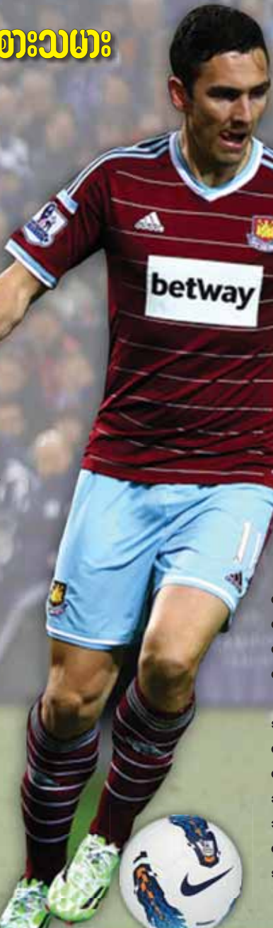
နိုင်းလင်းကြည်

အင်္ဂလန်အသင်း၏အားထားရသည့် ဝက်စ်ဟမ်းတောင်ပံကစားသမားတစ်ဦးဖြစ်သည့် စတီးဝက်ဒေါင်းနင်းသည် အသင်းဟောင်း မစ်ဒယ်ဘရော့အသင်းသို့ လေးနှစ်သက်တမ်းရှိ စာချုပ်တစ်ရပ်ချုပ်ဆိုကာ ပြောင်းရွှေ့ကြွေးပေါင် ၁၀ သန်းဖြင့် ပြောင်းရွှေ့လာခဲ့ခြင်းဖြစ်သည်။ ဒေါင်းနင်းသည် ၂၀၀၀ ခုနှစ်တွင် အက်စတွန်ဗီလာအသင်းမှ လီဗာပူးအသင်းသို့ ပြောင်းရွှေ့ခဲ့ပြီး ၂၀၀၃ ခုနှစ်တွင်မူ ဝက်စ်ဟမ်းအသင်းသို့ ထပ်မံပြောင်းရွှေ့ခဲ့ခြင်းဖြစ်သည်။ စတီးဝက်ဒေါင်းနင်းသည် အက်စတွန်ဗီလာအသင်းတွင် ၆၃ ပွဲ၊ လီဗာပူးအသင်းတွင် ၆၅ ပွဲ၊ ဝက်စ်ဟမ်းအသင်းတွင် ၆၉ ပွဲ ပါဝင်ကစားပေးခဲ့ပြီး အင်္ဂလန်လက်ရွေးစင်အသင်းတွင် ၂၀၀၅ ခုနှစ်မှစတင်ကာ လက်ရှိအချိန်ထိ ပွဲပေါင်း ၄၅ ပွဲ ပါဝင်ကစားပေးထားကြောင်း