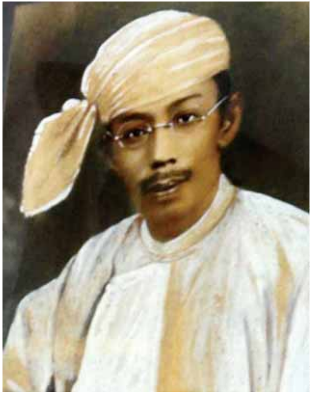
ဒီးဒုတ်ဦးဘချို။

မေး။ နိုင်ငံတော်အစိုးရသစ်လက်ထက်မှာ အာဇာနည်နေ့အခမ်းအနား ကျင်းပတာနဲ့ပတ်သက်ပြီး အာဇာနည်မိသားစုဝင်တစ်ဦးအနေနဲ့ ဘယ်လိုမြင် ပါသလဲ။