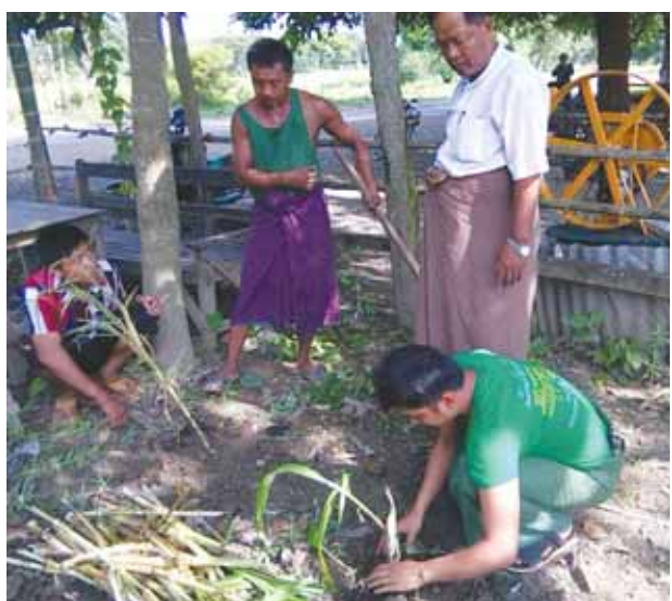
ရန် လျာထားစေမှုများပြည့်မီကျော် များ ခွဲဝေ၍ ကွင်းဆင်းဆောင်ရွက် လွန်အောင် အကောင်အထည်ဖော် လျက်ရှိကြောင်း သိရသည်။ နိုင်ငံရေးအတွက် စိုက်/ကြပ်နယ်မြေ ရှင်းထွင်းသား(ပြန်/ဆက်)

ကလေးဝမြို့နယ် မြေသာကျေးရွာ အုပ်စု ပန်းချီစုကျေးရွာတွင် တက် ရောက်လာကြသော တောင်သူဦးကြီး များအား မြက်မျိုးကိုင်းဖြတ်နှင့်ယိုးပင် ပေါင်း ၁၇၀၊ မထုကြီးကျေးရွာအုပ်စု မထုကျေးရွာတွင် မြက်မျိုးကိုင်းဖြတ် နှင့် ယိုးပင်ပေါင်း ၆၅ ပင်တို့ကို ဖြန့်ဝေ ပေးပြီး လက်တွေ့စိုက်ပျိုးခဲ့ကြသည်။