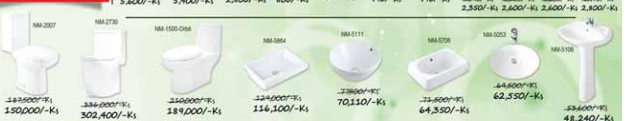
NM-2007 187,500/-Ks 150,000/-Ks NM-2730 336,000/-Ks 302,400/-Ks NM-1500-Onal 210,000/-Ks 189,000/-Ks NM-5864 124,000/-Ks 116,100/-Ks NM-5111 77,000/-Ks 70,110/-Ks NM-5708 71,500/-Ks 64,350/-Ks NM-5053 64,500/-Ks 62,550/-Ks NM-5106 53,600/-Ks 48,240/-Ks

အိမ်အမှီးပြားများ၊ အိမ်သုတ်ဆေးနှင့် ဓာတုဗေဒပစ္စည်းများ၊ ရေစိုက်စက်များနှင့် အခြားအောက်လုပ်ရေးလုပ်ငန်းသုံးပစ္စည်းများ အားလုံးကိုလည်း Promotion ပေးနေပြီနော် . . .