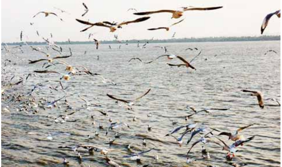
အုပ်စု ၅၄ ခုမှ ကျေးရွာအုပ်ချုပ်ရေး အဖွဲ့ဝင်များနှင့် အရပ်ဘက်လူအဖွဲ့ အစည်းများမှ တာဝန်ရှိသူများ တက်ရောက်ခဲ့ကြပြီး စီမံကိန်းလုပ်ငန်း နှင့်ပတ်သက်သည့် သိရှိလိုသည်များ ကို မေးမြန်းဆွေးနွေးရာ စီမံကိန်း သက်ဦး(သထုံ)

ယင်းအဖွဲ့အစည်းများက အဆိုပါ စီမံကိန်းကို မွေးမြူရေး၊ ရေလုပ်ငန်းနှင့် ကျေးလက်ဒေသဖွံ့ဖြိုးရေးဝန်ကြီး ဌာန၊ ပတ်ဝန်းကျင်ထိန်းသိမ်းရေးနှင့် သစ်တောရေးရာဝန်ကြီးဌာနတို့နှင့် ပူးပေါင်းဆောင်ရွက်သွားမည် ဖြစ် သည်။