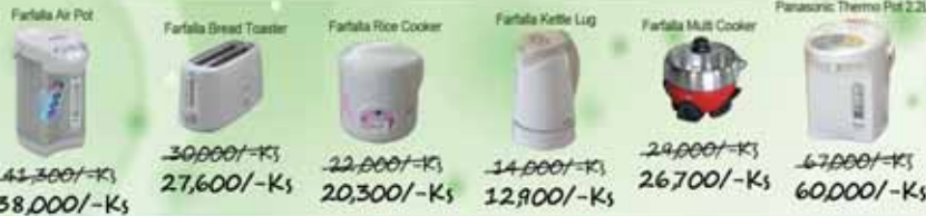
Farfala Air Pot 42,300/-Ks 38,000/-Ks Farfala Bread Toaster 30,000/-Ks 27,600/-Ks Farfala Rice Cooker 22,000/-Ks 20,300/-Ks Farfala Kettle Lug 14,000/-Ks 12,900/-Ks Farfala Multi Cooker 24,000/-Ks 26,700/-Ks Panasonic Thermo Pot 2.2L 67,000/-Ks 60,000/-Ks